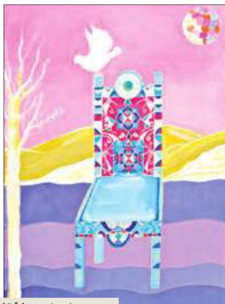
لوحات بريشة الفنانة المشاركات