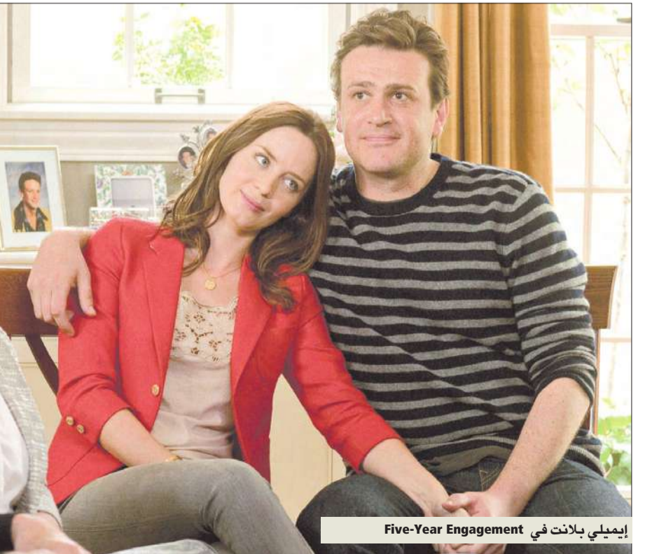
إيميلي بلانت في Five-Year Engagement

أصبت. تشتهر ستريب بقدرتها على أداء مختلف اللهجات بإتقان عالٍ، إلا أننا لم نسمعها يوماً تقلد شخصية Cookie Monster. يا له من مشهد مضحك! قلدت Cookie Monster باحتراف. كان هذا التحدي الأكبر الذي واجهته، وكان علي أن احرض على ألا تتلف أوتاري الصوتية بسبب إعادة هذا المشهد مرات عدة. كان مضحكاً فعلاً. لكن الفيلم يحتوي على كثير من المشاهد المميزة. أدرك أن الحكمة الأساسية مألوفة، ذلك صور الفيلم التي نشرته. فهي في النهاية فيلم رومانسي فكاهي. بيد أنه غني بشخصياته الفريدة، وتحفل المشاهد بالمواقف المضحكة، الغريبة، والمماثلة لما نصادفه في حياتنا. فالاعزاز التي تقدمها الشخصيات واهية