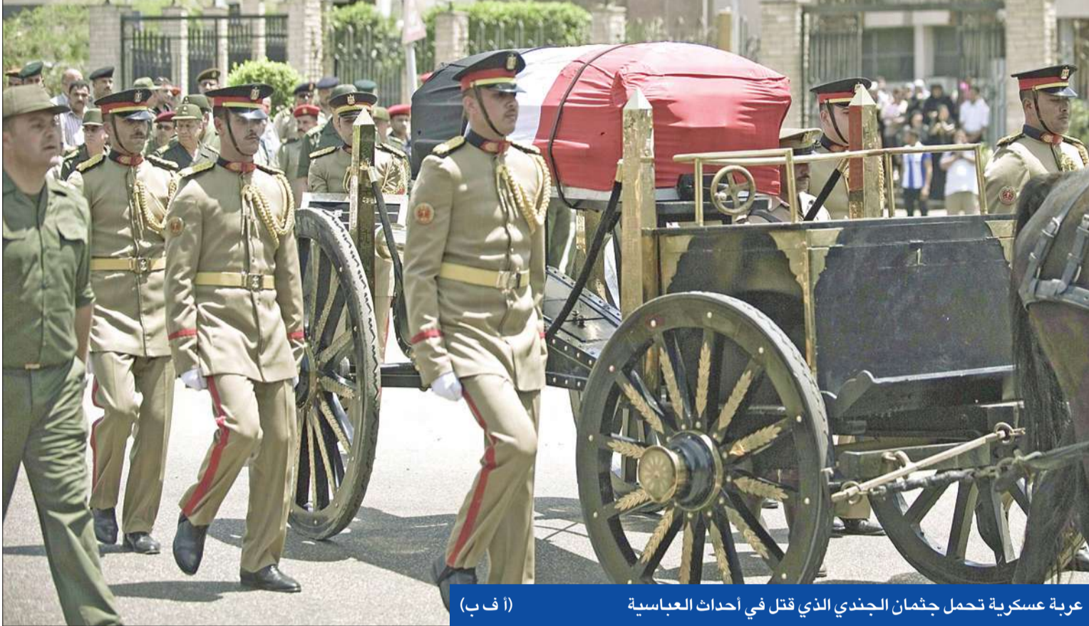
عربة عسكرية تحمل جثمان الجندي الذي قتل في أحداث العباسية

المشير يشيخ جندياً ويزور 140 جريحاً • «الإخوان» ترفض «الاعتداء الوحشي» على المتظاهرين