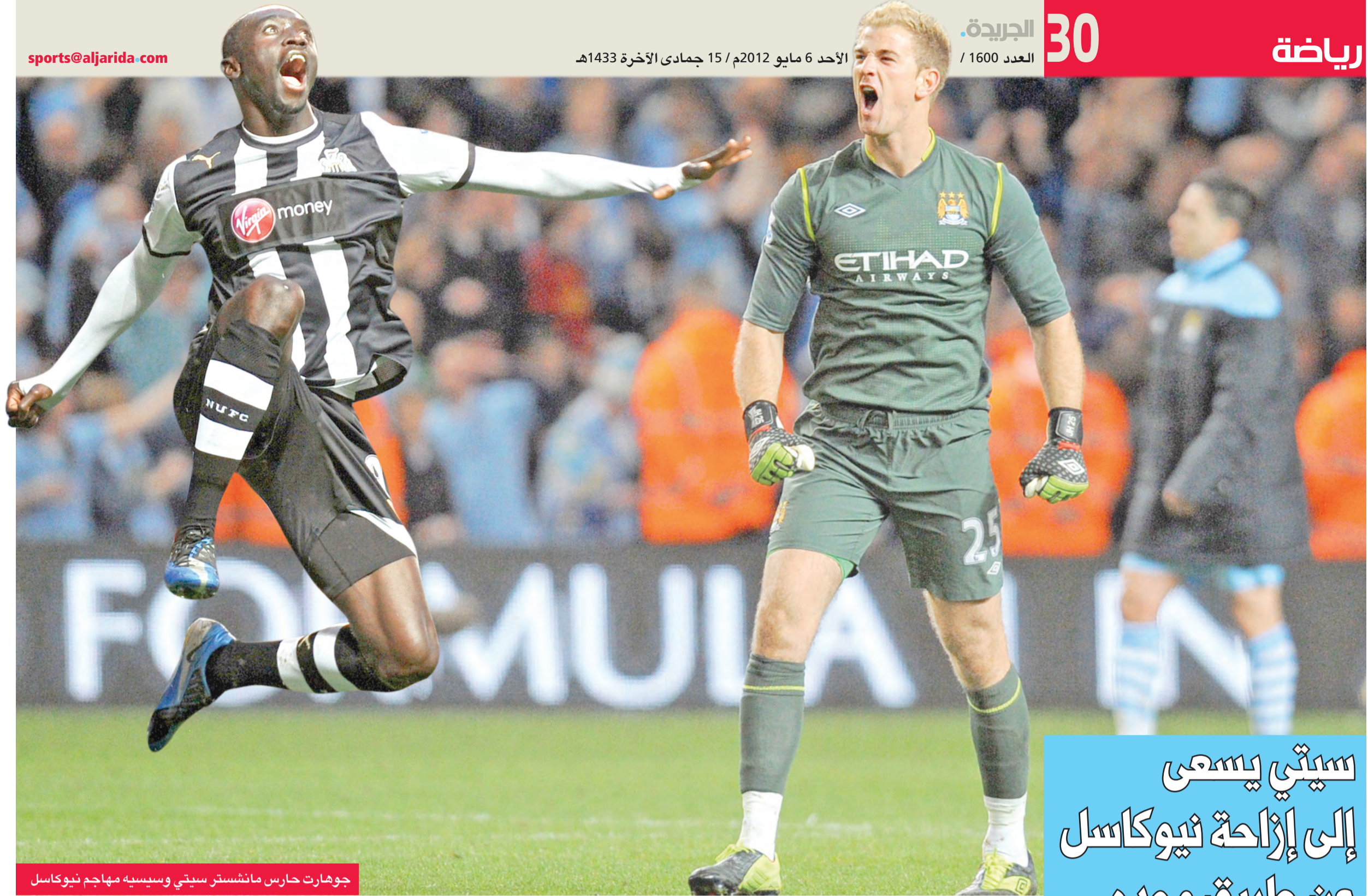
جوهارت حارس مانشستر سيتي وسياسيه مهاجم نيوكاسل