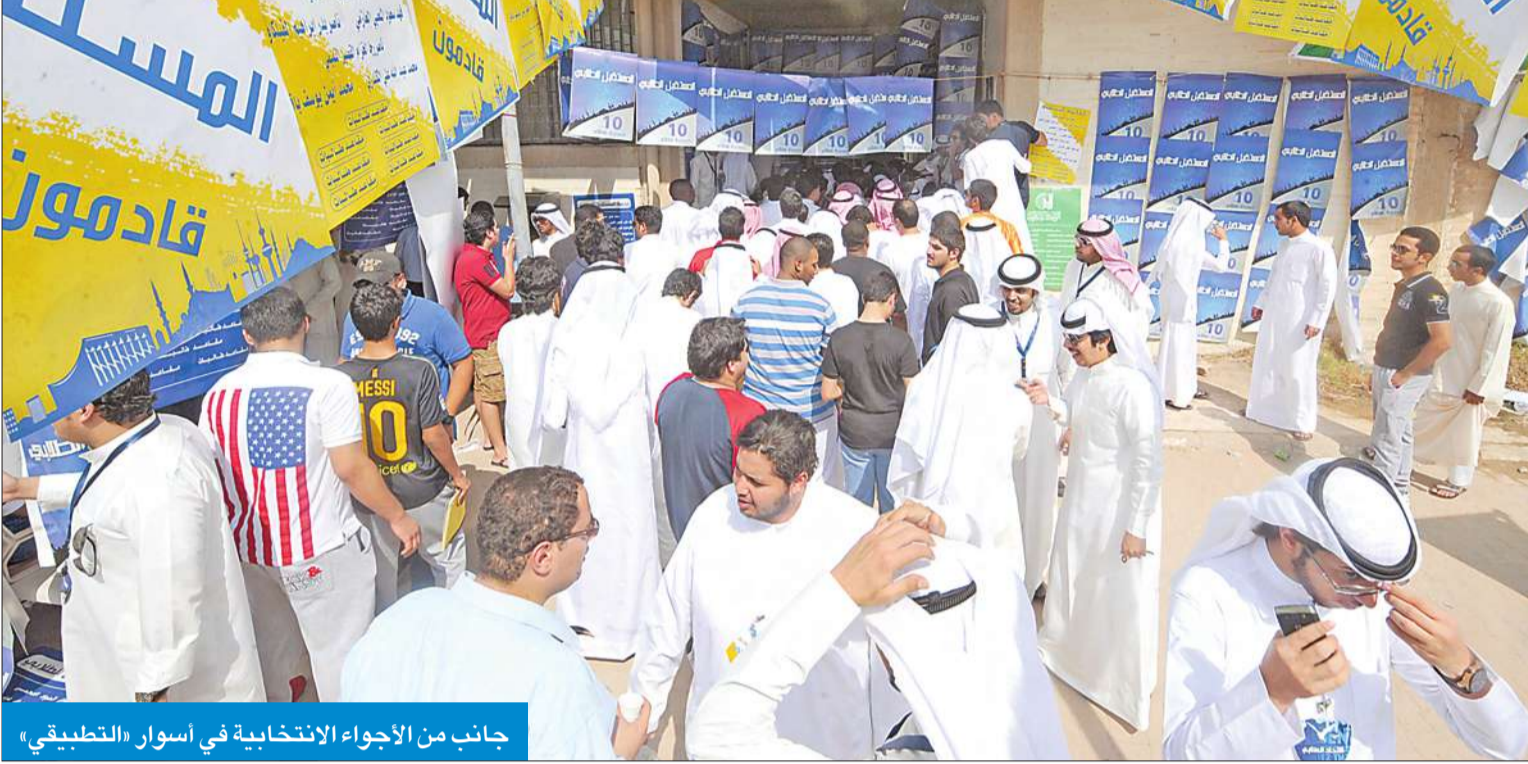
جانب من الأجواء الانتخابية في أسوار «التطبيقي»