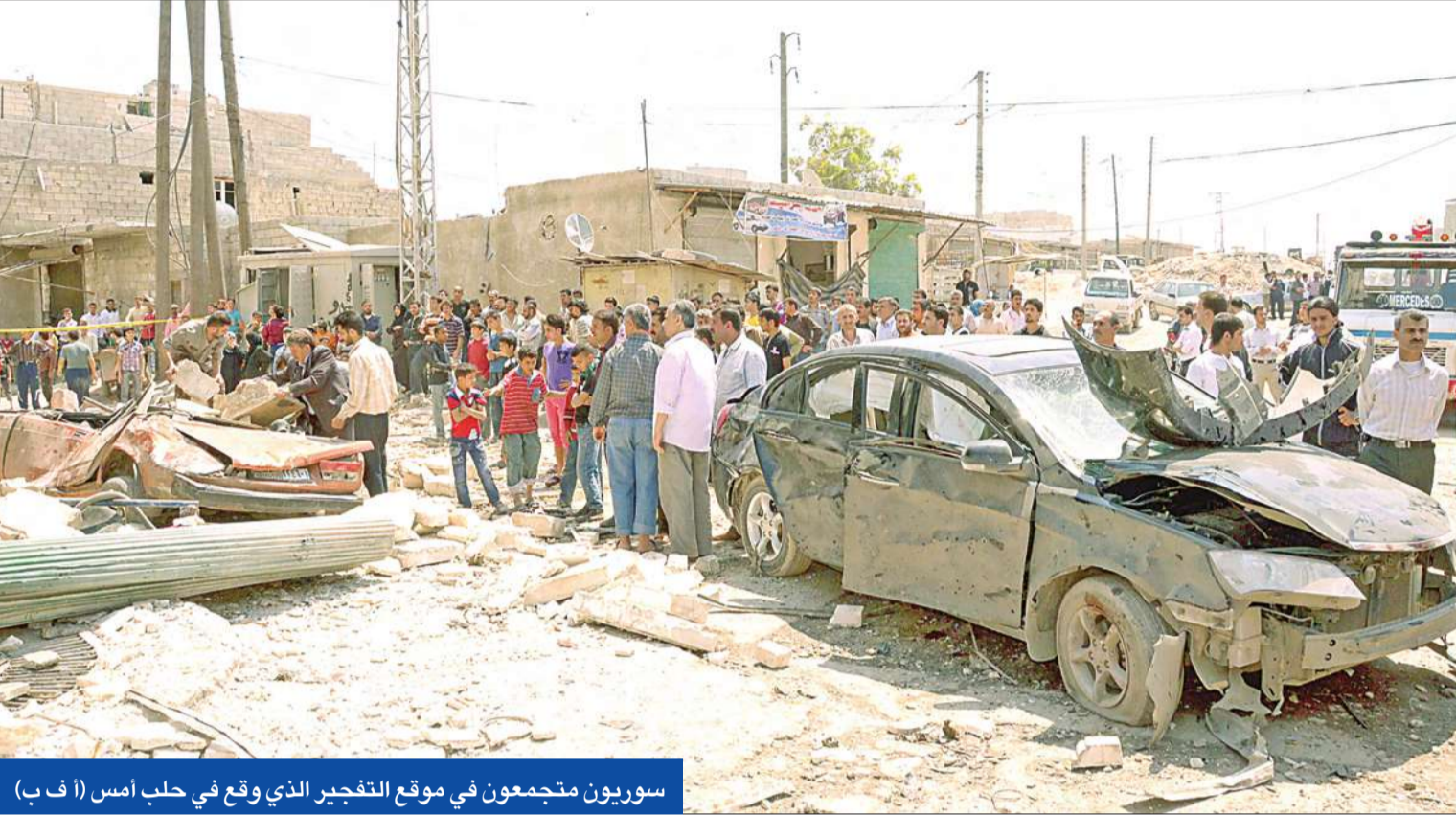
سوريون مجتمعون في موقع التفجير الذي وقع في حلب أمس

● آلاف الدمشقيين يشيعون قتلاهم متحدّين رصاص الأمن ● اغتيال مسؤول «بعثي» في إدلب