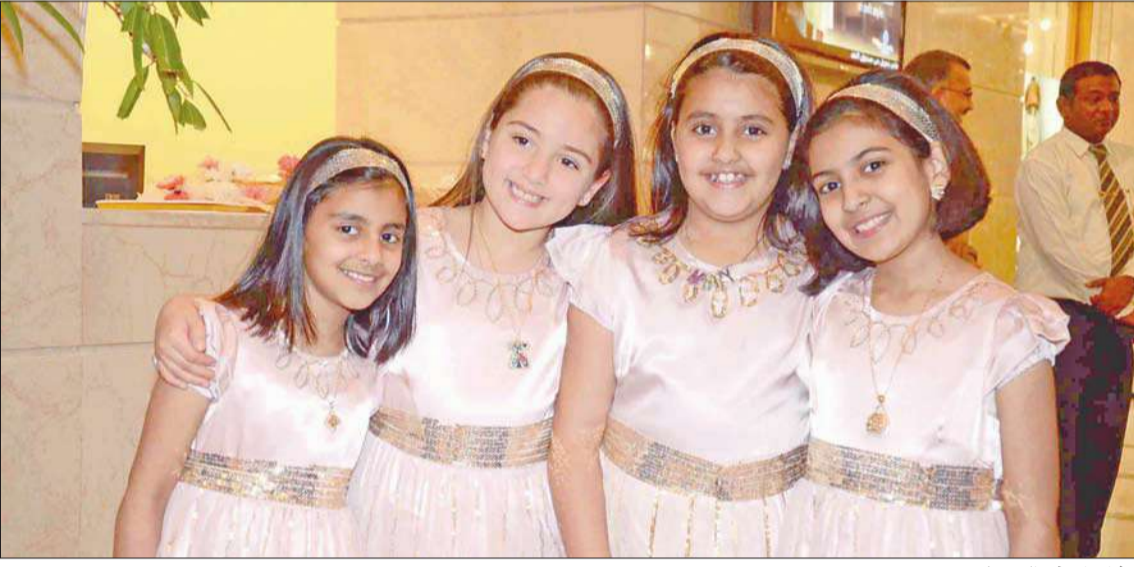
مشاركات في المعرض