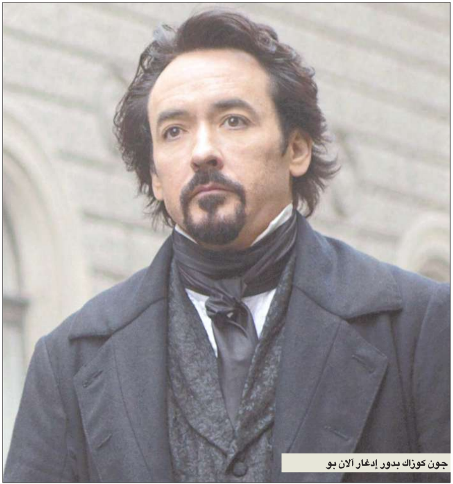
جون كوزاك بدور إدغار آلان بو

عرايي روايات الرعب الحديثة، ولا شك في أن أفلام الرعب والتشويق المقتبسة من روايات بو، لا سيما فيلمي Pendulum و The Pit and the Tell-Tale Heart، وتساوي في الحبكة والرسالة، مع أفلام الرعب المعاصرة، مثل Saw و Hostel. بحسب راي كوزاك، يعتبر بو أحد أهم عرايي الفن المعاصر، أمثال الفنانين كوروت كوبين أو هانت س. تومسون الذين ضحيا أشد تضحية لأجل فنهما.