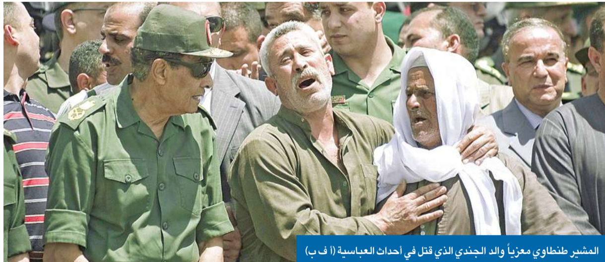
المشير طنطاوي معزياً والد الجندي الذي قتل في أحداث العباسية

مصر: «العسكري» يدرس توقيف 59 «محرزاً» بينهم أبوإسماعيل وشقيق الظواهري وسلفيون مواقع تنظيم «القاعدة» تنعى أحد ضحايا اشتباكات العباسية