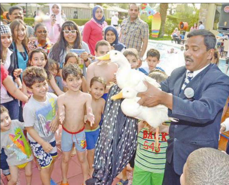
فكرة الساحر المشوقة