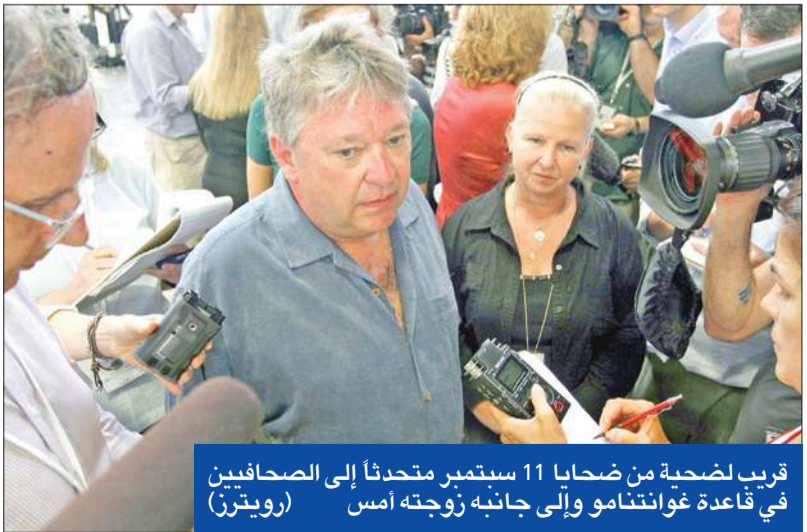
قريب لضحية من ضحايا 11 سبتمبر متحدثاً إلى الصحافيين في قاعدة غوانتانامو وإلى جانبه زوجته أمس

الشيخ محمد يصمت احتجاجاً... وبن الشيبه يصرخ: «ستقومون بقتلنا»