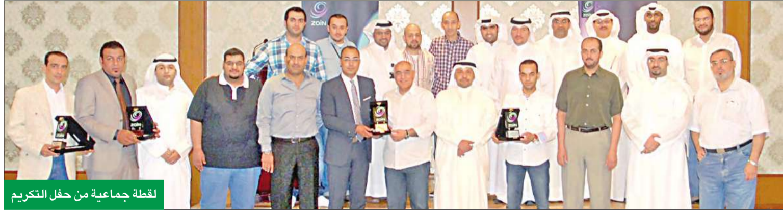
لقطة جماعية من حفل التكريم

هي البداية فقط حيث لدينا خطة عمل وتكريم ربع سنوي للموزعين الذين يحصلون على أداء مميز بالنسبة لجودة الخدمة.