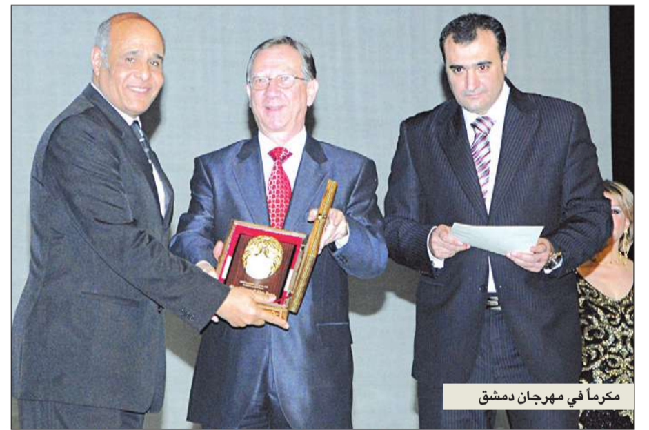
مكرما في مهرجان دمشق