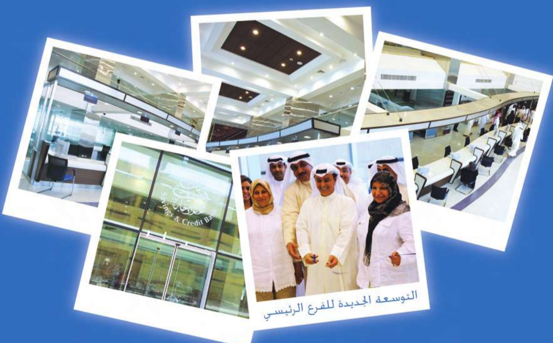
التوسعة الجديدة للفرع الرئيسي

بعد 60 يوماً من العمل المتواصل يسر بنك التسليف و الادخار ان يعلن عن افتتاح الفرع الرئيسي بحلته الجديد ويسره استقبال المراجعين الكرام من صباح هذا اليوم الاحد الموافق 6 مايو 2012