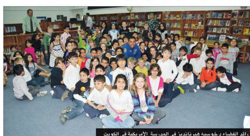
رائد الغضاء د.خوسيه هيرنانديز في المدرسة الأمريكية في الكويت

وتأتي هذه المبادرة ضمن إطار المسؤولية الاجتماعية للشركة والتي تسعى من خلالها إلى تطوير المجتمعات التي تخدمها حيث قامت الشركة بتخفيض العديد من البرامج وورش العمل بالتنسيق مع المركز العالمي للتدريب في جامعة الكويت، حيث تعتبر الشركة من المساهمين