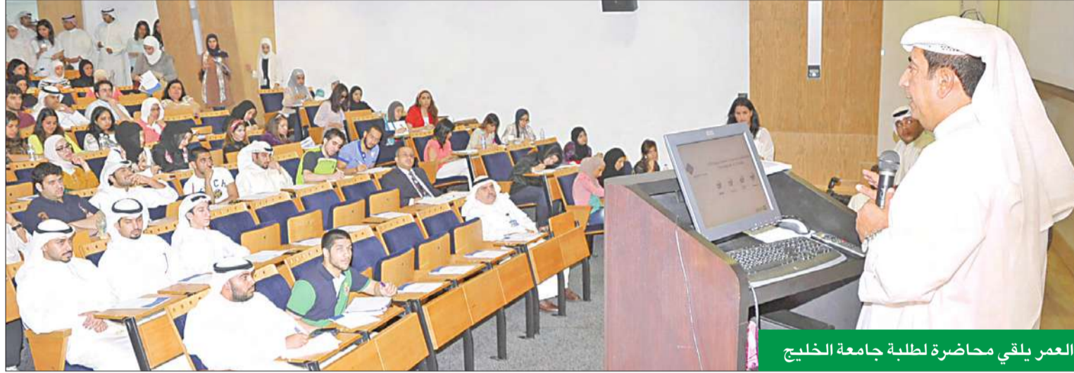
العمر يلقي محاضرة لطلبة جامعة الخليج