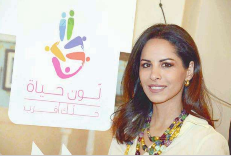
الشيخة مريم الصباح

أقامت الجمعية الوطنية لحماية الطفل معرضها السنوي لمساعدة الأطفال في الكويت بمجمع الراجية، بحضور الشيخة عابدة سالم العلي الصباح، ورئيسة الجمعية د. سهام الفريخ، والسفير الأميركي ماثيو تيلور وعائلته، وعدد من الشخصيات الأكاديمية والنسائية والمهتمين بشؤون الطفل.