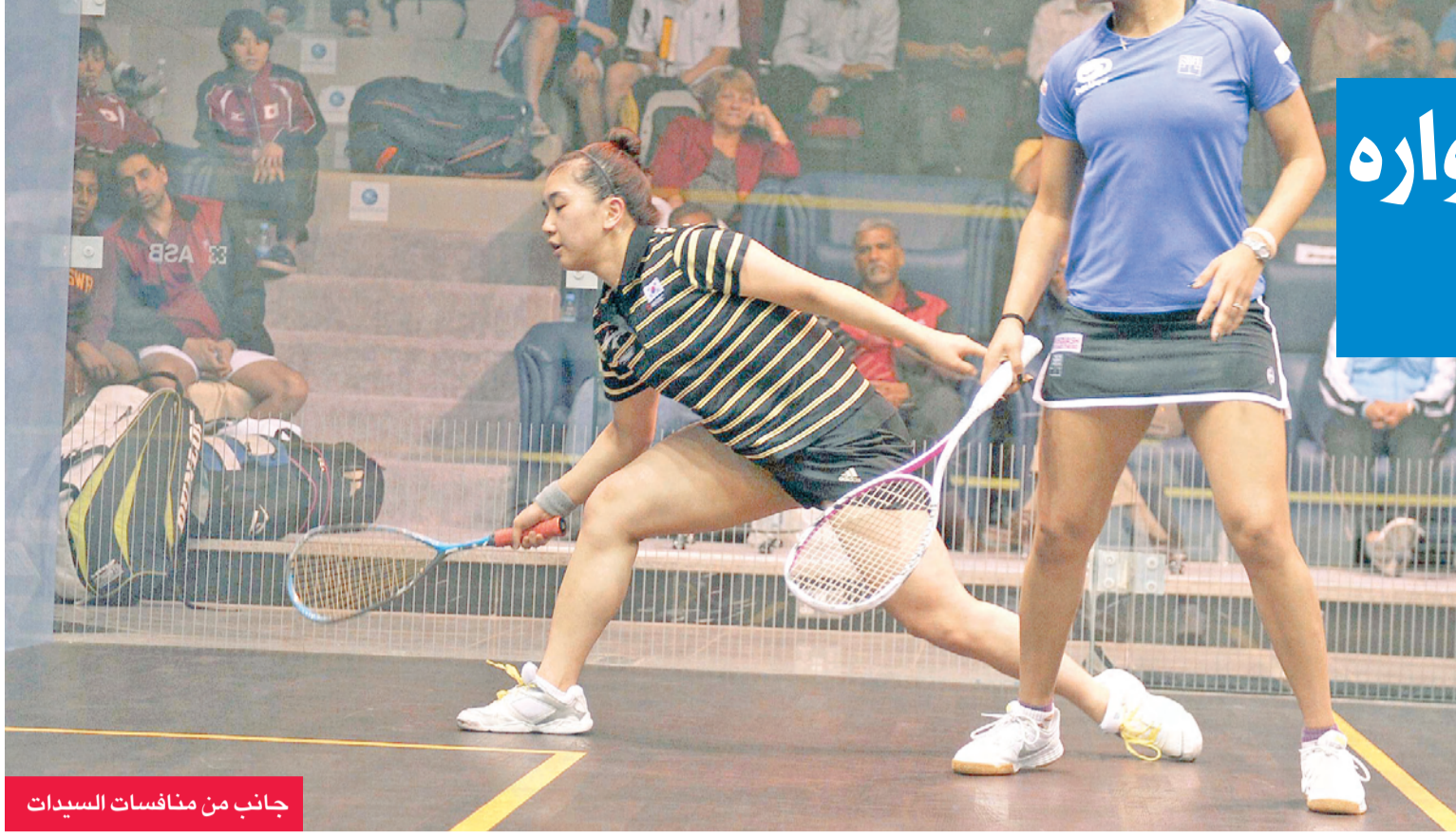
جانين من منافسات السيدات