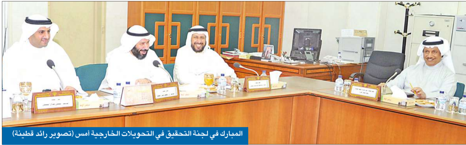
المبارك في لجنة التحقيق في التحويلات الخارجية أمس

في سابقة سياسية تسجل لسموه على مستوى لجان تحقيق مجلس الأمة، حضر رئيس مجلس الوزراء سمو الشيخ جابر المبارك مساء أمس أمام لجنة التحقيق في التحويلات الخارجية وأدلى بشهادته. وقال رئيس اللجنة النائب فيصل المسلم لـ الجريدة إن سمو رئيس الوزراء أبدى تعاوناً مع اللجنة إلى أبعد الحدود، فضلاً عن إصراره على تادية القسم قبل الإدلاء بالشهادة، مبيناً أن سموه أجاب عن كل الأسئلة التي طرحها اللجنة. وأضاف المسلم أنه تم إبلاغ سموه بأن هناك وزارات غير متعاونة وخصوصاً الخارجية، التي أعلن أنه سيرزوها غداً، مشيراً إلى أن المبارك أبدى ترحيبه «بزيارتي لديوانه في أي وقت أشاء». وقالت مصادر مطلعة لـ الجريدة إن رئيس الوزراء أبلغ اللجنة أنه أوقف جميع التحويلات التي تتم بأوامر شفوية عن طريق ديوانه، وأنه وجه بان تجري فقط عن طريق مجلس الوزراء وفق القنوات القانونية.