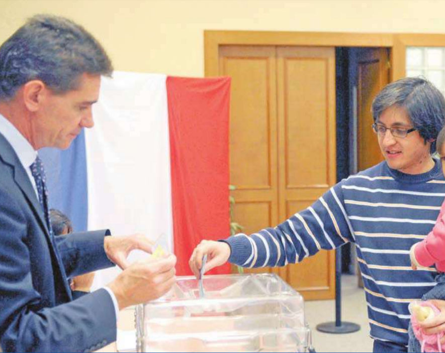
فرنسي يعيش في الأوروغواي يدلي بصوته في القنصلية الفرنسية في مونتفيدو أمس

يتوجه الناخبون الفرنسيون اليوم، إلى صناديق الاقتراع للمشاركة في الجولة الثانية من الانتخابات الرئاسية. في ظل منافسة مريرة بين الرئيس المنتهية ولايته نيكولا ساركوزي والمرشح الاشتراكي فرنسوا هولاند.