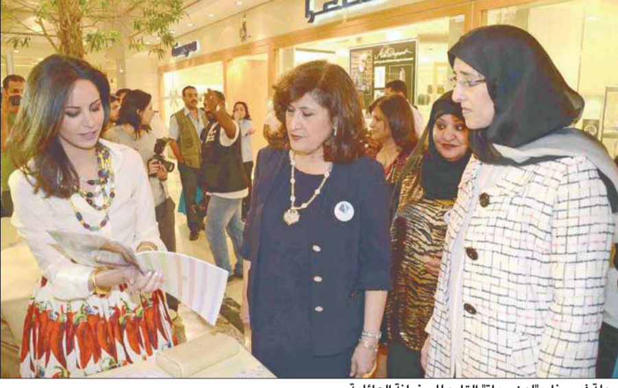
جولة في جناح "لون حياة" التابع للحضانة العائلية