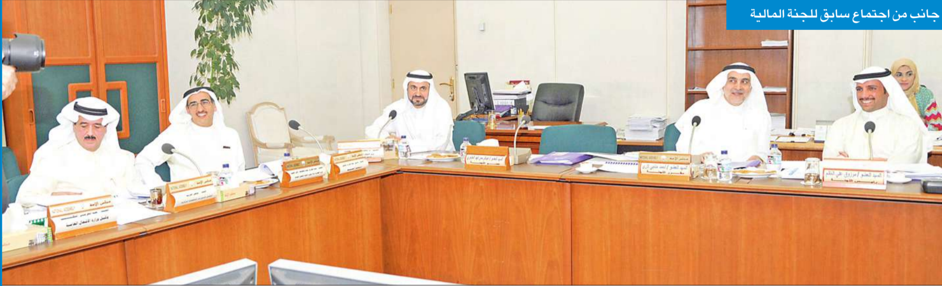
جانب من اجتماع سابق للجنة المالية

اصدرت الامانة العامة لمجلس الامة تقريرها عن اجتماعات لجان المجلس الدائمة والمؤقتة من 15 فبراير حتى 30 ابريل 2012، وذلك عملاً بالفقرة الأخيرة من المادة 46 من اللائحة الداخلية لمجلس الامة. ولوحظ انه في اللجان الدائمة حلت لجنة الشؤون المالية والاقتصادية في المرتبة الأولى، من حيث عدد اللجان التي اجتمعت، حيث عقدت خلال هذه الفترة 21 اجتماعاً، في مقابل اجتماع واحدة عقدته لجنة الجواب على الخطاب الاميري التي حلت في المرتبة الأخيرة. وفي اللجان المؤقتة حلت