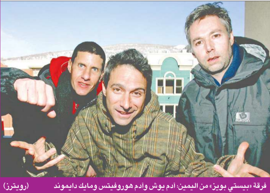
فرقة «بيستي بوائز» من اليمين: آدم يوش وأدم هوروفيتس ومايك دايموند

توفي أمس الأول آدم يوش، أحد مؤسسي فرقة بيستي بوائز، رائدة موسيقى الهيب هوب، عن 47 عاماً، بعد ثلاث سنوات من إعلانه إصابته بمرض السرطان، حسبما أفاد وكلاء الفرقة. وقال وكلاء الفرقة، في بيان، «نعلم بحزن شديد وفاة الموسيقي ومغني الراب والناشط والسينمائي آدم (أم سي آيه) يوش في مسقط رأسه في نيويورك، بعد صراع طويل مع السرطان استمر ثلاث سنوات تقريباً». وكان الفنان، المعروف أكثر باسم «أم سي آيه»، يعاني سرطاناً في الغدد اللعابية، حسبما ذكر الموقع الإلكتروني لمجلة رولينغ ستون، ففي عام 2009 أرجحت مجلة للفرقة، بسبب إصابة آدم يوش بالسرطان. وكان يوش، وأصله من بروكلين، أسس «بيستي بوائز» في عام 1979 مع مايك دايموند، المعروف باسم «مايك دي»، وأدم هوروفيتس والملقب بـ«إر روك».