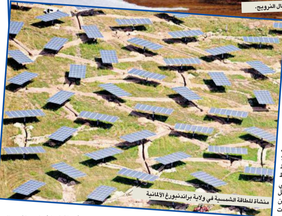
منشأة للطاقة الشمسية في ولاية براندنبورغ الألمانية

كان هذا التقلب السنوي غير متناسق. إضافة إلى أن نسبة انبعاثات غازات الدفيئة في الجو تتزايد بوتيرة متسارعة. يقول كوتش: «منذ سنتين تقريباً، شكّل ارتفاع معدل جزء واحد في المليون سنوياً، لكن يبلغ المستوى الراهن 3 أجزاء في المليون سنوياً».