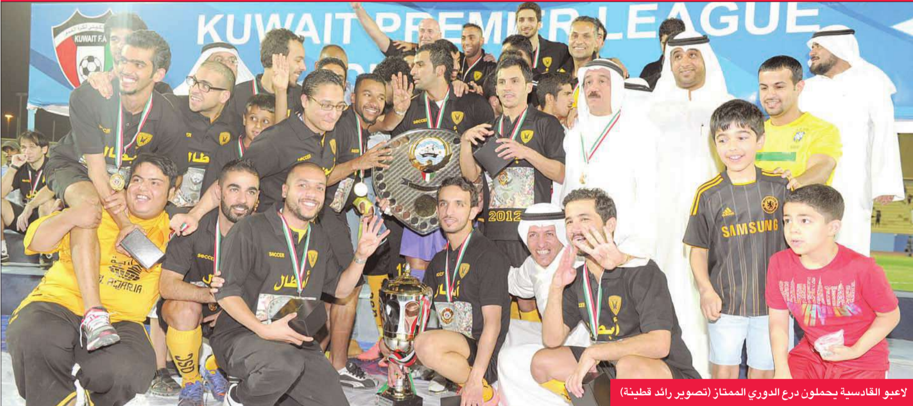
لاعبو القادسية يحملون درع الدوري الممتاز

توج الفريق الأول لكرة القدم في نادي القادسية بدرع بطولة الدوري الممتاز لكرة القدم للمرة الخامسة عشرة في تاريخه والرابعة على التوالي برصيد 51 نقطة، بالرغم من هزيمته أمام الكويت الذي رفع رصيده إلى نقطة 40 في المركز الثاني بهدفين نظيفين، في المباراة التي جمعتها على استاد محمد الحمد في نادي القادسية، ضمن ختام منافسات الجولة الـ 21 من عمر البطولة، التي شهدت أيضا فوز العربي على النصر بهدين لهدف، ليعزز الأخضر موقعه ثالثاً في ترتيب البطولة. وفي مباريات اللقاء، دخل الفريقان المباراة دون ضغوطاتهم المعتادة في الفترة الأخيرة، لأن نتيجة اللقاء لا تؤثر على تتويج