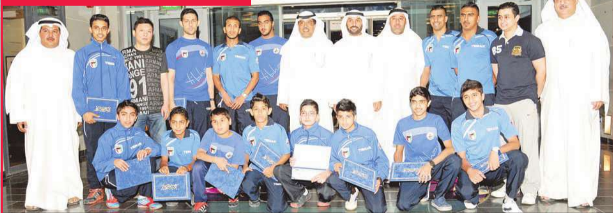
أعضاء الاتحاد مع المكرمين