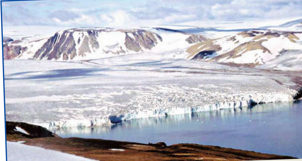
جبل جليدي في أرخبيل سفالبارد في شمال النرويج.