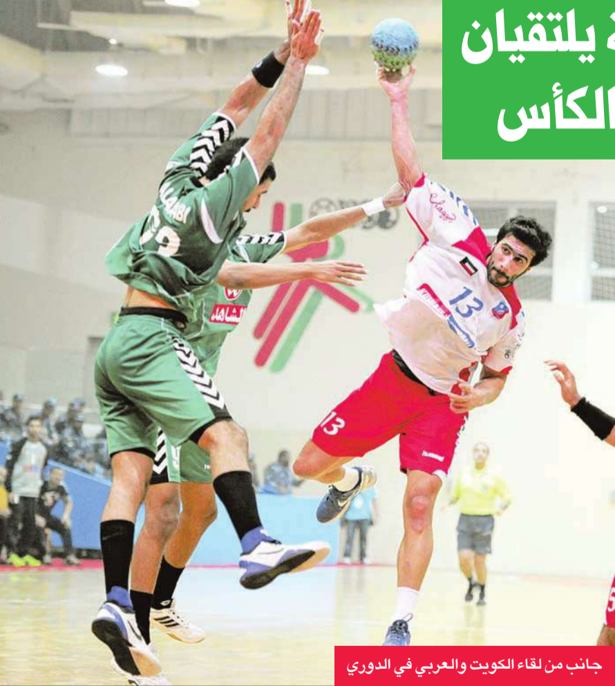
جانب من لقاء الكويت والعربي في الدوري