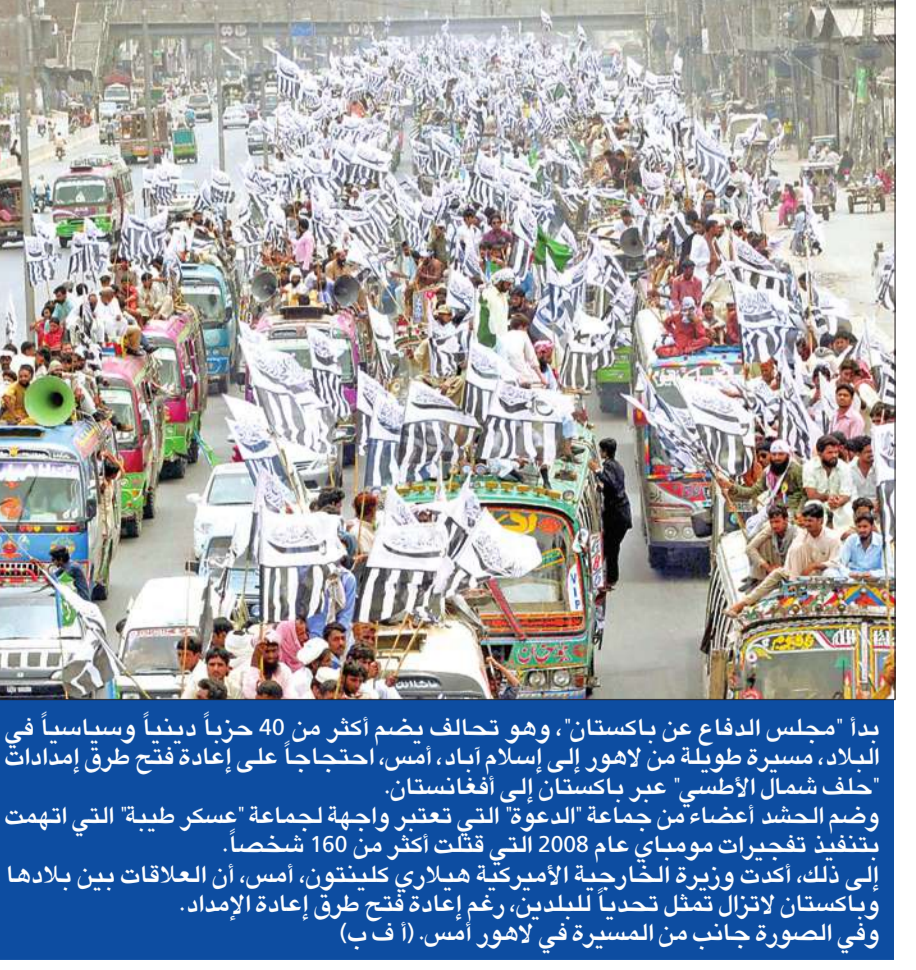
بدأ «مجلس الدفاع عن باكستان»، وهو تحالف يضم أكثر من 40 حزباً دينياً وسياسياً في البلاد، مسيرة طويلة من لاهور إلى إسلام آباد، أمس، احتجاجاً على إعادة فتح طرق إمدادات «حلف شمال الأطلسي» عبر باكستان إلى أفغانستان. ووضع الحشد أعضاء من جماعة «الدعوة» التي تعتبر واجهة لجماعة «عسكر طيبة» التي اتهمت بتنفيذ تفجيرات مومباي عام 2008 التي قتلت أكثر من 160 شخصاً. إلى ذلك، أكدت وزيرة الخارجية الأميركية هيلاري كلينتون، أمس، أن العلاقات بين بلدها وباكستان لا تزال تمثل تحدياً للبلدين، رغم إعادة فتح طرق إعادة الإمداد. وفي الصورة جانب من المسيرة في لاهور أمس.

قررت أكثر من 80 دولة ومنظمة دولية أمس، خلال مؤتمر في طوكيو لدعم أفغانستان منح مساعدة مدنية لهذا البلد بقيمة إجمالية قدرها 16 مليار دولار بحلول عام 2015 والاستمرار في تمويله حتى 2017 على الأقل. وقال المشاركون في «إعلان طوكيو» الذي تم تبنيه في ختام مؤتمرهم خلال بيان، «للتحقق من التقدم المحرز قررت الحكومة الأفغانية والأسرة الدولية وضع آلية متابعة لتقييم احترام التعهدات المتبادلة، ولهذه الغاية ستعقد اجتماعات متابعة على مستوى وزاري كل عامين». وأكد البيان، أن «المشاركين جددوا تصميمهم على محاربة الإرهاب والتطرف بكل أشكاله وعدم السماح بتحول أفغانستان مجدداً إلى معقل للإرهاب الدولي». وارتقت هذه التعهدات الجديدة بشرط صارمة على الأفغان احترامها خلال تنظيم انتخابات شفافة وديمقراطية في 2014 وتقديم ضمانات في احترام حقوق