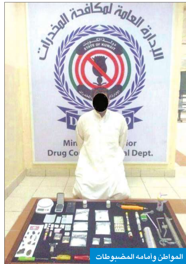
المواطن وأمامه المضبوطات