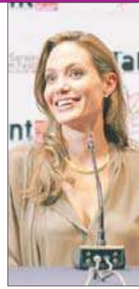
جولي تتحدث في إحدى ورشات العمل في المهرجان

في الحفاظ على حقيقة ما حصل في الاحداث المرتبطة بحرب سرايفو والبوسنة، ويروي فيلم انجلينا جولي الذي صور عام 2010 علاقة حب بين شابة مسلمة وصربي يجدان انفسهما في معسكرين متواجهين بعد اندلاع النزاع، مع خلفية حرب البوسنة واعمال العنف التي تعرضت لها النساء، واستعانت جولي