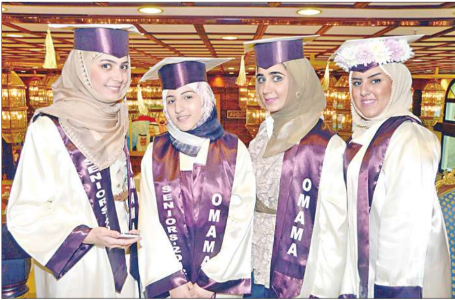
انفال وغدير وأمنة وزهراء