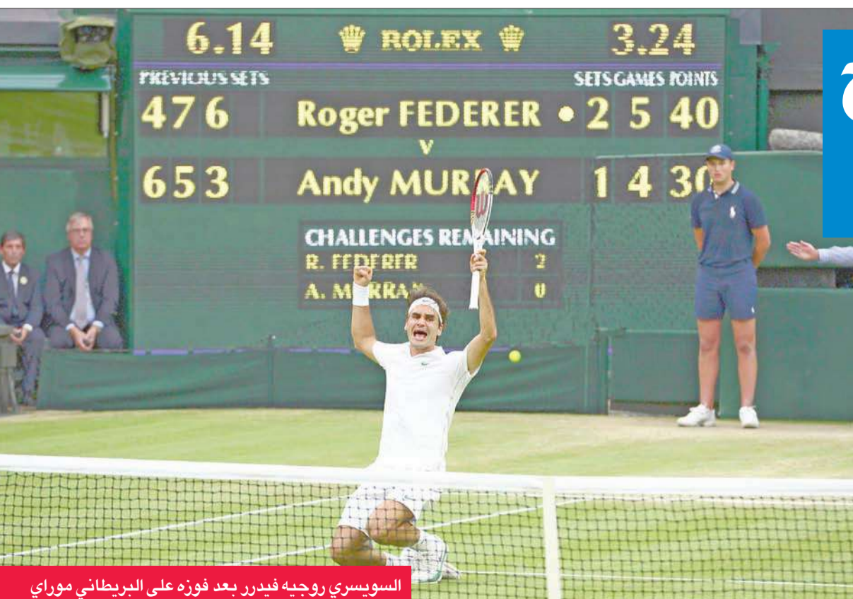
السويسري روجيه فيدرر بعد فوزه على البريطاني موراي

وكان النجم السويسري قد استهل مشواره في البطولة بالفوز على الإسباني البرت راموس 6-2 و 6-1 و 6-1 في الدور الأول، والإيطالي فابيو فونيني 6-1 و 6-3 و 6-2 في الثاني، والفرنسي جوليان بينينو التاسع والعشرين 6-7 و 6-3 و 7 و 6-2 و 6-1 في الثالث، والإيطالي فيليبي كزافييه ماليس 7-6 و 7-1 و 6-1 و 4-6 و 6-3 في الرابع، والروسي ميخائيل يوجني الساسد والعشرين 6-1 و 6-2 و 6-2 في ربع النهائي، والصربي نوكا ديوكوفيتش الأول وبطل العام الماضي 6-3 و 6-4 و 3-6 و 6-3 في نصف النهائي،