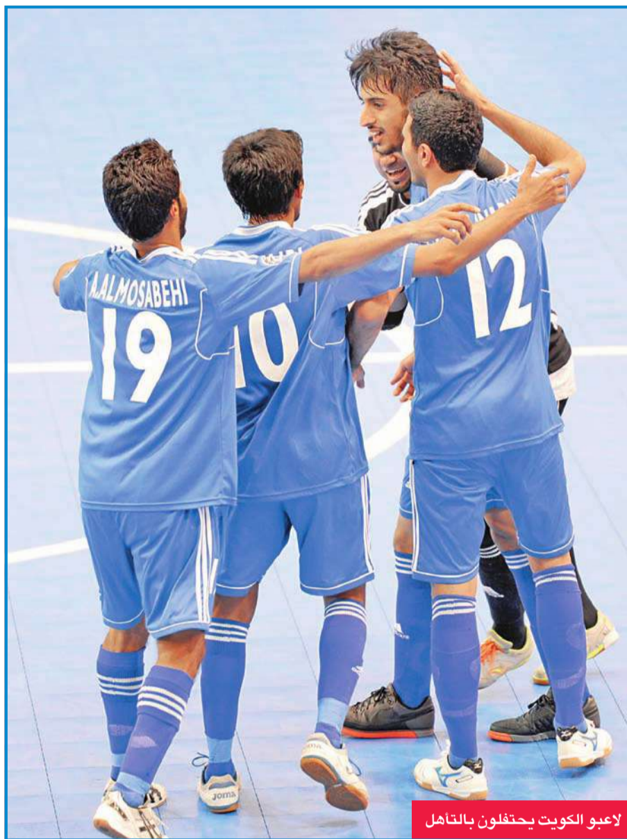
لاعبو الكويت يحتفلون بالتأهل

تحت رعاية وحضور اللواء فيصل الخراف رئيس هيئة الشباب والرياضة بيقم الصالون الإعلامي في الساعة السابعة من مساء حفل تكريم منتخب الكويت لهوكي الجليد، وذلك في مقر الصالون الإعلامي بدار الملثقي في بيت العثمان القديم، شارع العثمان، بحولي. وتأتي هذه الندوة التي يستضيف فيها الصالون منتخب الكويت لهوكي الجليد تكريماً لهذا الفريق الذي استطاع أن يضع اسمه في القائمة العالمية لهذه الرياضة. ويعتبر المنتخب الكويتي لهوكي الجليد أول منتخب يرفع علماً لدولة عربية في الأولمبياد الآسيوية، كما أنه أول منتخب عربي يُسجل رسمياً بالاتحاد العام لهوكي الجليد. وسيشارك عدد من الشخصيات الكويتية العامة في محلات مختلفة بحفل التكريم، والملثقي الإعلامي العربي يدعو المهتمين للحضور والمشاركة في هذا الحفل.