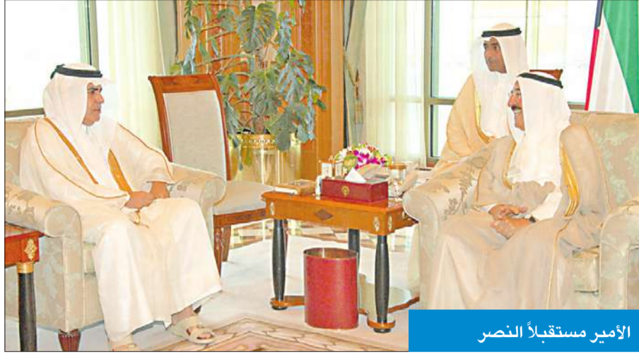
الأمير مستقبلاً النصر

استقبل سمو ولي العهد الشيخ نواف الأحمد في ديوانه بقصر السيف سمو الشيخ جابر المبارك رئيس مجلس الوزراء. كما استقبل سموه رئيس مجلس الأمة بالإقامة عبدالله يوسف الرومي. واستقبل سمو ولي العهد النائب الأول لرئيس مجلس الوزراء وزير الداخلية الشيخ أحمد الحمود. كما استقبل سموه نائب رئيس مجلس الوزراء وزير