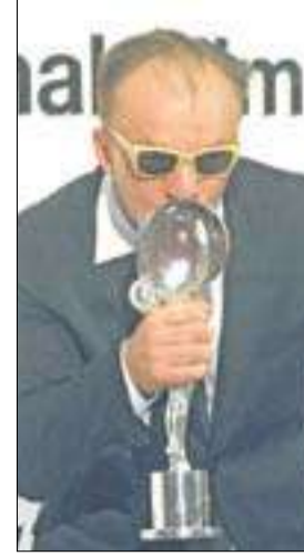
أفضل ممثل البولندي إيريك لوبوز

وقد منحت جائزة كرة بلور فخرية الى البريطانية هيلين ميرين الفائزة بجائزة اوسكار عن دورها في فيلم «ذي كوين» عام 2006 والممثلة الأميركية سوزان ساراندون (اوسكار أفضل ممثلة عن دورها في «ديد مان ووكيغ»، 1995) لمساهمتها في السينما العالمية.