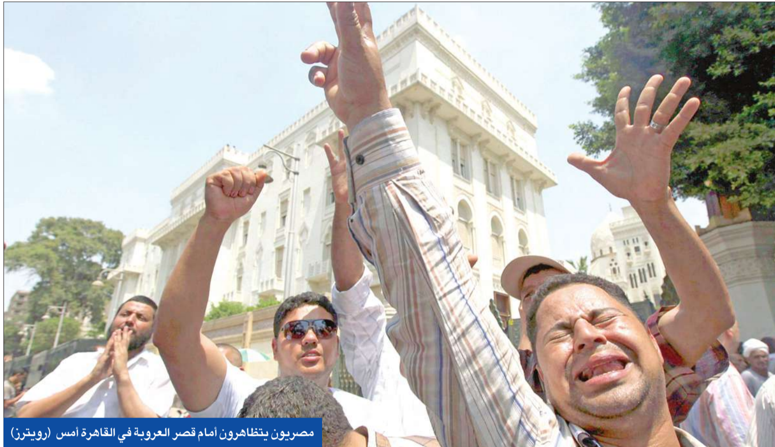
مصريون يتظاهرون أمام قصر العروبة في القاهرة أمس

القاهرة - أيمن عيسى وحاتم عبدالرحمن وأسماء حريز