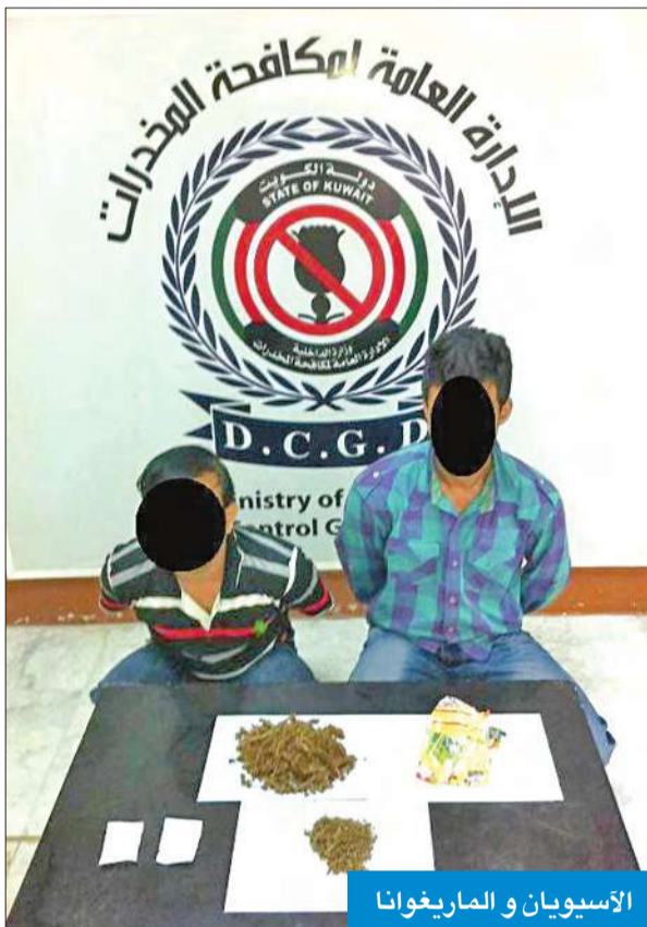
الأسويين و الماريغوانا

عدة أيام تاكدوا من ضلوع الأسوي في عملية الاتجار بمادة الماريغوانا المخدرة، مشيراً إلى أن التحريات دلت كذلك على أن الأسوي حذر جداً في تعاملاته ولا يتعامل مع أي شخص لا يعرفه وتتنصر تعاملاته في أبناء جلده فقط. وذكر المصدر أن رجال مكافحة استصردوا إذناً من النيابة العامة لمداومة منزل الأسوي في منطقة الفروانية، بعد أن دلت تحرياتهم على أنه يخفي كمية من مادة الماريغوانا في مسكنه، مشيراً إلى أن رجال مكافحة داهموا منزل الأسوي وعثروا بداخله على ربع كيلو من مادة الماريغوانا مخبأة في أماكن سرية، لافتاً إلى أن المتهم اعترف بأنه يحوزها بقصد الاتجار والتعاطي. وأشار المصدر إلى أن الأسوي اعترف كذلك خلال التحقيق معه بأنه يتاجر بالمخدرات لصالح أحد أبناء جلده وأرشد رجال مكافحة عن محل إقامته، حيث تم إلقاء القبض عليه وتمت إحالتها إلى النيابة العامة بتهمة الاتجار بالمواد المخدرة.