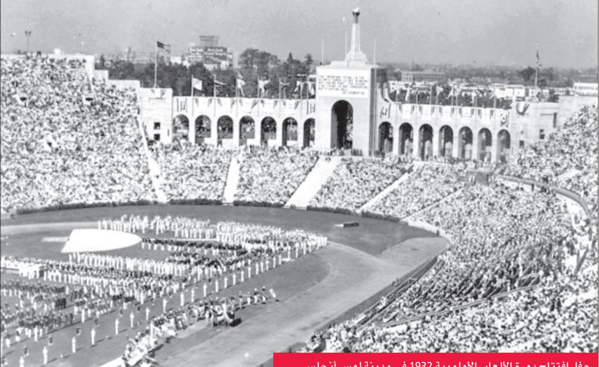
حفل افتتاح دورة الألعاب الأولمبية 1932 في مدينة لوس أنجلوس

سباقات السرعة أطلقت «الهيمنة الأميركية السوداء»، نظرا لكثرة المواهب والأسماء في العدو، حتى أن فريق البدل 4 مرات 100م الذي سجل رقما عالميا جديدا مقداره 40 ثانية لم يضم تولا، بل متكالف، وتآلف من كيسل وديير وتوبينو وويكوف. وفي سباق 10 آلاف متر غاب الاحتكار الفنلندي للمرة الأولى منذ 1912، وتوج البولندي يانوس كوزوسينسكي بطلا. كما أحرز مواطنه لوري لهيتين لقبه 15 آلاف متر (14:30) بدقة متقدما بفارق ضئيل على الأميركي هيل رالف. وأثارت النتيجة احتجاجات باعتبار أن لهيتين أعاق «ابن البلد» سوى الأمر لاحقا بكنز من السود والروح الرياضية وأداب الضيافة.