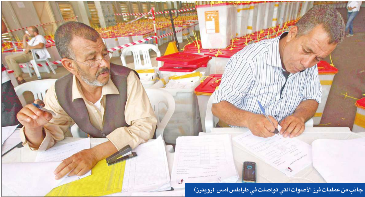
جانب من عمليات فرز الأصوات التي تواصلت في طرابلس أمس