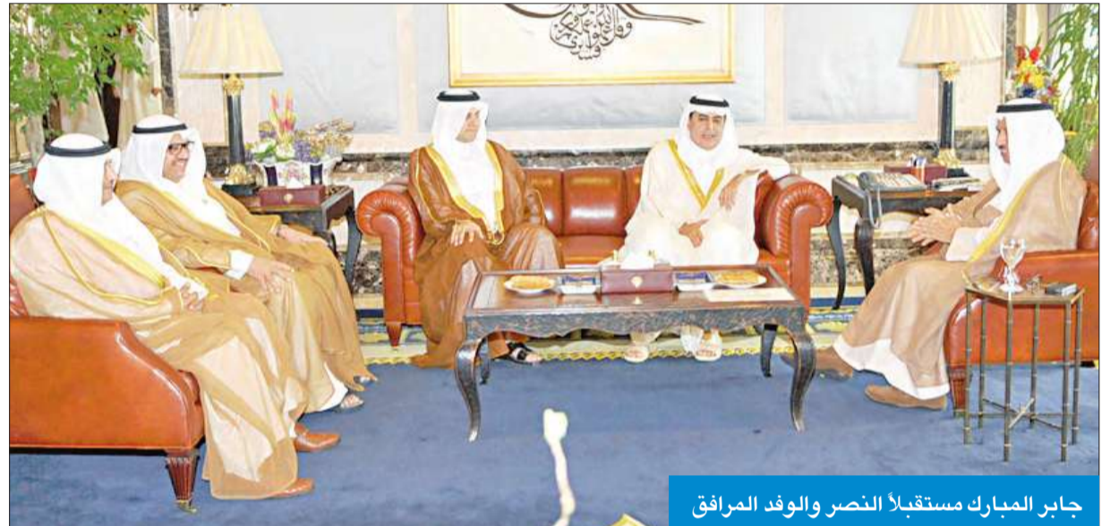
جابر المبارك مستقبلاً النصر والوفد المرافق

والتطورات الدولية على مختلف الأصعدة، شاكراً حكومة دولة الكويت على دعمها للجهود الدولية في تحقيق الأمن والسلام في العالم. حضر المقابلة مدير إدارة المنظمات الدولية في وزارة الخارجية جاسم المباركي.