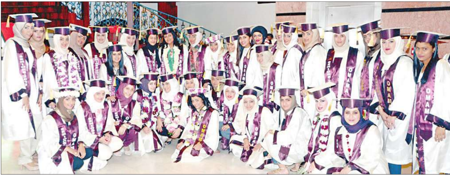
لقطة جماعية للخريجات

أقامت ثانوية أمانة بنت بشر بنات حفل تكريم لخريجات 2011-2012 برعاية رئيس الاتحاد الكويتي لكرة القدم الشيخ طلال الفهد في فندق ساس. حضر الحفل حشد من أولياء أمور الطالبات إضافة إلى كوادر تعليمية وتربوية.