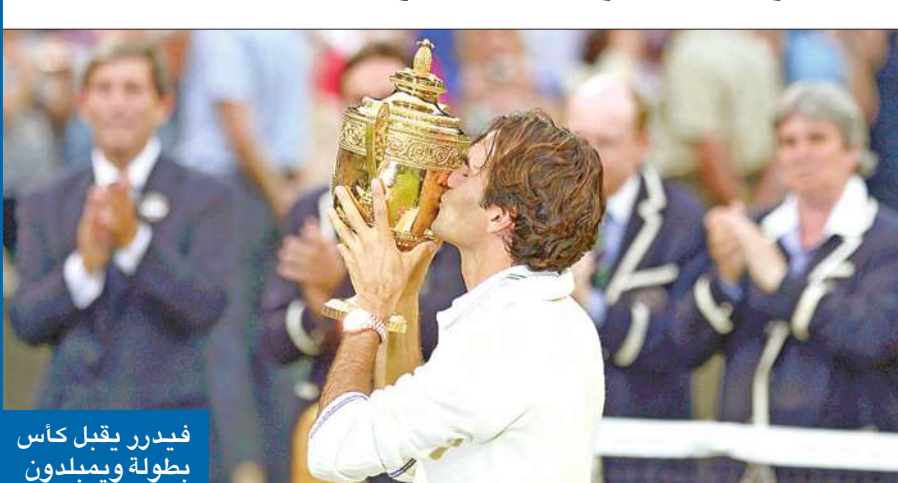
فيدرر يفصل بطولة ويمبلدون

أحرز السويسري روجيه فيدرر لقب بطولة ويمبلدون لكرة المضرب للمرة السابعة في مشواره، بعد فوزه على البريطاني أندي موراي (6-4) و5-7 و3-6 و4-6 في المباراة النهائية أمس. وسيعود فيدرر إلى صدارة التصنيف العالمي الذي يصدر اليوم الاثنين، بعدما رفع رصيده إلى 17 لقباً في البطولات الأربع الكبرى، وكان النجم السويسري قد تمكن من إطاحة الصربي نوفاك ديوكوفيتش