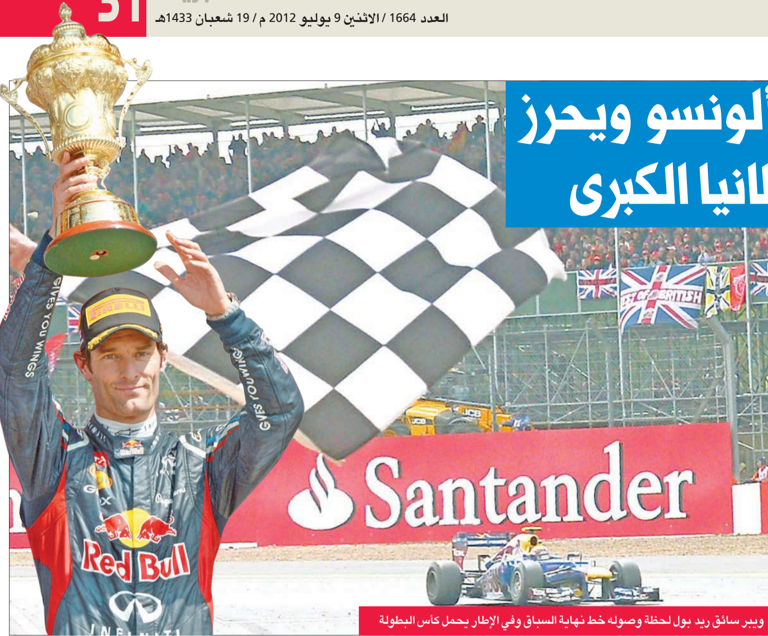
ويبر سائق ريد بول لحظة وصوله خط نهاية السباق وفي الإطار يحمل كأس البطولة

وفي المباراة الثانية في الدور قبل النهائي انتزع البولنديون فوزا مستحقا من أصحاب الأرض منتخب بلغاريا بثلاثة نظلفة جاءت أشواطها كالتالي (25-23، 25-20، 25-18). وبذلك يلتقي منتخبا كوبا وبلغاريا في مباراة تحديد المركزين الثالث والرابع. يذكر أن المباراة النهائية للدوري جرت في ساعة متأخرة أمس.