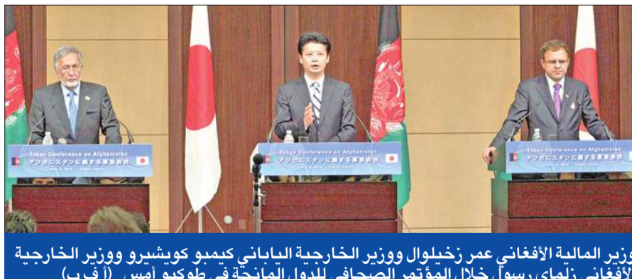
وزير المالية الأفغاني عمر زخيلوال ووزير الخارجية الياباني كيممو كوشيرو ووزير الخارجية الأفغاني زلمي رسول خلال المؤتمر الصحافي للدول المانحة في طوكيو أمس

وتريد الجهات المانحة تفادي انهيار الاقتصاد الهش أصلاً في أفغانستان لدى انسحاب قوات الحلف الأطلسي وتسليم المهمة الأمنية للأفغان، بسبب عدم توفر الأموال من الخارج مما قد يزعزع النظام القائم. وبالخزامن مع تعهدات كبار المانحين هذه، قال مسؤولون أمريكيون أفغان، إن 28 من المدنيين الأفغان وأفراد الشرطة قتلوا في سلسلة تفجيرات لقنابل مزروعة على الطرق واشتباكات في إقليم قندهار جنوب أفغانستان أمس، في أحد أكثر الأيام دموية في البلاد منذ أسابيع. وتعتبر القنابل التي يزرعها مقاتلو طالبان على الطرق أكثر الأسلحة الفتاكة في حرب الحركة ضد حلف شمال الأطلسي وحكومة الرئيس حميد كرزاي. (قندهار - أ ف ب، رويترز)