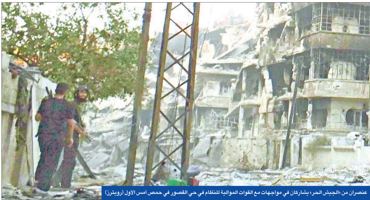
عنصران من «الجيش الحر» يشاركان في مواجهات مع القوات الموالية للنظام في القصور في حمص أمس الأول

للأمم المتحدة بان كي مون على هامش مؤتمر طوكيو من أن العنف الذي يجتاح سورية اتخذ منحى أسوأ ويتجه إلى اكتساب طابع طائفي، وأشار إلى أنه من الممكن أن تقوم الأمم المتحدة بتحريك آخر إذا استمرت أعمال العنف، وقال في هذا السياق: «يجب على حكومة سورية وجميع الأطراف الالتزام من جديد بخطة النقاط الست بالكامل».