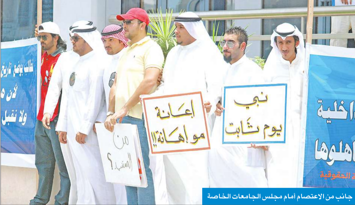
جانب من الاعتصام أمام مجلس الجامعات الخاصة

طلب التحاق بعد تاريخ 2012/7/17، وعلى الطلبة المتوقع تخرجهم، اصحاب الشهادات الانكليزية، ضرورة فتح ملف لدى عمادة القبول والتسجيل في الوقت الحالي.