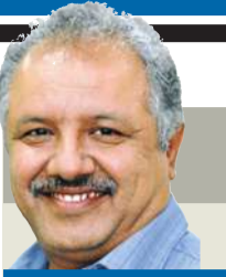
د. غانم النجار

في أيام الانتخابات وقبلها بكثير الحديث في كل الموضوعات، الكل يتحدث ولا يتوقف ليفكر في ما قال، في مثل هذه الأيام توقع كل شيء، فإنك لو تابعت أحد المرشحين في كل ما يقول فستجد الشيء ونقيضه، البعض منهم يتحدث حسب المكان الذي يوجد فيه، وحسب الجمهور الذي يستمع إليه، فحديث الصباح يختلف عن حديث المساء، وحديث السبت يختلف عن حديث الأحد وهكذا. في أيام الانتخابات لن تجد أحسن من شعار واحد يفرعه الجميع وهو: "المصلحة ولا غير المصلحة..." والتي تكسب به العبء، والغاية تبرر الوسيلة، وإلا كيف تستطيع أن تفسر اجتماع التقنيين وتبادل الأصوات بينهما، والمفاوضات السرية التي تحدث بينهما، والاتفاق على