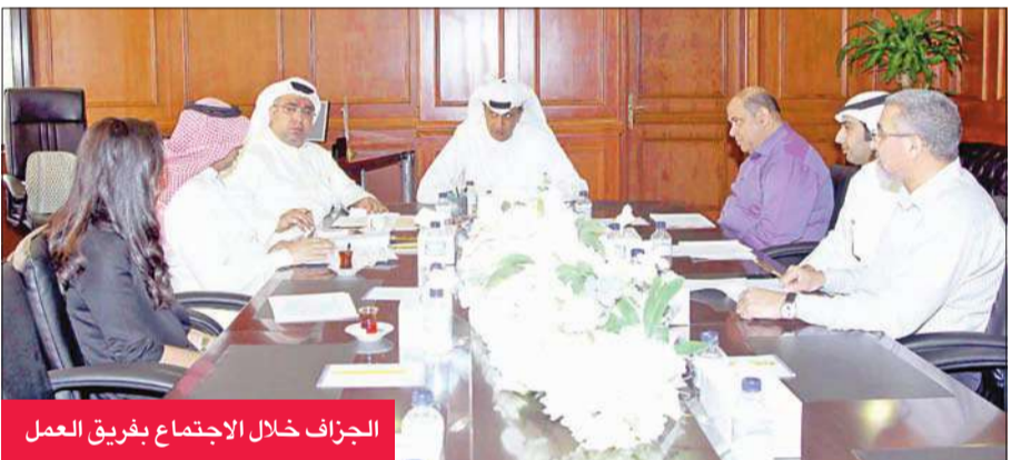
الجفاف خلال الاجتماع بفريق العمل

خاصة أن هذا المشروع يحمل اسم الأمير الوليد الشيخ سعد العبدالله، رحمه الله، مشيراً إلى أن العرض التقديمي من شأنها أن توضح مدى قدرة الشركات على مواكبة سوق العمل الذي يتسم بالسرعة. يذكر أن مجمع الشيخ سعد العبدالله الصباح للصالات المغطاة بمنطقة صباح السالم أحد المنشآت الرياضية العملاقة، ويضم ثلاث صالات اولمبية، منها الصالة الرئيسية لإقامة بطولات كرة السلة والطائرة، التي تتكون من خمسة طوابق، وتتسع لخمسة آلاف متفرج، إضافة إلى صالتين من ثلاثة طوابق، أحدها لانحاد السلة والأخرى لانحاد الطائرة، وتتكون كل صالة من ثلاثة طوابق علوية، وتتسع مدرجات الصالة لـ 19000 متفرج، ويضم المشروع فندقاً يشتمل على 60 غرفة، إضافة إلى ناد صحي وعبادة طبية وكل الخدمات الخاصة باللاعبين والجمهور والإعلام، وتبلغ تكلفة إنشاء المجمع 15.766.000 مليون دينار، ويقع المجمع بمنطقة صباح السالم ق4 ويطل على طريق الدائري السادس السريع.