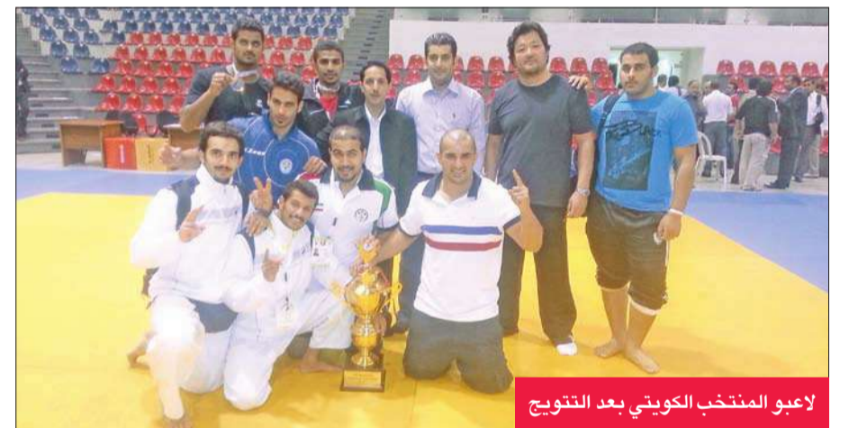
لاعب المنتخب الكويتي بعد التتويج