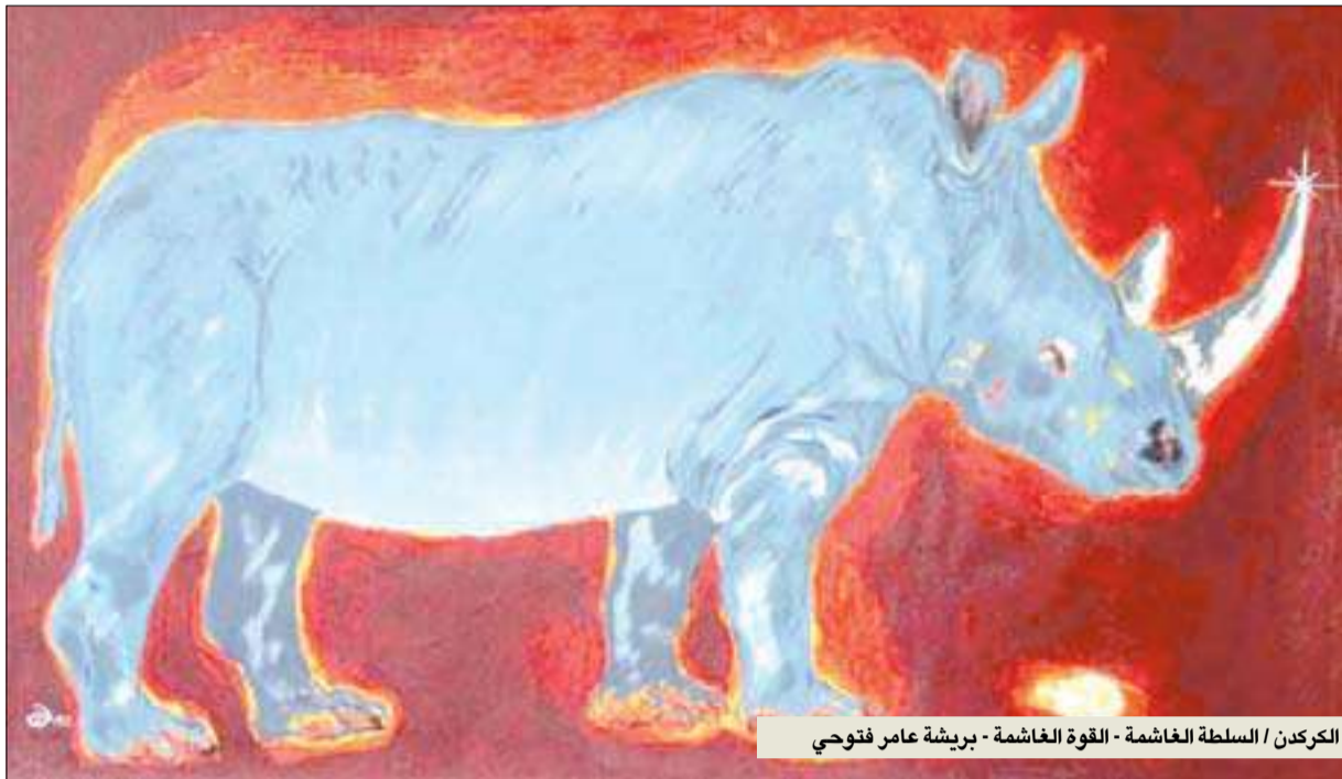
الكركدن / السلطة الغاشمة - القوة الغاشمة - بريشة عامر فتوحى

فرق شاسع بين كركدن توفيق صايغ وكركدن صانع الصائغ.