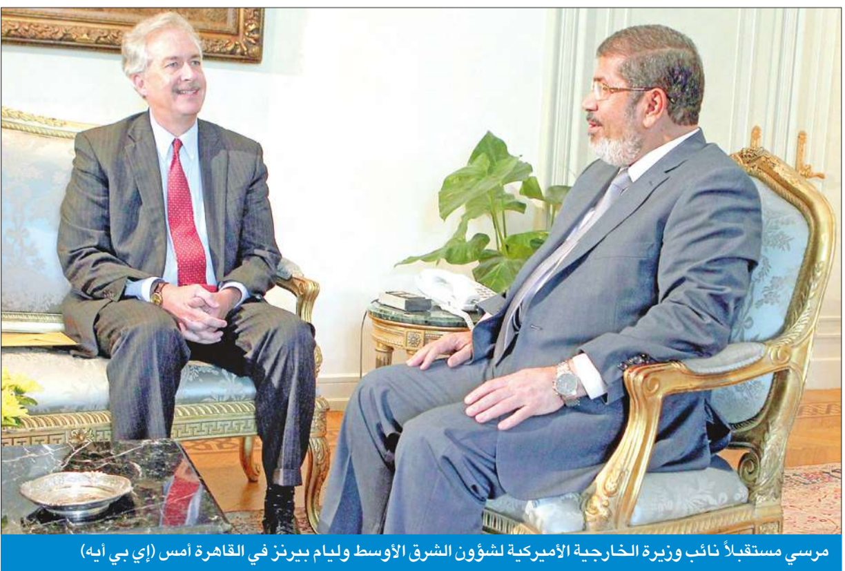
مرسي مستقبلاً نائب وزيرة الخارجية الأميركية لشؤون الشرق الأوسط وليام بيرنز في القاهرة أمس

في السياق، أفاد مصدر مطلع لـ"الجريدة"، بأن أعضاء المحكمة الدستورية العليا اجتمعوا فور صدور قرار مرسي، وناقشوا إمكان تقديم استقالاتهم، باعتبار أن القرار "اعتداء على أحكام المحكمة الدستورية".