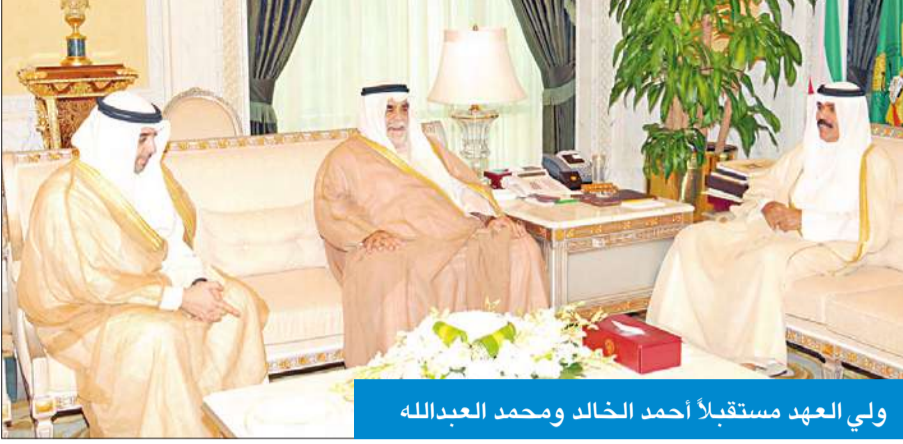
ولي العهد مستقبلاً أحمد الخالد ومحمد العبدالله

الدفاع الشيخ أحمد الخالد. واستقبل سمو ولي العهد نائب رئيس مجلس الوزراء وزير الخارجية وزير الدولة لشؤون مجلس الوزراء الشيخ صباح الخالد. كما استقبل سموه وزير الإعلام الشيخ محمد عبدالله المبارك. واستقبل سمو ولي العهد وزير الإعلام السابق الشيخ حمد جابر العلي.