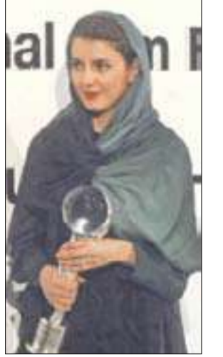
أفضل ممثلة الإيرانية ليلي حاتمي

حاز فيلم «ذي ألموست مان» للمخرج النرويجي مارتن لوند مساء السبت جائزة «كرة البلور» لأفضل فيلم في الدورة السابعة والأربعين لمهرجان الفيلم الدولي في كارلوفي فاري في تشيكيا الواقعة على بعد 120 كيلومترا غرب براغ.