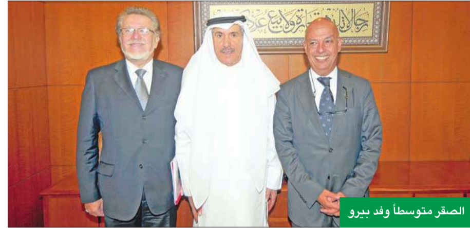
الصحف متوسطاً وفد بيرو

الصحف: خطوة مهمة في تقوية العلاقات بين البلدين