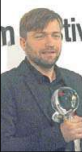
أفضل مخرج كندي رافيل أوليت