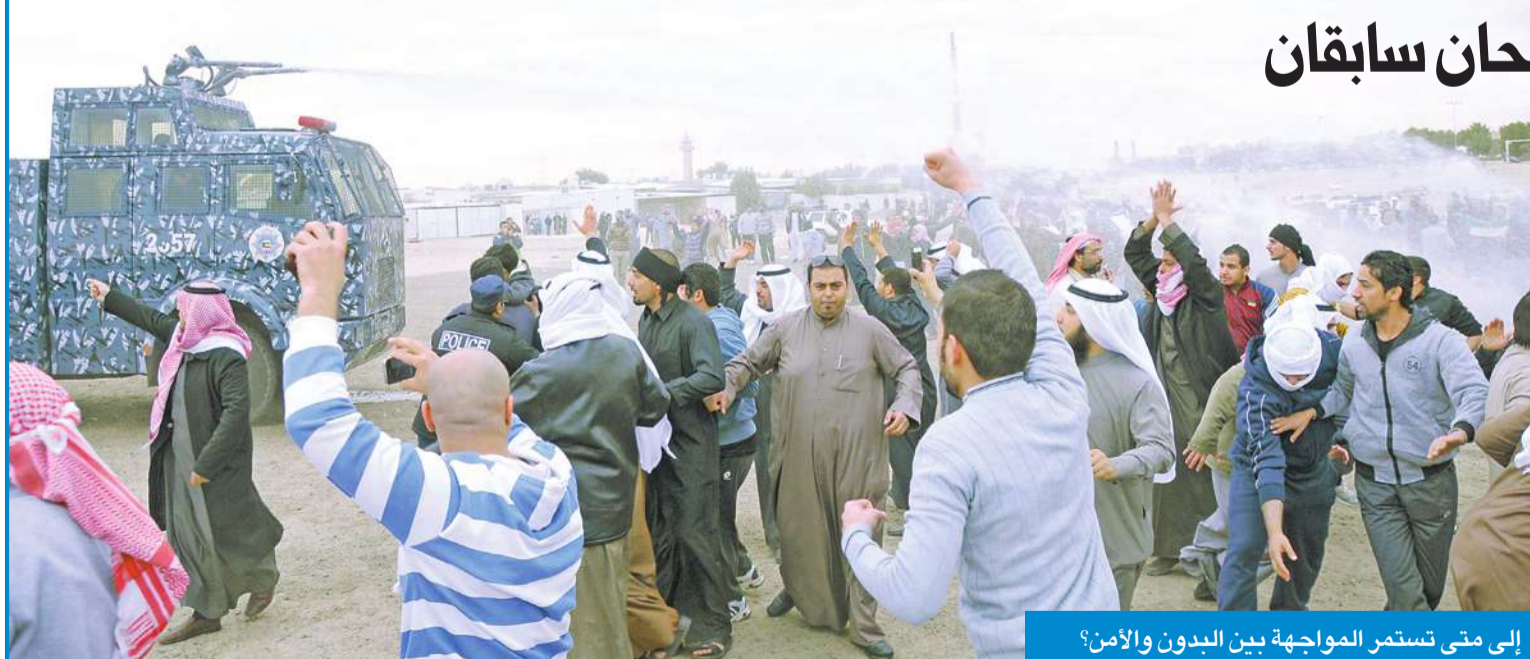
إلى متى تستمر المواجهة بين البدون والأمن؟