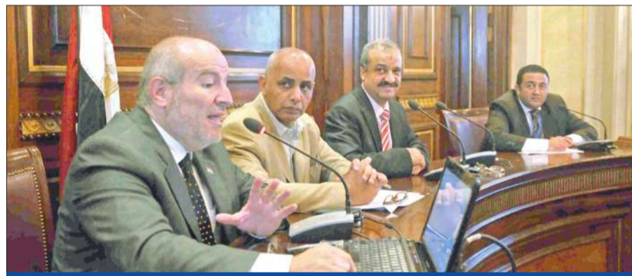
جانب من اجتماع في القاهرة، للجنة التي تتلقى المقترحات بشأن «تأسيسية للدستور»

هددت الكنيسة المصرية وحزب «النور» السلفي بالانسحاب من اللجنة التأسيسية لصياغة الدستور إثر الخلاف على نص المادة الثانية من الدستور، والتي ارتضت الكنيسة أن يكون نصها «ومبادئ الشريعة الإسلامية هي المصدر الرئيسي للتشريع»، وهو ما يعترض عليه حزب «النور». ومن المنتظر أن تعقد اللجنة التأسيسية غدا، اجتماعا مشتركا للجانبين الخمس لمناقشة ما توصلت إليه من اقتراحات وموضوعات تتعلق بموضع الدستور الجديد.