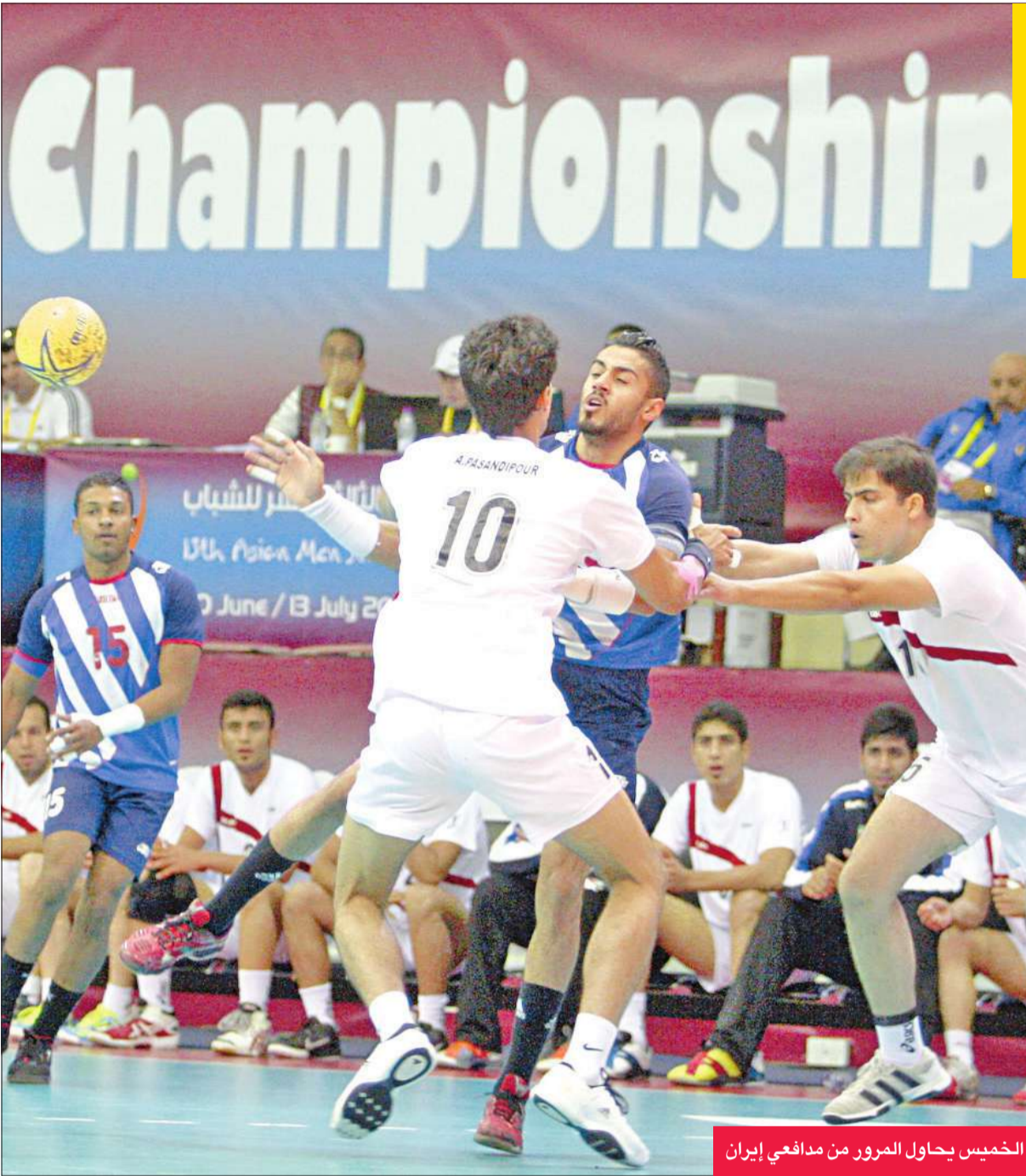
الخميس يحاول المرور من مدافعي إيران