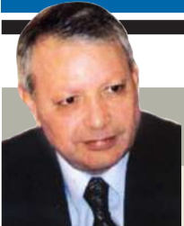
صالح القلب كاتب وسياسي أردني