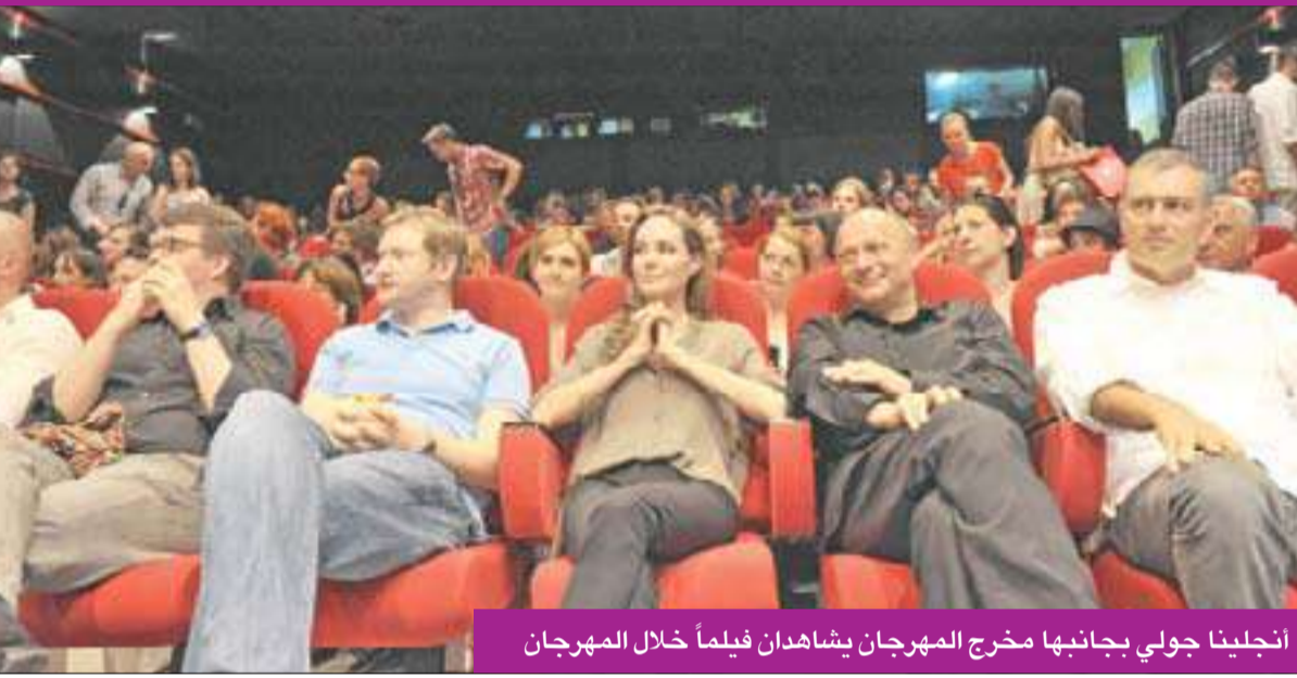
أنجلينا جولي بجانبها مخرج المهرجان يشاهدان فيلماً خلال المهرجان

الجمعة مع فيلم «ديكا»، (اطفال عابدة بيغيتش (نويه خاص من لجنة تحكيم مهرجان كان الاخير).