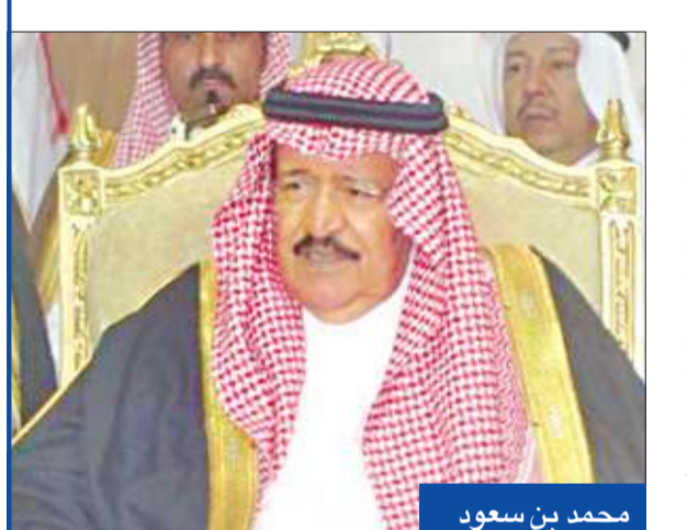
أعلن الديوان الملكي السعودي أمس، وفاة الأمير محمد بن سعود بن عبدالعزيز، الذي كان يعالج في أحد المستشفيات خارج المملكة.

وفاة الأمير محمد بن سعود بن عبدالعزيز آل سعود، ولد في عام 1919 وهو من الجيل الثالث حيث كان معروفاً لدى عائلة آل سعود وتخرج من مدرسة الأمراء. وعين في 1941 وزيراً للدفاع والطيران والمفتش العام بعد أخيه الأمير فهد بن سعود بن عبد العزيز آل سعود، وفي العام نفسه عينه والده رئيساً للحرس الملكي السعودي، وكان من أفضل الأضواء الذين ترأسوا هذا المنصب. وعين وزيراً للمالية في عام 1961 ولم يبق فيها إلا ستة أيام، وتولى منصب أمير منطقة الباحة جنوب غرب المملكة منذ سنة 1986 إلى سنة 2010، وصدر أمر ملكي في 2010 يقضي بإعفائه من منصبه بناء على طلبه، وذلك لظروفه الصحية. وعُيّن أخوه الأمير مشاري بن سعود بن عبدالعزيز أميراً لمنطقة الباحة بمرتبة وزير. وكان الراحل يملك عدة مشاريع عقارية وصناعية واستثمارية وفندقية داخل المملكة وخارجها، فضلاً عن شركاته المتعددة مع بعض رجال الأعمال في المملكة وخارجها. وهو عضو في هيئة البيعة عن أبناء الملك سعود بن عبد العزيز آل سعود. (الرياض - يو بي أي)