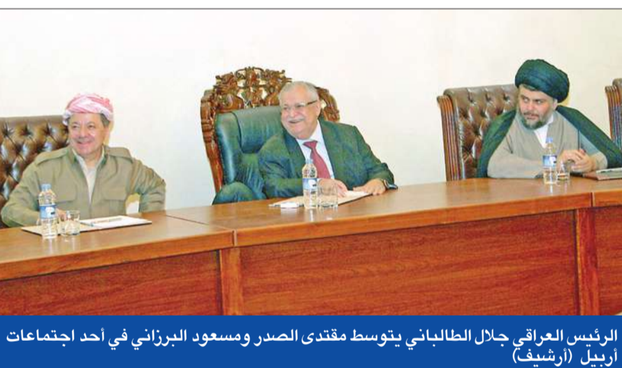
الرئيس العراقي جلال الطالباني يتوسط مقتدى الصدر ومسعود البرزاني في أحد اجتماعات أربيل

إقليم كردستان العراق فؤاد حسين، أمس، أن الاجتماع التشاوري الذي عقد أمس الأول، في أربيل بين التحالف الكرديستاني وقائمة العراقية توصل إلى مجموعة من التوصيات. وأوضح حسين أن «جملة من الخيارات الدستورية تم طرحها خلال الاجتماع تتعلق بكيفية معالجة الأزمة الحالية التي تواجه العملية السياسية والجهود التي بُذلت في سبيل إنقاذها». ولم يفصح حسين عن طبيعة الخيارات، لكنه قال إنه سيتم نقلها إلى زعيم التيار الصدري مقتدى الصدر، بغية اتخاذ قرارات موحدة بشأنها.