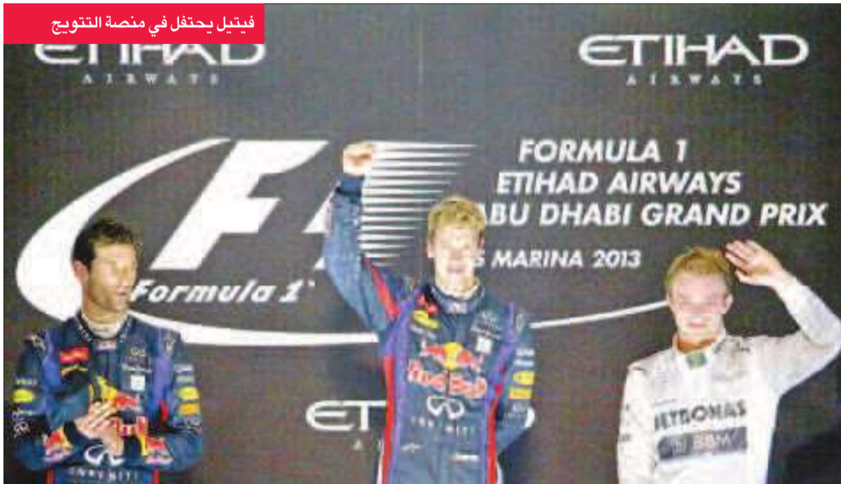
فيتيل يحتفل في منصة التتويج

بليه اللونسو في المركز الثاني برصيد 217 نقطة، ثم رايبون في المركز الثالث برصيد 183 نقطة، ثم هاميلتون في المركز الرابع برصيد 175 نقطة. (د ب أ)