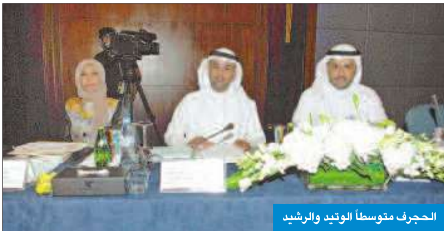
الحجرف متوسطاً الوتيد والرشد

ومناقشة الإطار مع المعنيين في وزارة التربية والبنك الدولي والمركز الوطني لتطوير التعليم، مضيفاً أن هذا الإطار سيمثل النظرة الشاملة والكبيرة التي تنطلق منها المعايير الوطنية للتعليم لأول مرة لتطوير التعليم ومخرجاته.