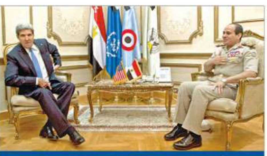
كيري يجلس مع وزير الدفاع المصري عبد الفتاح السيسي في القاهرة أمس

واشنطن تدعم السلطات المؤقتة وتجدد دعوتها إلى انتخابات بمشاركة الجميع