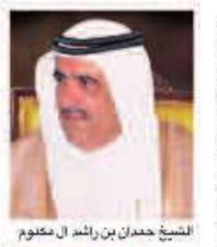
الشيخ حمدان بن راشد آل مكتوم