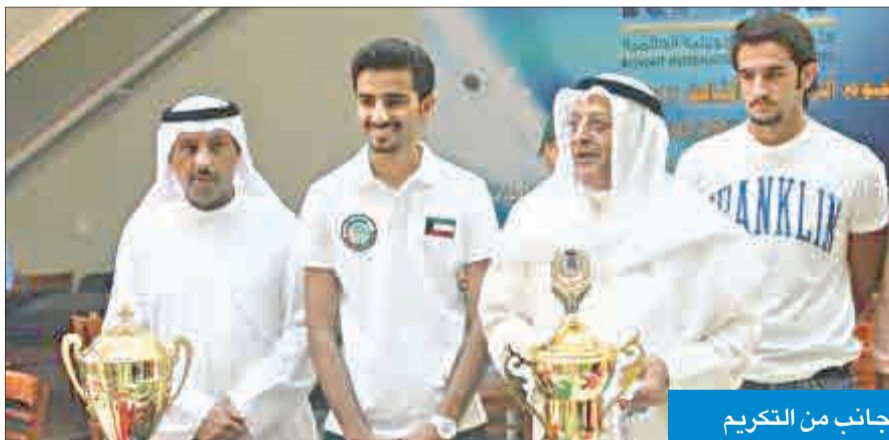
جانب من التكرم

أكد رئيس مجلس الأمانة في كلية القانون الكويتية العالمية د. بدر الخليفة أن «الكلية تفخر بنخبة الأبطال الرياضيين من طلابها لأنهم يمثلون نموذجا رائعا للشباب الكويتي القادر على تحقيق التفوق في أكثر من مجال في وقت واحد، وأنتم حين تشاركون في بطولات محلية أو خارجية تكونون سفراء للكلية في تلك المحافل».