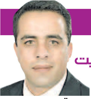
على كف عفريت