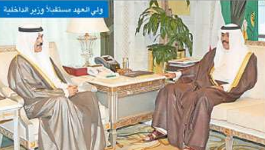
استقبل سمو ولي العهد نائب رئيس مجلس الوزراء وزير الدفاع الشيخ خالد السجراح. كما استقبل سموه وزير الإعلام وزير الدولة لشؤون الشباب الشيخ سلمان الحمود. واستقبل سمو ولي العهد نائب رئيس مجلس الوزراء وزير الدفاع الشيخ خالد السجراح. كما استقبل سموه وزير الإعلام وزير الدولة لشؤون الشباب الشيخ سلمان الحمود.