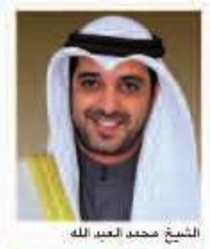
الشيخ محمد العبد الله

وأضاف يهياني إن هذا الحدث يعد فرصة حضيض لخلق الضوء على التطور الكبير الذي وصلت إليه المؤسسات والهيئات الكويتية، وعلى نحو الحركة الاقتصادية، كما يسهم بشكل كبير في تسهيل الضوء على الإنجازات الكويتية في مختلف المجالات، واختتم يهياني، الكويتي، «ببني» شعاعاً آنذاك لفعاليات الأسبوع الكويتي في لقاءات الأسيوع الكويتي في دبي والذي يعد أكبر وأتمتع بظهورها في أعماق التاريخ، وتلهم يوفاء، تلا الشعبين لأختر. وأعرب يهياني عن الاعتزاز الكبير بالتواصل المتمتع بين أبناء الشعبين الكويتي والإماراتي، الذي نمزه روح الأسرة الواحدة، في ظل التعاون