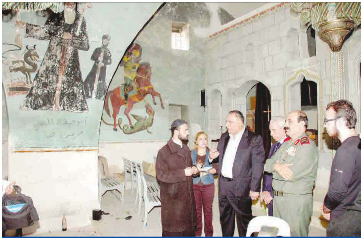
صورة وزعتها وكالة «سانا» أمس الأول تظهر مسؤولين سوريين موالين للنظام داخل كنيسة تاريخية في بلدة صدق التي تسكنها غالبية مسيحية في محافظة حمص بعد أن استعادت القوات الاسديّة السيطرة عليها من مسلحي المعارضة (إي بي آية)

«الائتلاف» يقدم ورقة عمل لوزراء الخارجية العرب ترفض مشاركة طهران في «جنيف 2»