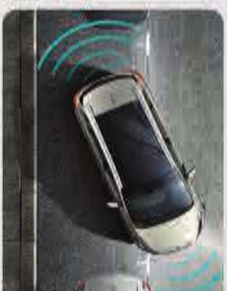
نظام المساعدة على الإصطفاق