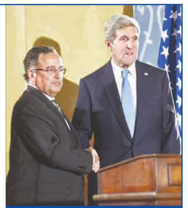
كيري وفهمي عقب انتهاء مؤتمرهما الصحفي في القاهرة أمس (أ ف ب)

وفي ما يتعلق بالتجميد الجزئي مؤخراً للمساعدة الأميركية (1.5 مليار دولار منها