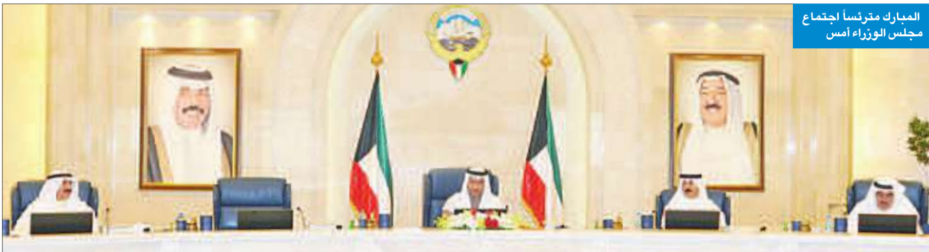
المبارك مترئساً اجتماع مجلس الوزراء أمس

حرساً على تجسيد جدية الحكومة في ترجمة التوجيهات والنصائح التي وردت في النطق السامي والخطاب الأميري لسمو الأمير، وكذلك ما ورد في كلمة رئيس مجلس الوزراء سمو الشيخ جابر المبارك في افتتاح دور الانعقاد العادي الثاني لمجلس الأمة، وجهه اللازمة في مجال تنفيذ تلك التوجيهات، وكذلك سبل ضمان الالتزام الجاد بتنفيذ الخطوات العملية التفصيلية اللازمة في مجال تنفيذ تلك التوجيهات، وكذلك سبل ضمان العملية وحسن متابعتها، تمهيدا لمناقشة هذه الأوراق في مجلس الوزراء واتخاذ ما يلزم من إجراءات بشأنها.