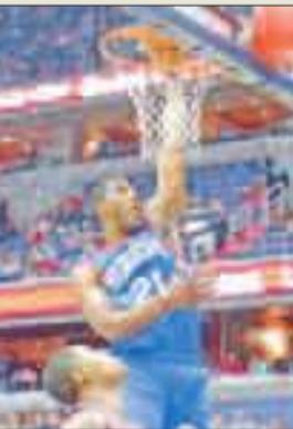
يوغ نجم فيلادلفيا