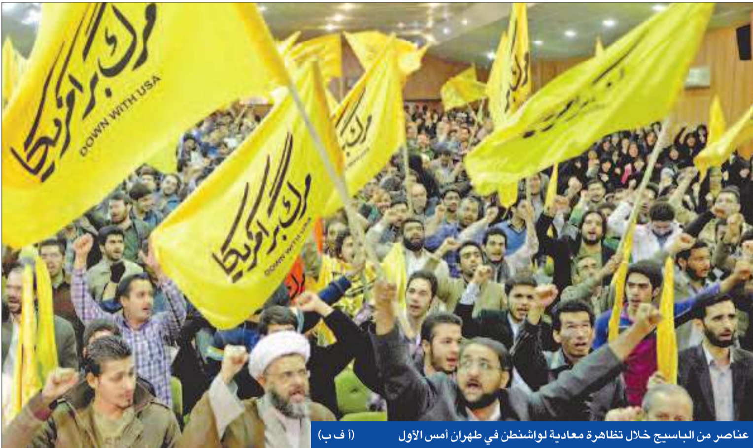
عناصر من الباسيج خلال تظاهرة معادية لواشنطن في طهران أمس الأول

• ظريف يدعو إلى تقوية علاقة إيران بالجوار • دهقان: توصلنا إلى قوة ردع فعالة