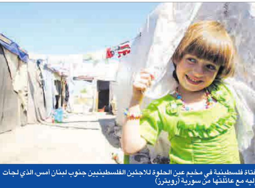
فتاة فلسطينية في مخيم عين الحلوة للاجئين الفلسطينيين جنوب لبنان أمس، الذي لجأت إليه مع عائلتها من سورية

● بري: «14 آذار» تعرقل تأليف حكومة ● عون: المسيحيين مع الدولة المدنية