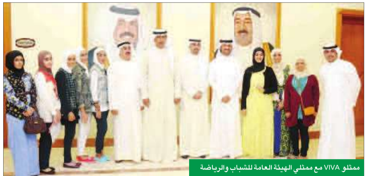
ممثلو VIVA مع ممثلي الهيئة العامة للشباب والرياضة

المهارات اللازمة لهم في أجواء تسودها المتعة والإثارة تمكنهم من تبادل الخبرات والتعرف على بيئة العمل الإعلامي من خلال زيارة العديد من المؤسسات الإعلامية كما تستهدف صقل مهارات الشباب القيادية والإعلامية والإدارية وتأهيلهم ليصبحوا قادرين على قيادة مجتمعاتهم في المستقبل وتحقيق الرقي والتقدم والتنمية المستدامة، وتمثيل كل من دولة الكويت والإمارات العربية المتحدة في كافة المحافل الإقليمية والدولية.