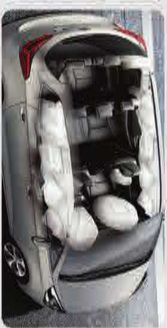
أكياس هوائية أمامية وجانبية - 7 ركاب