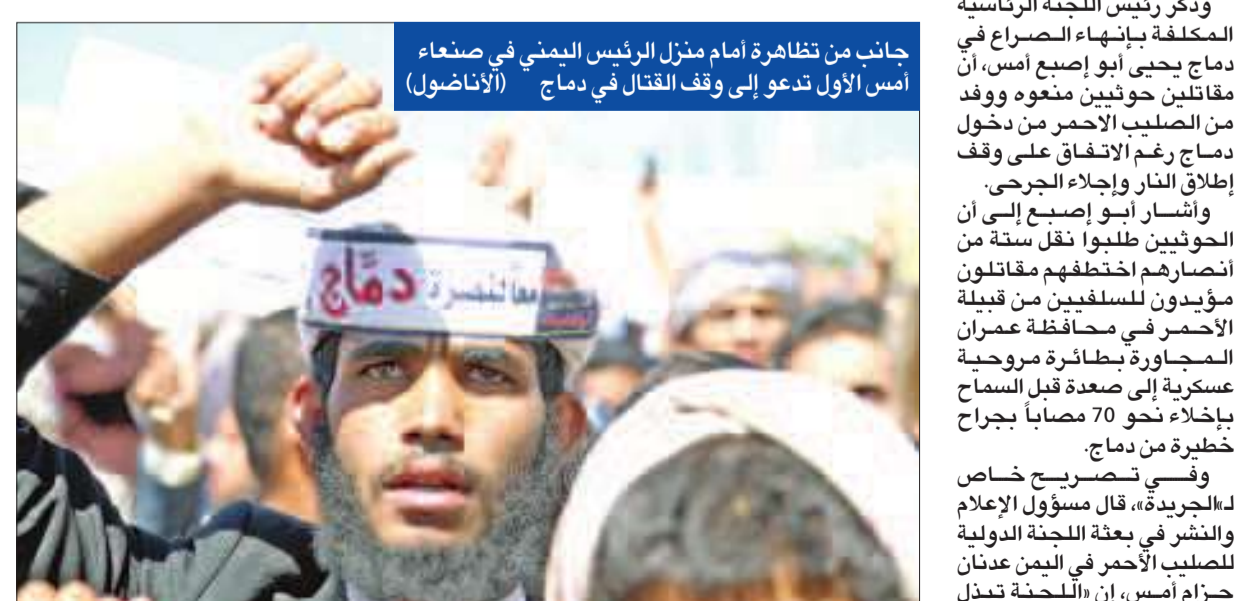
جانب من تظاهرة أمام منزل الرئيس اليمني في صنعاء أمس الأول تدعو إلى وقف القتال في دماج