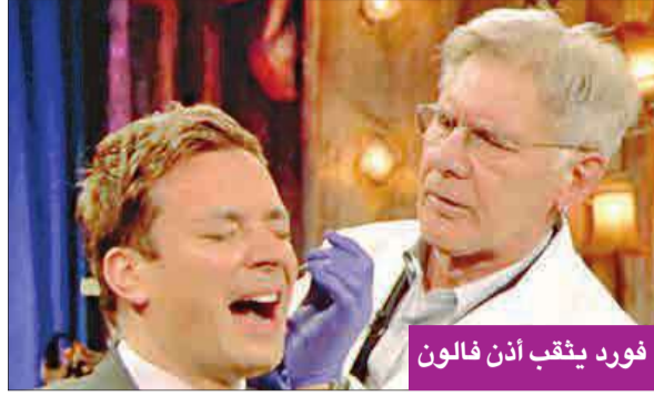
فورد يثقب أذن فالون

خرج المغني الأميركي كريس كيلبارتريك من عالم العزوبية وتزوج خطيبته كارلي سكلاداني بعد علاقة امتدت أكثر من 3 سنوات. وذكر موقع «بيبول» الأميركي ان كيلبارتريك (42 سنة)، الذي كان المغني الرئيسي في فرقة «NSYNC»، ودع حياة العزوبية وتزوج سكلاداني في فلوريدا. وأشار إلى ان كل أعضاء فرقة «NSYNC» كانوا