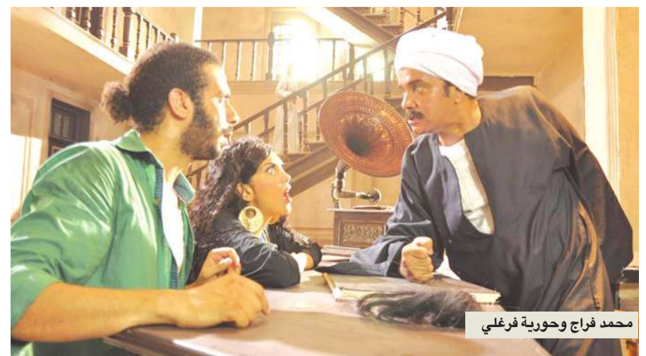
محمد فراج وحورية فرغلي

يرى الناقد طارق الشناوي أن طبيعة المجتمع تغيرت وأصبح استخدام الألفاظ القبيحة أمراً عادياً في الحياة اليومية وعلى مواقع التواصل الاجتماعي، وبالتالي نقلت السينما الواقع بسليبيته، وقد سبقتها الدراما التلفزيونية في ذلك للأسف. يضيف: «لا مبرر درامياً للإفراط في هذه الألفاظ ولا توجد قصة من الأساس، إنما استخدام هو الهدف يحد ذاته، ثم طبيعة المشاهد تغيرت وتعبير غالبيتها عن شريحة تستخدم هذه الألفاظ بشكل طبيعي وترغب في سماعها، فليس صانعو هذه الأفلام رغبة الجمهور». وعن تغاضي الرقابة عن مثل هذه الألفاظ يوضح الشناوي أن سقف الممنوعات ارتفع نتيجة تغير المجتمع