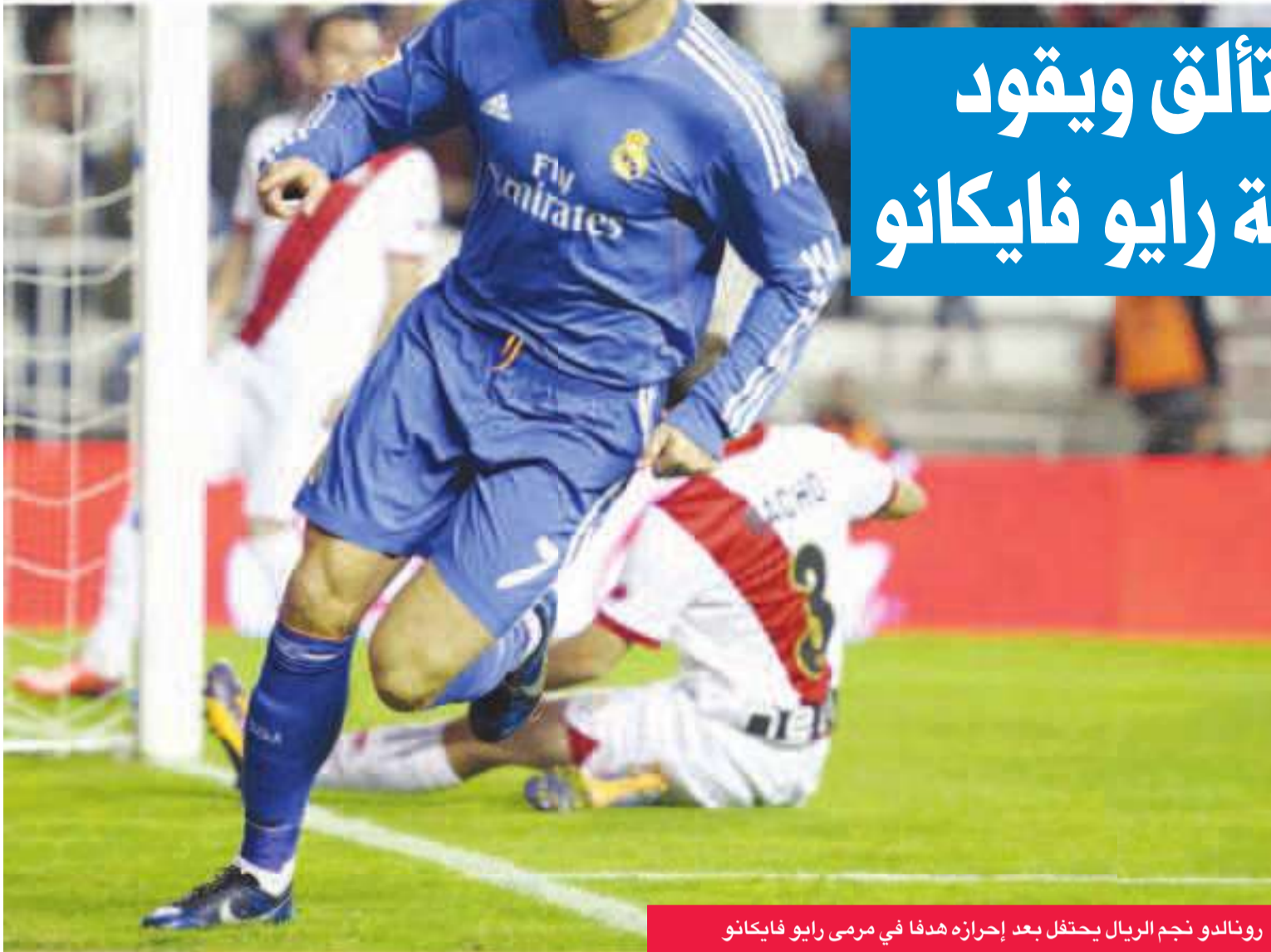
رونالدو نجم الريال يحتفل بعد إحرازه هدفا في مرمى رايو فايكانو

قاد النجم البرتغالي كريستيانو رونالدو فريق ريال مدريد للفوز على مضيفه رايو فايكانو 2-3 أمس الأول، في المرحلة الثانية عشرة من الدوري الإسباني لكرة القدم.