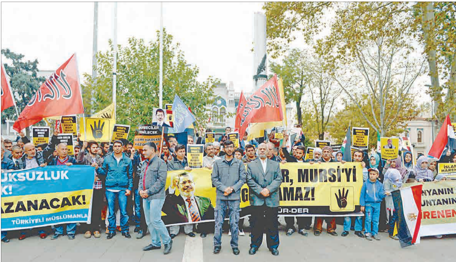
تظاهر أعضاء «جمعية حقوق التعليم والفكر الحر» التركية في مدينة إسطنبول أمس احتجاجاً على محاكمة الرئيس المعزول محمد مرسي التي تبدأ اليوم، وفي الصورة عدد من أعضاء الجمعية يرفعون شعار رابعة العدوية

«الخمسين» تحذف «المدنية» وتتجاهل المادة المفصلة للشرطة الإسلامية