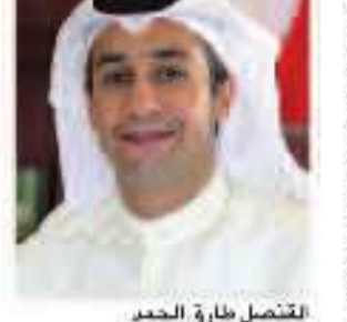
التقصل طارق الحمد

برعاية سمو الشيخ حمدان بن راشد آل مكتوم نائب حاكم دبي وزير المالية، يفتتح الشيخ محمد العبد الله المبارك الصباح وزير الدولة لشؤون مجلس الوزراء ووزير الصحة في الساعة السابعة والنصف مساءً اليوم الإثنين فعاليات الأسبوع الكويتي الثاني في دبي في فندق ال «ريتز كارلتون» بمرکز دبي المالي العالمي، بالتنسيق مع الفصيلة العامة لدولة الكويت في دبي والإمارات الشمالية، وبإدارة مجموعة الجابرية للمعارض، وبمشاركة أكثر من 50 جهة تمثل الوزارات والمؤسسات الرسمية في دولة الكويت، بالإضافة إلى مشاركة عدد من الهيئات الإعلامية الكويتية والمؤسسات الإماراتية، وتتضمن عرض مساحات الاستثمار والاقتصاد والصناعة والتعليم والإعلام والسياحة والطب من أجل تحقيق العلاقات والروابط المتميزة بين دولة الكويت ودولة الإمارات العربية المتحدة وتطويراً ودعمها لها. وصرح التقصل العام للكويت دبي في الإمارات الشمالية، طارق خالد الحمد بان هذا الحدث يضم نخبة ممتازة من الجهات الاقتصادية والثقافية والاجتماعية والعلمية، الذين يساهمون بفعاليتهم المشتركة في تعزيز أوجه التعاون والتعاون بين البلدين الشقيقين، والتي تعد امتداداً وتدعماً للعلاقات المتميزة من العقارب والتفاهم بين قيادات البلدين، وإكتمالاً لبرنامج البصيرة المشتركة للتخسيسق يدنها في كل المجالات، والتي تشهد بلا شك نمواً ونجاحاً متزايدين. وأضاف: «يعد هذا المحفل