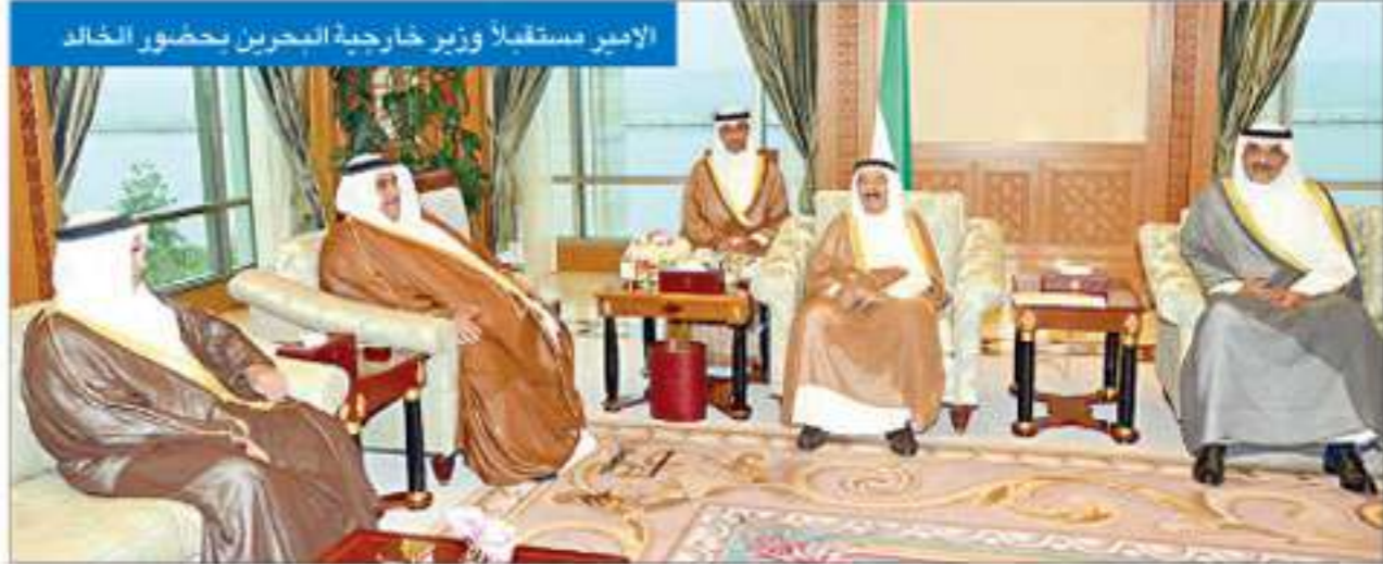
استقبل سمو أمير البلاد الشيخ صباح الأحمد بقرص السيد الشيخ نواف الأحمد. كما استقبل سموه رئيس مجلس الأمة مرزوق الغانم. واستقبل سمو أمير البلاد الشيخ صباح الأحمد بقرص السيد الشيخ نواف الأحمد. كما استقبل سموه رئيس مجلس الأمة مرزوق الغانم. واستقبل سمو أمير البلاد الشيخ صباح الأحمد بقرص السيد الشيخ نواف الأحمد. كما استقبل سموه رئيس مجلس الأمة مرزوق الغانم.