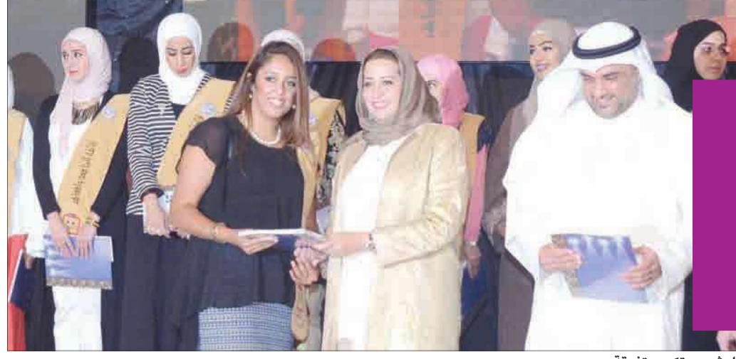
الرشدي تكرم متفوقة