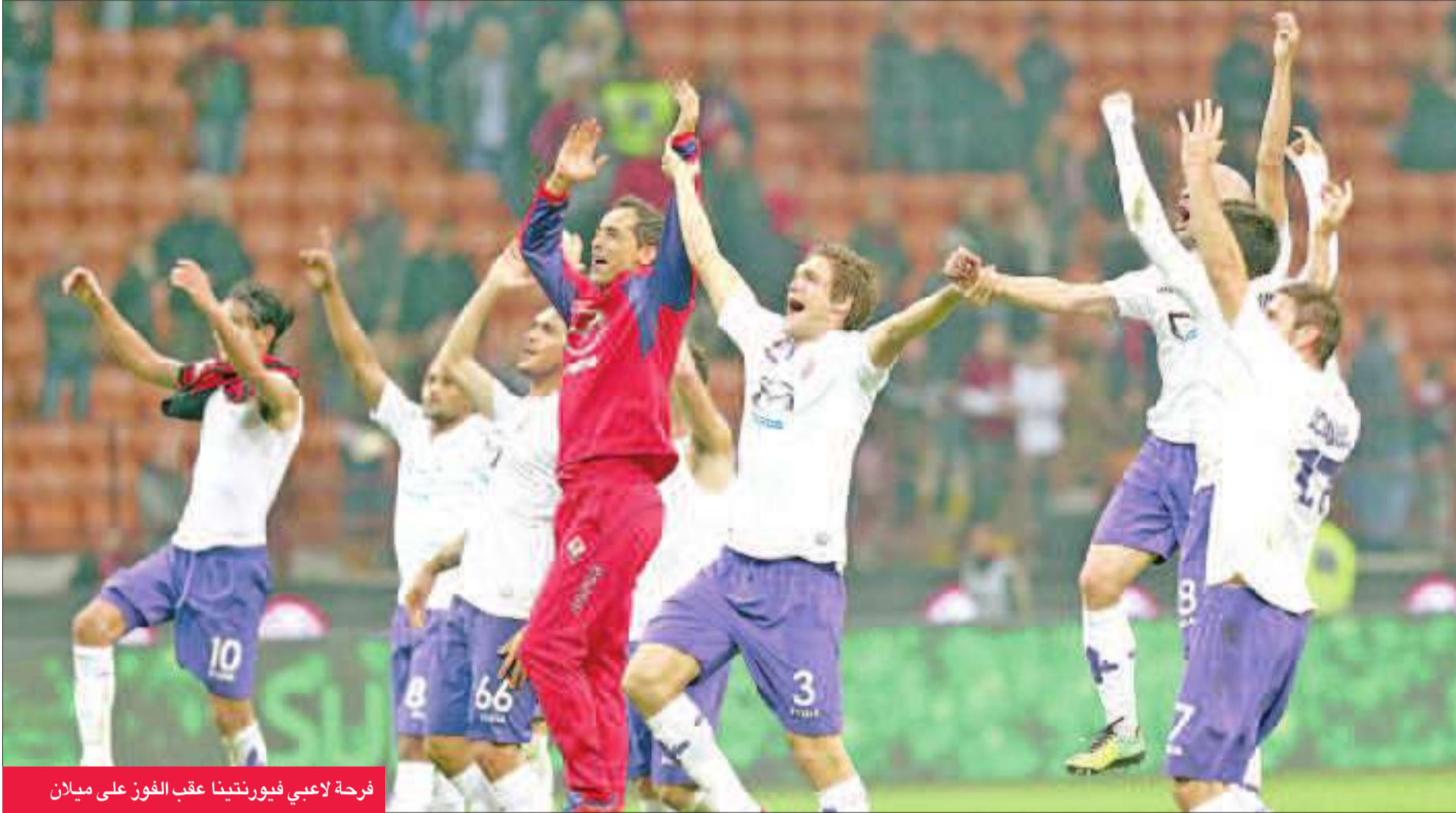
فرحة لاعبي فيورنتينا عقب الفوز على ميلان

قلص يوفنتوس حامل اللقب في آخر موسمين ونابولي الفارق مع روما المتصدر الى نقطتين بعد فوز الأول الصعب على مضيفه بارما 1- صفر في المرحلة الحادية عشرة من الدوري الإيطالي لكرة القدم أمس الأول والثاني على كاتانيا 2-1.