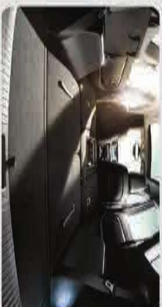
مساحات تخزين رحيبة