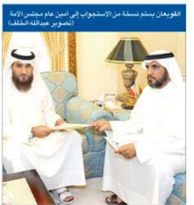
القويغان يسلم نسخة من الاستجواب إلى أمين عام مجلس الأمة

28 رياضة أحفاة كبيرة في انتظار أبطال الأبيض... والمعزفون ضحية خسارة الأصغر