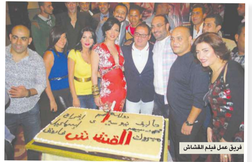
فريق عمل فيلم القشاش

أهم نقطة هي مراعاة توقيت عرضها، فمثلاً جمهور الأعياد يختلف عن جمهور أي موسم آخر؛ فالأول يريد مشاهدة فيلم قصته مختلفة، ويستمتع إلى أغنية تخرجه من الحالة النفسية التي يتخبط فيها