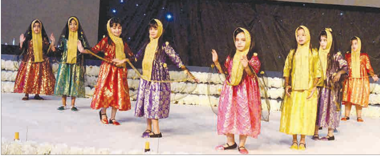
فقرة من الحفل