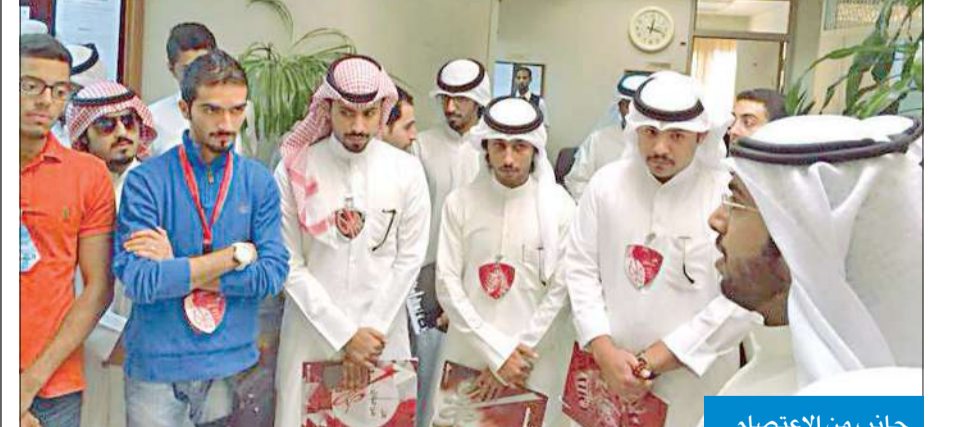
جانب من الاعتصام

نظم مجموعة من طلبة كلية العلوم في جامعة الكويت امس اعتصاماً امام قسم الرياضيات في كلية العلوم، احتجاجاً على سياسة التعسف التي يتخذها القسم في حق الطلبة، ومن أجل وضع حد لها وإنصافهم، خاصة أن هناك نسبة رسوب كبيرة بين الطلبة في مقر الرياضيات. ومن جانبه، كشف المدير التنفيذي في الاتحاد الوطني لطلبة جامعة الكويت إبراهيم العبدلي أن الاتحاد لن يتوانى في الدفاع عن مصلحة الطلبة، وسيقف معهم من أجل إنصافهم، وإيقاف سياسة التعسف في اقسام كلية العلوم، ولاسيما أن هناك الكثير من الشكاوى من ارتفاع نسبة الرسوب بين الطلبة. وذكر العبدلي أن مشاركة الاتحاد في الاعتصام هي للدفاع عن حقوق الطلبة والمطالبة بمكتسباتهم، واليوم هي نقطة انطلاق لحل مشاكل طلبة العلوم.