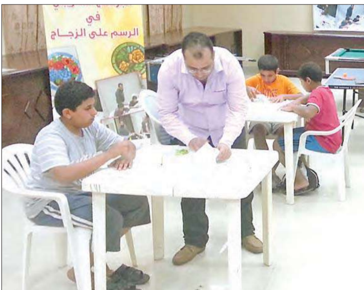
جانب من ورشة الرسم على الزجاج

نظمت إدارة مراكز الشباب لأعضائها برنامج الرسم على الزجاج، وذلك ضمن برنامجها الزمني بمشاركة مراكز شباب القادسية والدعية والقصور والشامية. ووجد البرنامج إقبالاً من الشباب المشاركين، إذ تم تدريبهم تحت إشراف موجهي النشاط الفني بإدارة مراكز الشباب.