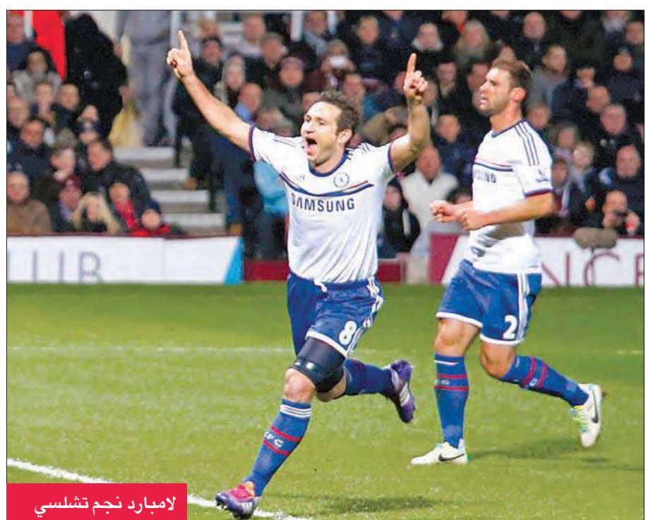
لامبارد نجم تشلسي

يحل تشلسي الإنجليزي ضيفاً على بازل السويسري، بينما يواجه برشلونة الإسباني مضيفه أياكس أمستردام الهولندي، في الجولة الأخيرة من دور المجموعات لمسابقة دوري أبطال أوروبا.