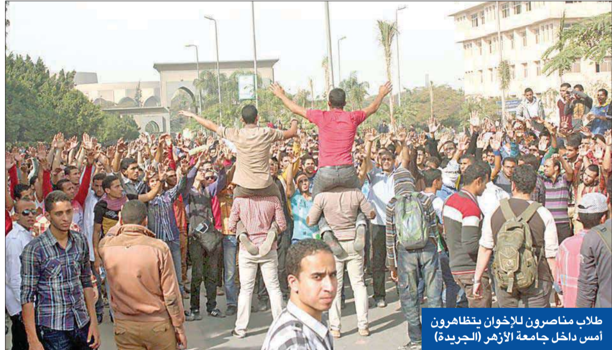
طلاب مناصرون للإخوان يتظاهرون أمس داخل جامعة الأزهر

توسعت موجة الغضب من قانون «التظاهر» الذي بدأ سريانه فعلياً في مصر منذ نشره في الجريدة الرسمية أمس، في حين تقرر التصويت النهائي علنياً على مواد الدستور السبت المقبل، بينما واصل الإرهاب عملياته باستهداف كمين أمني قرب قصر «القبة» الرئاسي.