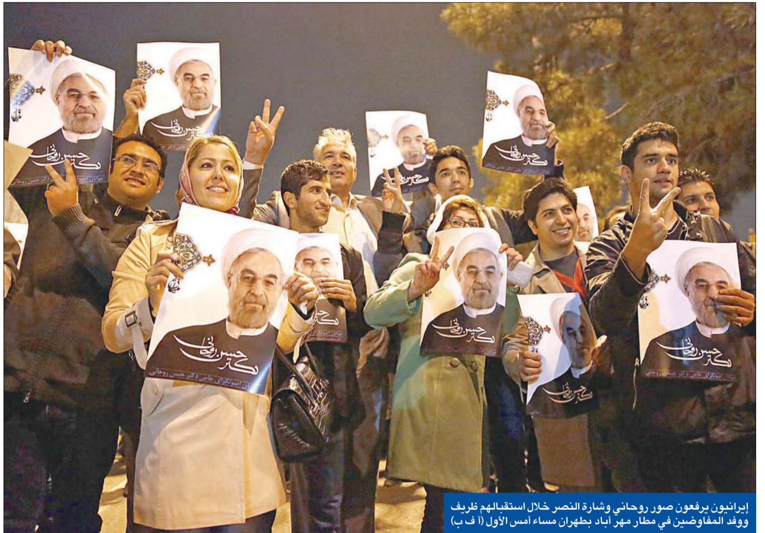
إيرانيون يرفعون صور روحاني وشارة النصر خلال استقبالهم ظريف ووفد المفاوضين في مطار مهر اباد بطهران مساء أمس الأول

الخارجية الفرنسية لوران فاييوس أمس أن الاتحاد الأوروبي سنبدا تخفيف العقوبات التي يفرضها على إيران في ديسمبر، مؤكداً أن الاتفاق سيمنع طهران من أن تتصرف كما تريد في مجال تخصيب اليورانيوم. وقال فاييوس، لإذاعة «أوروبا 1»، إن رفع العقوبات سيكون محدوداً وديققاً وقابلًا للتراجع، وسيكون الأمر كذلك في الجانب الأمريكي، بدون أن يكشف المجالات التي سيشملها، مبيئاً أنه من المقرر عقد اجتماع في الاتحاد الأوروبي على مستوى وزراء الخارجية خلال الأسابيع القليلة المقبلة لدراسة التفاصيل. وبشأن الإمكانية التي منحت لإيران لتخصيب اليورانيوم بينما تدعو كل قرارات الأمم المتحدة منذ عشر سنوات إيران إلى تعليق هذه العملية، أكد فاييوس أنه في المستقبل سيكون ذلك في إطار محدد خاضع لمراقبة شديدة. وأضاف أن «ما هو مضمون في كلا الطرفين هو برنامج للتخصيب وهذا لا ينطبق على حق في التخصيب، في عبارات متفق عليها. هذا يعني أن إيران لا يمكن أن تتصرف كما تريد وهناك حدود معينة».