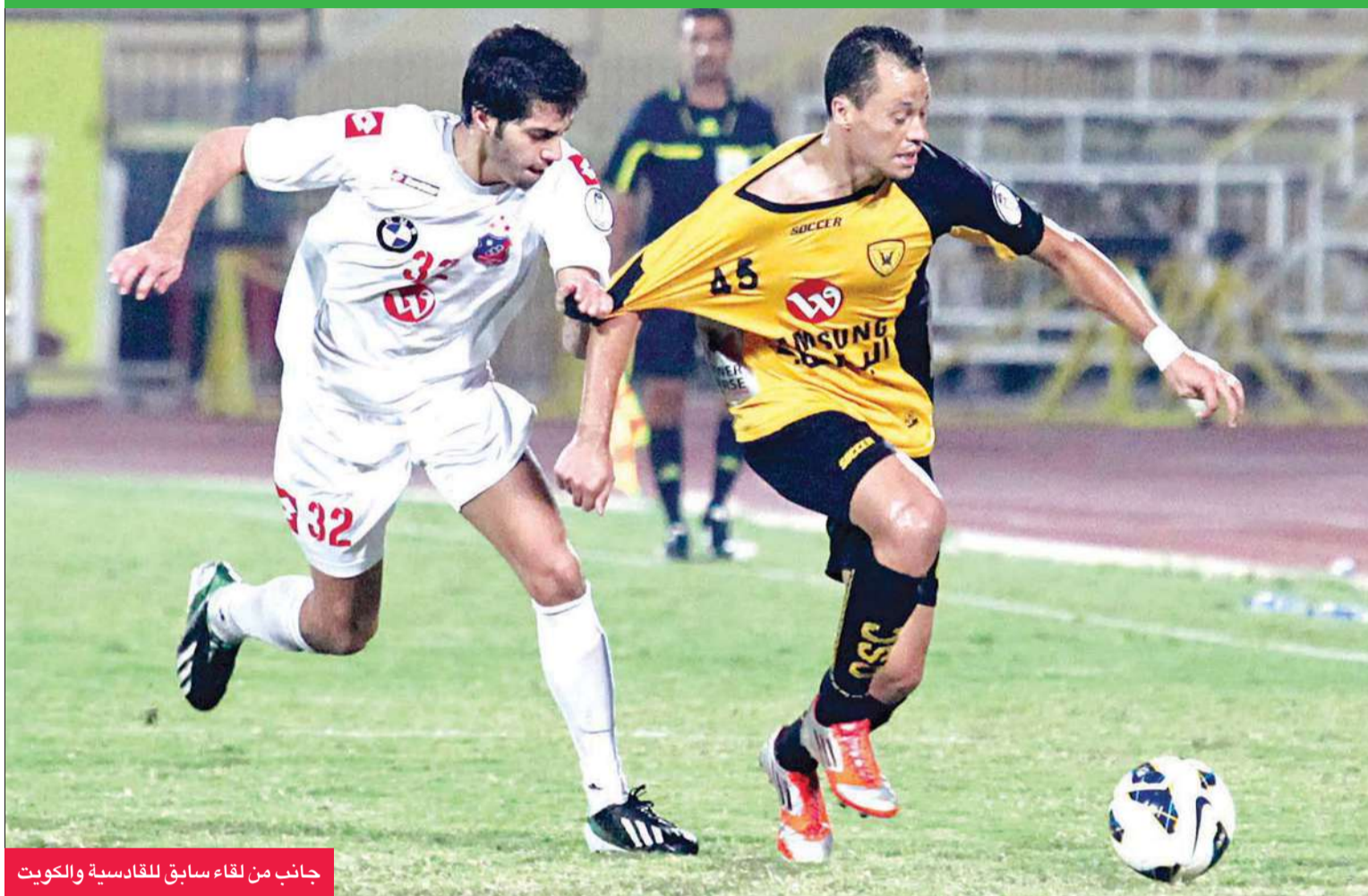
جانب من لقاء سابق للقادسية والكويت