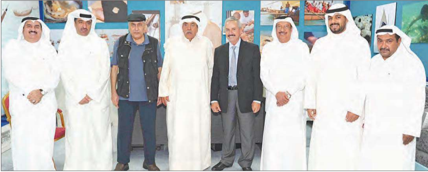
عليان وأعضاء إدارة "البحري" والحضور في صورة جماعية