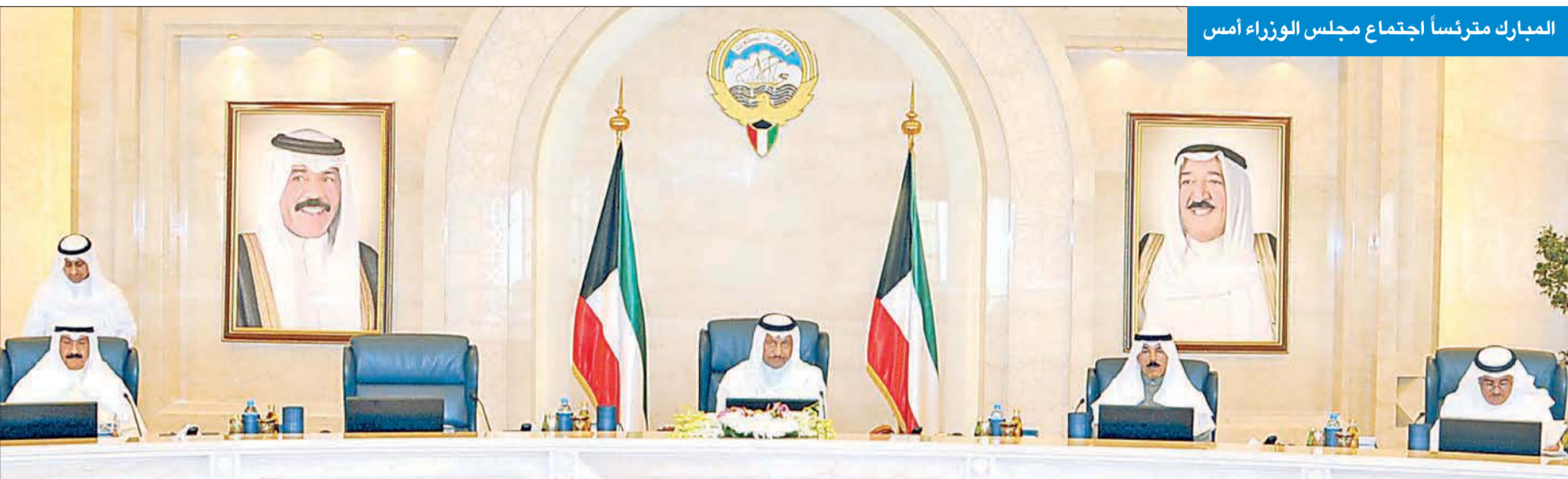
المبارك مترئساً اجتماع مجلس الوزراء أمس

أقر مجلس الوزراء في اجتماع أمس مشروع قانون بإصدار الخطة السنوية لعام 2013/2014. في وقت أكد أن للوزير المستجوب الحق في كيفية التعامل مع الاستجواب الموجه إليه، أملاً أن تكون الممارسة البرلمانية بخصوص الاستجابات المقدمة متفقة مع الإجراءات البرلمانية الصحيحة.