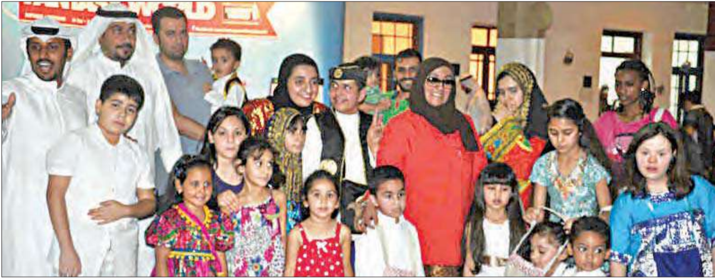
جانب من إحدى الحفلات التي أقيمت في بيت لودان

استكمل بيت لودان استعداداته لبدء مجموعة من الفعاليات والأنشطة الثقافية والتراثية والفنية والاجتماعية لموسم 2014، والتي تتناسب مع أهدافه التي تعزز العلاقات الإنسانية. وفي هذا الصدد تقدمت الشبيخة فرح فواز الصباح أمين عام بيت لودان بالشكر لراعي فعاليات لودان وأنشطته، شركة المركز المالي.