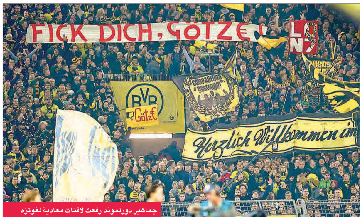
جماهير دورتموند رفعت لافتات معادية لغوتزه

لقد لعبنا بصورة جيدة جداً ك فريق". وتحدث غوتزه عن زيارته لملائه السابقين في دورتموند في غرفة خلع الملابس عقب نهاية المباراة، مضيفاً: "بالتأكيد اللاعبون كانوا محبطين، جميعهم أصدقاء مقربون لي، لقد لعبت معهم لفترة طويلة".