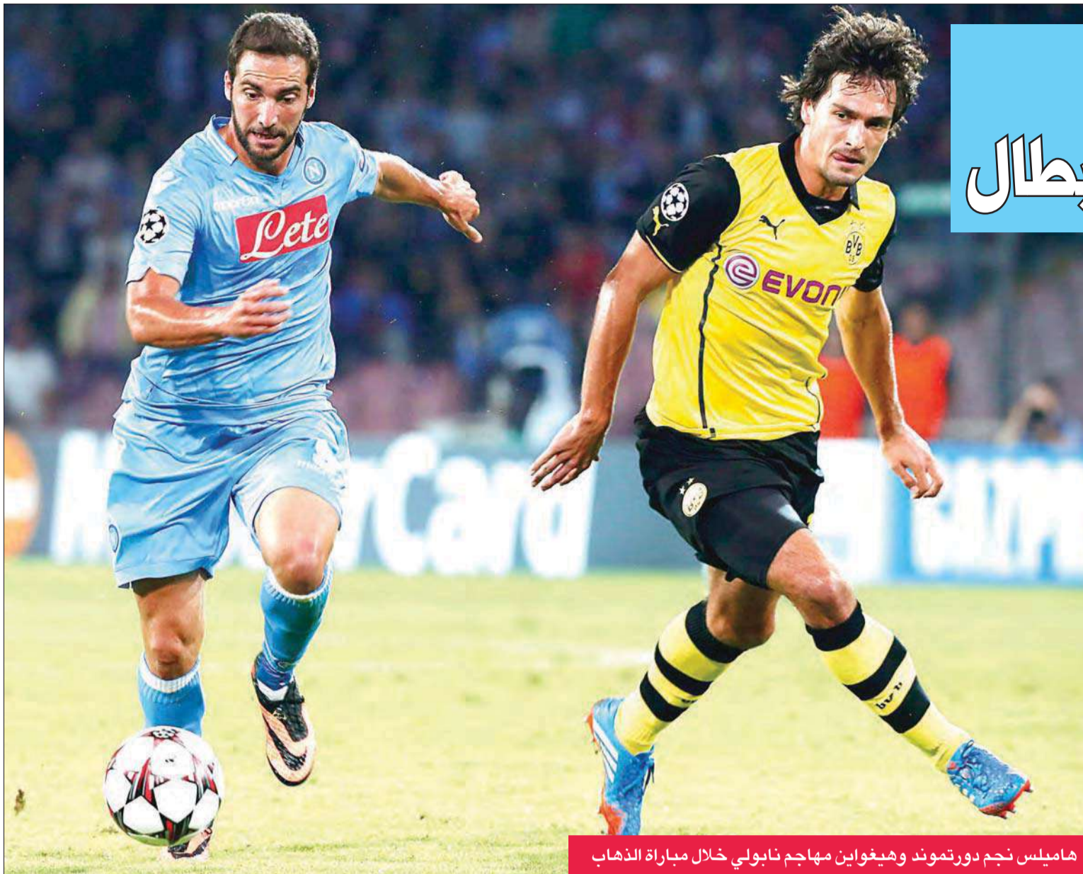
هاميلس نجم دورتموند وهيغواين مهاجم نابولي خلال مباراة الذهاب

تجه الأنظار إلى القمة المرتقبة بين بوروسيا دورتموند الألماني وضيغه نابولي الإيطالي، ضمن منافسات المجموعة السادسة في مسابقة دوري أبطال أوروبا لكرة القدم.