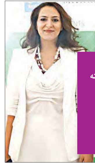
الشبيخة فرح فواز الصباح

استكمل بيت لودان استعداداته لبدء مجموعة من الفعاليات والأنشطة الثقافية والتراثية والفنية والاجتماعية لموسم 2014، والتي تتناسب مع أهدافه التي تعزز العلاقات الإنسانية. وفي هذا الصدد تقدمت الشبيخة فرح فواز الصباح أمين عام بيت لودان بالشكر لراعي فعاليات لودان وأنشطته، شركة المركز المالي.