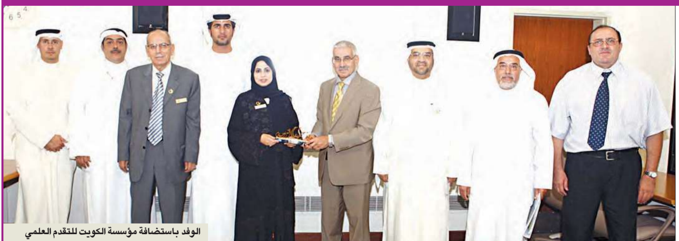
الوفد باستضافة مؤسسة الكويت للتقدم العلمي

استضافت مؤسسة الكويت للتقدم العلمي وفداً من جائزة خليفة التربوية في مقر المؤسسة الرئيسي، وتم تبادل الآراء حول الجائزة، وجوائز مؤسسة الكويت للتقدم العلمي، كجائزة الكويت، وجائزة الإنتاج العلمي.