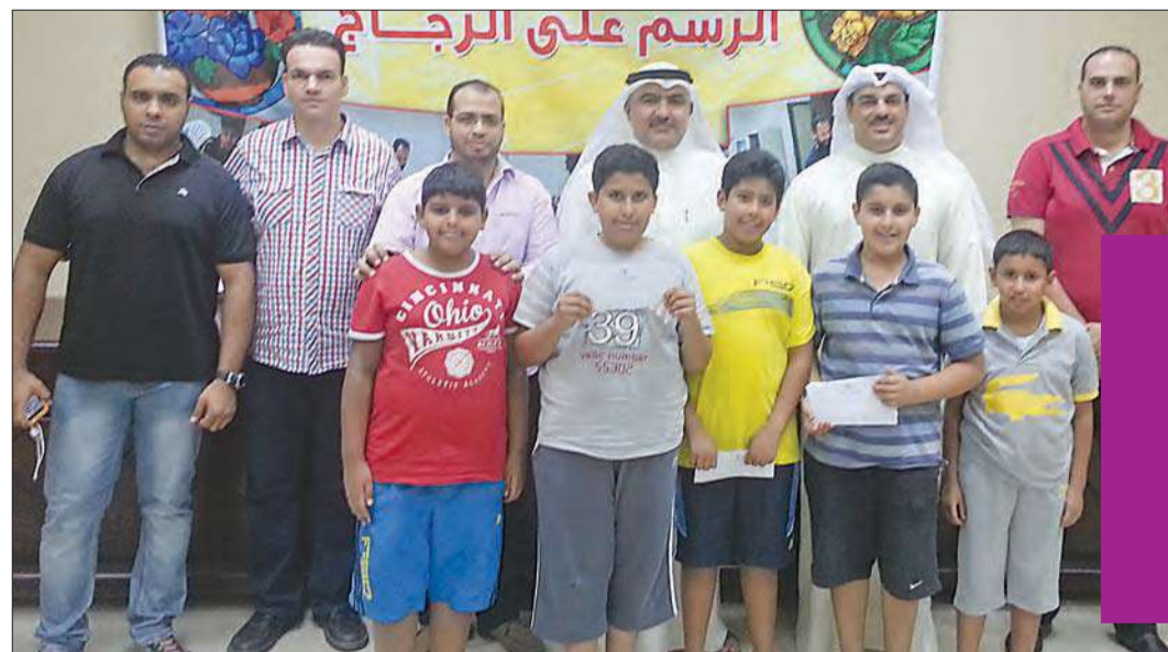
موجهو النشاط الفني والمشاركون

نظمت إدارة مراكز الشباب لأعضائها برنامج الرسم على الزجاج، وذلك ضمن برنامجها الزمني بمشاركة مراكز شباب القادسية والدعية والقصور والشامية. ووجد البرنامج إقبالاً من الشباب المشاركين، إذ تم تدريبهم تحت إشراف موجهي النشاط الفني بإدارة مراكز الشباب.