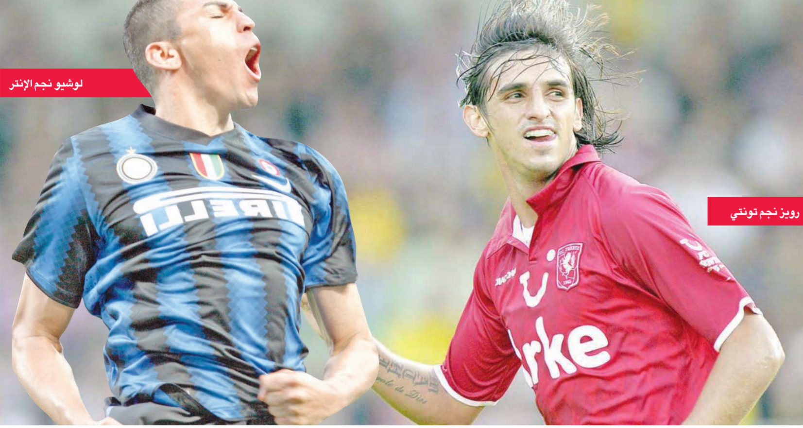
لوشيو نجم الإنتر

وفي المجموعة الثانية، يستضيف ليون الفرنسي الذي بلغ نصف نهائي النسخة الأخيرة شالكة الألماني، بينما يلعب بنفيكا البرتغالي مع هابويل تل أبيب الإسرائيلي (أ ف ب)