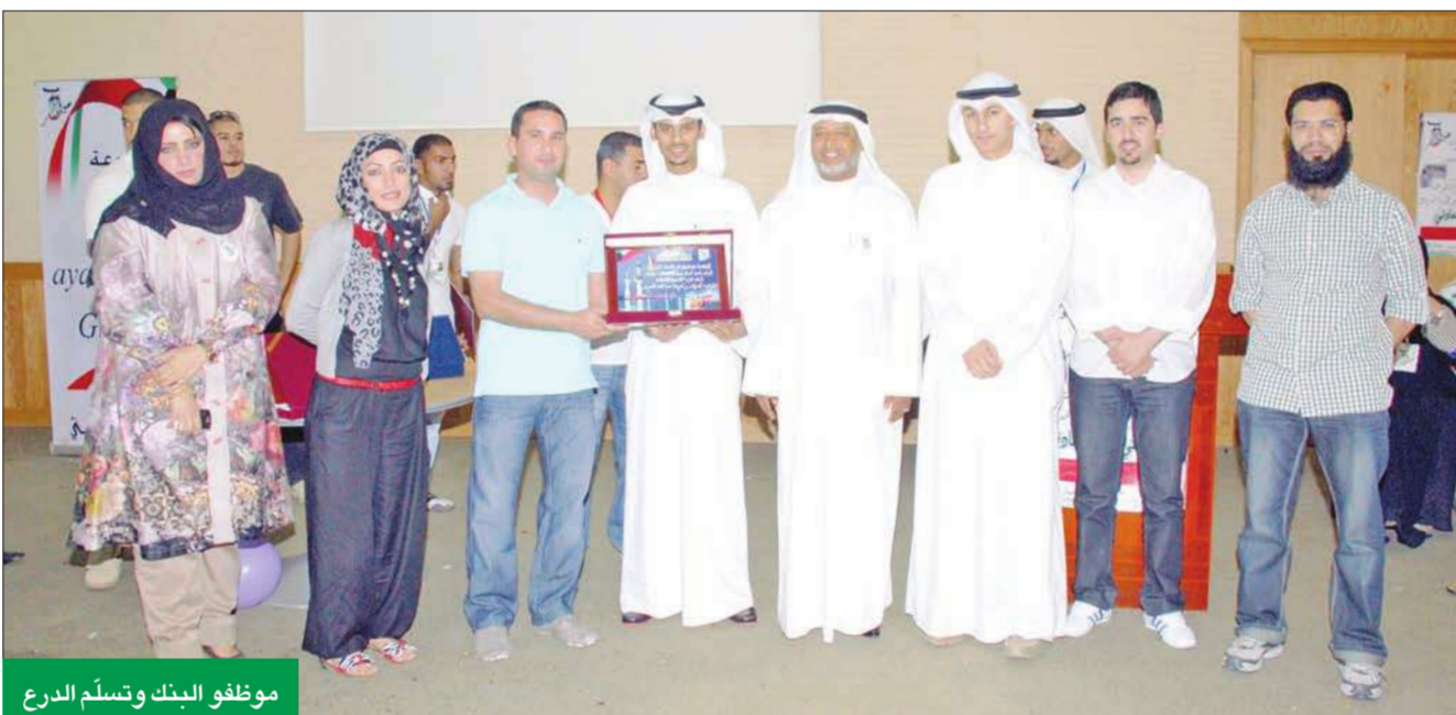
موظفو البنك وتسلم الدرغ

الأطفال، بل يقضي موظفو العلاقات العامة في البنك وعدد من الموظفين المتطوعين بعض الوقت مع الأطفال، إذ يتم وضع برنامج ترفيهي كامل يشارك فيه المتطوعون والموظفون جميع الأطفال في العديد من الأنشطة والمسابقات.