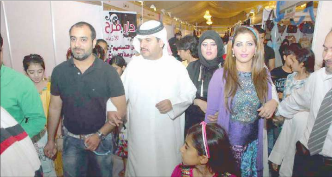
جولة في المعرض