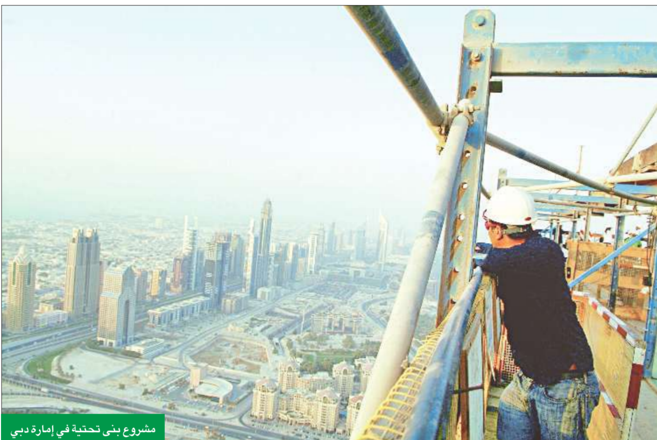
مشروع بني تحتية في إمارة دبي

«ديوان» بين أفضل ثلاث شركات للهندسة المعمارية في الخليج