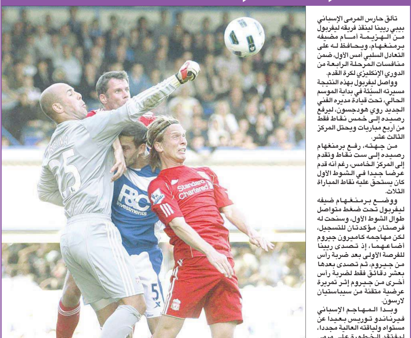
ريينا حارس مرمى ليفربول يتصدى لإحدى محاولات برمنغهام

تألق حارس المرمى الإسباني بيبي ريينا لينقذ فريقه ليفربول من الهزيمة أمام مضيفه برمنغهام، ويحافظ له على مناصفة المرحلة الرابعة من الدوري الإنكليزي لكرة القدم. وواصل ليفربول بهذه النتيجة مسيرته السيئة في بداية الموسم الحالي، تحت قيادة مديره الفني الجديد روي هودجسون، ليرفع رصيده إلى خمس نقاط فقط من أربع مباريات ويحتل المركز الثالث عشر.