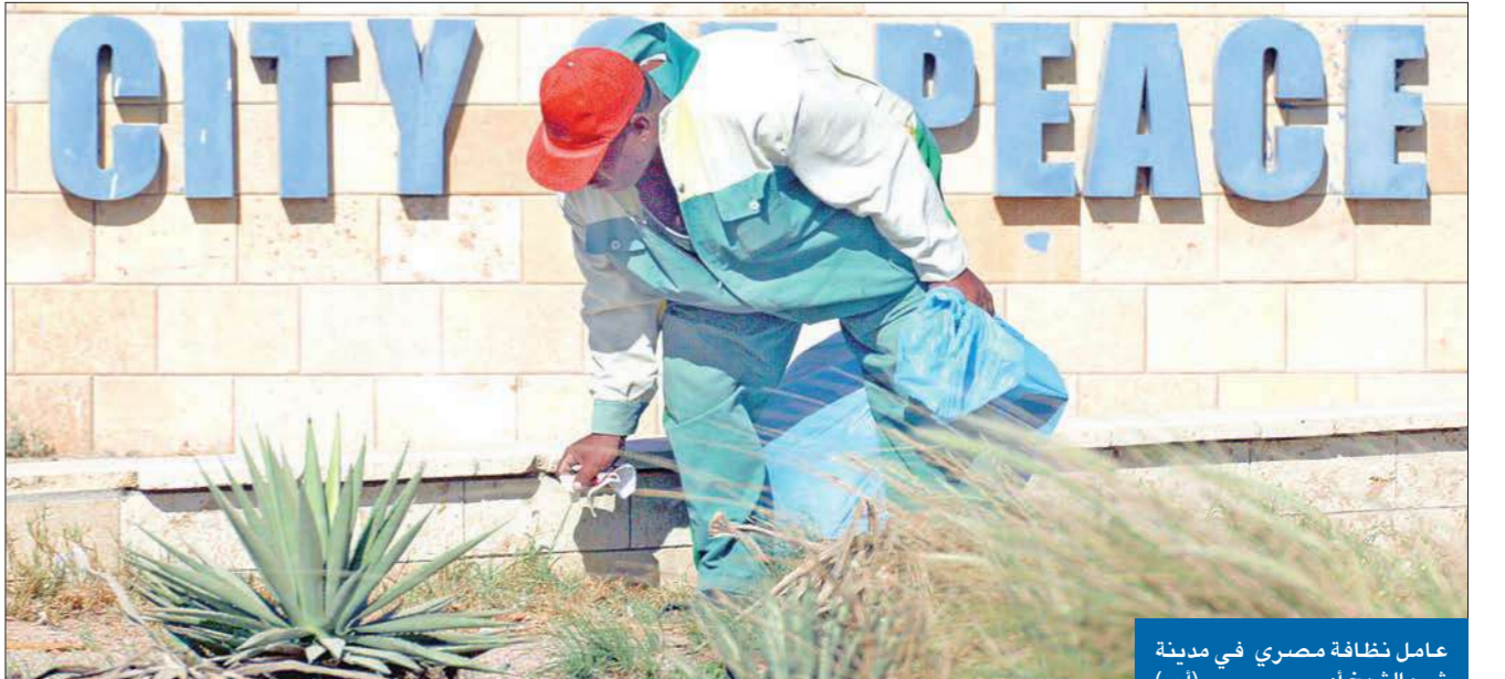
عامل نظافة مصري في مدينة شرم الشيخ أمس

كشفت مصادر سياسية مطلعة لـ «الجريدة» أمس، أن رئيس الحكومة الإسرائيلية بنيامين نتنياهو أوصل رسالة إلى الرئيس السوري بشار الأسد، عبر وسيط أميركي خلال الأيام الماضية، أبلغه فيها أنه في الإمكان التوصل إلى اتفاق إطاري خلال عام، حيث يوقع الطرفان على اتفاق سلام يجهد هضبة الجولان إلى سورية على