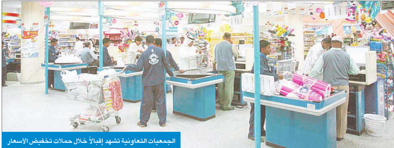
الجمعيات التعاونية تشهد إقبالاً خلال حملات تخفيض الأسعار

المستقبلية مثل افتتاح فرع غاز جديد وسوق للخضار، إضافة إلى إعادة تنظيم السوق المركزي لتوفير منطقة عرض كافية للمتسوقين، مشيراً إلى أنه سيتم استحداث أنشطة جديدة مثل فرع المأكولات الخفيفة وفرع السفريات، مؤكداً أن مجلس الإدارة لا يبالو جهداً في تقديم أفضل الخدمات لأهالي المنطقة.