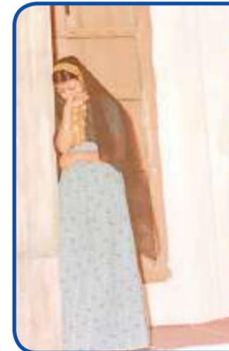
من مسرحية «نورة»