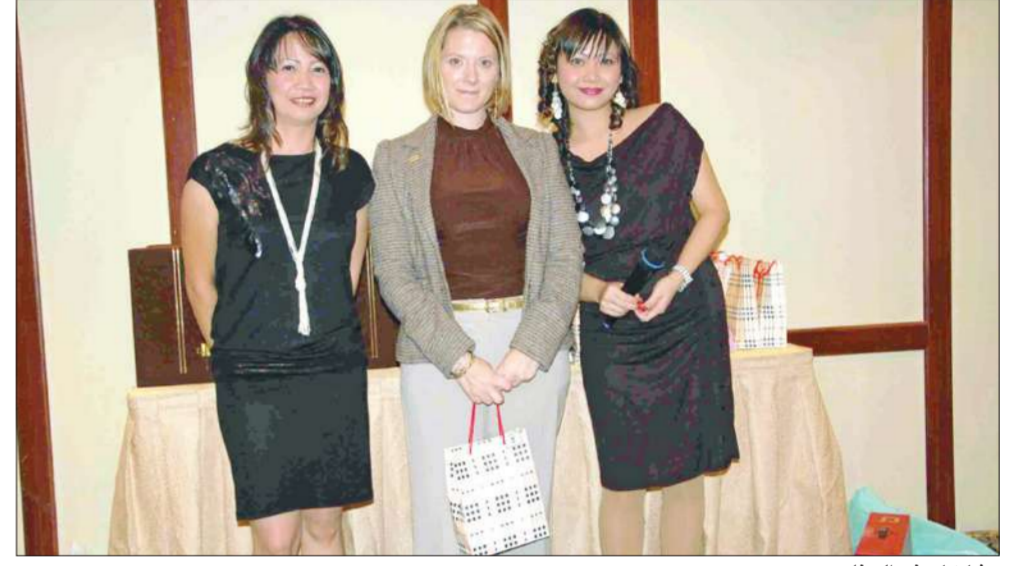
مشاركات في الحفل