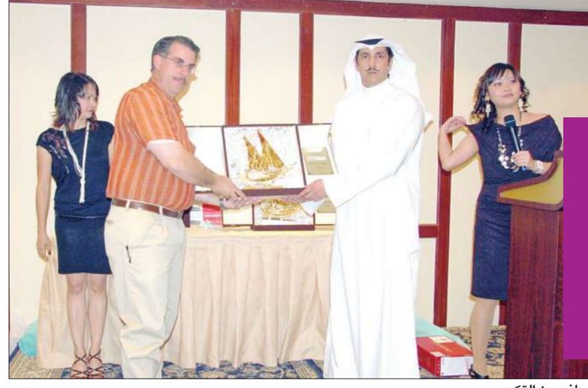
جانب من التكرم

المناسبة حفلة عشاء المكان فندق سويس بل بلازا