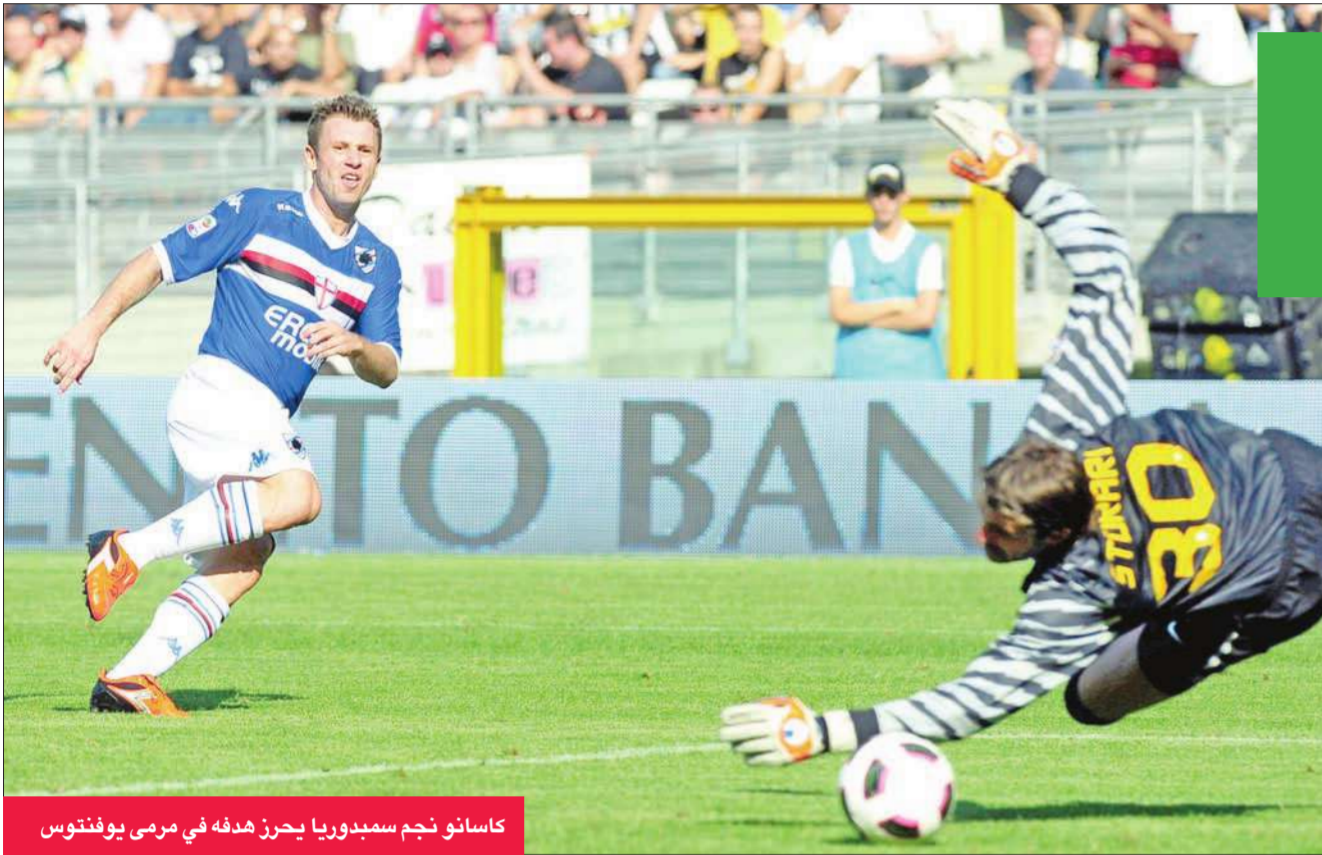
كاسانو نجم سمبدوريا يحرز هدفة في مرمي يوفنتوس

شركة فؤاد الغانم وأولاده للسيارات تدم 1811118 - www.faa.com.kw