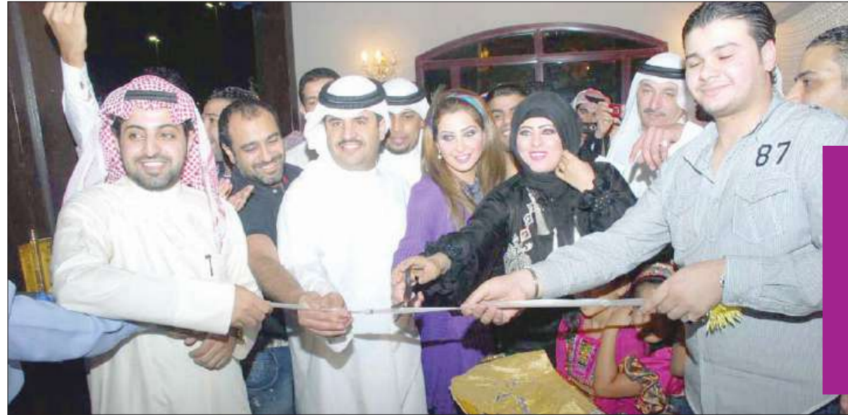
قص شريط الافتتاح

المناسبة افتتاح معرض ومهرجان «سما الأول» المكان فندق ومنتجع سليل الجهراء