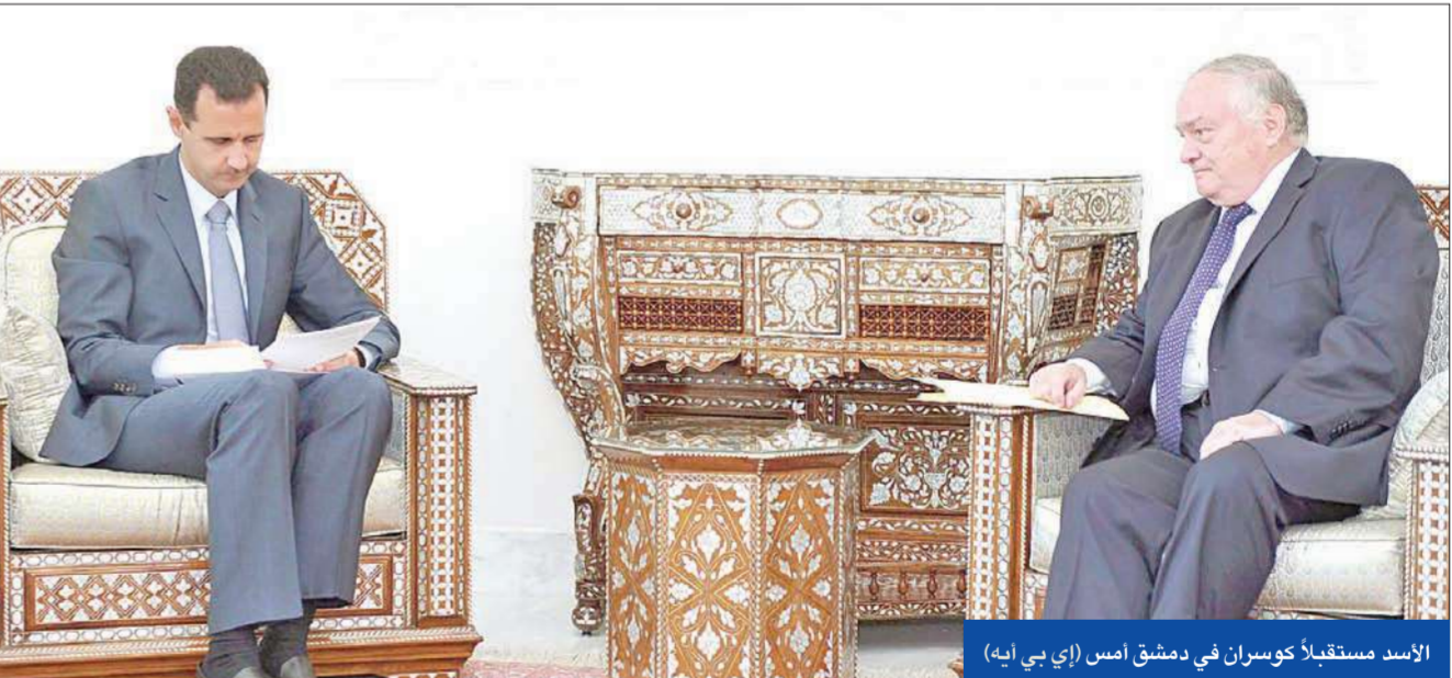
الأسد مستقبلاً كوسران في دمشق أمس

تسلم الرئيس السوري بشار الأسد أمس، رسالة خطية من نظيره الفرنسي نيكولا ساركوزي تتعلق بالعلاقات الثنائية بين البلدين وعملية السلام في المنطقة وإمكان استئناف المفاوضات السورية-