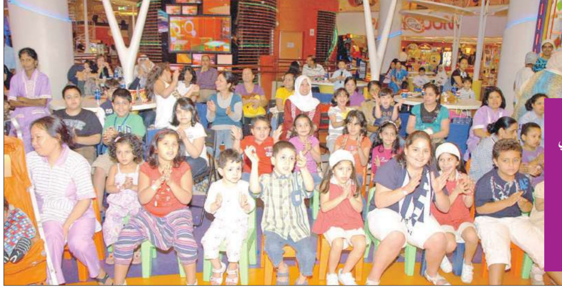
اطفال مشاركون في الحفل

المناسبة مركز إنفاثي العائلي الترفيهي احتفل بيوم الطفل