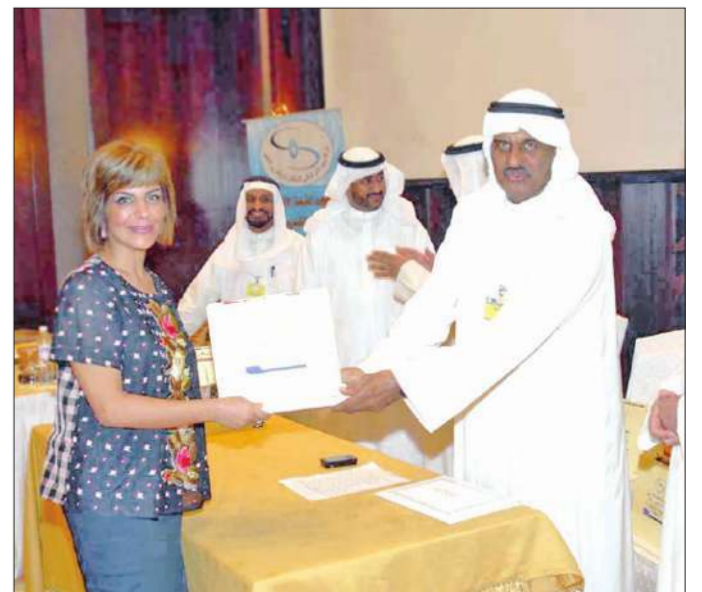
جانب من التكريم