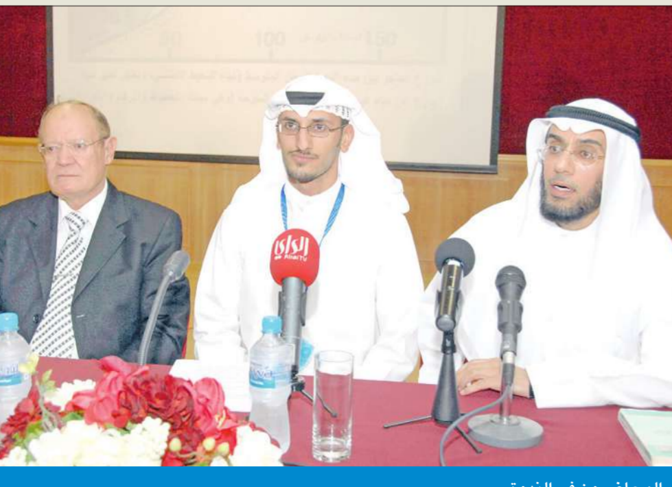
المحاضرون في الندوة

وأكد الدمرداش أن هناك أدلة على وجود الخالق وفق اعتبارات الماديين من علماء الفيزياء، منها أن هذا الوجود لا يتوقف على سبب وان الأدنى لا يخلق الأرقى.