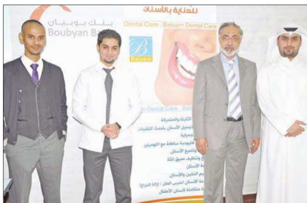
موظفو «بوبيان» في حملة بلسم

من الحملات الصحية الأخرى التي سيتم من خلالها الأطمئنان على صحة ولبانة موظفي البنك وتبنيهم مبكراً، لاتخاذ الاحتياطات اللازمة لمواجهة أي أمراض متوقعة.