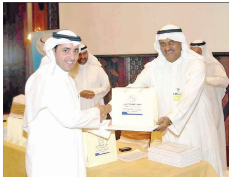
... وتكريم آخر