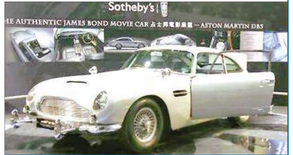
سيارة أستون مارتين (دي بي 5) الأصلية التي قادها شون كورني أثناء تجسيده شخصية عميل سري بريطاني في فيلمي 'الأصبع الذهبية' و'كرة العاصفة'

اشترى رجل أعمال أميركي سيارة جيمس بوند - وهي من طراز أستون مارتين (دي بي 5) - 1964 مقابل 2.9 مليون جنيه استرليني (4.59 ملايين دولار أميركي) في مزاد أقيم في لندن