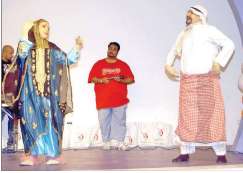
فكرة من الحفل