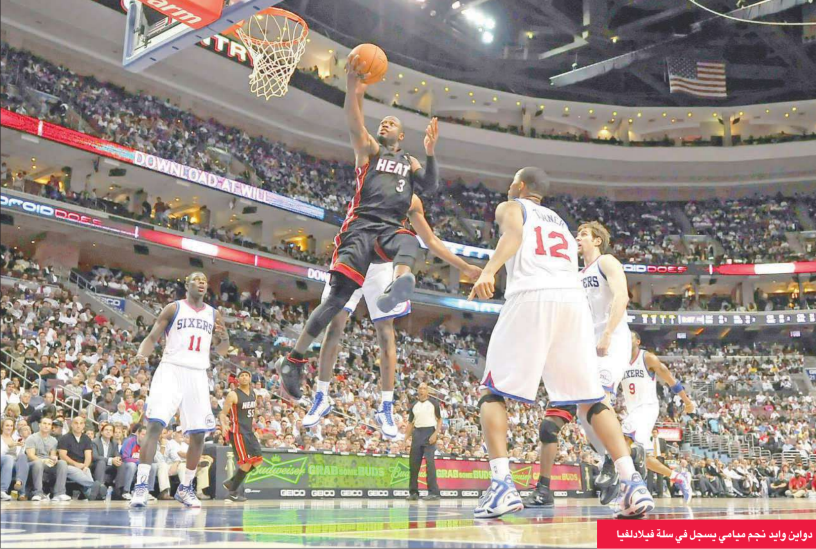
دواين وايد نجم ميامي يسجل في سلة فيلادلفيا

تمكن ميامي هيت من تحقيق الفوز على مضيفه فيلادلفيا سفنتي سيكسرز 87-97 في مسابقة دوري كرة السلة الأميركي للمحترفين.