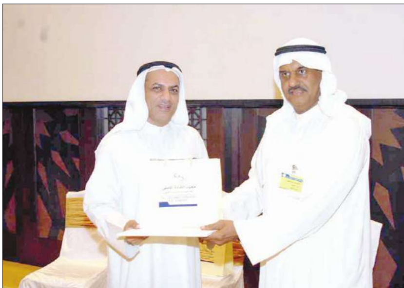
مشارك في الندوة يتم تكريمه

أقام معهد القادة الأمني للدراسات والتدريب الأهلي ندوة عملية عن كيفية مواجهة العنف في المجتمع، إذ أعد بعض البرامج الأمنية والمدنية لبعض وزارات ومؤسسات وهيئات الدولة، وذلك من أجل مساندة ودعم المشاركين في الندوة وزيادة الوعي لديهم وتدريبهم على الأساليب الأمنية لمواجهة المواقف المهنية المختلفة والقدرة على السيطرة والتحكم في حالات الطوارئ والأزمات الأمنية.