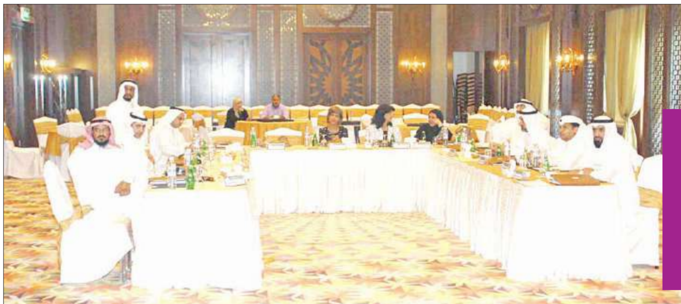
المشاركون في صورة تذكارية

المناسبة ندوة عملية المكان معهد القادة الأمني للدراسات والتدريب الأهلي