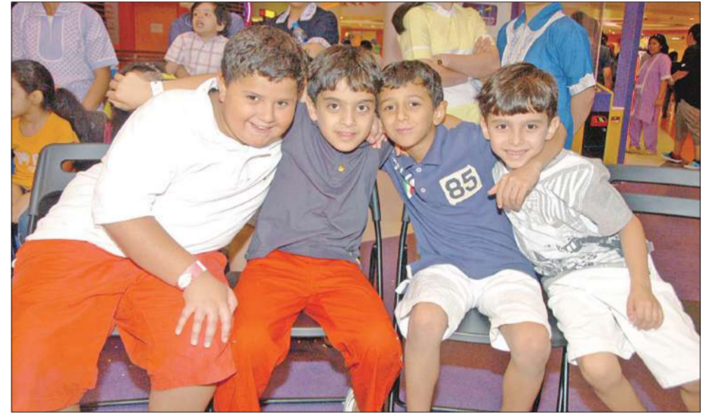
عدد من الاطفال المشاركين