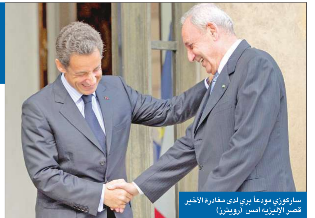
ساركوزي مودعا بري لدى مغادرة الأخير قصر الإليزيه أمس

وباتت تتطلب منا جميعاً موقفاً مختلفاً، أنا في الحقيقة لم أكن أود أن أتحدث اليوم لولا أنني شاهدت بالأمس ردود الفعل المحملة والخارجية على أعلى المستويات، واليوم المزيد منها، سواء من المذعي العام الدولي (دانيال بلمار) أو رئيس المحكمة الدولية (أطونيو كاسيزي) أو جهات دولية معبنة وصولاً إلى وزارة الخارجية الأميركية التي أدانت بحسب تعبيرها بأشدّ تعابير الإدانة ما حصل في الضاحية الجنوبية، في إشارة إلى هجوم عشرات النساء على 02