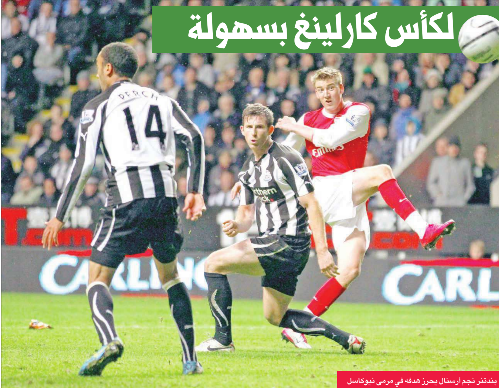
بندنتنر نجم أرسنال يحرز هدفه في مرمرى نيوكاسل