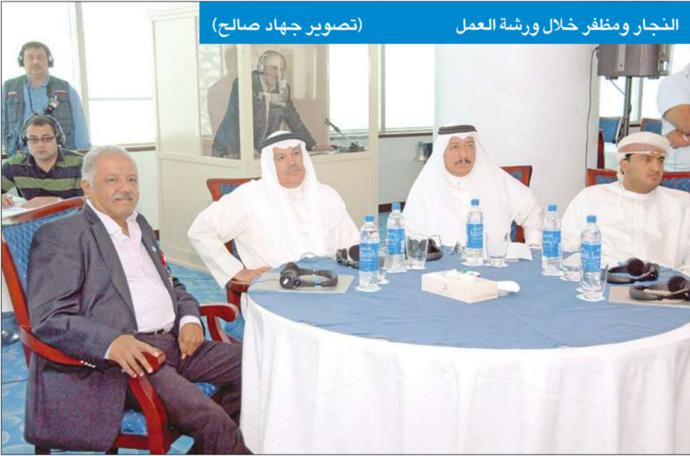
النجار ومظفر خلال ورشة العمل