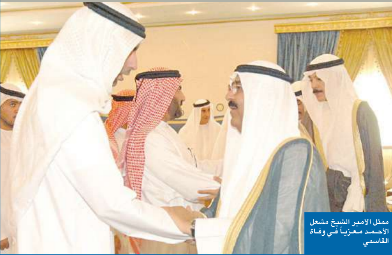
ممثل الأمير الشيخ مشعل الأحمد معزياً في وفاة القاسمي