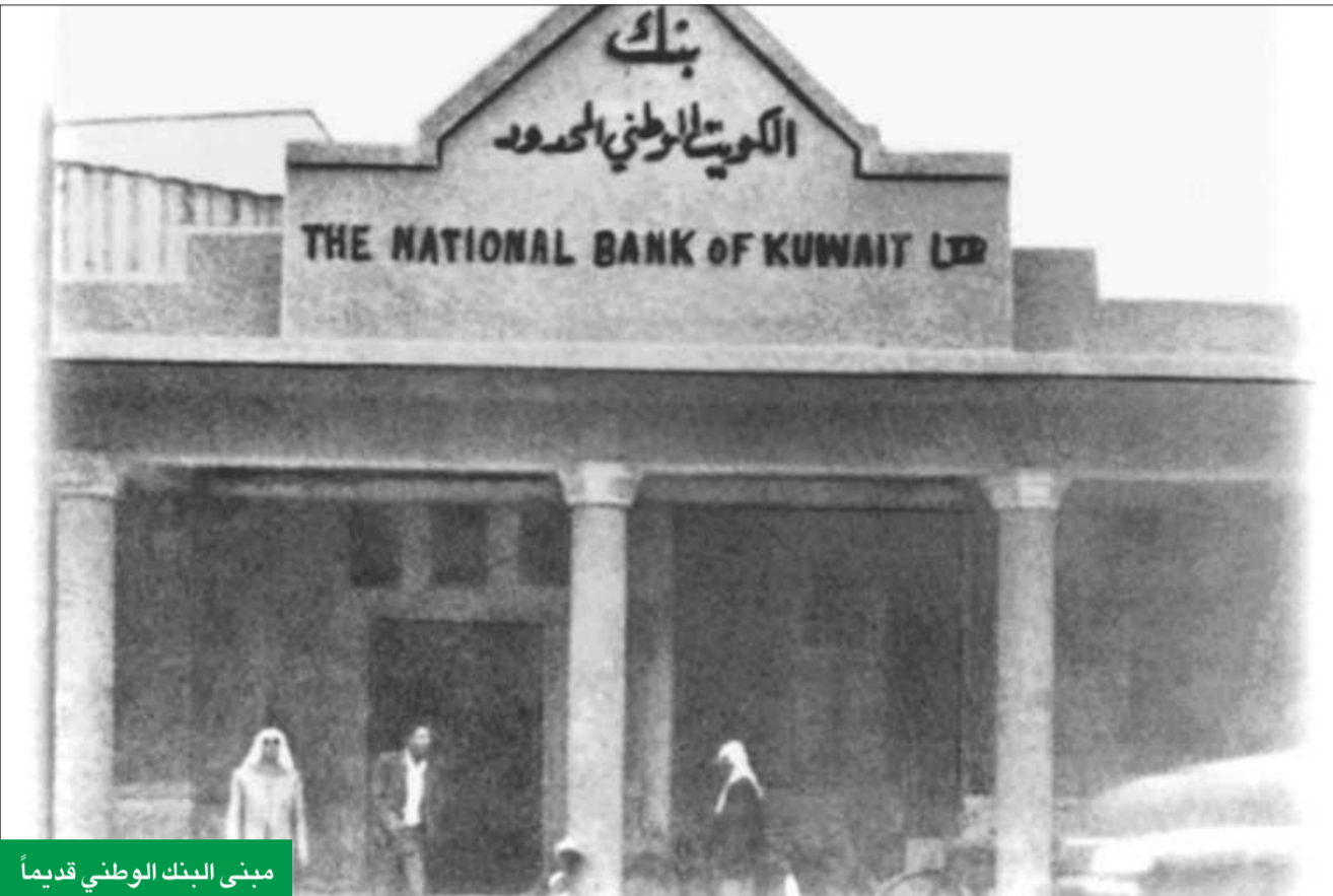
مبنى البنك الوطني قديماً