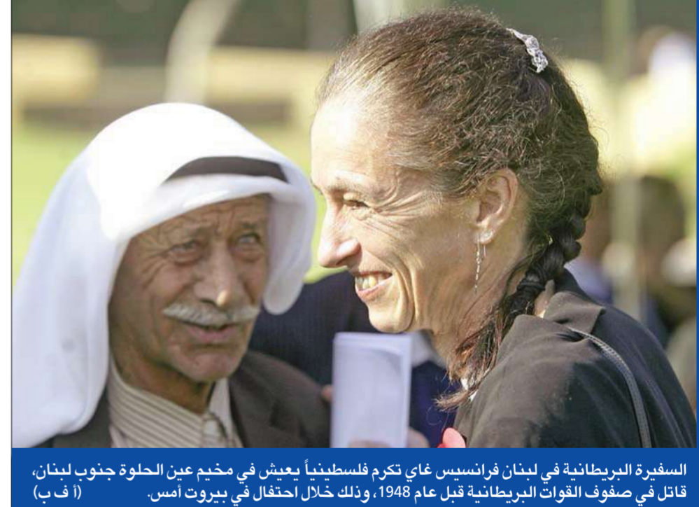
السفيرة البريطانية في لبنان فرانسيس غاي تكرم فلسطينياً يعيش في مخيم عن الحلوة جنوب لبنان، قاتل في صفوف القوات البريطانية قبل عام 1948، وذلك خلال احتفال في بيروت أمس.

السعودي بيد اللبنانيين، مشيراً إلى وجود لاعبين على الساحة يحاولون زرع أوام خاطئة برأس اللبنانيين، معتبراً أن هناك فرقاً بين القرار الظني، والقرار الاتهامي، وأوضح أن المدعي العام الدولي يمكن أن يملأ بقرار ظني، لبنان باتهامات تؤثر على أمنه واستقراره، أما القرار الاتهامي فيكون مبنياً على أدلة موثقة.