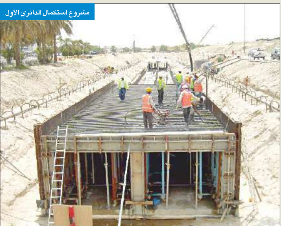
مشروع استكمال الدائري الأول

الأمطار، مشيرة إلى أن الخطة الجديدة لـ"الأشغال" تتضمن إنشاء سدود اسفلتية وغرف تصريف كبيرة للتغلب على مشكلة الأمطار والسيول. وأشارت المصادر إلى أن وزير الأشغال العامة وزير البلدية فاضل صفر سيقدّم تقريرا متكاملًا عن استعدادات وزارته لموسم الشتاء والمطر الصاعد من أجل حماية البلاد من أخطار السيول.