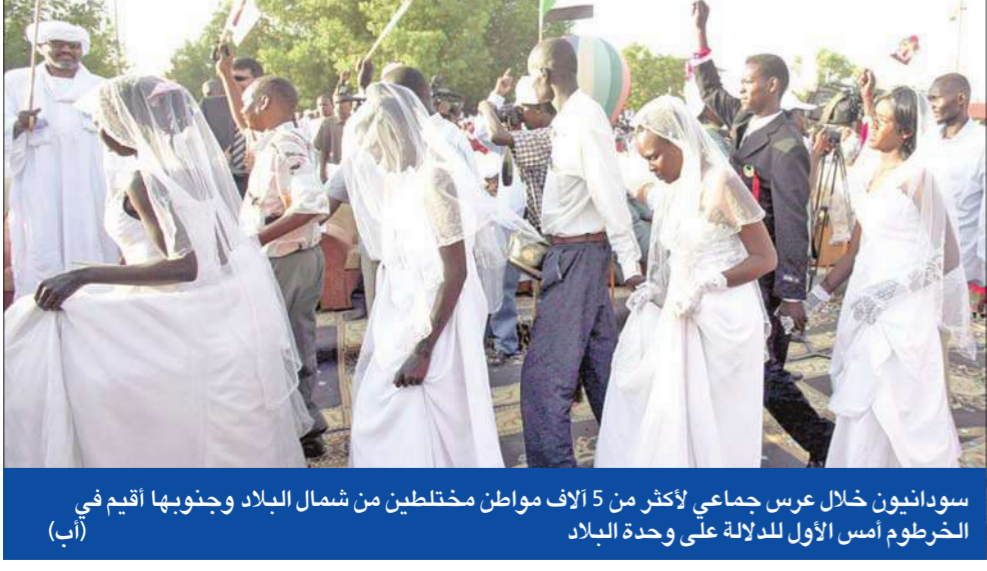
سودانيون خلال عرس جماعي لأكثر من 5 آلاف مواطن مختلطين من شمال البلاد وجنوبها أقيم في الخرطوم أمس الأول للدلالة على وحدة البلاد

البشير يتحدى «المذكرتين» مجدداً ويؤيد مناسك الحج