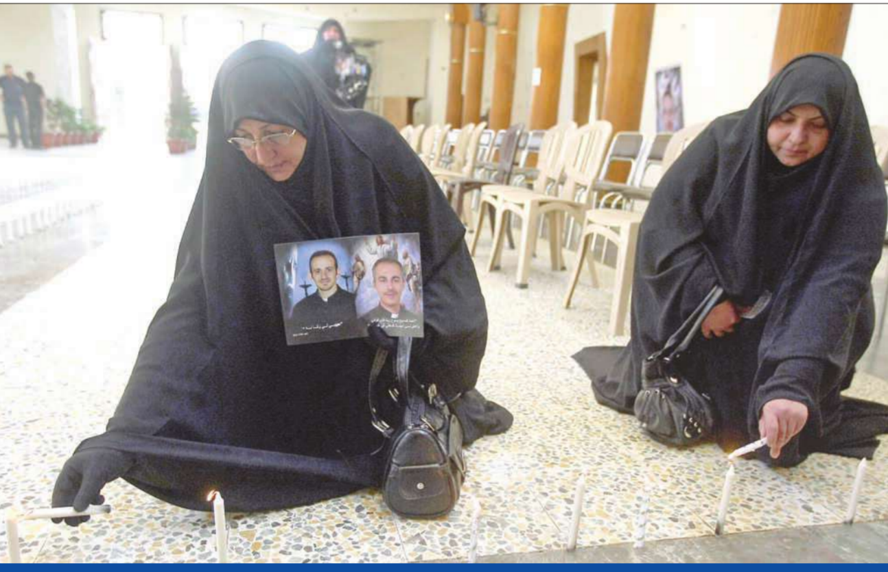
سيدتان عراقيتان مسلمتان تودعان أمس شموعاً في كنيسة سيدة النجاة وسط بغداد أمام لوحات كتبت عليها أسماء الضحايا الذين قتلوا في المكان ذاته الأسبوع الماضي

المجلس الأعلى يرى اجتثاث أعضاء في «العراقية» خطأ يجب تصحيحه النجيفي للسفير الإيراني: بناء علاقات متميزة مع طهران مشروط بعدم التدخل في الشؤون العراقية