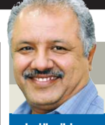
د. غانم النجار

هناك مثل مصري شعبي يقول: "ما وجدوش في الورد عيب قالوا له يا خسر الخدين"، وهذا المثل ينطبق على الذين لم يجدوا عيباً في الانتخابات البرلمانية الأردنية الأخيرة، لا من حيث النزاهة ولا من حيث الشفافية، فقالوا: "إن البعد العشائري برز فيها بشكل كبير وواضح"، وكان الأردن ليس دولة عربية مشرقية وإنما إحدى الدول الإسكندنافية. لم يبادر الإخوان المسلمون، بعد أن أسقطت الانتخابات النيابية، التي جرت يوم الثلاثاء الماضي في التاسع من هذا الشهر، كل حججه ومبرراتهم التي استندوا إليها لاتخاذ موقف استنكافي وسلبى بالنسبة إلى المشاركة في هذه الانتخابات إلى فعل ما تفعله الأحزاب، التي تنق بنفسها والتي تمتلك الشجاعة الأدبية، والمبادرة إلى مراجعة مواقفها وانتقاد ما قامت به نقداً ذاتياً