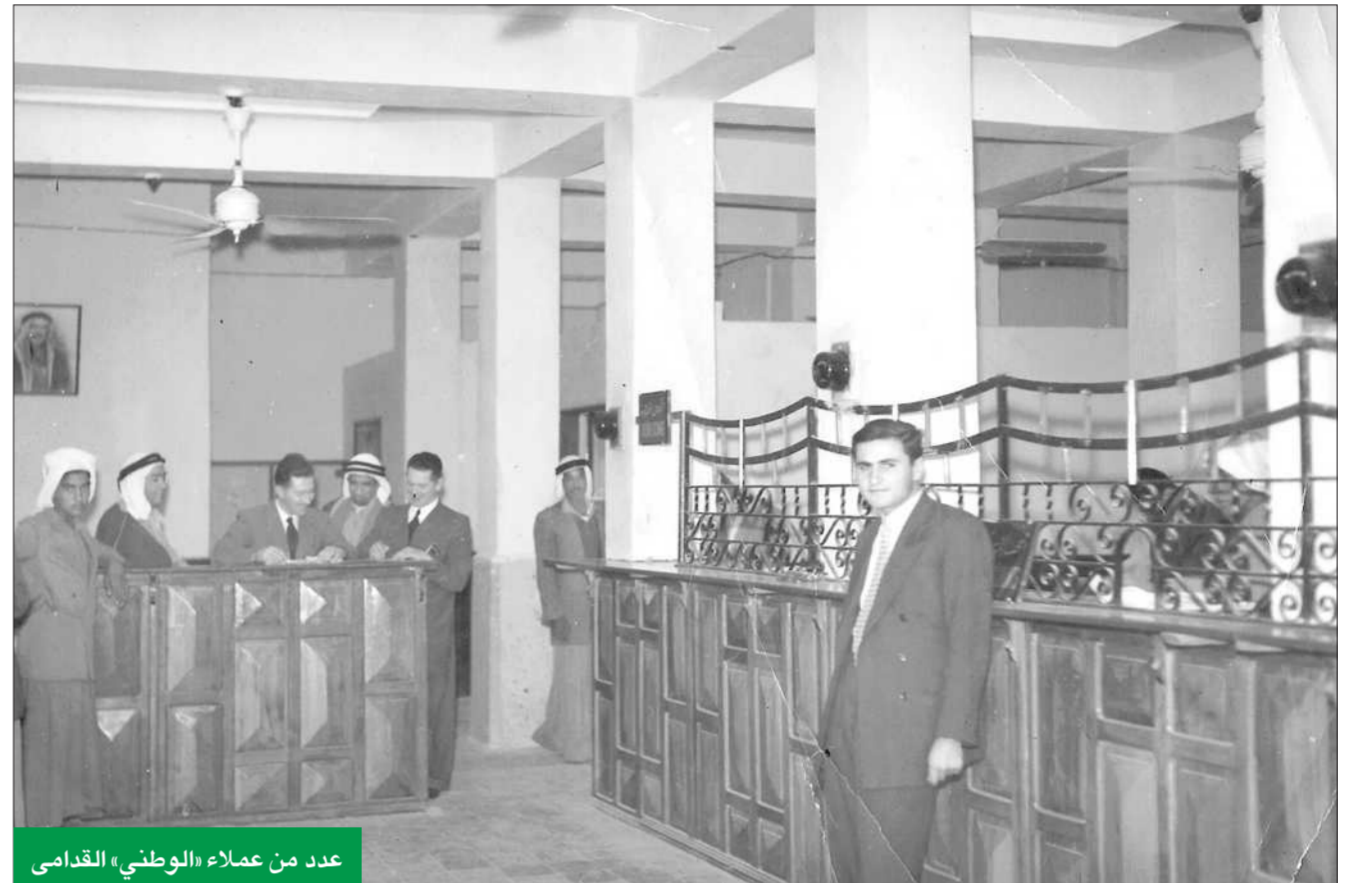
عدد من عملاء «الوطني» القدامى