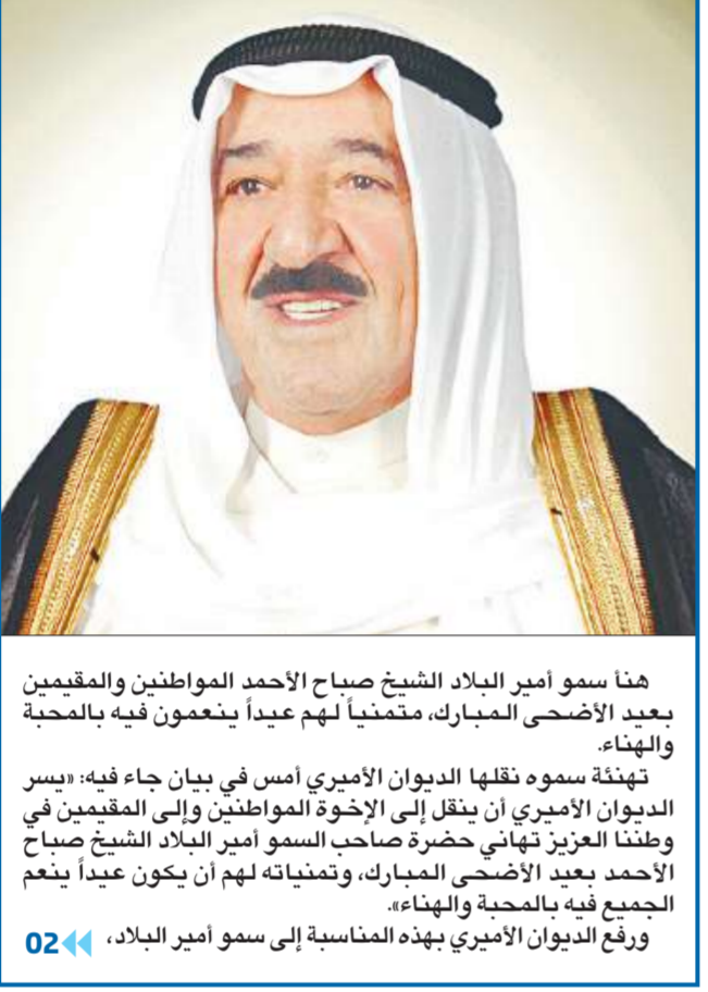
الأمير يهنئ المواطنين والمقيمين بعيد الأضحى

«البيئة» و«الأعلى للتخطيط» يتجهان إلى إقرار خطط سريعة لحماية السكان «السكنية» تحيي مطالباتها بمنافسة «غرب هدية» مع «البترو»