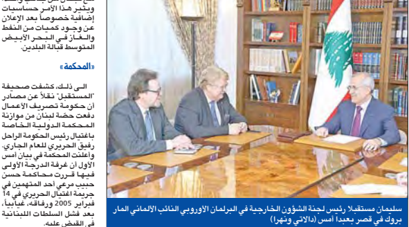
سليمان مستقلاً لرئيسة الشؤون الخارجية في البرلمان الأوروبي الألماني المنار بروك في قصر بعيداً أمس (الاتي ونهر)

وان حزية باقي في سورية، راجحاً تشكيل حكومة من تصريف الأعمال العازمة حتى فقد عقد جلسة حكومية، وذلك حسب تصريحاته في اجتماع مع صحفيين في بيروت أمس. وقال سليمان: «لا نقبل أي إجراء أحادي إسرائيلي لترسيم الحدود البحرية معكم».