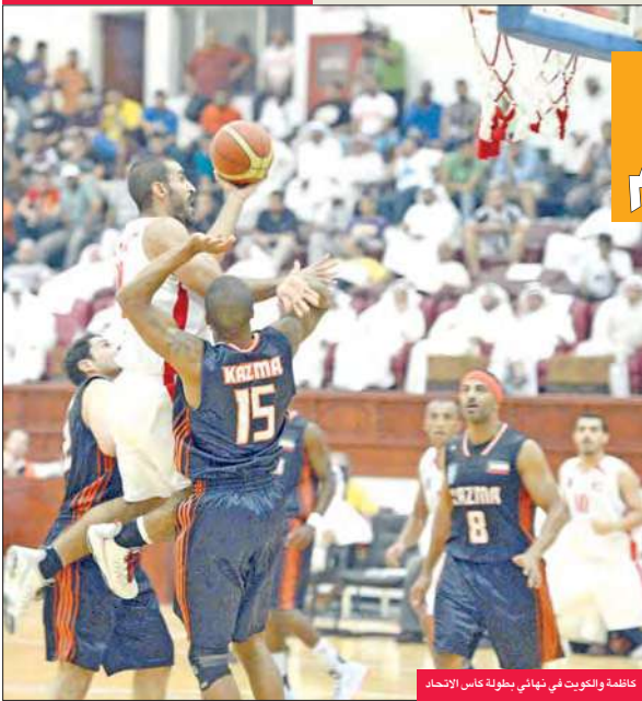
كاظمة والكويت في نهائي بطولة كأس الاتحاد.