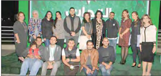
فريق عمل البنك التجاري.