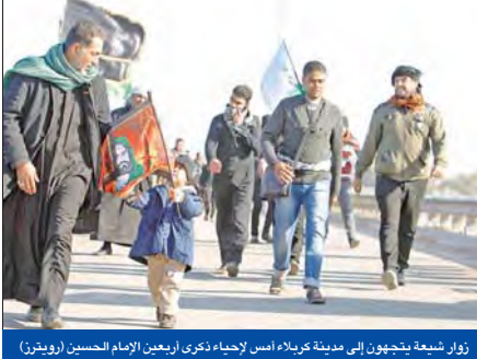
زوار شيعية يتجهون إلى مدينة كربلاء أمس لإحياء ذكرى أربعين الإمام الحسين