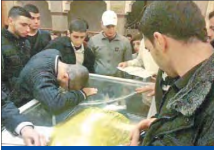
عراقيون يشعرون لأول مرة في النجف أحد القتلى الذين سقطوا في سورية خلال القتال إلى جانب الأسد (إي بي إن)

«هيومن ووتس»: يعتمد قتل المدنيين • المقداد يدعو إلى إدراج السعودية على لائحة الإرهاب