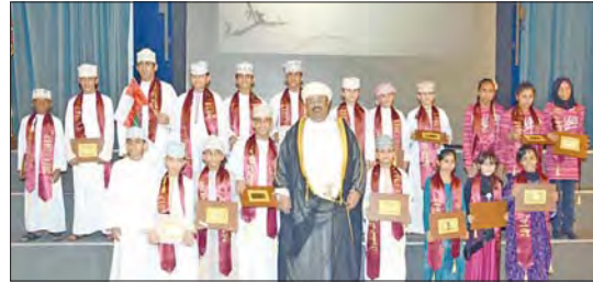
صورة جماعية مع المكرمين