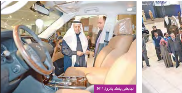
الباطين يتفقد باترول 2014

تزيد من الراحة يأتي باترول 2014 مع شاشة الأذرة للقيادة وعجلة القيادة، المقصورة بولون (Tan)، مسند امامي مخصص للاسترخاء، دروات مزودة على الأضواء، شاشة العرض، المعلومات للقيادة على الطرق الوعرة، نظام مراقبة ضغط الهواء في الإطارات، خاصة في التحكم بدرجة الحرارة في المقاعد الامامية، نظام ملاجي ركن السيارة، على شاشة LCD قياس 8 بوصة، نظام BOSE للترفيه بنظام Music Box للترفيه الصوتي مع قرص 6X9.3 جيجا بايت.