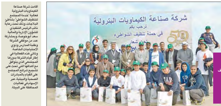
صورة جماعية للعاملين في الشركة مع الطلبة

المناسبة حملة التبرع بالدم المكان الجامعة العربية المفتوحة