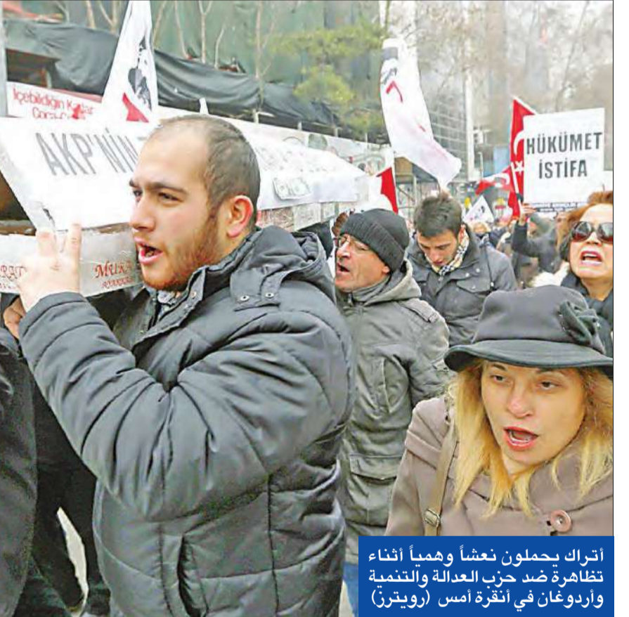
أتراك يحملون نعشاً وهمياً أثناء تظاهرة ضد حزب العدالة والتنمية وأردوغان في أنقرة أمس

من جهة أخرى، اتهم أردوغان مجموعة لم يحددها من السفراء لدى تركيا بممارسة «الاستفزاز» و«المكائد»، داعياً إليهم إلى «القيام بعملهم فقط». وقال أردوغان، في إشارة إلى رؤساء البعثات الأجنبية في تركيا «لا بتعين علينا الإبقاء عليكم، مضيفاً «إذا حاول سفراءنا في الدول الأجنبية التخطيط لمثل هذه المكائد، لا نتوانوا في إبعادهم وسوف نستدعيهم على الفور».