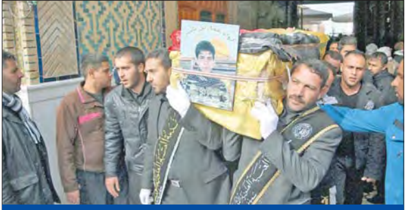
عراقيون يشعرون لأول مرة في النجف أحد القتلى الذين سقطوا في سورية خلال القتال إلى جانب الأسد

شده على أن «طهران ليست مستعدة من قايمة الدول المؤيدة للإرهاب»، وقال المتحدث باسم وزارة الخارجية الإيرانية في مؤتمر صحفي في طهران أمس، «الكندي» بشأن سورية رغم لم تتوصل إلى اتفاق بعد. وليس سرا أنما في الوضع التي ما زالت تعلن دعمها للجماعات الإرهابية الإيرانية، ولكن شريكها في إيران، ولكن شريكها في الولايات المتحدة ليسوا متفقين بعد بشأن مشاركة إيران شؤون الصراعا. وأضاف «لقد اتفقا على أننا سنجري مزيدا من المحادثات لنرى ما إذا كنا نتوصل إلى اتفاق حول هذا الأمر».