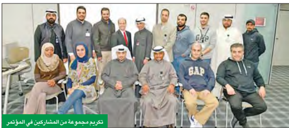
تكريم مجموعة من المشاركين في المؤتمر