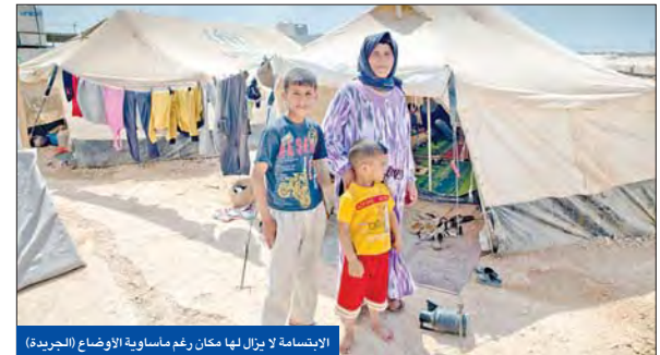
الابتساماة لا يزال هناك رغم مأساة الأوضاع

أمام مجموعة من الكرفانات العديدة من دولة الكويت يلعبون الكرة، وبعد الرجوع إلى المخيم ليبدأ حياة جديدة في المخيم، ولتحققا بالمرسة السورية وديرا بالصف الرابع الابتدائي، مدرس بالصف الرابع الابتدائي، والمسئول للمرحلة من الثانية عشر وحتى الرابعة من الصف الأول، والتي يمكن ان تكون قد وضعت احد الأشخاص الذين يتنقل معهم بعيداً عن