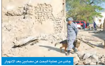
جانب من عملية البحث عن مصابين بعد الانهيار

لحق عاملان آسيويان مصرعهما صباح أمس في انهيار حائط يبلغ طوله 5 أمتار، أثناء عملية ترميم أحد المباني الأثرية التابعة للمجلس الوطني للثقافة والفنون والآداب، وشرف على ترميمه وزارة الأشغال، على عاملين من الجنسية الآسيوية. ووفقاً لرجال الإطفاء شرعوا في عمليات البحث عن المفقودين يومياً خوفاً من وقوع أي انهيارات أخرى نظراً لقدم الموقع، وموضحة أن رجال الإطفاء استعانوا بوحدة كتاب الإشراف التابعة لوزارة الداخلية في عمليات البحث والتفقد. وتذكر أن رجال الإطفاء وبالمجهود الذي تمكنوا من العثور على العامل الآسيوي الأول حين تبرع الأجير بالرمال وتمتداده لكنه كان له فرق الحياة وسلمت حياته إلى رجال الإطفاء الجبائية، ثم عثروا على العامل