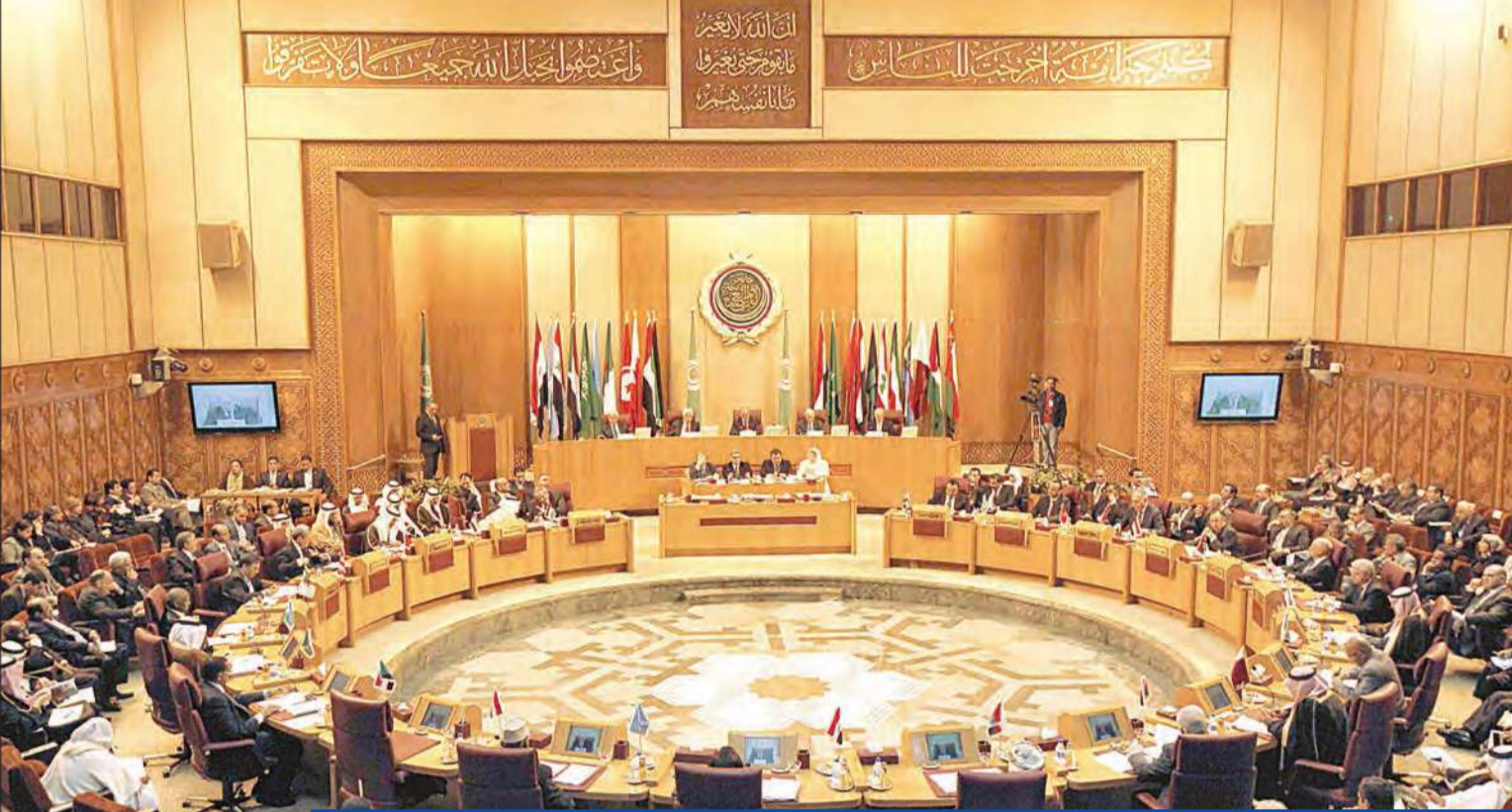
جانب من الاجتماع الطارئ لوزراء الخارجية العرب في مقر الجامعة العربية بالقاهرة أمس (رويترز)

الخبير في الجماعات الإسلامية سمير عطاس لفت إلى ظاهرة جديدة في سيناء هي «أسر الجثث» عن طريق اختطاف الجماعات المسلحة جثث بعض الجنود الذين وقعوا في الاشتباكات للتفاوض عليها مع النظام من أجل إطلاق سراح القيادات الموقوفين من قبل الجيش، مثلما حدث في اشتباكات أمس الأول مع الجندي الذي وقع في الاشتباكات الأخيرة لكن الجيش استطاع استرجاع جثته.