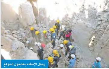
رجال الإطفاء يعينون الموقع

المكرد: فرق الإطفاء عملت يدوياً لقدم المبنى وجار التحقيق لمعرفة أسباب الحادث