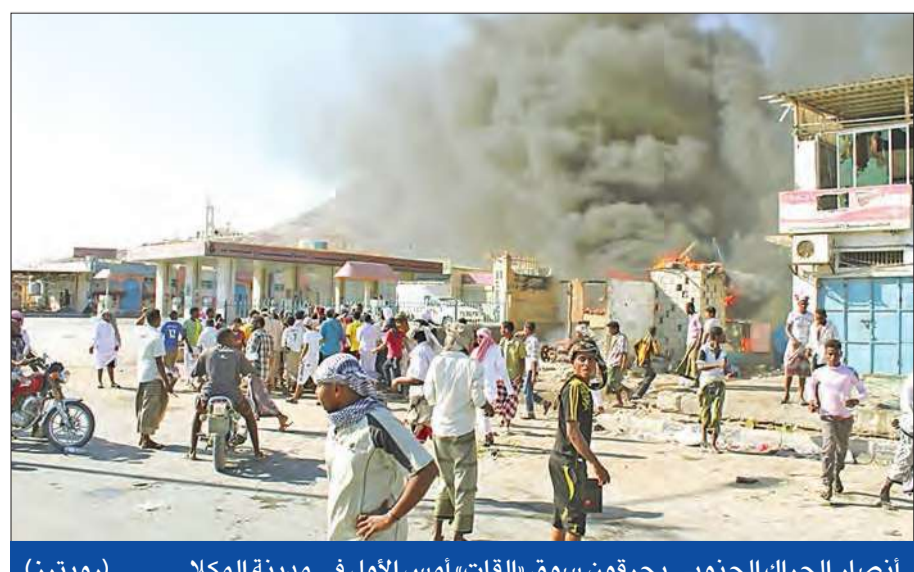
أنصار الحراك الجنوبي يحرقون سوق «القات» أمس الأول في مدينة المكلا

ودعا تحالف قبائل حضرموت إلى «الهبة الشعبية»، عقب مقتل زعيم قبيلة الحوم كبرى قبائل حضرموت الشيخ سعد بن حبريش ومرافقه برصاص قوات الجيش في الثاني من ديسمبر ما أدى إلى موجة غضب غير مسبقة في صفوف قبائل الجنوب. وعاشت المحافظات الجنوبية أمس الأول يوماً صاخباً في أول أيام «الهبة» وتم اقتحام مقرات حكومية وإحراق محلات تجارية لمواطنين «شماليين».