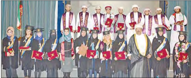
الطلاب والطالبات خلال تكريمهم