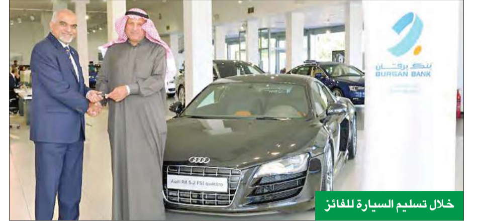
خلال تسليم السيارة للفائز

متعددة، والتي تشمل إمكانية فتح الحساب بالدينار الكويتي أو كافة العملات الرئيسية والاستقطاع المباشر، والحصول على القروض، والبطاقات المصرفية الائتمانية وغيرها الكثير. وقد تم تصميم حساب الثريا استجابة لكافة المتطلبات التي تهدف إلى تقديم المزيد من العروض والمزايا المبتكرة بالإضافة إلى تعزيز فرص الفوز للعملاء.