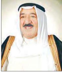
الأمير يبلغ من المبارك وضع الوزراء استقالتهم تحت تصرفه