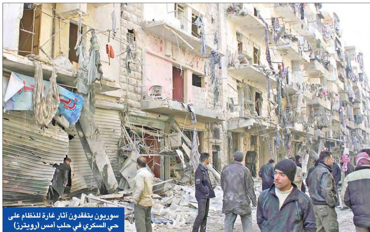
سوريون يتفقدون آثار غارة للنظام على حي السكري في حلب أمس

وأضافت: «إذا كان المتحدث باسم البيت الأبيض جاي كارني» وصف المناطق التي تتعرض للقصف من قبل القوات