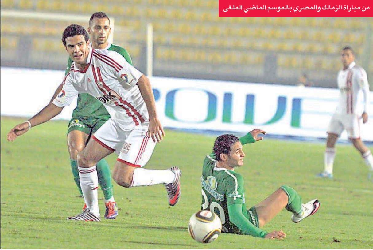
من مباراة الزمالك والمصري بالموسم الماضي الملغى