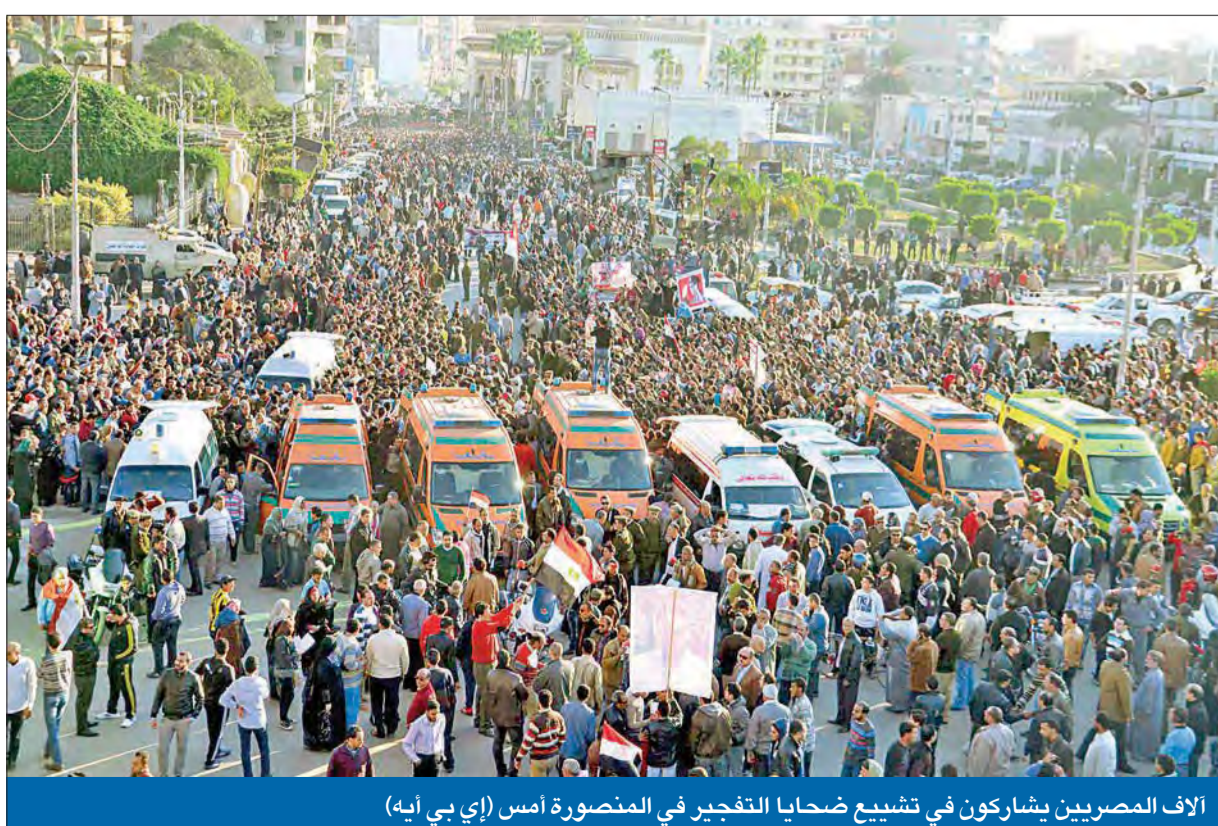
آلاف المصريين يشاركون في تشييع ضحايا التفجير في المنصورة أمس (إي بي آيه)

أهالي المدينة رثوا بإضرار النيران في ممتلكات «الإخوان» الكويت تدين وتدعو المصريين إلى الوحدة ورمص الصفوف