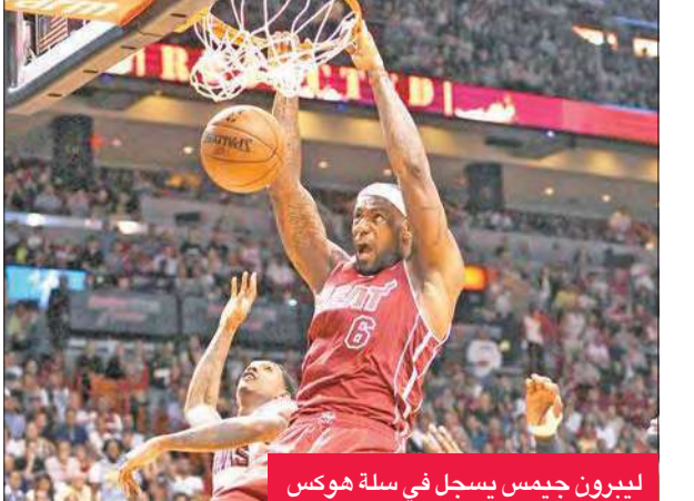
ليبرون جيمس يسجل في سلة هوكس

بتصدر المجموعة الوسطى فارق شاسع عن أقرب منافسيه، في حين لقي بروكلين رابع مجموعة الأطلسي خسارته الثامنة عشرة في 27 مباراة. وتغلب سان أنتونيو سبيرز متصدر مجموعة الجنوب الغربي على تورونتو رابتنورز متصدر مجموعة الأطلسي 112-99، فرغ الأول رصيده إلى 22 فوزا في 28 مباراة، ولقي الثاني خسارته الخامسة عشرة في 26 مباراة. سجل للفائز توني باركر 26 نقطة مع 8 تمريرات حاسمة، ومانو جينوبيلي 18 نقطة، وللخاسر تيريس روس 23 نقطة وكايلي لاوري 23 نقطة مع 9 تمريرات حاسمة. ولقي لوس انجليس ليكرز خسارته