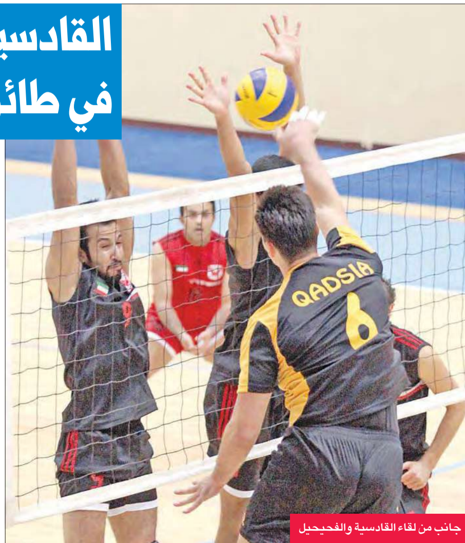
جانب من لقاء القادسية والفحيحيل

وأسفرت بقية مباريات المرحلة عن فوز الكويت على التضامن بثلاثة أشواط دون رد (19-25، 18-25، 21-25)، وبخس النتيجة تغلب فريق كازمة المدافع عن لقبه في البطولة على منافسه الشباب (26-26)، والساحل (21-25، 18-25، 24