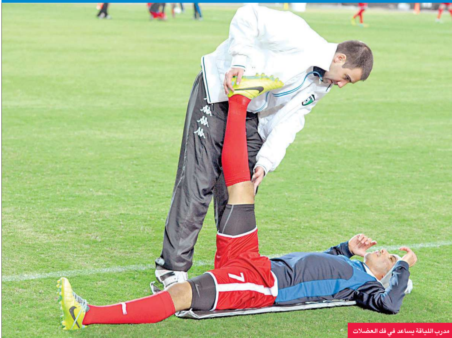
مدرب اللياقة يساعد في فك العضلات