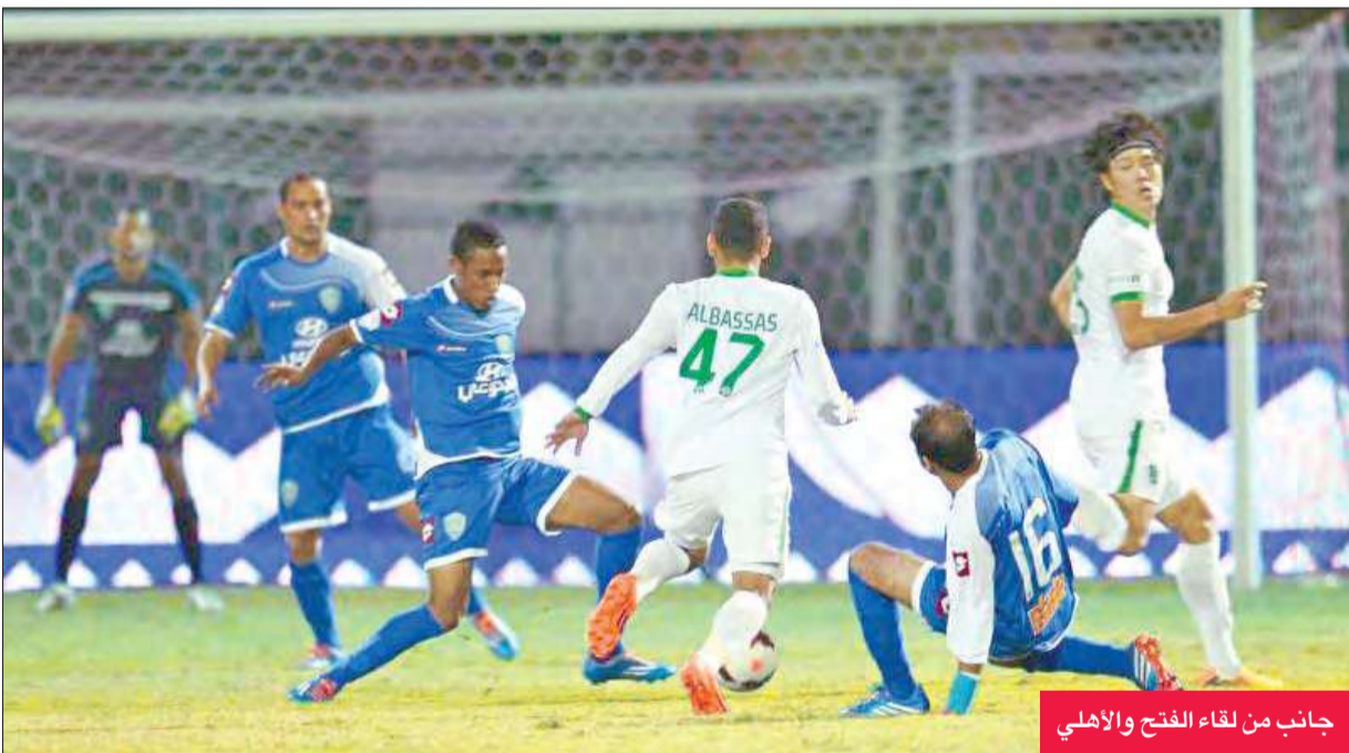
جانب من لقاء الفتح والاهلي

ويلتقي الهلال في دور الاربعة مع الفتح، بطل الدوري في الموسم الماضي، الذي تغلب بدوره على الاهلي بهدفين متأخرين للبرازيلي التون جوزيه على مضيفة الرائد 1-صفر أمس الأول، ويدين الهلال بتأهله لسالمة الدوري، الذي سجل هدف المباراة الوحيد (41).