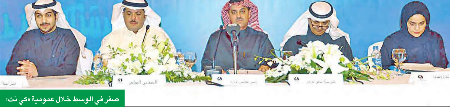
صفر في الوسط خلال عمومية «كي نت»

شركة الخدمات المصرفية الآلية المشتركة (ش.م.ك.م.) The Shared Electronic Banking Services Company (K.S.C.C)