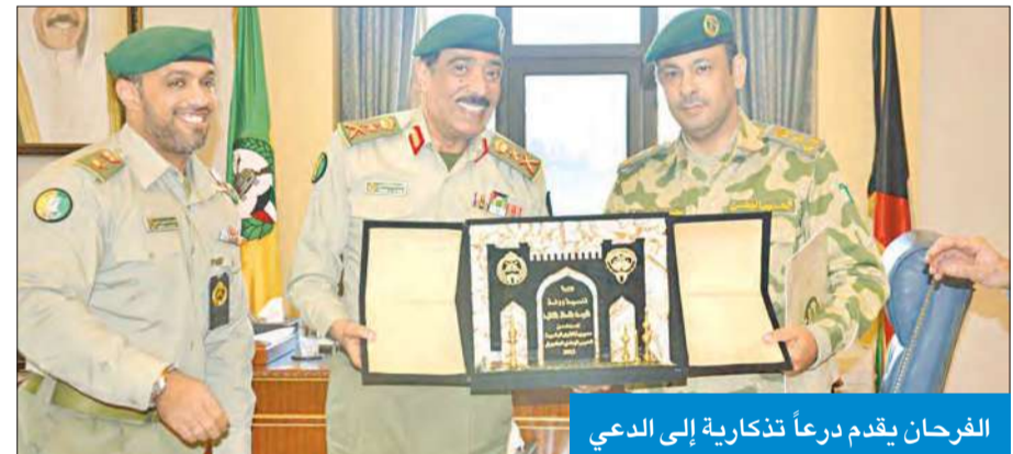
الفرحان يقدم درعاً تذكارية إلى الدعي

أكد وكيل الحرس الوطني الفريق ناصر الدعي أن الحرس يضع نصب عينيه التوجيهات السامية في الاهتمام بالشباب الكويتيين وتبني مطالبهم. وقال الدعي خلال تكريمه مديريةية التوجيه المعنوي ومديرية القوى البشرية، بمناسبة اختتام مبادرة تنمية ووفاء لكويت العطاء الثانية، إن الخطة الاستراتيجية للحرس الوطني أولت الدور المجتمعي عناية كبيرة، ولاشك أن تاهيل الشباب الكويتيين وصل