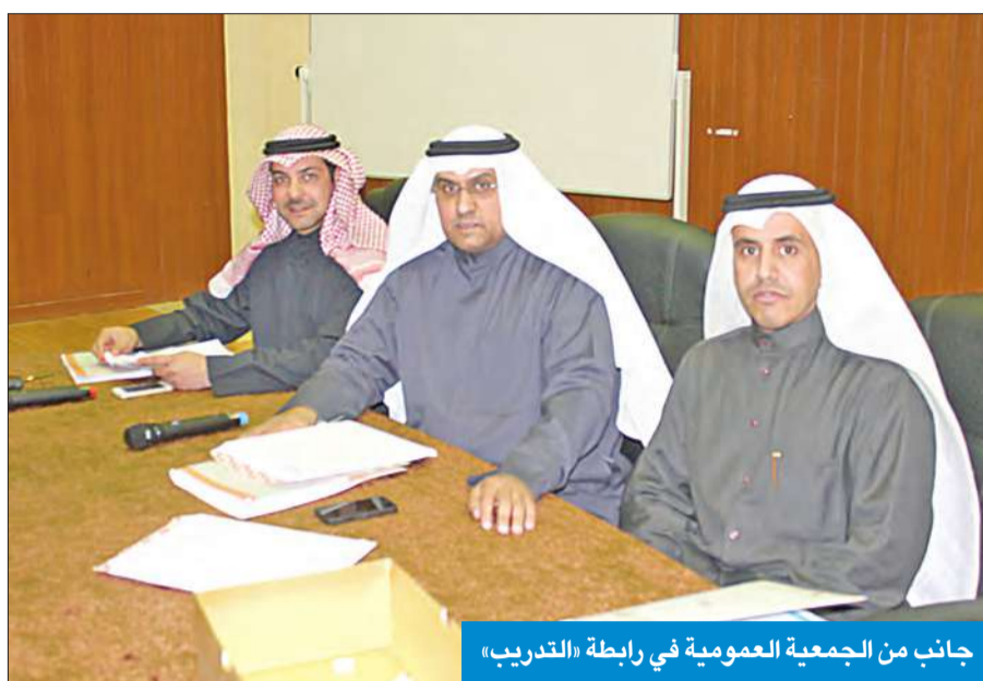
جانب من الجمعية العمومية في رابطة «التدريب»