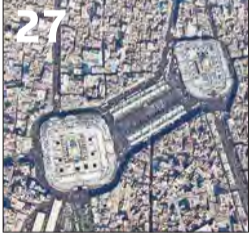
العراق: وزير الدفاع ينجو من اغتيال... و20 مليوناً زاروا كربلاء