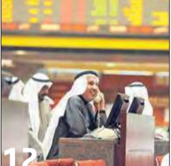
ارتفاع حركة تداولات السوق 27%... والمؤشرات تقفل خضراء