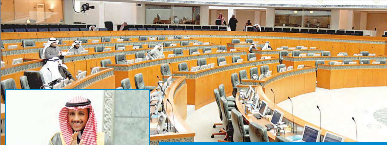
القاعة كما بدت وقت رفع الجلسة أمس وفي الإطار الغانم محييا الحضور