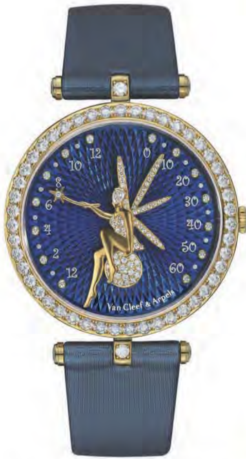
Lady Arpels Féerie Yellow Gold - Kuwait Special Edition

كما ان دار فان كليف أند آربلز مهتمة جداً بالسوق الكويتي وتحديداً بالمرأة الكويتية التي تتميز بذوقها الرفيع وتدعو جميع السيدات بزيارة الدار وستجد كل ما يروق لها من القطع التي توافق مشاعرها.