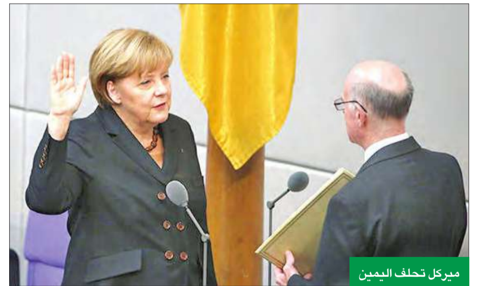
ميركل تحلف اليمين

متنصف الشهر الجاري لصالح اختيار المستشارة أنجيلا ميركل «سيدة أوروبا القوية» لقيادة البلاد لفترة ثالثة، ويأتي التصويت بعد نتائج انتخابية حرجة أجبرت ميركل