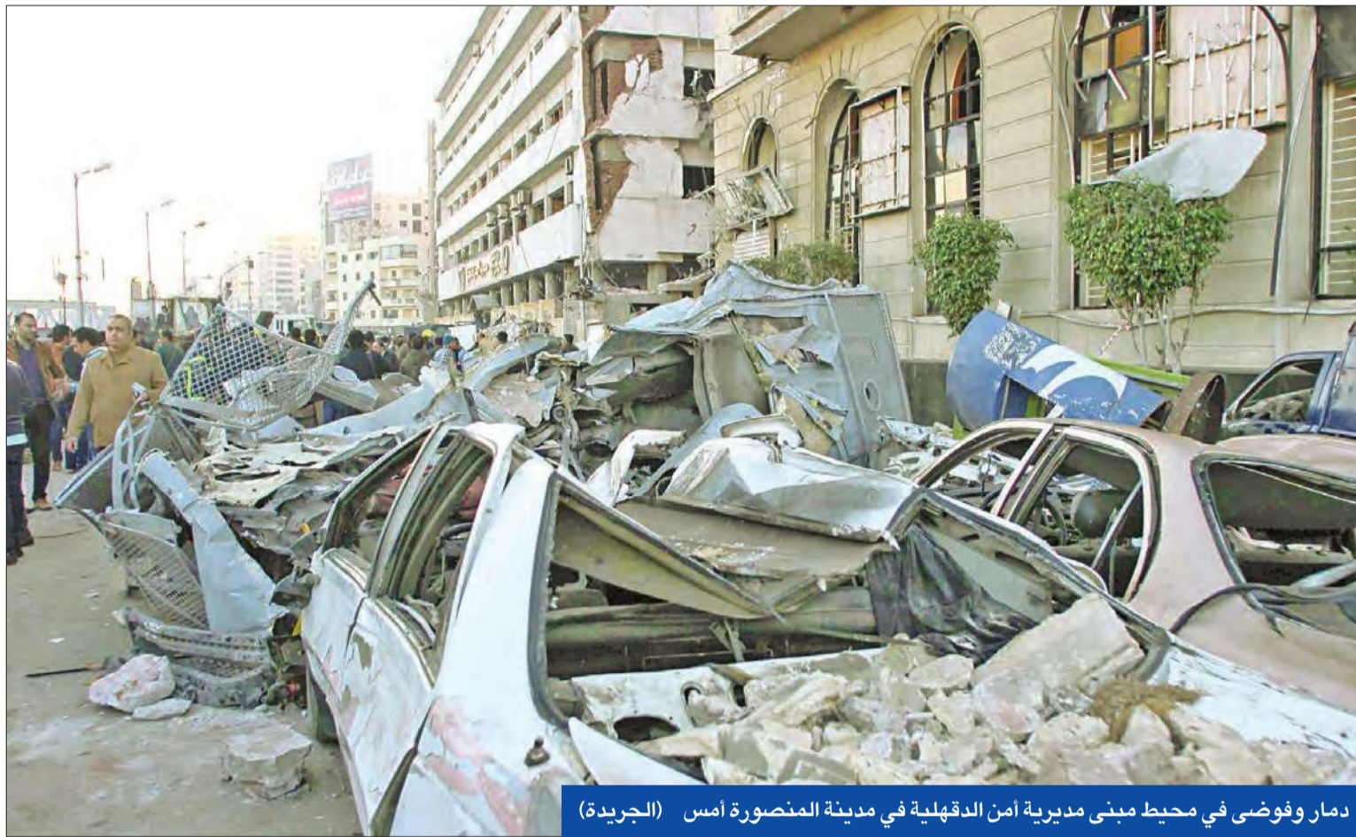
دمار وفوضى في محيط مبنى مديرية أمن الدقهلية في مدينة المنصورة أمس

القاهرة، المنصورة - أيمن عيسى وحسن حسين وشيما جلال وهيثم عسرن