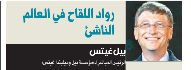
رواد اللقاح في العالم الناشئ

إن اللقاحات تجرّح المعجزات، فهي تمنع الأمراض من إصابة الناس، وهذا أفضل كثيراً من معالجة هذه الأمراض بعد حدوثها. وهي أيضاً رخيصة نسبياً ويسهل تسليمها إلى المحتاجين إليها. ورغم هذا فإن الملايين من الأطفال لا يحصلون عليها. وكانت هذه الحقيقة مذهلة بالنسبة لي يوماً. فعدمتنا أنشأتنا «مؤسسة غينس» قبل خمسة عشر عاماً، افتراضاً أن كل الخطوات الواضحة كانت تتخذ بالفعل، وأنها لا بد أن نلاحق حلولاً مكلّفة أو لم يتّخذ نجاحها. والواقع أن تسليم اللقاحات الأساسية لا يزال يشكل واحدة من أعلى أولوياتنا.