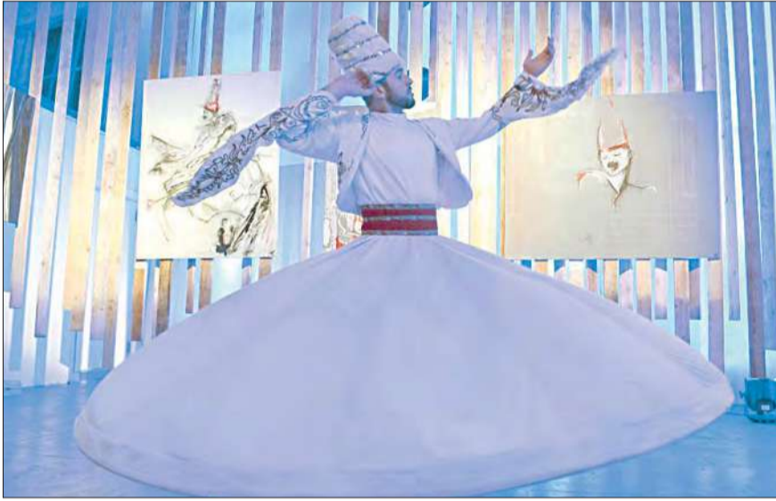
رقصة لفرة «الدرابيش»

المكان قاعة Studios 450 PK (برج حمود) في بيروت