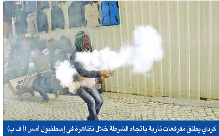
كردي يطلق مفرقات نارية باتجاه الشرطة خلال تظاهرة في إسطنبول أمس

غولن يشدد على معاقبة المفسدين... ووزير الداخلية يدافع عن نجله