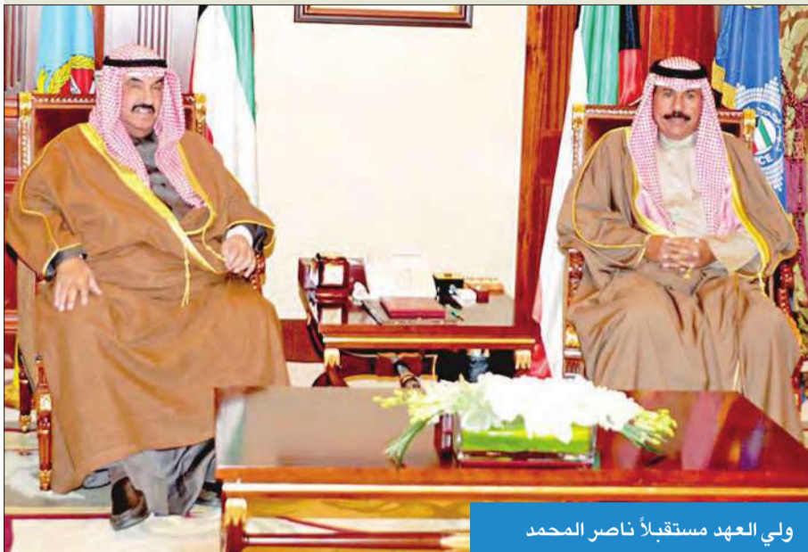
ولي العهد مستقبلاً ناصر المحمد

استقبل سمو ولي العهد الشيخ نواف الأحمد بقصر بيان صباح امس سمو الشيخ ناصر المحمد.