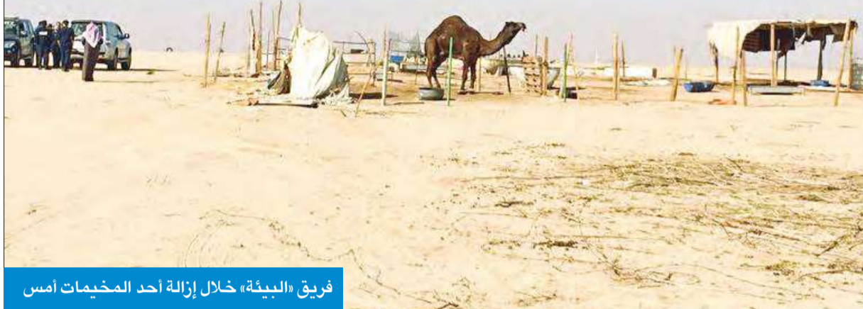
فريق «البيئة» خلال إزالة أحد المخيمات أمس