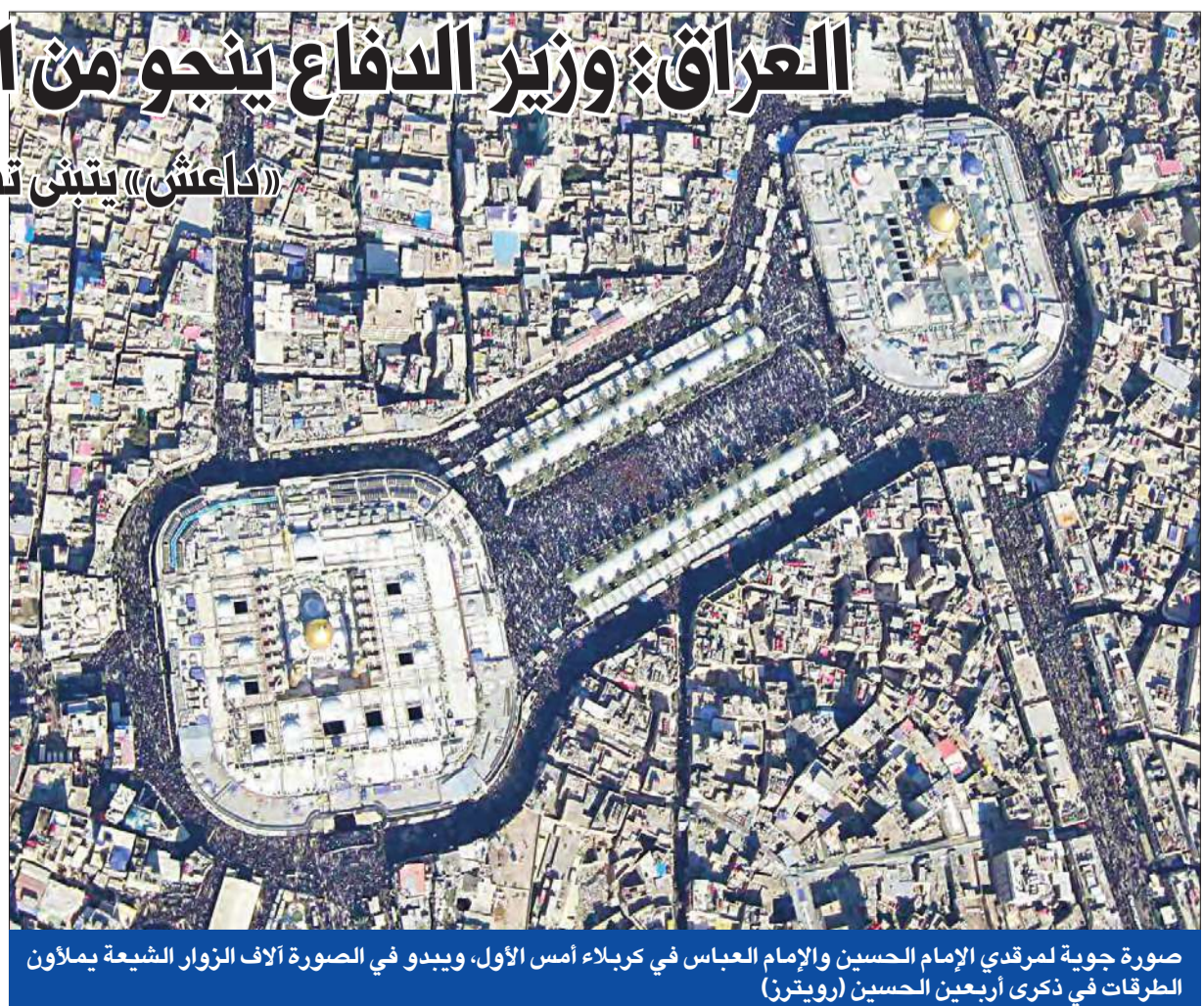
صورة جوية لمقردي الإمام الحسين والإمام العباس في كربلاء أمس الأول، ويبدو في الصورة آلاف الزوار الشيعة يملأون الطرقات في ذكرى أربعين الحسين

بغداد، كربلاء - أ ف ب، رويترز، د ب، يو بي آي، كونا