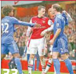
فينغر يفشل في فك شفرة مورينيو مجدداً