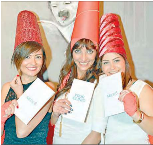
جوزيان وربنا وتيما