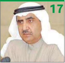
بودي لـ الجريدة: لتنسحب الشركات غير المتوافقة مع متطلبات «هيئة السوق» لـ تنظيف البورصة