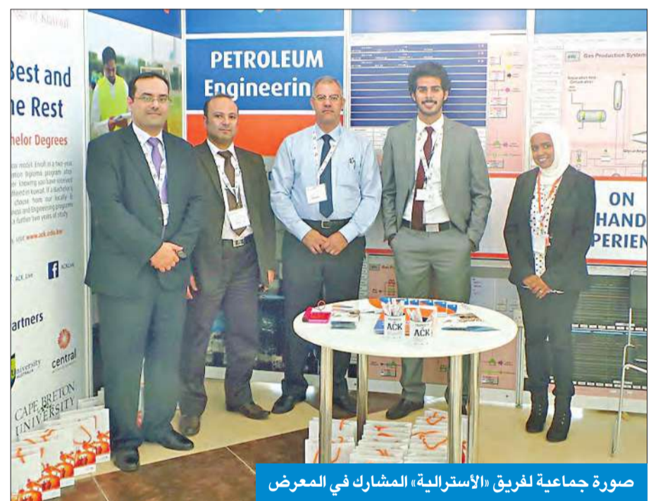
صورة جماعية لفريق «الأسترالية» المشارك في المعرض

شاركت الكلية الأسترالية Getenergy في معرض «VTEC MENA 2013» للتدريب المهني في قطاع النفط والغاز، المقام في أبوظبي. ويمثل المعرض منصة مثالية لخلق أسس تعاون بين المؤسسات التعليمية والشركات العاملة في قطاع النفط والغاز وجهات حكومية، سعياً لتلبية الاحتياجات المتنامية وخلق كوادر بشرية ماهرة تساعد على مواكبة متطلبات قطاع الطاقة. وجاءت مشاركة الكلية في المعرض من منطلق ريادتها في المجال التعليمي المهني في قطاع النفط والغاز إقليمياً، حيث تهدف الكلية إلى إبراز نجاحاتها في استخدام نظام «TAFE» الأسترالي مع تأكيد أهمية التعليم المهني في عملية تعزيز قدرات الشباب وتأهيل الكوادر البشرية لسوق العمل.