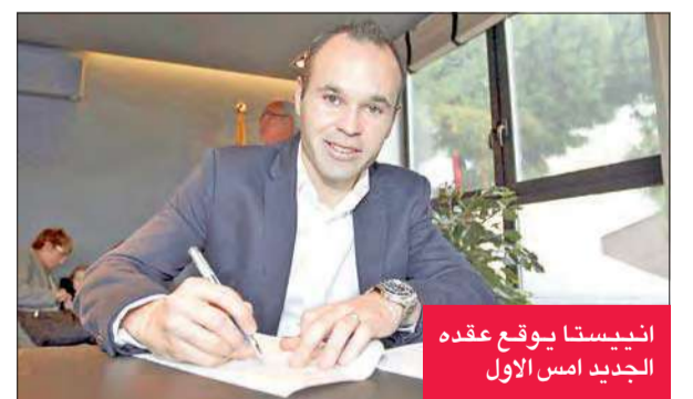
انبيستا يوقع عقده الجديد أمس الأول

الفريق الريدف عام 2001 والاول اعتبارا من 2002. وتوج انبيستا مع "بلوغرانا" بلقب الدوري المحلي 6 مرات والكأس مرتين وكأس السوبر 6 مرات ودوري أبطال أوروبا 3 مرات وكأس السوبر الأوروبية