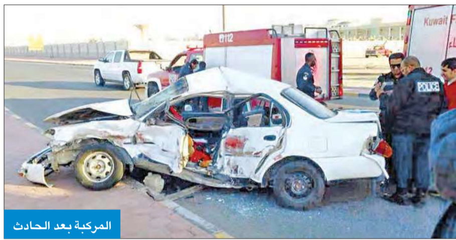
المركبة بعد الحادث

دوريات رجال الأمن لتخطيم حركة المرور وتسجيل تقرير بالواقعة.