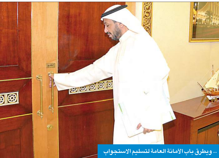
... ويترك باب الامانة العامة لتسليم الاستجواب