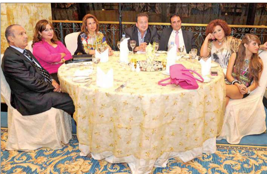
عدد من الحضور