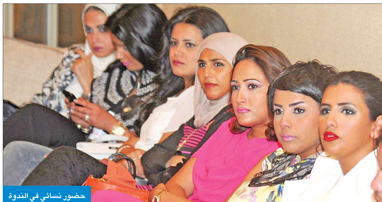
حضور نسائي في الندوة