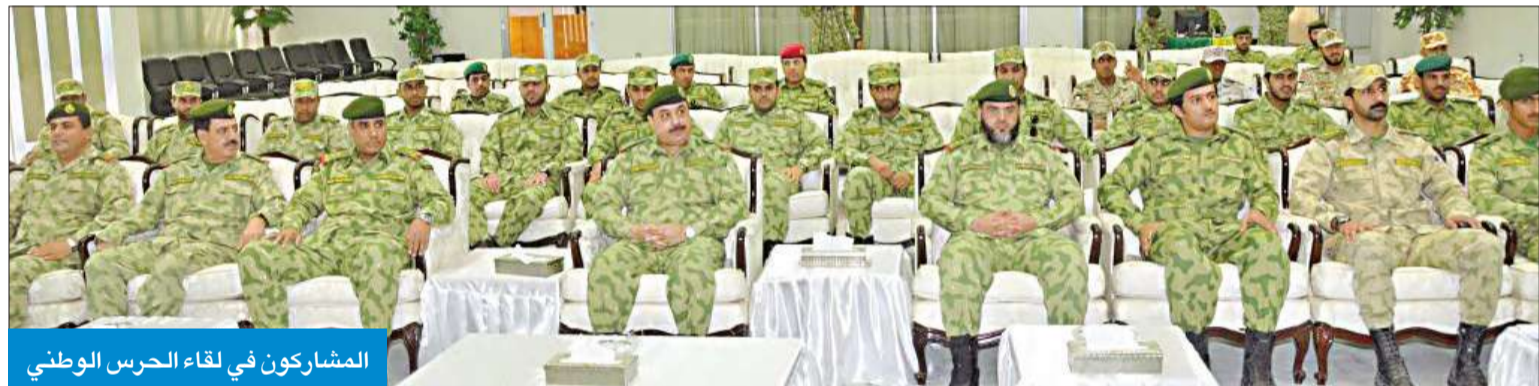
المشاركون في لقاء الحرس الوطني

في المؤسسات العسكرية المرموقة حتى يبقى الحرس الوطني مسالماً لركب التقدم والتطور. ودعا اللواء الرفاعي الضباط الجدد إلى الاستفادة من المناهج والتدريبات سواء النظرية أو العملية التي يقوم بتدريسها طاقم متخصص من المعلمين والمدربين الأكفاء، مشدداً على أهمية رفع مستوى اللياقة البدنية بالمداومة على التمارين الرياضية واتباع أنماط غذائية سليمة.