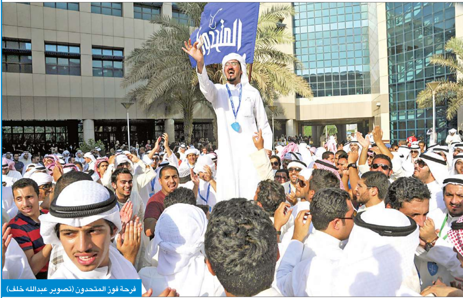
فرحة فوز المتحدون

ومن جانبها، أكدت منسقة القائمة المستقلة في كلية