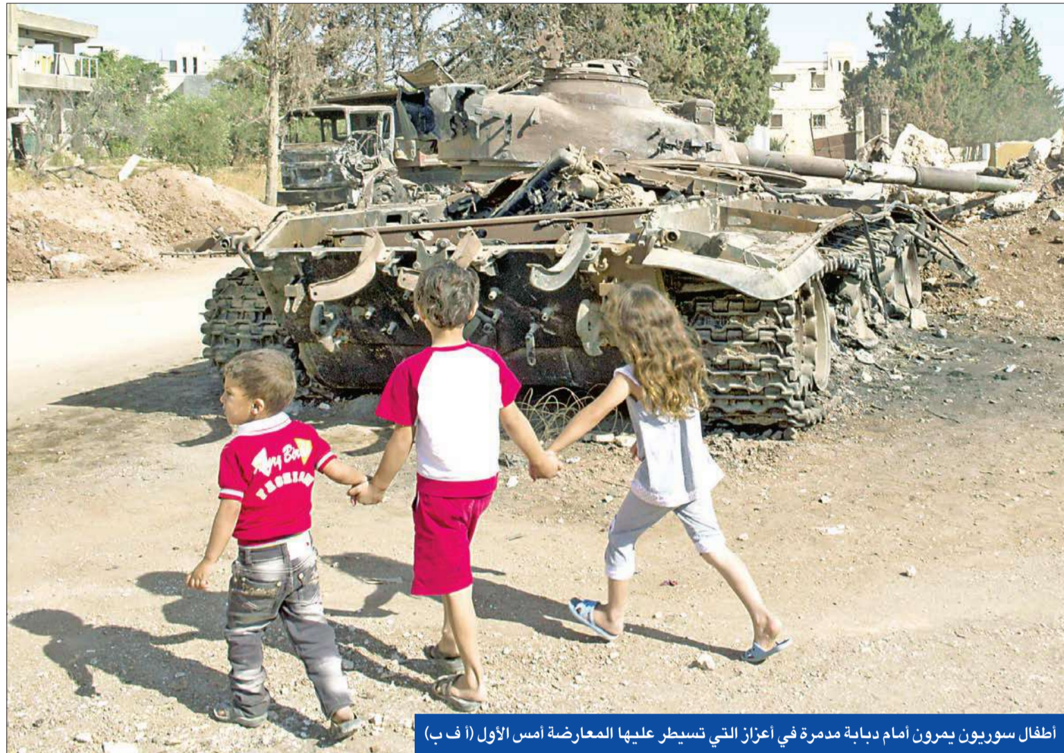
أطفال سوريون يرون أمام دبابة مدمرة في أعزاز التي تسيطر عليها المعارضة أمس الأول

من ناحيته، اعتبر رئيس كتلة الوفاء للمقاومة، (حزب الله) النائب محمد سعد أن «كل من يطرح صيغة لقانون الانتخاب بمعزل عن اتفاق الطائف يتنكر للوفاق الوطني ويخرج من الوحدة الوطنية، ويغدر لوحد من أجل أن يحقق مصالحه الخاصة، وحتى في كثير من الأحيان على حساب طائفته ومذهبه». وقال: «نحن لدينا معيار واضح هو أن أي صيغة لقانون الانتخاب يمكن أن توافق عليها إذا كانت تلزم التعاظم مع مضمون اتفاق الطائف لجهة حجم الدوائر الانتخابية ووجهة الحفاظ على العيش المشترك، وأيضاً لجهة أنها تسحق في المجال أمام أوسع وأشمل تمثيل للناس في المجلس النيابي».