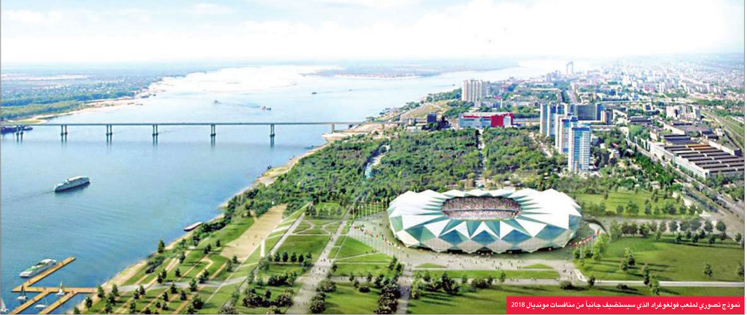
نموذج تصويري لملاعب فولغوغراد الذي سيستضيف جانباً من منافسات مونديال 2018

وأشار إلى أن نصف التكاليف سيتحملها مستخدمو القطاع الخاص، أمثال رومان ابراموفيتش مالك نادي تشلسي الإنكليزي. وامتدح بلاتر اللجنة المنظمة لمونديال 2018، بالقول: «إننا في وضع مريح، عندما يتعلق الأمر بتنظيم كأس العالم 2018 في روسيا، نحن على مسافة عام واحد من جدول الأعمال».