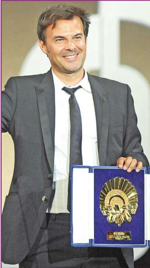
جائزة الصدفه الذهبية لفيلم «دان لا فيرون» لمخرجه فرنسوا أوزون