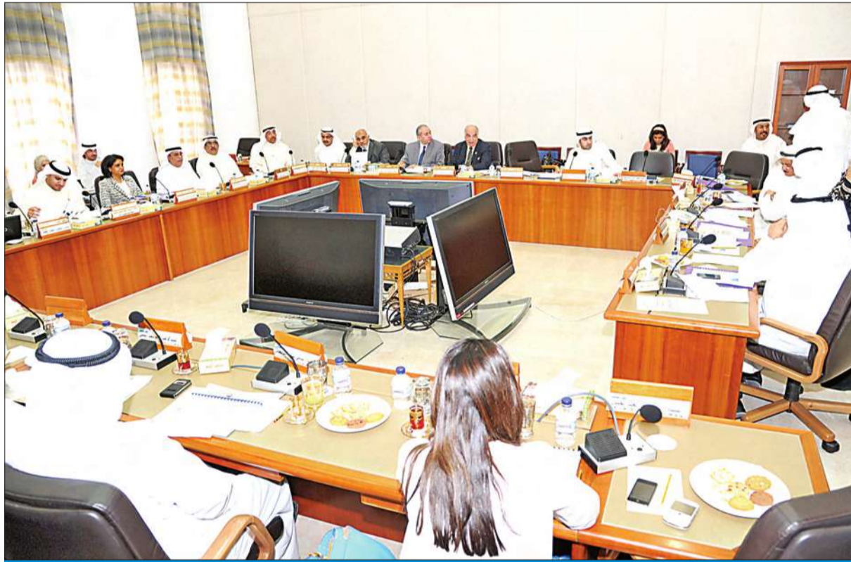
صورة لاجتماع سابق للجنة الميزانيات

محذراً من التوسع في بعض بنود الميزانية بطريقة غير صحيحة.