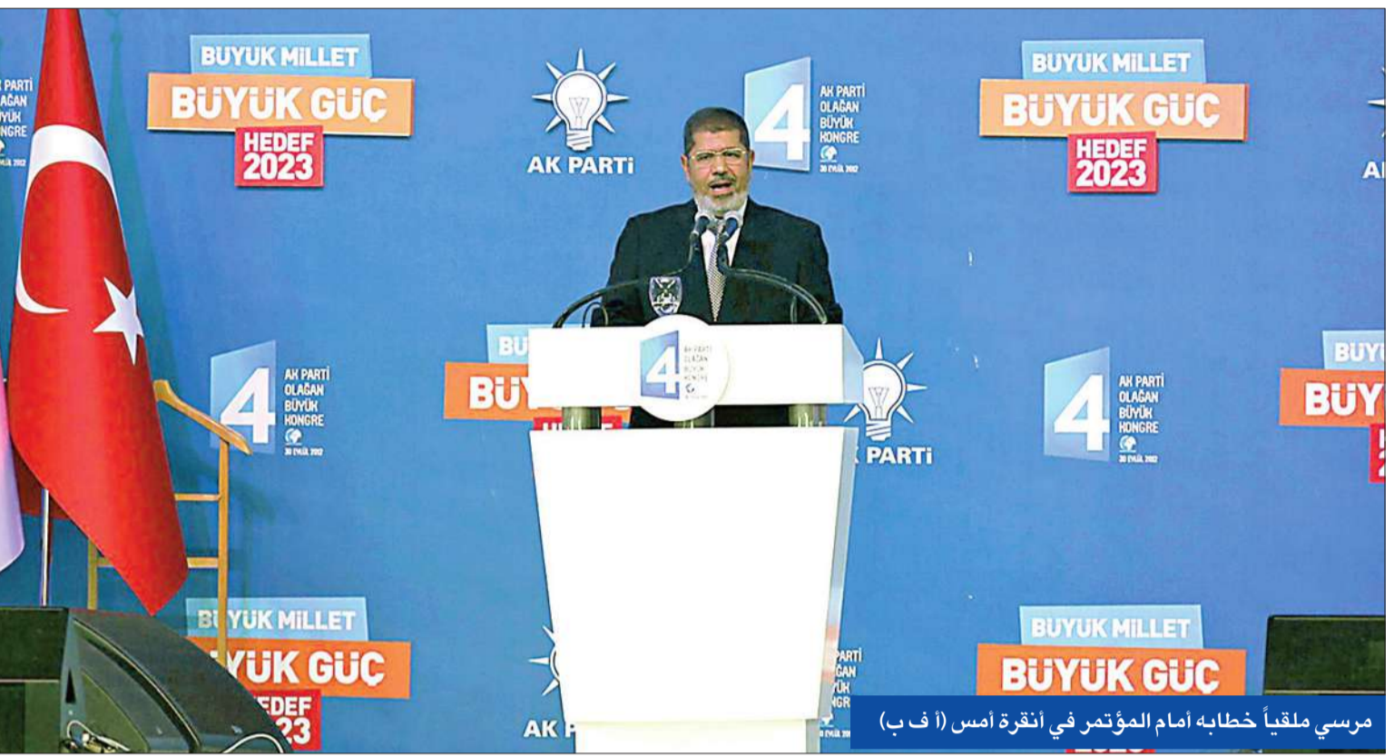
مرسي ملقياً خطابه أمام المؤتمر في أنقرة أمس

• أردوغان يناشد روسيا والصين وإيران وقف دعم الأسد • الرئيس المصري: لن يهدأ لنا بال حتى زوال القيادة السورية