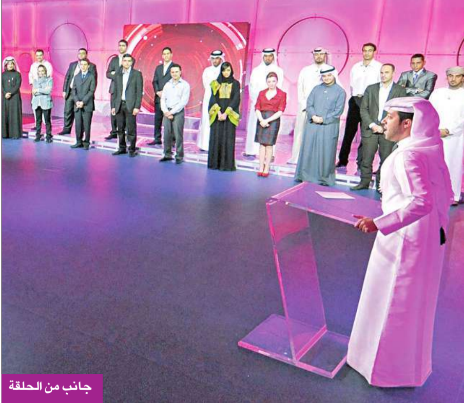
جانب من الحلقة

وكشفت لجنة التحكيم خلال عملية الاختيار النهائية التي أقيمت في «واحة العلوم والتكنولوجيا في قطر»، عن أسماء 16 مختراً عربياً تأهلوا لمرحلة «إثبات الفكرة» التي يُطلب خلالها من المخترعين الشباب إقناع اللجنة بمدى فاعلية أفكارهم من الناحية العلمية، من خلال إثبات إمكانية تطبيقها وتحويلها إلى منتجات عملية خلال فترة زمنية لا تتجاوز ثلاثة أشهر.