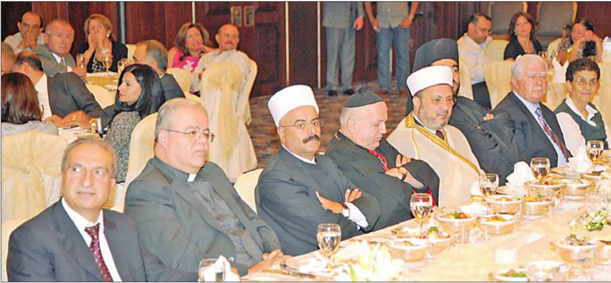
رجال دين مسلمون ومسيحيون ودروز في المائدة