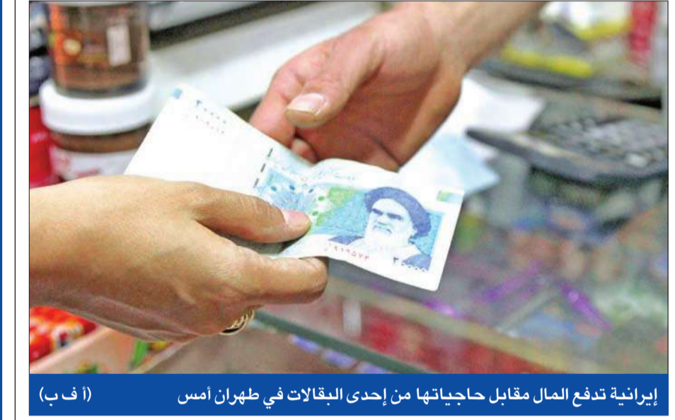
إيرانية تدفع المال مقابل حاجياتها من إحدى البقالات في طهران أمس

استعداد أوروبا - أميركي لتشديد العقوبات على إيران