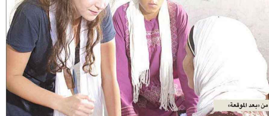
من «بعد الموقعة»

فعلًا، قمت بزيارات عدة لعدد من هذه المنطقة، كي أقدم شخصية من لحم ودم كما هي في الواقع، فهي قريبة منا وليست بعيدة، وكل من سيشاهد الفيلم سيحس كما لو أنه يعرفها أو قابلها.