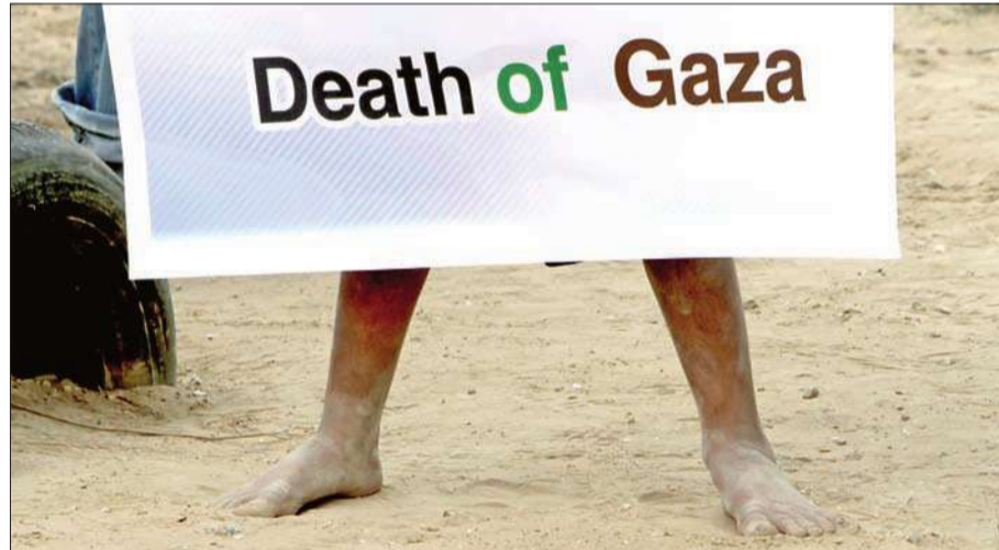
طفل فلسطيني يحمل لافتة كتب عليها «موت غزة» خلال التظاهرة في رفح أمس

انفجار في غزة في ظل استمرار الحصار وإغلاق الأفق، مضيافاً: «يا إخواننا المصريين لا تجعلونا نفقد الأمل بهذه الاستراتيجية».