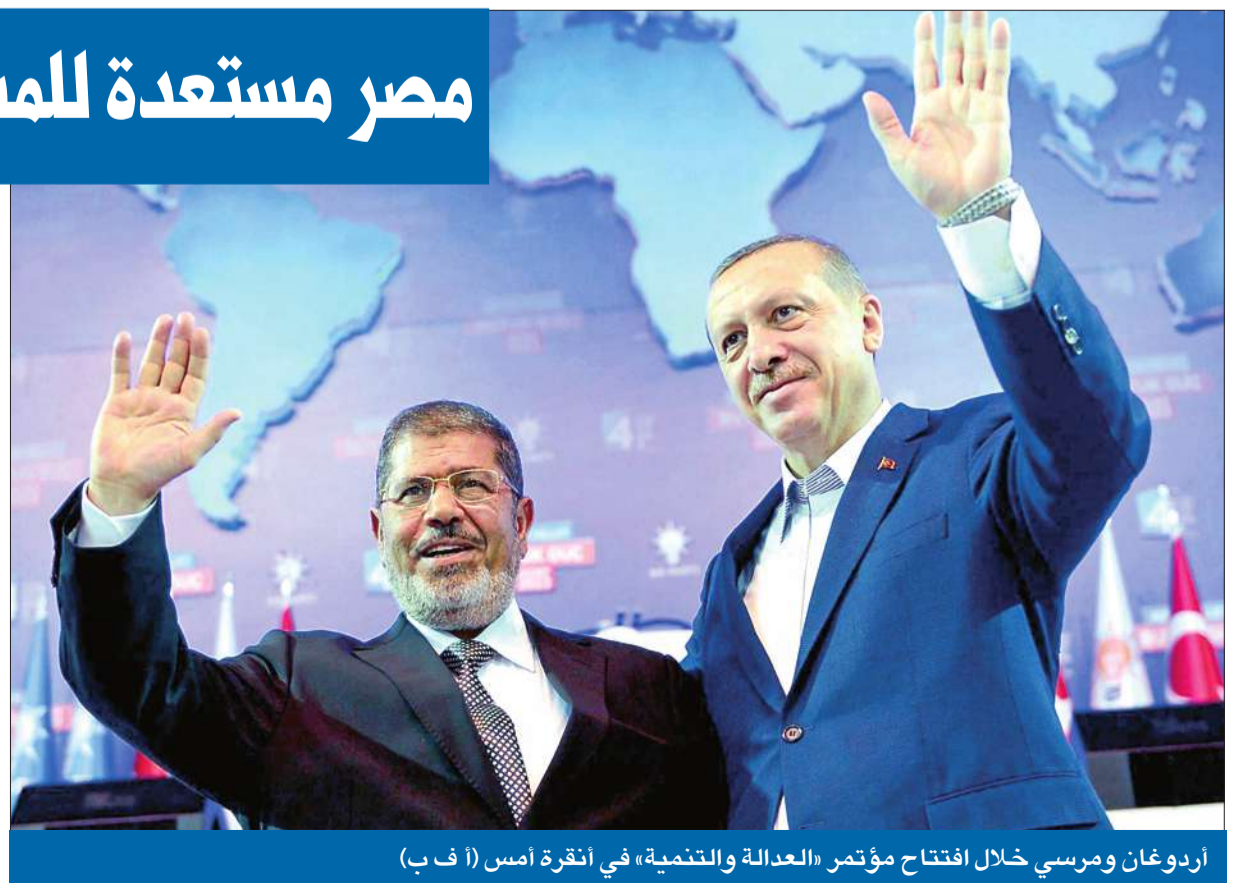
أردوغان ومرسي خلال افتتاح مؤتمر «العدالة والتنمية» في أنقرة أمس

وأوضح عبدالفتاح، في تصريحات لوكالة أنباء الاناضول التركية، أن القاهرة تدرس المقترح الذي أعلنه أمير قطر حمد بن خليفة أمام الجمعية العامة للأمم المتحدة الثلاثاء الماضي، بشأن التدخل العسكري العربي في سورية لإنهاء الأزمة الراهنة، وستجرى اتصالات مع الدوحة وأنقرة قريباً حول هذا المقترح.