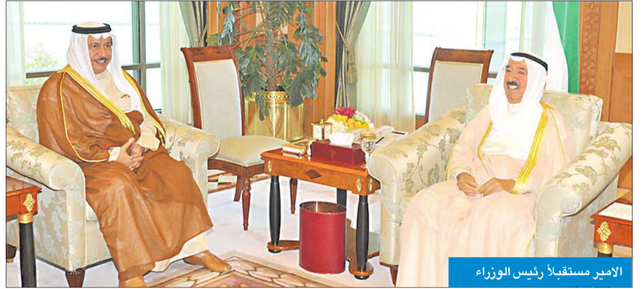
الأمير مستقبلاً رئيس الوزراء

بوفاء المغفور له باذن الله تعالى صاحب السمو الملكي الأمير هذلول بن عبدالعزيز آل سعود، سائلاً سموه المولى تعالى أن يتغمده بواسع رحمته، ويسكنه فسيح جناته، وأن يلهم الأسرة المألكة الكريمة جميل الصبر وحسن العزاء. وبعث سمو ولي العهد الشيخ نواف الأحمد وسمو رئيس الوزراء ببرقيتي تعزية مماثلتين.