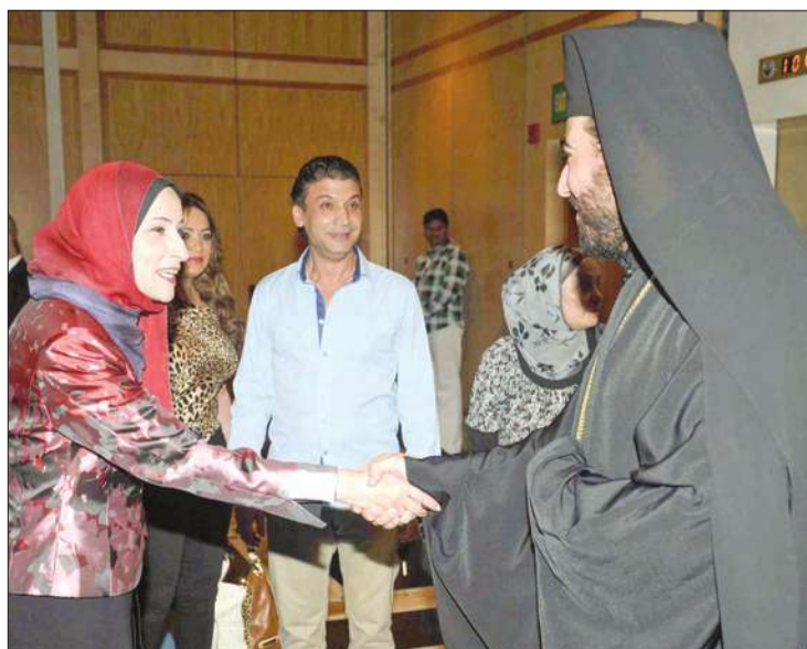
زوجة الحاج حوجو ترحب بالمدعوين