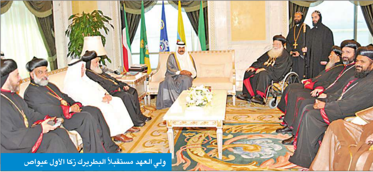
ولي العهد مستقبلاً بطريك زكا الأول عيواص

واستقبل سمو ولي العهد بطريك زكا الأول عيواص (بطريك انطاكية وسائر المشرق والرئيس الأعلى للكنيسة السريانية الأرثوذكسية في العالم أجمع) والوفد المرافق له، وذلك بمناسبة زيارته للبلاد.