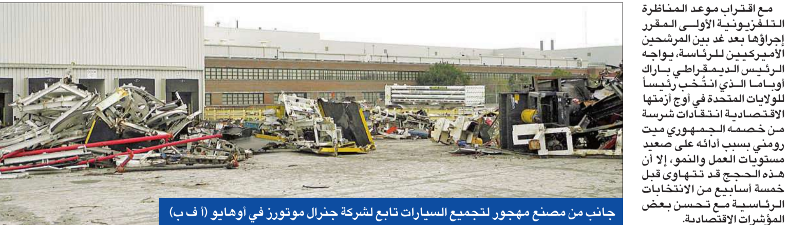
جانب من مصنع مهجور لتجميع السيارات تابع لشركة جنرال موتورز في أوهايو

19 متمولاً من داعمي نتنياهو يدعمون المرشح الجمهوري