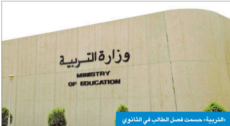
«التربية» حسمت فصل الطالب في الثانوي

من جانب آخر، أكد العتيبي أن الجمعية أرادت أن تشارك العالم في الاحتفال بالمعلم تقديراً لمكانته وتعبيراً شكرها له، وهذه الاحتفالية انطلقت تحت شعار «معلم وأفتخر» لتضمن رسالة وفاة للمعلم، موضحة أن «هذا الاحتفال نفوذ به بشكل سنوي، ولكن في هذا العام أردنا أن تكون الاحتفالية مختلفة عن ذي قبل، وهذا إشراك وسائل الإعلام والمجمعات والأسواق، بالإضافة إلى المهرجان الثاني، وهو شكرًا للمعلم الذي سيكون تحت