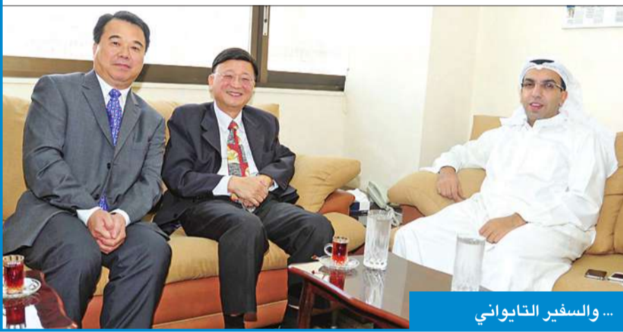
... والسفير التايواني