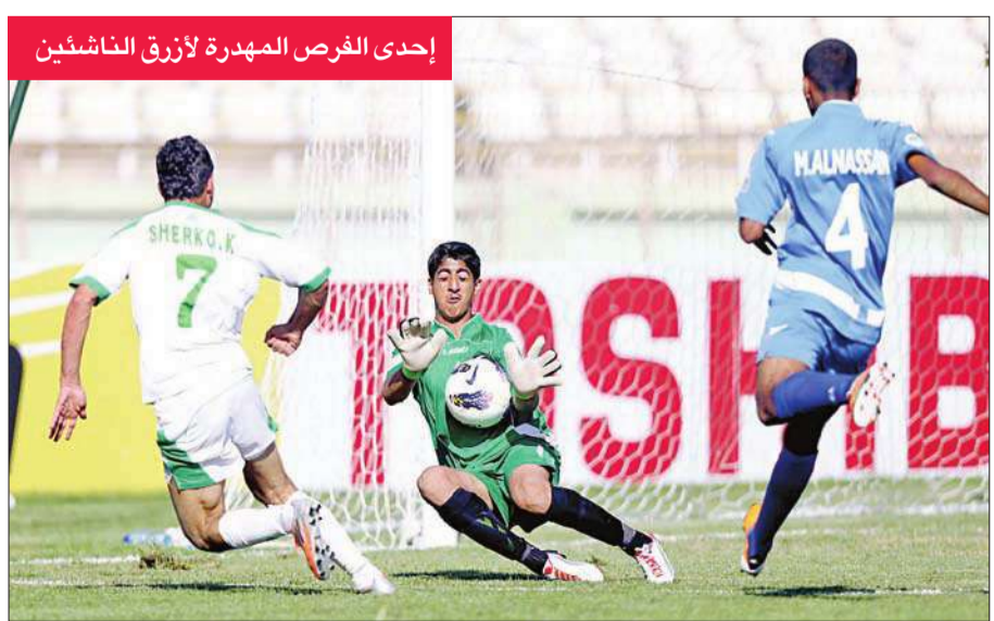
إحدى الفرص المهددة لأزرق الناشئين

تنتقل في السادسة من مساء اليوم منافسات الجولة الثالثة من بطولة دوري كرة القدم لفة تحت 22 سنة (الرديف)، حيث يلتقي في لقاء قمة القادسية مع اليرموك ولهما (6 نقاط) على استاد محمد الحمد، والذي يسعى خلاله كل منهما إلى إبعاد الآخر عن طريقه والإنفراد بصدارة البطولة. كما يلتقي النصر (6 نقاط) أيضاً مع السالمية ذي النقطة الوحيدة على استاد علي صباح السالم، ويطمع النصر في حصد نقاط اللقاء الثلاث على