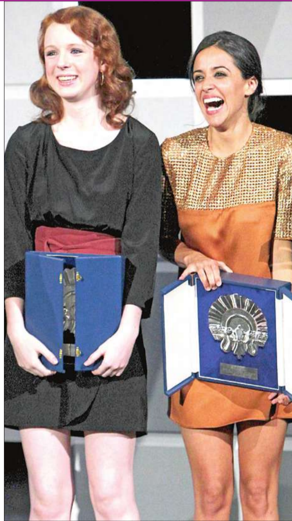
الإسبانية غارسيا والكندية كوزيني تحصلان على جائزة أفضل ممثلة مناصفة

وفازت الكندية كاتي كوزيني والإسبانية ماريانا غارسيا مناصفة بجائزة أفضل ممثلة. وشاركت كاتي كوزيني في فيلم «فوكس فاير» للمخرج الفرنسي لوران كانتيه حول تمرد مجموعة من الفتيات من الطبقة العاملة في المجتمع النيويوركي في خمسينيات القرن الماضي. وفازت ماريانا غارسيا عن دورها في فيلم «بلانكايفيس» لبايلو بيرغر. وكانت جائزة أفضل ممثل من نصيب الإسباني خوسيه ساكريستان لدوره في فيلم «إيل مويرتو إي سير فيليت» لخافيير ريبويو، وهو قاتل ماجور مصاب بسرطان في مرحلته النهائية. (سان سيستيان - أ ف ب)