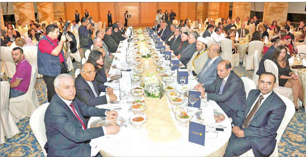
لقطة جماعية للحضور على مائدة الطعام الرئيسية