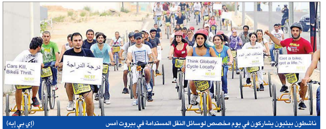
ناشطون بيئيون يشاركون في يوم المحصن لوسائل النقل المستدامة في بيروت أمس

الراعي يجدد رفضه قانون الـ 60... و«حزب الله» مع قانون يحترم الطائف