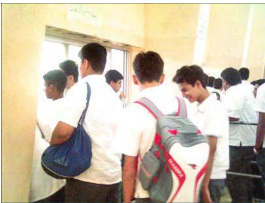
المقاصف المدرسية تحولت إلى مشاريع تجارية بعيداً عن الرقابة