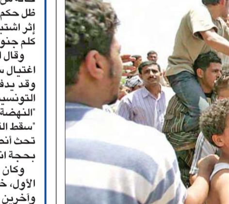
جانب من مواجهات طائفية في المنيا في 10 أغسطس 2011 (أرشيف)

مصرع قبطيين ومسلم في مشاجرة بالأسلحة وتهجير 11 أسرة قبطية