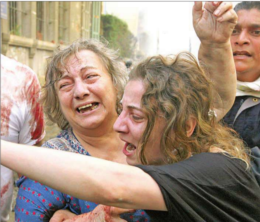
امراتان جريحتان تسالان عن عائلتيهما في موقع التفجير في الأشرفية أمس

سيارة مفخخة تنفجر في الأشرفية في وضح النهار • جنبلاط اتهم الأسد: أحرق سورية ويريد أن يحرق المحيط