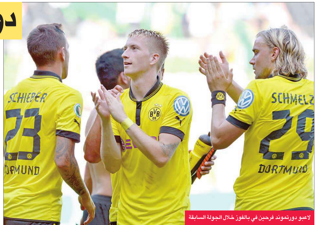
لاعبو دورتموند فرحين في الفوز خلال الجولة السابقة

يلتقي مساء اليوم بوروسيا دورتموند مع شالكه في مباراة مثيرة من الجولة الثامنة من عمر "البوندسليغا"، بينما يبحث بايرن ميونخ عن انتصار جديد لمواصلة صدارته والمحافظة على فارق 5 نقاط.