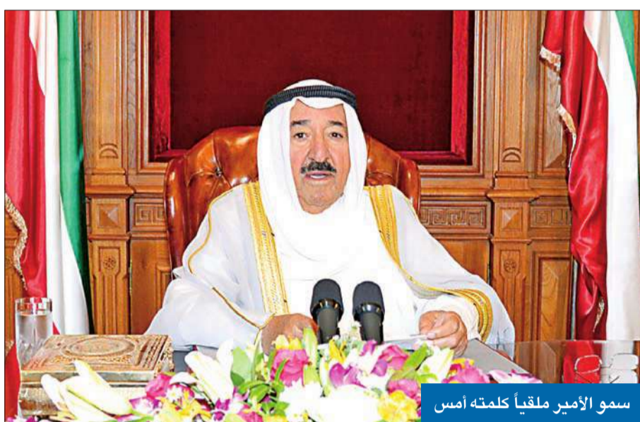
سمو الأمير ملقياً كلمته أمس

كما أعرب سموه عن المبهمة لما يراه من «إسفاف مقبوت في لغة الخطاب، وانحدار مشين في أخلاقيات التعامل والعمل العام، وخروج صارخ على القيم الموروثة والآداب المعهودة، وفجور في الخصومة، ورفض لحق الاختلاف وعدم احترام الرأي الآخر وتشنح في المواقف وغلو في التطرف واستمراء لنهج الفوضى والشغب، وتجاوز لكل الحدود المألوفة، وتماد في الطاول». وشدد سموه على عدد من النقاط التي لن يسمح بها قائلًا: «لن نقبل أبداً بتهديد أمن الكويت وإرهاب أهلها وتعطيل مسيرتها ولن نقبل بفوضى الشارع وشغب الغوغاء أن تشل حركة الحياة والعمل في البلاد. ولن نسمح لبدور الفتنة أن تنمو في أرضنا الطيبة. ولن نقبل بثقافة العنف والفوضى أن تنتشر بين صفوف شعبنا المسالم. ولن نقبل بتضليل الشباب المخلصين بالأوهام والافتراءات. ولن نقبل باختطاف إرادة الأمة بالأصوات الجوفاء والبطولات الزائفة».