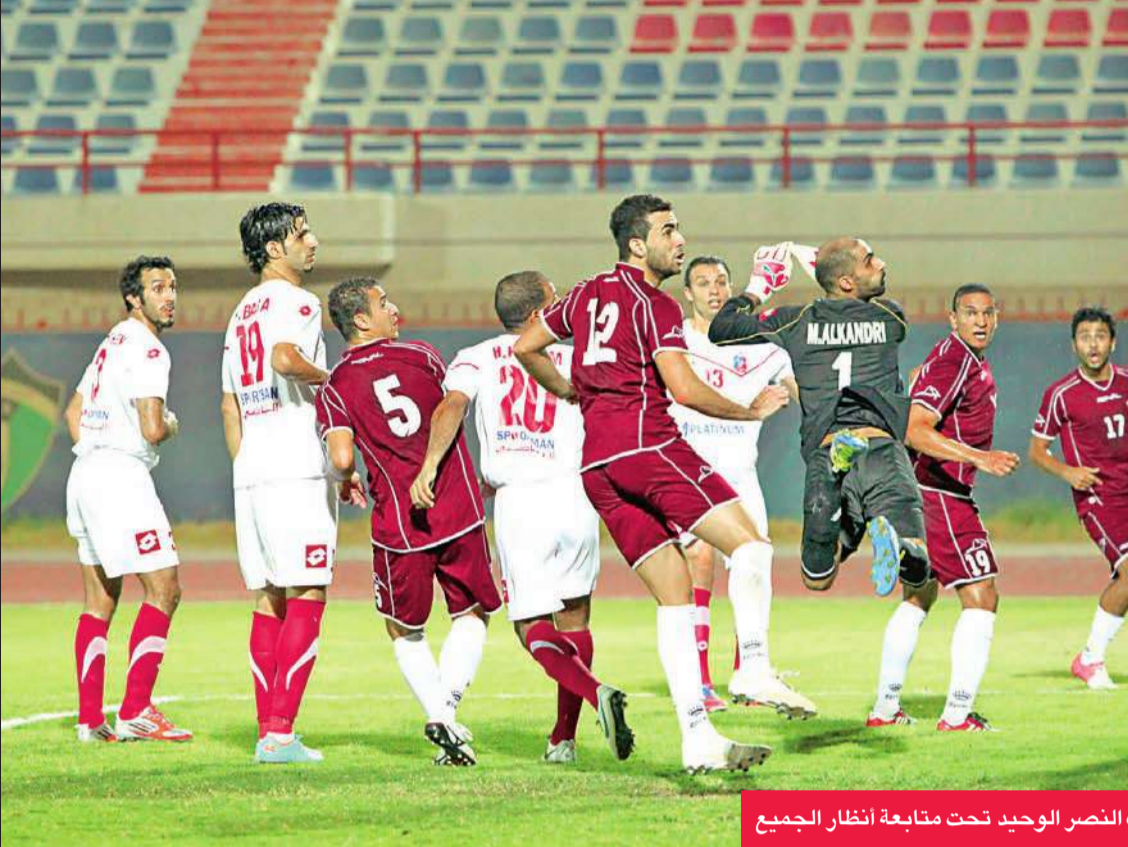
كرة المشيليج تلج شبك الكويت معلنة هدف النصر الوحيد تحت متابعة أنظار الجميع