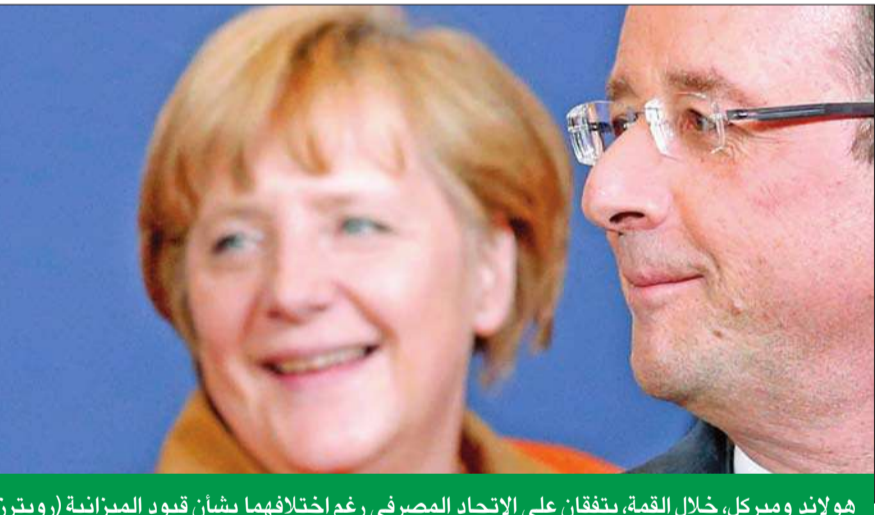
هولاند وميركل، خلال القمة، يتفقان على الاتحاد المصرفي رغم اختلافهما بشأن قيود الميزانية

توصل قادة الاتحاد الأوروبي مساء أمس الأول إلى اتفاق بشأن بدء تطبيق «تدريجي» للرقابة المصرفية في منطقة اليورو العام المقبل، بحسب ما أعلن متحدث باسم المفوضية الأوروبية. وقال أوليفييه بابيه على حسابه على موقع تويتر أن قادة الاتحاد الأوروبي توصلوا إلى «اتفاق على الإطار السياسي نهاية 2012 وتطبيق تدريجي في 2013».