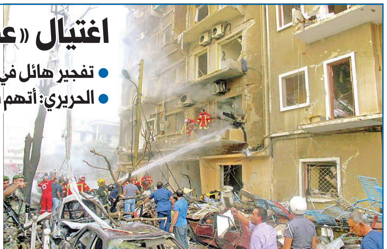
رجال إطفاء يحاولون إخماد النيران المشتعلة في موقع التفجير في بيروت أمس

كانت بيروت أمس على موعد جديد مع التفجيرات الكبيرة، التي عادت بعد غياب عدة سنوات لتضرب منطقة الأشرفية المسيحية مستهدفة هذه المرة رئيس شعبة المعلومات في قوى الأمن الداخلي العميد وسام الحسن، الذي قضى مع عدد آخر من المواطنين قُدر بثمانيه، في حين سقط نحو 100 جريح من المارة وسكان المنطقة. ووقع التفجير بواسطة عبوة زُرعت في سيارة، في شارع قريب من ساحة ساسين عند حوالي الساعة الثانية وأربعين دقيقة بعد ظهر أمس، أي في ساعة الذروة التي تصادف خروج التلاميذ من المدارس، ليدوي صوته في أرجاء العاصمة