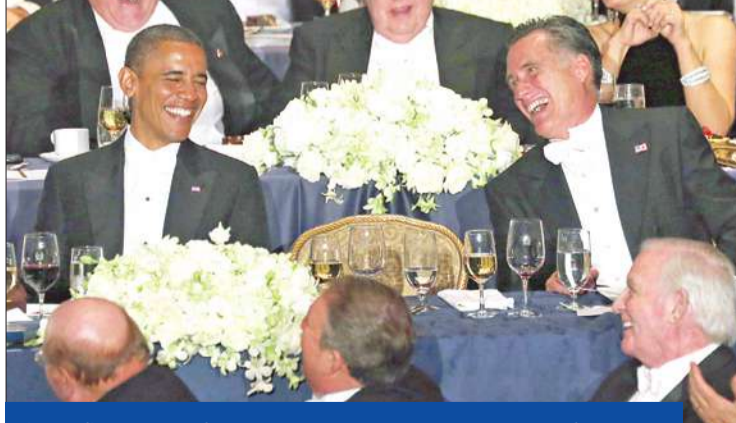
رومني وأوباما خلال حفل العشاء في نيويورك أمس الأول

مناظرة ثالثة في فلوريدا الاثنيين تتمحور حول الشؤون الخارجية