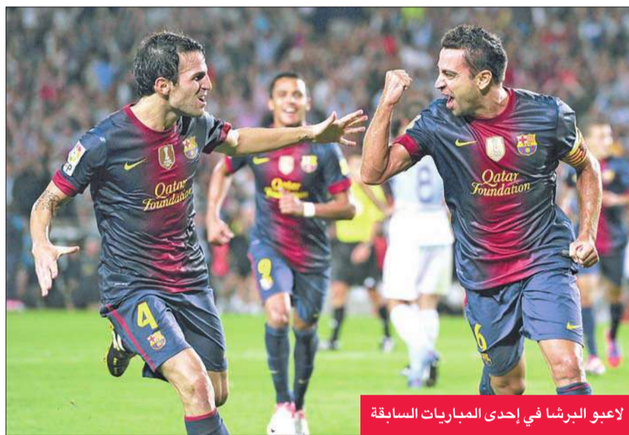
لاعبو البرشا في إحدى المباريات السابقة

البرتغالي جوزيه مورينيو، خصوصاً أنه بانتظار فريقه مباراة صعبة الأربعاء المقبل ضد بوروسيا دورتموند الألماني في دوري أبطال أوروبا. وفي المباريات الأخرى، يلعب اليوم ملقة مع بلد الوليد، وفالنسيا مع أتلتيك بلباو.