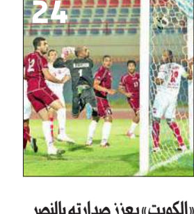
«الكويت» يعزز صدارته بالنصر