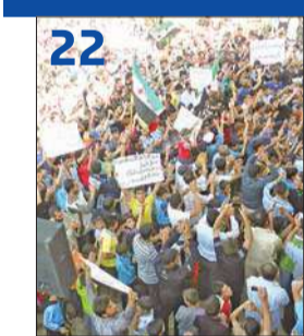
الإبراهيمي يصل إلى دمشق في مهمة صعبة