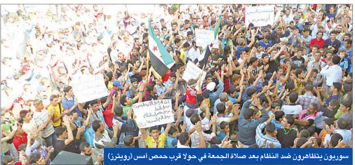
سوريون يتظاهرون ضد النظام بعد صلاة الجمعة في حولا قرب حمص أمس

الطيران الحربي السوري يواصل غاراته على معرة النعمان