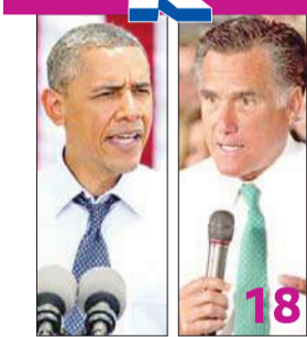
Obama Vs Romney