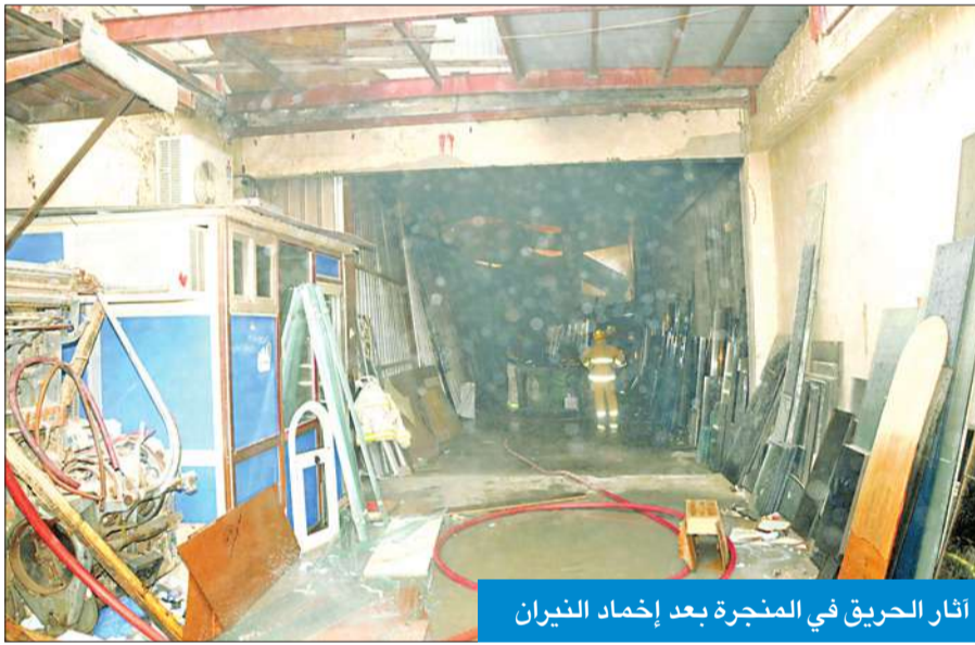
أثار الحريق في المنجرة بعد إخماد النيران

«الإنقاذ البحري» أنقذ أسرة بعد غرق يختها في رحلة بحرية