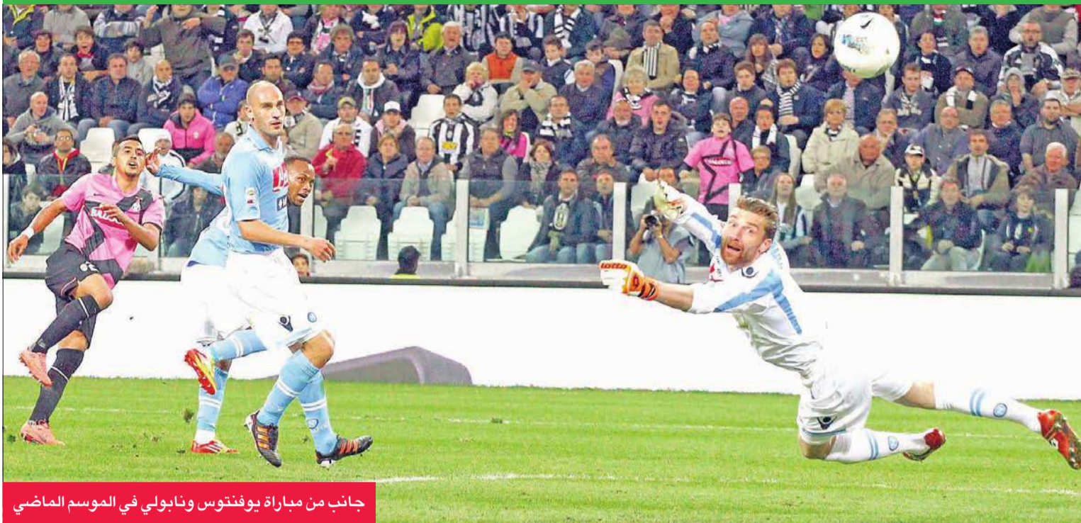
جانب من مباراة يوفنتوس و نابولي في الموسم الماضي

ونابولي، لأنه لا يتخلف عنهما إلا بفارق 4 نقاط، لكن الأول يخوض اختباراً صعباً جداً أمام ضيفه الجريح ميلان، بينما سيكون بانتظار الثاني مباراة سهلة على أرضه أمام كاتانيا يدخل إليها بمعنويات جيدة، بعد أن خرج فائزاً في المرحلة السابقة من دربي ميلانو أمام "روسونيري" بهدف لالارجنتيني ولتر صامويل الذي عقد من مهمة فريق المدرب ماسيميلياو الغيري بعد أن أوقف رصيده عند 7 نقاط في المركز الحادي عشر.