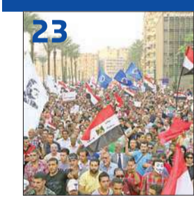
تظاهرات تستقبل مرسي في مطروح وتطوفه في «التحرير»