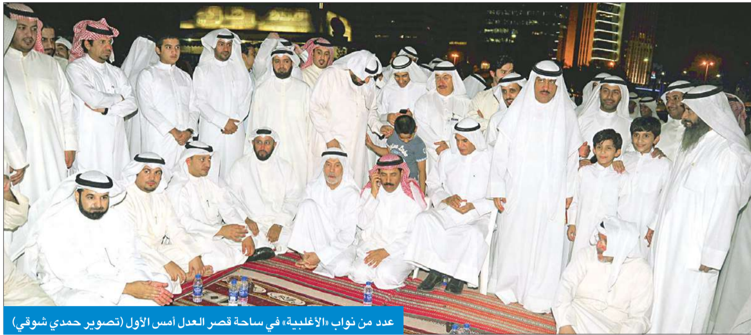
عدد من نواب «الأغلبية» في ساحة قصر العدل أمس الأول

نواب سابقون: استقزاز واستخفاف إجراء التلفزيون مقابلة مع الرئيس الإيراني