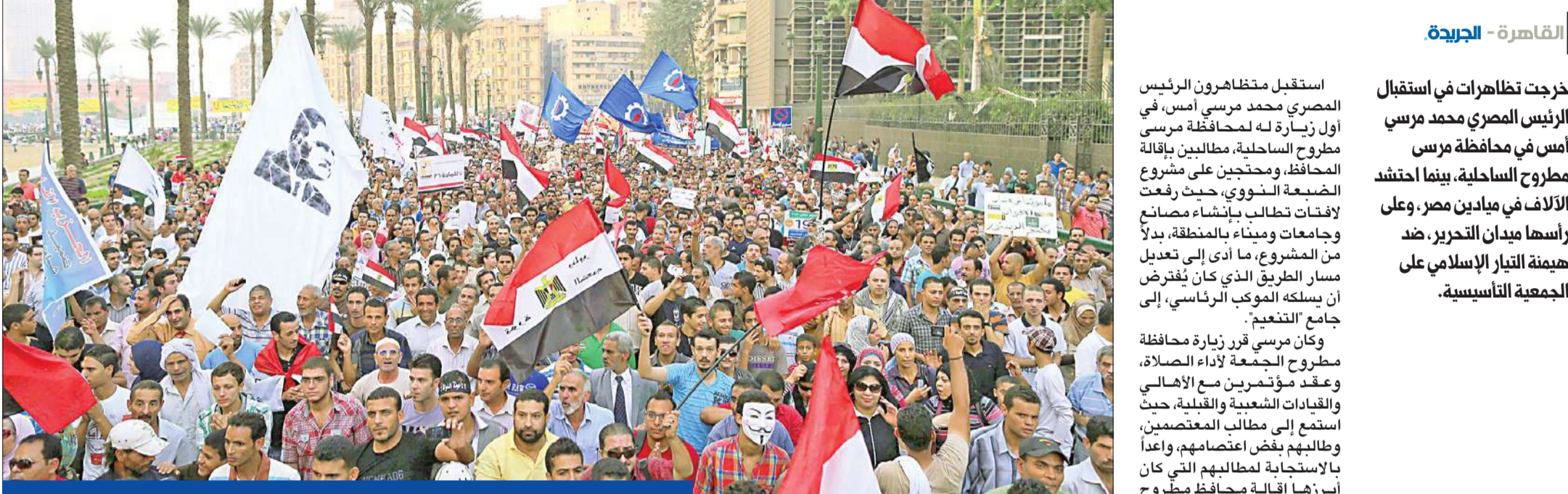
جانب من التظاهرات الحاشدة ضد «الإخوان» في ميدان التحرير وسط القاهرة أمس

الرئاسة تعترف برسالة «الود» لبييريز • الكتاتني يفوز برئاسة حزب «الحرية والعدالة»