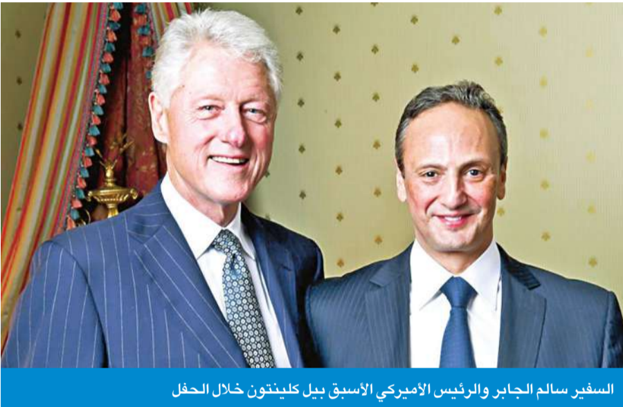
السفير سالم الجابر والرئيس الأسبق بيل كلينتون خلال الحفل

أقامت حفلاً خيرياً حضره كليتون وشخصيات رسمية