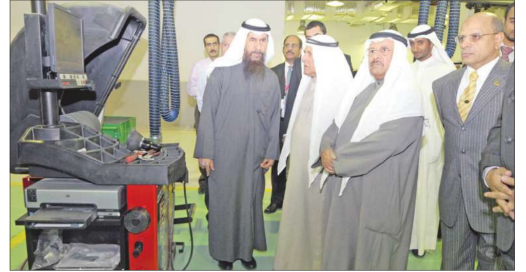
جولة في المركز الجديد