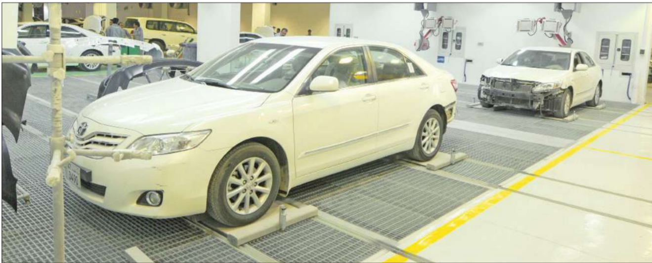
مركز خدمة «تويوتا» مجهز بأحدث الأجهزة