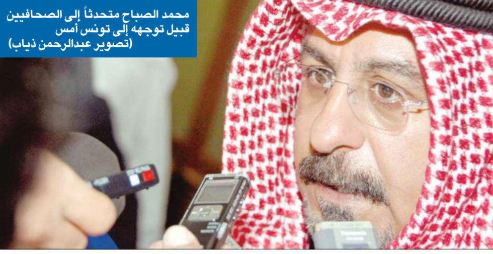
محمد الصباح متحدثاً إلى الصحفيين قبيل توجهه إلى تونس أمس

رحب بكلمة زبياري في الأمم المتحدة وبكلمات الأعضاء في مجلس الأمن