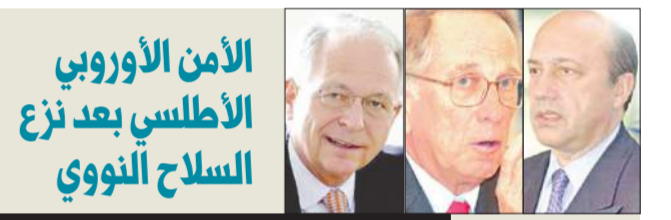
إيغور إيفانوف-سام نان- فولغاغ إيشنغر*

الدستوريين والقانونيين في الحكومة أكدوا إمكان الرد على المحور، مشيرة إلى أن التقرير النهائي حول الاستجواب سينتهي مع نهاية الأسبوع الجاري. وعلى الصعيد النيابي، توقع النائب فلاح الصواعغ أن يصل العدد المؤيد لكتاب عدم التعاون إلى 25 نائباً، أو يتقلص إلى 16، نافياً أن يكون نواب «إلا الدستور» قد بدأوا جمع التواضع الخاصة بعدم التعاون. وجددت كتلتا «العمل الوطني» و«التنمية»