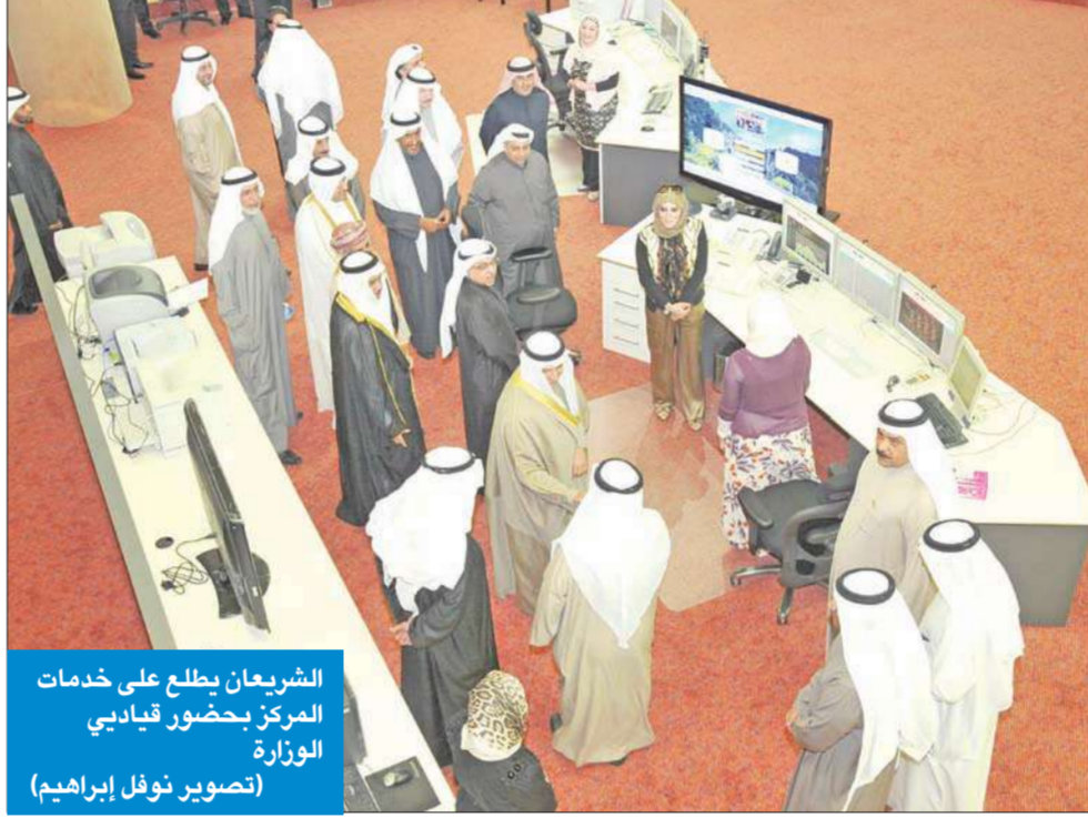
الشريعان يطالع على خدمات المركز بحضور قياديي الوزارة

افتتح وزير الكهرباء والماء د. بدر الشريعان مشروع ربط التحكم الوطني بالربط الكهربائي الخليجي مشيراً إلى أن المشروع يؤدي إلى رفع كفاءة التشغيل والاستغلال الأمثل للطاقة المتاحة.