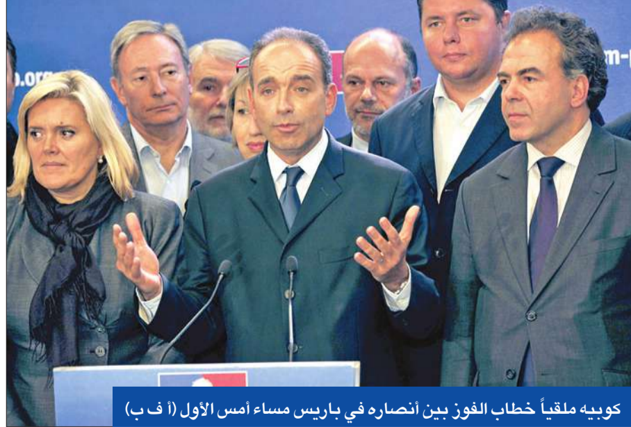
كوبيه ملقياً خطاب الفوز بين أنصاره في باريس مساء أمس الأول

أصبح جان فرانسوا كوبيه (48 عاماً) رسمياً أمس، رئيساً لـ«الاتحاد من أجل حركة شعبية» الحزب اليميني الرئيسي المعارض في فرنسا، بتخطيه رئيس الوزراء السابق فرانسوا فيون في انتخابات تنازع عليها حتى النهاية هذان الوريثان السياسيان للرئيس الفرنسي السابق نيكولا ساركوزي، لرئاسة الحزب وهو منصب أساسي يمهّد للانتخابات الرئاسية المقبلة في عام 2017، دون أن يعني أن الرئيس سيكون حتماً المرشح الرئاسي اليميني الفرنسي.