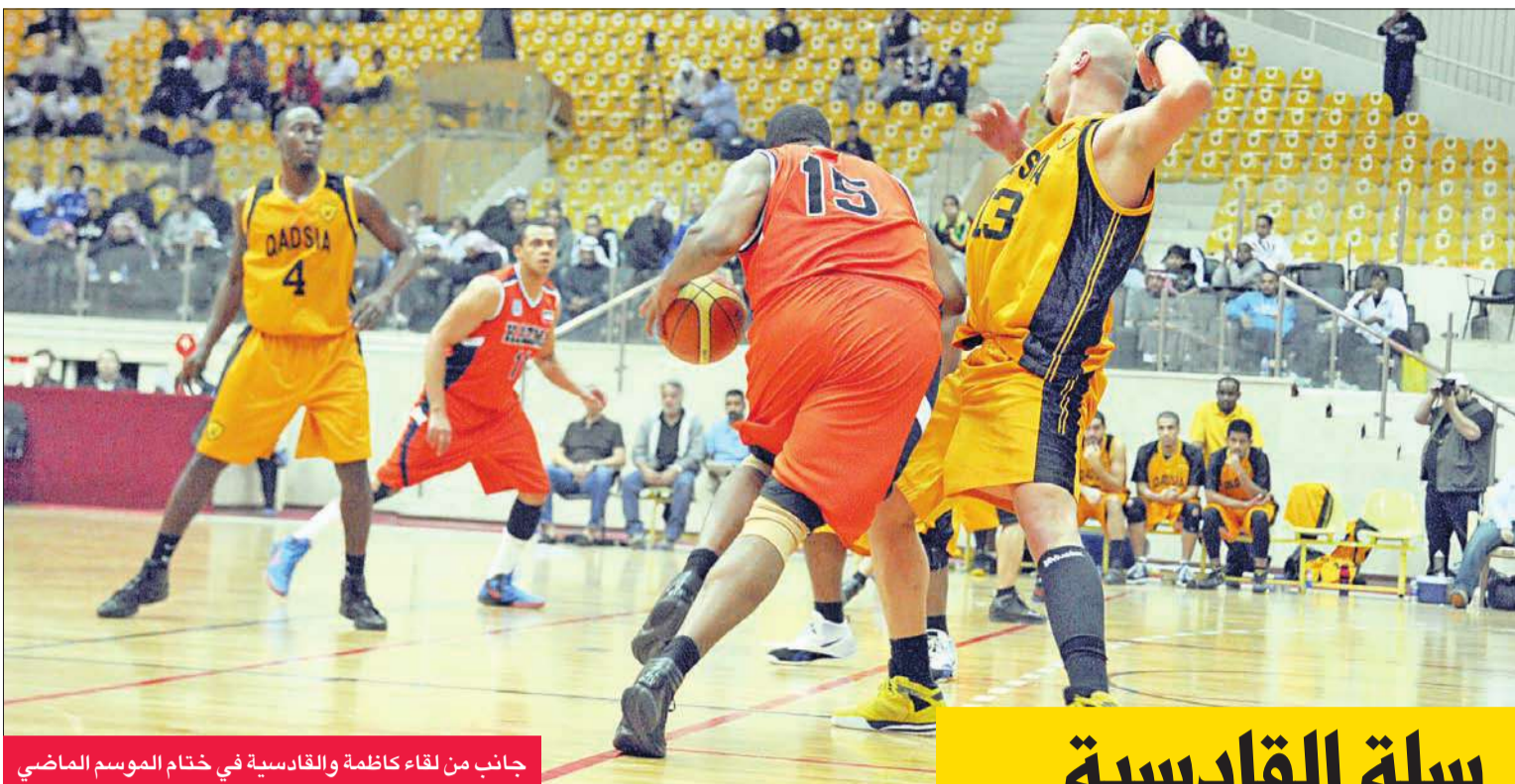
جانب من لقاء كاظمة والقادسية في ختام الموسم الماضي