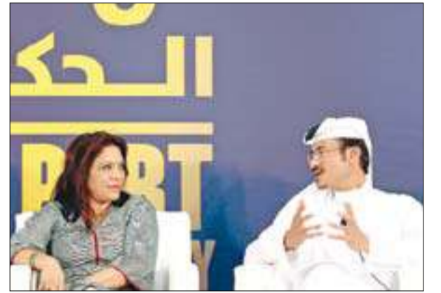
المخرجة ميرا ناير في حلقة نقاشية خاصة عن فيلم «الأصولي المتعدد»