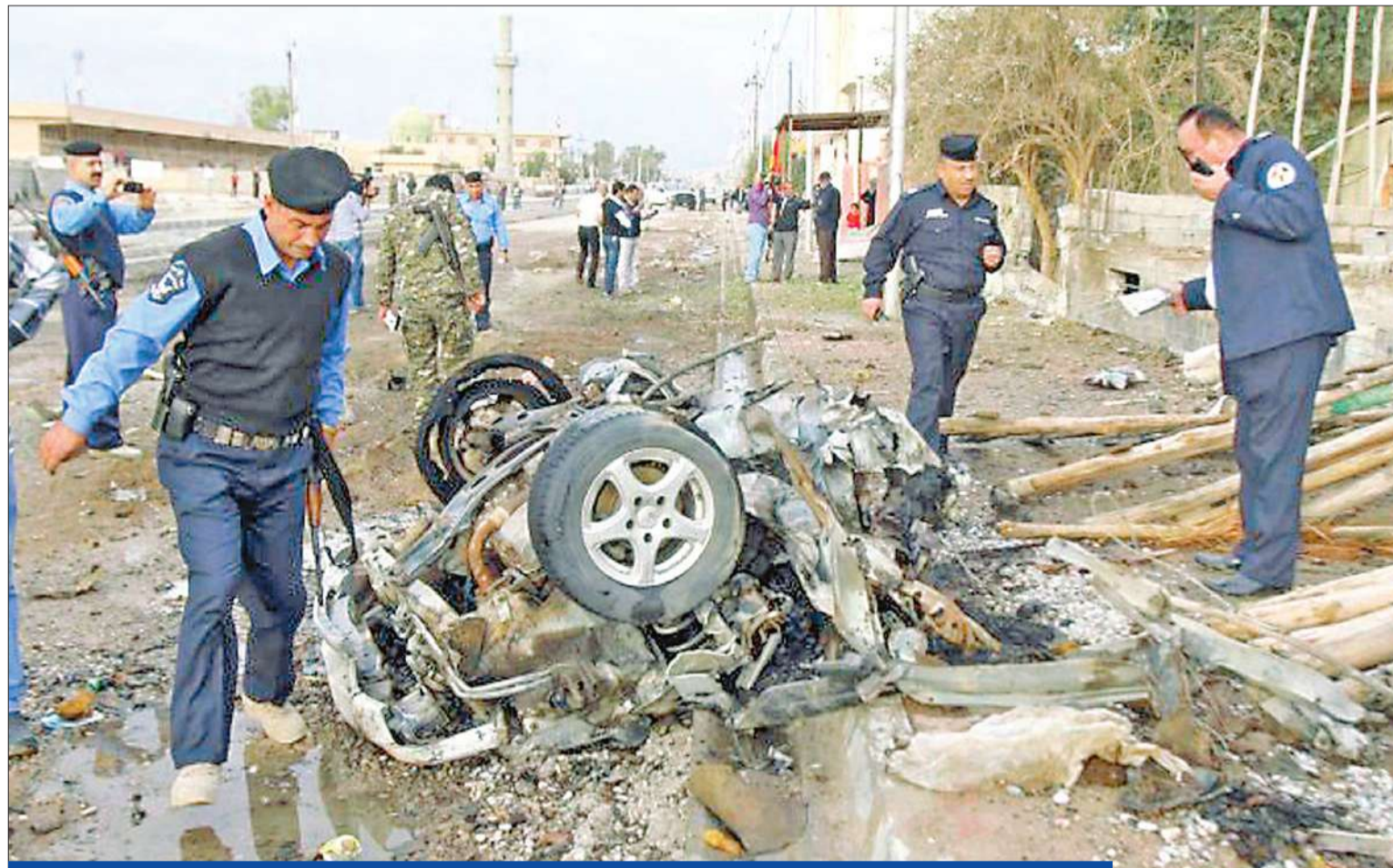
أدى انفجار سيارة مفخخة في مدينة كركوك إلى جرح 12 شخصاً، وفي الصورة الشرطة العراقية تتفقد موقع الانفجار أمس

أعلن المتمردين في «حركة ام 23» أنهم سيطروا على مدينة غوما شرق الكونغو الديموقراطية التي دعا رئيسها جوزف كابيلا السكان إلى «التعبئة» وتوجه إلى أوغندا للتحضير لجلسة قمة لأمم المتحدة حول الأزمة الكونغولية. وقد وصل زعيم الحركة الجنرال سلطاني ماكينغا ظهر أمس إلى المدينة وتوجه بسيارة جيب في عدد من مناطقها. وأكد الناطق العسكري باسم «حركة ام 23» أن قوات الحركة «تسيطر على مدينة غوما عاصمة إقليم كيفو الشمالي شرق الكونغو الديموقراطية وتطارد العدو». وفي غيسيني قتل مصادر أن المتمردين في غوما تمكنوا من السيطرة على مركزين حدوديين مع مدينة غيسيني الرواندية المجاورة، كما ذكر صحافي من «وكالة فرانس» على الجانب الرواندي من الحدود. (غوما - أ ف ب)