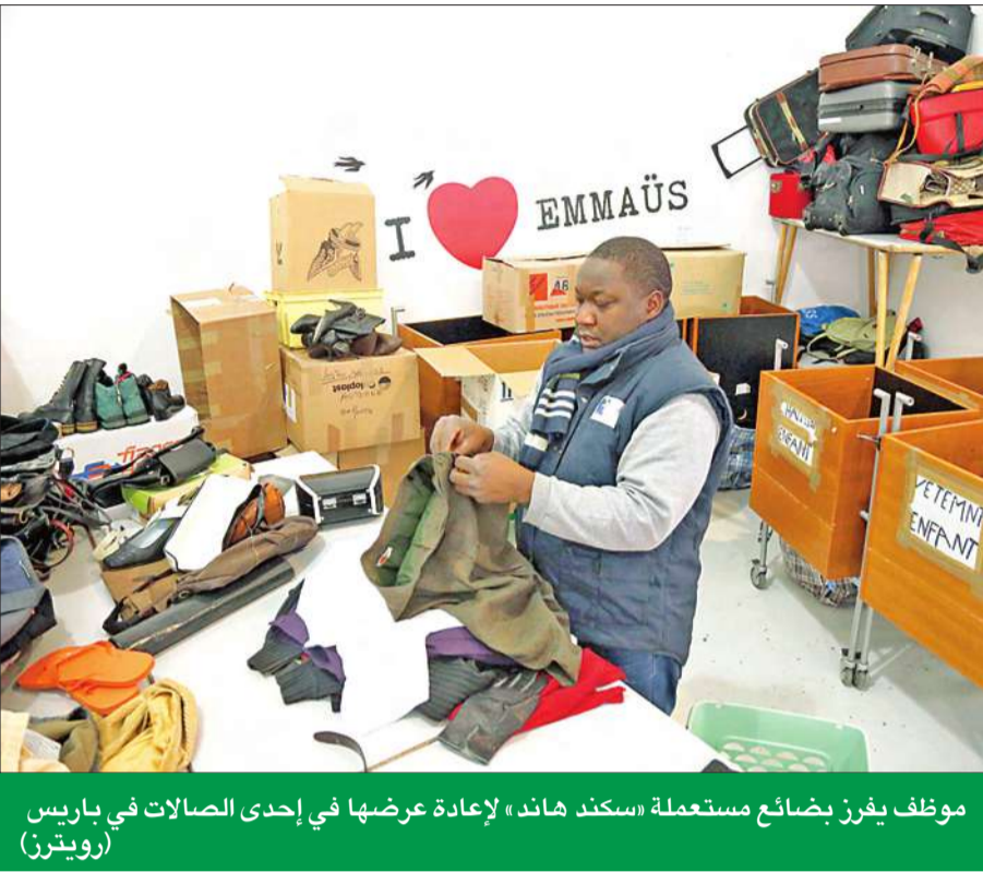
موظف يفرز بضائع مستعملة «سكند هاند» لإعادة عرضها في إحدى الصالات في باريس

بعد فرنسا... الدور على بريطانيا في خطوة تبدو متوقعة أوائل الشهر القادم