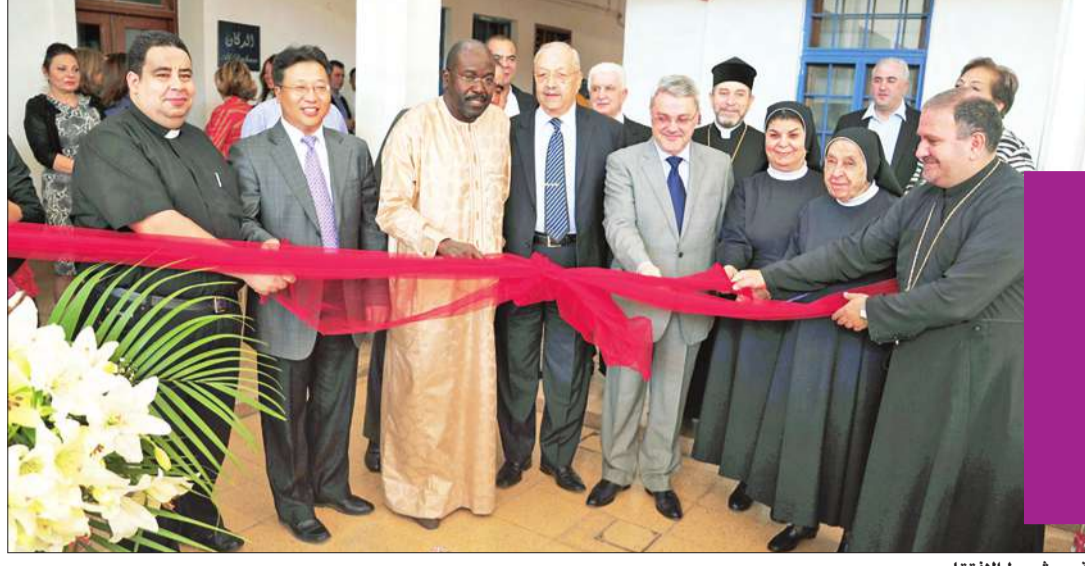
قص شريط الافتتاح