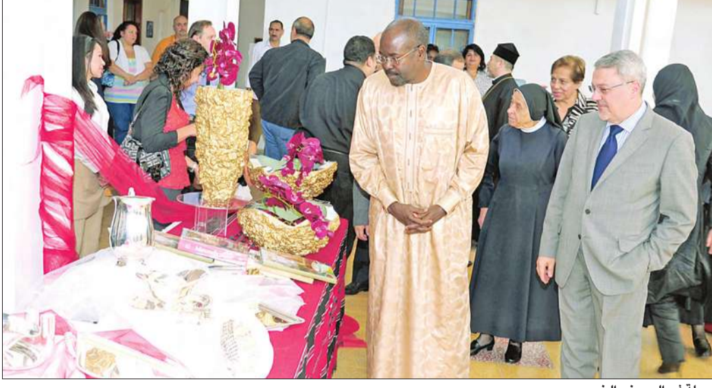
جولة في المعرض الخيري