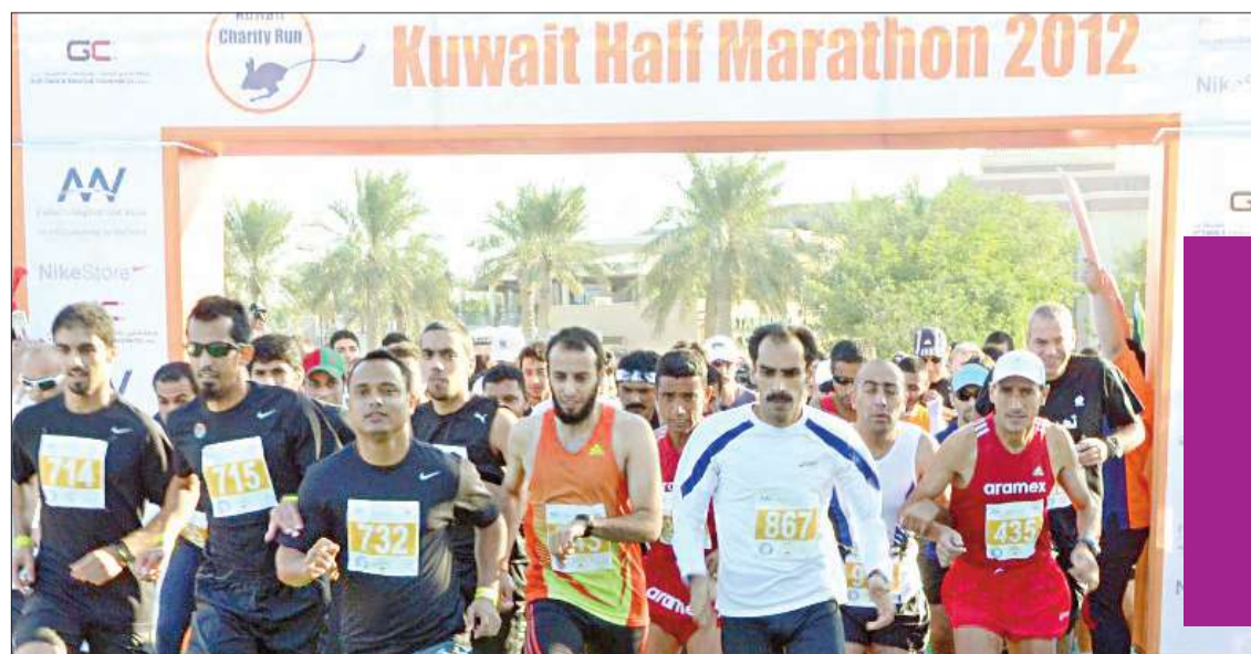
الانطلاق من الماريننا

انطلق الماراثون الخيري الثاني من 'الماريننا'، تحت رعاية وزير الإعلام وزير الدولة لشؤون مجلس الوزراء الشيخ محمد عبدالله المبارك. ويهدف الماراثون، الذي يأتي في إطار الاحتفال باليوم العالمي للسكركي، إلى نشر التوعية الصحية ودعمها، إضافة إلى مساعدة مجموعة 'كي أن' لحملة أطفال Pumps4kids لمريضى السكركي.