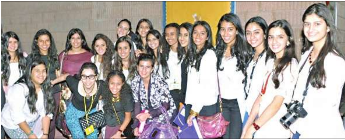
طالبات مشاركات في المؤتمر