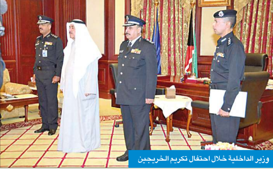
وزير الداخلية خلال احتفال تكريم الخريجين

استقبل النائب الأول لرئيس مجلس الوزراء وزير الداخلية الشيخ أحمد الحمود أمس غسان عبدالباري الزواوي سفير دولة الكويت لدى جمهورية أذربيجان، حيث تم خلال اللقاء تبادل الأحاديث الودية. ثم استقبل الحمود، بحضور وكيل وزارة الداخلية الفريق غازي العمر ووكيل وزارة الداخلية المساعد لشؤون التعليم والتدريب الفريق أحمد النواف، ومدير عام أكاديمية سعد العبدالله للعلوم الأمنية بالإتابة العميد هارون العمر، تسعة من خريجي الكلية البحرية