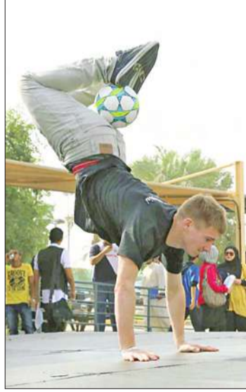
فكرة من العرض

أقامت الكلية الأسترالية في الكويت مهرجان الماكولات الأول على مدى ثلاثة أيام، ضمن سلسلة أنشطتها الاجتماعية والرياضية بمقر الكلية في غرب مشرف، وقد تضمن المهرجان مجموعة من الفعاليات بمشاركة أشهر مطاعم الكويت.