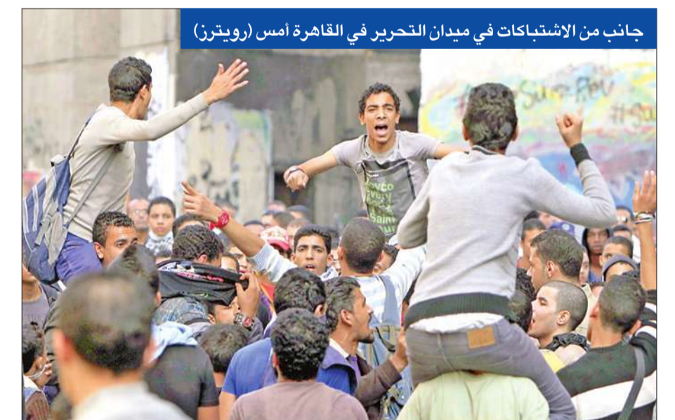
جانب من الاشتباكات في ميدان التحرير في القاهرة أمس

وعادت إلى ميدان التحرير مجدداً أمس، مشاهد الكر والفر ورائحة دخان قتال الغاز المسيل للدموع وهتافات المتظاهرين «الشعب يريد إسقاط النظام». بعد قليل من بدء الاحتفال بالذكرى الأولى لأحداث شارع محمد محمود، للمطالبة بمحاكمة المتسببين في الحادث، الذي راح ضحيته، العام الماضي، ما يزيد على خمسين شهيداً، وفقد فيه نشاط أعينهم، إثر إصابتهم بطلقات خرطوش. عقب محاولة قوات الشرطة فض اعتصام في ميدان التحرير بالقوة. وبينما قالت مصادر من وزارة الصحة إن 44 مصاباً سقطوا من جراء الاشتباكات في صفوف المتظاهرين، قال مصدر مسؤول بالمركز الإعلامي بوزارة الداخلية، إن الأجهزة الأمنية ضبطت 19 من مثيري الشغب والحرضين على أعمال الاعتداءات في أحداث محمد محمود، أمس، لافتاً إلى أن الاعتداءات أسفرت عن إصابة 29 من رجال الشرطة