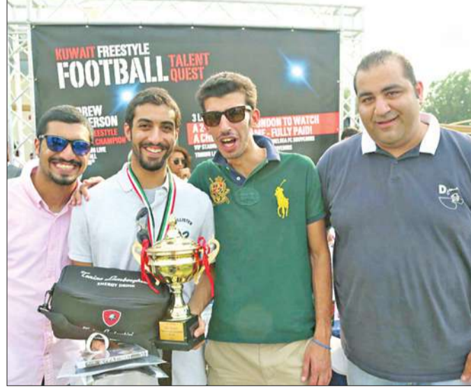
مشاركون في المهرجان