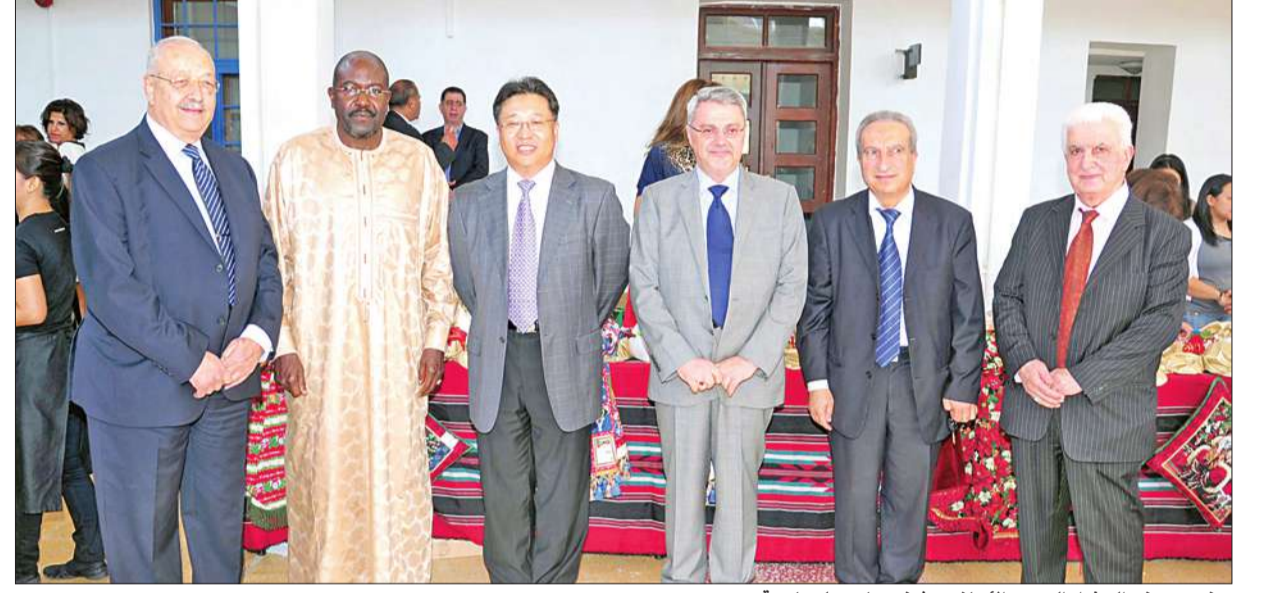
حضور بعض السفراء العرب والأجانب وشخصيات دبلوماسية