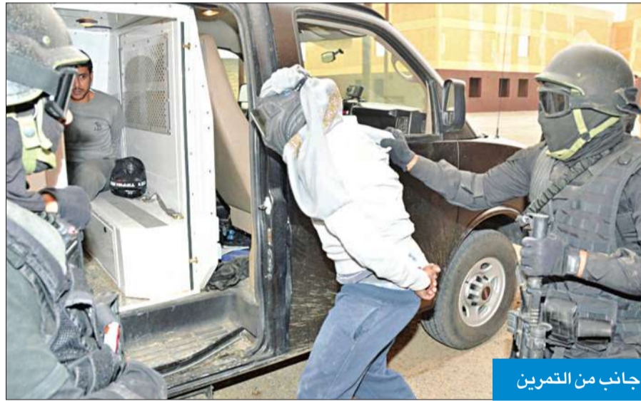
جانب من التمرين

شن رجال أمن محافظة الجهراء حملة أمنية على المستهترين أسفرت عن ضبط 14 شاباً تم حجزهم ومركباتهم بامر مدير الأمن اللواء إبراهيم الطراح. واكد مصدر أمني أنه استمرارا لشن الحملات على مستوى المحافظة ضد المستهترين الذين يقومون بتعطيل حركة المرور بعمليات الاستهتار إضافة إلى ازعاج أهالي بعض المناطق السكنية، فقد تم تشكيل