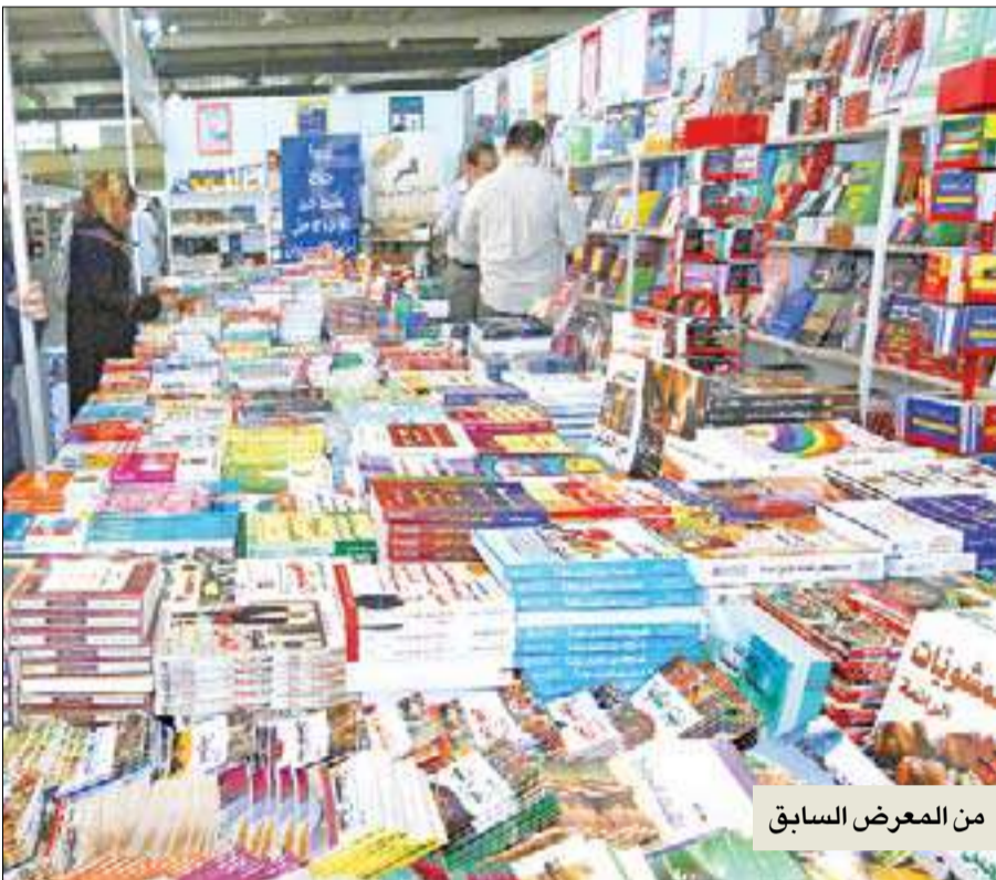
من المعرض السابق

ويشمل المعرض مجموعة اجنحة أخرى، منها جناح المجلس الوطني للثقافة والفنون والآداب، ويتضمن إصدارات المجلس الوطني المختلفة التي تحظى بإقبال شديد، كما يستطع الزائر خلال فترة المعرض الحصول على نسخ الأعداد القديمة من السلاسل المختلفة، إضافة إلى السلاسل التراثية ومعجم تاج العروس، وكذلك جناح الصحافة المحلية. إلى ذلك، تستمر ديوانية الناشرين العرب للعام الرابع على التوالي، نظراً إلى وجود عدد كبير من الناشرين العرب وأعضاء اتحاد الناشرين، بهدف إتاحة الفرصة للناشرين العرب للقاء زملائهم في الكويت، وعقد الحوارات وتبادل الأفكار