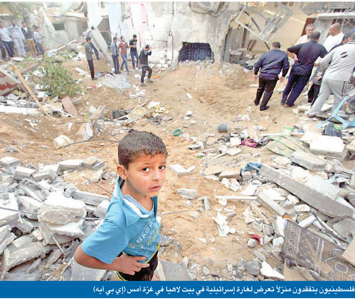
فلسطينيون يتفقدون منزلاً تعرض لغارة إسرائيلية في بيت لاهيا في غزة أمس

بعد مرور نحو أسبوع على بدء العدوان الإسرائيلي على غزة، تم التوصل أمس إلى اتفاق تهدئة جديد بين حركة حماس التي تحكم القطاع وإسرائيل، بضمانة مصرية. وأكد القيادي في حركة "حماس" أيمن طه أنه تم التوصل إلى اتفاق للتهدئة، في حين أفادت مصادر فلسطينية أن الاتفاق، الذي دخل حيز التنفيذ منتصف ليل الثلاثاء، الأربعاء، يقضي ببدء التسهيلات على المعابر. وتتضمن أبرز بنود الاتفاق، حسب المصادر، وقف كل العمليات العسكرية من الجانبين بما في ذلك الإغتيالات. وكان الرئيس المصري محمد مرسى أعلن في وقت سابق أمس، أن "مهزلة العدوان الإسرائيلي على غزة ستنتهي اليوم"، متوقعاً التوصل إلى تهدئة "خلال الساعات القليلة القادمة". في المقابل، صرح رئيس الوزراء الإسرائيلي بنيامين نتانياهو أمس، أن إسرائيل "تعدّ بدأ للسلام وتشهر سيفاً بالأخرى". ونقل بيان صادر عن مكتب نتانياهو قوله: "يدنا ممدودة