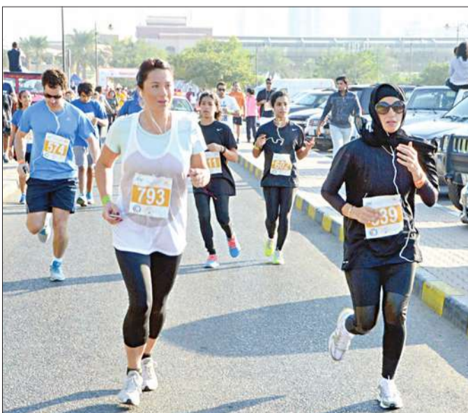
جانب من الماراثون

انطلق الماراثون الخيري الثاني من 'الماريننا'، تحت رعاية وزير الإعلام وزير الدولة لشؤون مجلس الوزراء الشيخ محمد عبدالله المبارك. ويهدف الماراثون، الذي يأتي في إطار الاحتفال باليوم العالمي للسكركي، إلى نشر التوعية الصحية ودعمها، إضافة إلى مساعدة مجموعة 'كي أن' لحملة أطفال Pumps4kids لمريضى السكركي.