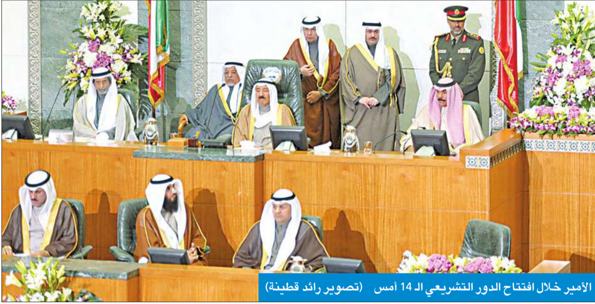
الأمير خلال افتتاح الدور التشريعي الـ 14 أمس

للشباب، حيث إن سموه الداعم الأول للشباب الكويتي والمستمع لكل ما يطرحونه، مشيراً إلى أن ذلك يظهر جلياً في كل تشكيل حكومي بوجود الوزراء الشباب.