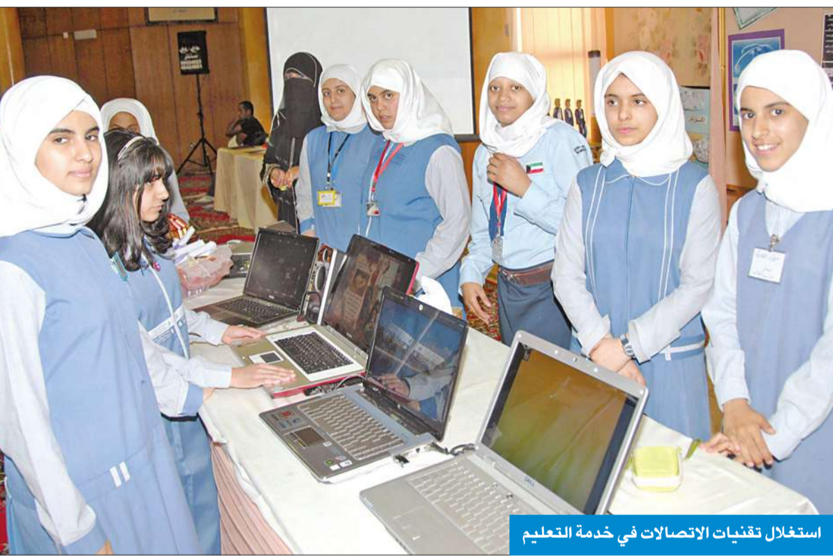
استغلال تقنيات الاتصالات في خدمة التعليم

من جانب آخر، نظم نادي الاحمدي المدرسي المسائي برنامج «جيكسو ايكاس وزكيد» لتنمية مهارات العد الرياضي للمسائل الحسابية، ويعتمد على تعلم المشاركين عملياً الجمع والطرح من 1-99 باستخدام تقنيات الاصابع تمهيداً لاستخدام العداد الضمني «Abacus»، ثم يتم تدريبه على الطابوقة وتمكينه من التفوق في الرياضيات بسرعة فائقة وطريقة مرحة وسهلة ذهنياً