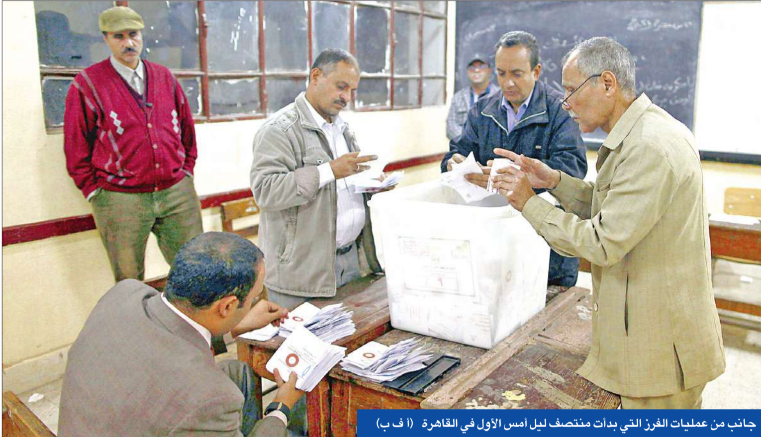
جانب من عمليات الفرز التي بدأت منتصف ليل أمس الأول في القاهرة