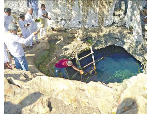
من مراسم تغيير حقبة زناة المايا

بدات مساء أمس الاول في شبه جزيرة يوتاكان بالمكسيك المراسم الخاصة بتغيير حقبة المايا، في ختام مرحلة من 5200 سنة، يفسرها البعض بأنها نبوءة بنهاية العالم، حسبما افاد مصور وكالة فرانس برس. وتدنن المراسم والفعاليات، التي تبلغ ذروتها في 21 ديسمبر، بتقديمات إلى إله القمر لدى المايا «إيختشيل» في كهف يقع في بلدة نوك-الك، قرب ميريدا عاصمة مقاطعة يوتاكان (شرق)، وقدم الهنود المشاركون في الاحتفالات خصوصاً الذرة إلى إيختشيل، رمز الخصوبة في ديانة المايا. وسيكون مطلع حقبة المايا الجديدة موضع احتفالات في جنوب المكسيك وفي أربع دول أخرى، حيث لا يزال تأثير ثقافة المايا مستمرا، هي غواتيمالا وبيليز وسلفادور وهندوراس، ويشكل تاريخ 21 ديسمبر نهاية المرحلة من أكثر من خمسة آلاف سنة بحسب زناة المايا، بدأت في عام 3114