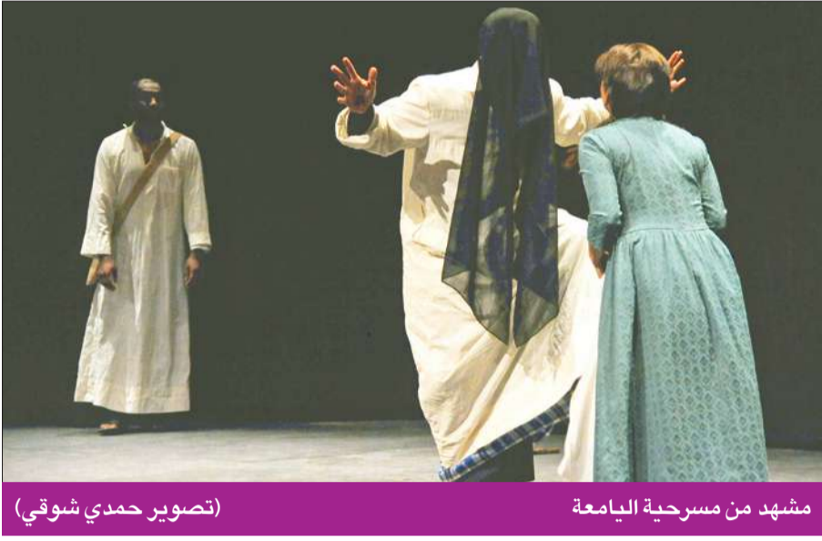
مشهد من مسرحية اليامعة

وقد احسن المخرج والمؤلف عندما غيرا عنوان العمل من «محمل ومطرفة» إلى «اليامعة» باعتباره المحور الأساسي للعرض. جسد عرض «اليامعة» صراعاً بين شابين «عفلنقي» و«خاوط» على فتاة هي ابنة عم الأول من أجل الفوز بزواجها، لكن والدها «مصرقة» يرفض ابن أخيه بسبب الفسيدة الغزلية التي أطلقها «عفلنقي» في ابنة عمه، وينتهز