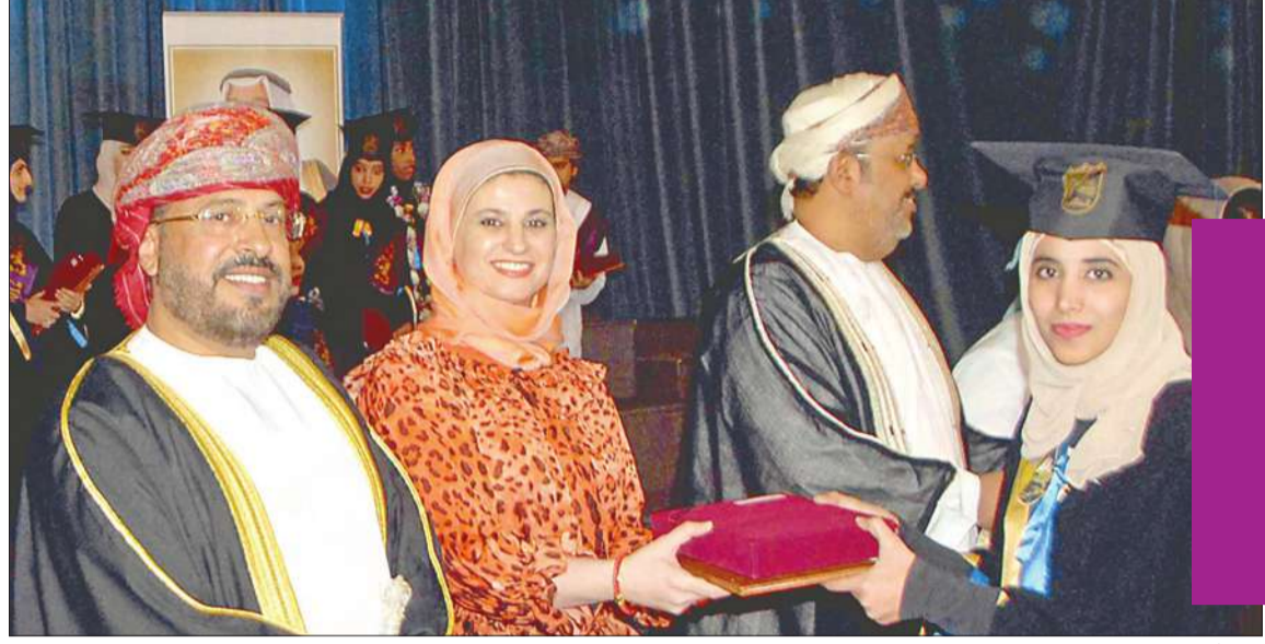
المعشني يكرم إحدى الخريجات