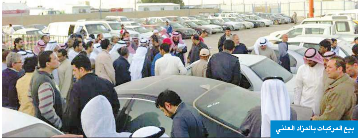
بيع المركبات بالمزاد العلني

أقامت وزارة الداخلية، ممثلة في الإدارة العامة للمرور، وبالشراكة مع وزارة المالية، مزاداً علنياً لبيع 130 مركبة محجوزة على ذمة مخالفات مرور في منطقة حجز المركبات بميناء عبدالله، بقيمة 61.360 ألف دينار.