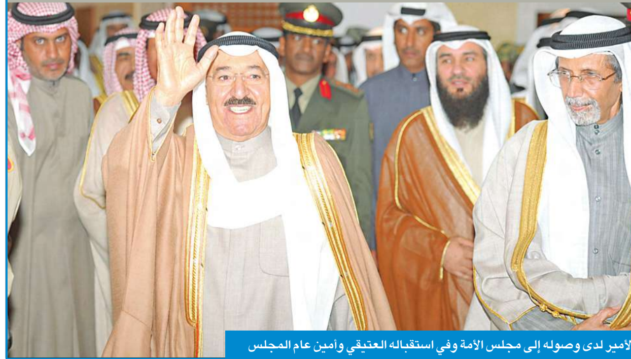
الأمير لدى وصوله إلى مجلس الأمة وفي استقباله العتيقي وأمين عام المجلس

التي تعيق أداء دوره الحيوي في التشريع الايجابي والرقابية الموضوعية الجادة والنأي به عن النزعات الطائفية والقبلية والفئوية والمصالح الضيقة وضمان الارتقاء بلغة الحوار وتجاوز الجدل العقيم الذي يبذل الجهد والوقت والطاقات والعمل على احترام الحدود الفاصلة بين السلطات وتفصيل التعاون الحتمي البناء مع الحكومة لانزاله كل اسباب الاحتقانات التي تعرقل تكامل الجهود وانسجامها وتدفع عجلة الانجاز.