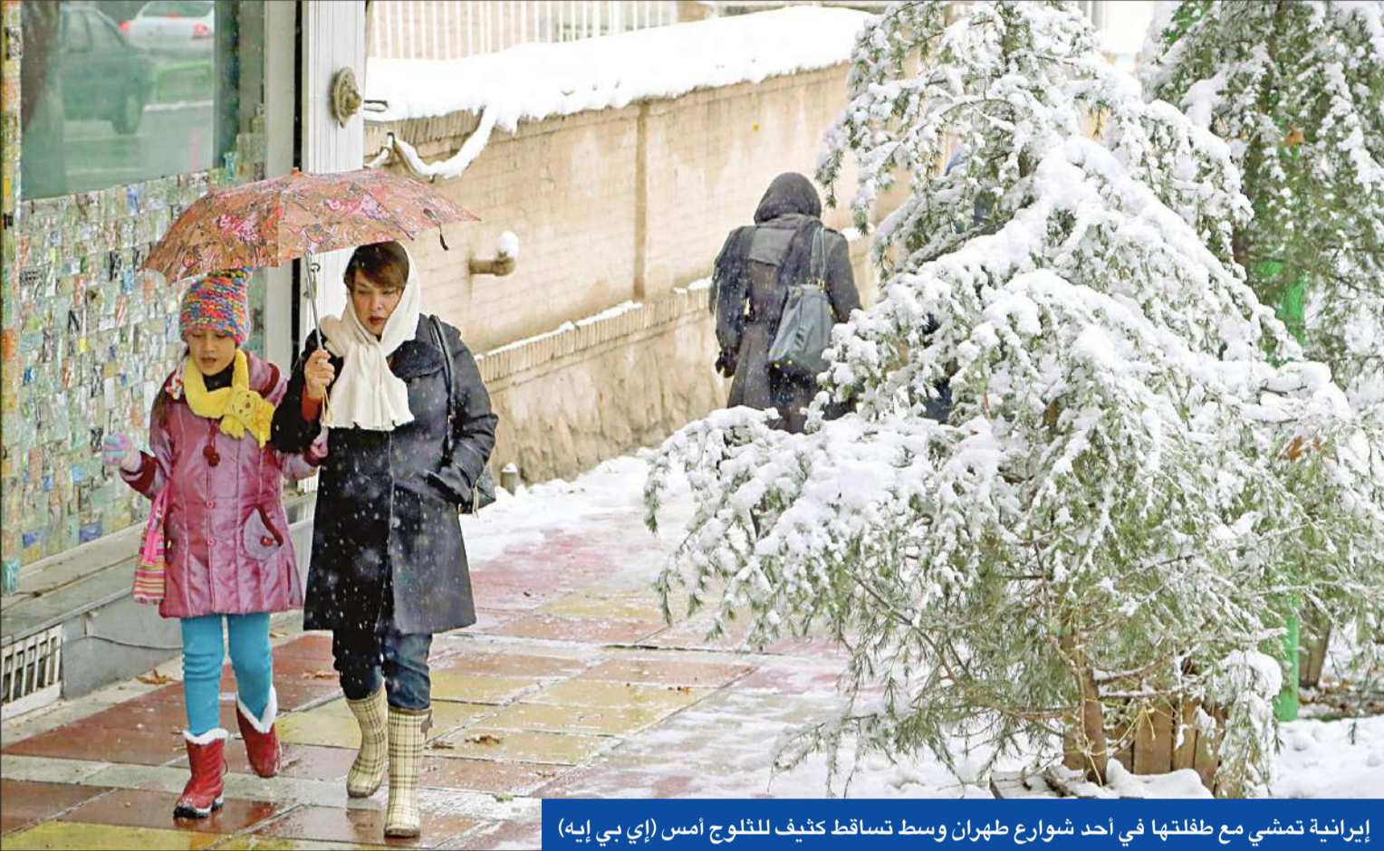
إيرانية تمشي مع طفلتها في أحد شوارع طهران وسط تساقط كثيف للثلوج أمس

● إيران: الاتحاد الأوروبي بات أداة لتنفيذ سياسة واشنطن ● سياري: سفننا رست في 4 بلدان عربية