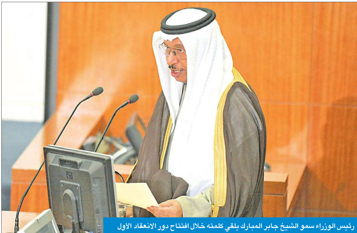
رئيس الوزراء سمو الشيخ جابر المبارك يلقي كلمته خلال افتتاح دور الانعقاد الأول

«تابعا جميعاً ما تعرضت له البلاد مؤخراً من أحداث مؤسفة لا يتمنى أي كويتي وقوعها»