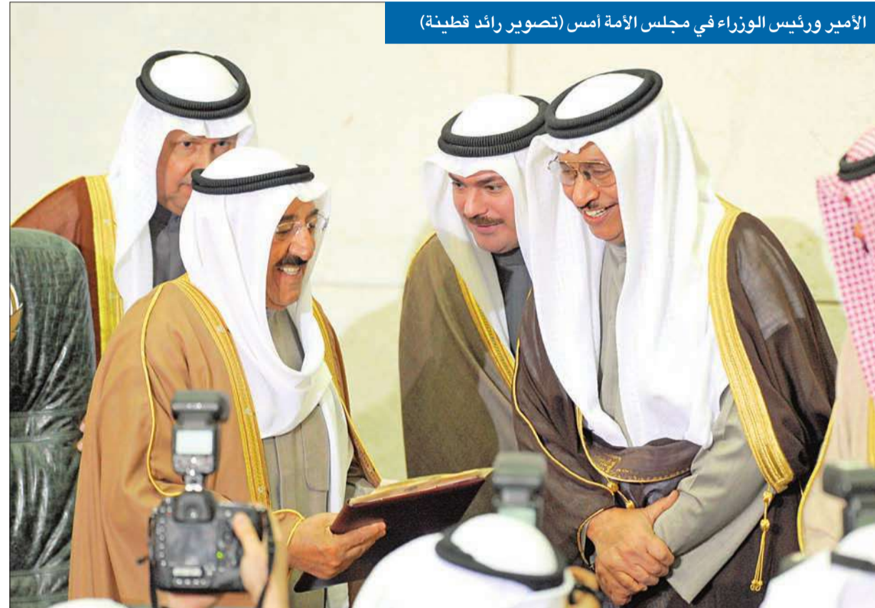
الأمير ورئيس الوزراء في مجلس الأمة أمس

أكد سمو أمير البلاد الشيخ صباح الأحمد أن جميع الكويتيين أبنائه مهما تباينت الآراء، ولا أن لهم سوى الود والمحبة والتقدير، وإنني على مسافة واحدة من كل واحد منهم. ووجه سموه، في النطق السامي خلال حفل افتتاح دور الانعقاد الأول للفصل التشريعي الرابع عشر أمس، رسائل وتوجيهات إلى الحكومة ومجلس الأمة والمؤسسات الإعلامية والشباب، شدد فيها على أن أولى خطوات الإصلاح تبدأ بالاعتراف بالخلل، وحسن شخصيته، وتحديد أسبابه؛ ليتسنى إصلاحه ومعالجته. وحفل سموه مجلس الأمة مسؤولياً لإصلاح المؤسسة التشريعية، وتعزيز دورها الإيجابي