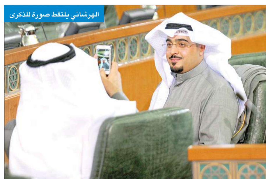
الهرشاني يلتقط صورة للذكرى

عهد وميثاق أن نلتزم بأدب الحوار ونحترم اللائحة ونطبقتها