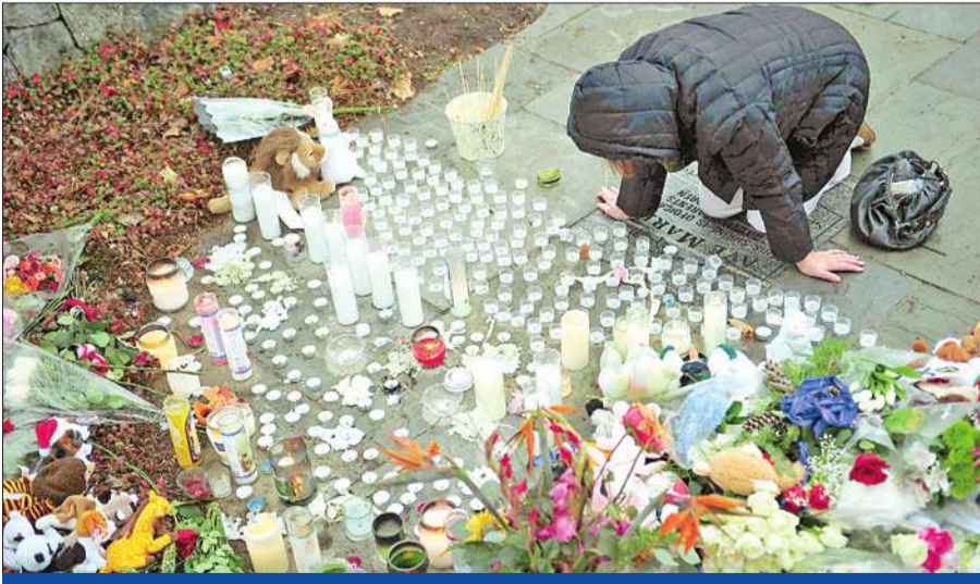
أميركية تقدم تعازياً أمام نصب مؤقت لضحايا المدرسة بعد قداس الأحد في كنيسة ساينت ليميا في نيوتاون في ولاية كونيتيكت أمس (أ ف ب)

وفي المنزل الفخم الذي كان يعيش فيه القاتل ووالدته، التي قُتل قبل المجزرة في هذا المنزل، سمحا بجمع عناصر جديدة جداً نامل أن نسمع لنا برسوم صورة كاملة لطريقة وأسباب حدوث ذلك. (نيوتاون - أ ف ب، رويترز)