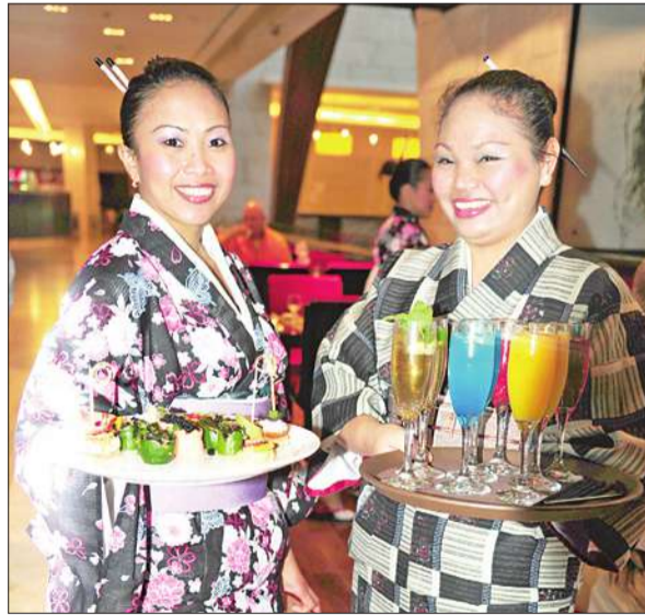
تقديم أنواع مختلفة من العصائر للحضور