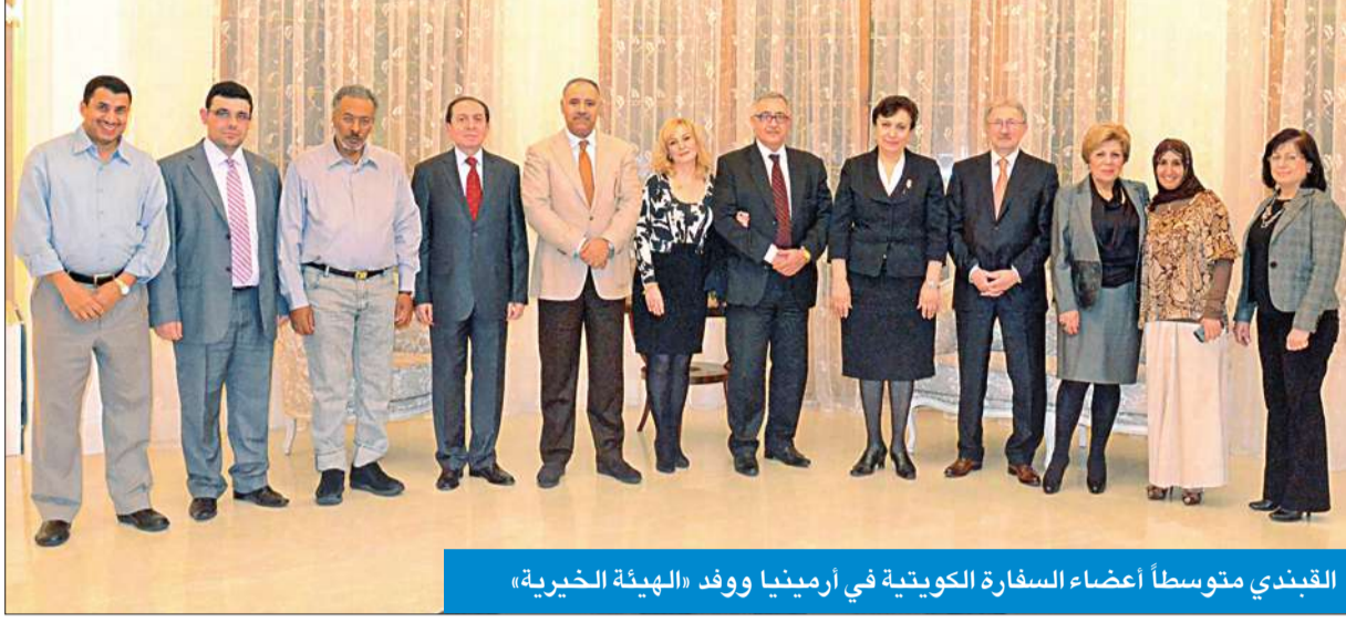
القبدي متوسطاً أعضاء السفارة الكويتية في أرمينيا ووفد «الهيئة الخيرية»

وحضر المادة وزيرة المهجر ووكيل وزارة الخارجية في أرمينيا ورئيسة مركز التنسيق لجمعية احتياجات اللاجئين السوريين ونائب رئيس المركز. يذكر أن دولة الكويت وجمهورية أرمينيا، ممثلتين بوزيري خارجية البلدين، وقعتا الشهر الماضي في وزارة الخارجية الكويتية اتفاقية الإغناء من التأشيرات الخاصة بالجوازات الدبلوماسية.