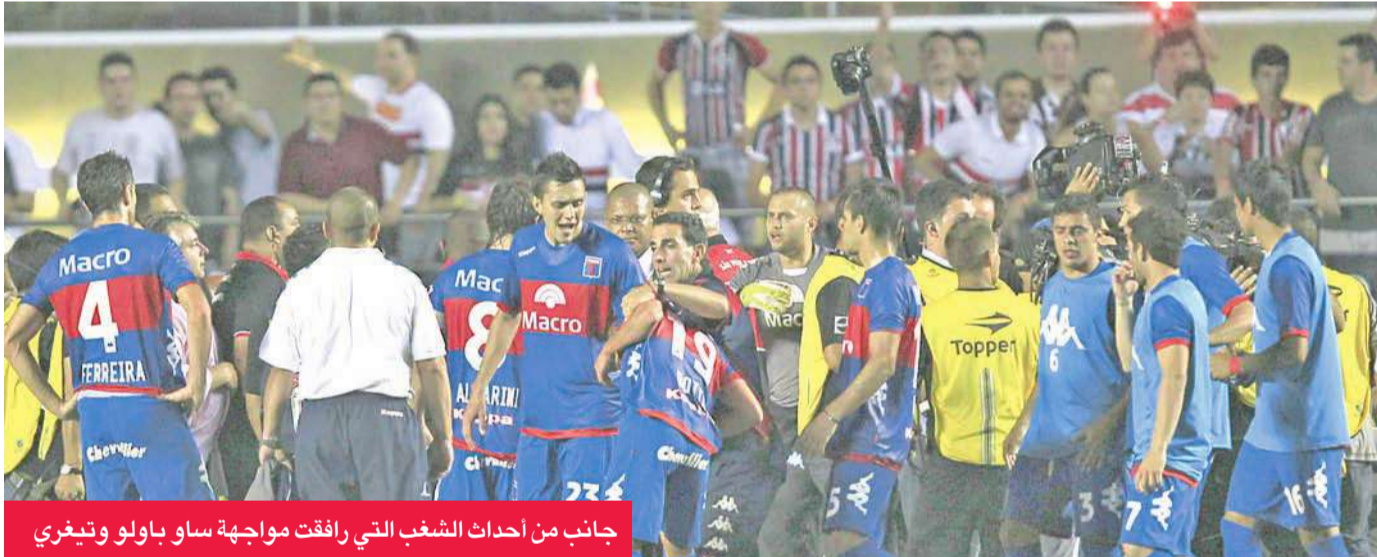
جانب من أحداث الشغب التي راقت مواجهة ساو باولو وتيغري

وقرر الكونمبول الجمعة بدء تحقيق في الواقعة، وأعلن عزمه جمع كل التقارير المقدمة من الأطراف المعنية فضلاً عن الفريقين. (إفي)