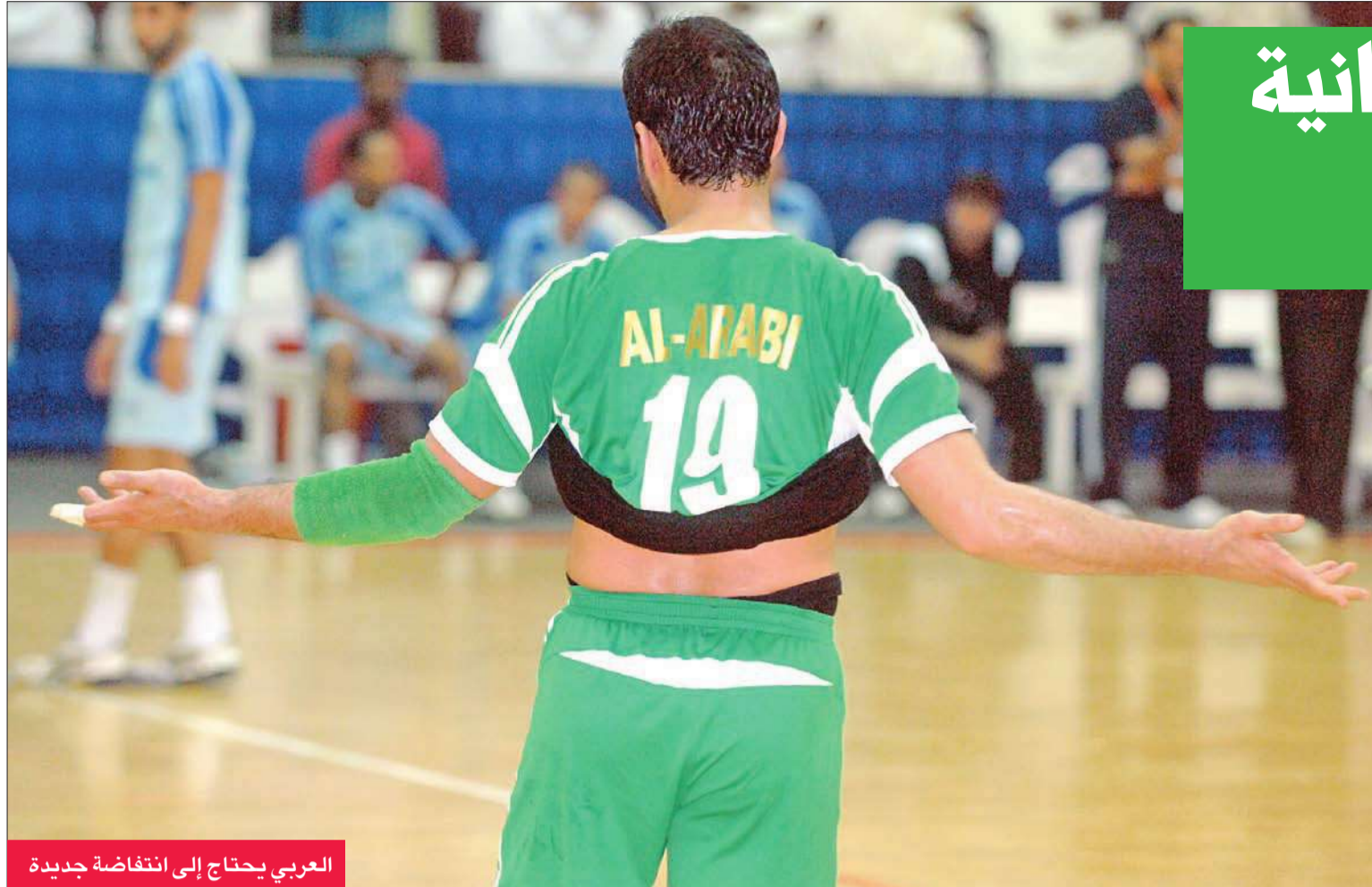
العربي يحتاج إلى انتفاضة جديدة

وبالنظر إلى نتائج باقي المباريات نجد أن أغلبها متوقع، حيث فاز الكويت بأقل مجهود على خيطان 39-24،