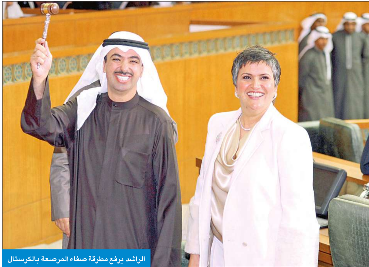
الراشد يرفع مطرقة صفاء المرصعة بالكرستال

● مجلس الأمة يرفض اقتراح الصانع بإحالة المادة 71 إلى «المحكمة الدستورية»