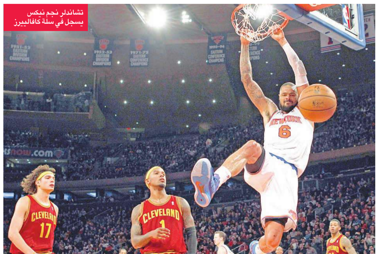
تشاندرل نجم نيكس يسجل في سلة كافاليرز

اورلاندو ماجيك على تشارلوت بوبكاتس 107-98، وانديانا بيسرن على ديترويت بيستونز 88-77، ومفيس غريزلز على يوتا جاز 99-86، ومينيسوتا تمبرولفز على دالاس مافريكس 114-106 بعد التمديد، وغولدن ستايت ووريترز على اتلانتا هوكس 115-93.