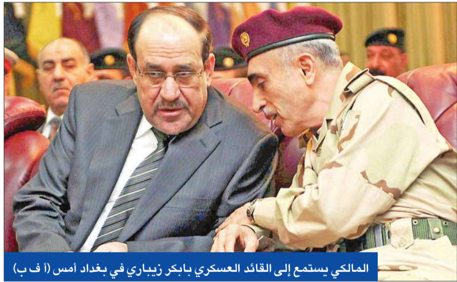
المالكي يستمع إلى القائد العسكري بابكر زبياري في بغداد أمس

البارزاني يوقف «الحملة الدعائية» استجابة لدعوة الطالباني