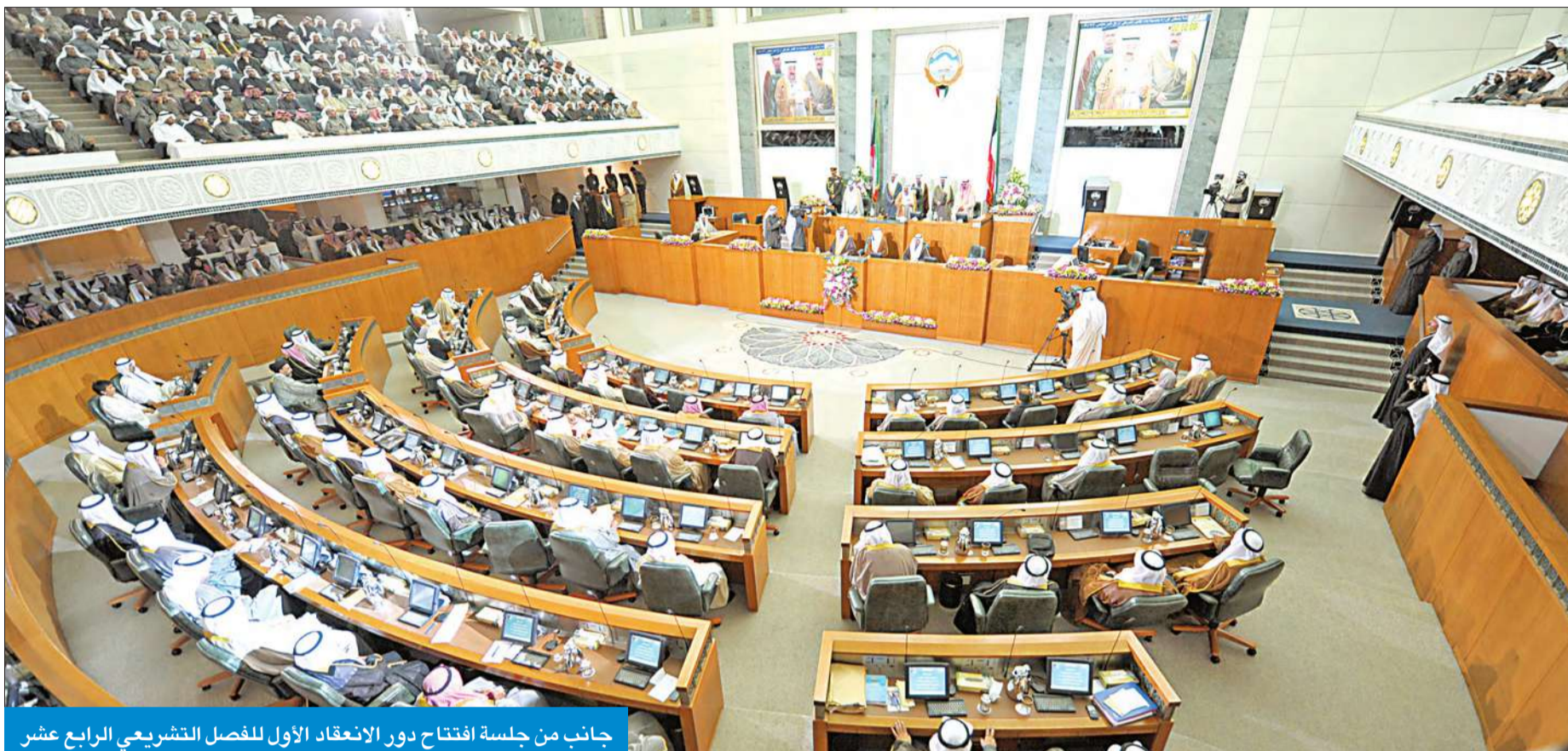
جانب من جلسة افتتاح دور الانعقاد الأول للفصل التشريعي الرابع عشر

● الأمير يلتقي مكتب المجلس الجديد اليوم ● تأجيل بت اللجان المؤقتة إلى جلسة 25 ديسمبر