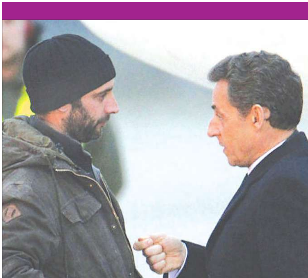
وليام دانيالز مع الرئيس نيكولا ساركوزي

نغد صبر السائق. راح يتكلم مع صالح، وقد بدا لي أنه يريد الانطلاق، لكن لا يمكننا الرحيل بدون الآخرين، بدون وليام، إلا أن السائق لم يوافقني الرأي، على ما يبدو، لأنه عبت بناقل السرعة، معداً السيارة للانطلاق. كنت أعني أن الناشطين السوريين لن يتحركوا في هذا المازق، إلا أنهم يدركون أن جيش بشار ينتظر أحياناً عمليات الإيقاد ليعاود القصف ليغضي على من يقدمون العون للجرحى، مدنيين كانوا أو محاربين، بدون تمييز. كانت كل ثانية تمرّ بالغة الأهمية، بيد أنني لا أستطيع الرحيل من دون وليام. ناديته بصوت عال، لكن لا جدوى من الصراخ في هذه الفوضى التي تحيط بنا. رحّت أهدق في مدخل المبنى الذي سكنناه. أوما صالح للسائق، علينا المغادرة في الحال. فيما كان صالح يضرب سطح السيارة في إشارة منه على ضرورة الرحيل في الحال، رأيت وليام يخرج من المنزل وحقيبته على ظهره. فقد جمع في بضع لحظات بعض أغراض ريمي، آخر ما تبقى لنا منه، ورض مندفاً داخل السيارة التي انطلق سائقها بلح البصر.