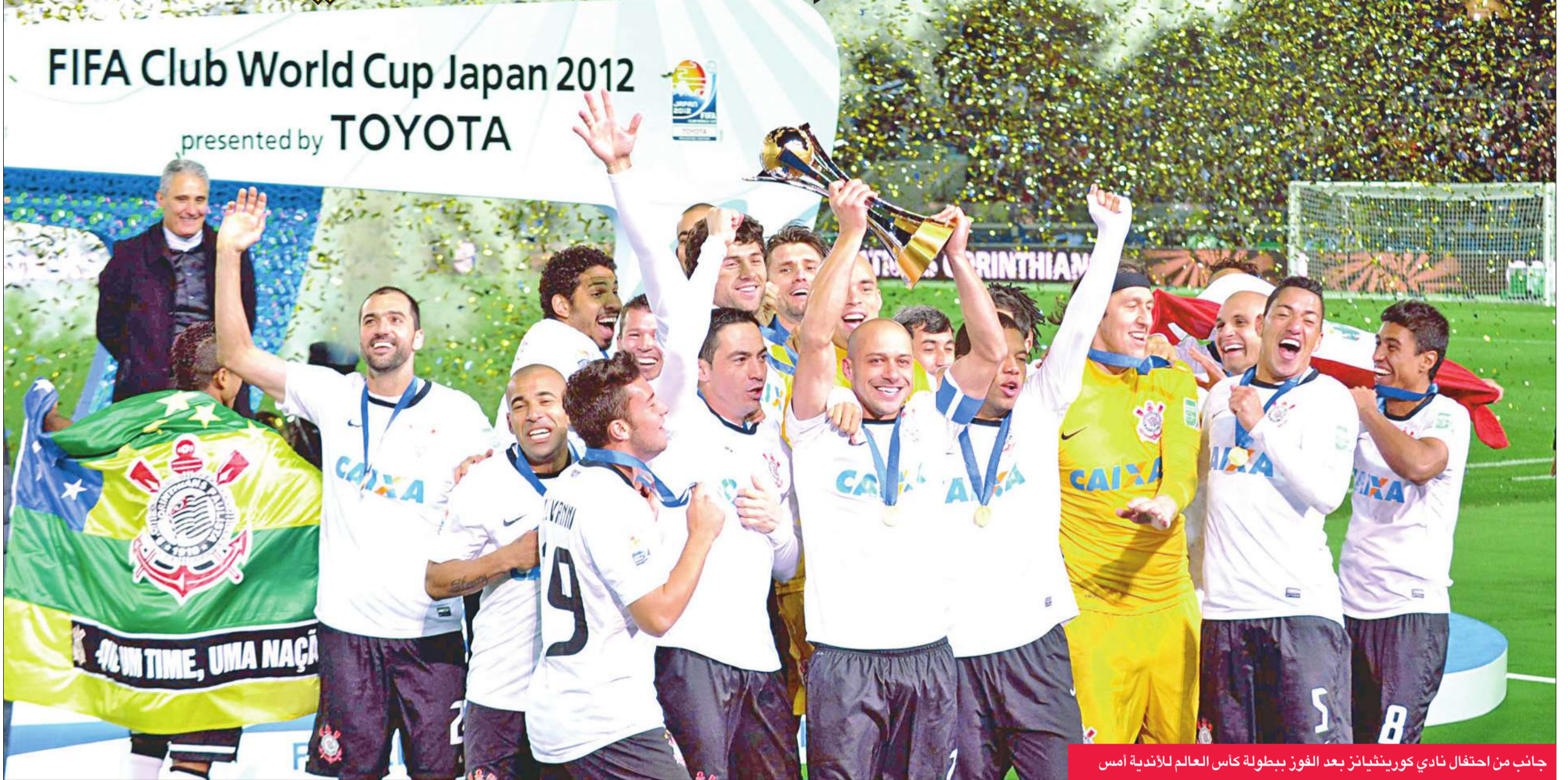
جانب من احتفال نادي كورينثيانز بعد الفوز ببطولة كأس العالم للأندية أمس

قاد البيروفي خوان باولو غيريرو فريقه كورينثيانز البرازيلي إلى الفوز ببطولة كأس العالم للأندية لكرة القدم للمرة الثانية في تاريخه، بعد إحرازه هدف المباراة الوحيد أمام تشلسي الإنكليزي في المباراة النهائية أمس.