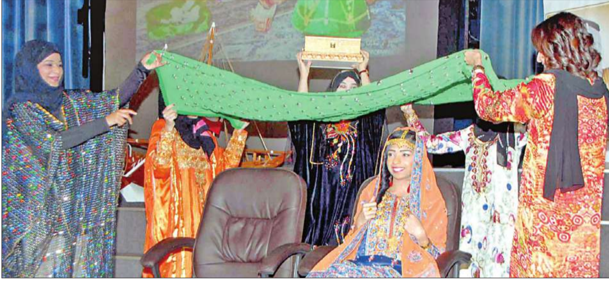
تقديم فقرة ليلية الحنة للعروس