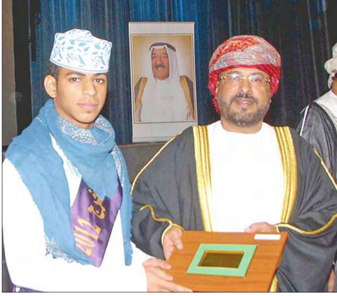
... ويكرم موسى بن جميل

نظمت المحلقة الثقافية بالسفارة العمانية في الكويت الحفل الطلابي السنوي بمناسبة العيد الوطني لسلطنة عمان، وتكريم الطلبة الخريجين والمتفوقين للعام الدراسي 2012، تحت رعاية وحضور سفير سلطنة عمان لدى الكويت الشيخ سالم بن سهيل المعشني، وذلك في مسرح صباح السالم بجامعة الكويت. تخلل الحفل عدة أنشطة وعرض مسرحي ووصلات غنائية.