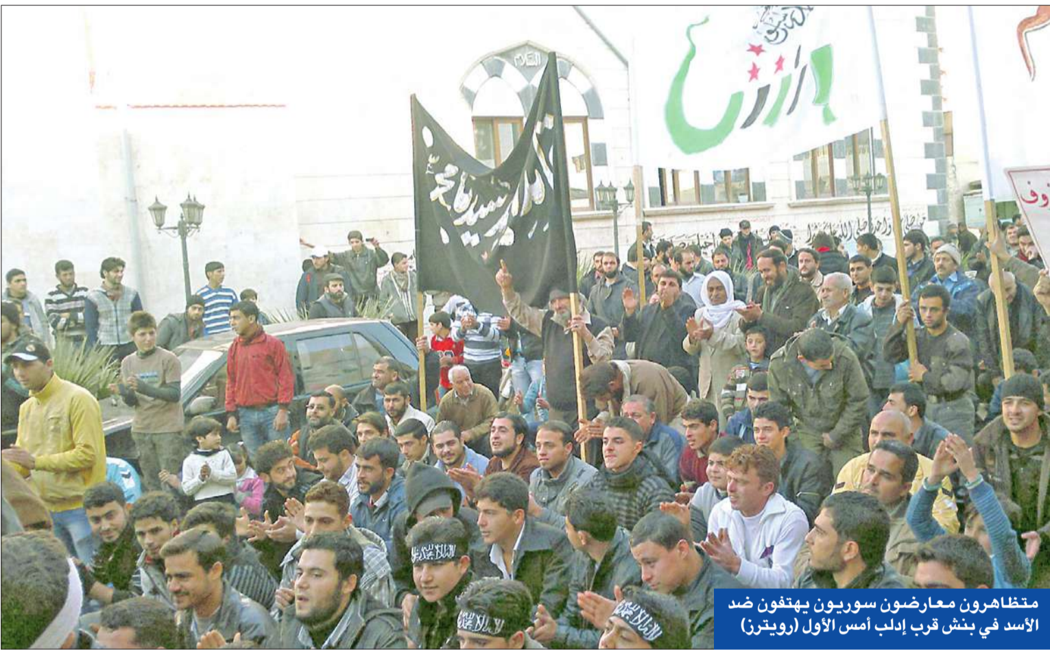
متظاهرون معارضون سوريون يهتفون ضد الأسد في دمشق قرب إدلب أمس الأول (رويترز)

من جهتهم، قال سكان في المخيم إن صاروخاً استهدف مسجد عبدالقادر الحسيني الذي يؤوي 600 نازح من أحياء دمشق الجنوبية، مشيرين إلى سقوط عدد كبير من الضحايا. وأفاد أحد اللاجئين بأن «السكان مجتمعون في وسط المخيم هرباً من القصف والاشتباكات التي تحدث على أطرافه». وأشار المرصد إلى أن الغارة كانت واحدة من ست غارات شنها الطيران الحربي السوري أمس، على مناطق في جنوب دمشق هي، إضافة إلى اليرموك، حيي الحجر الأسود والعسالي. وقال مدير المرصد رامي عبدالرحمن إن «القوات النظامية تشعر بحاجة إلى تعزيز حملتها للقضاء على المقاتلين المعارضين في جنوب دمشق، ولا يمكنها محاربتهم من دون اللجوء إلى قوتها الجوية». وأضاف: «أما بالنسبة إلى الفلسطينيين، فهم منقسمون ويقاوتون إلى جانب طرفي النزاع». المستمر منذ 21 شهراً وإشراك المرصد إلى أن اشتباكات مستمرة منذ 48 ساعة تدور في الحجر الأسود وعلى أطراف المخيم بين مقاتلين من اللجان الشعبية في اليرموك التابعة للتيار الشعبي لتحرير فلسطين بقيادة العامة وهي فصائل مسوول للنظام الرئيس السوري بشار الأسد، ومقاتلين