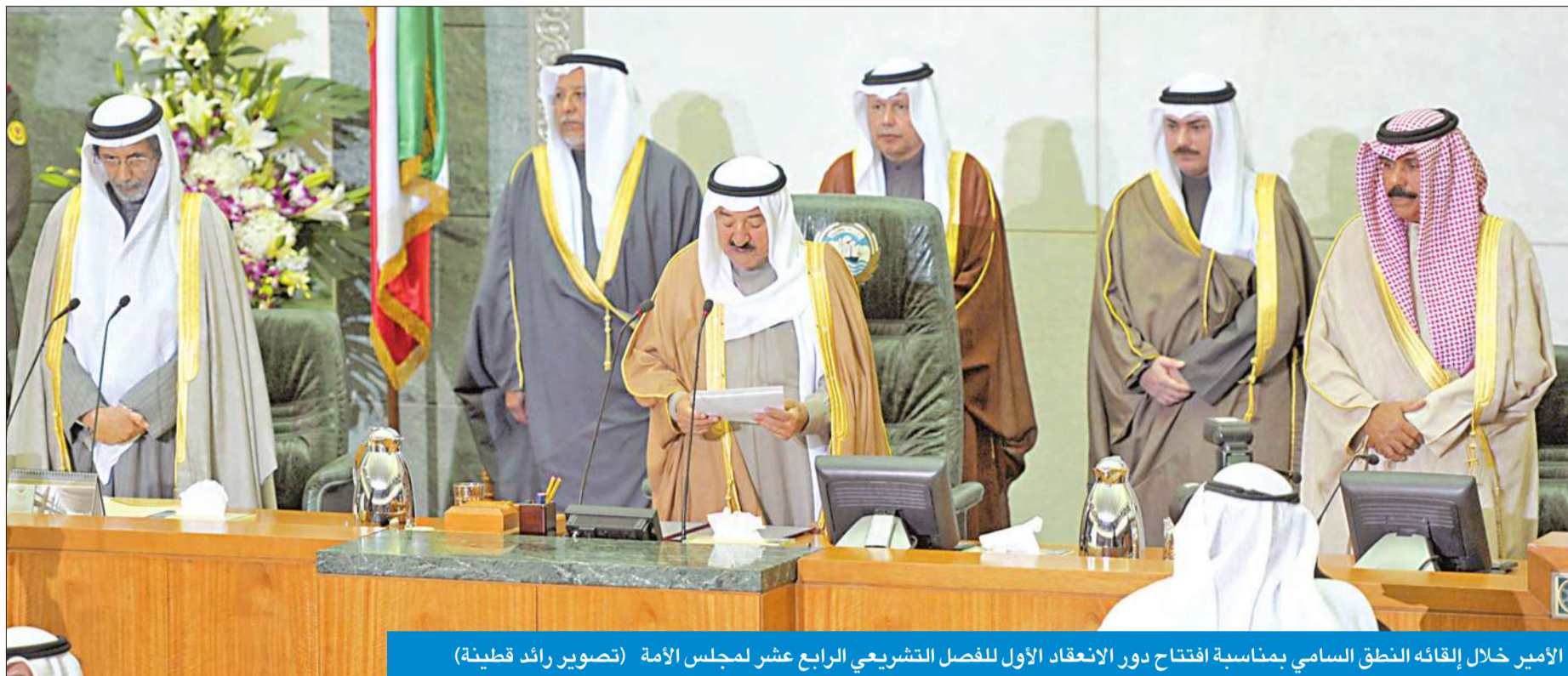
الأمير خلال إلقائه النطق السامي بمناسبة افتتاح دور الانعقاد الأول للفصل التشريعي الرابع عشر لمجلس الأمة

أكد سمو أمير البلاد الشيخ صباح الأحمد أنه من بحمي الدستور ولن يسمح بالتمسك به أو التعدي عليه إيماناً بأنه يمثل الضمانة الأساسية بعد الله للامن الوطن واستقراره. مبينا أن جميع الكويتيين أبناءه مهما تباينت الاجتهادات والآراء ولا يكن لهم سوى الود والمحبة والتقدير. جاء ذلك في النطق السامي لسموه في افتتاح دور الانعقاد الاول من الفصل التشريعي الرابع عشر لمجلس الأمة. وأشار سموه الى تفهم «قلق أهل الكويت ومخاوفهم إزاء ما شهدته الساحة المحلية مؤخراً من مظاهر الفوضى وتجاوز القانون والانحراف في الخطاب السياسي»، متسائلاً «ماذا تركنا لابنائنا واحفادنا من قيم ومبادئ وأعراف غرسها الآباء والاجداد في وجدان هذا الوطن الكريم». ولفت سموه الى خطورة اوضاع المنطقة والواقع المضطرب الذي يشهده العديد من دول المنطقة وما يستتويج من اتخاذ الحيطة والحذر وحسن الاستعداد لتجنب آثارها وشررها علينا. وفي ما يلي نص النطق السامي الذي فضل به سموه: