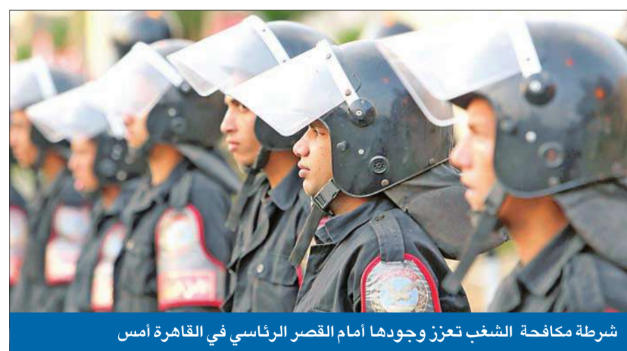
شرطة مكافحة الشغب تعزز وجودها أمام القصر الرئاسي في القاهرة أمس

الموافقون 56%... القاهرة صوتت بالرفض والإسكندرية خذلت المعارضة والصعيد دعم الإسلاميين