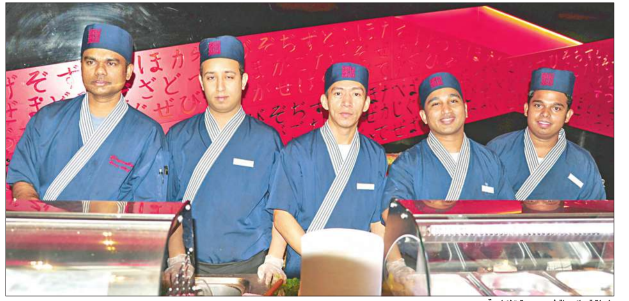
طهارة "ساكورا" في صورة تذكارية