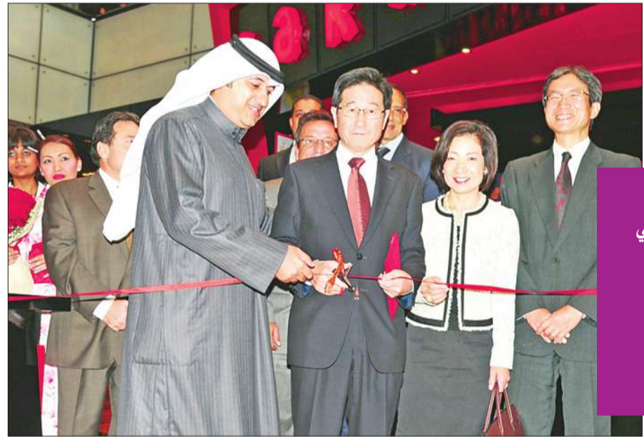
قص شريط الافتتاح