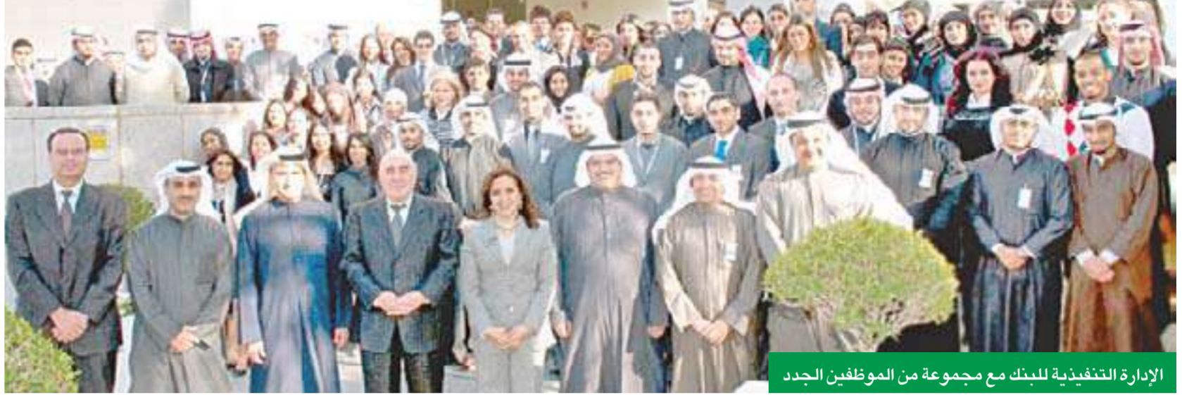
الإدارة التنفيذية للبنك مع مجموعة من الموظفين الجدد

التنمية المستدامة للموارد والكوادر البشرية في مقدمة أولوياته، بوصفها هدفاً استراتيجياً للنهوض بمسؤولياته الوطنية وزيادة مساهماته وجهوده في مجال توظيف الوظائف وبناء طاقات قيادية جديدة. وقد أطلق «الوطني» في هذا الإطار العديد من المبادرات هي الأولى من نوعها على مستوى القطاع الخاص، من أهمها أكاديمية الوطني وبرامجه المتعددة لتطوير القيادات الوطنية الشابة بالتعاون مع كبرى الجامعات والمعاهد العالمية، بالإضافة إلى حملته المستمرة لاستقطاب الكفاءات الشابة، بالتوازي مع التوسع الذي تشهده أعمال البنك ونشاطاته.