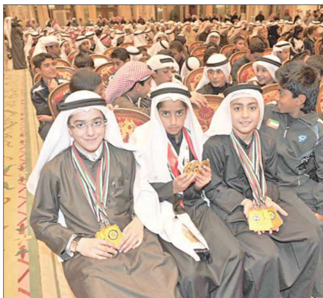
جانب من الأبطال الصغار الذين تشرفوا بقاء صاحب السمو