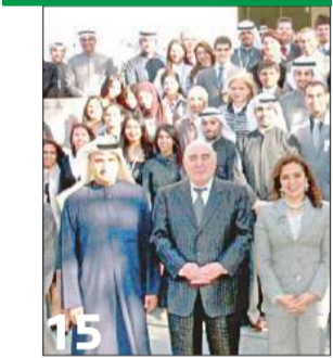
15 «الوطني» يزيد عمالته الوطنية أكثر من 17% خلال 2010