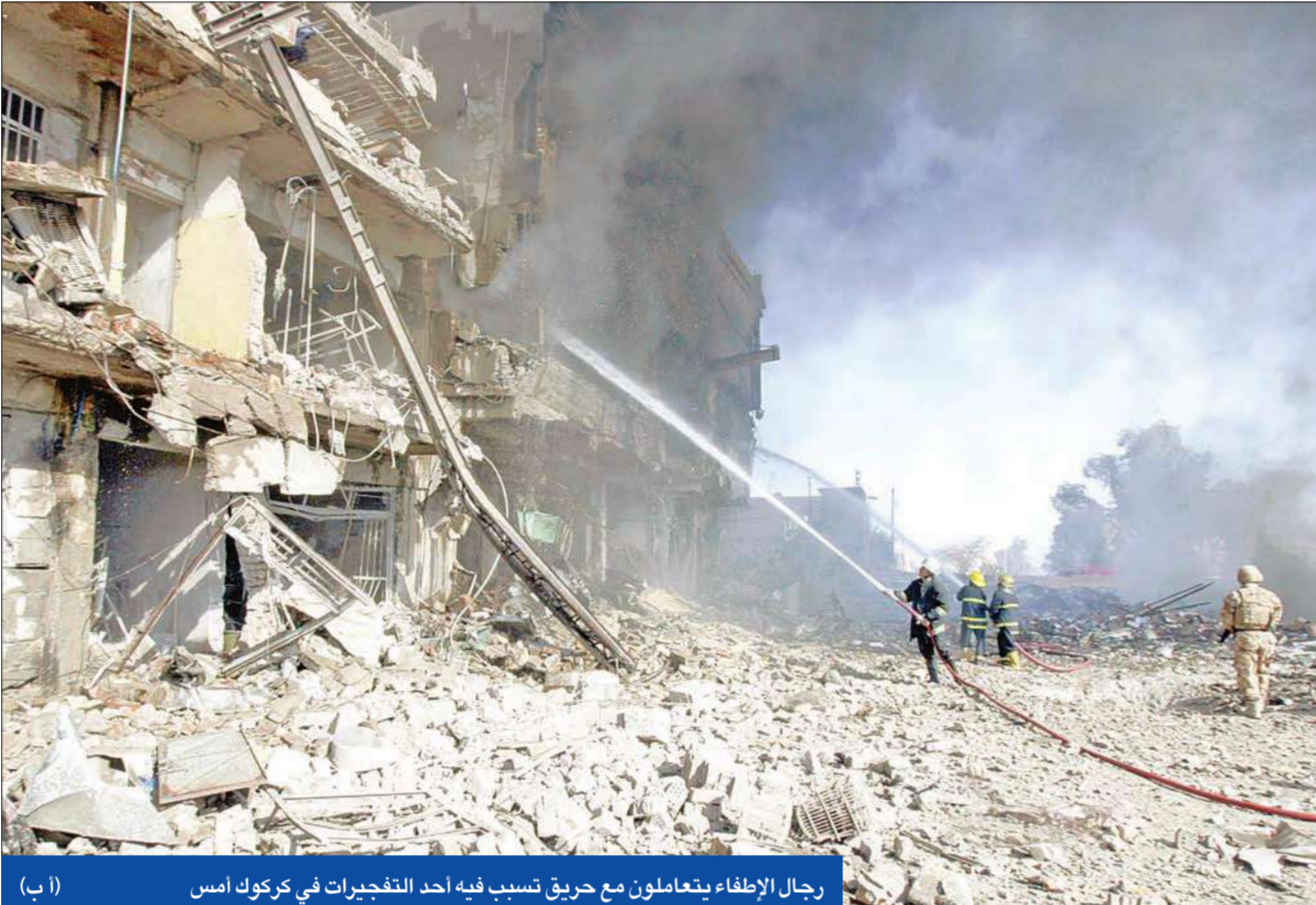
رجال الإطفاء يتعاملون مع حريق تسبب فيه أحد التفجيرات في كركوك امس

● رئيس «هيئة النزاهة»: الوزراء التنفيذيون يغطون الفساد ● 10 قتلى و83 جريحاً في 3 انفجارات في كركوك