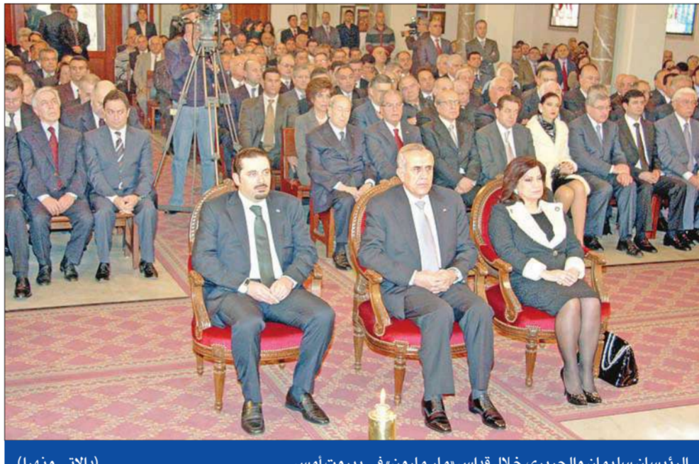
الرئيسان سليمان والحريري خلال قداس «مار مارون» في بيروت امس (الالاتي ونهرا)

أحمد الحريري: ميقاتي تعهد لـ «8 آذار» بنسف بروتوكول التعاون مع المحكمة