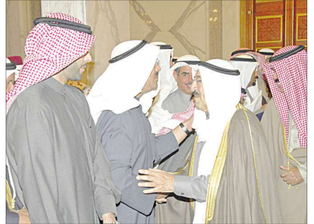
... ويصافح الحضور

استقبل حضرة صاحب السمو أمير البلاد الشيخ صباح الأحمد الصباح بقصر بيان ظهر أمس بحضور سمو ولي العهد الشيخ نواف الأحمد الصباح وزير الشؤون الاجتماعية والعمل الدكتور محمد العفاسي، والمنتخبات والأندية الحائزة على البطولات المتقدمة اقليمية وعالميا وقاريا، والأندية المحلية الحائزة على المراكز المتقدمة محليا. هذا وأشاد سموه بإنجازات أبنائه الرياضيين في مختلف المحافل الدولية، مؤكدا أهمية التعاون والتكاتف بين مختلف الأندية الرياضية من أجل النهوض بمستواها الرياضي وتحقيق الانجازات الرياضية المنشودة. وأعرب سموه عن اعتزازه بما حصلت عليه المنتخبات والأندية الرياضية المختلفة من ميداليات مما أعاد الثقة إلى نفوس الجماهير الرياضية. وأكد سموه ان الانجازات الرياضية وتحقيق البطولات اصبحت تمثل سمة بارزة في مختلف الدول، مما يدعو الى تكثيف الجهود وتذليل المعوقات من أجل الحصول على مثل هذه البطولات، متمنيا للجميع دوام التوفيق والنجاح لرفع اسم الكويت عاليا في مختلف المحافل الرياضية الإقليمية منها والدولية. وقد أشاد وزير الشؤون الاجتماعية والعمل بالرعاية الأبوية السامية والدعم غير المحدود اللذين يحظى بهما الرياضيون من قبل سموه حفظه الله والتي شكلت دافعا لهم لبذل المزيد من الجهد من أجل رفعة الوطن وعلياه.