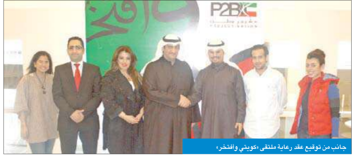
جانب من توقيع عقد رعاية ملتقى «كويتي وأفتخر»