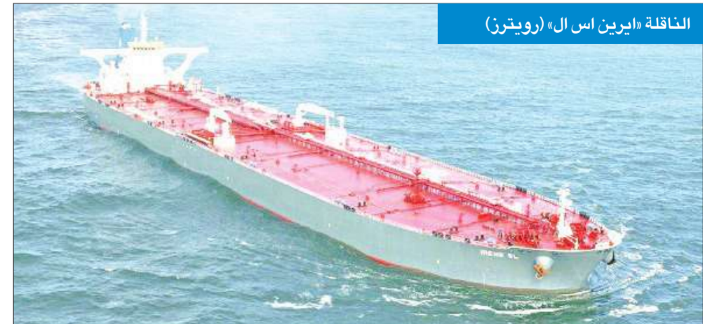
الناقلة «إيرين اس ال»

إلى ذلك، قالت القوة البحرية الأوروبية المنتشرة في خليج عدن لمكافحة القرصنة، إن السفينة ترفع العلم اليوناني، وهي مملوكة من شركة يونانية أيضاً، بخلاف ما قالته المتحدثات باسم القوات البحرية الدولية. وذكرت القوة الأوروبية في بيان، أن الطاقم مؤلف من 7 يونانيين وجورجي واحد و17 فلبينياً. (دبي - أ ف ب، رويترز)