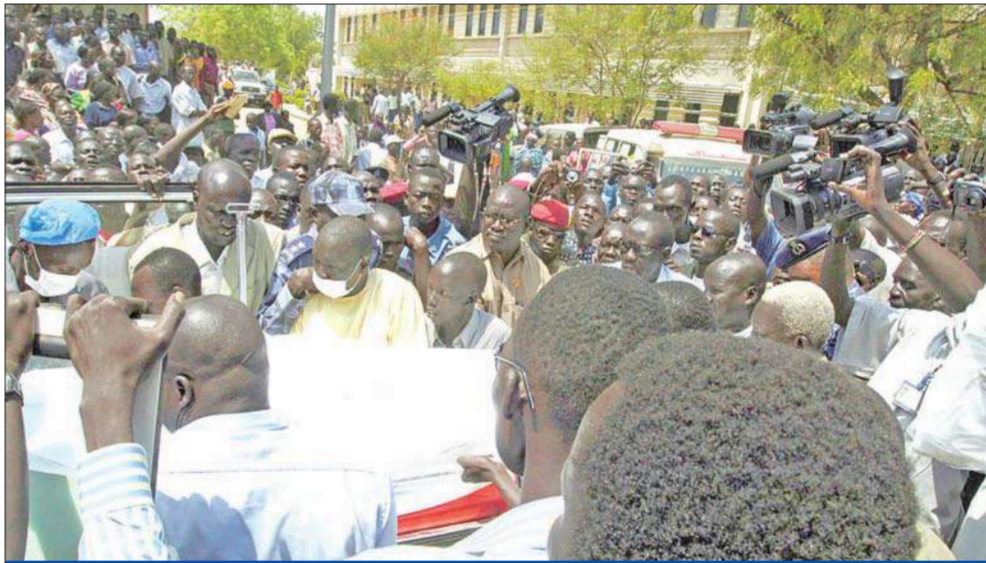
مسجونون سودانيون يتقلون جثة ميلا إلى الاسعاف في جوبا أمس

على صعيد آخر، أعلن الزعيم القبلي الباكستاني