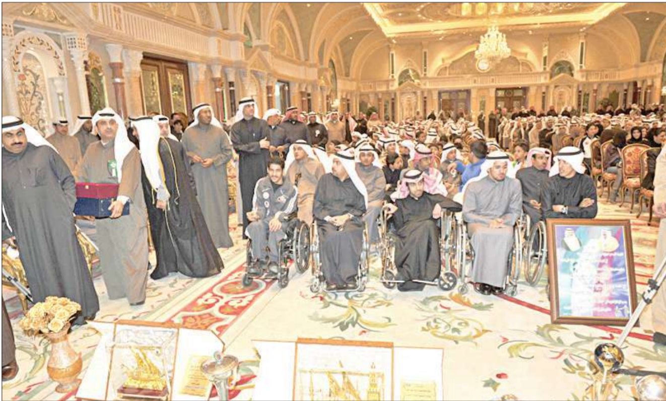
جانب من اللاعبين المعاقين أصحاب الإنجازات