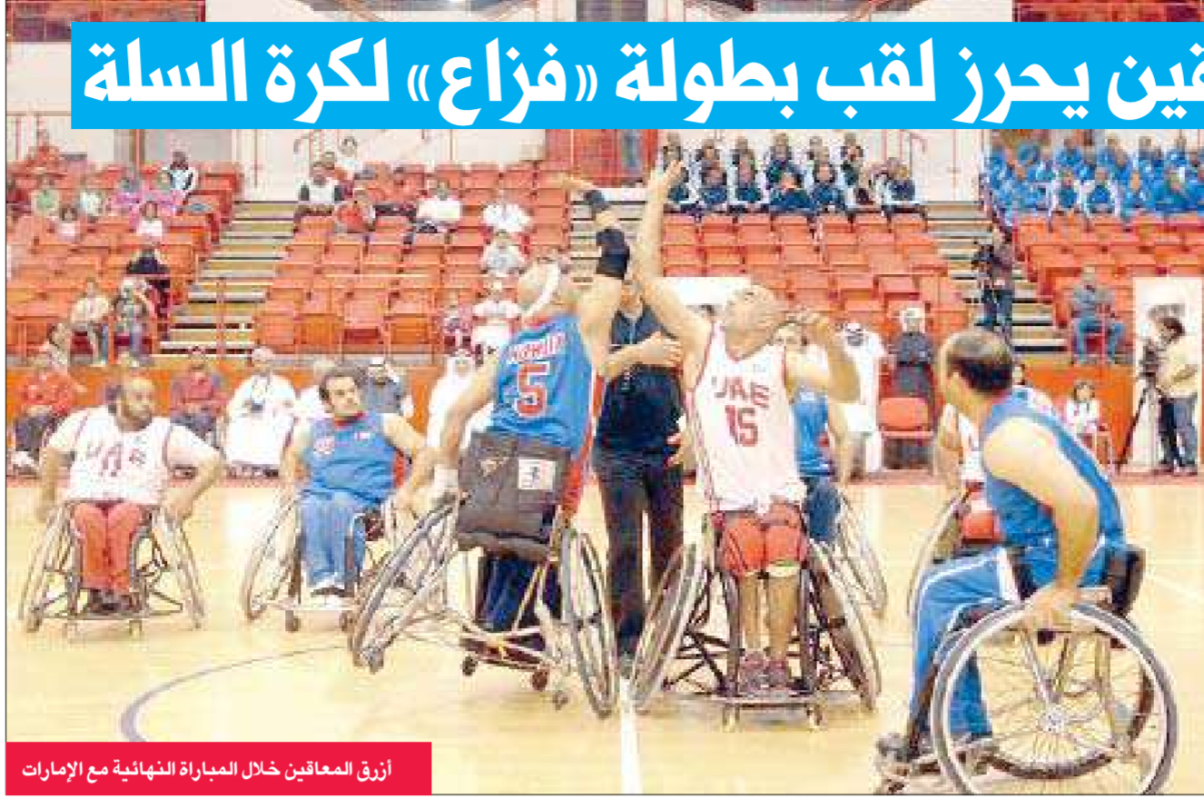
أزرق المعاقين خلال المباراة النهائية مع الإمارات

توج فريق نادي الكويت الرياضي للمعاقين لكرة السلة على الكراسي المتحركة بطلا لبطولة فزاع الدولية، بعد فوزه المثير على نظيره الاماراتي 54/67 في المباراة النهائية التي جرت يوم أمس.