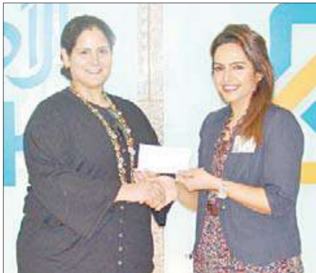
لقطة لتسلم بيت لودان، شريك الرعاية

ينظمه «بيت لودان» ضمن فعاليات الاحتفال بأعياد الكويت