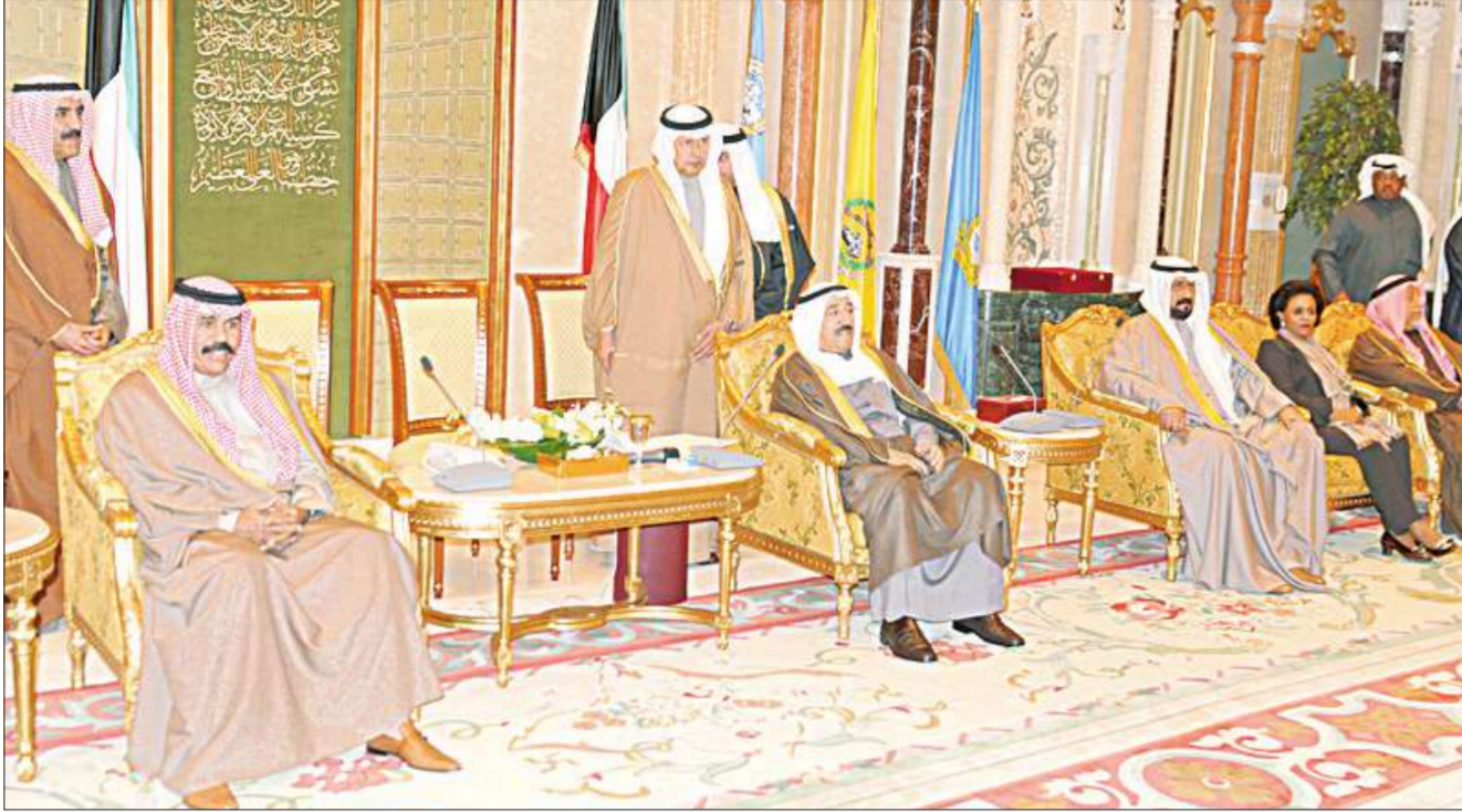
سمو الأمير متوسلاً سمو ولي العهد والوزير العفاسي