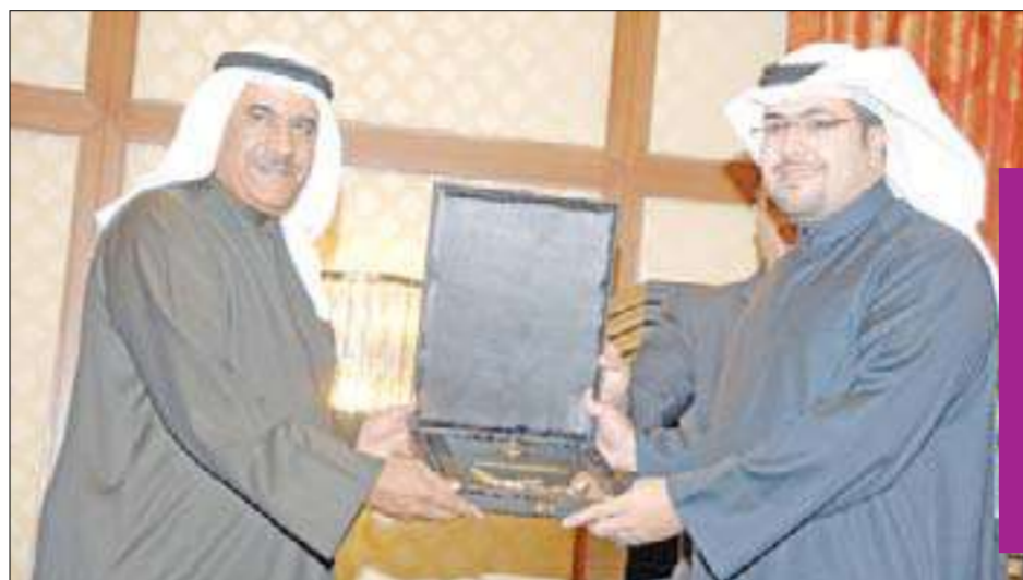
الخشتي يكرم أحد العاملين في الشركة

المناسبة الشركة الكويتية لنفط الخليج تكريم قدامى العاملين المكان فندق هيلتون المنقف