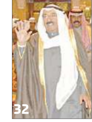
32 المتخبات الرياضية تشرفت بلقاء سمو أمير البلاد