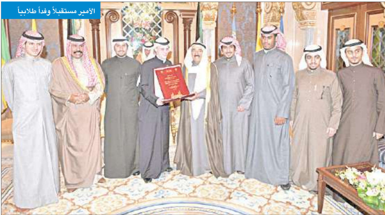
الأمير مستقبلاً وفداً طلابياً