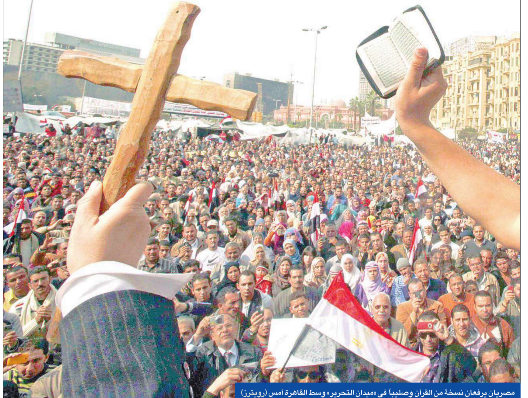
مصريان يرفعان نسخة من القرآن وصلياً في «ميدان التحرير» وسط القاهرة أمس