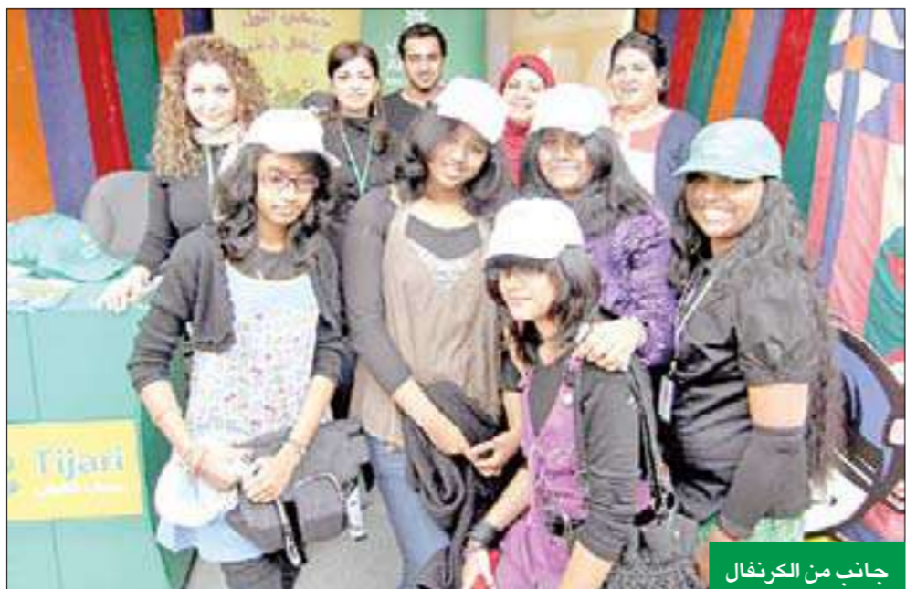
جانب من الكرنفال

منووعة، وتأتي هذه المشاركة من جانب البنك لأهمية هذا الحدث التربوي وتقديراً لجهود المدرسين والإداريين خلال العام الدراسي الحالي. وبهذه المناسبة، أشار "التجاري" إلى أن مشاركته في هذا الكرنفال