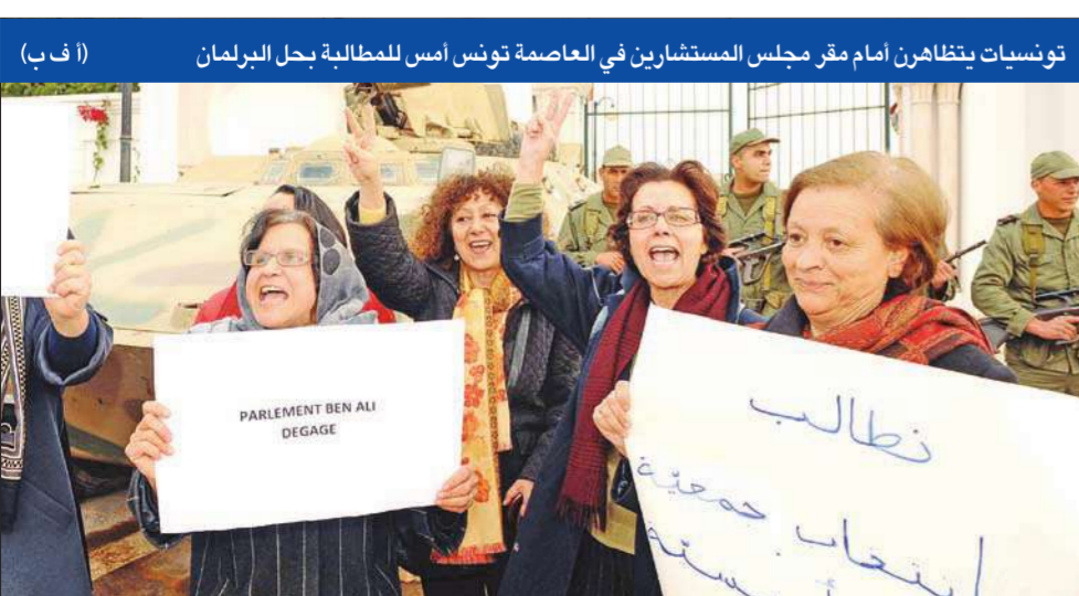
تونسيات يتظاهرن أمام مقر مجلس المستشارين في العاصمة تونس امس للمطالبة بحل البرلمان (أ ب)

(القدس، تل أبيب، أ ف ب، ب، رويترز، د ب، يو بي أي)