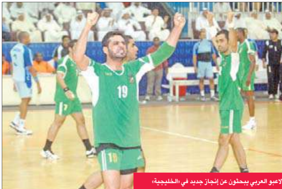
لاعب العربي يبحثون عن إنجاز جديد في «الخليجية»

تفتتح في الرابعة من عصر اليوم منافسات البطولة الخليجية الحادية والثلاثين للأندية أبطال الكؤوس لكرة اليد التي يستضيفها نادي الريان القطري في العاصمة الدوحة حتى 21 فبراير الجاري، بلقاء يجمع بين الريان ومسقط العماني ضمن منافسات المجموعة الأولى للبطولة. وفي السادسة والنصف يستهل فريق النادي العربي ممثل الكويت الوحيد في المسابقة مشواره في المنافسة بلقاء نظيره الشباب البحريني ضمن المجموعة ذاتها. يذكر أن قرعة البطولة قسمت الفرق الثمانية المشاركة فيها إلى مجموعتين ضمت المجموعة الأولى أندية الريان القطري والعربي الكويتي والشباب البحريني ومسقط العماني، فيما ضمت المجموعة الثانية الأهلي البحريني «حامل اللقب» والنور السعودي والشباب الإماراتي والجيش القطري.