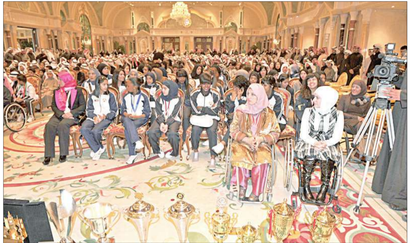
جانب من الحضور الرياضي النسائي