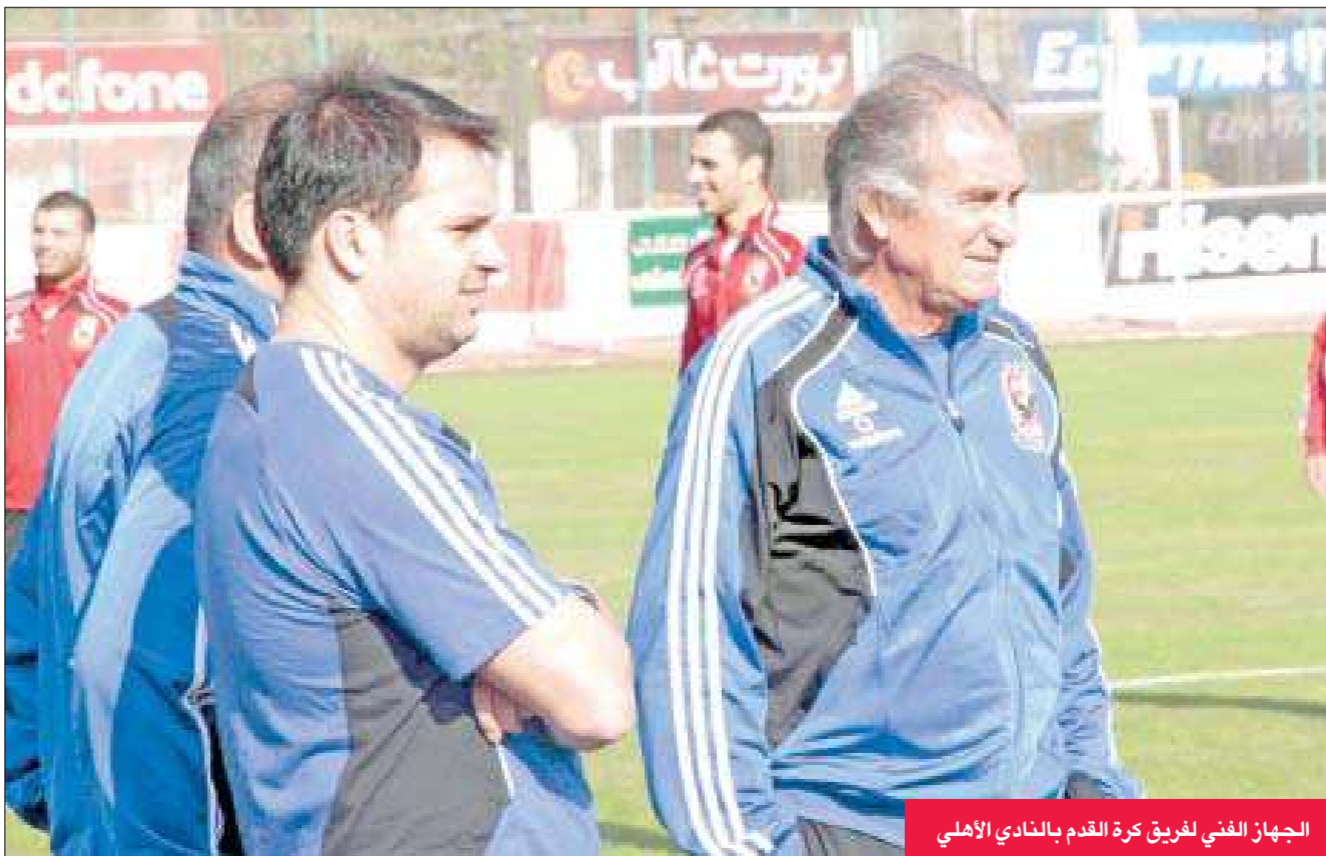
الجهاز الفني لفريق كرة القدم بالنادي الأهلي