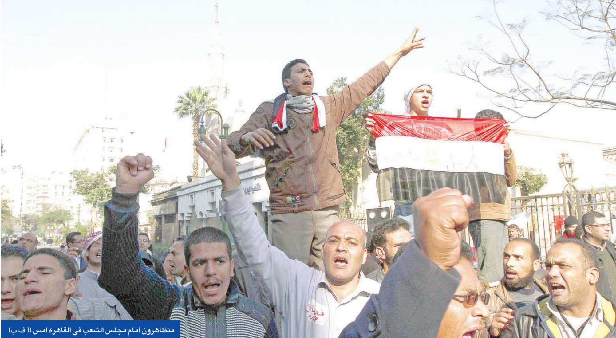
متظاهرون أمام مجلس الشعب في القاهرة أمس

● 3 قتلى في اشتباكات بين الأمن و متظاهرين في الوادي الجديد... وعمال السويس والمحلة «يضربون» ● لجنة تعديل الدستور تعلن 6 تعديلات تشمل مواد خاصة بالترشح للرئاسة والإشراف على الانتخابات