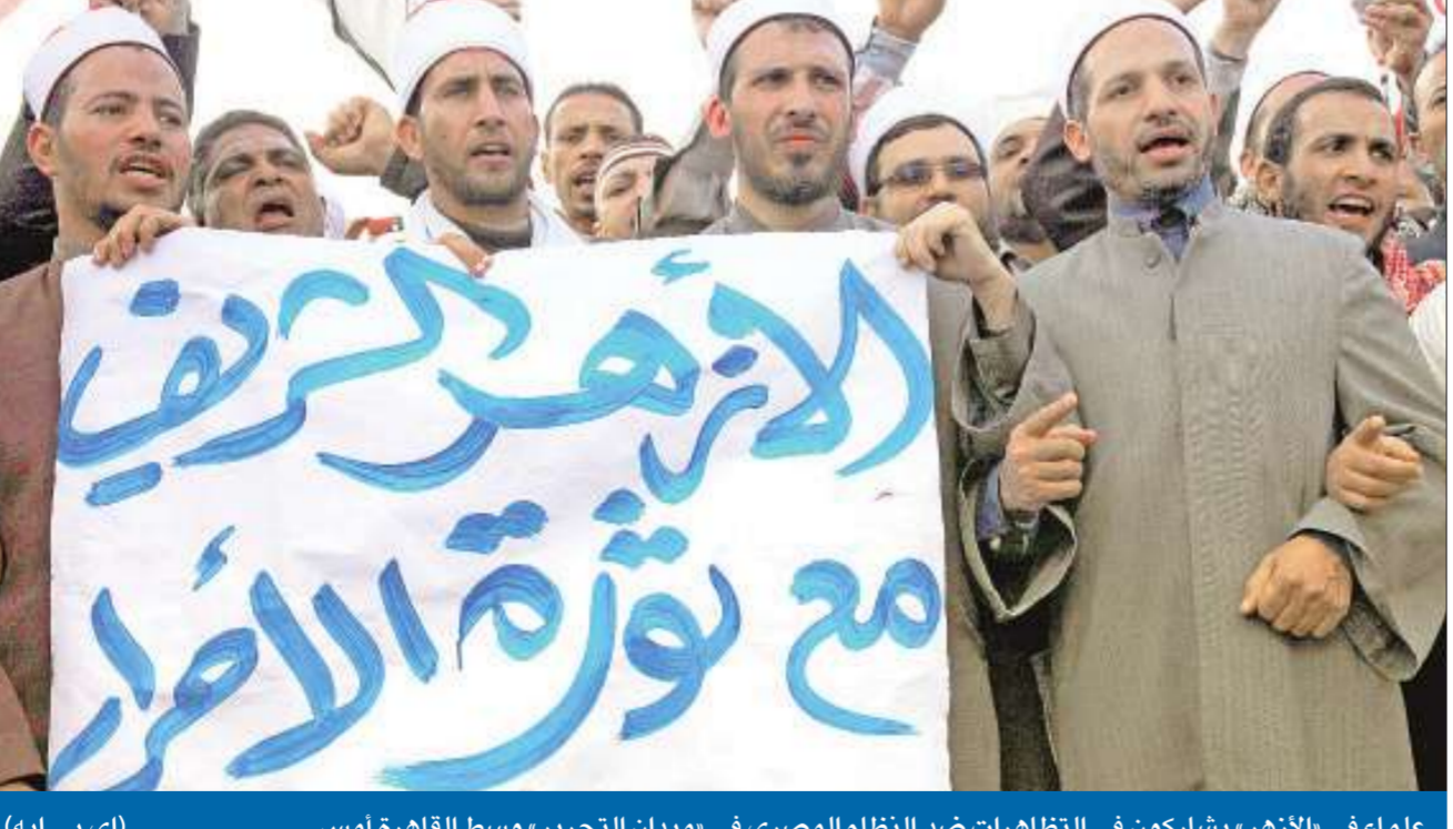
علماء في الأزهر، يشاركون في التظاهرات ضد النظام المصري في ميدان التحرير، وسط القاهرة أمس

«شباب التحرير» يناشدون شيخ الأزهر الاستقالة و«الإخوان» تدرس الانسحاب من الحوار