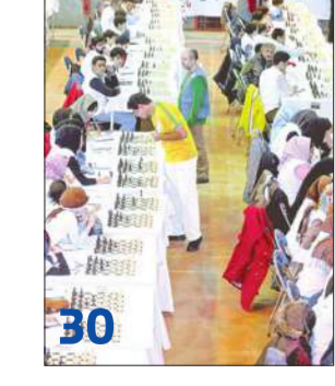
30 طهران تجري «مناورات» مع مسقط... ولاريجاني يزور الدوحة