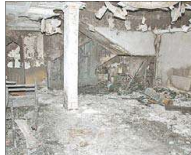
حريق المنزل بعد إخماده

لقي طفل مصرعه فجر أمس في حريق بمنزله بمنطقة العيون، بينما تمكن رجال إطفاء مركزي الجهراء والجهراء الحرفي من إنقاذ عائلته بعد انحسارها بين أروقة المنزل أكثر من نصف ساعة.