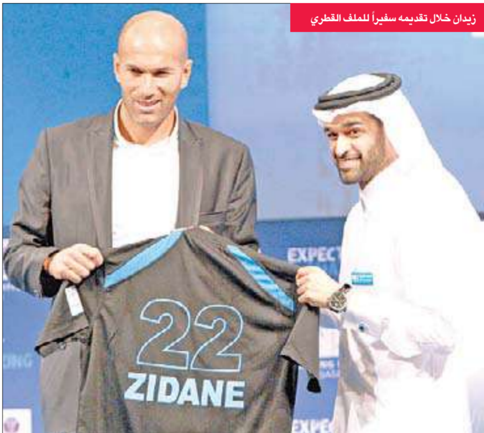
زيدان خلال تقديمه سفيراً للملف القطري

اعترف نجم كرة القدم الفرنسي السابق زين الدين زيدان بأنه تلقى «مبلغاً كبيراً» من المال لدعم ملف الترشيح القطري لاستضافة مونديال 2022، مشيراً إلى أنه سيخصصه لتعزيز المشاريع الخيرية التي تديرها مؤسسته. وقال زيدان: «طبقاً لما ذكرته جريدة ليكيب الفرنسية: «يتحدث البعض عن 10 أو 11 أو 13 مليون يورو... ساقول الأمر بوضوح إنه جنون لأن الأمر لم يصل إلى ربع هذا المبلغ». وأشار قائد المنتخب الفرنسي السابق، الذي وصلت بعض وسائل الإعلام المحلية إلى وصف دعمه للملف القطري بـ«الدعارة»، إلى أنه لا يمكن الكشف عن المبلغ الذي تلقاه بسبب بند يقتضي بسريته ولكنه أوضح أنه كان «كبيراً». ولفت من ناحية أخرى إلى أنه أصيب بالإرهاق من تبرير الوظيفة التي يلعبها حالياً في ريال مدريد كاستشار، مؤكداً أنها ليست وظيفة «خيالية». وأكمل النجم الفرنسي: «أنا موجود في التدريبات يومياً ومع المدرب ومع أعضاء مجلس الإدارة ولدي مكتبي الخاص».