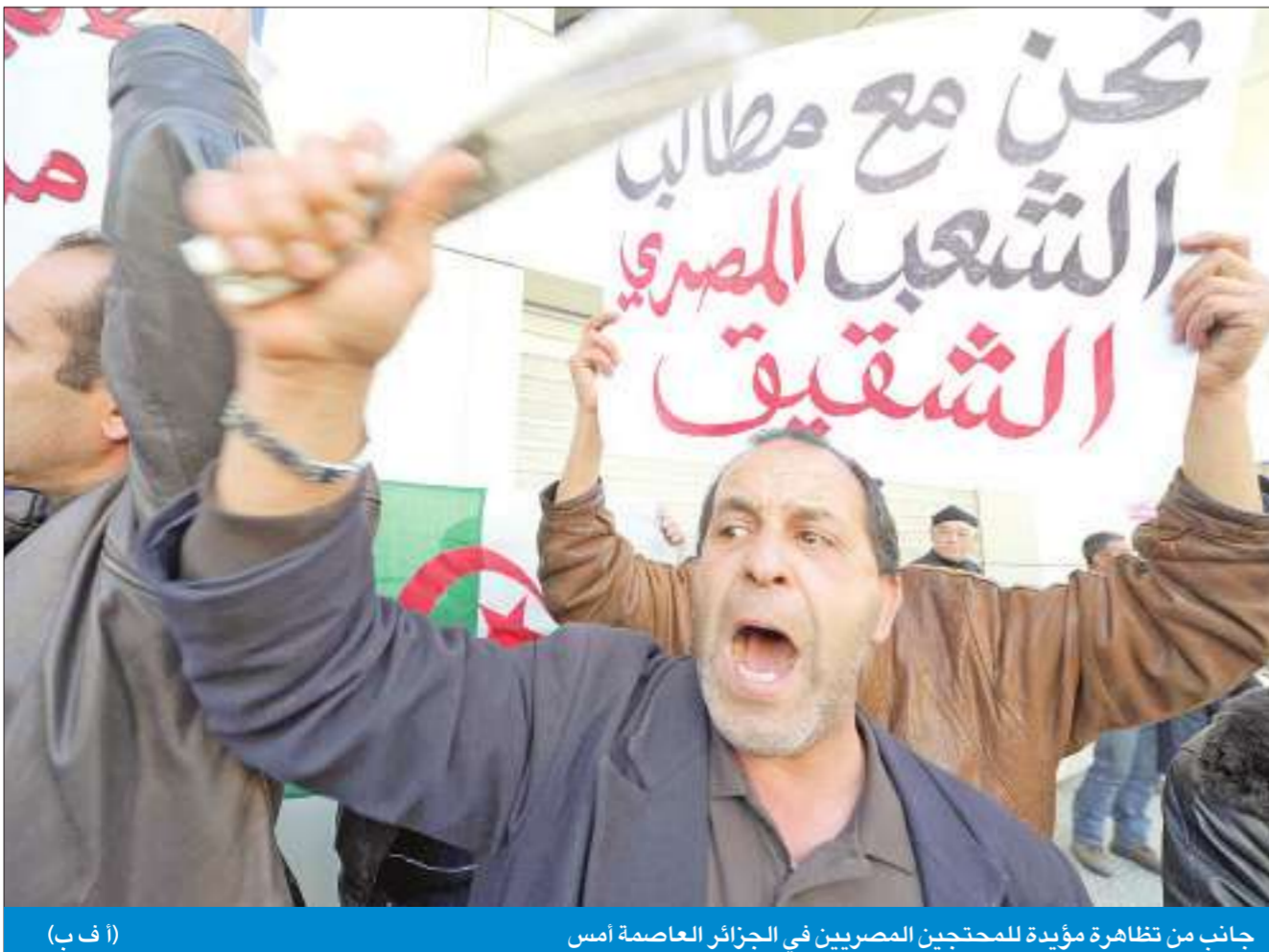
جانب من تظاهرة مؤيدة للمحتجين المصريين في الجزائر العاصمة أمس

وقد طلب أمس اختلاف "ثورة شباب الغضب" من شيخ الأزهر د. أحمد الطيب الاستقالة وترك منصبه، احتجاجاً على ما أسموه "أعمال العنف التي مارسها نظام مبارك ضد أبناء الشعب". إلى ذلك، اعتبرت جماعة "الإخوان المسلمين" عبر بيان أصدرته أمس أنها ما زالت ترى في "القرارات التي يصدرها الرئيس غير الشرعية محاولة