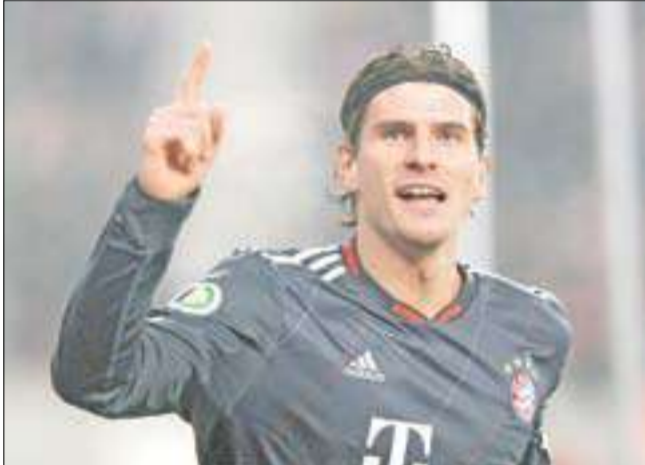
فرناندو توريس من ليفربول مقابل 60 مليون يورو.

كشفت مهاجم بايرن ميونخ ماريو غوميز أن ناديه رفض عرضاً قيمته 42 مليون يورو للتخلي عنه لمصلحة تشلسي خلال فترة الانتقالات الشتوية التي أقيمت في نهاية يناير الماضي. وقال غوميز في تصريح صحيفي «ببداً الرياضية: لم اعلم بالعرض الرسمي الذي تقدم به تشلسي إلا بعد أن رفضه بايرن ميونخ».