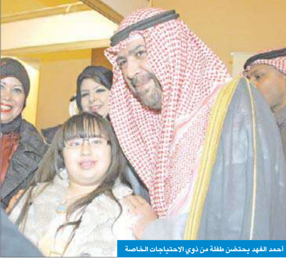
أحمد الفهد يحتضن طفلة من ذوي الاحتياجات الخاصة

العامة لشؤون ذوي الإعاقة د. جاسم الخمار أن القانون رقم 8 لسنة 2010 الصادر في شأن حقوق الأشخاص ذوي الإعاقة، هو ثمرة نجاح التعاون البناء بين السلطين التشريعية والتنفيذية وقد أتى متطابقاً مع المواثيق العربية والعالمية التي تهتم بحقوق الإنسان، مشيراً إلى ان إنجاز القانون يعد مؤشراً للرقى الحضاري والدخول ضمن صفوة دول العالم المتقدمة لاحترام كرامة الإنسان.