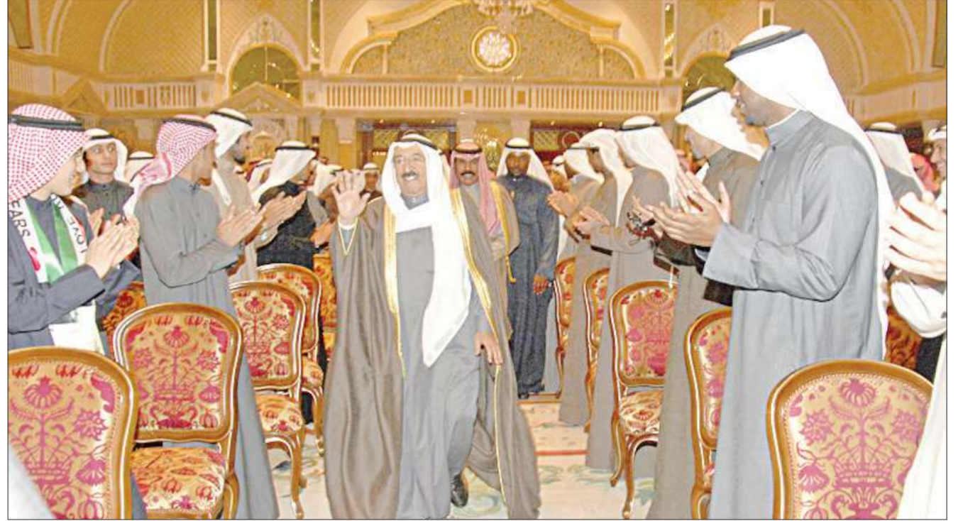
الرياضيون يحيون سمو الأمير