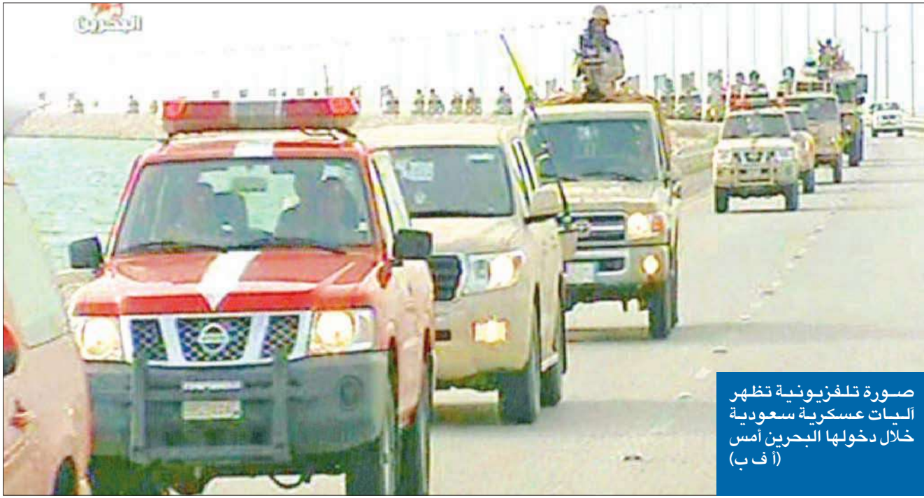
صورة تلفزيونية تظهر البات عسكرية سعودية خلال دخولها البحرين أمس (أ ب)

● طهران: لن نقف مكتوفي الأيدي ● واشنطن: يجب احترام حقوق البحرينيين ودخول القوات السعودية ليس غزواً ● المعارضة البحرينية: أي تدخل هو احتلال ونطالب مجلس الأمن بالتحرك