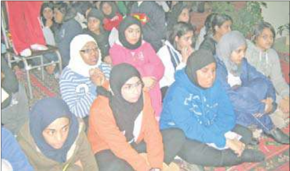
مستمعات إلى الندوة التوعوية

أقامت جمعية المرشدات الكويتية ندوة توعوية تحدث فيها رئيسة وحدة التشخيص الإكلينيكي للثدي بمستشفى الصباح د. نورالهدى كرمانى عن آخر التطورات في مجال تشخيص أمراض الثدي المختلفة، مع التركيز على أهمية الكشف المبكر عن سرطان الثدي والوسائل المتاحة في هذا المجال.