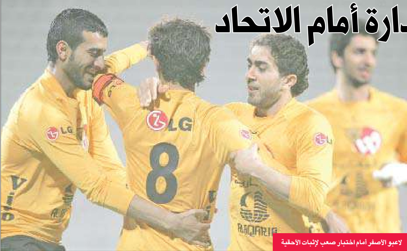
لاعبو الأصفر أمام اختبار صعب لإثبات الأهمية

ونحن لا نريدها مباراة تادية واجب أو ردا للاعتبار، بل مباراة بين فريقين شقيقتين كبيرين وعريقين تقبل الفوز والخسارة». وذكر أن «هناك بعض الغيابات في الفريق، لكنها غير مؤثرة ووضعتنا حوللا لكل الاحتمالات التي قد نواجهها، «منمننا ان يكون الأداء نظيفا بعيدا عن الخشونة والأصايات، وبين أن فريق القادسية تنتظره مباريات مصيرية وحاسمة في الدورى الكويتي أسام العربي