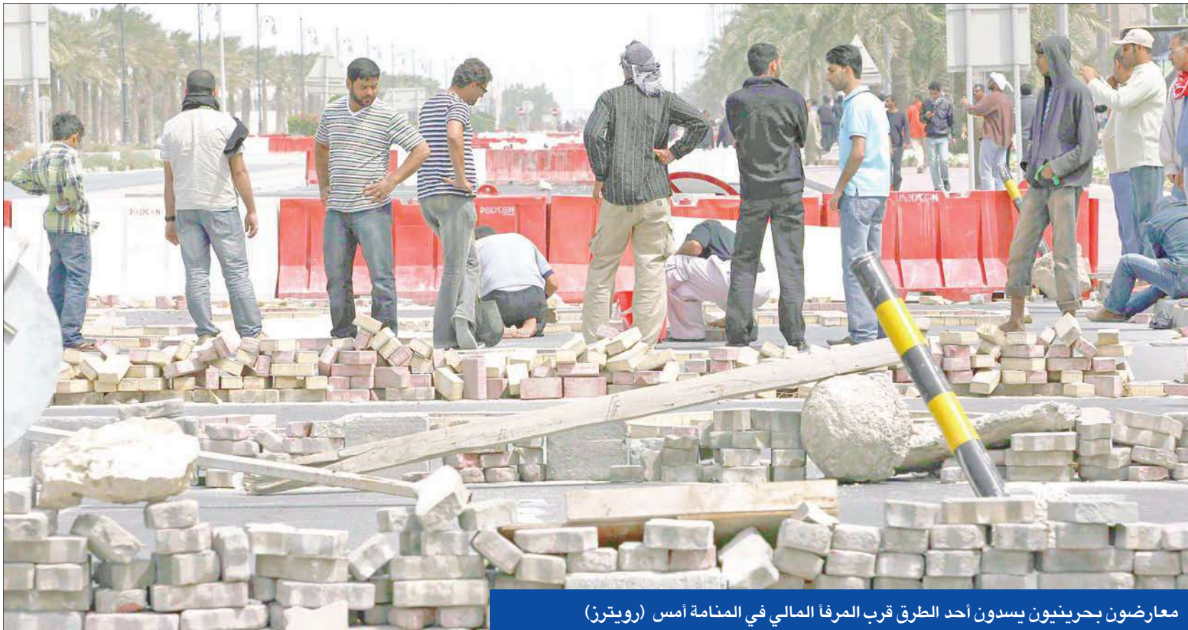
معارضون بحرينيون يسدون أحد الطرق قرب العرفا المالي في المنامة أمس

● الرياض: سواجه مثيري النعرات الطائفية بحزم ● طهران: نتظر الاستجابة لمطالب الشعب ● المعارضة تعتبر أي تدخل خارجي «احتلالاً سافراً»... وتطالب الأمم المتحدة بحماية المدنيين