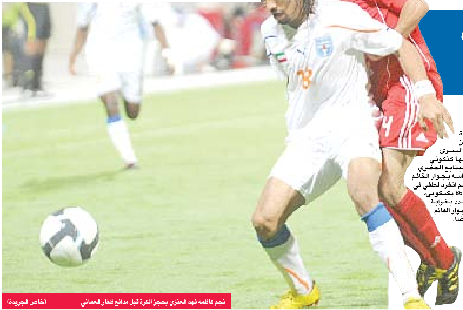
نجم كاظمة فهد العنزي يحجز الكرة قبل مدافع ظفار العماني