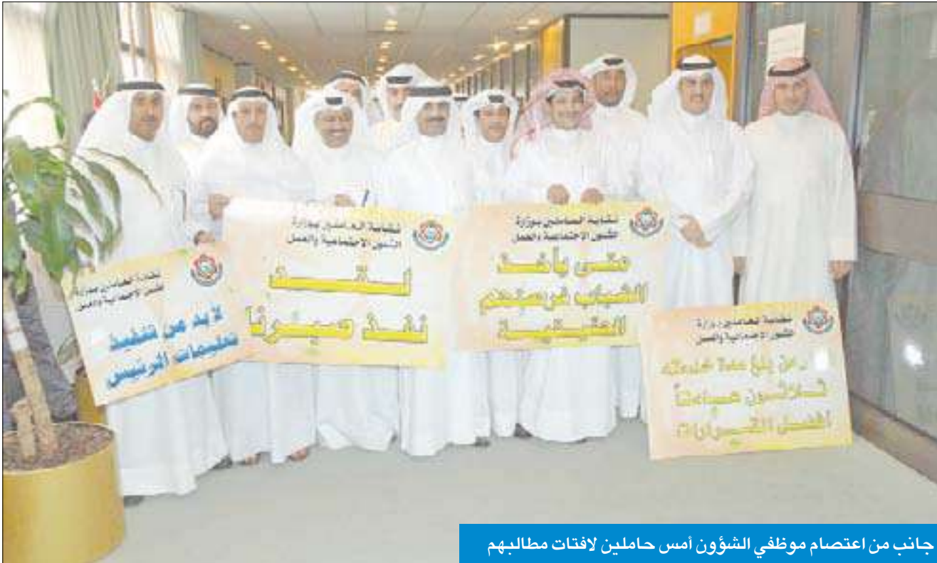
جانب من اعتصام موظفي الشؤون أمس حاملين لافتات مطالبهم