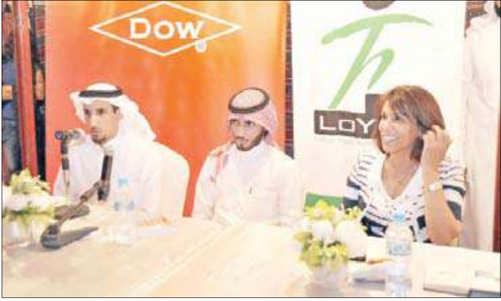
الدالي تقدم الأمسية الشعرية