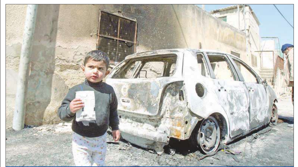
طفل فلسطيني أمام سيارة ومنزل تعرضا لاعتداءات من المستوطنين اليهود في بلدة جن صافوت في الضفة الغربية أمس (أ ف ب)

صاقت لجنتان في الكنيست أمس، على مشروعي قانونين يعتبران ضمن سلسلة القوانين العنصرية، وهما مشروعا «قانون النكبة» و«قانون عزمي بشارة». وأقرت لجنة القانون والدستور في الكنيست مشروع «قانون النكبة» الذي قدمه عضو الكنيست الكس ميلر من حزب «إسرائيل بيتنا»، وذلك قبل طرحه على الهيئة العامة للكنيست للتصويت عليه بالقراءتين الثانية والثالثة. وينص مشروع القانون على أنه سيكون بإمكان وزير المالية خفض الميزانيات لهيئات تمولها الحكومة مثل جمعيات ومنظمات وسلطات محلية في حال إحيائها لذكرى «النكبة» الفلسطينية، وهو ما يعتبره مشروع القانون أنه يمس باحترام علم الدولة أو رموزها» أو ضد من ينفي وجود إسرائيل «كدولة يهودية وديمقراطية».