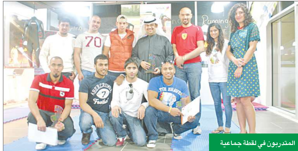
المتدربون في لقطة جماعية

النادي في مسابقة الرجل الحديدي في اليابان، ومسابقة (The Flying Start) ضمن رياضة الترياثلون في الكويت. وتتمحور المسؤولية الاجتماعية لشركة «VIVA» حول خمسة حقول: التعليم والتطوير، الوقاية، الصحة، الريادة في الإنتاجية وتعزيز القيم المجتمعية، وتم من خلال هذه الدورة التركيز على حفل الصحة لنشر التوعية الصحية بين كل شرائح