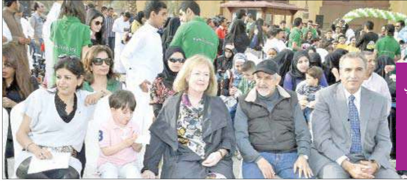
وزير الصحة وحرمة يتوسطان العتال والسقاف