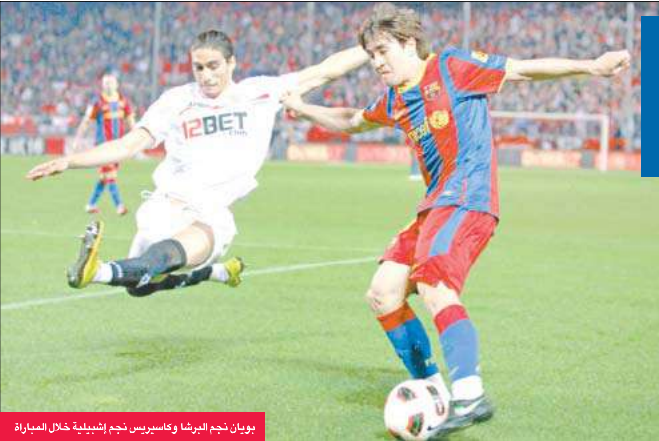
بويان نجم البرشا وكاسيريس نجم إشبيلية خلال المباراة