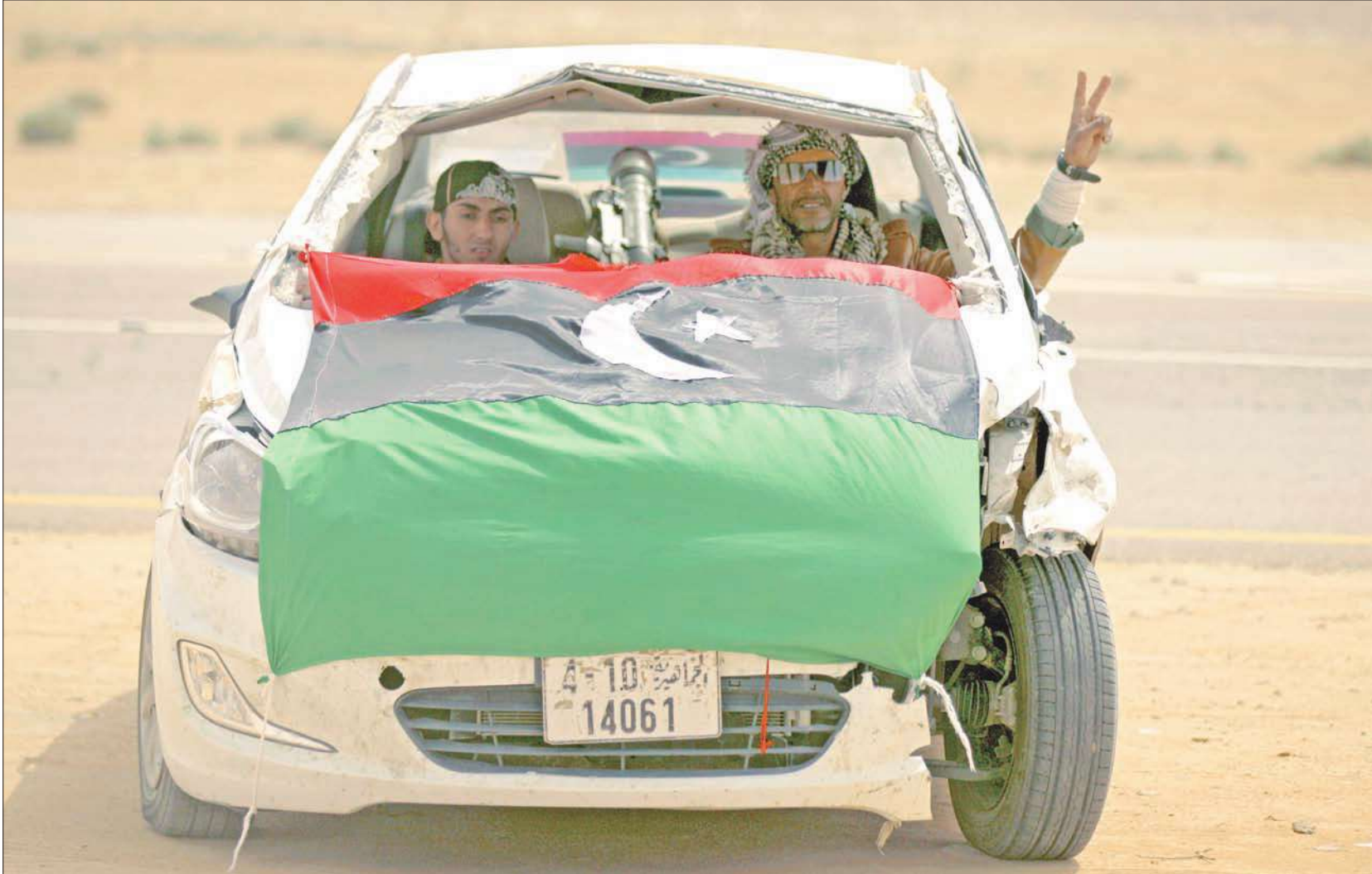
مسلحان من المعارضة الليبية في سيارة ثبتت عليها قذيفة صاروخية من نوع «سام 7» قرب أجدايا أمس

مجلس الأمن و«مجموعة الثماني» يبحثان الحظر الجوي... وواشنطن تؤكد أن لا قرار سياسياً بهذا الشأن حتى الآن