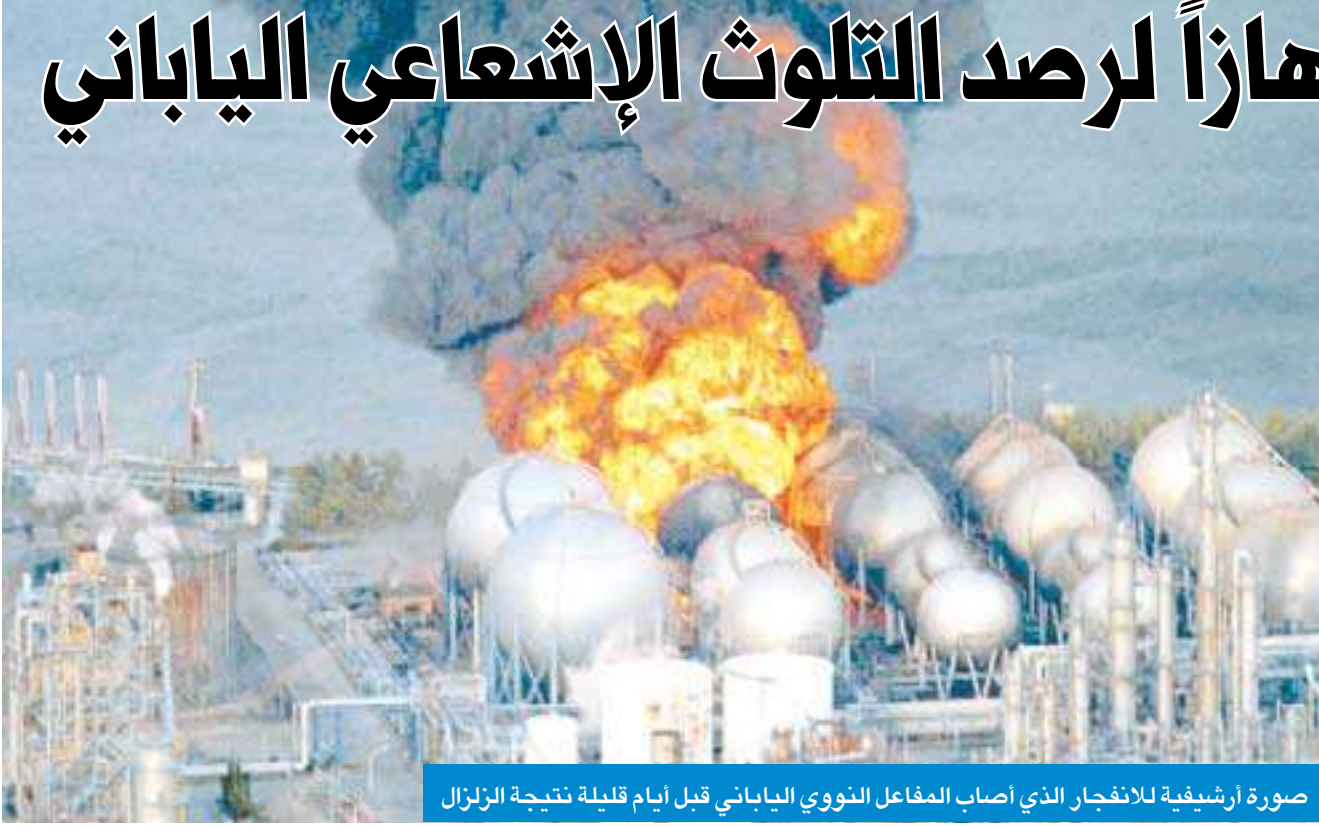
صورة أرشيفية للانفجار الذي أصاب المفاعل النووي الياباني قبل أيام قليلة نتجة للزلزال

أعلن عدد من المختصين والهتمين بالشأن البيئي على عدم خطورة ما حصل في اليابان من تسرب نطفي، إثر الزلزال المدمر الذي ضرب اليابان وأسفر عن انفجار المحطة النووية الأولى في مدينة فوكوشيما اليابانية. علنا في الكويت، مؤكداً أن البعد الجغرافي بين البلدين يحول دون ذلك.