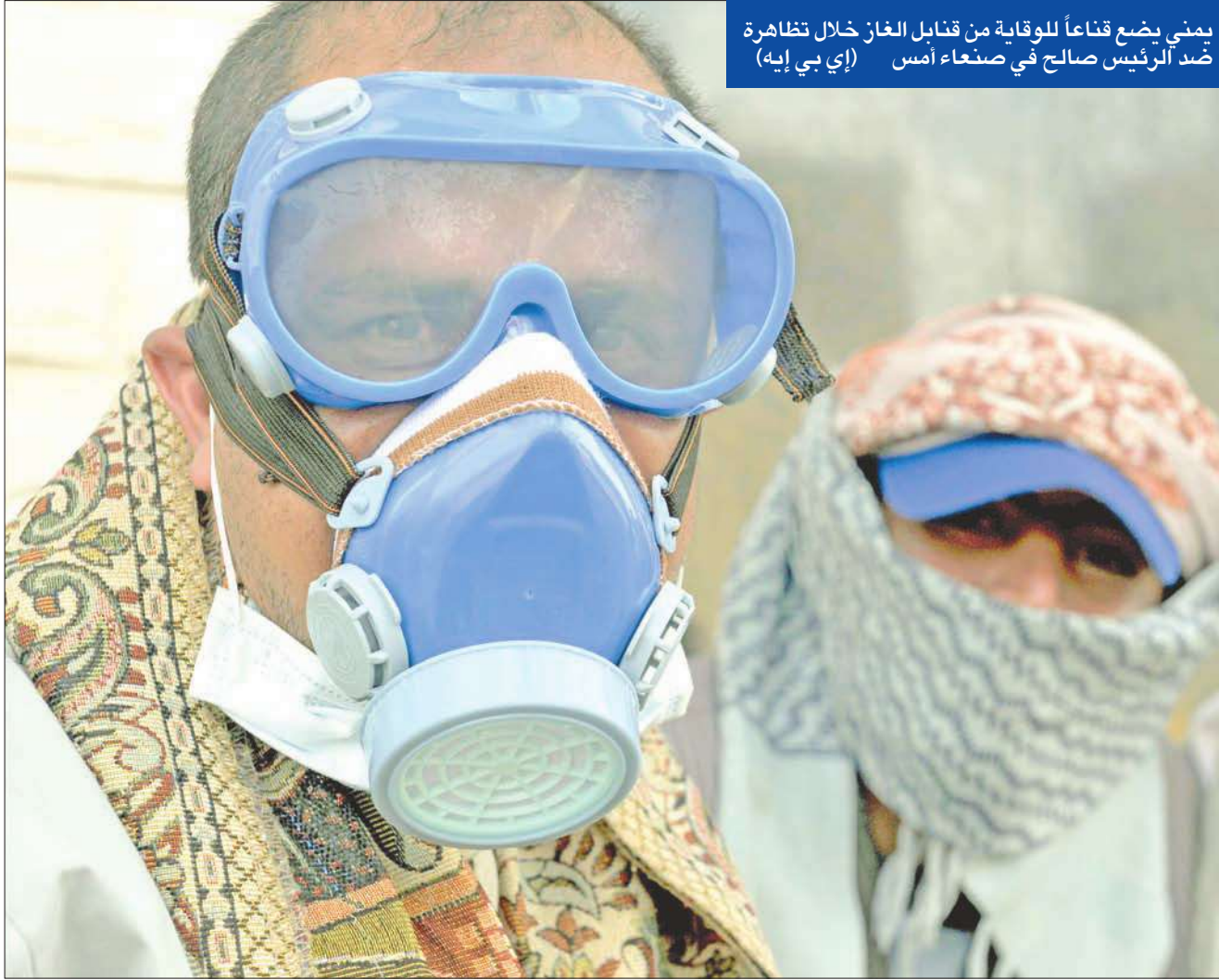
يمني يضع قناعاً للوقاية من قنابل الغاز خلال تظاهرة ضد الرئيس صالح في صنعاء أمس

مدينة الحوطة عاصمة محافظة لحج جنوب اليمن. وذكر أحد السكان أن «الحوطة في حالة شلل، والمعارضة دعت إلى إضراب عام احتجاجاً على قمع مختلفة من البلاد للمطالبة باستقالة الرئيس علي عبدالله صالح، وبدا أن الطرف المؤيد لصالح والطرف المعارض له بدأ يصعدان أعمالهما على الأرض».