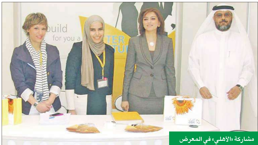
مشاركة «الأهلي» في المعرض

إنكي: الشباب الكويتيون أثبتوا قدرتهم على العمل في «الخاص»