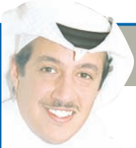
تركيب الدخيل www.turkid.net

واليابانيون مسالمون، بعكس العيران المتوحشين حتى في تسمية ابنائهم «ذفاف الدم، القعقاع (أحد الخليجيين أطلق على ابنه اسم القعقاع وأدخله مدرسة فرنسية فتحوّل اسمه إلى كاك)، جراح، ضاري، مهاوش، نمر، سيف، مناطق، جاسم، بطّاح»، ليش كل هذا القصف الجوي؟ حرب عالمية؟ في حين تسال الياباني عن اسمه فيجيب «سو» وكان الله غفوراً رحيماً، وتستفسر منه عن معنى الاسم فيشرح لك: «ورقة عيد الشمس»، شوف الأناثة والبهوء، وتسال المصرية عن اسمها فتجيبك بغير وهي تفرم الملوخنة وتنتز الزيت على الحلة ببذخ، «كاداهم»، ويناديها زوجها «الولبة»، وتسال اليابانية فتجيبك وهي تمسك بأعواد الأكل وترافق الساعة، «تي» ويدلها زوجها: «با، أي فديت الزول، وفي أسواق الصرف تعامل تي» وخسا وثمانين واحدة من «كاداهم»، وتعطس كاداهم «عاطسو»، فترتج الأرض ويبيكي أطفالها هلعاً، قبل أن تتحلمط يا لهوي بمة»، وتعطس تي عطسة مختصة «نس» مع إغماضة العين المغمضة أصلاً، وفي اليابان يولد الطفل فتشترى له أمه جهاز روبوت (الرجل الآلي) يعذب به ويفككه، وفي الجزائر يهدى المولود قنينة بدوية، وعند زواجه يهديه أصحابه دانة مدفع (155 ملم)، وفي اليمن يهدى المولود «جنيبة» أي خنجر، فإذا بلغ الفطام إهداه أبوه قنينة «اربي جي»، يتسلى بها الكلاسيكوف للبنات فقط، لا يجوز إهداؤه للرجال (عيب)، واليماني الأمي يفكك الأربي جي وهو مغضض العينين، قطعة قطعة، والياباني يقيس أشعة الشمس وهو في تالي