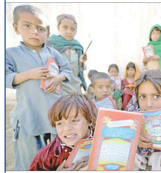
أطفال أفغان يحملون كتباً وزعمها عليهم مكتب المحافظة في هلمند أمس الأول

وقان قائد الشرطة المحلية في قندوز عبدالرحمن سيد خيلي وأربعة أشخاص آخرين قد قتلوا الأسبوع الماضي، في تفجير نفذه انتحاري على دراجة نارية وتبناه أيضاً مقاتلو «طالبان».