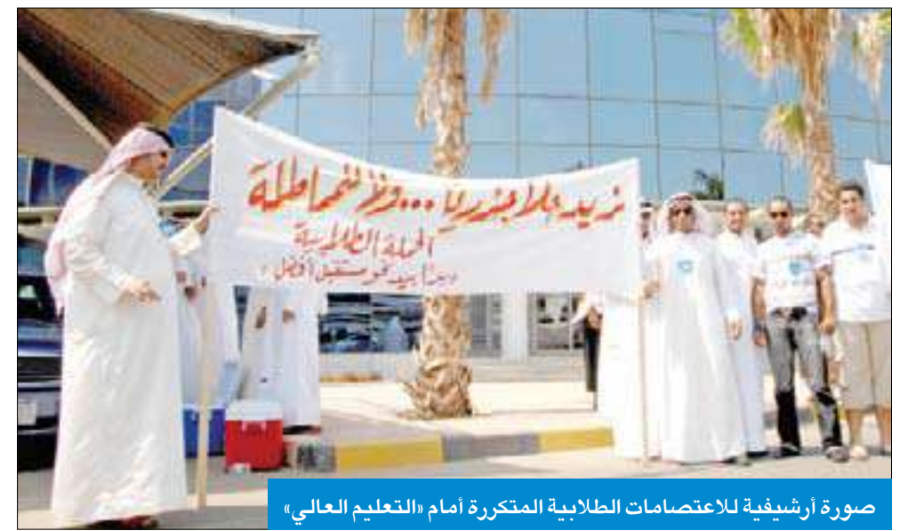
صورة أرشيفية للاعتصامات الطلابية المتكررة أمام «التعليم العالي»

وجدت «الجريدة» أمام مباني «التعليم العالي» العشري في المنطقة الحرة بعد أن نعى إلى علمها احتمالية وجود اعتصام طلابي لطلبة أميركا أمام مبنى «1» رافضين العودة إلى أميركا في الوقت الحالي. وحاولت «الجريدة» التقاء مسؤولي الوزارة للاطمئنان على الطلبة الدارسين في الخارج إلا أنهم طلبوا إرسال كتاب رسمي إلى وكيل الوزارة د. خالد السعد لإعطاء الضوء الأخضر بمقابلة المسؤولين رغم أن السعد غير موجود في الكويت، وهاتفه النقال مغلق، وعند محاولة التحدث إلى سكرتيرة مكتبه عبر الرقم الداخلي جاء الرد من جهاز الرد الآلي بأن «صندوق البريد ممتلئ ولا يمكن استقبال أي رسالة جديدة...» والسؤال إلى وزارة التعليم العالي صاحبة المباني العشرة، ماذا لو احتاج أحد الطلبة الدارسين في الخارج إلى مساعدة مستعجلة من الوزارة في ظل الأوضاع الأمنية في القارات المختلفة؟ من سيتلقى هذا الطالب الذي يعاني الغربة والأوضاع الأمنية السيئة؟