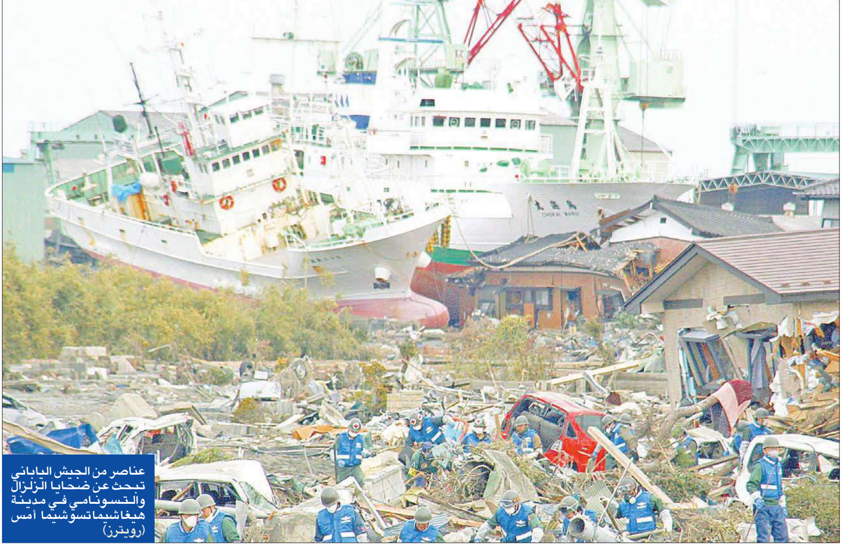
عناصر من الجيش الياباني تحسنت عن ضحايا الزلزال والتسونامي في مدينة هياغاشيما تسوشيما أمس

إلى أن الانفجارين اللذين وقعوا في محطة نووية يابانية لا يشكأن أي خطر على روسيا وإن يؤثر على تطوير قطاع الطاقة النووية فيها. وصرح ميدفيديف بأن اليابانيين «يواجهون كارثة وطنية» ويجب مساعدتهم. مشيراً إلى أنه أجرى اتصالاً هاتفياً برئيس الوزراء الياباني، مؤكداً استعداد روسيا لتقديم أية مساعدة.