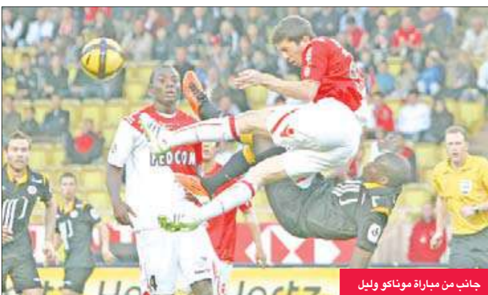
جانب من مباراة موناكو وويل