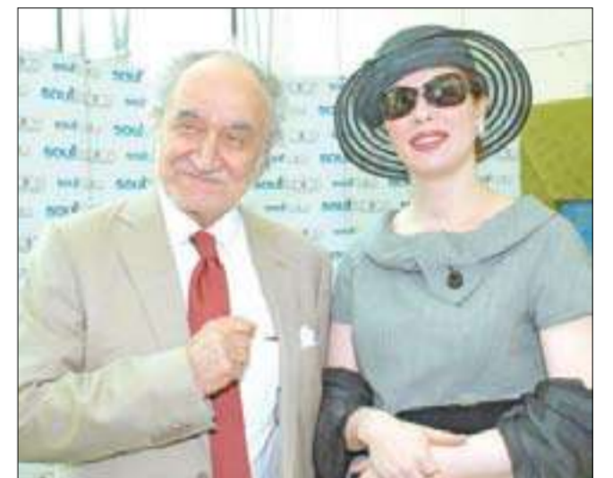
سهام الجراف واولنا