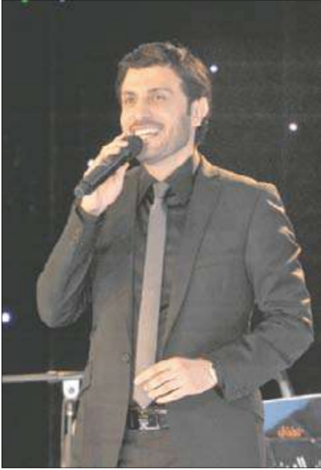
المهندس خلال الحفل

بعد أن غاب عن الحفلات الغنائية الجماهيرية بالإمارات ثلاث سنوات تقريباً، تألق "برنس الغناء العربي" الفنان ماجد المهندس في حفله يوم الجمعة الماضي، وقدم أجمل أغنياته أمام الجمهور الكبير الذي احتشد في صالة الأندلس بفندق غراند حنتور في دبي، وبقي حتى ساعات الصباح الأولى يغني ويتميل على أنغام الأغنيات التي يحفظها الجمهور عن ظهر قلب. وبدأ المهندس وصلته الغنائية، على أنغام أغنية "أتوسل بك"، بمصاحبة فرقته الموسيقية التي ترافقه دائماً في جميع حفلاته بقيادة المايسترو مدحت خميس، لينتقل بعدها إلى مجموعة من الأغنيات ضمن الجدول المخصص للحفل إلى جانب طلبات الجمهور، التي قام بتلبيتها جميعاً.