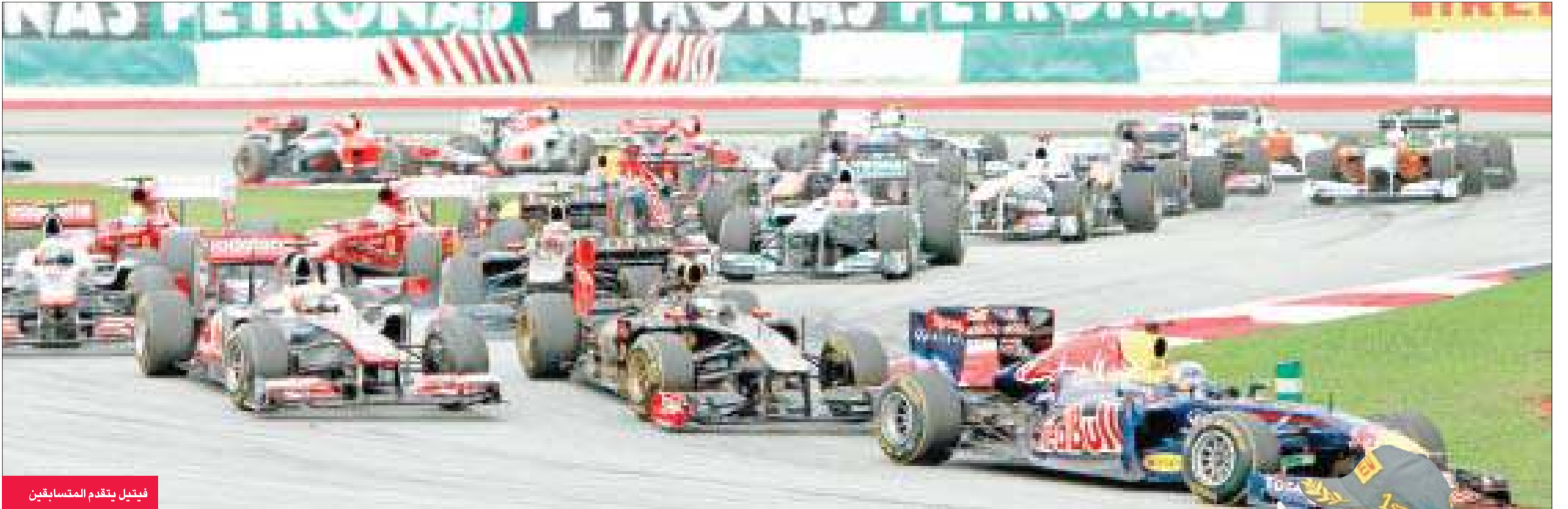
فيتيل يتقدم المتسابقين