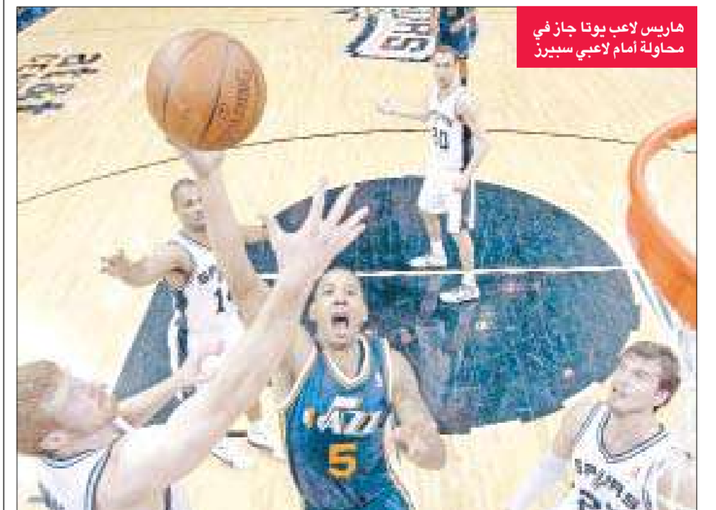
ماريس لاعب يوتا جاز في محاولة أمام لاعبي سبيرز

فاز موناكو على ضيفه ليل المتصدر 1-صفر، وبريست على ضيفه رين 2-صفر، فقدمتا خدمة كبيرة إلى مرسليليا حامل اللقب أمس في افتتاح المرحلة الثلاثين من الدوري الفرنسي لكرة القدم. في المباراة الأولى، سجل الدولي الكوري الجنوبي بارك تشو يونغ الهدف الوحيد (11) فارتفع رصيد موناكو إلى 35 نقطة، وتوقف رصيد ليل عند 58 نقطة. وفي الثانية، سجل نولان رو (29) وبرونو غروجي (57) الهدفين فوقف رصيد رين عند 51 نقطة في المركز الثالث. وعزز باريس سان جرمان موقعه في المركز الخامس بفوزه على مضيفه كاين بهدفين لكريستوف جاليه (12) وكليمان شاننوم (68)، مقابل هدف لرومان هاموما (90).