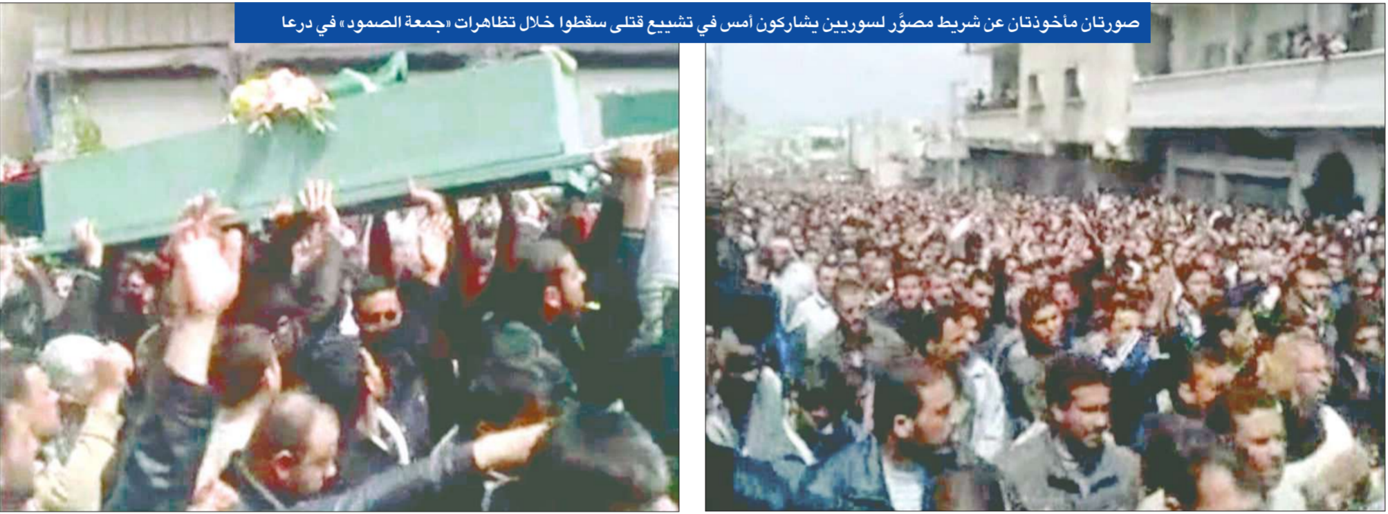
صورتان ماخوذتان عن شريط مصوّر لسوريين يشاركون أمس في تشييع قتلى سقطوا خلال تظاهرات «جمعة الصمود» في درعا

الحولة في محافظة حمص شوهد أفراد أمن وهم ينزلون من حافلات، وكان متظاهرون في الحولة دمروا أمس الأول تمثالاً للرئيس السوري بشار الأسد. وكان عشرات الآلاف السوريين في حمص شاركوا أمس الأول في تشييع عدد من الضحايا الذين سقطوا خلال تظاهرات يوم الجمعة التي أطلق عليها اسم «جمعة الصمود».