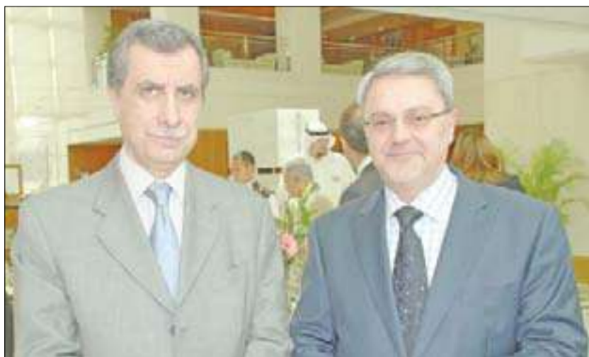
السفيران اللبناني والعراقي

افتتح فندق كورت يارد ماريوت، التابع لسلسلة فنادق ماريوت، مطعم سول أند سبيس الشهير للمأكولات الهندية، ورعى الافتتاح السفير الهندي لدى الكويت أجاى ملهوترا، ورئيس مجلس الإدارة العضو المنتدب لشركة الصالحة العقارية غازي النفيسي، بحضور عدد من كبار الضيوف والشخصيات الهامة وممثلين عن وسائل الإعلام المحلية، وإدارة فنادق ماريوت، إضافة إلى الشيف العالمي هاري نايبك والشيف راج.