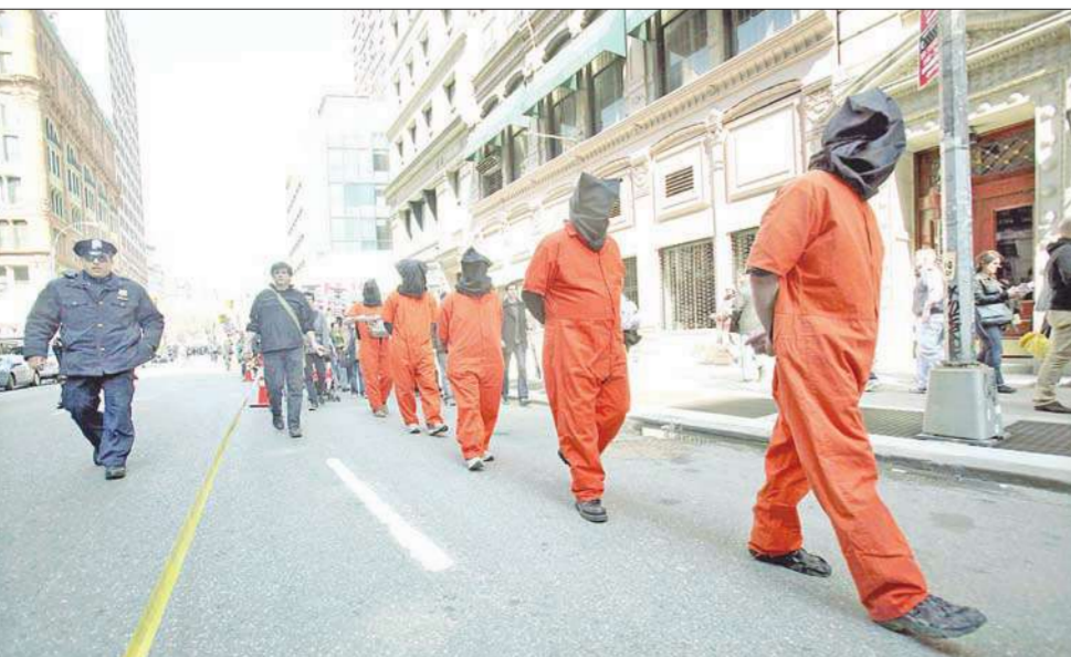
ناشطون يلبسون زي سجناء غوانتانامو في أحد شوارع نيويورك أمس الأول بمناسبة الذكرى الثامنة لدخول القوات الأميركية بغداد

النجيفي يكشف عن رغبة واشنطن إبقاء جزء من قواتها في العراق