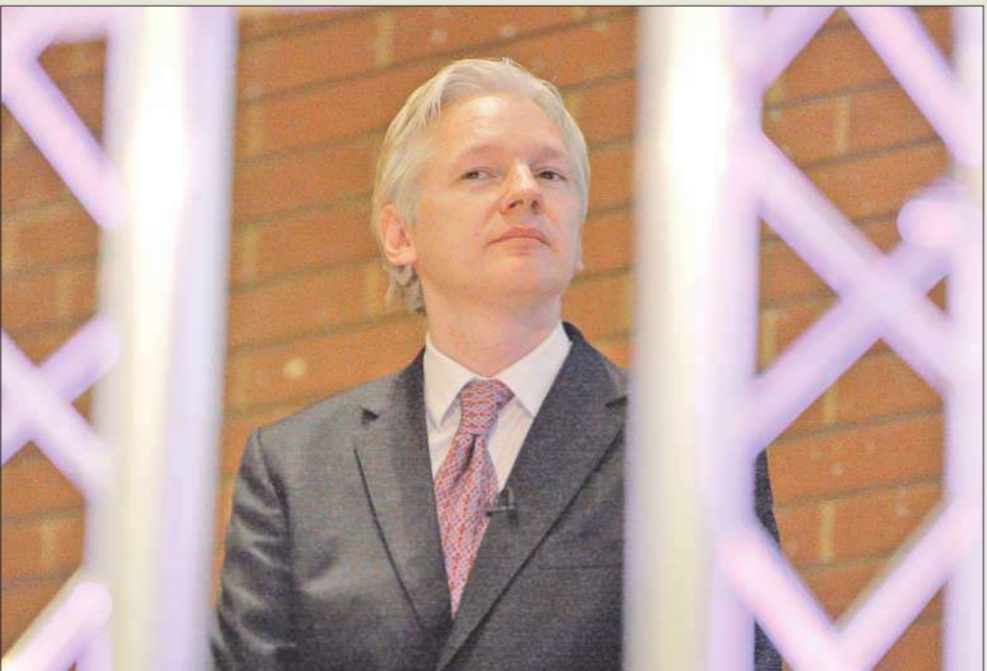
استاذ يستمع لمداخلة خلال مشاركته في جلسة حوار عامة في لندن أمس

وزارة الخارجية الأميركية الزابيت ديب وجلعاد غُدد في 19 سبتمبر عام 2005 قال الأخير أن سليمان أبلغه أن «الأسد غي وأذنيه صماء للنصائح». وجاء في البرقية أن إسرائيل تفضل بقاء الأسد في الحكم وأن جلعاد قال إنه «يستخف» بالأسد لكنه اعترف أن «سورية ستكون في وضع أسوأ كثير من دونه».