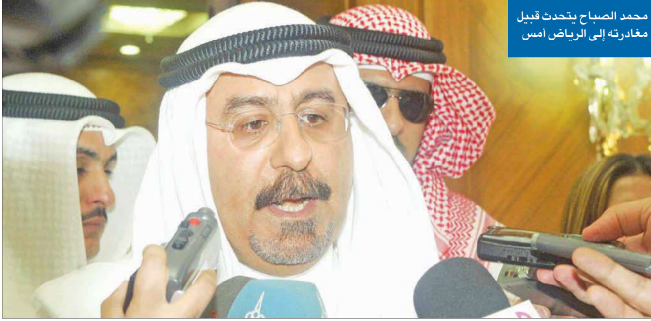
محمد الصباح يتحدث قبيل مغادرته إلى الرياض أمس