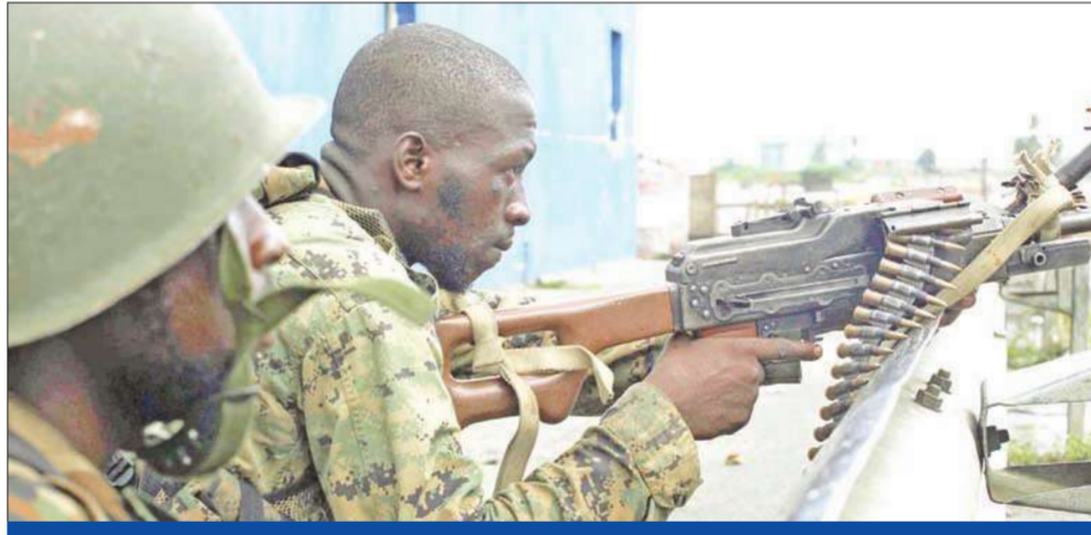
عنصران من القوات الموالية لوتارا متاهبان خلف سلاحهما في أبيجان أمس

إعادة تشكيل نفسها بعد أن تعرضت لهجوم وحشي من المتمردين المدعومين من الأمم المتحدة وقوات ليكورن الفرنسية في ساحل العاج. (أبيجان - أ ف ب، رويترز، أ ب)