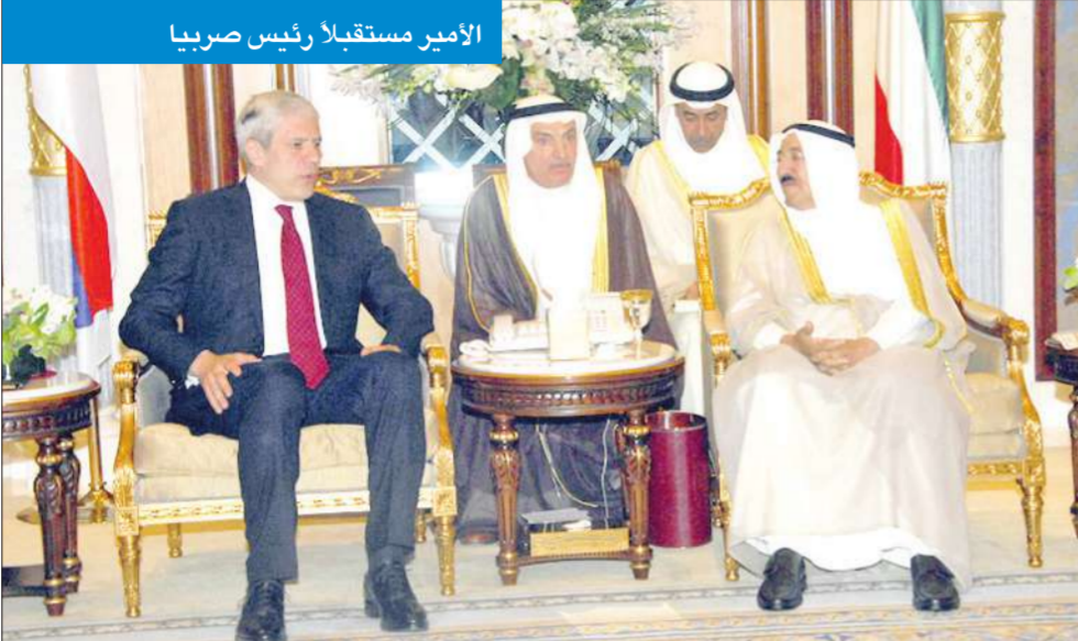
الأمير مستقبلاً رئيس صربيا

صاحب السمو يأمر بتخصيص 19 مليون دينار لدعم الألاف