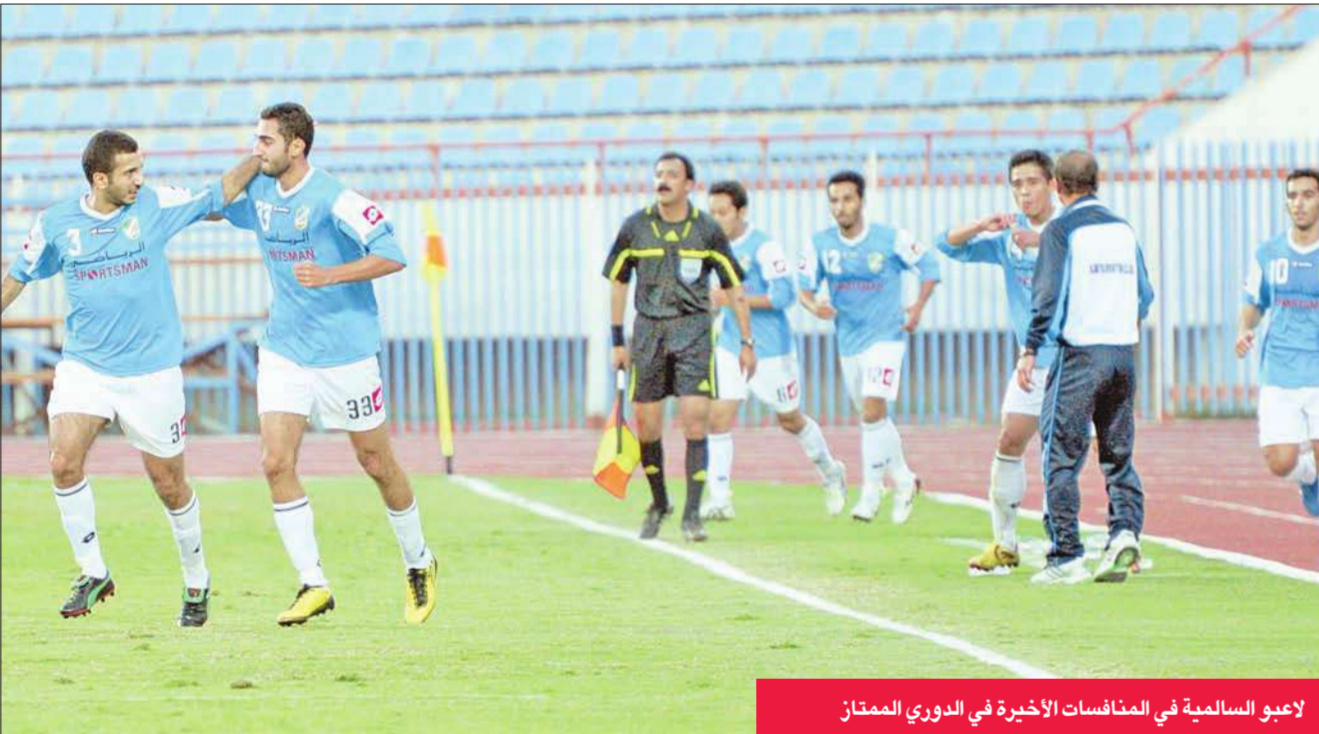
لاعبو السالمية في المنافسات الأخيرة في الدوري الممتاز