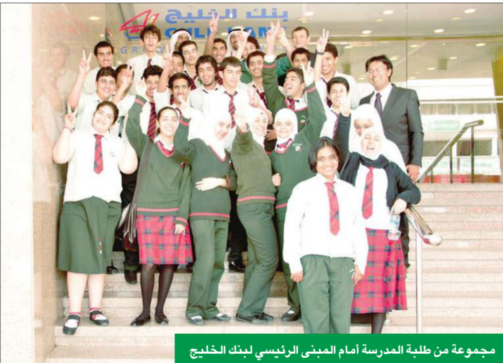
مجموعة من طلبة المدرسة أمام المبنى الرئيسي لبنك الخليج

أعلن بنك الخليج ختام استضافته لبرنامج "ظل العمل" الذي تنظمه مؤسسة إنجاز الكويت، إذ استضاف خمسة وعشرين طالبا وطالبة من مدرسة الكويت الإنكليزية الوطنية، وقد زار الطلبة فرع البنك الرئيسي في شارع مبارك الكبير والنقوا عددا من المسؤولين من ذوي الخبرة الذين أتاحوا لهم فرصة التعرف عن كخب بالعمل اليومي في عدد من إدارات البنك، وتجربة الحياة العملية والمهنية بكل تفاصيلها. وقد استمع الطلبة إلى شرح من عدد من موظفي الإدارات في بنك الخليج من ذوي الخبرة في مجالاتهم، الذين قدموا عروضاً توضيحية شملت التسويق والاتصال، ومكافحة غسل الأموال، والموارد البشرية، ومركز الخدمة الـهاتفية المصرفية، والتعلم والتطوير، فضلاً عن فريق العلاقات العامة وفريق الخدمات المصرفية للشركات.