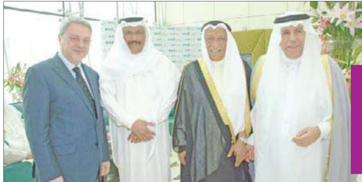
غازي النفيسي والسفيران السعودي والعراقي