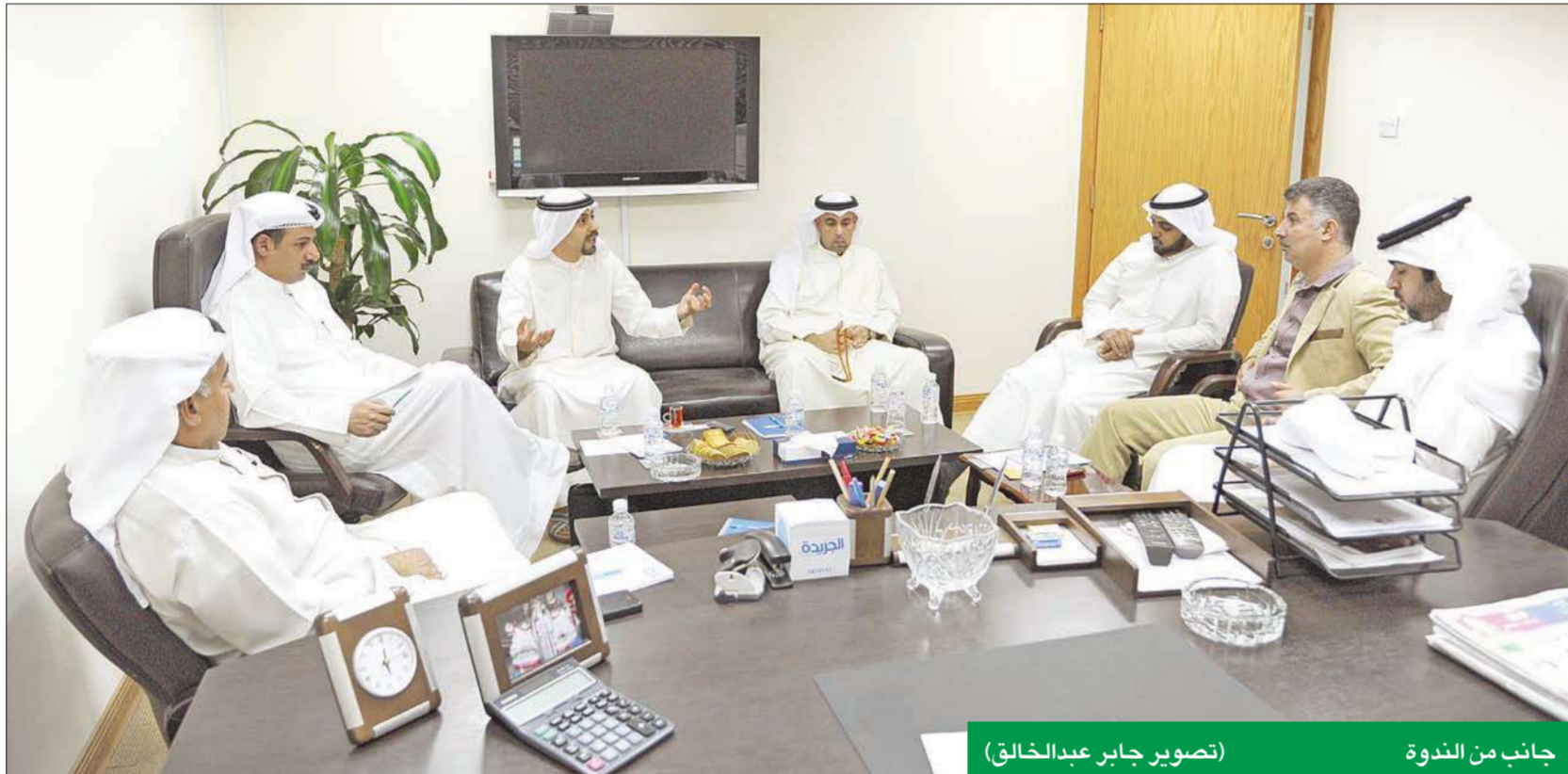
جانب من الندوة