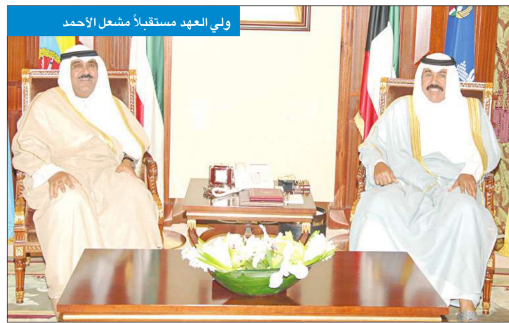
ولي العهد مستقبلاً مشعل الأحمد

استقبل سمو ولي العهد الشيخ نواف الأحمد بقصر بيان أمس رئيس مجلس الأمة جاسم الخرافي، واستقبل سموه نائب رئيس الحرس الوطني الشيخ مشعل الأحمد. واستقبل سموه سمو الشيخ ناصر المحمد رئيس مجلس الوزراء. كما استقبل سموه نائب رئيس مجلس الوزراء وزير الخارجية الشيخ الدكتور محمد الصباح، واستقبل سموه رئيس جهاز الأمن الوطني الشيخ محمد خالد.