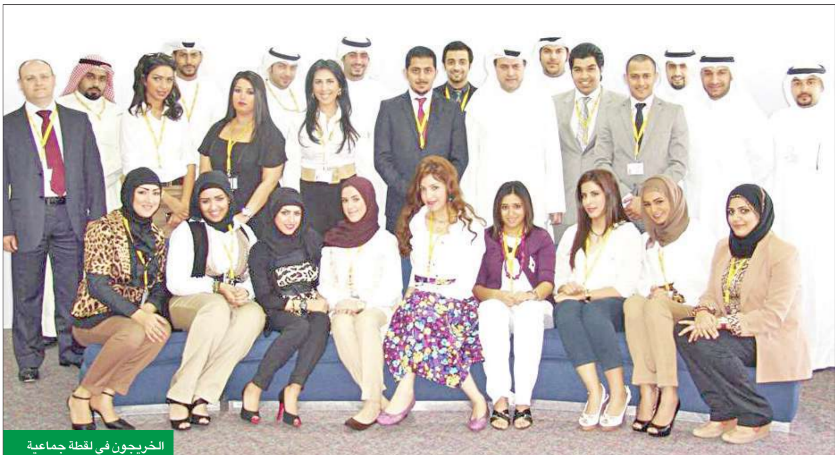
الخريجون في لقطة جماعية

على أكاديمية الأهلي لما قدموه من دعم و تأهيل لخوض حياتهم العملية المصرفية. يذكر أن أكاديمية الأهلي قامت منذ أن تأسست في عام 2009 بتخريج الكثير من الكوادر المصرفية المؤهلة والمدربة تدريباً جيداً للقيام بمهام عملها على أفضل وجه.