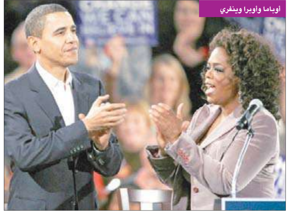
أوباما وأوبرا وينفري

نفى فريق مقدمة البرامج الأميركية أوبرا وينفري ما يتردد عن أنها لن تدعم حملة إعادة انتخاب الرئيس الأميركي باراك أوباما.