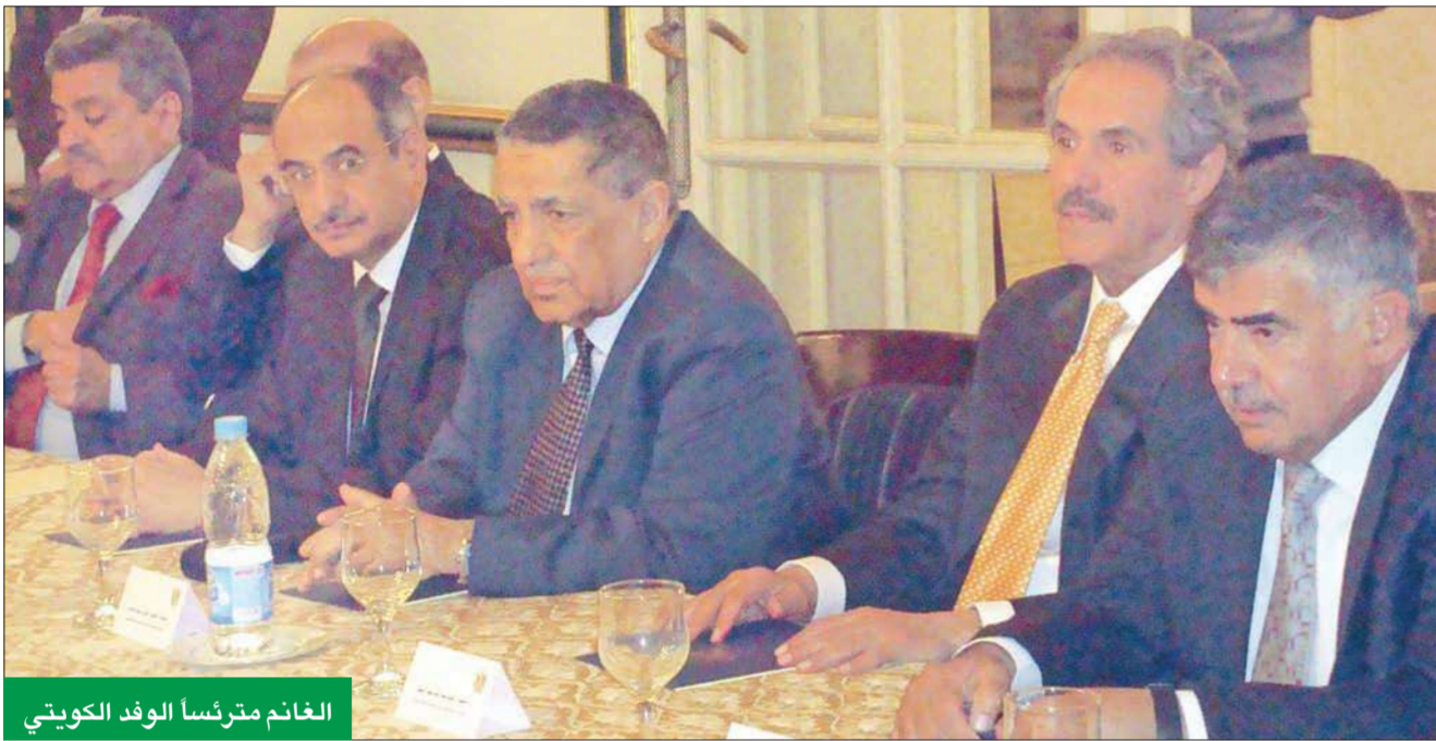
الغانم مترئساً الوفد الكويتي

في مصر وتشجيعها، ومعالجة كل الحالات الخاصة والعامة التي تعترضها، وقد بارك رئيس الوزراء المصري، كما أيد الوزراء الذين اجتمعوا بالوفد هذا الاتجاه وأكدوا تعاونهم لجناحه، وبقينا ان هذا الاتفاق سيلقى كل الدعم والتشجيع على المستوى الرسمي الكويتي أيضا، علما بأن الوفد استمع الى تأكيدات واضحة وصريحة بأن معالجة أية أشكال يواجه الاستثمارات الكويتية في مصر، ستكون في إطار التشريرات والعقود، ويعيدا عن أية ضغوط واعتبارات سياسية.