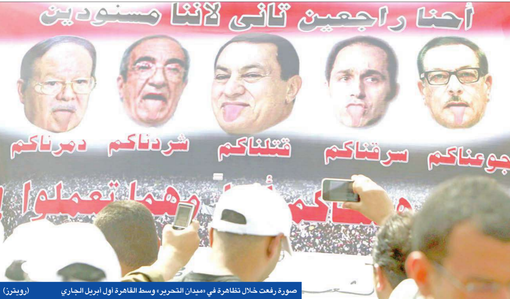
صورة رفعت خلال تظاهرة في «ميدان التحرير» وسط القاهرة أول أبريل الجاري

منع الوليد بن طلال من التصرف في أرض «توشكى»