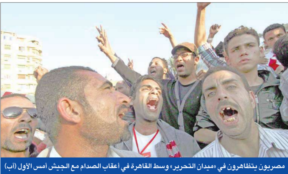
مصريون يتظاهرون في «ميدان التحرير» وسط القاهرة في أعقاب الصدام مع الجيش أمس الأول

وطالب الائتلاف خلال المؤتمر الصحافي الذي عقده أمس، في نقابة الصحفيين، بتقديم رؤوس الفساد للمحاكمة، خاصة الدائرة الرئيسية التي تحبب بالرئيس السابق وأسرتة وأعوانه. وأكد الائتلاف رفضه التام لحدوث أي انقسام داخل المؤسسة