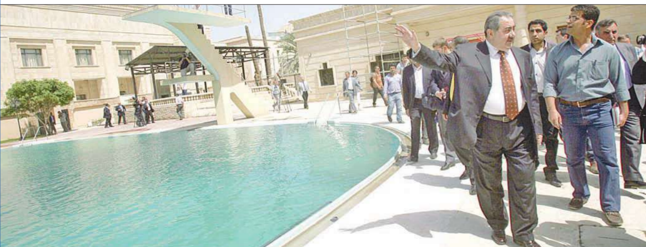
اصطحب وزير الخارجية العراقي هوشيار زبيري أمس، مجموعة من الصحفيين المحليين والأجانب في جولة في مقر عقد القمة العربية في بغداد، المقررة في 11 مايو المقبل في القصر الجمهوري السابق، الذي بلغت كلفة تجهيزه وإعادة هيكلته 450 مليون دولار. وفي الصورة زبيري مع عدد من الصحفيين أمس.

وقال الدباغ: «نحن لا نريد الوجود الأميركي في العراق، ونحن نقول للأميركيين بمحبة ومصادقة. جزامك الله خيراً وأن وجودكم انتهى، كما أن وجود الأمم المتحدة في العراق هو بناء على قرار من العراق، وهي ليست وصية على العراق ونشكر جهودها». يذكر أن الانسحاب الأميركي من العراق سيكون نهاية العام الحالي وفق الاتفاقية الأمنية الموقعة بين بغداد وواشنطن.