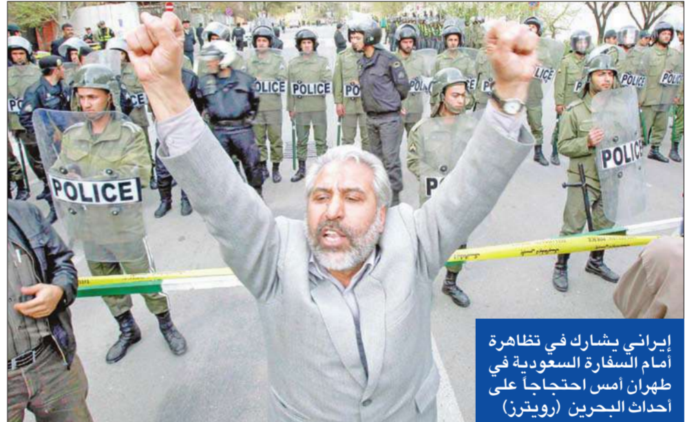
إيراني يشارك في تظاهرة أمام السفارة السعودية في طهران أمس احتجاجاً على أحداث البحرين

على أكبر صالحي في نهاية الأسبوع المقبل إلى العاصمة الإماراتية أبو ظبي، للمشاركة في اجتماع اللجنة الاقتصادية الإيرانية-الإماراتية المشتركة. وذكرت وكالة "مهز" الإيرانية شبه الرسمية أنه سيتم خلال هذا الاجتماع سبل تعزيز التعاون الاقتصادي بين إيران ودولة الإمارات العربية المتحدة. يشار إلى أن العلاقات بين إيران والإمارات اللتين تتنازعان السيطرة