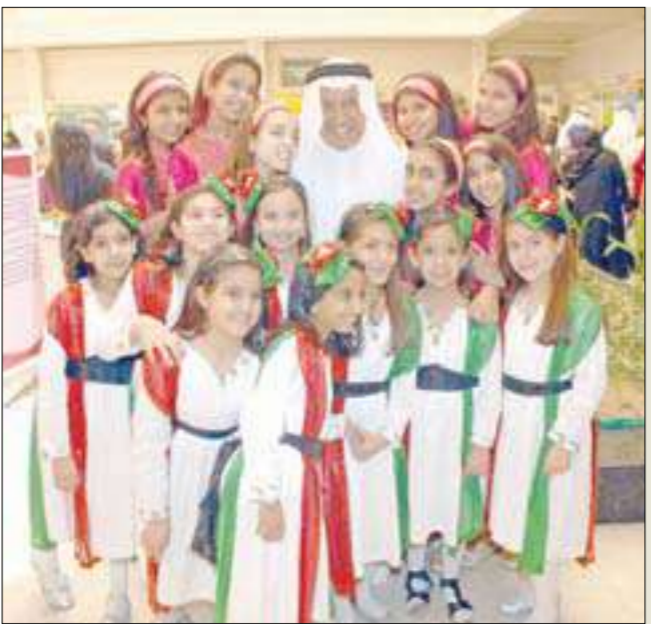
الطالبات والفنان جاسم النبهان

وقالت المؤسسة في بيان صحافي أمس، إن أسماء المواطنين المستحقين دخول هذه القرعة جاءت بناء على أولوية طلباتهم الإسكانية، والتي وصل التخصيص فيها حتى تاريخ السابع من أغسطس عام 2000.