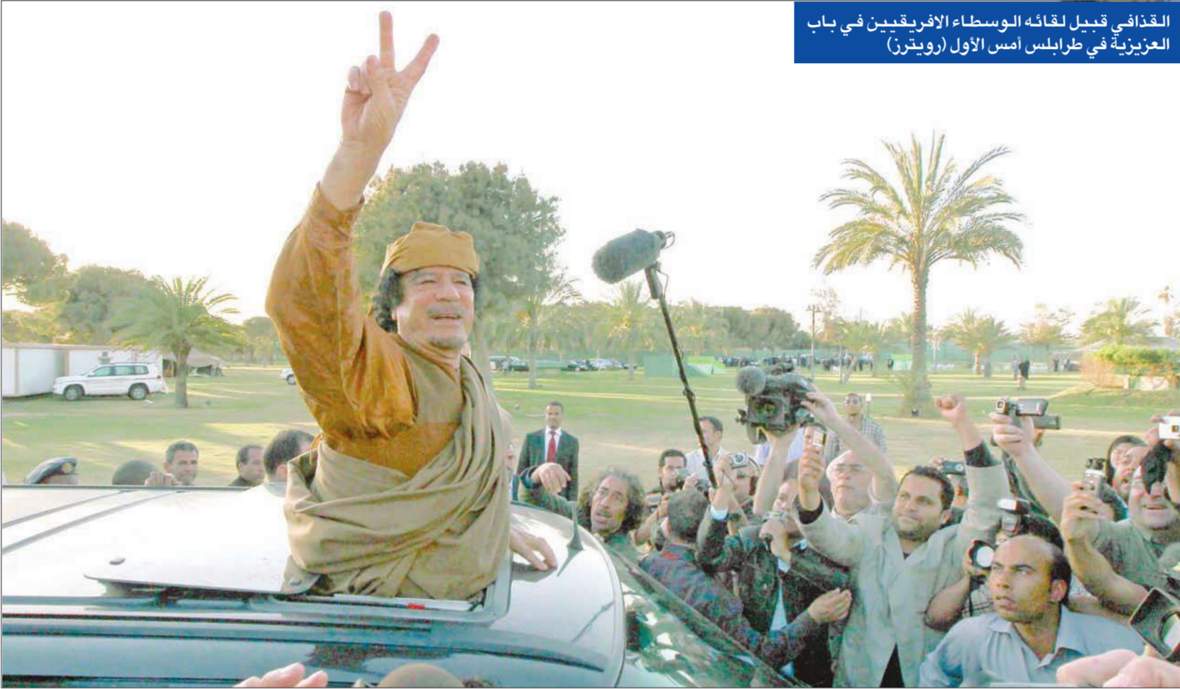
القذافي قبيل لقائه الوسطاء الإفريقيين في باب العزيزية في طرابلس أمس الأول

عرض وفد الوساطة الإفريقية على الثوار الليبيين في معقلهم بنغازي أمس «خريطة الطريق» التي أعدها لحل الأزمة في ليبيا ووافق عليها العقيد معمر القذافي، ولكن مهمة الوفد بدت صعبة بعدما استيق الثوار وصول الوفد بإعلانهم أن أي وقف لإطلاق النار يجب أن يسبقه عودة الجيش إلى ثكناته.