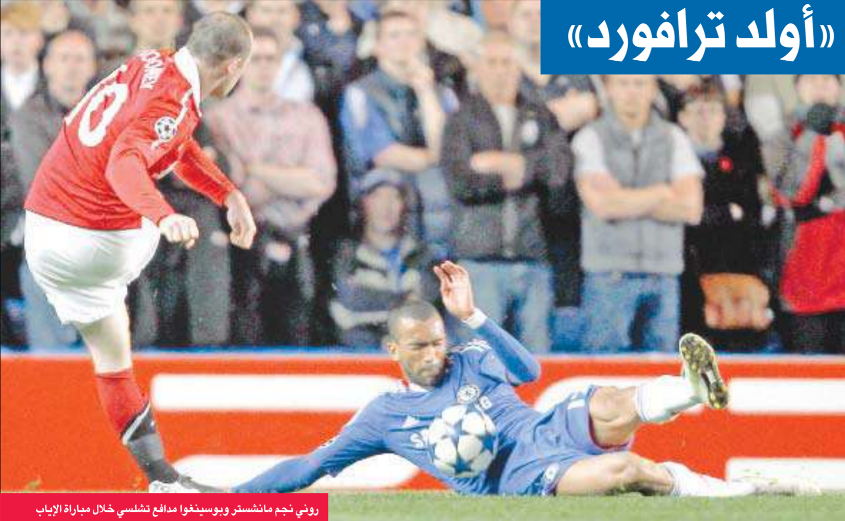
روني نجم مانشستر ويوسيتغوا مدافع تشلسي خلال مباراة الإياب

فقط تمكنت من قلب نتيجتهما في الأدوار الإقصائية من دوري الإبطال. حتى الآن. وبحال تاهل يونايتد سيواجه على الأرجح شالكه الألماني الذي سحق انتر ميلان الإيطالي حامل اللقب 2-5 في عقار داره.