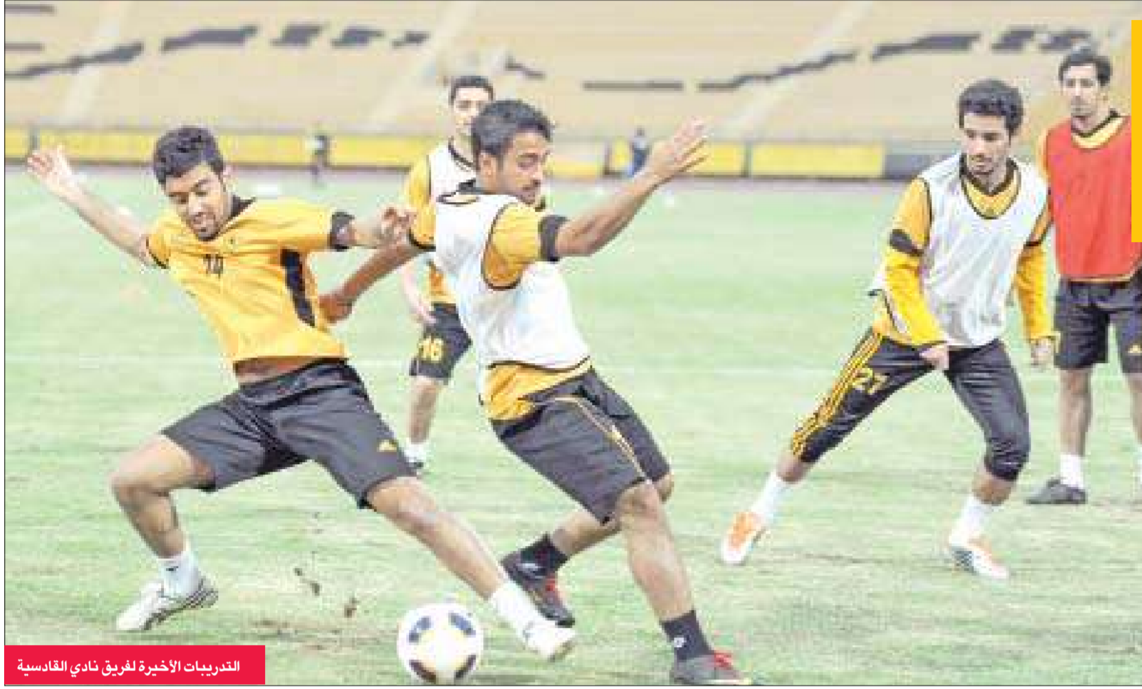
التدريبات الأخيرة للفريق نادي القادسية