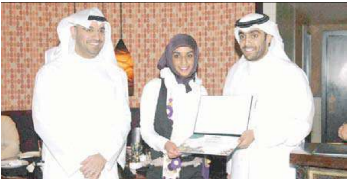
مشاركة تتسلم شهادة التقدير

المناسبة حفل تكريم المكان مطعم «pf ching» الصيني