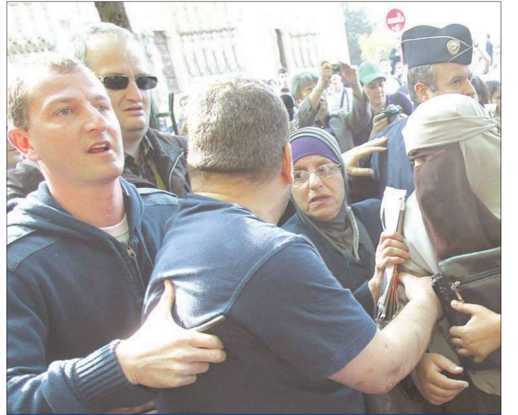
الشرطة تحاول توقيف امرأة منتقبة في باريس أمس