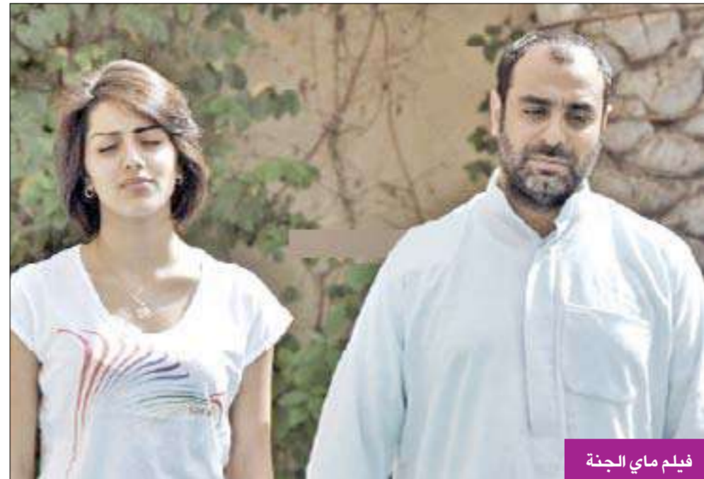
فيلم ماي الجنة