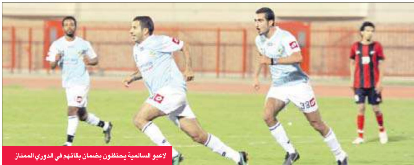
لاعبو السالمية يحتفلون بضمأن بقائهم في الدوري الممتاز