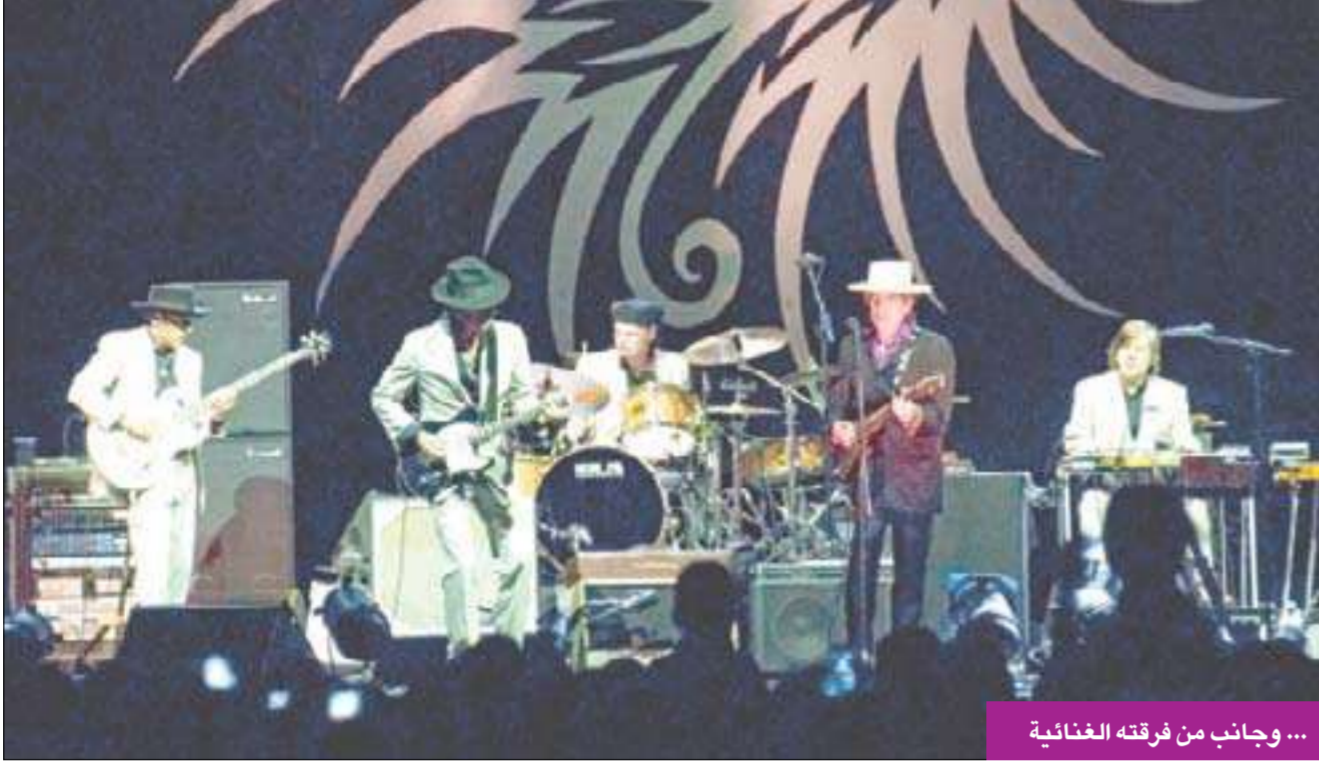
... وجانب من فرقته الغنائية