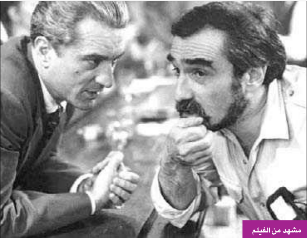
مشهد من الفيلم