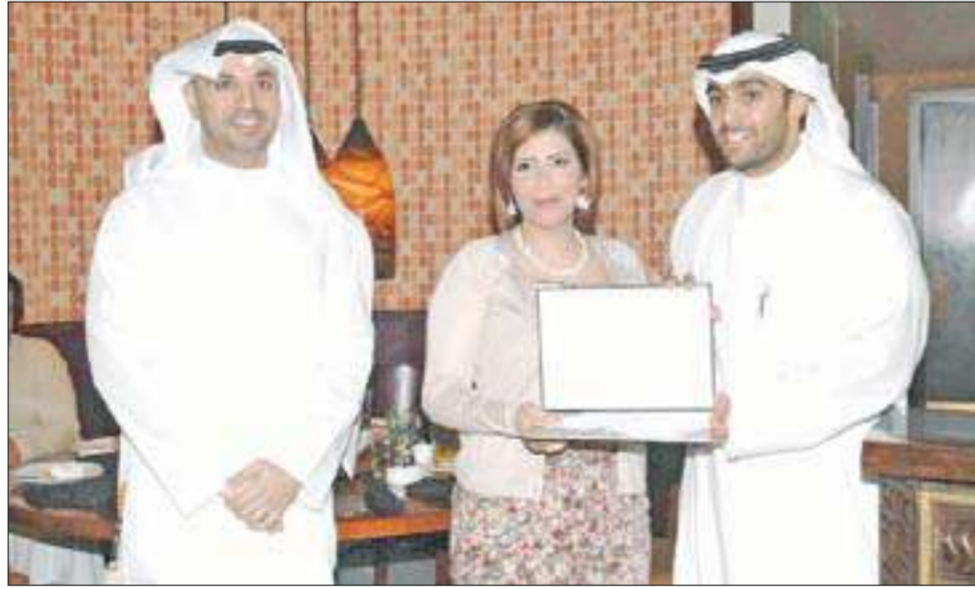
... وتكريم متطوعة أخرى

أقام منظمو مشروع معرض "كويتي وأفتخر" الرابع الذي افتتح في مارس الماضي، برعاية رئيس مجلس الوزراء سمو الشيخ ناصر المحمد، حفل تكريم وعشاء للمتطوعين في المشروع البالغ عددهم 200 متطوع ومتطوعة بمطعم "pf ching" الصيني.