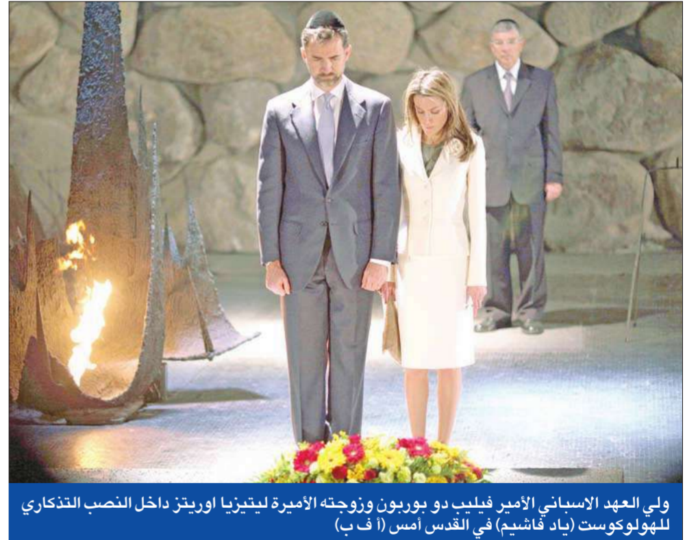
ولي العهد الإسباني الأمير فيليب دو بوربون وزوجته الأميرة ليتيزيا أوريثز داخل النصب التذكاري للهولوكوست (باد فاشيم) في القدس أمس (أ ف ب)

وكان مصدر مطلع قال لـ«الجريدة» أمس الأول إن عرض