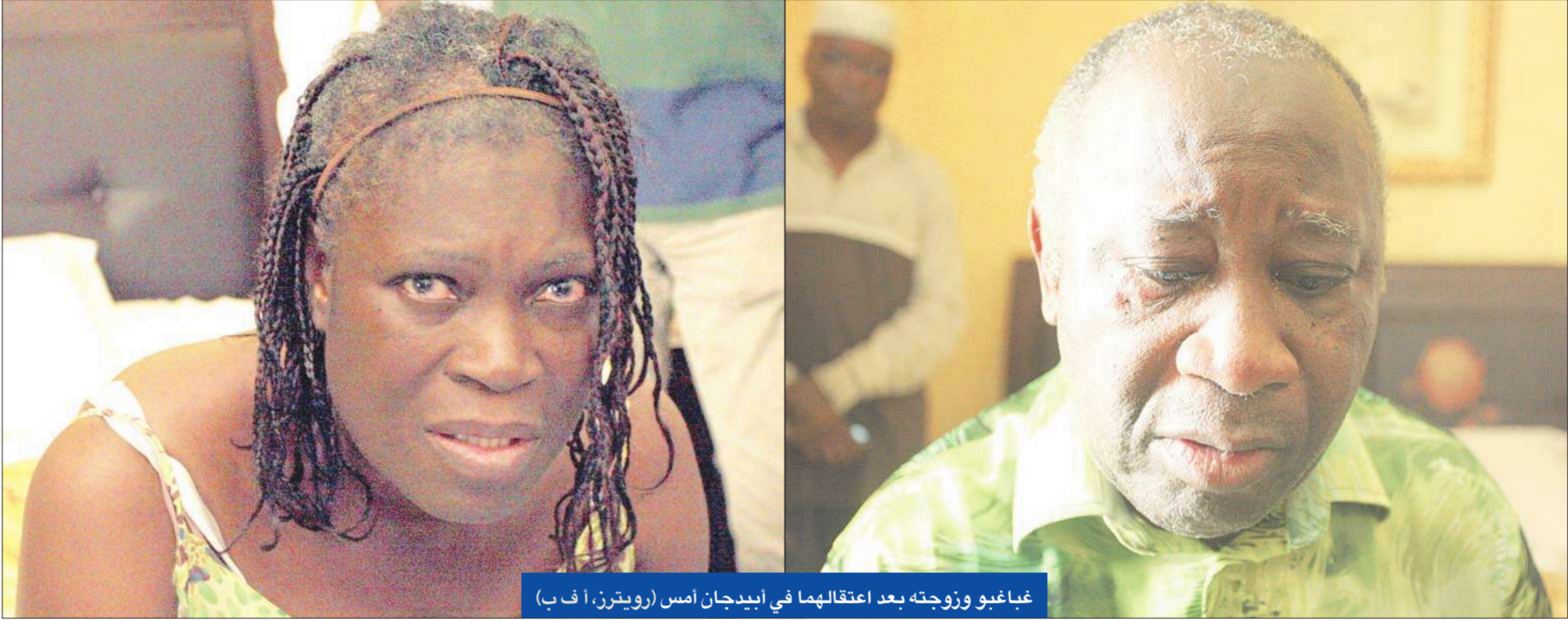
غباغبو وزوجته بعد اعتقالهما في أبيدجان أمس

تشمل المحيط المباشر لمقر غباغبو، بل دارت في منطقة تقع بين التلفزيون الحكومي وكنية الدرك، وهما معقلان أخران للرئيس المنتهية ولايته في حي كوكودي شمال أبيدجان حيث مقره. كما سمع دوي انفجارات قوية في حي القصر الرئاسي. واتهم معسكر غباغبو فرنسا بالسعي "إلى قتله"، بينما أعلن وتارا أنه طلب من الأمم المتحدة القضاء على الأسلحة الثقيلة التي بحوزة غباغبو.