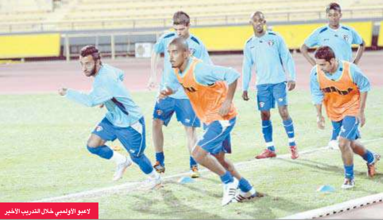
لاعبو الأولمبي خلال التدريب