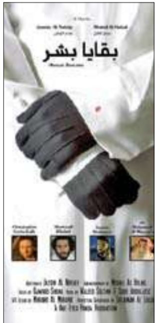
بوستر بقايا بشر

يخوض المخرجون الشباب الكويتيون غمار منافسة جديدة في الدورة الرابعة لمهرجان الخليج السينمائي، إذ يشاركون بتسعة أفلام قصيرة في المسابقة الخليجية، وآخر وثائقي في مسابقة الطلبة.