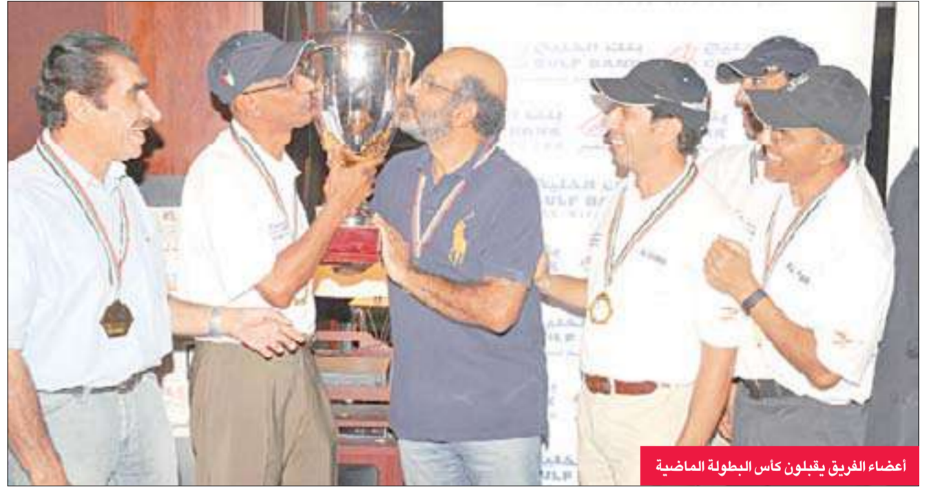
أعضاء الفريق يقبلون كأس البطولة الماضية

تطوير مستويات لاعبي المنتخب لضمان جاهزيتهم لخوض البطولات الخارجية المقبلة. وأشار إلى أن اللجنة نظّمت قبل أيام بطولة الصداقة التاسعة بين منتخب الكويت ومنتخب يضم لاعبين من الجاليات الأجنبية في الكويت، حيث تمكن المنتخب الكويتي من حسم المواجهة التي شملت ثلاث جولات بنتيجة 14 نقطة مقابل 10.