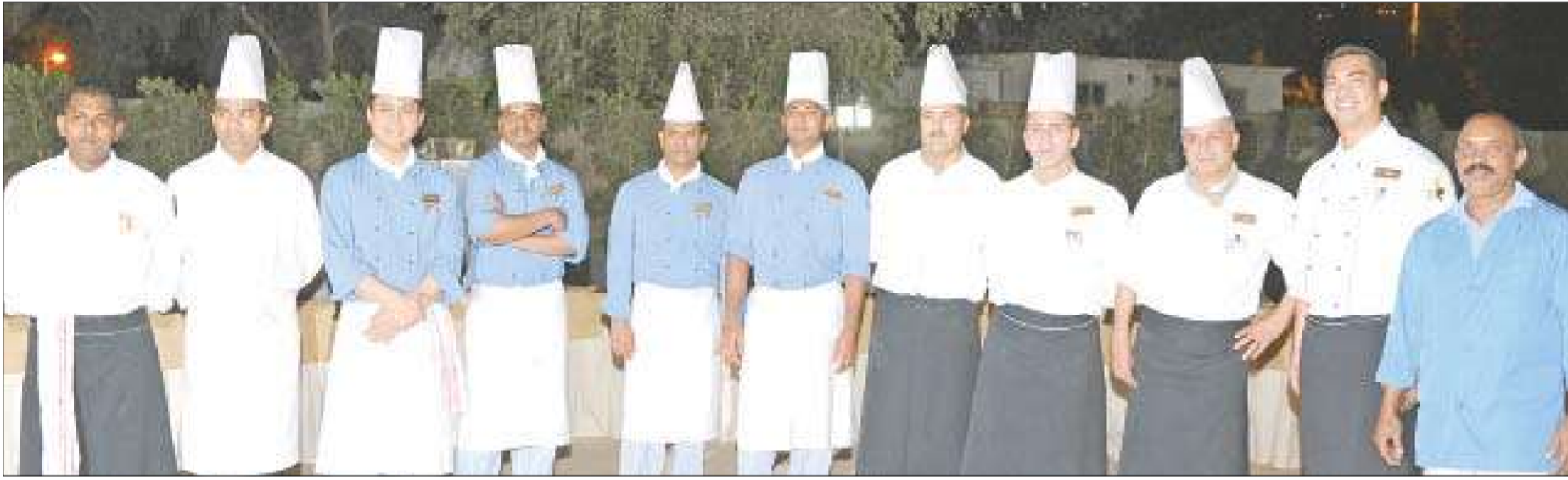
فريق الطهاة في لقطة جماعية