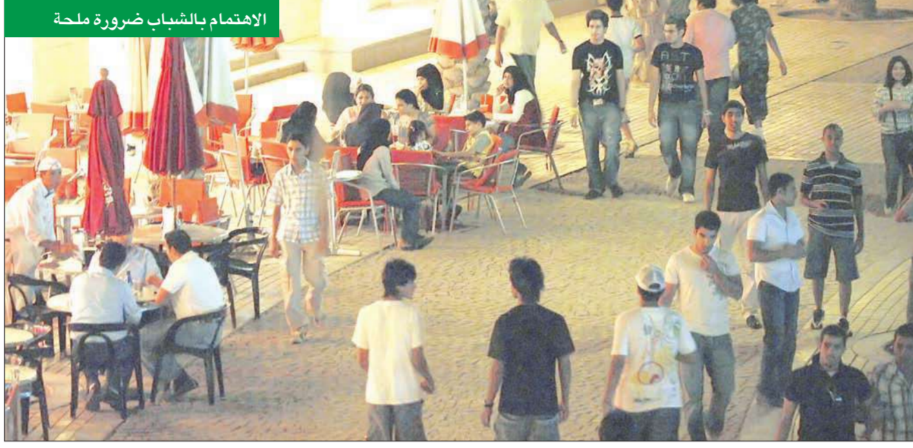
الإهتمام بالشباب ضرورة ملحة

والنمو المحتمل لا يخلو من مخاطر، فالنمو غير المتكافئ مهدد، بالدرجة الأولى، من عجز الموازنة والميزان التجاري الأميركي وعجز ميزان العمالة، وهناك، وينصح الصندوق بضرورة بدء الصين في بناء نموذج نمو لا يعتمد، بقوة، على الطلب الخارجي أو على الصادرات، وإنما على تقوية الطلب الداخلي، لدعم صادرات الدول الأخرى، وفي ما يبدو أنه مؤشر استجابة للطلب، حقق الميزان التجاري الصيني عجزاً، في فبراير 2011، وفاضحاً طفيفاً، في مارس 2011. ورغم مشاكل أوروبا واليونان وإيرلندا والبرتغال، فإن الصندوق يعتقد أن منظومة دول الوحدة النقدية الأوروبية تقوم بما يكفي لضمان دعم النمو وتخلص أوروبا من تبعات الأزمة المالية العالمية. كل ما ذكر، أعلاه، موحد في معانيه ومؤشراته، سواء كتب بالصينية أو الهندية أو الإنكليزية، فإلّا يتكلم عن معدل نمو حقيقي، يتحقق أو لا يتحقق، ويتساءل عن سبل تحقيقه والأثر المحتمل على الموازن الأخرى الداخلية والخارجية، وتحديدًا ميزان العمالة. وحدها تلك اللغة سوف تنهي الجدل، إلى الأبد، حول نجاح خطة التنمية أو فشلها، لأن الأرقام لا تكذب، ولأنها لا تتحمل جدلاً ولا إطالة فإن كل ما تحتاج إليه «خطة التنمية» فريق يفهمها، ويؤمن أن الكويت، دون تحقيقها، ستظل تسير في «تنمية» معاكسة للأهداف المعلنة.