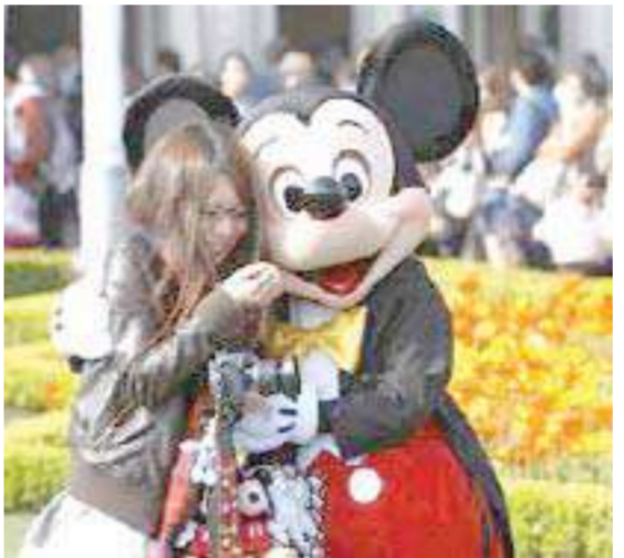
زائرة تحضن ميكي ماوس في مدينة ديزني في اليابان يوم الجمعة

أممات الحضور أخذت سنووات والبطة دونالد بفقراً احتفالاً بإعادة فتح مدينة ديزني في اليابان أمس الأول، كخطوة أولية تجاه إعادة الحياة إلى طبيعتها من جديد في البلاد التي مازالت تعاني كارثة نووية وأزمة إنسانية. وأغلقت مدينة ديزني أبوابها بعد الزلزال المدمر الذي هز البلاد في 11 مارس وأصاح المد العاتية التي تلتها وممرت أجزاء شاسعة بشمال شرق اليابان، والحقت ضرراً بمحطة فوكوشيما للطاقة النووية الواقعة على بعد 240 كيلومتراً شمالي العاصمة. ومع اصطاف الغثات خارج المدينة الترفيهية استعداداً للدخول علت صباحتهم "ميكى"، بينما أخذت أشهر شخصيات ديزني تلوح للزوار قبل أن تفتح مدينة ديزني أبوابها الساعة الثامنة صباحاً بالتوقيت (أورايسو - رويترز)