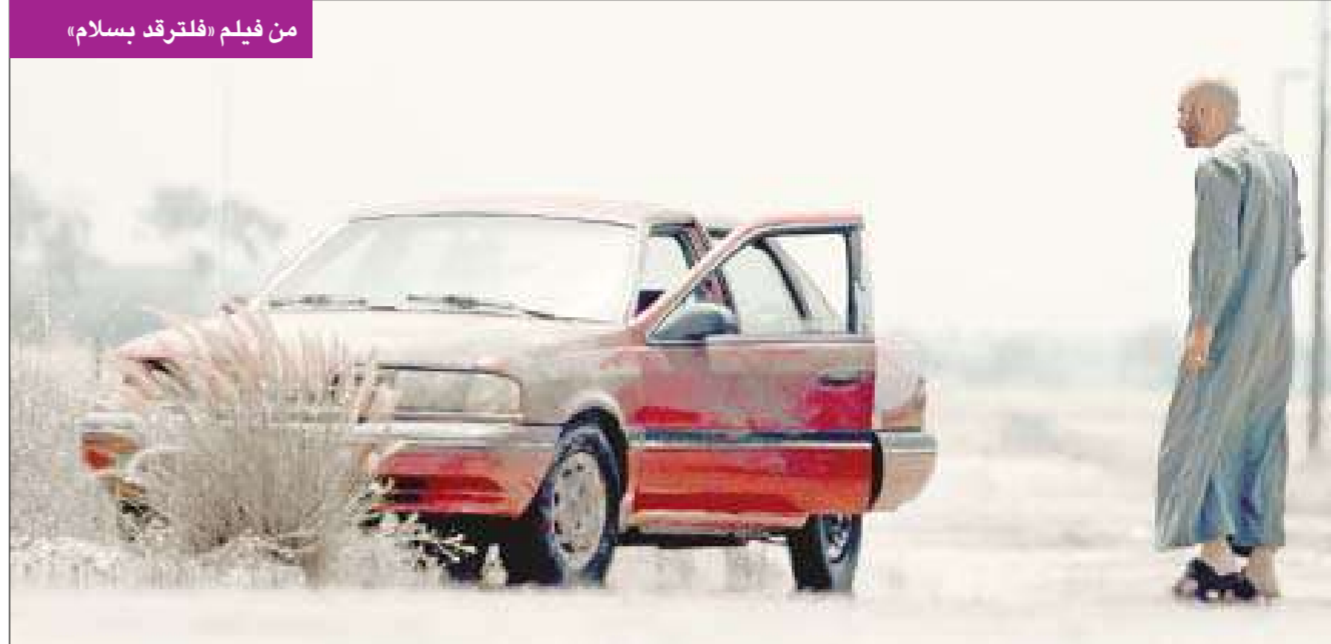
من فيلم «فلترقد بسلام»

عرضت ثلاثة أفلام كويتية في مهرجان الخليج السينمائي اثنان في المسابقة الرسمية للأفلام القصيرة، وواحد ضمن برنامج «أضواء» خارج المسابقة.