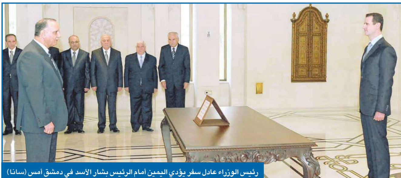
رئيس الوزراء عادل سفر يؤدي اليمين أمام الرئيس بشار الأسد في دمشق أمس (سانا)

واستندت المحكمة إلى أن "الحزب أزيل من الواقع السياسي المصري رضوخاً لإرادة الشعب، ولا يستقيم عقلاً أن يسقط النظام الحاكم دون أدواته ومنها الحزب