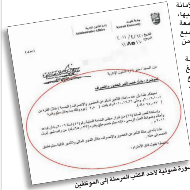
صورة ضوئية لأحد الكتب المرسله إلى الموظفين

في ما يبدو أن صراعاً جديداً سيدب بين الأمانة العامة في جامعة الكويت ونقابة العاملين فيها، إذ عممت الأمانة العامة على موظفي الجامعة مغلطات كتب عليها "سري جداً" تخطر جميع الموظفين بالمبالغ المخضومة من راتبهم من جراء التأخر عن الدوام. وأوضحت الأمانة في كتبها المرسله إلى الموظفين ساعات التأخير والمبالغ المخضومة من كل موظف على حدة، مع حساب ساعات التأخير من الفترة الممتدة منذ تطبيق نظام الخصم التي تبدأ في 2009/1/10 حتى 2010/12/31، مبيّنة أن المبلغ سيخصم بشكل كامل مرة واحدة دون اتباع آلية التقسيط التي اتفقت عليها مع النقابة في وقت سابق عندما أثيرت المشكلة قبل شهرين.