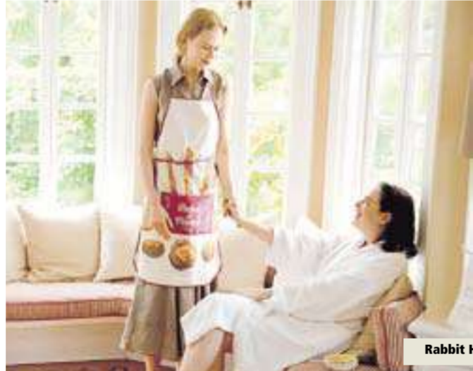
من Rabbit Hole

مئة ولد. ونحن نعمل على هذه المسألة. أتمنى أن