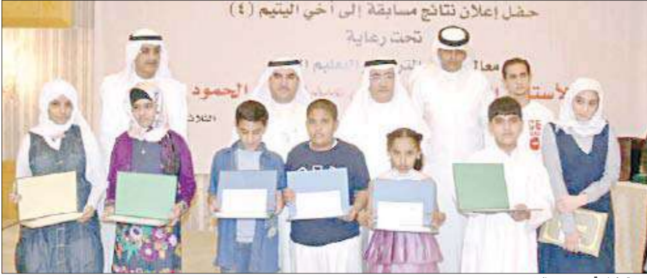
صورة تذكارية مع عدد من المكرمين