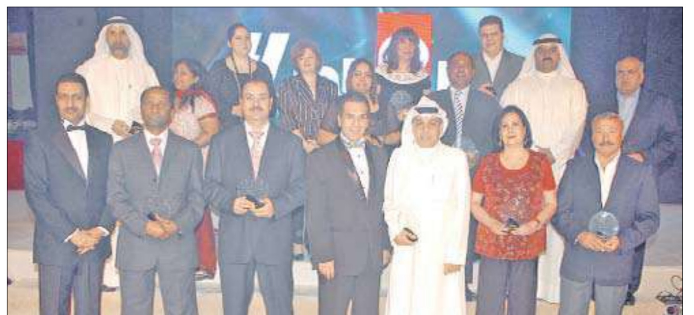
... ويتوسط ممثلي الشركات والجهات الداعمة