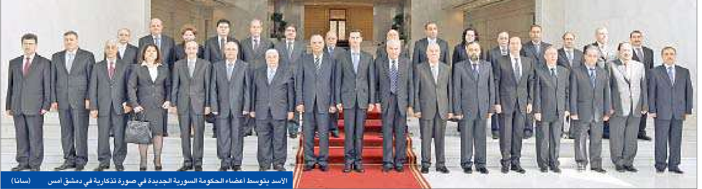
الأسد ينوسط أعضاء الحكومة السورية الجديدة في صورة تذكارية في دمشق أمس (سانا)