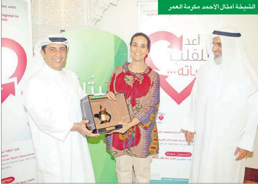
الشيخة أمثال الأحمد مكرمة العمر

المرشد، ومستشفى السلام الدولي التابع لـ"بيتك"، بالإضافة إلى الجهة المنفذة وهي جمعية القلب الأميركية وجميع الداعمين والمشاركين في الحملة.