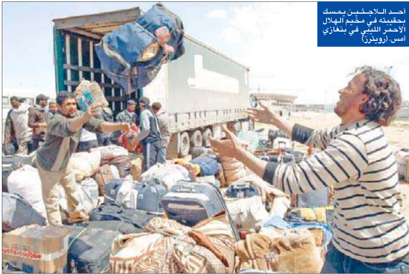
أحد اللاجئين بمسك بحقيبته في مخيم الهلال الأحمر الليبي في بنغازي

● اتهام نظام القذافي باستخدام القنابل العنقودية ضد المدنيين ● الأطلسي يعاني نقصاً في الذخيرة