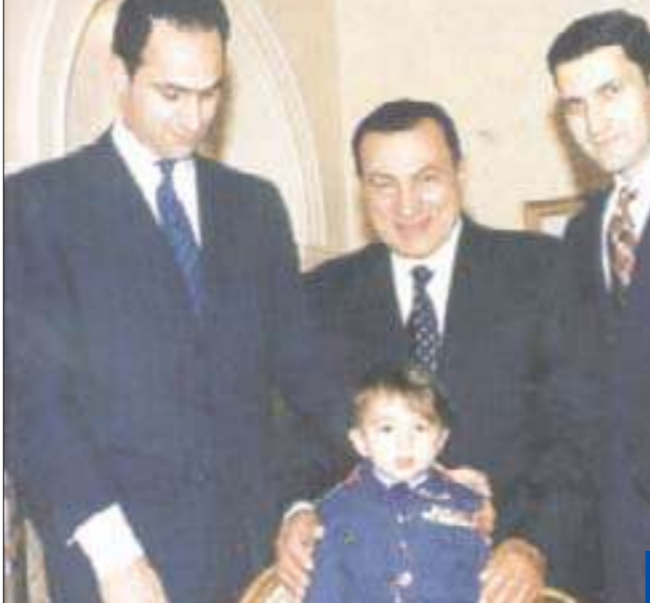
مبارك وزوجته ونجاله وحفيده

بدأت قصة صعود أسرة مبارك عندما خطى محمد حسني السيد مبارك (ولد في 4 مايو 1928) خطواته الأولى من قريته كفر مصيلحة في محافظة المنوفية، عندما نشأ في أسرة بسيطة، والتحق في أول نوفمبر 1947 بالكلية الحربية لتخرج فيها عام 1949. وعندما أعلنت كلية الطيران قبول دفعة جديدة بها، من خريجي الكلية الحربية، تقدم حسني مبارك للالتحاق بالكلية الجوية، التي تخرج فيها عام 1950، ليصل إلى منصب مدير قاعدة بني سويف الجوية في تكسة 1967، ليتم تعيينه بعدها بقرار من الزعيم جمال عبدالناصر مديراً للكلية الحربية. ثم شارك بعدها في حرب أكتوبر 1973 كقائد للقوات الجوية. بعد الحرب اختاره الرئيس أنور السادات نائباً له في منتصف عام 1975، وصولاً إلى رئاسة الجمهورية في أعقاب اغتيال السادات في 6 أكتوبر 1981. شهدت رئاسة مبارك في بدايتها التناغافا مصرياً حول الرئيس الجديد، إلا أن الأمل المعقود على مبارك لنقل مصر إلى مصاف الدول المحترمة تقلص شيئاً فشيئاً حتى ثلاثى تماماً مع ولاية د. عاطف عبيد (1999-2004) في رئاسة وزراء مصر، إذ بدأت معه بشاير مشروعات التوريث والخصخصة 1949. وإفكار الشعب المصري. وهو نفس الوقت الذي انتقل فيه مبارك بعيداً عن نبض الشارع إلى مدينة شرم الشيخ ليكرس عزلته عن الشعب المصري، بعيداً عن تصاعد المد الشعبي المعارض له في سنوات حكمه الأخيرة بصورة متواترة مع انضمام المزيد من فئات الشعب المصري إلى طبقة الفقراء، وهو