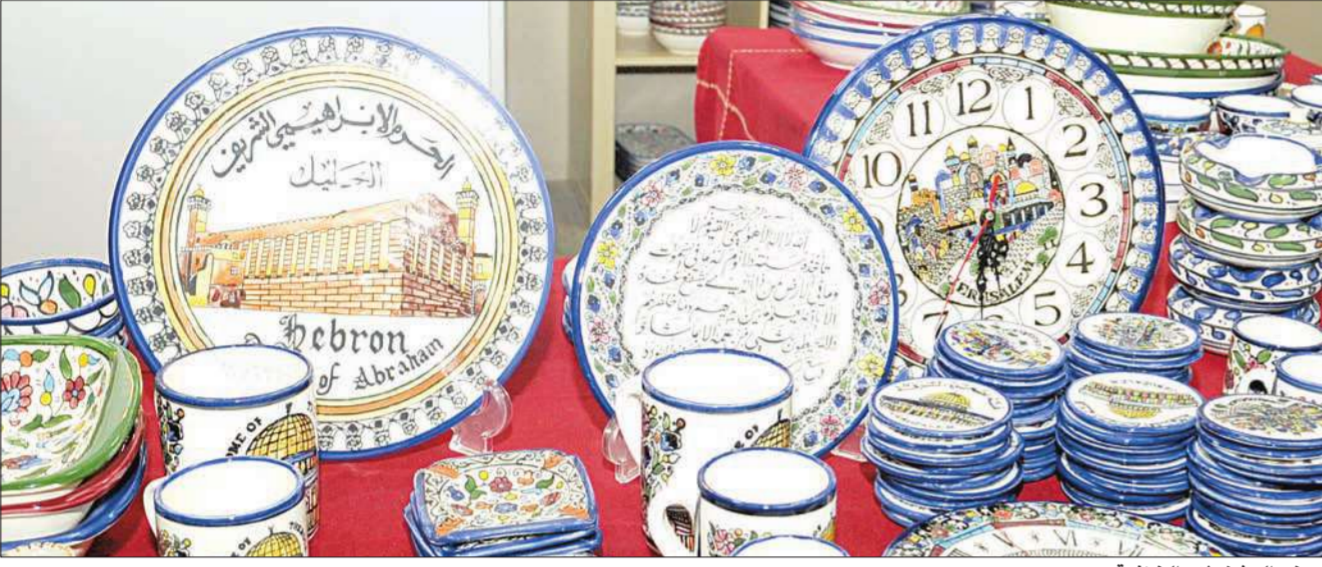
بعض المشغولات الخزفية