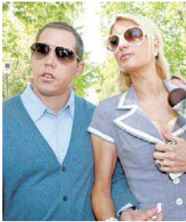
باريس هيلتون وعشيقها أثناء دخولهما المحكمة