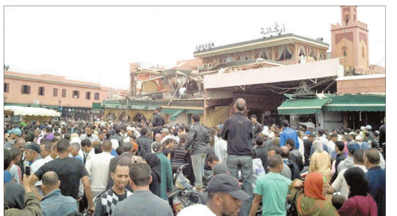
حشد من المغاربة أمام المقهى الذي استهدفه الانفجار في مراكش أمس

في اعتداء استهدف أحد المقاهي، هز انفجار ضخم ساحة «الفناء» الرئيسية في مدينة مراكش المغربية، حيث قُتل 15 شخصاً بينهم ستة فرنسيين، وجرح 20 آخرون. وأفادت وزارة الداخلية المغربية في بيان أمس، بأن التحقيقات الأولية ترجح أن يكون الانفجار ناتجاً عن «عمل إجرامي»، بينما أشار مصدر طبي إلى أنه من الصعب تحديد هوية جميع الضحايا بسبب قوة الانفجار. وفي تصريح لأحد مسؤولي بلدية المدينة أكد أن «المعلومات تقول إن الهجوم يمكن أن يكون منقذه انتحارياً». في موازاة ذلك، أعطى الملك المغربي محمد السادس أمس، تعليماته