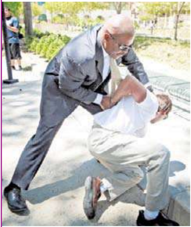
...وحارسها يوقف المعتدي

تعرض عشيق النجمة الأميركية باريس هيلتون لاعتداء من قبل معجب مهورس بها، بينما كان يدخل برقيتها إلى قاعة محكمة في كاليفورنيا للشهادة في دعوى رفعها ضد رجل يتعقبها. وذكر موقع «يو إس ماغازين» أن المعجب اخترق صف الصورين ورسم الماء بوجه عشيق هيلتون، سي وايس، وأمسك به من عنقه، قبل أن يتدخل حرس النجمة لإفقاذه.