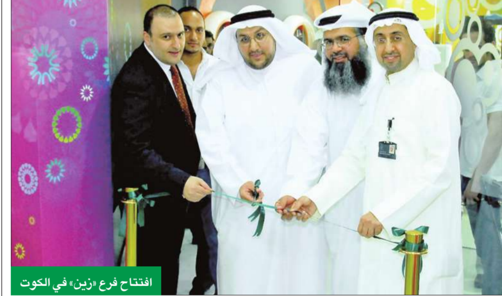
افتتاح فرع «زين» في الكويت

وتأتي مشاركة البنك في رعاية المؤتمر انطلاقاً من أهمية الحدث الذي يناقش دور القطاع الخاص وبالذات المؤسسات الإسلامية باعتباره مصارف تعمل وفق الشريعة الإسلامية في تمويل خطة التنمية التي تحتاج إلى تكاتف الجهود في شتى المجالات كي تتم على أكمل وجه.