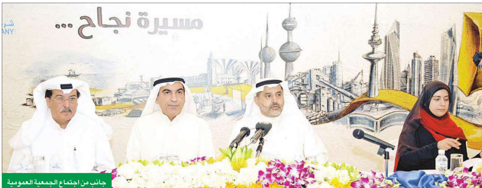
جانب من اجتماع الجمعية العمومية

وأشار إلى أن من ضمن المعوقات الأخرى التي تعوق نهضة الصناعة في البلد هي تعدد النوافذ التي يتم الحصول منها على الموافقات والرخص، في المقابل حرص