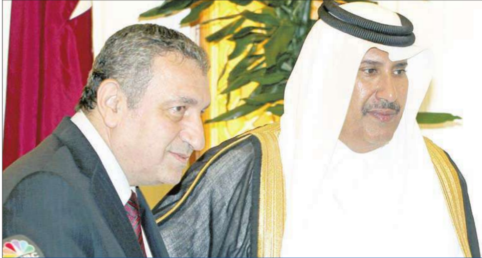
في إطار جولته الخليجية، أجرى رئيس الوزراء المصري عصام شرف محادثات في الدوحة مساء أمس الأول، مع نظيره القطري الشيخ حمد بن جاسم آل ثاني. وفي الصورة، الشيخ حمد وشرف قبيل مؤتمر صحافي مشترك في الدوحة أمس الأول.

في موقف يحمل الكثير من الغموض، قرر مكتب الإرشاد في جماعة الإخوان المسلمين، (أعلى مستويات القيادة في الجماعة) مقاطعة «مؤتمر مصر الأول» في 7 مايو، والذي دعا إليه المهندس الاستشاري والناشط السياسي د. مدوح حمزة، والذي يتوقع أن يشارك فيه أكثر من ألفي ناشط وباحث، في مسعى إلى تأسيس كيان شعبي يقود ثورة مصر. وفي المقابل قررت الجماعة المشاركة في الحوار الوطني الذي ترعاه الحكومة المصرية، ويترأسه رئيس الوزراء الأسبق د. عبدالعزیز حجازي، رغم الانتقادات الحادة التي تعرض لها الحوار في جولته الأولى والتي رأسها نائب رئيس الوزراء يحيى الجمل.