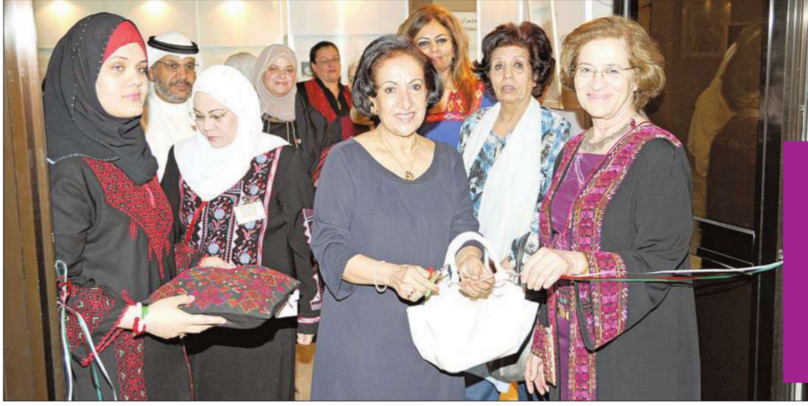
شيخة النصف تفتتح المعرض