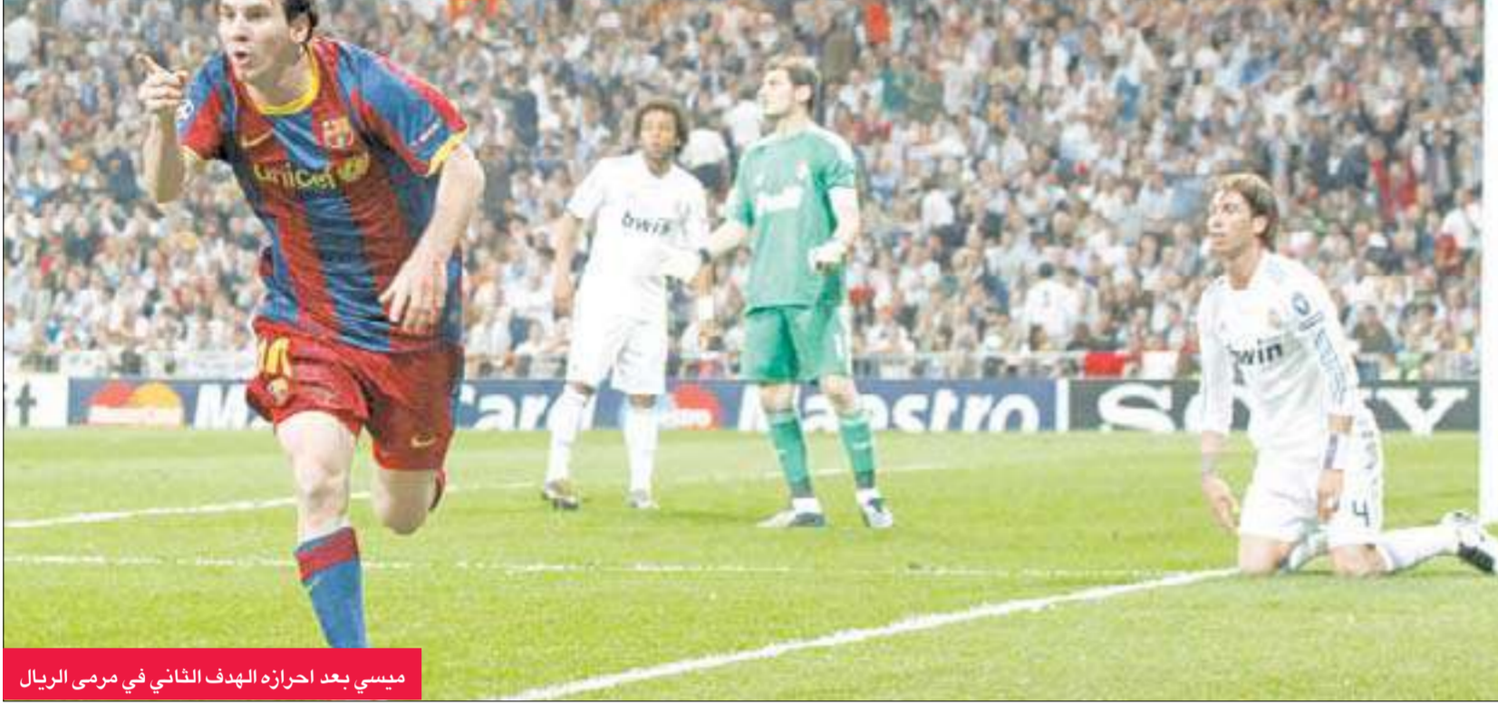
ميسي بعد احرازه الهدف الثاني في مرمى الريال