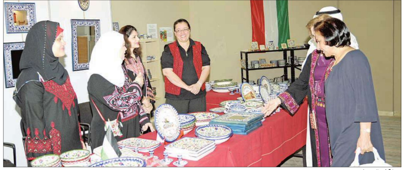
جولة في المعرض