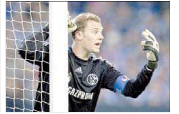
بيتر شمايكل، حارس مرمى مانشستر يونايتد السابق وأفضل حارس في تاريخ بلاده، إن الألماني مانويل نوير، سيكون أفضل من يخلف عرين الشياطين الحمر بعد اعتزال حارسه الهولندي الحالي إدوين فان دير سار.

قال اللاعب الدنماركي السابق، بيتر شمايكل، حارس مرمى مانشستر يونايتد السابق وأفضل حارس في تاريخ بلاده، إن الألماني مانويل نوير، سيكون أفضل من يخلف عرين الشياطين الحمر بعد اعتزال حارسه الهولندي الحالي إدوين فان دير سار. وقال شمايكل في تصريحات لشبكة «سكاى سبور» البريطانية: «نوير ربما يعد حالياً أفضل حراس العالم، فهو حارس رائع ويعد مثاليًا لحراسة عرين مانشستر يونايتد». ورغب التقارير الأخيرة التي تشير إلى قرب انتقال نوير، حارس شالكه الحالي، إلى نادي بايرن ميونخ،