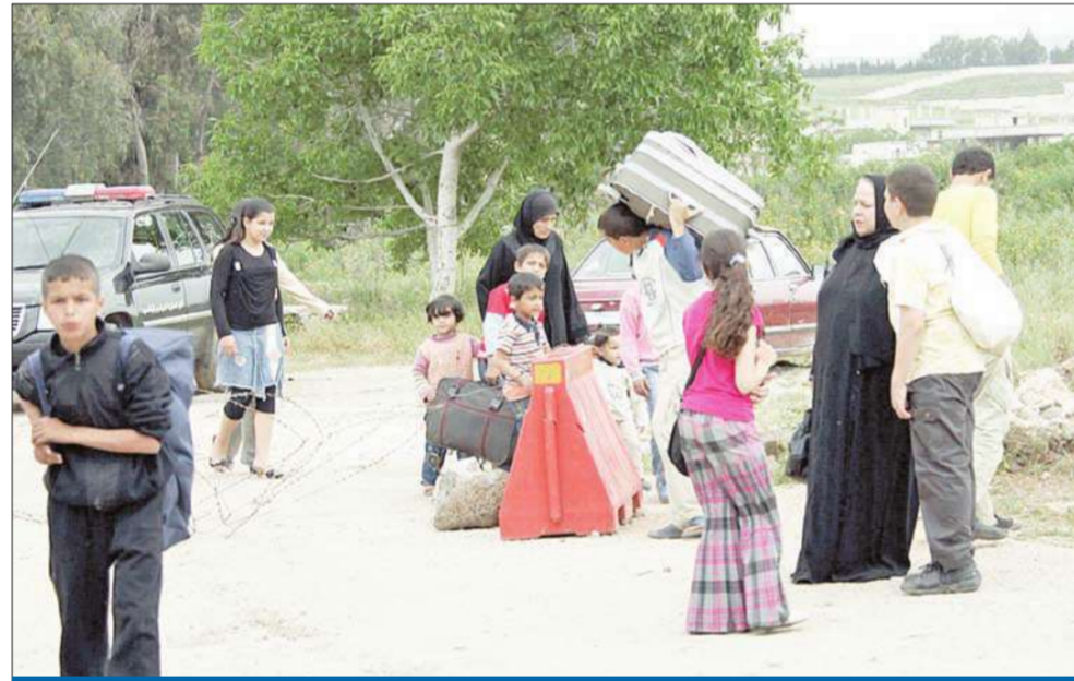
عائلات سورية داخل الأراضي اللبنانية في منطقة وادي خالد أمس بعد فرارها على الأقدام من منطقة تكلخ التي تعرضت لهجوم من الأمن السوري مساء أمس الأول (أ ب)

تدخل الاحتجاجات المطالبة بالحرية والديمقراطية في سورية اليوم، أسبوعياً السابغ، حدث يواجه النظام اختباراً جديداً في الشارع، مع اعتزام المحتجين تنظيم تظاهرات أطلقوا عليها اسم «جمعة الغضب» وخصوصاً لـ «تحرير مدينة درعا» المحاصرة من قبل قوات الجيش والأمن، التي تعاني انقطاع الاتصالات والمياه والكهرباء، حيث قتل فيها منذ يوم الاثنين الماضي 42 شخصاً. وتأتي هذه الجمعة في ظل حصار أمسي مطلق لبيروت الاحتجاجات الأساسية المنتملة بدرعا جنوب البلاد ومنطقتي دوما والمضمية في ريف دمشق ومدنية بانياس الشمالية ومدنية حصن في الوسط، ما يطرح تحدياً كبيراً أمام المحتجين بشأن النزول إلى الشوارع.