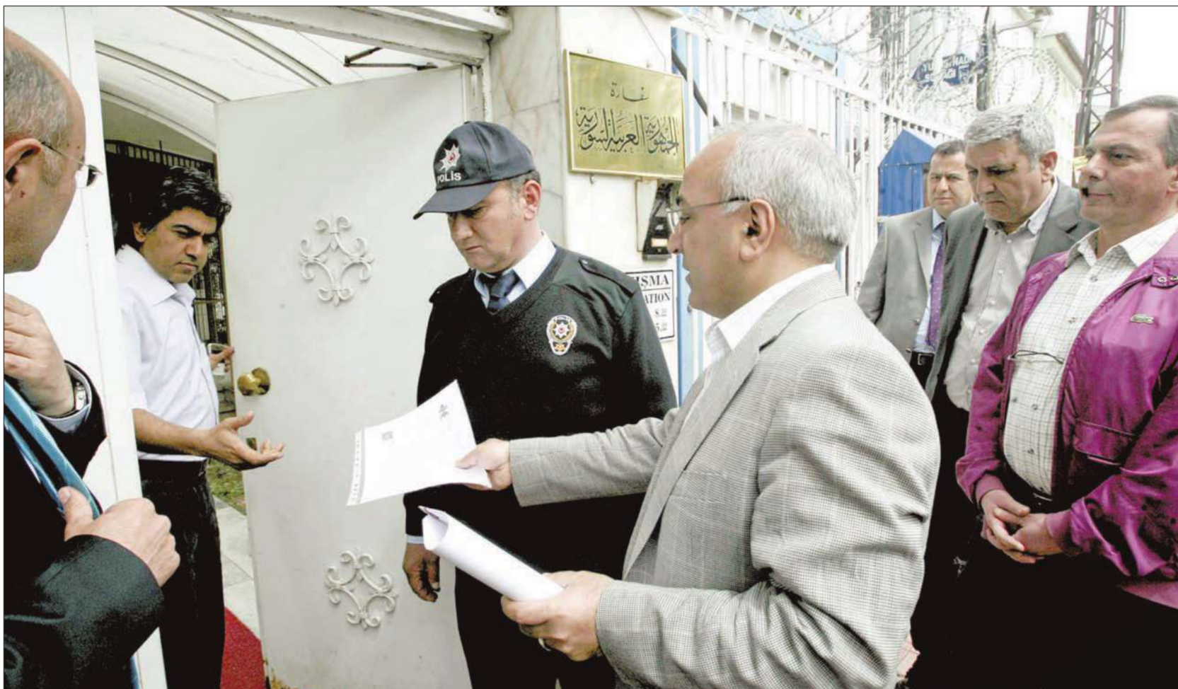
ناشطون حقوقيون اتراك يسلمون رسالة احتجاج على قتل المدنيين للسفارة السورية في أنقرة أمس (أ ب)

● حصيلة قتلى درعا المحاصرة 42... وإصابة 4 في اللاذقية ● المئات يفرون من تلكخ إلى لبنان