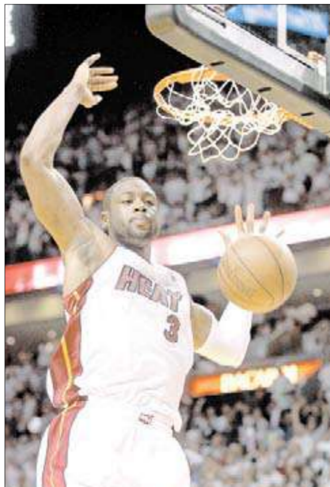
دواين وايد نجم ميامي

وامام 18203 متفرجين، تعلمق سبيني ثاندرد الدور الثاني من «بلاي أوف» الدوري الأميركي للمحترفين في كرة السلة بعدما حسموا مواجهتهما مع فيلادلفيا سفنتي سيكسرز ودفتر تاغنس 1-4 بفوز الأول 91-97، والثاني 97-100 أمس الأول. على ملعب «اميركان إيرلاينز أرينا» وامام 19896 متفرجا، لحق ميامي بشيكاغو بولز وبوسطن سلتيكس إلى نصف نهائي المنطقة الشرقية، على أن تحدد هوية الطرف الرابع بين اتلاندا هوكس وأورلاندو ماجيك (2-3 حالياً). وهذه المرة الأولى التي يبلغ فيها ميامي الدور الثاني منذ تتويجه بلقبه الأول والوحيد عام 2006، وقد ضرب موعداً ثانياً مع بوسطن الذي كان أخرجه الموسم الماضي من الدور الأول بالفوز عليه 1-4، وستبدأ سلسلة مواجهتهما غداً على أرض ميامي. كما أن الفريق الأخضر الأسطوري الذي تأهل على حساب نيويورك نيكس (4-صفر)، كان أطاح الموسم الماضي بنجم ميامي الحالي ليبرون جيمس من الدور الثاني عندما كان الأخير مع كليفلاند كافاليرز. وفي المنطقة الغربية وعلى ملعب «أوكلاهوما سيتي أرينا»