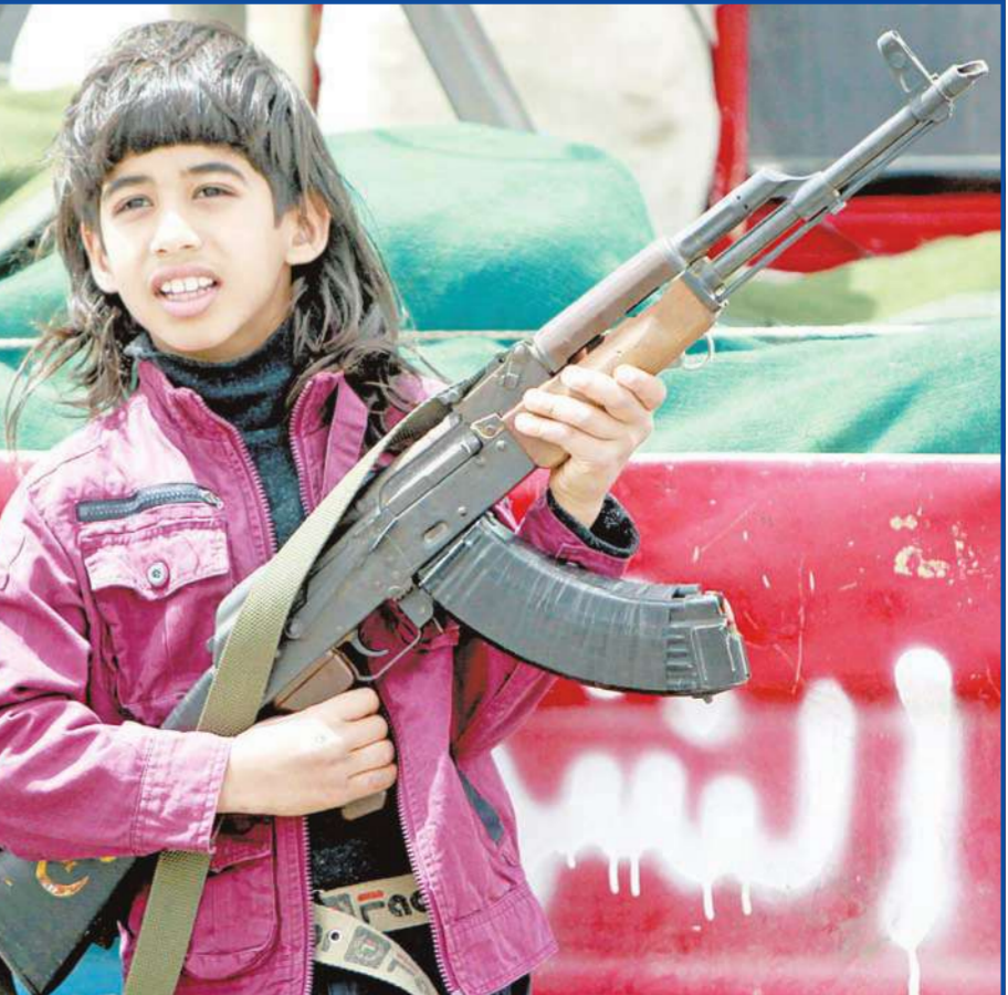
ابن احد مقاتلي المعارضة الليبية يحمل سلاح والده في أجدابيا أمس

غارات أطلسية إلى ذلك، أعلن حلف شمال الأطلسي أمس أن طائراته دمرت خلال الساعات الـ 24 الماضية منشأة للاتصالات ومبنيين لتخزين المركبات ومنشأة لتخزين صواريخ أرض/جو قرب طرابلس، وأضاف الحلف في تحديث يومي بشأن عملياته العسكرية في ليبيا أن طائراته دمرت أيضاً قاذفتي صواريخ