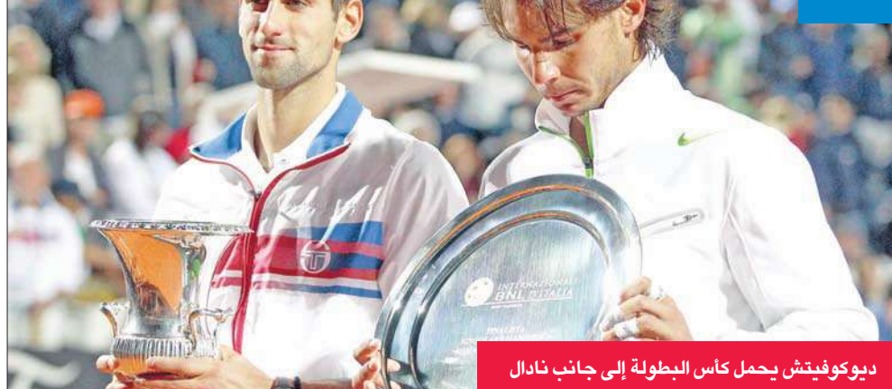
ديوكوفيتش يحمل كأس البطولة إلى جانب نادال

من أصل 25 مباراة نهائية حتى الآن. واكثرت شارابوفا التي غابت عن الملاعب نحو عام بين 2008 و2009 بعد أن احتلت صدارة التصنيف العالمي أسابع عدة، تفوقها التام على ستوسور محققة فوزها الثاني