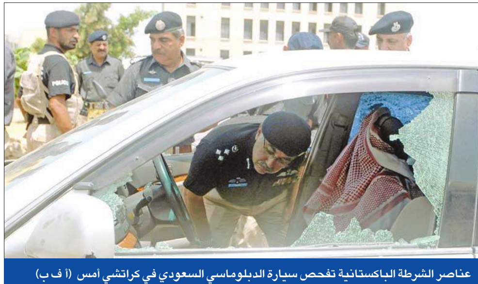
عناصر الشرطة الباكستانية تفحص سيارة الدبلوماسي السعودي في كراتشي أمس

بعد الاعتداء الذي تعرضت له القنصلية السعودية في كراتشي منذ أيام، قتل أمس، دبلوماسي سعودي بهذه القنصلية، في هجوم تبنته حركة «طالبان» - باكستان.