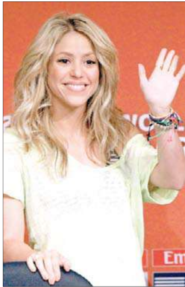
شاكيرا (كراكاس - رويترز)

أهدت نجمة البوب الكولومبية شاكيرا إلى الرئيس الفنزويلي هوغو تشافيز غيتاراً كهربائياً يحمل توقيعها، لونه أحمر كلون حركة الزعيم السياسي الاشتراكي. وذكر تشافيز أمس الأول أن النجمة الحائزة جائزة غرامي أرسلت إليه الغيتار بعد زيارة للنلال في مارس الماضي، وتقدم لها بالشكر على الهدية. وقال لمحطة تلفزيون حكومية عبر الهاتف: «كنت أعزف عليه الليلة الماضية، إنه غيتار كهربائي حديث جداً، لا أعاد العزف عليه... كنت أنشد بعض الأغاني المكسيكية القديمة»، وفي كثير من الأحيان يردد الرئيس المعروف بأسلوبه غير الرسمي أغاني أميركا اللاتينية الشعبية أثناء التجمعات والخطب السياسية. وعندما اقترح مسؤول على تشافيز أن ينشد أغنية شاكيرا الناجحة لكأس العالم العام الماضي، طرح سؤالاً «كيف أقوم بأداء (واكا واكا) بهذه القدم المتورمة؟» وأنهى الدعوة بغناء بوليفيو وهي أغنية هادئة من أميركا اللاتينية. ويتعافى تشافيز حالياً من إصابة في الركبة والغى زيارات لعدة بلدان هذا الأسبوع. وقال إن إصابته تتحسن.