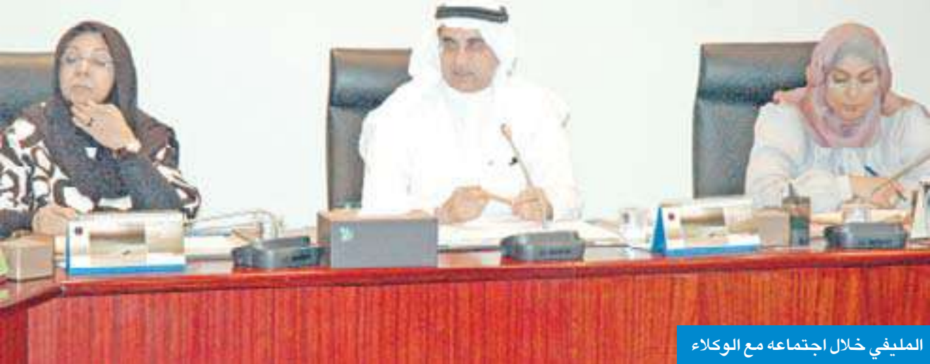
المليفي خلال اجتماعه مع الوكلاء

وجه وزير التربية وزير التعليم العالي أحمد المليفي خلال حفل استقباله في مكتبه بوزارة التربية، بمناسبة توليه حقيبة الوزارة صباح أمس، رسالة قال فيها: "أوجه رسالتي للجميع بتحمل مسؤولياتهم كاملة، فمن لا يعمل لا يخطئ، ولكن هناك أخطاء غير مبررة، أما الأخطاء التي تبرز نتيجة العمل فهذه