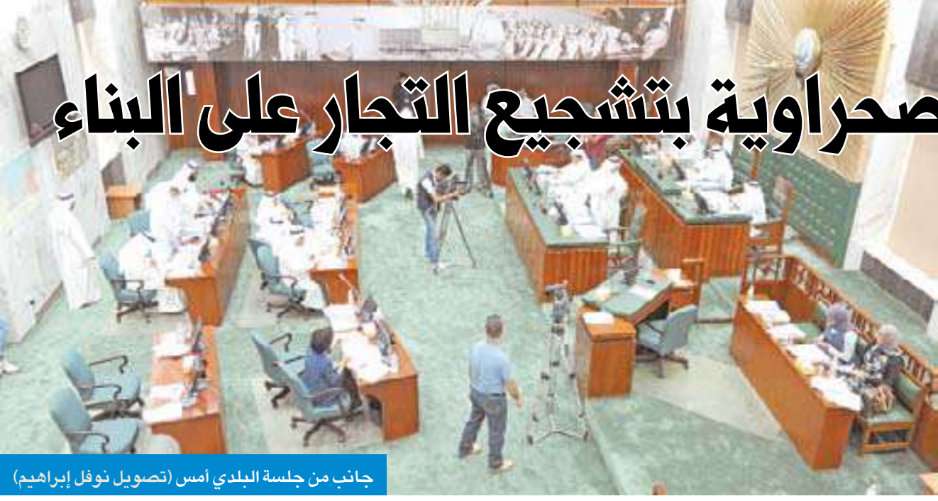
جانب من جلسة البلدي أمس