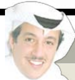
تركبي الذخيل www.turkid.net

برامج التلفزيون وصفحة الخدمات على www.aljarida.com