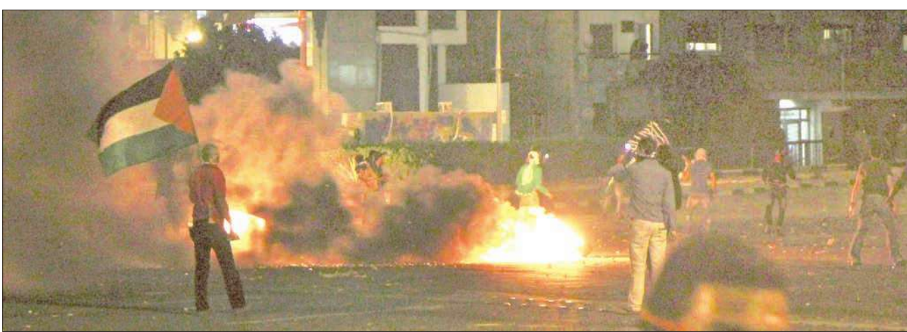
جانب من المواجهات بين المتظاهرين وقوى الأمن أمام السفارة الإسرائيلية في القاهرة مساء أمس الأول (أ ب)

إخلاء سبيل رئيس مجلس الشعب السابق (الغرفة الأولى للبرلمان) أحمد فتحي سرور من محبسه الاحتياطي بسجن مزرعة طرة، بكفالة مالية قدرها مئة ألف جنيه مصري، بعدما قدم سرور مستندات جديدة تفيد بأن تحريات وتقارير