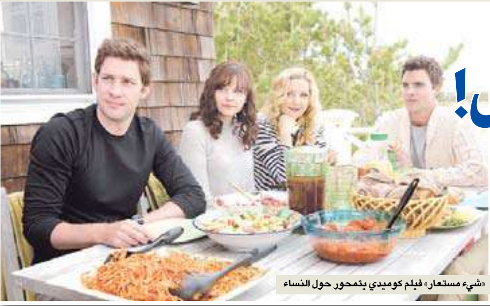
«شيء مستعار» فيلم كوميدى يتمحور حول النساء