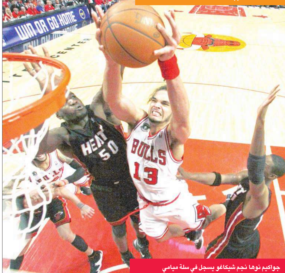
جواكيم نوها نجم شيكاغو يسجل في سلة ميامي

شيكاغو أمام 22874 متفرجا صاحوا في الدقائق الأخيرة «هزموا هيت» و«كبر من حجمكم»، تعادل الفريقان 48-48 في الشوط الأول، قبل أن يحقق بولز انتصافاً صاخبة في الثاني بنسجيلة 10 نقاط متتالية، متقدماً على هيت 24-46 في آخر 19 دقيقة. وتقام المباراة الثانية في شيكاغو بعد غد الأربعاء.