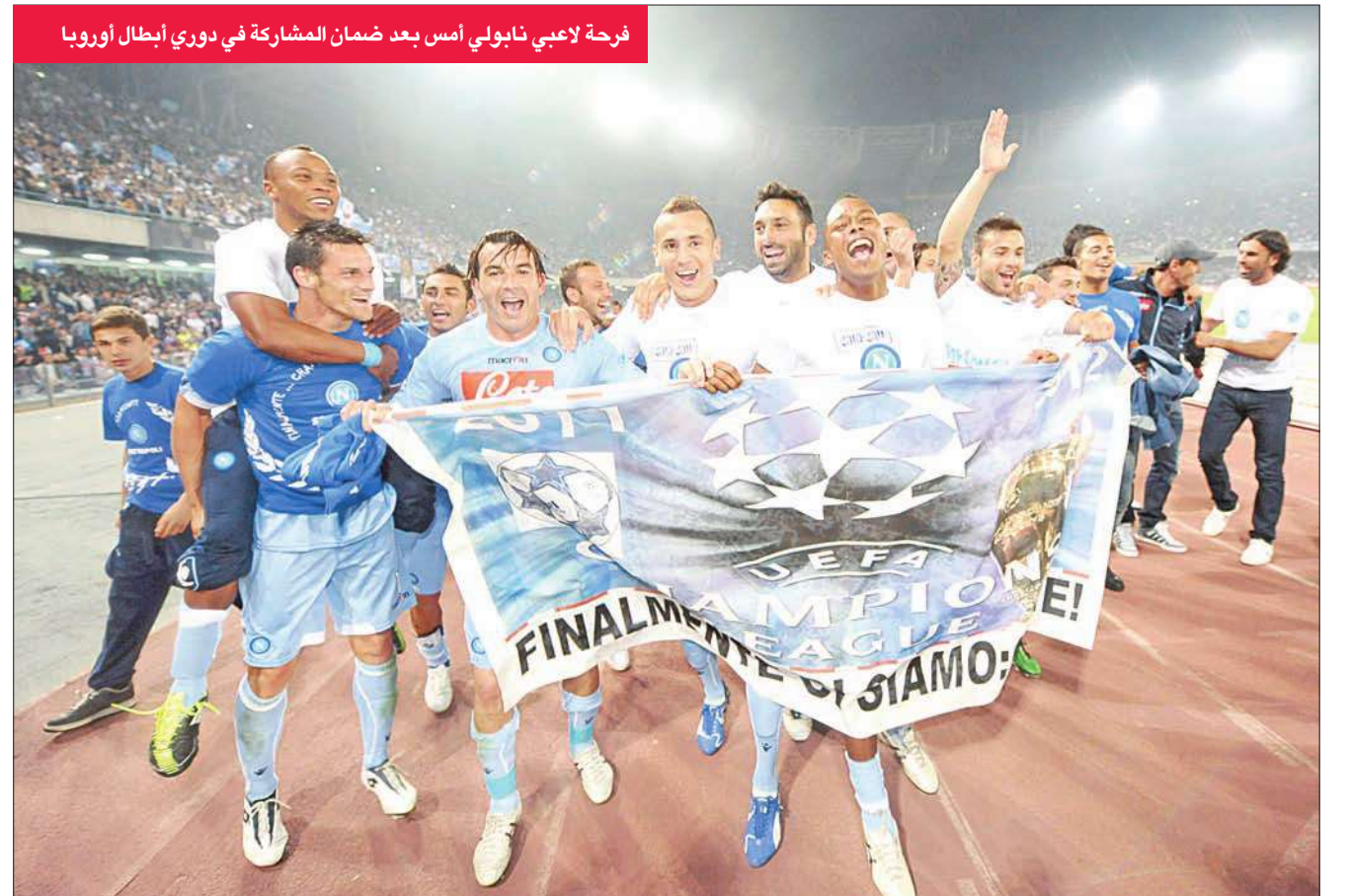
فرحة لاعبي نابولي أمس بعد ضمان المشاركة في دوري أبطال أوروبا