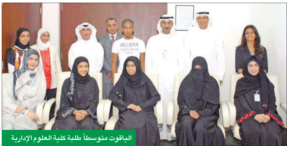
الباقيات متوسطاً طلبة كلية العلوم الإدارية

يمكن أن تكون هناك تنمية بالشكل المراد الوصول اليه. وكان البنك قام بتكريم مجموعة من طالبات شعبة الاقتصاد الإسلامي اللواتي شاركن في إعداد كتاب خاص بالاقتصاد الإسلامي بلغة عصريه مبسطة وذلك من خلال التعاون مع بنك بوبيان.