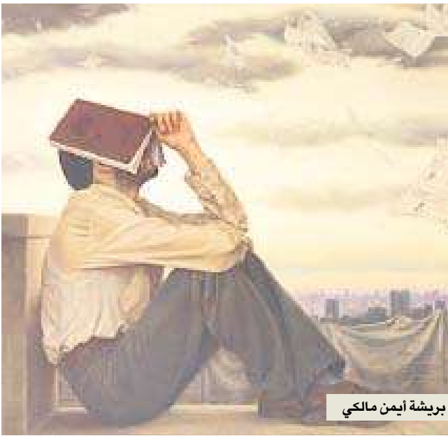
بريشة أيمن مالكي

وصفه البعض بأنه مناضل جسور، تصدى لهذه الظاهرة، في وقت كان من الممكن أن يتعرض للتكفير والتخيل من الجماعات الإسلامية المتطرفة، ما جعل دوره بحسب كثر فاعلاً في الحراك الاجتماعي والسياسي، حتى وإن لم يشارك في موقف القمع والظلم، ففي مسيرة تندد بالحكومة مثلمما يفعل بعض المثقفين في مساندة القضايا الديمقراطية ومناهضة الفساد، وتجاوزات الحكومة المصرية. ما حدا بالبعض إلى تصنيفه تارة على اليسار اليميني، وطوراً على