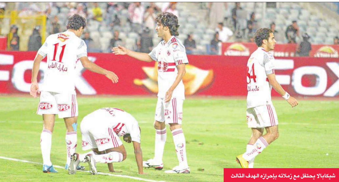
شيكابالا يحتفل مع زملائه بإحرازه الهدف الثالث

نقطة في المركز التاسع، بينما رفع المصري رصيده إلى 27 نقطة في المركز الثامن.