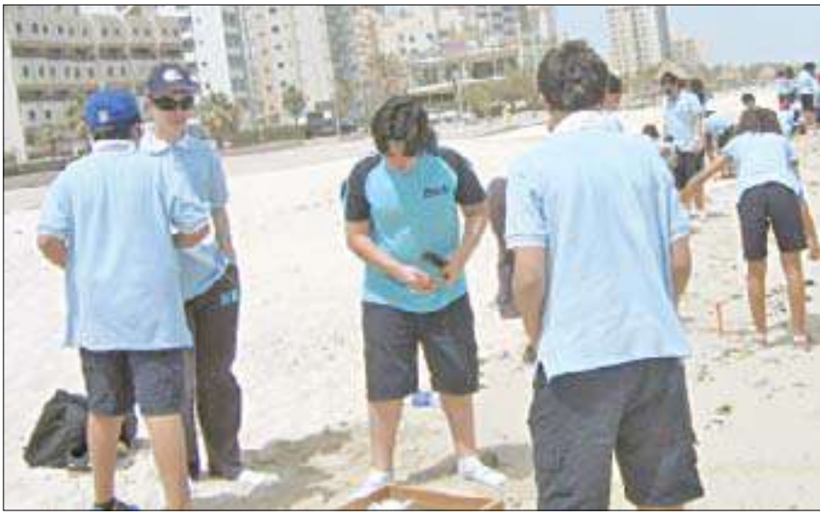
الطلاب يجمعون عينات للتحليل

أقامت مدرسة البيان ثنائية اللغة رحلة ميدانية لطلاب الصف السابع، لتفقد واستكشاف الصحة البيئية والبحرية لأحد الشواطئ المحلية. وخلال الرحلة حلل الطلاب عينات خاصة من الشاطئ، لجمع أدلة فرضية لتحديد إذا ما كانت بيئة الشاطئ صحية أم لا، وبهذا يكونون قد طبقوا ما درسوه عملياً.