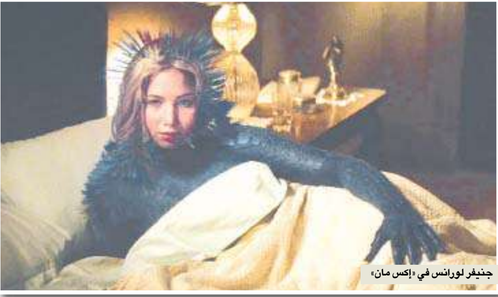
جينيفر لورانس في «إكس مان»

ثم نصل إلى الأنسة الصغيرة فانيغ. لا تعني بها داكوتا فانيغ التي انتقلت لآداء أدوار الراشدين الآن. بل نتكلم عن شقيقتها الصغرى إبل التي ستظهر في فيلم جي. جي. أيرمز بعنوان «الغمانية الخارقون» (Super 8) (يبدأ عرضه في 10 يونيو). في هذه القصة، يشهد أطفال يعذون فيلماً منزلياً على حادثة تحطم غامضة لقطار قادم من المنطقة رقم 51، تليها سلسلة من الأحداث الغريبة. كان هذا النوع من الأفلام يتمحور عادةً حول الشبان، لكن دورها فيه هو الأبرز هذه المرة