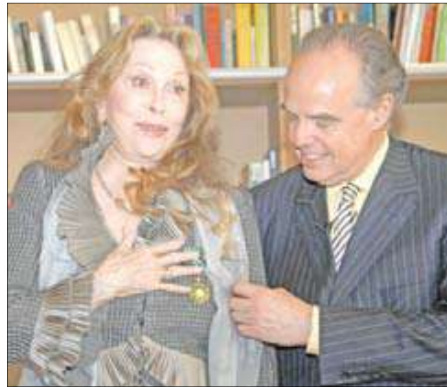
وزير الثقافة الفرنسي يقدّم داناوي وسام الفنون والآداب

الواقعة بين النجمة التي لا يمكن الوصول إليها على غرار غاربو، وبين بساطة جاين فوندا، إنك تملئين الحلم الأميركي الذي احتك بعبوب البشرية. وأعربت فاي داناوي في معرض شكرها عن «تأثرها وفخرها الكبيرين» للحصول على الوسام، مشيرة إلى أن «حس الممثل هو أن يبذل كل شيء بحثاً عن الانسجام الذي يتطلب تسخير الذات في خدمة العواطف التي لا تشعر بها بالضرورة في الحياة». وقالت النجمة الأميركية إنها تعمل على تحسين أدائها وعلى تعلم احترام المواعيد في إشارة طريفة إلى تأخرها 25 دقيقة على مراسم تقليد الوسام.