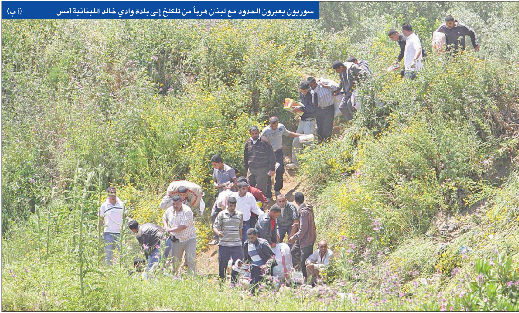
سوريون يعبرون الحدود مع لبنان هرباً من تلكلخ إلى بلدة وادي خالد اللبنانية أمس

تردي الأوضاع الإنسانية في بانياس في ظل استمرار الحصار • الإفراج عن مئات المعتقلين بعد «تعهدهم» بعدم التظاهر