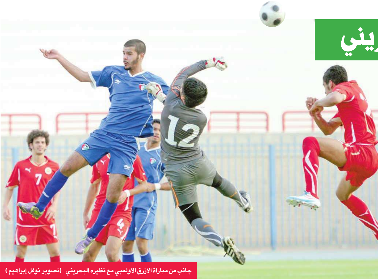
جانب من مباراة الأزرق الأولمبي مع نظيره البحريني