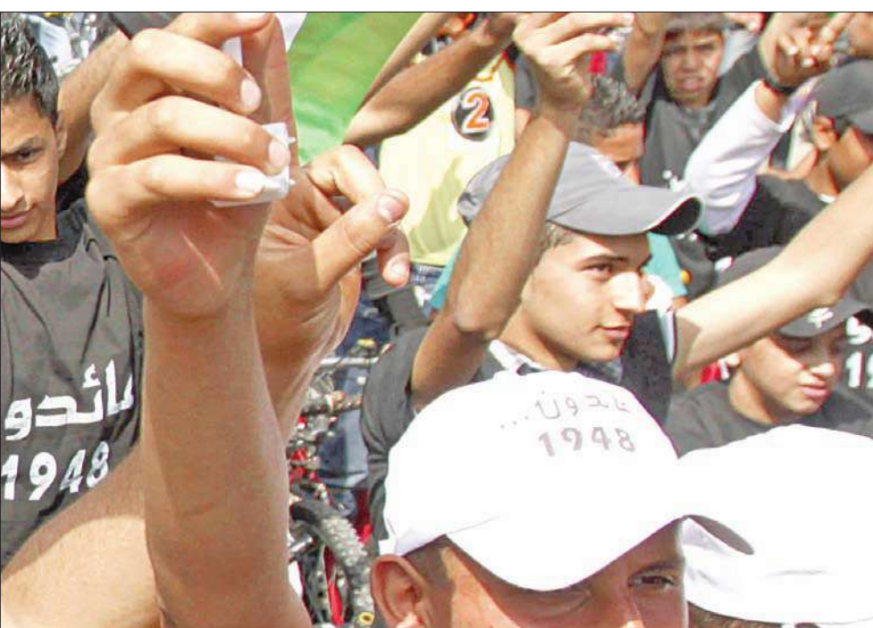
شبان فلسطينيون يرفعون شارات النصر خلال مشاركتهم في سباق للدراجات الهوائية خاص بذكرى النكبة في جنين أمس.

• روما ترفع التمثيل الفلسطيني إلى مستوى بعثة • شكوى إسرائيلية ضد لبنان وسورية