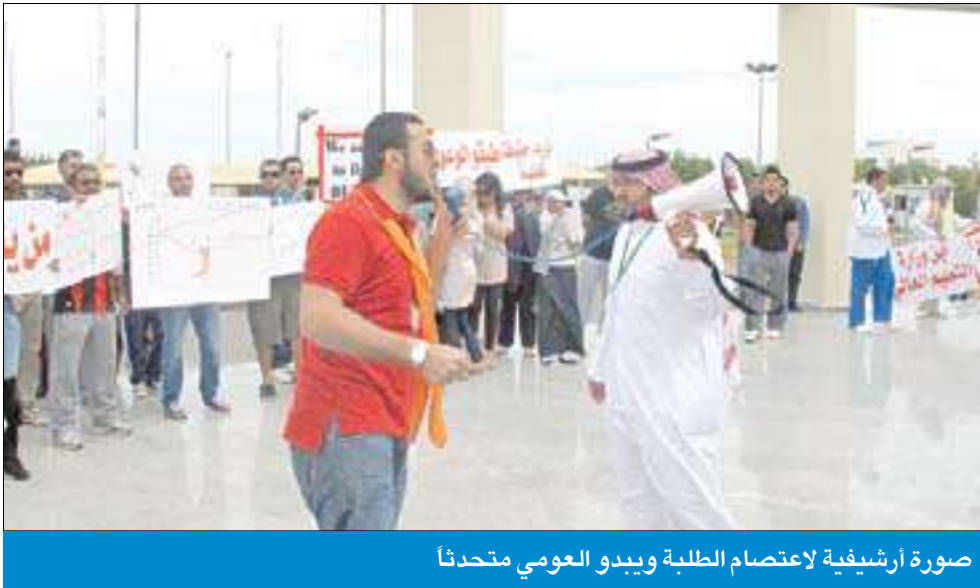
صورة أرشيفية لاعتصام الطلبة وبدو العمومي متحدنا

سبعة محامين يقاضون الإدارة... و«التنفيذية» تتوعد بالمحاسبة