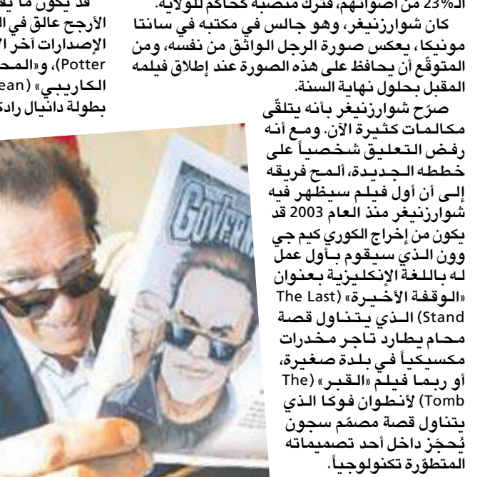
أوضح شوارزنيغر أنه يرغب في العودة إلى التمثيل في الأفلام القديمة التي حققت نجاحاً باهراً على شباك التذاكر، مع أن بعض الممثلين لا يحض هذه الفكرة.

لكن لا شك في أنك ستشعرون بالفضول عند التفكير بروية بينيلوبي كروز الحائزة جائزة أوسكار وهي تخوض دور المقاتلة المغامرة، لمجرد انضمامها إلى طاقم الممثلين في الفيلم - إلى جانب روب مارشال الذي أخرج فيلم «شيكاغو» (Chicago) والذي يحل الآن مكان المخزغ غور فيربيشكي - وستعرجون في منح هذا الفيلم الذي يتمحور حول قرصنة مجانيين فرصة أخرى. إذا كنت قد بدأت تسام من سلسلة «إكس مان» (X-Men) ستغير موقفك هذا عندما تسمع أن جينيفر لورانس (التي ترشحت لجائزة الأوسكار عن فيلم «عظام الشتاء»، ستظهر في فيلم «إكس مان: الصف الأول» (X-Men: First Class) (يبدأ عرضه في 3 يونيو) تؤدي لورانس دور «مستيك»، الكاتبة المتحوّلة ذات الجشرة الزرقاء، علماً أن ريبكا رومجين كانت قد جسدت هذه الشخصية سابقاً. بالحدث عن الكائنات الزرقاء الجميلة، لا يجب أن ننسى السنفورة «سورفيت»، فهي الأثني