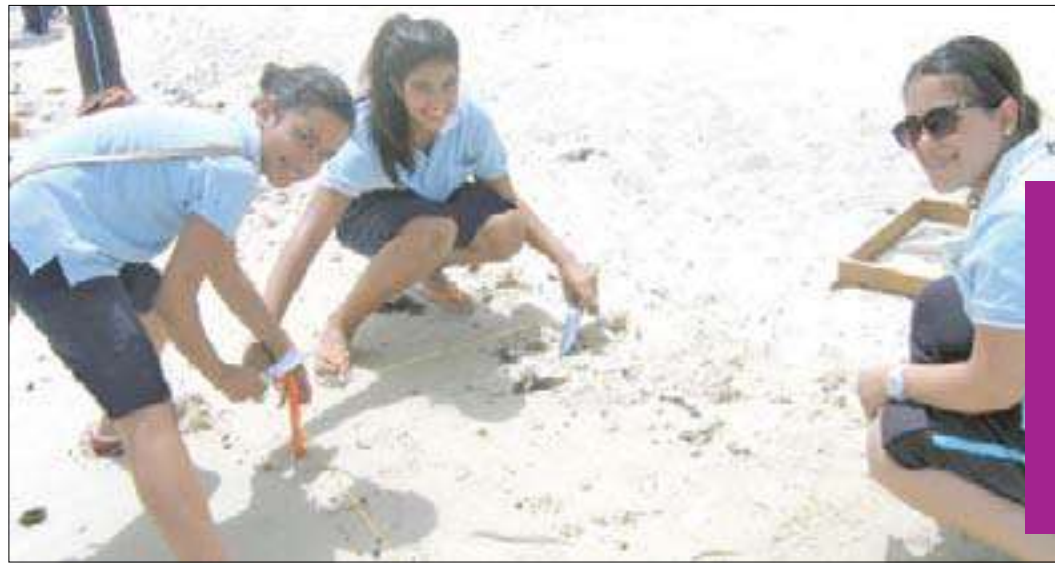
عدد من طالبات الصف السابع أثناء الرحلة

أقامت مدرسة البيان ثنائية اللغة رحلة ميدانية لطلاب الصف السابع، لتفقد واستكشاف الصحة البيئية والبحرية لأحد الشواطئ المحلية. وخلال الرحلة حلل الطلاب عينات خاصة من الشاطئ، لجمع أدلة فرضية لتحديد إذا ما كانت بيئة الشاطئ صحية أم لا، وبهذا يكونون قد طبقوا ما درسوه عملياً.