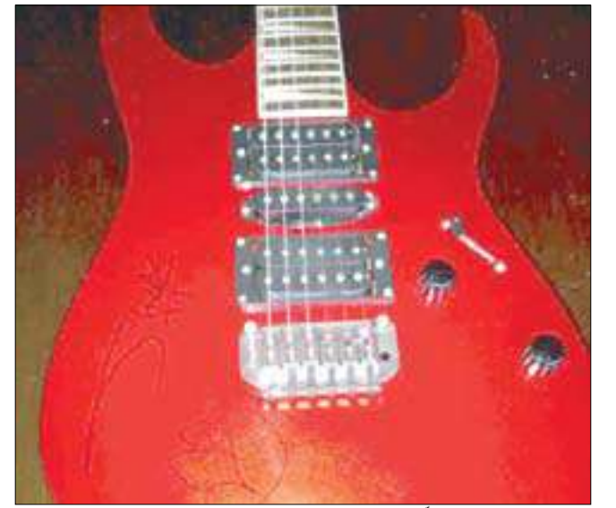
الغيتار الأحمر الذي تلقاه تشافيز من شاكيرا