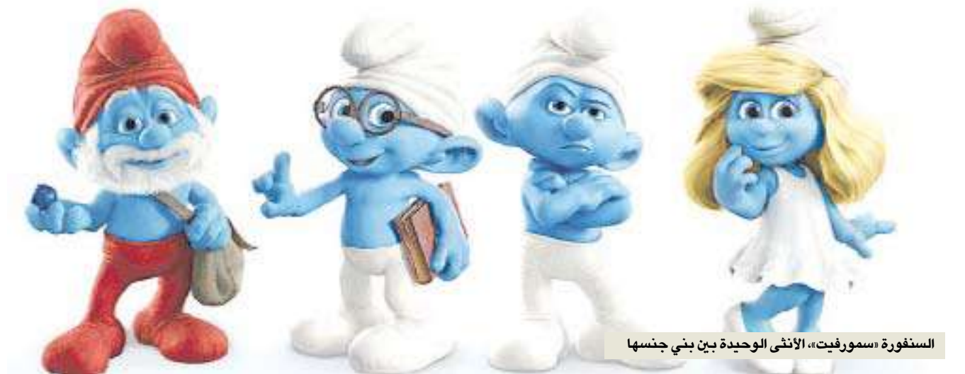
السنفورة «سورفيت»، الأثني الوحيدة بين بني جنسها

لا يعني ذلك أن الشبان المشاهغبين والرجال الذكورين سيغيبون عن دور السينما خلال الأشهر الأربعة المقبلة. إذ تُعتبر أفلام «ثور» (Thor)، والفانوس الأخضر، (Green Lantern)، وكابتن أميركا (Captain America)، و«عارة البقر ضد المخلوقات الفضائية» (Cowboys vs. Aliens)، من أكثر الناويين جذباً لانتباه. لكن، ستطغى أفلام من إنتاج النساء ومتعلقة بهنّ ومخصصة لهنّ على الساحة السينمائية خلال أيام الصيف الحارة. وحتى في أنواع الأفلام التي تستهوي الشبان، تؤدي النساء أدوراً أكبر وأكثر أهمية. في حالات عدة، تكون المرأة السبب الرئيس الذي يدفعني إلى رؤية أي فيلم. لتحدث مثلاً عن فيلم «قرصنة الكاريبي: الغريب في المد والجزر» (Pirates of the Caribbean: On Stranger Tides) (يبدأ عرضه في 10 مايو الجاري). لقد تحول موقف كثر تجاه سلسلة الأفلام الشهيرة هذه من المتعة الطفيفة إلى الملل الهائل بعد الجزء الثالث.