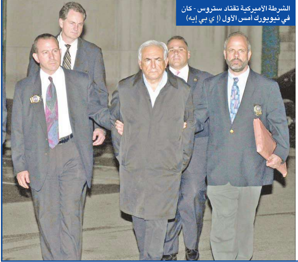
الشرطة الأميركية تقتاد ستروس - كان في نيويورك أمس الأول

لصندوق النقد الدولي «اقرب منها من الخلف ولمسها بشكل غير لائق. وأرغمها على أداء عمل جنسي».