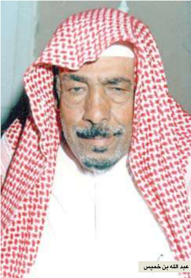
عبد الله بن خميس

وفي عام 1956 عين مديراً عاما لرئاسة القضاء بالمملكة العربية السعودية. وفي عام 1961 صدر مرسوم بتعيينه وكيل وزارة المواصلات. وفي عام 1966 عين رئيسا لمصلحة المياه بالرياض، وفي عام 1972 قدم طلبا للإحالة على