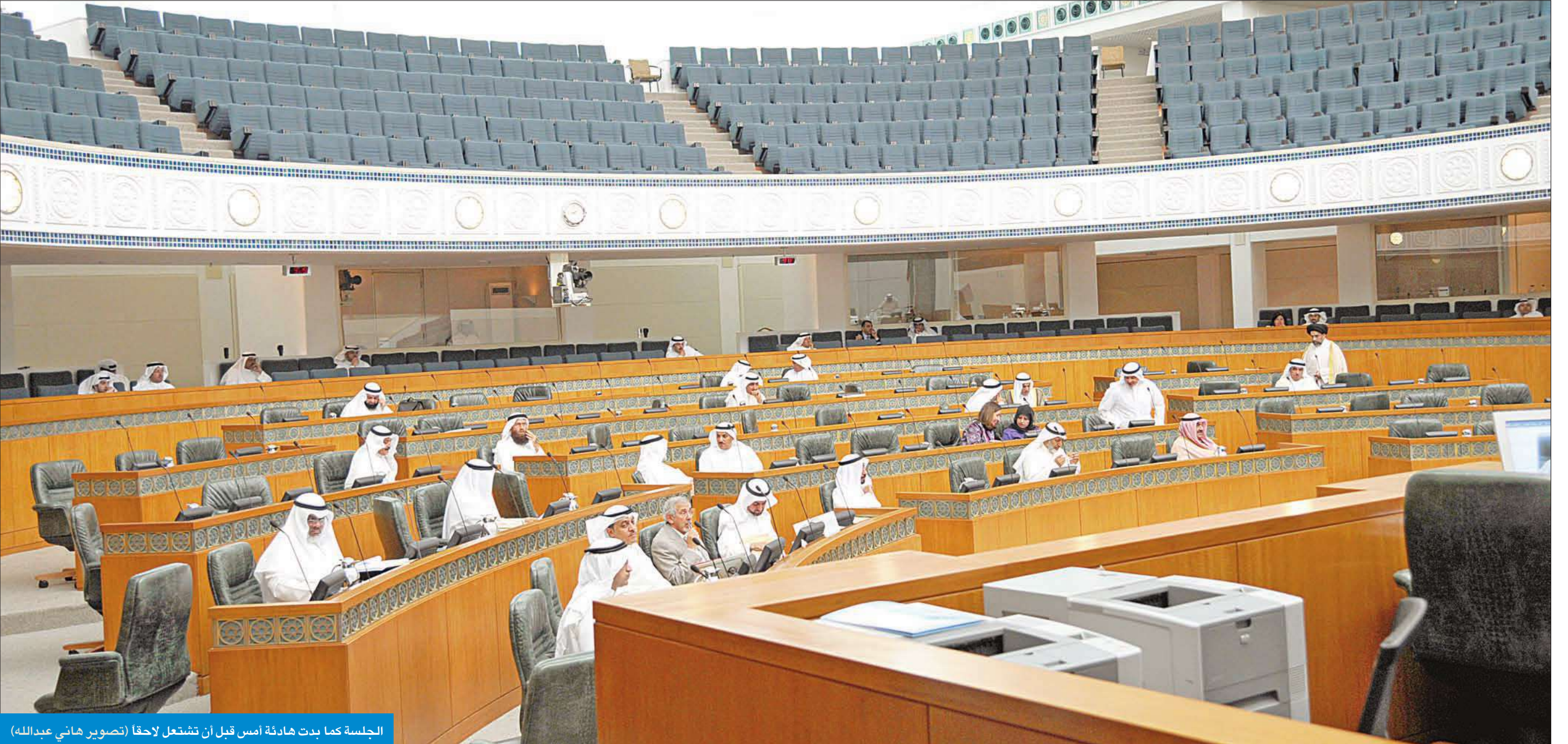
الجلسة كما بدت هادئة أمس قبل أن تشتعل لاحقاً

أميركا ترسل كل فترة ديفيد كوهين، الذي يحمل أفكاراً صهيونية، وتقوم بسجن وتعذيب أفراد من جنسيات عربية مختلفة في سجن غوانتانامو، من دون إعطائهم حقهم الأساسي في الدفاع، ولم يشتركوا في أي حرب، وتم ادخالهم السجن، بعيداً عن أي حقوق إنسانية في العالم، ومشروع ديفيد كوهين لمكافحة الإرهاب يأتي لمصلحة الكيان الصهيوني.