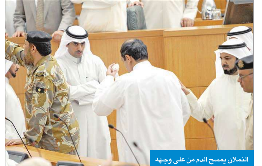
النملان يمسح الدم من على وجهه