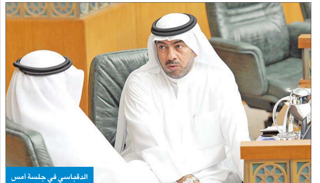
الدقباسي في جلسة أمس

يبدأ اليوم أعمال دورته العادية الأولى لعام 2011