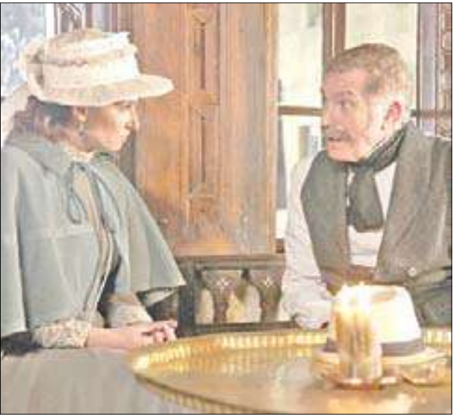
من مسلسل توق

من مدينة حلب الشهباء السورية، دارت كاميرا المخرج التونسي شوقي الماجري معلنة بدء تصوير المشاهد الأولى للمسلسل «توق» وهو من تأليف الأمير الشاعر بدر بن عبدالمحسن، ثم انتقلت منذ أيام قليلة إلى مواقع التصوير الخارجية في منطقة تدمر الأثرية السورية.