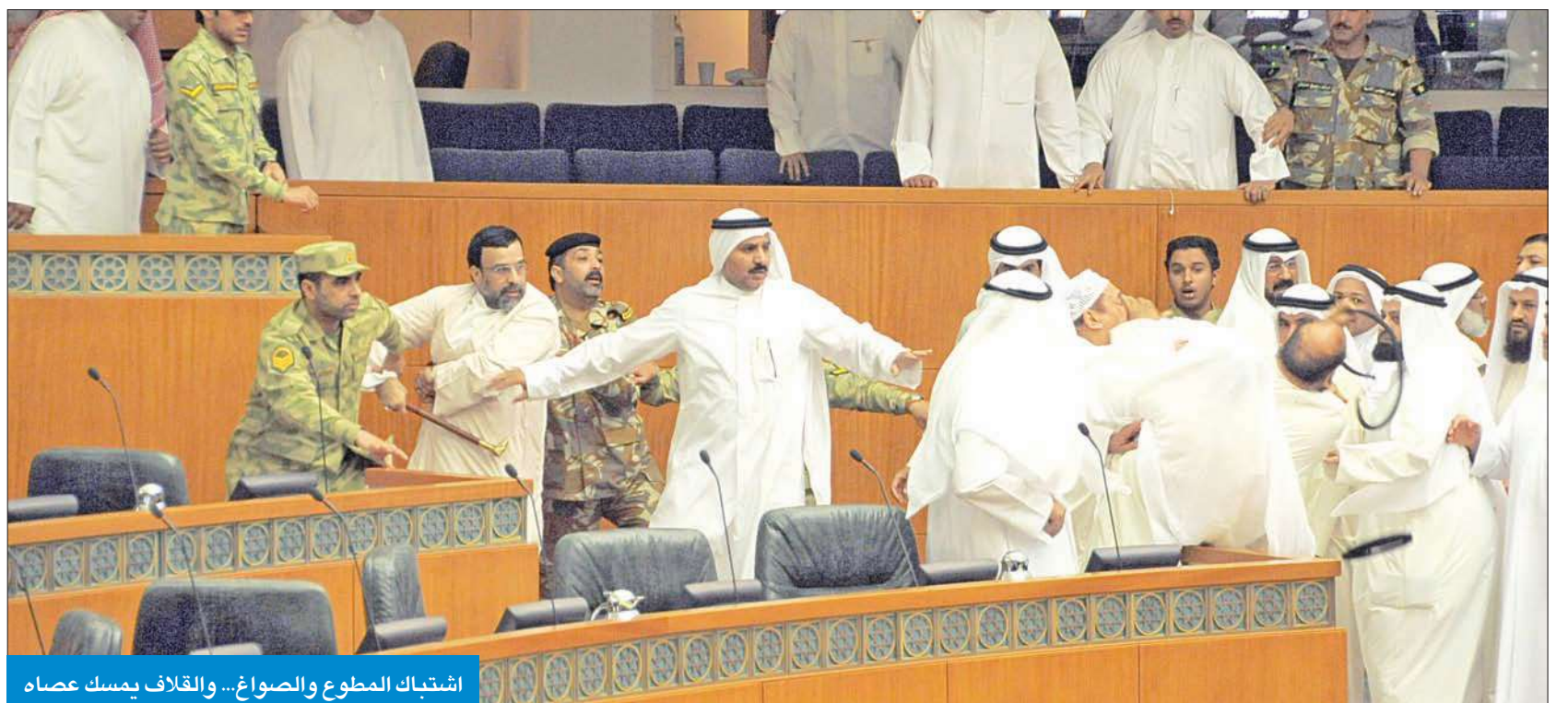
اشتباك المطوع والصواغ... والقلاف يمسك عصاه