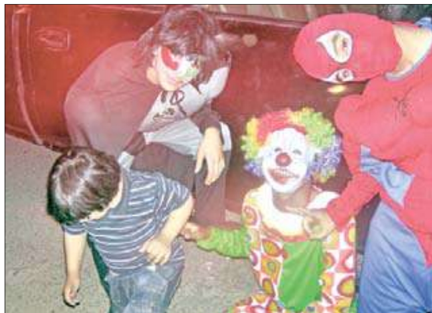
شباب أحيوا الحفل بشخصيات مختلفة