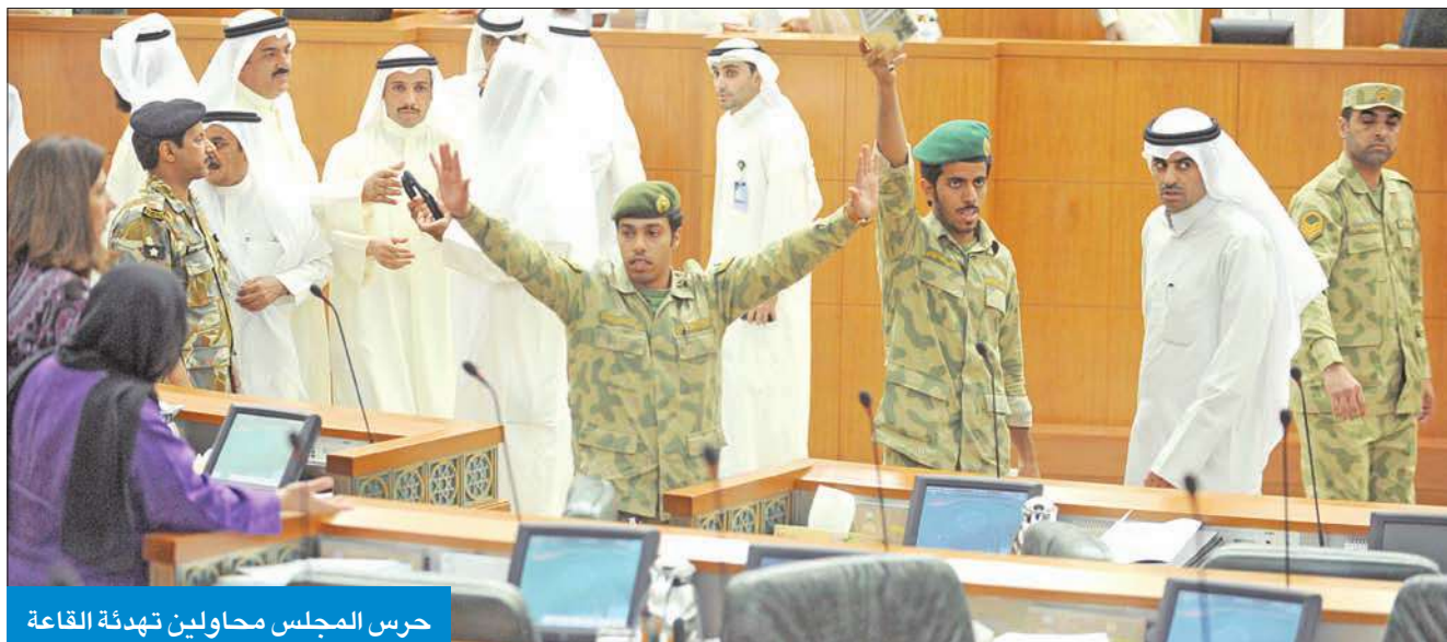
حرس المجلس محاولين تهدئة القاعة