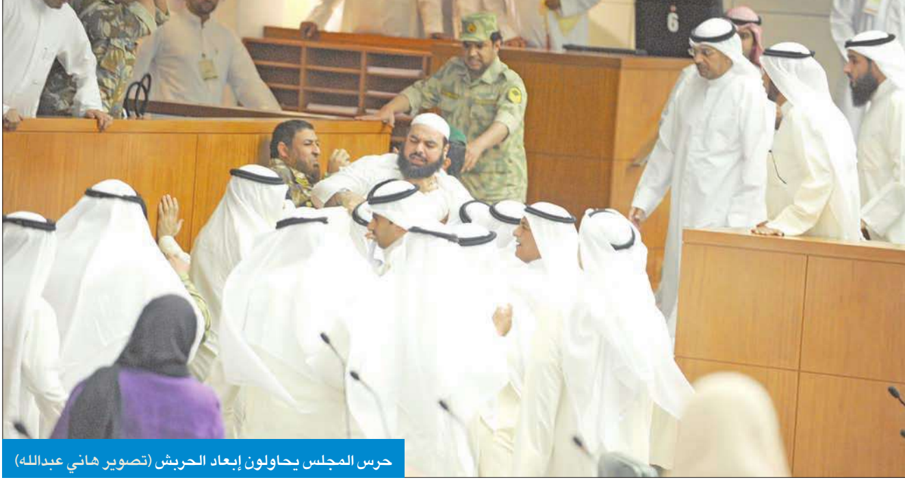
حرس المجلس يحاولون إبعاد الحريش

● القلاف بدأها... وهايك والحريش والصواغ وزنيفر والطببائي والمطوع أطراف