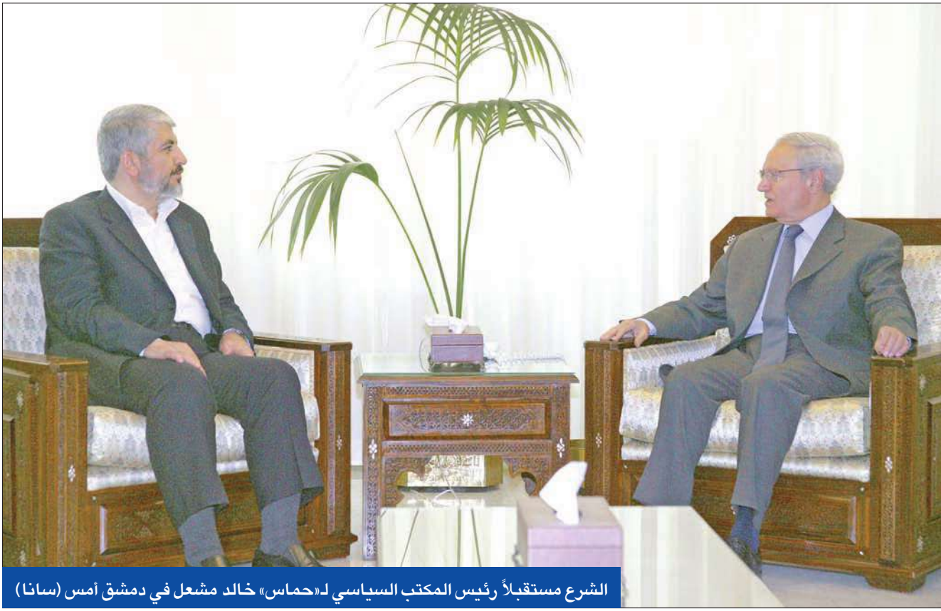
الشرع مستقبلاً رئيس المكتب السياسي لـ«حماس» خالد مشعل في دمشق أمس

خطب في مدينة حلب، وذلك بعد سلسلة من الاستدعاءات الأمنية المتكررة بحقهما". وأشار البيان إلى أن "الصحافيين المعتقلين يعملان في موقع (شو) الأخبار) الإلكتروني السوري، مرجحاً أن يكون اعتقالهما جاء على خلفية سياسة الموقع حيال الأحداث الأخيرة التي تمر بها البلاد".