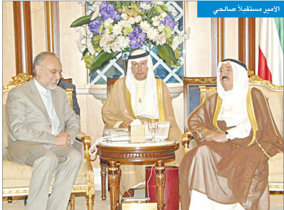
الأمير مستقبلاً صالح

استقبل سمو أمير البلاد الشيخ صباح الأحمد بقصر بيان صباح أمس، بحضور رئيس مجلس الوزراء سمو الشيخ ناصر محمد، وزير الشؤون الخارجية في إيران دعلي أكبر صالح والوفد الرسمي المرافق، وذلك بمناسبة زيارته الرسمية للبلاد.