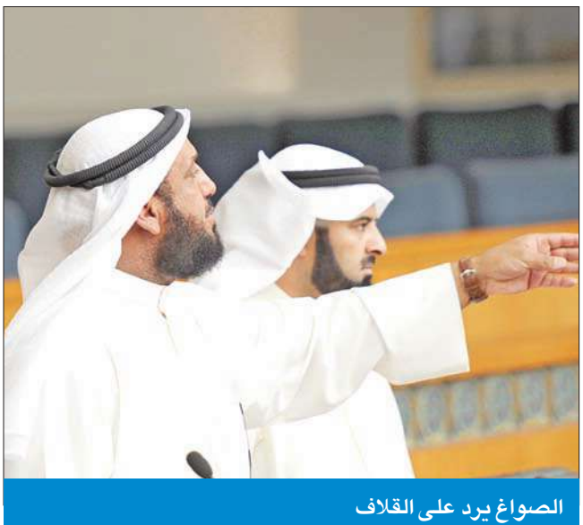
الصواغ يرد على القلاف