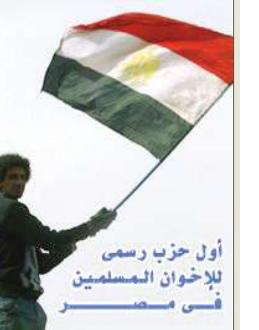
ملصق وزعه شباب الإخوان المسلمين في مصر