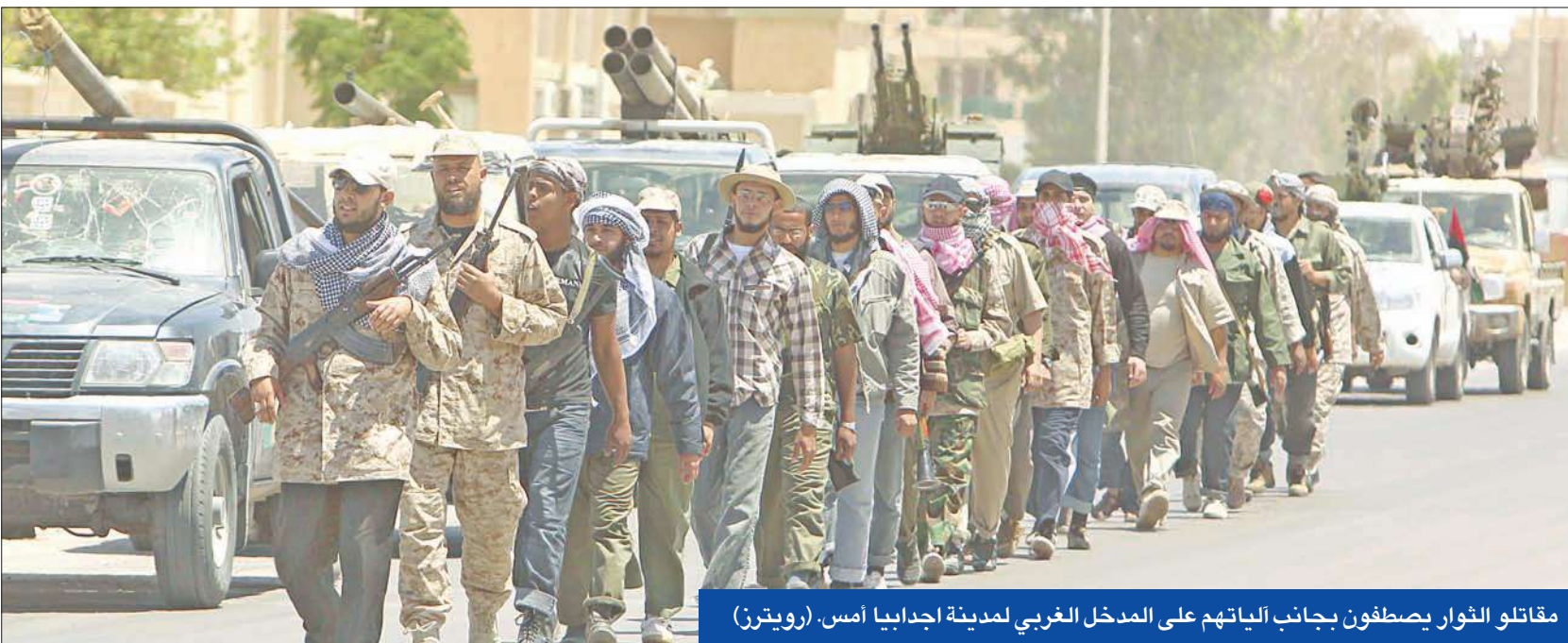
مقاتلو الثوار يصطفون بجانب الياتهم على المدخل الغربي لمدينة اجدابيا أمس.

بعد تلقية سلسلة من الهزائم العسكرية في الميدان وتكبده عددا من الإخفاقات الدبلوماسية في الأمم المتحدة وعدد من عواصم الدول الكبرى، لا يزال العقيد الليبي معمر القذافي يملك بعض مراكز القوى على الأرض، إذ تستمر كتابته في تنفيذ قصف مركز لبض المناطق الخاضعة لسيطرة الثوار. رغم تكديدها خسائر جسيمة على أرض المعركة في الأيام القليلة الماضية، لا تزال القوات الموالية للقذافي تقصف للزعيم الليبي معمر القذافي قري وبلدات، في محاولة للسيطرة على الأرض المرتفعة في سلسلة جبال غربية، في حين وسع حلف شمال الأطلسي غاراته الجوية وتوزيع المنشورات، بهدف إقناع القوات الحكومية بالتوقف عن القتال. وأفاد مصدر من مقاتلي الثوار في قرية قرب منطقة بفرن التي تبعد 120 كيلومترا جنوب غرب طرابلس، بأن قوات القذافي استخدمت صواريخ غراد وقاذفات الصواريخ في حصارها المتواصل منذ شهر، تاركة السكان عالقين لا تصل إليهم إمدادات الغذاء والوقود، وأضاف: «نحفر خنادق ونحتمي فيها ليلا». وتعد بفرن واحدة من كبرى المدن في سلسلة جبال نفوسة التي تضم الأقلية البربرية في البلاد، وصرح مسلح من الثوار بتمركز في بفرن بأن قوات القذافي تقصف قري باتجاه قمة سلسلة جبال نفوسة، في محاولة للسيطرة على الأرض المرتفعة.