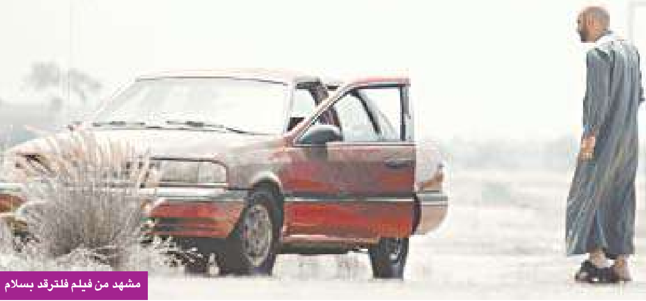
مشهد من فيلم فلترقد بسلام

لمخرجه محمد المري، و«حياة من صخر» لمخرجه معاذ بن حافظ، و«جمل مجنون» لمخرجه محمد فكري، و«ممل» لمخرجه نايلة الخاجة. وتضم قائمة الأفلام الأخرى المشاركة في زاوية الأفلام القصيرة