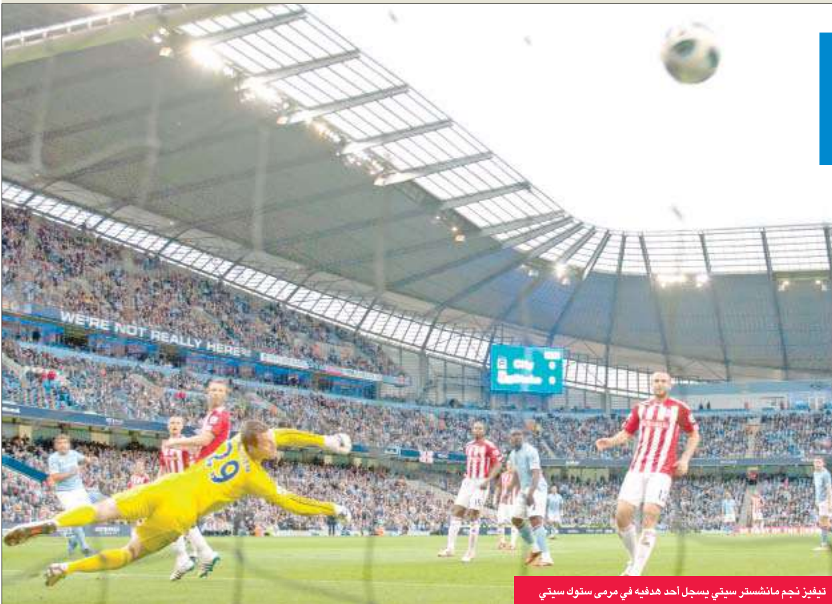
تيفيز نجم مانشستر سيتي يسجل أحد أهدافه في مرمى ستوك سيتي

سجل المهاجم الأرجنتيني كارلوس تيفيز ثنائية قاد بها مانشستر سيتي إلى الفوز على ضيفه ستوك سيتي 3-صفر أمس الأول، في ختام منافسات المرحلة السابعة والثلاثين قبل الأخيرة من الدوري الإنكليزي الممتاز لكرة القدم.