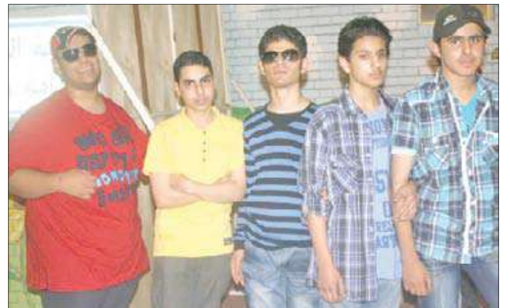
مجموعة من الشباب المشاركين