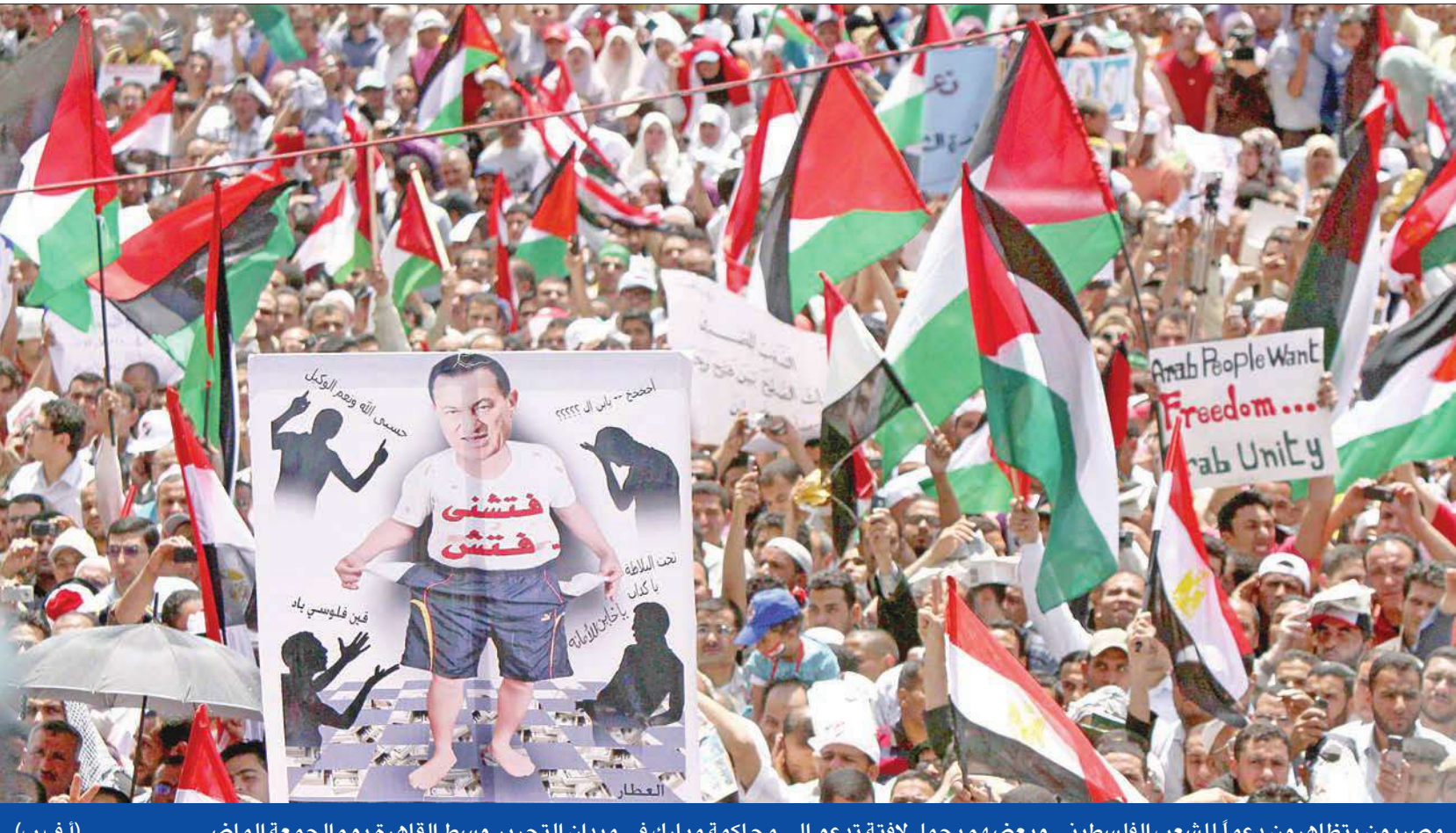
مصريون يتظاهرون دعماً للشعب الفلسطيني وبعضهم يحمل لافتة تدعو إلى محاكمة مبارك في ميدان التحرير وسط القاهرة يوم الجمعة الماضي

«الكسب غير المشروع» يستدعي هيكل لمناقشته بشأن ثروة مبارك