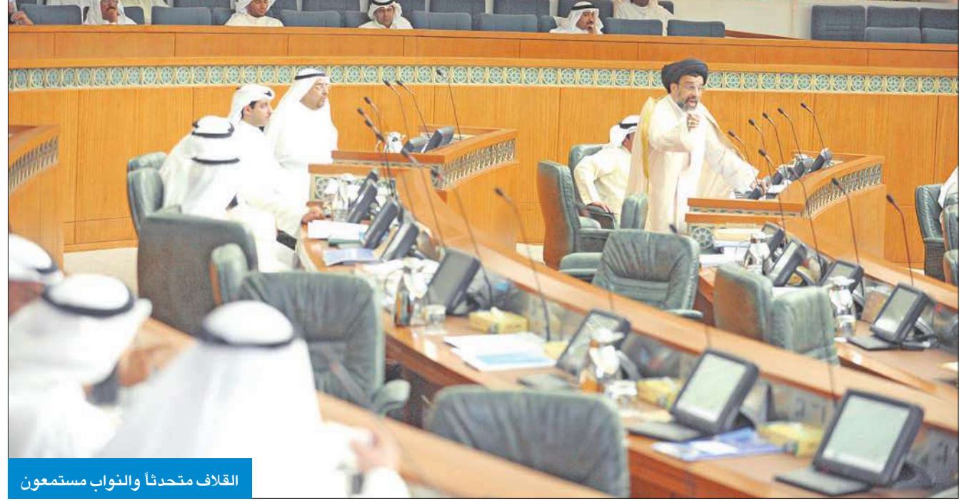
القلاف متحدثا والنواب مستمعون