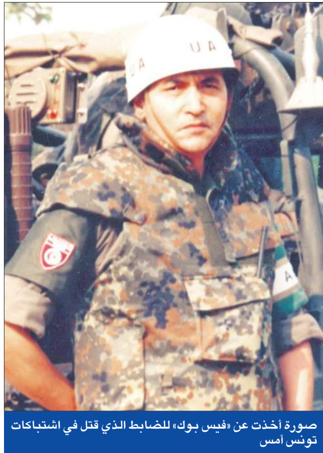
صورة أخذت عن «فيس بوك» للضابط الذي قتل في اشتباكات تونس أمس

من ناحية أخرى، رفعت وزارة الداخلية أمس، حظر التجول الليلي الذي فرض منذ السابع من مايو