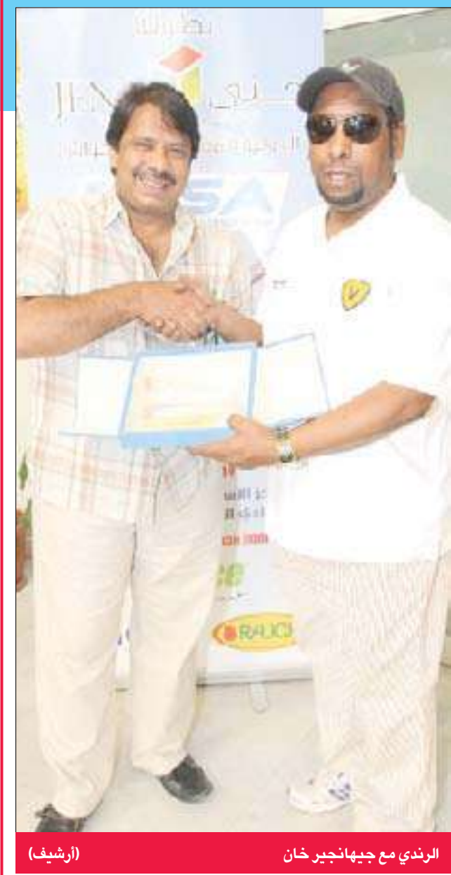
الرندي مع جيهانجير خان