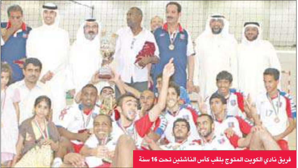
فريق نادي الكويت المتوج بلقب كأس الناشئين تحت 16 سنة

الساحل بثلاثة أشواط مقابل شوط واحد، في مباراة تحديد المركزين الثالث والرابع، عقب انتهاء المباراة النهائية سلم رئيس مجلس إدارة الاتحاد كامل الأيوبي كأس البطولة لكابتن فريق الكويت، ووزع الميداليات التذكارية على لاعبي الفرق الـ3 الفائزة بالمركز الأول.