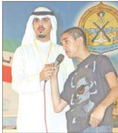
فقرة من الحفل