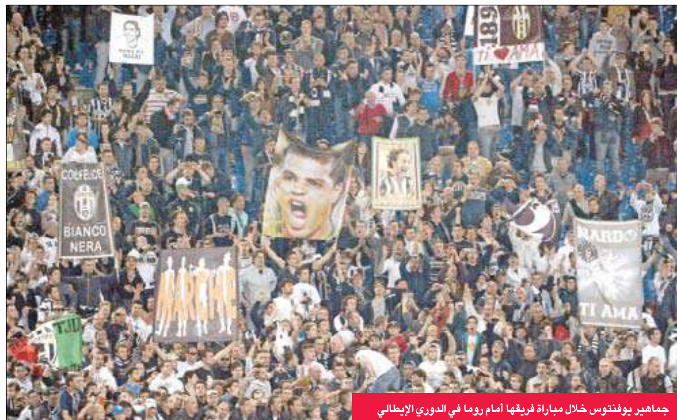
جماهير يوفنتوس خلال مباراة فريقها أمام روما في الدوري الإيطالي

وبدأت الخطوات الأولى بالفعل لاستعادة أمجاد يوفنتوس الماضية، فقد أصبح أهم أهداف الفريق استعادة مكانته التي فقدتها في عام 2006 عندما أنزل إلى دوري الدرجة الثانية الإيطالي لدوره البارز