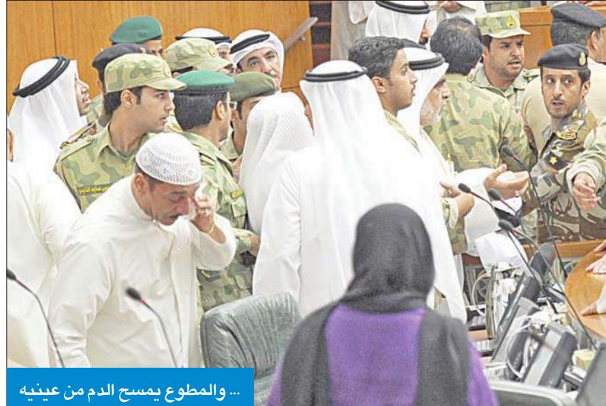
... والمطوع يمسح الدم من عينيه