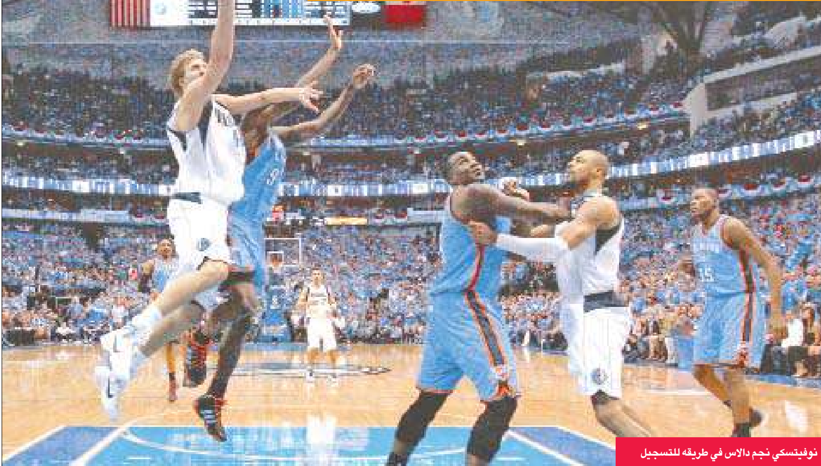
نوفيتسكي نجم دالاس في طريقة للتسجيل

وتعمق النجم الألماني ديرك نوفيتسكي وقاد دالاس مافريكس إلى التقدم على أوكلاهوما سيختي ثاندز 1-0 صفر في نهائي المنطقة الغربية، بتسجيله 48 نقطة في مباراة هجومية مفتوحة حسمها فريقه 112-121 امس الأول ضمن بلاي أوف الدوري الأميركي للمحترفين في كرة السلة. على ملعب «اميركان إيرلاينز سنتر» وامام 20911 متفرجا، بدأ دالاس نهائي المنطقة الغربية من حيث انتهى الدور نصف النهائي (اكتسح ليكرز 4-0 صفر) وحسم مواجهته الأولى مع ضيفه أوكلاهوما سيختي بفضل تالق نوفيتسكي، الذي قدم مباراة رائعة بكل المعايير، حيث سجل 10 سلات من اصل اول 11 محاولة، ونجح في ترجمة 24 رمية حرة متتالية من اصل 24 (بينها 13 في الربع الثالث فقط) محققاً رقماً قياسياً في الادوار الاقصائية، وكان رقم السابق باسم نجم بوسطن سلتيكس بول بيرس الذي سجل 21 رمية متتالية امام انديانا في ابريل 2003.