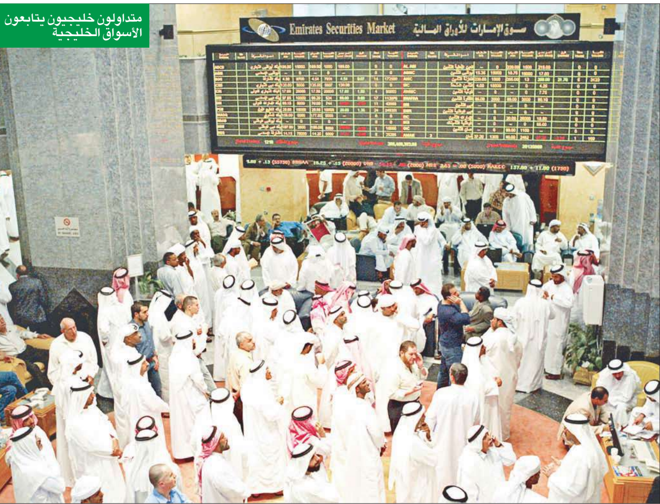
متداولون خليجيون يتابعون الأسواق الخليجية

وحول الاستعداد للمعرض قال مدير المبيعات أن الشركة لديها فريق مدرب على أعلى مستوى لاستقبال الزبائن وتقديم كافة الخدمات المطلوبة حيث سيتم استعراض تشكيله الجديد من الأواب والدرابزينات