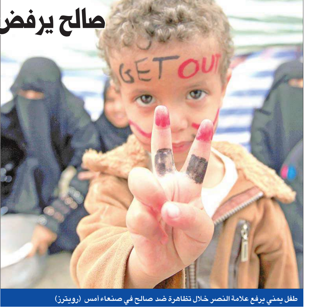
طفل يمني يرفع علامة النصر خلال تظاهرة ضد صالح في صنعاء أمس

وتابع الطويل وزكا قائلين: "لو كنت له ان يصبح رئيسا للجمهورية، فسيتل قوة مدمرة ومخزية"، لافتين إلى أنه "متعريف وعندي كفاية لعدم التحوار مع