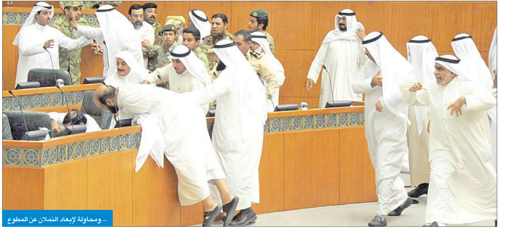
... ومحاولة لإبعاد النملان عن المطوع