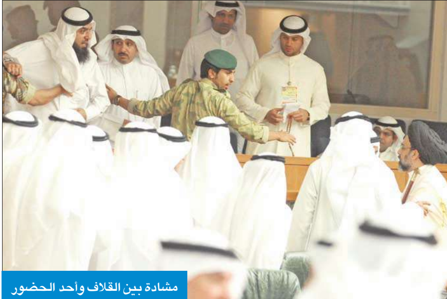
مشادة بين القلاف وأحد الحضور