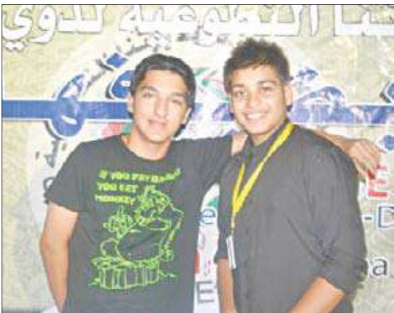
متطوعان من فريق العمل