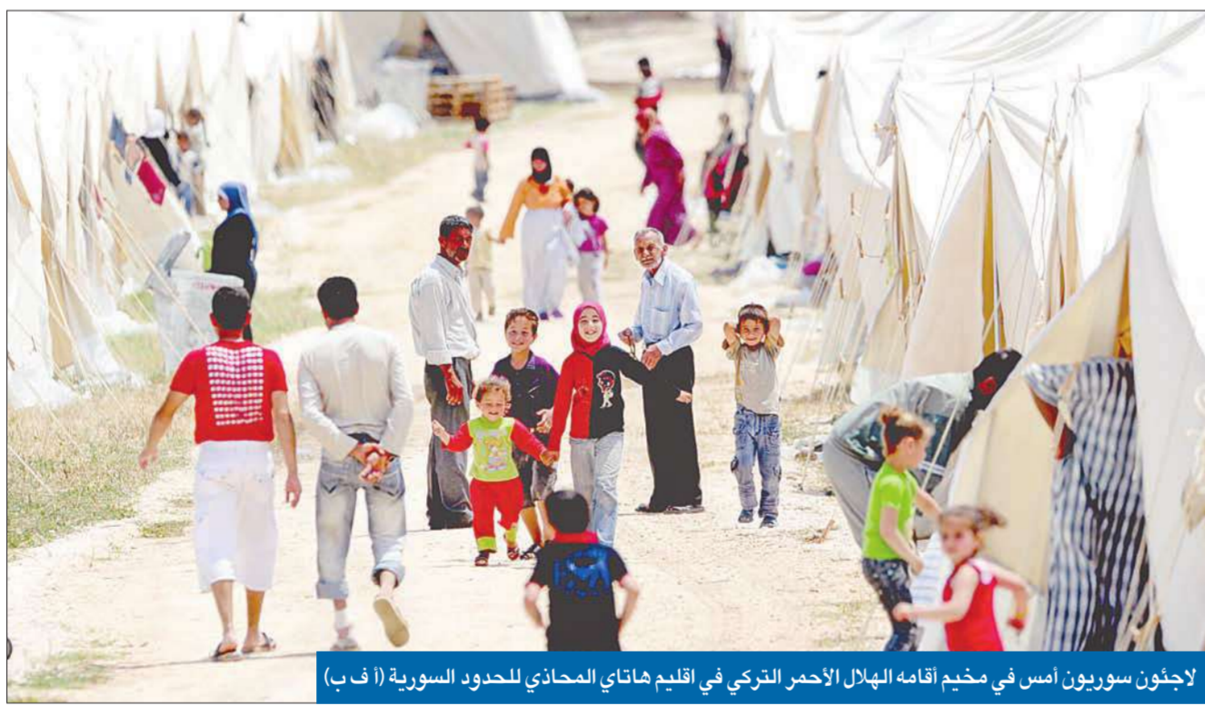
لاجئون سوريون أمس في مخيم أقامه الهلال الأحمر التركي في إقليم هاتاي المحاذي للحدود السورية

أكثر من 5000 هربوا إلى تركيا... وتحذيرات دولية من أزمة إنسانية