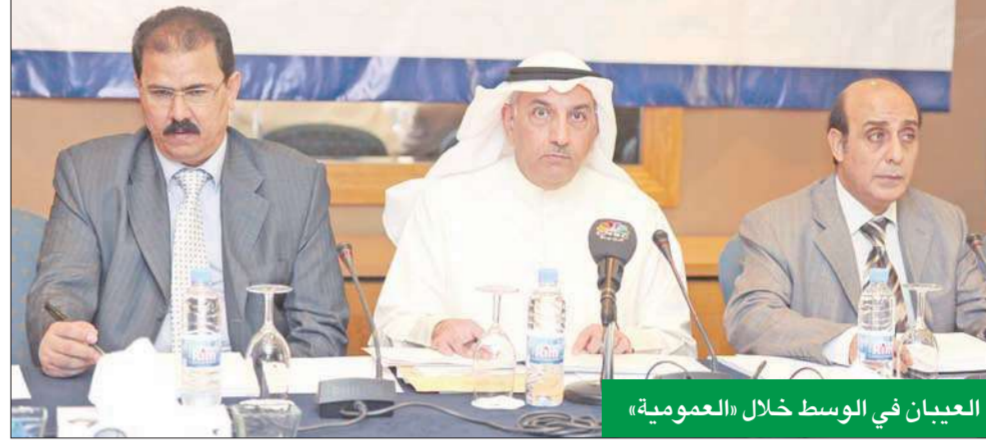
العيان في الوسط خلال «العمومية»

الجيد بالخبرات اللازمة للنهوض بها وفي إدارة أصولها والاستثمار في بعض اهم الشركات المرددة للدخل سواء محلياً في الشركة الكويتية للمقاصة أو خارجياً في صناديق استثمارية مؤنفة. من جانبها، وافقت الجمعية العمومية على جميع بنود جدول الأعمال واعتمدت تقرير مجلس الإدارة ومراقبي الحسابات وصادقت على الميزانية العامة للسنة المالية المنتهية في 31 ديسمبر 2010، كما وافقت على إخلاء طرف أعضاء مجلس الإدارة والتعامل مع اطراف ذات صلة.