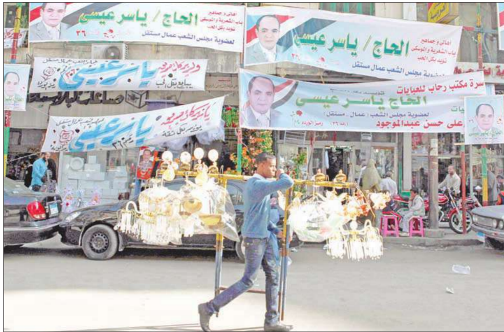
بانع متجول يمر بجوار إعلانات لمرشح مستقل في الانتخابات البرلمانية المصرية في القاهرة العام الماضي

في ما يعد تعزيزاً لدعوات إرجاء الانتخابات البرلمانية المقبلة، أكد رئيس الحكومة المصرية عصام شرف أمس، خلال حوار مع الجالية المصرية بجنوب إفريقيا في إطار زيارته الحالية لها، أنه "يشكل شخصي" من أنصار أن يكون هناك وقت إضافي قبل إجراء الانتخابات البرلمانية، مشيراً إلى أن المرحلة الحالية تشهد حوارات مكثفة اقترح بعضها نوعاً من التأجيل حتى تعطى فرصة للحراك السياسي أن يتطور. وتضمن شرف أن يتطور التغيير، الذي أحدثته الثورة، بمضي الوقت على مستوى الحركة والخريطة السياسية بالوصول إلى نتائج ملموسة، مبيحاً أنه إذا اختار المواطنون أن يتم التغيير في هذا التوقيت فلا بد من الاستجابة، ومد يد المعاونة.