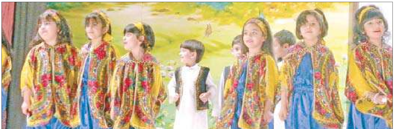
فقرة من الحفل