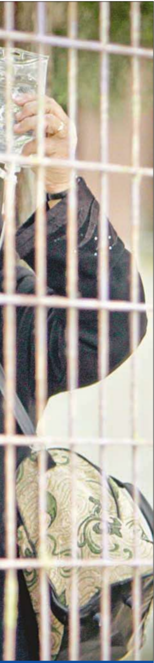
لاجئة سورية تحمل طفلاً مريضا في مخيم للاجئين داخل تركيا أمس

وفي روما، دان مكتب رئيس الحكومة سيلفيو برلسكوني «لجوء السلطات السورية غير المقبول إلى العنف ضد شعبيها» وطلب السماح