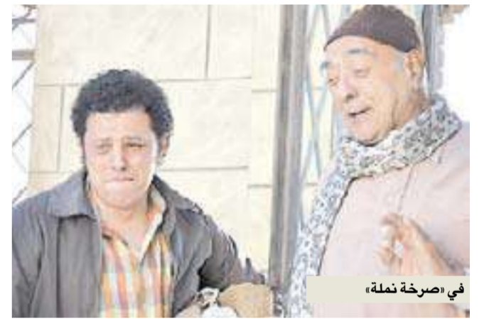
في «صرخة نملة»