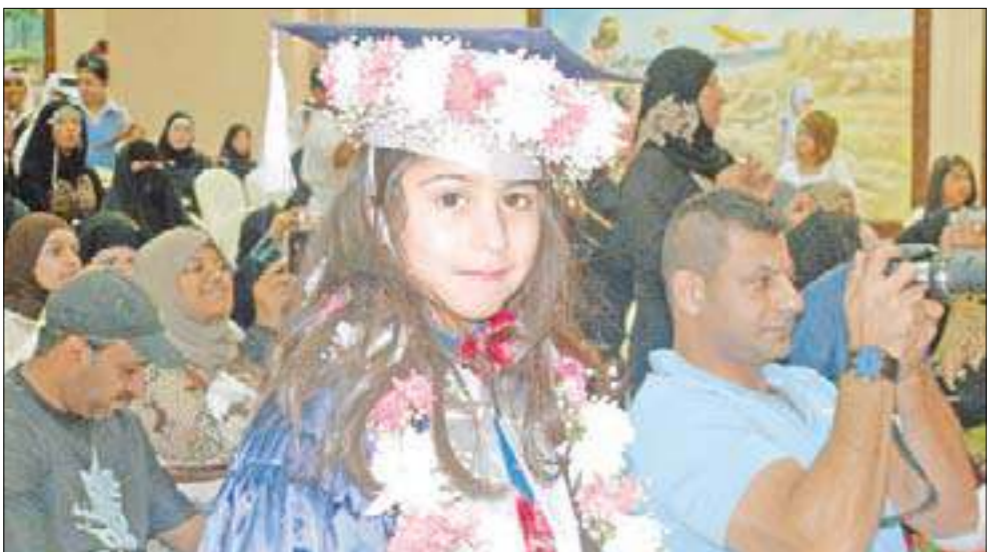
إحدى الخريجات متألقة بزهور التفوق