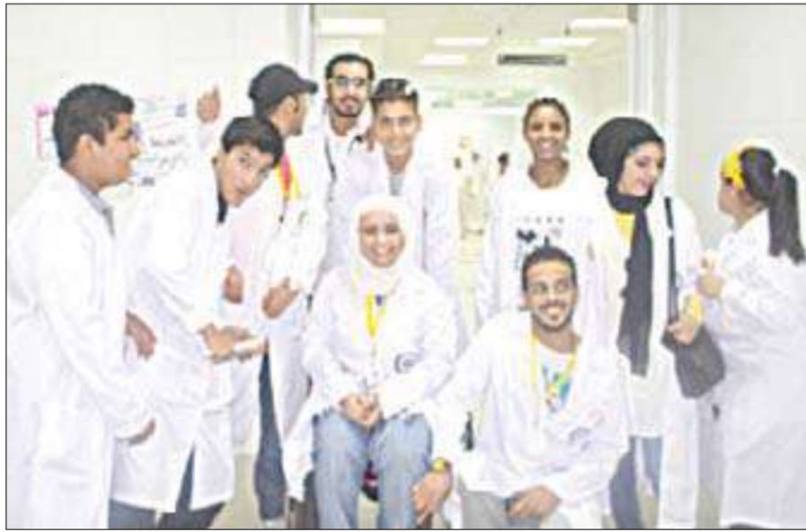
عدد من المتطوعين