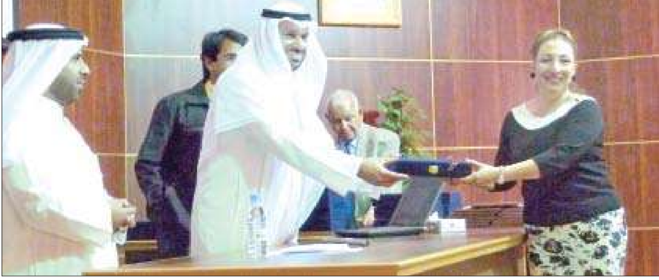
... وتكريم آخر