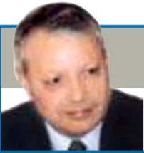
صالح القلب كاتب وسياسي أردني

كنت في طهران صحافياً أطارد الأحداث الكبرى أينما وقعت. في ذروة انتصار الثورة الخمينية في فبراير عام 1979. وقد رأيت مما رأيت ما جرى في ذلك اليوم الذي خصص لتدمير أضرار الشاه رضا بهلوي وسحلها في الشوارع، وكان كل هذا يجري وهتافات التكبير تلبغ عنان السماء: «الله أكبر... الله أكبر... والأين وبينما وصلت ظاهرة إباحة التماثيل إلى سورية، فإنه لمن الجدير بالذكر أن أحد كبار المسؤولين الأردنيين كان أهد تمثالاً «برونزيًا» للملك حسين، حاول مفاجاته بإقامته في الدوار الرابع بالقرب من رئاسة الوزراء في نكري ميلاده، وكان رحمه الله قد استشاط غضباً عندما أعلم بذلك، وأمر بإزالة التمثال على الفور، وهو يردد: «كيف لمن جده محطم الأصنام في مكة أن يقم صنماً لنفسه». وكاد يرسل ذلك المسؤول «المتعلق» إلى السجن لولا تدخل بعض المحسنين!