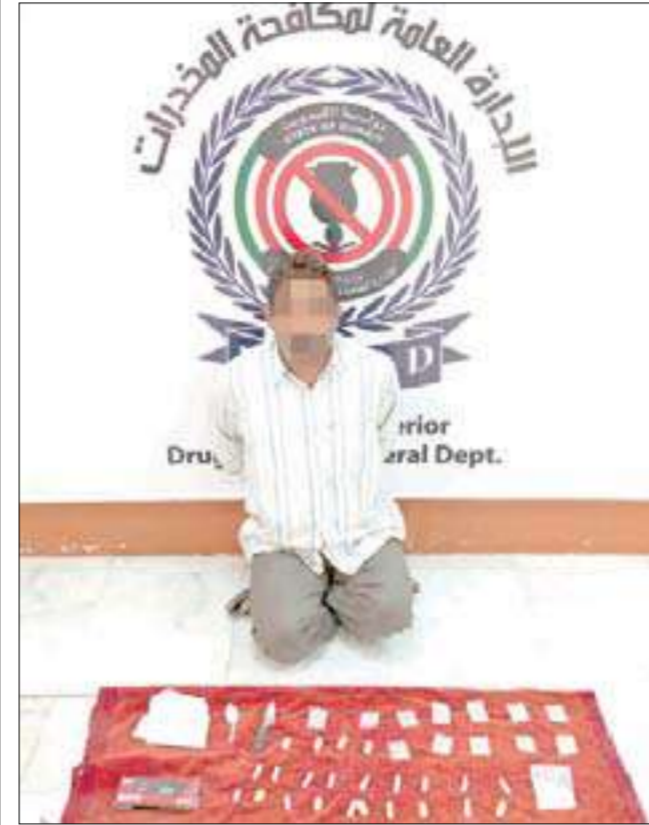
المتهم وامامه المضبوطات

واضاف المصدر أن رجال المكافحة، بعد مراقبة استمرت نحو اسبوع، تاكدوا من النشاط الاجرامي للمتهم في ترويج مادة الهيرويين المخدرة، وقرروا ارسال مصدر سري للاتفاق معه على شراء كمية من هذه المادة، الامر الذي وافق عليه المروج