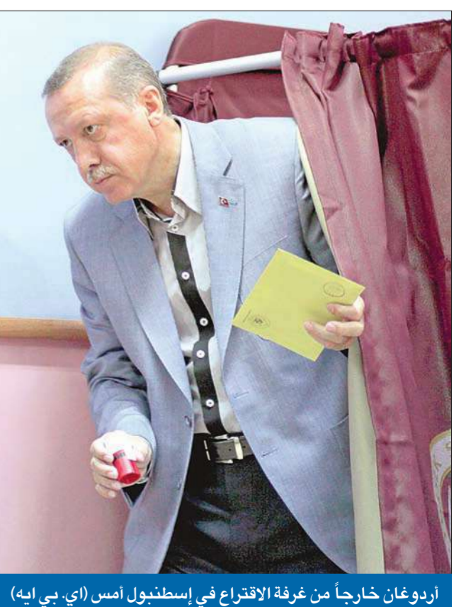
أردوغان خارجاً من غرفة الاقتراع في إسطنبول أمس (أي بي إيه)

ونمت دعوة أكثر من 50 مليون ناخب وناخبة ممن يحق لهم التصويت في عموم البلاد إلى الإدلاء بأصواتهم في 200 ألف صندوق اقتراع، لاختيار برلمان جديد من 550 مقعداً يتنافس عليها 7500 ألف مرشح. وشهدت الانتخابات بعض المواجهات في عدد من المراكز الانتخابية بين أنصار الحزب الحاكم والمعارضة. وكان الرئيس التركي عبدالله غول أدلى بصوته في منطقة تشانكايا التابعة لأنقرة ظهر أمس، ودعا في تصريح الأحزاب السياسية إلى «تهدد الخلافات والتوحد عقب انتهاء العملية الانتخابية»، كما دعا مواطنيه إلى الإقبال على التصويت. بدوره، أدلى رئيس الوزراء رجب طيب أردوغان من غرفة الاقتراع في إسطنبول أمس (أي بي إيه)