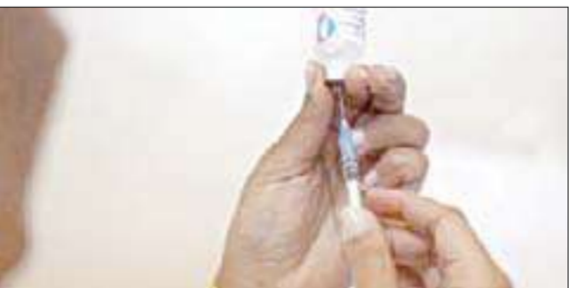
جرعة عقار مضاد لإنفلونزا الخنازير بمستشفى في كراكاس

اكتشفت سلالة جديدة من إنفلونزا الخنازير في آسيا، تتأقلم بشكل جيني يمكنها من مقاومة عقار تاميفلو الذي تنتجه شركة روش، وعقار ريلنزا الذي تنتجه جلاكسو سميت كلاين وهما العقاران الأساسيان المستخدمان في مكافحة المرض. وقال باحثون إن أكثر من 30 في المئة من عينات عدوى إنفلونزا الخنازير إتش إن 1 من شمال أستراليا، وأكثر من عشرة في المئة من عينات من سنغافورة جمعت خلال الأشهر الأولى من العام الحالي قللت بشكل طفيف الحساسية تجاه العقارين. ولم يظهر أي انخفاض كبير في الحساسية لعقار بيراميفير وهو عقار ضد الإنفلونزا في طور التجريب من إنتاج شركة بيوكرست.