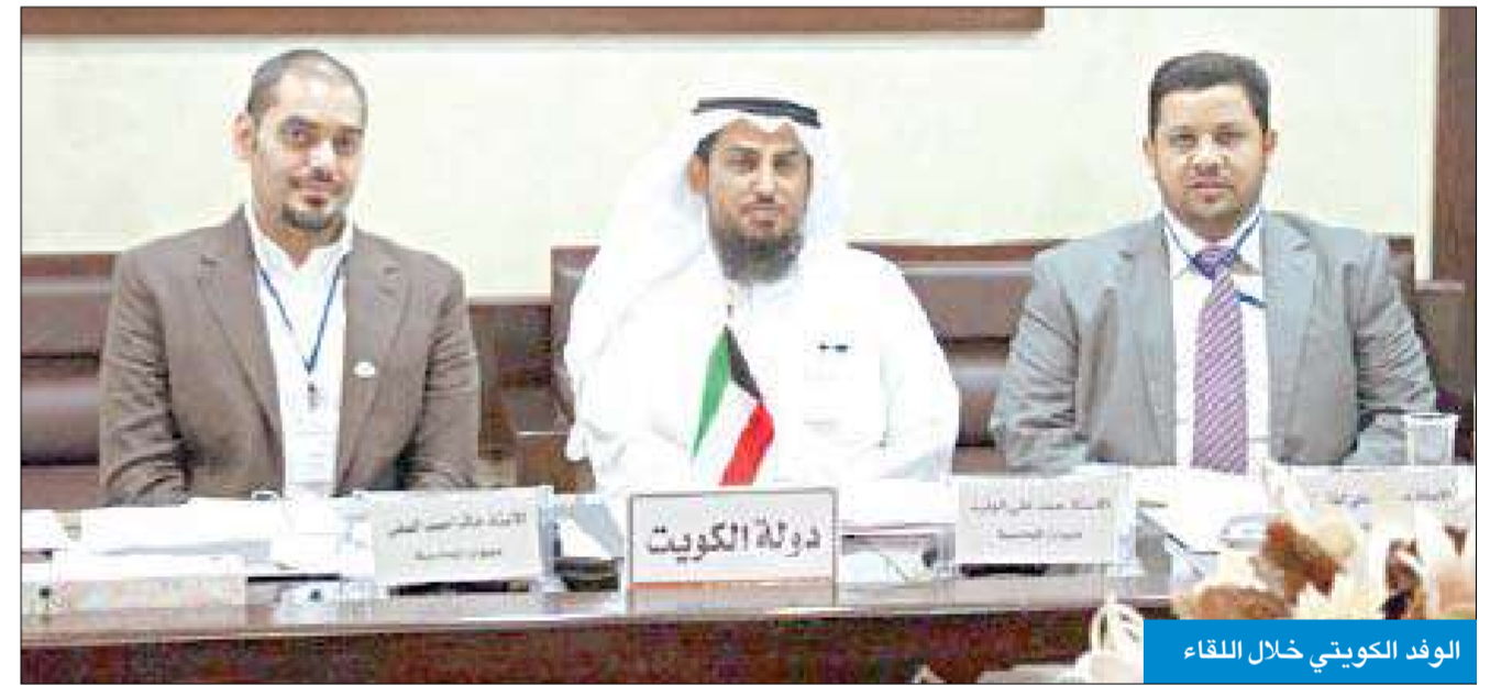
الوفد الكويتي خلال اللقاء

35 متخصصاً من 13 دولة عربية يتبادلون الخبرات الرقابية في مجال المعلومات