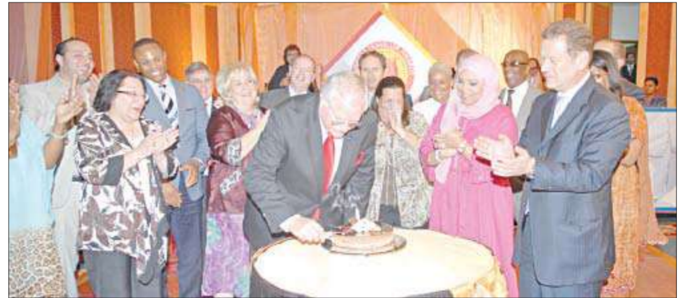
قطع كعكة الاحتفال