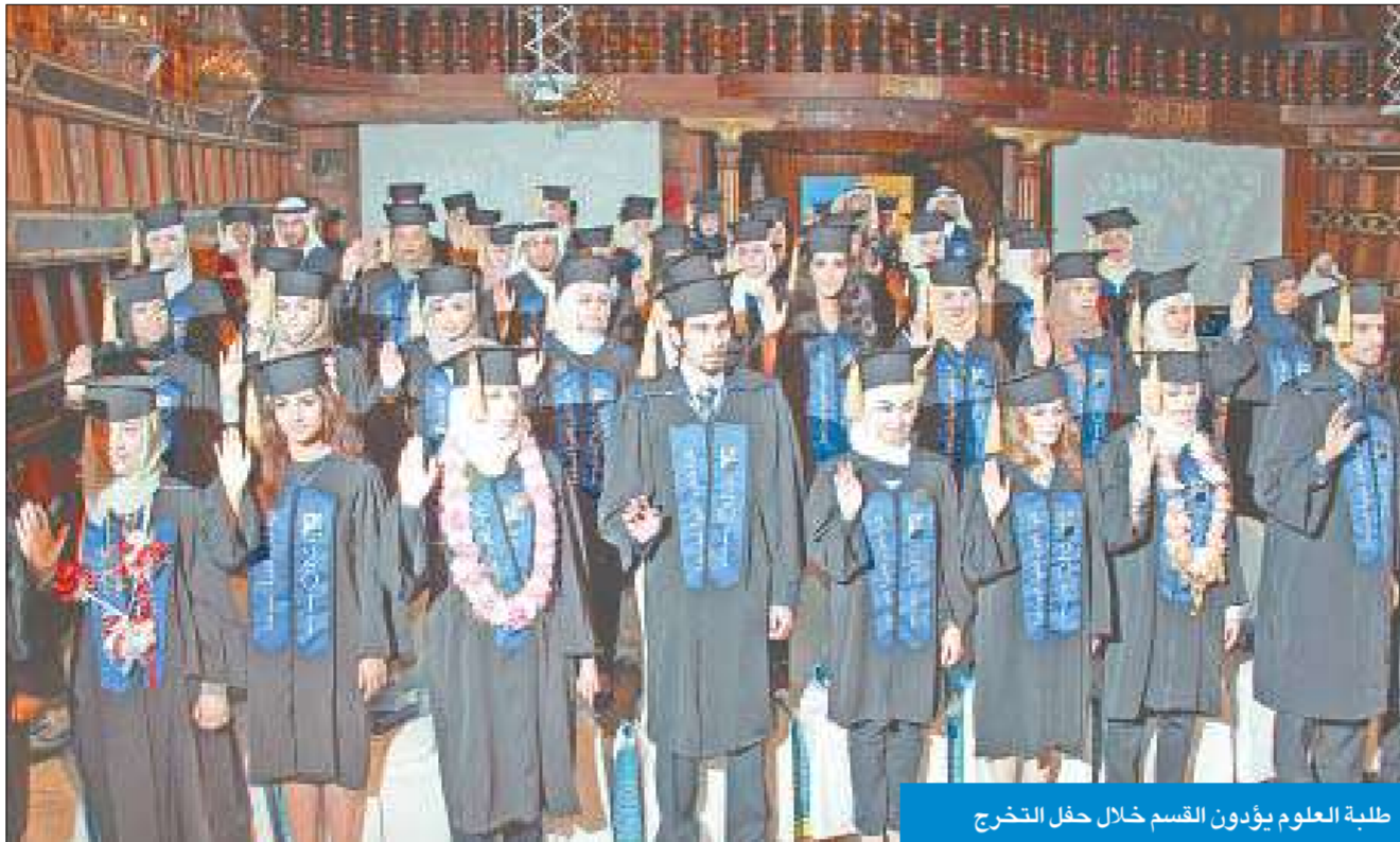
طلبة العلوم يؤدون القسم خلال حفل التخرج

تفوق الطلبة هو ثمرة جهود جامعة الكويت والكلية في تحصيلهم العلمي العبيدي