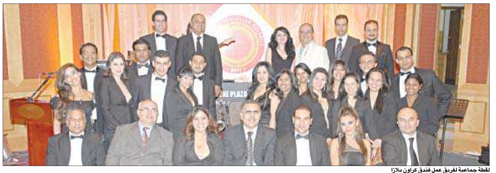
لقطة جماعية لغريق عمل فندق كراون بلازا