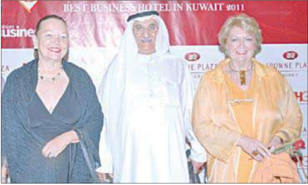
شخصيات اجتماعية ودبلوماسية