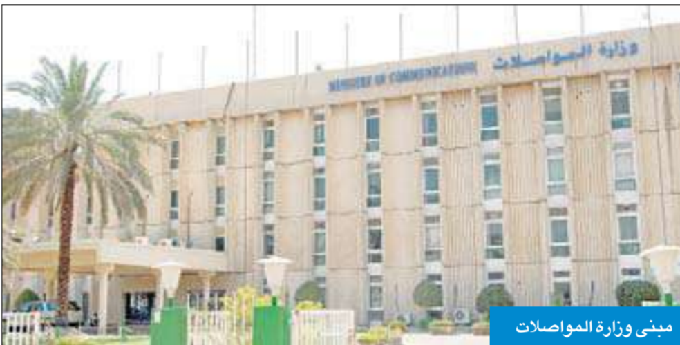
مبنى وزارة المواصلات

ولفتت إلى أن الشركات الرئيسية المزودة لخدمة الإنترنت في البلاد لجأت خلال العامين الماضيين إلى استخدام البرنامج الذكي "سياسة الاستخدام العادل" رغم أنه مكلف ماليا، لأنه يستطيع تحديد المستخدم السبي "القرصان" متى ما تجاوز أو استهلك ساعات كبيرة، خصوصا أن القرصنة يمثلون من 2 إلى 5 في المئة من إجمالي المشتركين، إذ يستهلك هؤلاء القرصنة من 40 إلى 50 في المئة