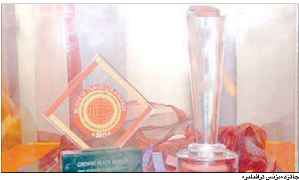
جائزة «بزنس ترافيلير»