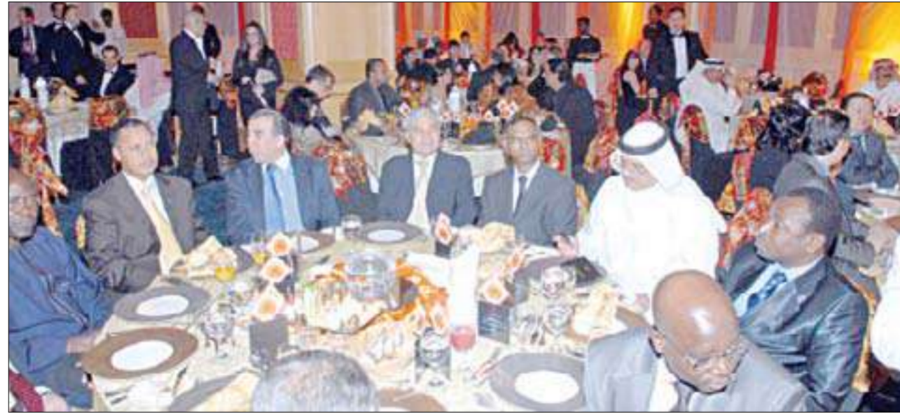
حضور دبلوماسي واجتماعي