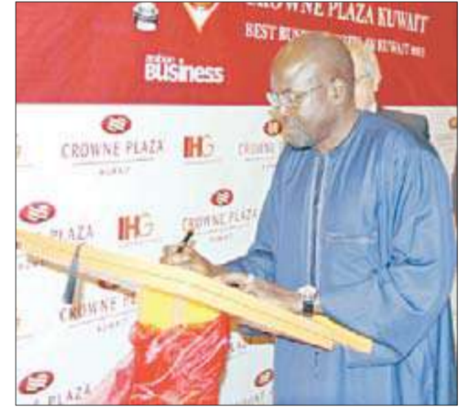
سفير السنغال عبدالأحد امباكي