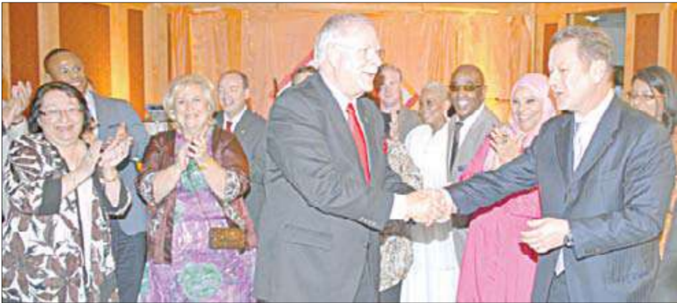
تبادل التهاني بمناسبة حصول الفندق على الجائزة