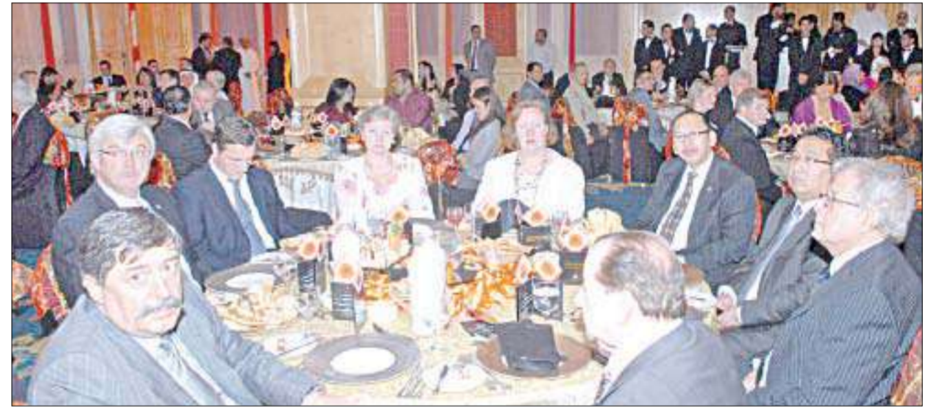
عدد من الحضور