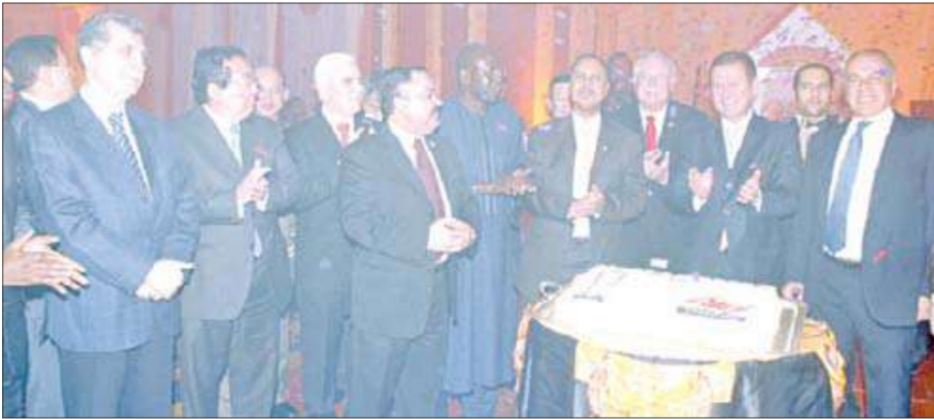
عدد من السفراء وإدارة كراون بلازا خلال احتفالهم بالمناسبة