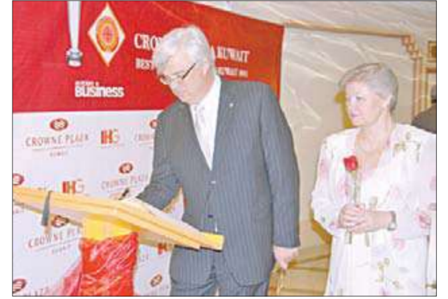
أحد الشركاء في النجاح