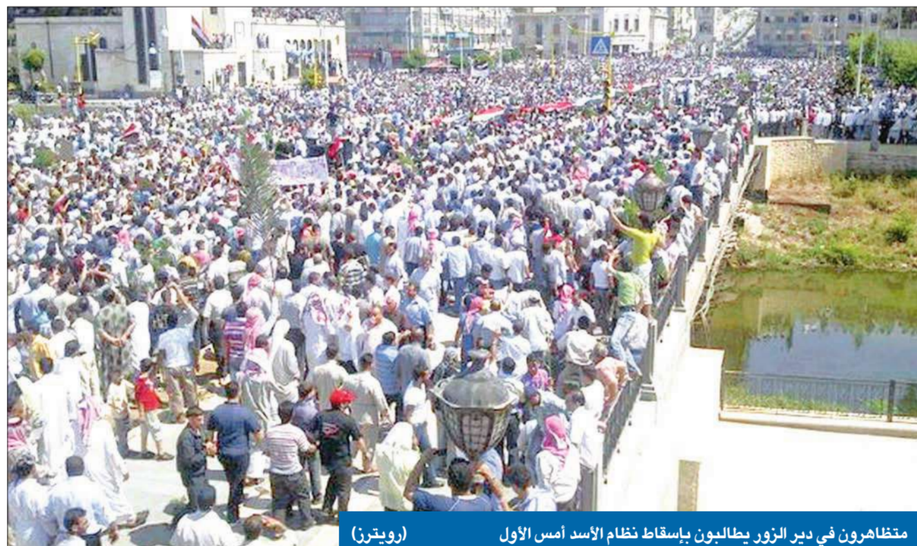
متظاهرون في دير الزور يطالبون بإسقاط نظام الأسد أمس الأول