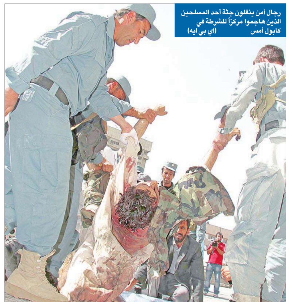
رجال أمن ينقلون جثة أحد المسلحين الذين هاجموا مركزاً للشرطة في كابول أمس

بينما تجهز قوات "حلف شمال الأطلسي" وعلى رأسها القوات الأمريكية للبدء في تسليم الملف الأمني للحكومة الأفغانية، حصل تجاوز أمني خطير في قلب العاصمة كابول أمس، إذ أعلنت وزارة الداخلية أن أربعة انتحاريين هاجموا مركزاً للشرطة في وسط المدينة قرب القصر الرئاسي ووزارة الدفاع، فجرت مواجهات مع الشرطة أدت إلى مقتلهم، بالإضافة إلى أربعة أشخاص من بينهم عنصر أمن. ونقلت وكالة أنباء "بختار" الأفغانية عن المتحدث باسم الداخلية الأفغانية صديق صديقي قوله إن المهاجمين الانتحاريين هاجموا مركزاً للشرطة في مبنى سابق لوزارة المال وسط كابول، مضيفاً أنهم "كانوا يرتدون بزات عسكرية".