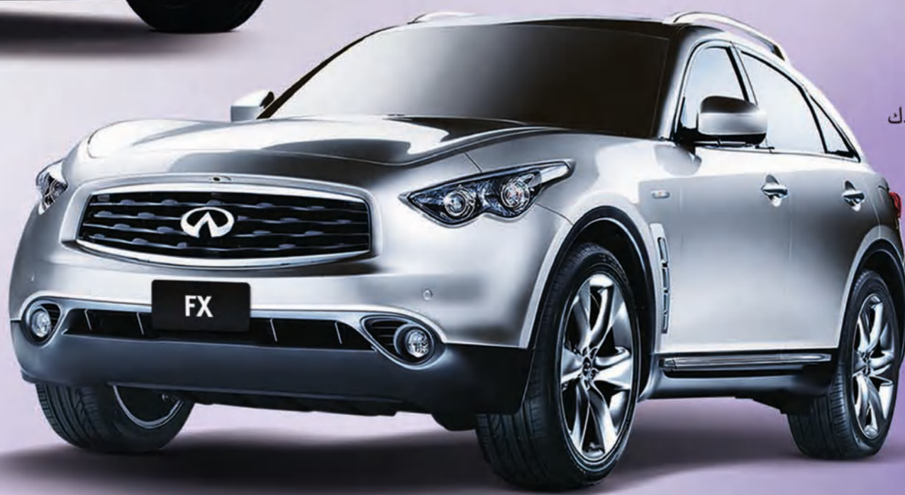
إنفينيتي FX ابتداءً من 14,990 د.ك.