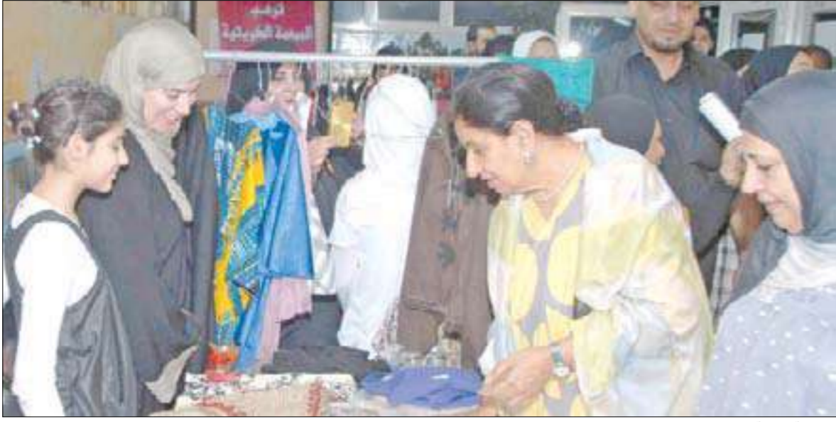
الشيخة العوضي خلال تقديمها المعرض الخيري