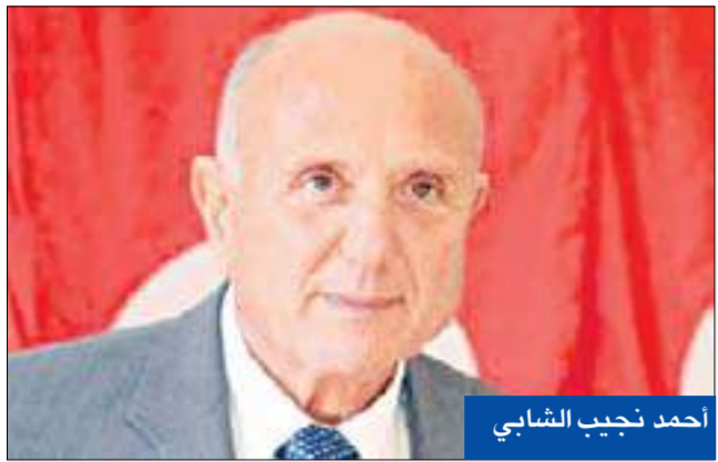
أحمد نجيب الشابي