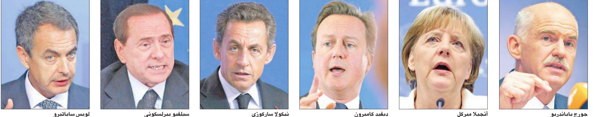
نيكولا ساركوزي، سيلفيو بيرلسكوني، فرانسوا هولاند، ديفيد كاميرون، أنجيلا ميركل، جورج باباندريو