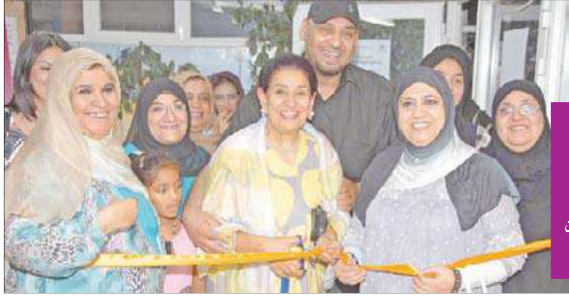
قص شريط الافتتاح

المناسبة المعرض الرمضاني الثاني للتذوق المجاني