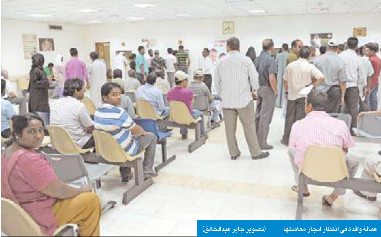
عمالة وافدة في انتظار انجاز معاملتها

انتشاره إلى حالة واحدة فقط لكل 100 ألف من السكان، كما تهدف الوحدة إلى اكتشاف كل الحالات المرضية بين القادمين للبلاد ومراقبة انتشار المرض عن طريق اكتشاف كل الحالات المرضية بين السكان. «الجريدة» تجولت داخل أروقة الوحدة واستطلعت آراء المسؤولين والمراجعين عن أداء الوحدة وإلى التفاصيل: