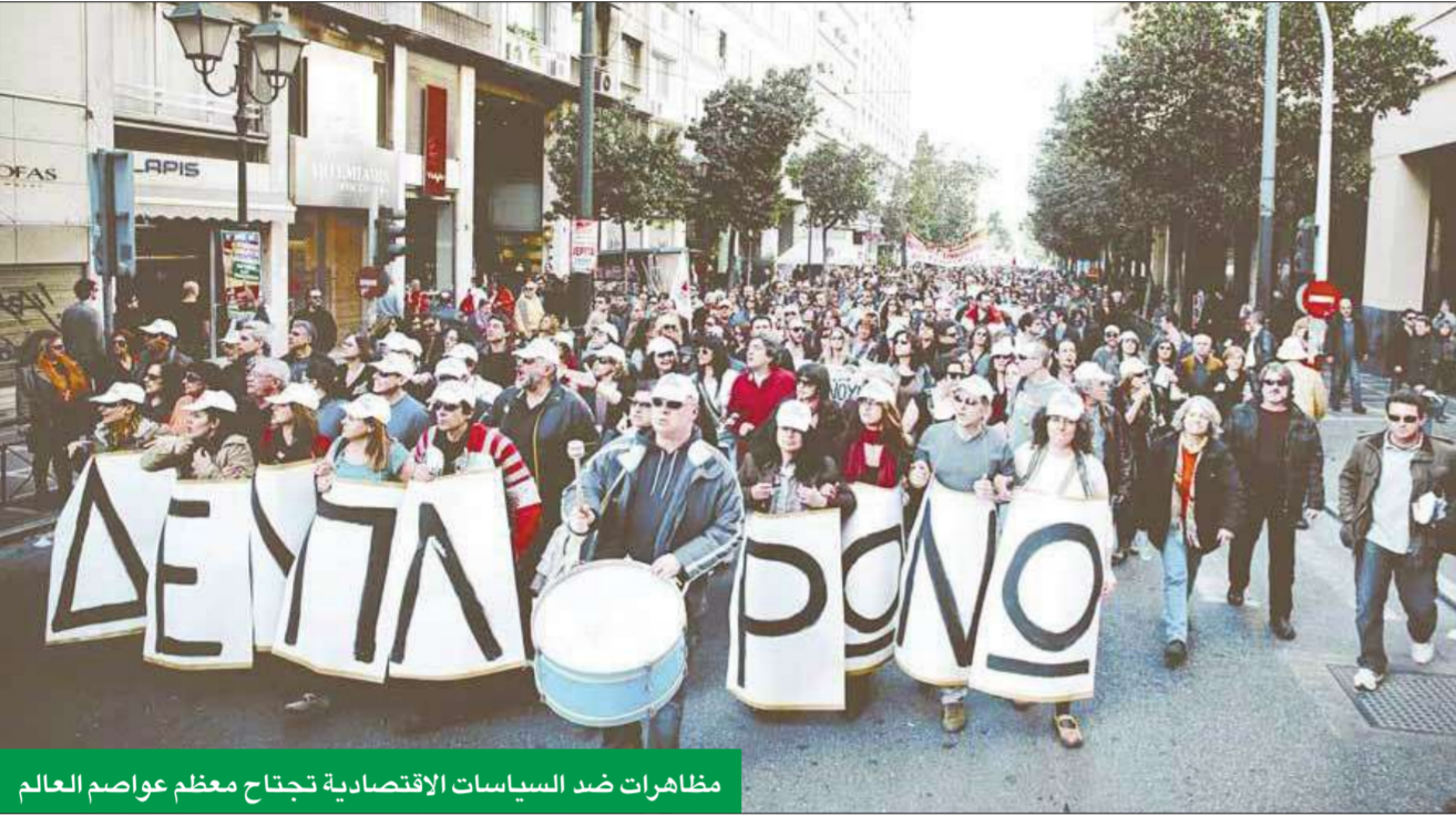
مظاهرات ضد السياسات الاقتصادية تجتاح معظم عواصم العالم

● تواجهه 4 مخاطر يندر توافرها في وقت واحد ● رسالة «تحذير» لدول النفط: أنتم ترتكبون خطايا أواسط السبعينيات نفسها