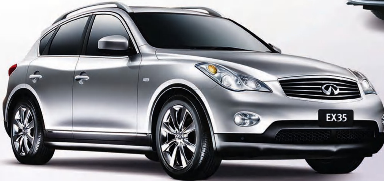
إنفينيتي EX الآن بـ 12,990 د.ك.