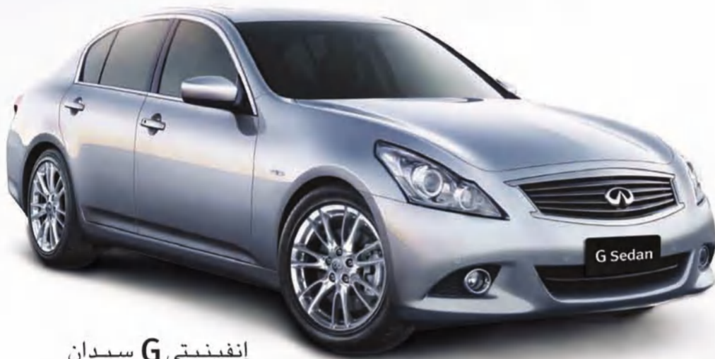
إنفينيتي G سيدان الآن بـ 12,290 د.ك.