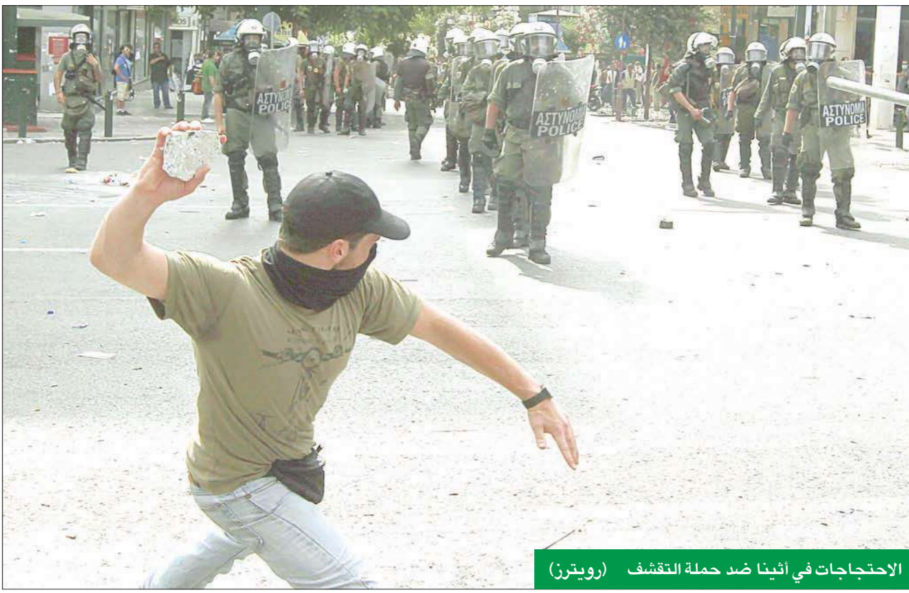
الاحتجاجات في أثينا ضد حملة التقشف

إلى اليونان، فإن دعم الخطة الجديدة سيمكننا من تزويد أثينا بتمويل جديد".