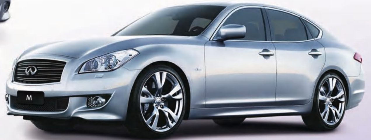
إنفينيتي M ابتداءً من 13,290 د.ك.