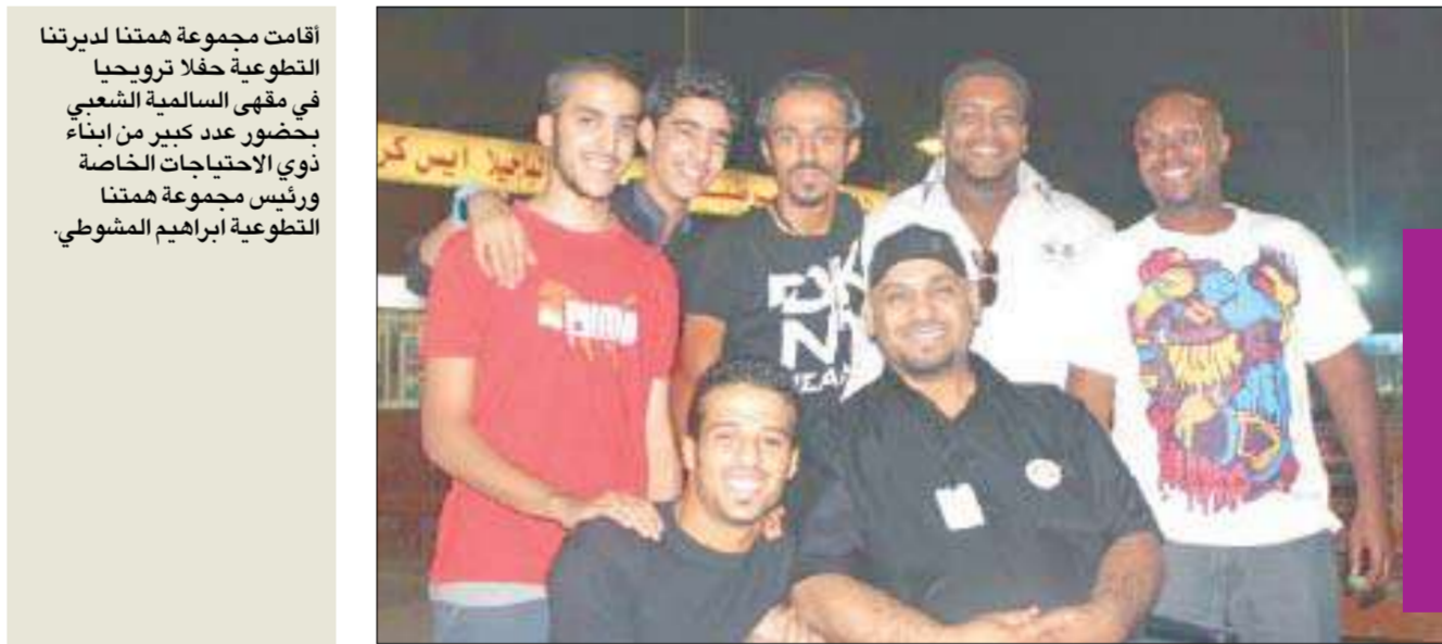
مجموعة همتنا لديرتنا التطوعية