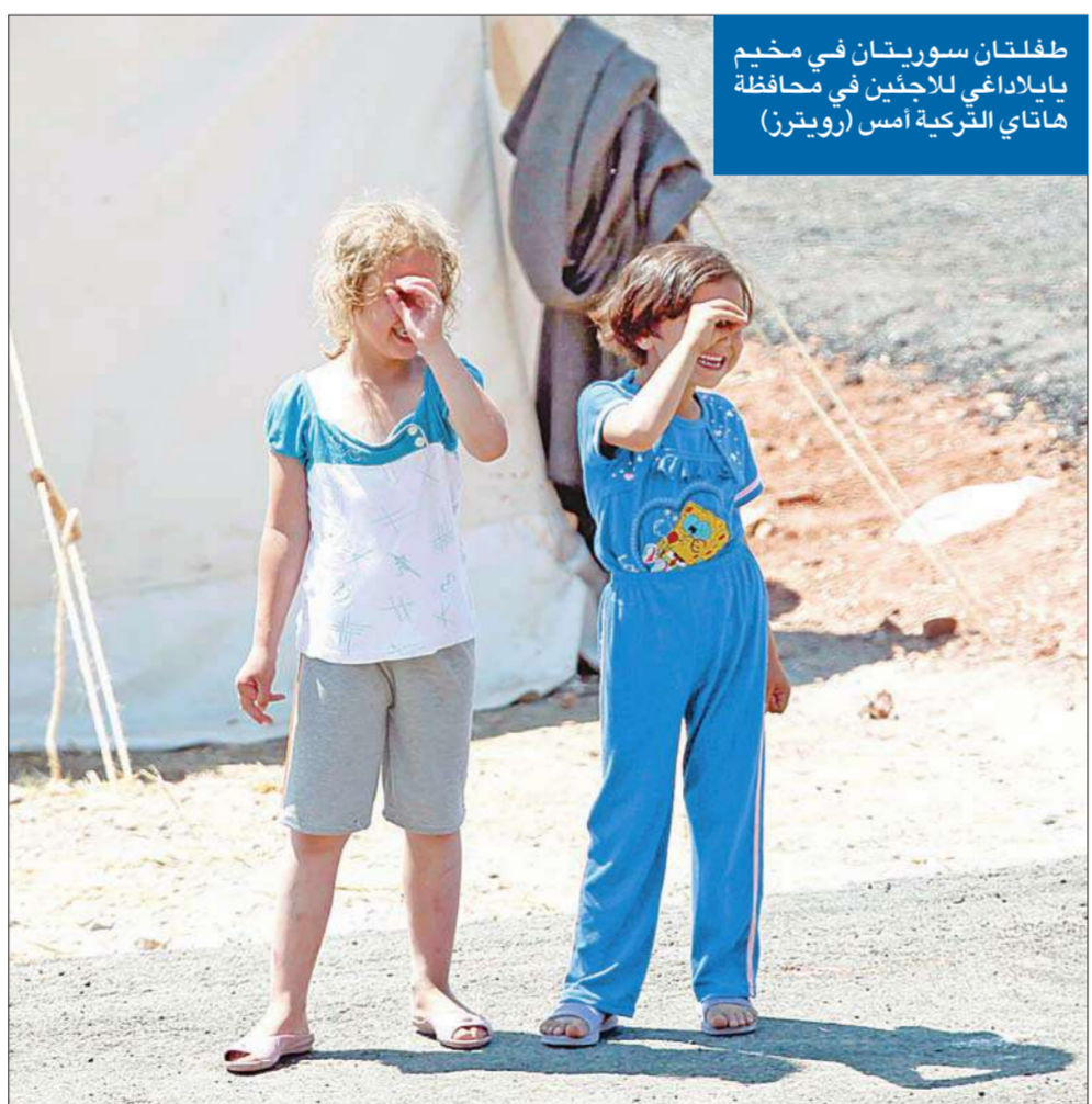
طفلتان سوريّتان في مخيم يابلا داعي للاجئين في محافظة هاتاي التركية أمس

وفد معارض إلى موسكو غداً... ولقاء تشاوري «وسطي» في دمشق