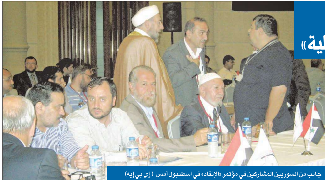
جانب من السوريين المشاركين في مؤتمر «الإنقاذ» في إسطنبول أمس

على وقع هدبر دبابات الجيش السوري التي اقتحمت بلدة كفرنبيل الواقعة في محافظة حمص وقصفت منازلها واعتقلت أهليها، انطلق «مؤتمر الإنقاذ الوطني السوري» في مدينة إسطنبول التركية أمس، بمشاركة شخصيات سورية سياسية، وحقوقيين معارضين، فضلاً عن مشاركة معارضين سوريين من الداخل عن طريق الإنترنت والهاتف، بعد أن ضيّقت عليهم السلطات السورية، ومنعتهم من عقد اجتماع بالتوازي في حي القابون الدمشقي.