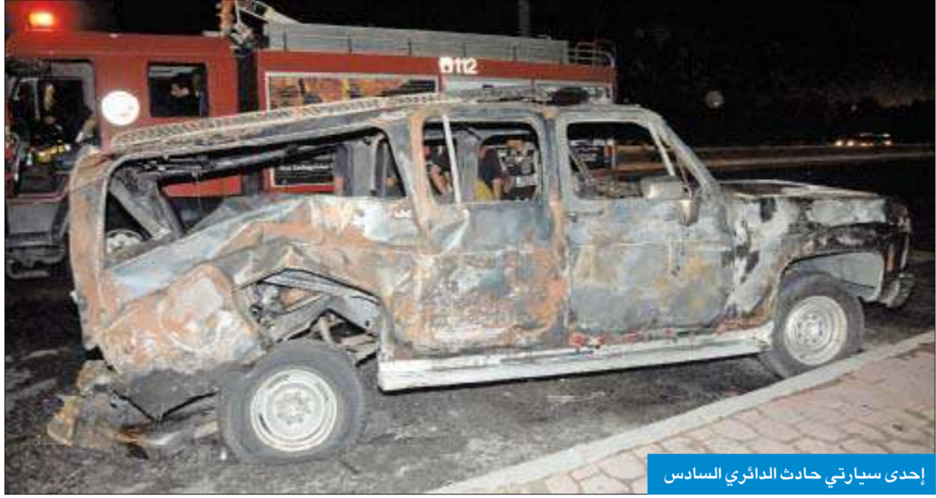
إحدى سيارتي حادث الدائري السادس

وأشار إلى ان رجال الاطفاء كافحوا النيران واكتشفوا وجود جثتين داخل المركبة الأخرى متفحمتين جراء النيران، مشيراً إلى ان رجال الاطفاء انتشلوا الجثتين وسلموهما إلى رجال الادلة الجنائية، حيث تمت احالتهما