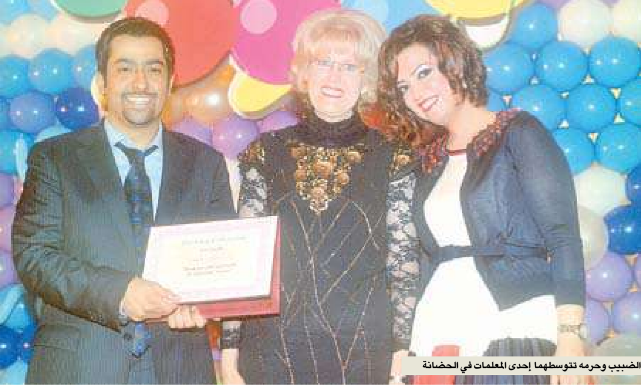
السبيبي وحرمة تتوسطهما إحدى المعلمات في الحضانة

الميلاد وحفلات التخريج والمناسبات الخاصة، تقدم فيه خدمات ترفيهية، ومعدات وأدوات متطورة وذات جودة عالية استوردناها من أميركا، والذي بدوره يعد امتداداً لحضانة «لتل لاند».