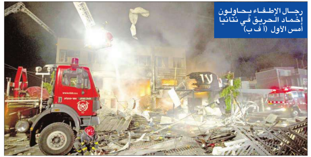
رجال الإطفاء يحاولون إخماد الحريق في تانانيا أمس الأول (أ ف ب)

● انفجار شمال تل أبيب يخلف 14 مصاباً ● إطلاق صلاح في لندن بكفالة