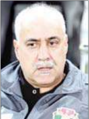
البرتغالي نيلو فينغادا

المصرية السعودية، ومنتخب مصر الأولمبي (2004-2005)، إلى جانب إشرافه على الوداد البيضاوي المغربي (2007)، ومنتخبني السعودية (1996-1997) والأردن (2007-2009).