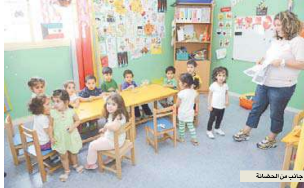
جانب من الحضانة