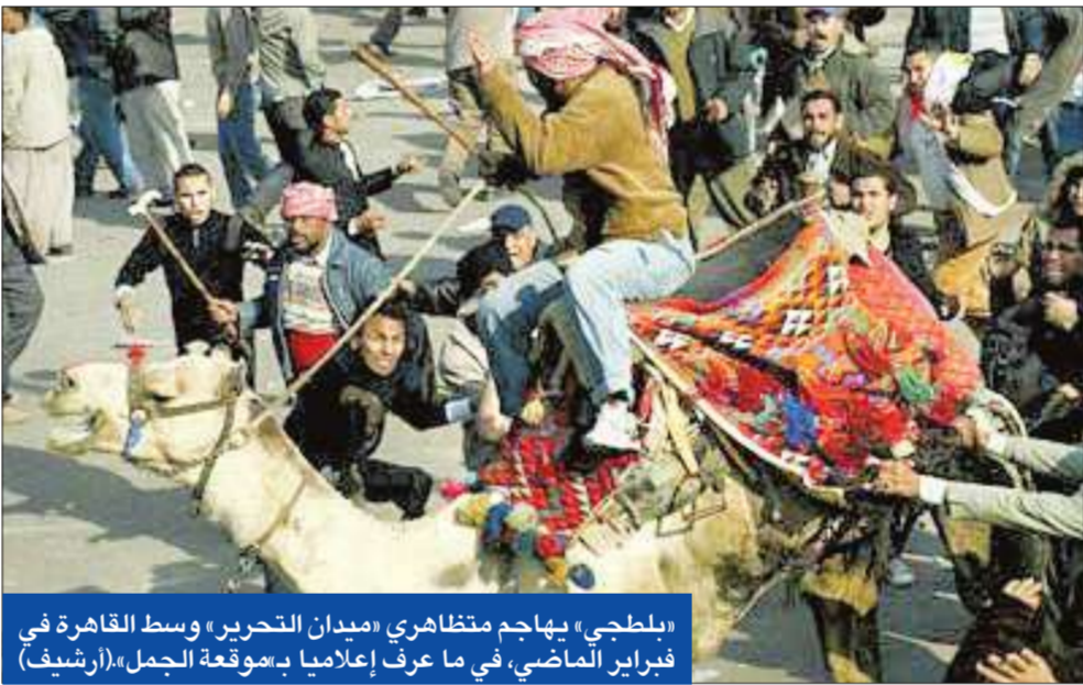
«بلطجي» يهاجم متظاهري «ميدان التحرير» وسط القاهرة في فبراير الماضي، في ما عرف إعلامياً بـ«هوقعة الجمل»