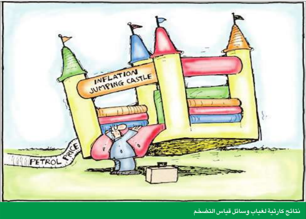
نتائج كارثية لغياب وسائل قياس التضخم

إن البلد يشكو، ويتخطى، من كثرة الجدل وقلة العمل أو الفعل، وهذا صحيح، والسبب هو أنه، في غياب وسائل القياس الموثوقة، يبقى من حق أي كان أن يختار ما يشاء من مشكلات وينسبها إلى ما يشاء من مبررات، وعلى كل من يعارضه إثبات العكس، بينما في الدول المتقدمة، العكس هو الصحيح، فالسياسات الاستباقية متغير تابع للإرقام والمؤشرات، والجدل هو حول الآليات، وليس حول الحقائق والنتائج.