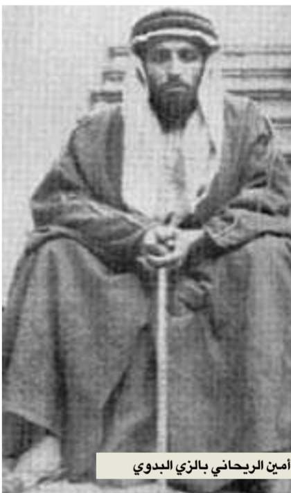
أمين الريحاني بالزي البدوي