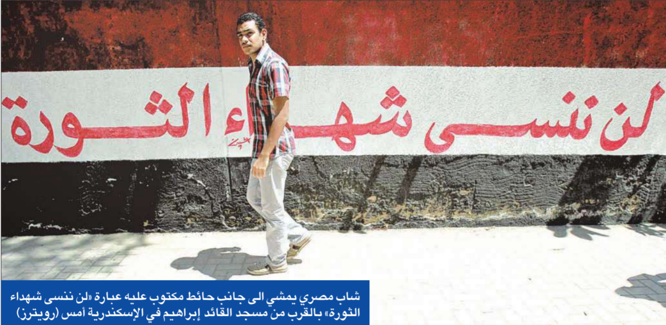
شاب مصري يمشي الى جانب حائط مكتوب عليه عبارة «لكن ننسى شهداء الثورة» بالقرب من مسجد القائد إبراهيم في الإسكندرية أمس

عضو بحركة 6 أبريل، إن الحركة لن تترك الميدان لحين تحقيق مطالب الثورة، مبيناً أن مجمع التحرير (أكبر المباني الإدارية في مصر) مفتوح ويمارس العاملون فيه عملهم بشكل طبيعي، وأن الحركة ستستخذ إجراء تصعيدياً بإغلاق المجمع لنهاية الأسبوع في حالة عدم تحقيق المطالب.