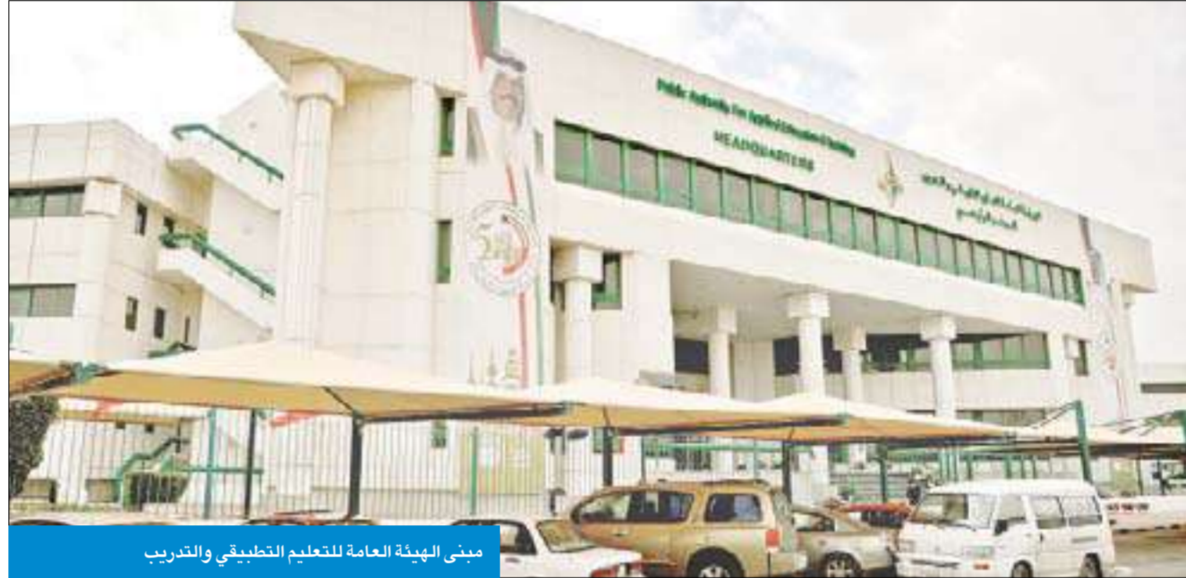
مبنى الهيئة العامة للتعليم التطبيقي والتدريب