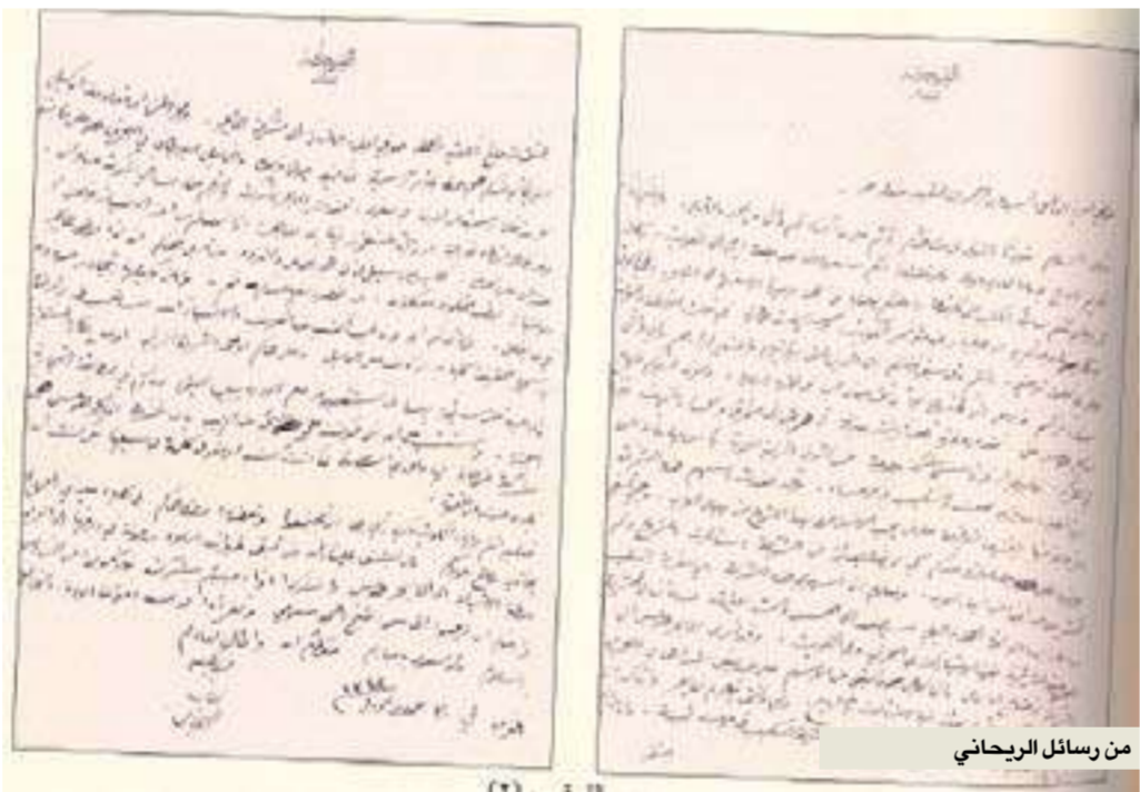
من رسائل الريحاني

كذلك يبسط المعدّ الضوء على أبرز المناسبات التي شهدها أمين الريحاني في الكويت، لا سيما الاحتفال بمرور عشرة أعوام على تأسيس المدرسة المباركية، وكان احتفالاً كبيراً حضره سمو الأمير الراحل الشيخ أحمد الجابر الصباح، وقد ألقى فيه كلمات من الإساتذة والطلبة رُحّب فيها المحفلون بأمين الريحاني، وأشاروا إلى تكبده غناء السفر للتلفّل بين بلدان الأمة العربية.