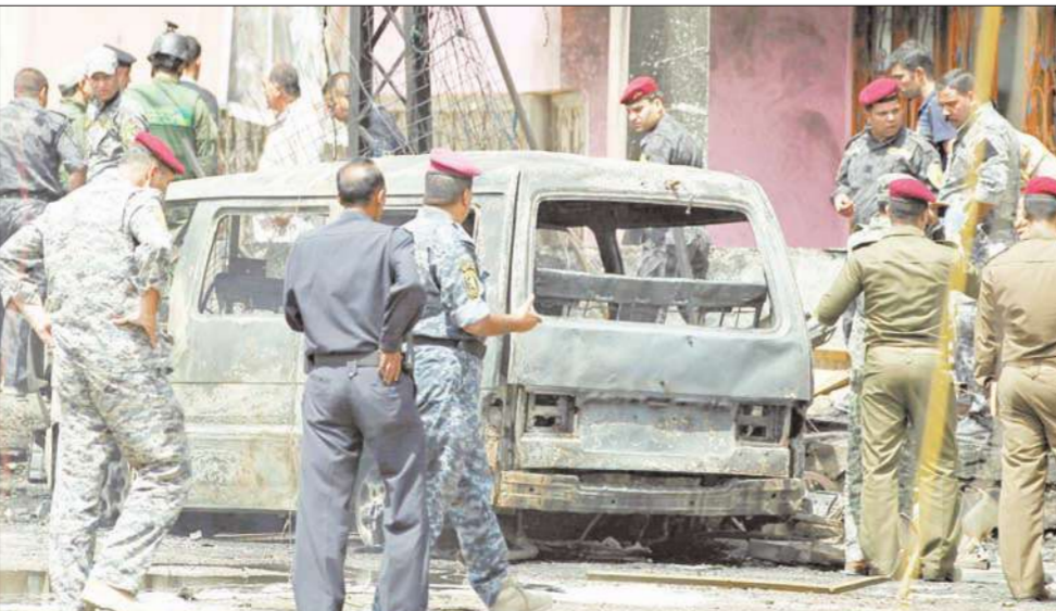
أدى انفجار سيارة ملغومة استهدف ملهى ليلياً وسط بغداد مساء أمس الأول، إلى مقتل شخصين وإصابة تسعة آخرين بجروح. وفي الصورة، مجموعة من الجنود يتفقدون مكان التفجير

المالكي يشدد على ضرورة سلامة الأراضي العراقية من «التجاوز»