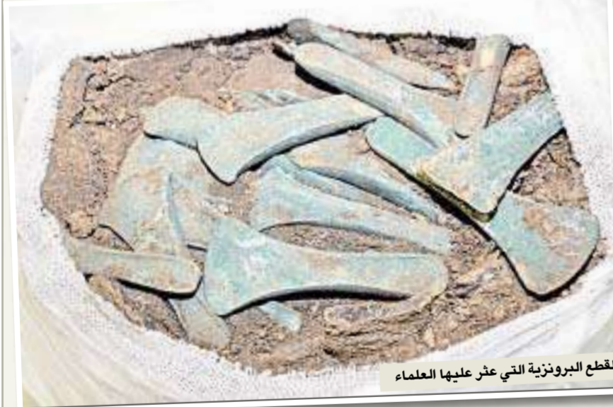
القطع البرونزية التي عثر عليها العلماء

طوال سنوات، تساءل الباحثون عن مصدر سلطة هذا