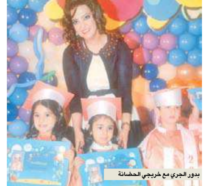
بدور الجري مع خريجي الحضانة