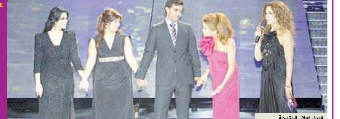
قبيل إعلان النتيجة