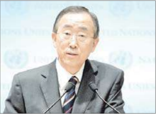
بان كي مون

الف عراقى نزحوا من العراق أو لجأوا إلى دول مجاورة، مؤكدا أنهم يشكلون «أكبر عدد من السكان النازحين في العالم». وأوضح أن معدلات التسجيل في المدارس تضاعف في مراحل التعليم الابتدائي والمتوسط، بينما بلغ معدل الأميين بين صفوف الفقراء 29 في المئة ممن تبلغ أعمارهم عشر سنوات فما فوق. ومن المقرر أن يبحث مجلس الأمن الدولي تقرير بان كي مون ربع السنوي بشأن عمل بعثة «يونامي» بعد غد.