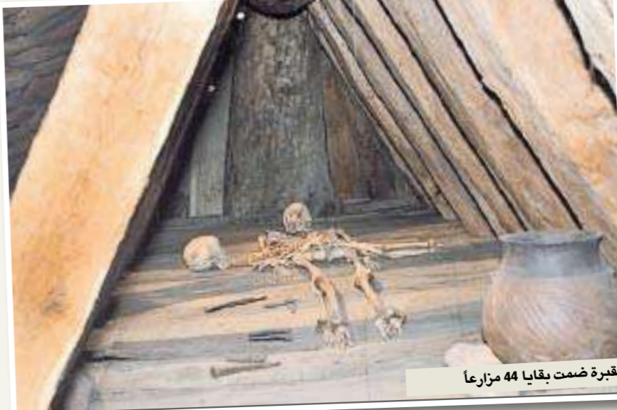
مقبرة ضمت بقايا 44 مزارعاً

بعدما نُبشت أكواخ موقع ليوبنغن المتواضعة المحيطة بقصور، شكّلت هذه الحياة البسيطة، التي جاورت البذخ