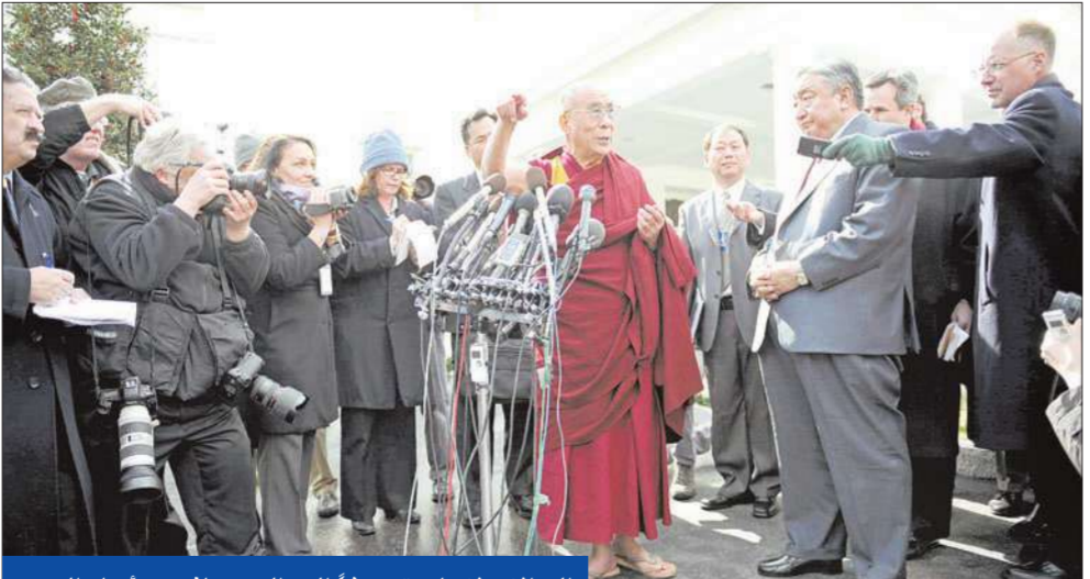
الدالاي لاما يتحدث إلى الصحفيين أمام البيت الأبيض بعد لقائه أوباما في 18 فبراير 2010

وفية للالتزامها في الاعتراف بأن التيببت جزء من الصين، مطالبا بعدم تدخل «واشنطن في الشؤون الداخلية للصين» وأن لا تبادل بالدالاي لاما بأي شكل من الأشكال.