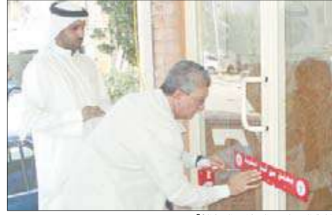
إغلاق المحلات والمخازن المخالفة

تواصل فرق التفتيش في بلدية الكويت النبل من كل من تسول له نفسه المتاجرة بأرواح المواطنين والمقيمين، إذ ضبطت أمس كمية كبيرة من المخلل الفاسد.