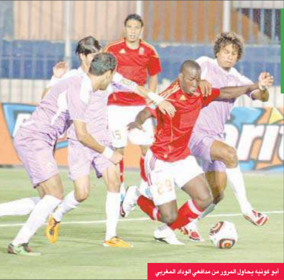
ابو كونيّه يحاول المرور من مدافعي الوداد المغربي

واكد المدرب البحريني نبيل طه، في تصريح له«الجريدة»، أن الفترة التدريبية التي سيخوضها شباب الأزرق خلال المعسكر السلوفيني، والمباريات القوية في