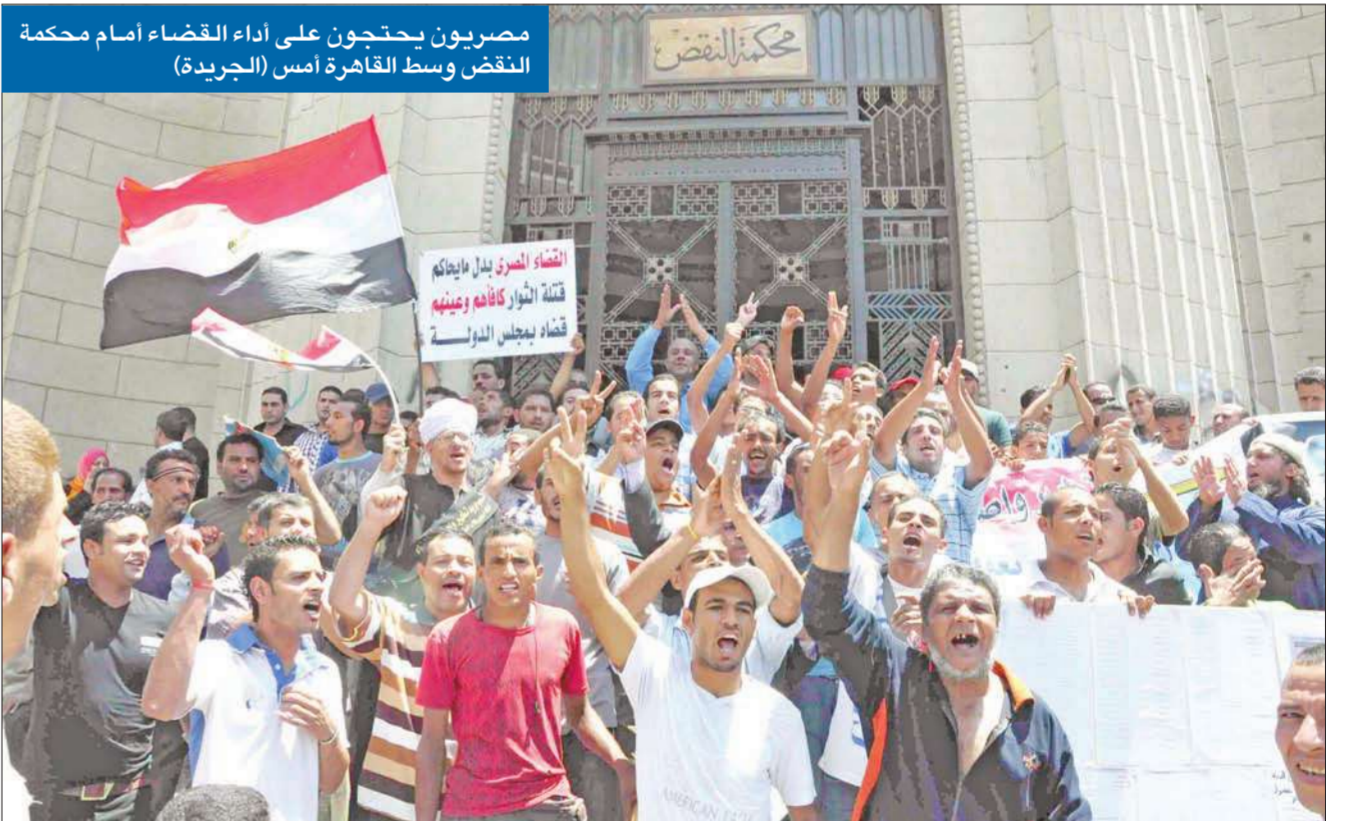
مصريون يحتجون على أداء القضاء أمام محكمة النقض وسط القاهرة أمس

مؤيدون للمجلس العسكري يستعدون لتنظيم مليونية في «ميدان التحرير»