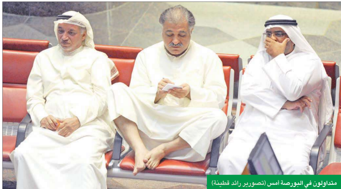
متداولون في البورصة أمس

سهم «الوطني» تصدر النشاط... تلاه «الدولي» ف «أبيار»