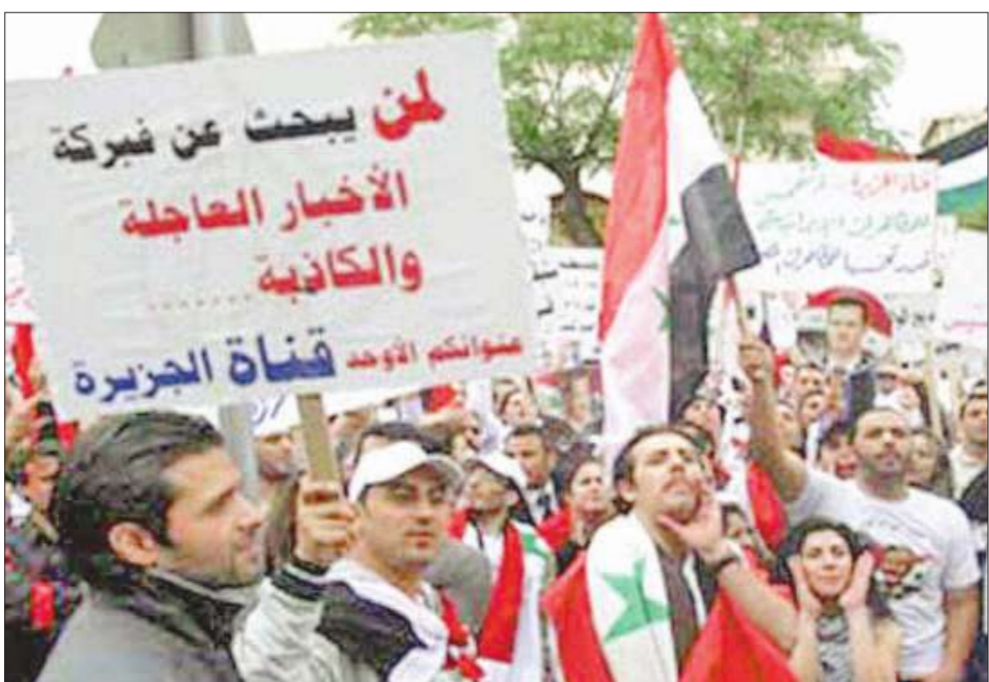
مولون للأسد يرفعون لافتة ضد قناة «الجزيرة» خلال تظاهرة أمام السفارة القطرية في دمشق الأسبوع الماضي (أرشيف)

غادر سفير قطر في دمشق زايد الخبارين وجميع الدبلوماسيين القطريين سورية، وقامت السفارة بـ«تجميد أعمالها إلى موعد لم يحدد»، على ما أعلن أمس مسؤول في البعثة الدبلوماسية القطرية في دمشق لم يذكر اسمه، ولم يشير إلى تاريخ رحيل السفير ولا أسبابه. وكان دبلوماسيون مقيمون في دمشق أفادوا بأن الخطوة القطرية جاءت بعد هجمات على مجمع السفارة، شنّها مؤيدون للرئيس السوري بشار الأسد، احتجاجاً على طريقة تعاطي فضائية «الجزيرة» القطرية مع