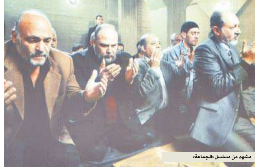
مشهد من مسلسل «الجماعة»

في القرآن الكريم آية تقول: «ولا تكتموا الشهادة»، أي إذا عرفنا أمراً أو اكتشفنا حقيقة يجب أن نجهر بها، بالإضافة إلى أن من يخاطب الناس، سواء كان ممثلاً أو مذنباً أو شاعراً... يجب أن يكون قذوفاً، إذ لا يمكن أن أتكلّم عن الشهادة وسلوكي بعيد عنها. لا بد من أن يتبنى الكاتب الفكرة التي يدعو