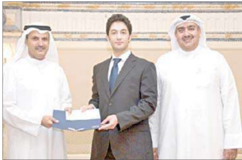
متفوق يتسلم تكريمه من الصقر والعبداني