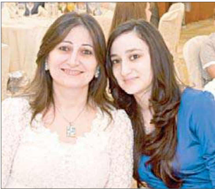
متفوقة مع والدتها

المناسبة «الوطني» يكرم المتفوقين من أبناء موظفيه