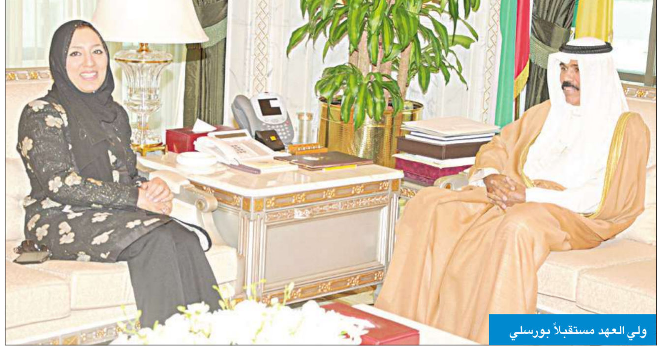
ولي العهد مستقبلاً بورسلي

بورسلي. واستقبل سموه الشيخ احمد عبداللله الصباح.