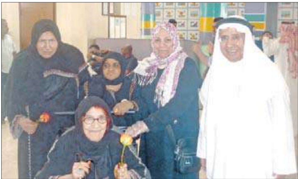
البغلي وعدد من الأمهات المسنات