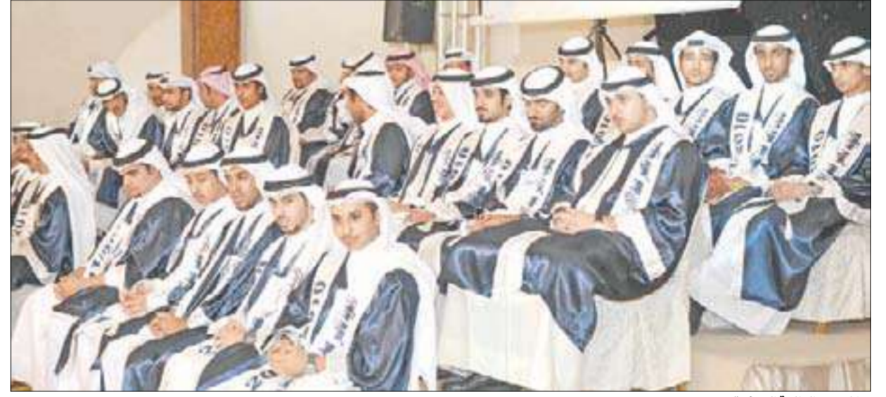
جانب من الطلبة المتفوقين