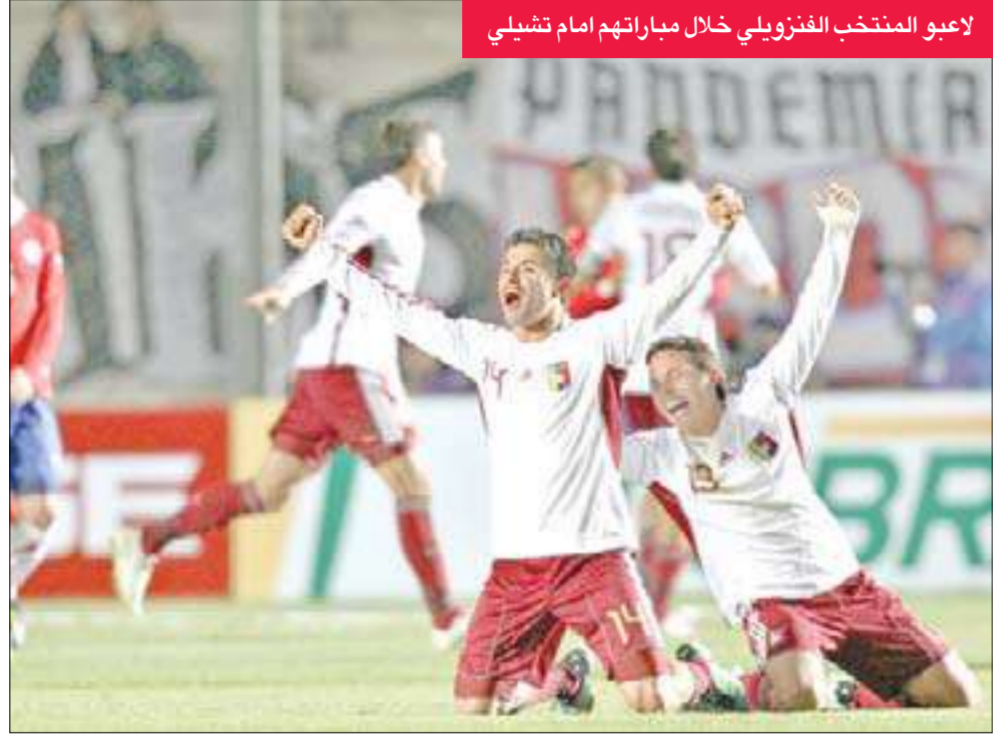
لاعبو المنتخب الفنزويلي خلال مباراتهم امام تشيلي