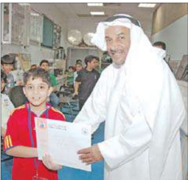
مشارك يتسلم شهادة التقدير