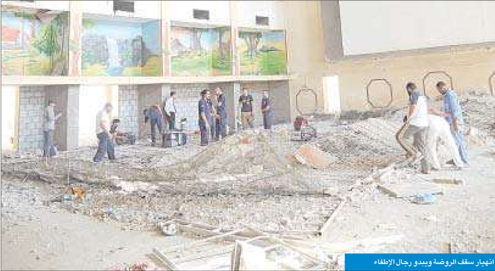
انهيار سقف الروضة ويبدو رجال الإطفاء