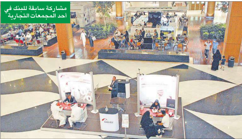
مشاركة سابقة للبنك في أحد المجمعات التجارية

واكد استمرار التوجس من السياحة في تلك الدول العربية، إضافة إلى أنه في حال حدوث أي ظرف بإحدى الدول فإن دول العرب تبت لرعاياها تحذيرات من السفر إلى هذه الدولة، الأمر الذي من شأنه أن يؤثر أيضاً على قطاع السياحة العربي، لافتاً إلى أن المنظمة تسعى إلى الحد من حجم الخسائر. ودفع عدم استقرار الأوضاع السياسية في بعض الدول العربية بالمنظمة العربية للسياحة إلى تنمية أسواق سياحية أخرى لدعم قطاع السياحة في هذه الدول، إذ عقد أمس اجتماع مع وفد تركي زار السعودية، برئاسة الوزير الدكتور شهاب الدين خربوط والي مدينة بورصة التركية والمكلف بمتابعة التعاون العربي التركي في مجال السياحة. وبيّن الدكتور بندر ال فهيد أن تركيا تسعى دائماً للتعاون العربي ودعم الدول العربية في كل المجالات،