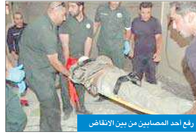
رفع أحد المصابين من بين الأنقاض

أصيب ثلاثة عمال أسبويين ورجلا إطفاء إصابات خطيرة من جراء انهيار سقف روضة عبد الملك الصالح عليهم، أثناء إجراء عمليات ترميم وصيانة لمسرحها مساء أمس. وقال مدير إدارة العلاقات العامة والإعلام في الإدارة العامة للإطفاء المقدم خليل الأمير، في تصريح صحفي، إن غرفة عمليات الإدارة تلقت بلاغا مساء أمس أفاد بانهايار سقف المسرح على عدد من العمال أثناء إجراء عمليات الترميم والصيانة للروضة.