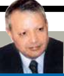
صالح القلب كاتب وسياسي أردني