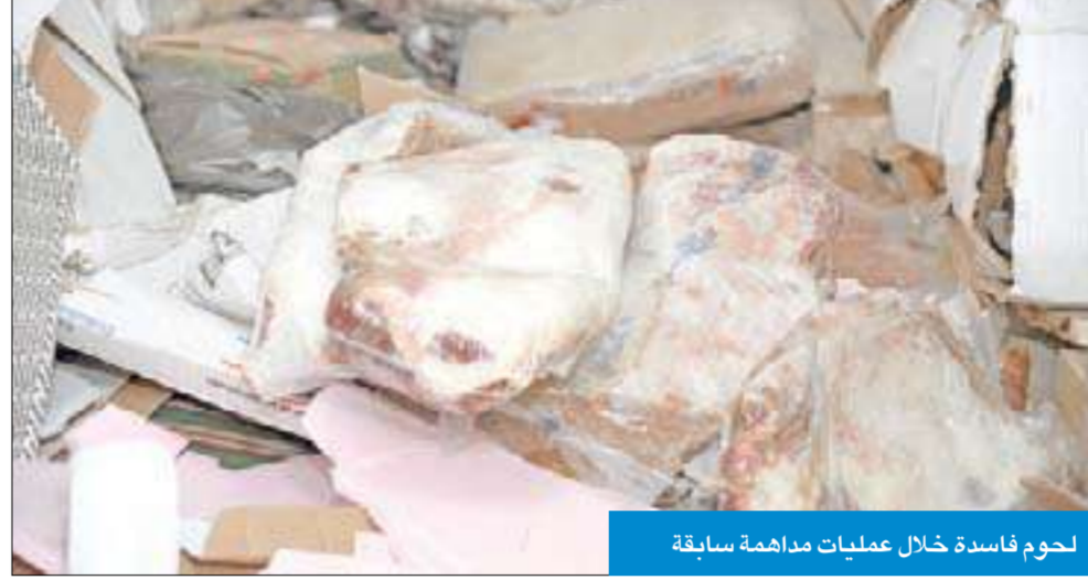
لحوم فاسدة خلال عمليات مدهامة سابقة

شدد وزير الأشغال العامة وزير الدولة لشؤون البلدية د. فاضل صفر على ضرورة تنظيف البلاد من المواد الغذائية الفاسدة ومنتهية الصلاحية، مشيداً في الوقت نفسه بالتعاون القائم مع مختلف إدارات بلدية الكويت كالإغذية المستوردة، من أجل إزالة المخالفات الذي اثمرت عن ضبطيات متواصلة والمضي في عملية التخلص من أي سموم تهدد الأمن الغذائي.