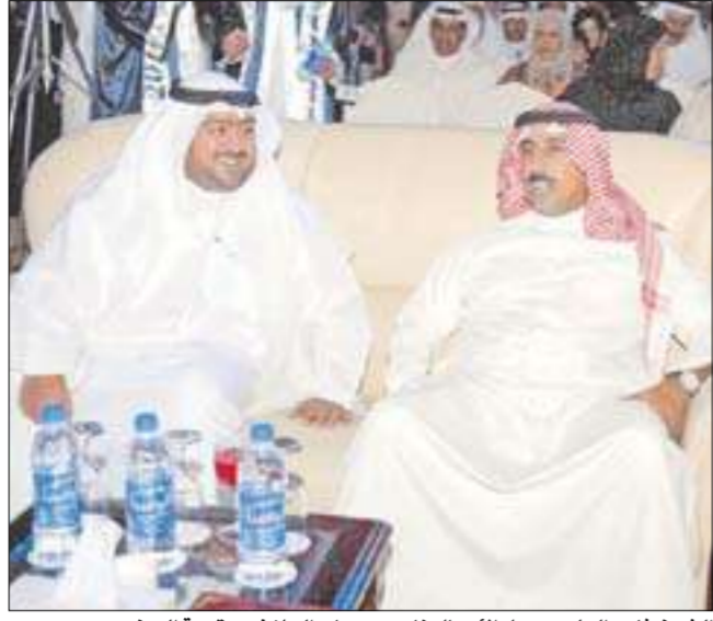
الشيخ ناصر العلي ورجل الأعمال ناصر صباح الملا في مقدمة الحضور

أقيم حفل تخرج لطلبة المرحلة الثانوية بمدرسة ناصر عبدالمحسن السعيد في فندق موفنيك بالمنطقة الحرة، تحت رعاية نائب رئيس جهاز الأمن الوطني الشيخ ناصر العلي الصباح، ورجل الأعمال ناصر صباح الملا.