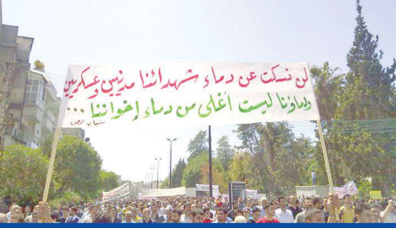
صورة لمتظاهرين في حمص يوم 27 مايو الماضي (أرشيف)