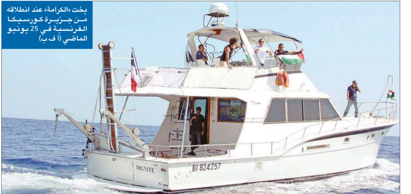
يخت «الكرامة» عند انطلاقه من جزيرة كورسيكا الفرنسية في 25 يونيو الماضي

الجيش: استنفدنا كل القنوات الدبلوماسية... وركاب اليخت رفضوا إطاعة الأوامر