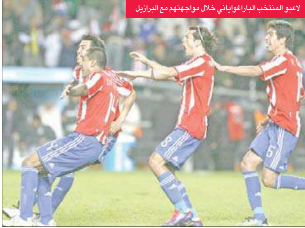
لاعبو المنتخب الباراغواياني خلال مواجهتهم مع البرازيل

تخوض الباراغواي والبيرو المواجهة الثانية في نصف نهائي كأس اميركا الجنوبية «كوبا اميركا» لكرة القدم المقامة حاليا في الأرجنتين، على ملعب «ملفيناس ارخنتيناس» في مندوزا فجر غد الخميس، بعد اقضاء الاولى البرازيل حاملة اللقب في النسختين الاخيرتين والثانية تشيلي التي تصدرت مجموعتها في الدور الاول وظهرت كمرشحة قوية لحرارز اللقب.