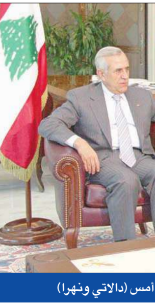
الرئيس اللبناني ميشال سليمان مستقبلاً قائد الجيش جان قهوجي أمس (اللاتي ونهرا)

تمت في الطائفة الدرزية مع رئيس جبهة النضال الوطني النائب وليد جنبلاط، مشيراً إلى أن "الطائفة الدرزية اختارت أفضل ضابطين تم تعيينهما، لهما تاريخ في الكفاءة والجدارة"، وموضحاً أن معايير الاختيار للتعيين جاءت على هذا الأساس".