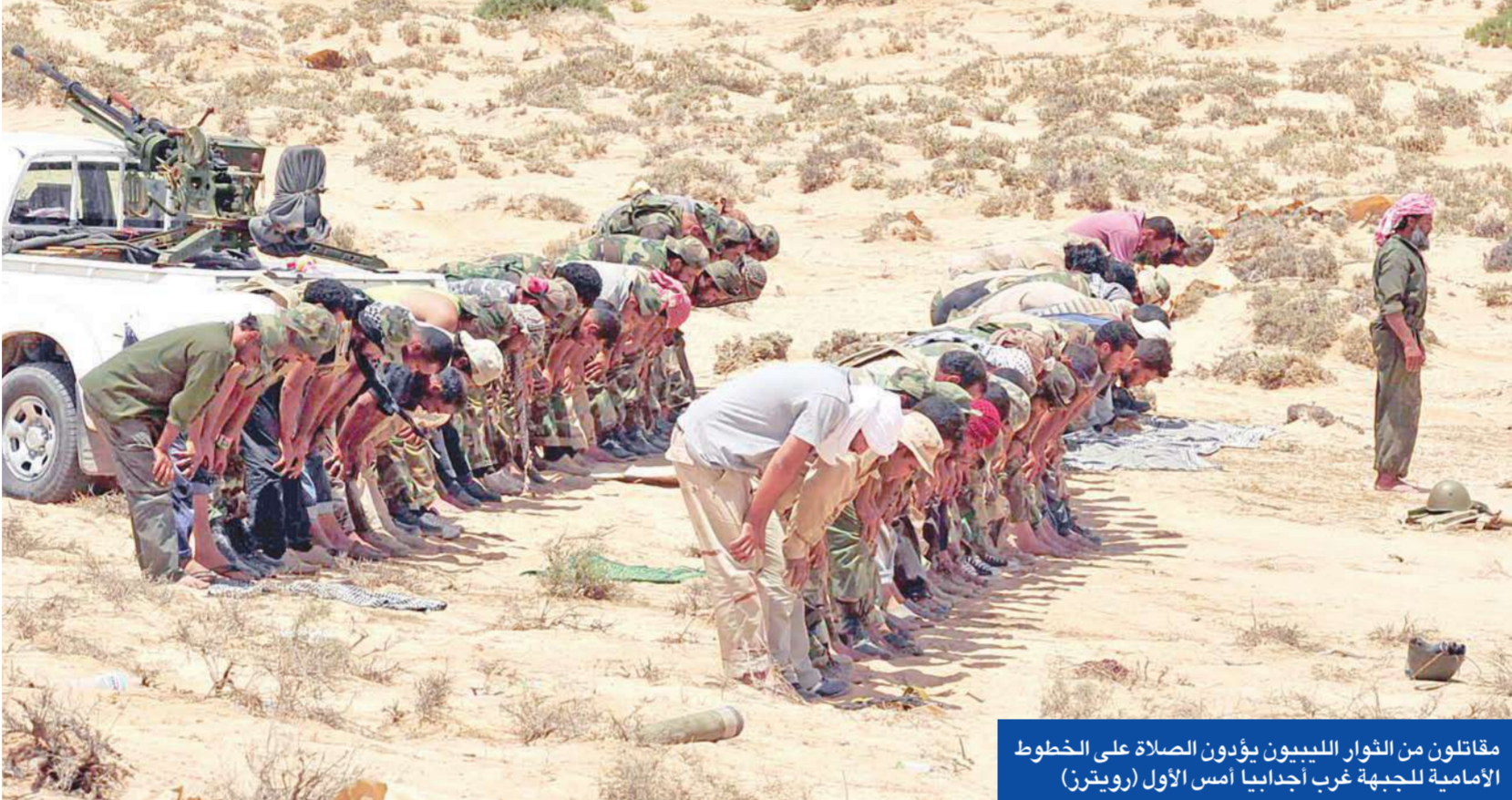
مقاتلون من الثوار الليبيون يؤدون الصلاة على الخطوط الأمامية للجبهة غرب أجدابيا أمس الأول

● لونغيه: نلتزم الحذر الشديد لأن العقيد ليس منطقياً ● واشنطن تؤكد ضرورة رحيل النظام الليبي