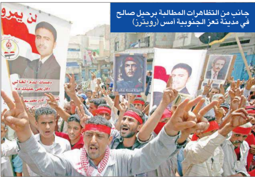
جانب من التظاهرات المطالبة برحيل صالح في مدينة تعز الجنوبية أمس

عدد من الانتحاريين وزرع الغام في عدد من الشوارع والأحياء والمنشآت الحكومية.