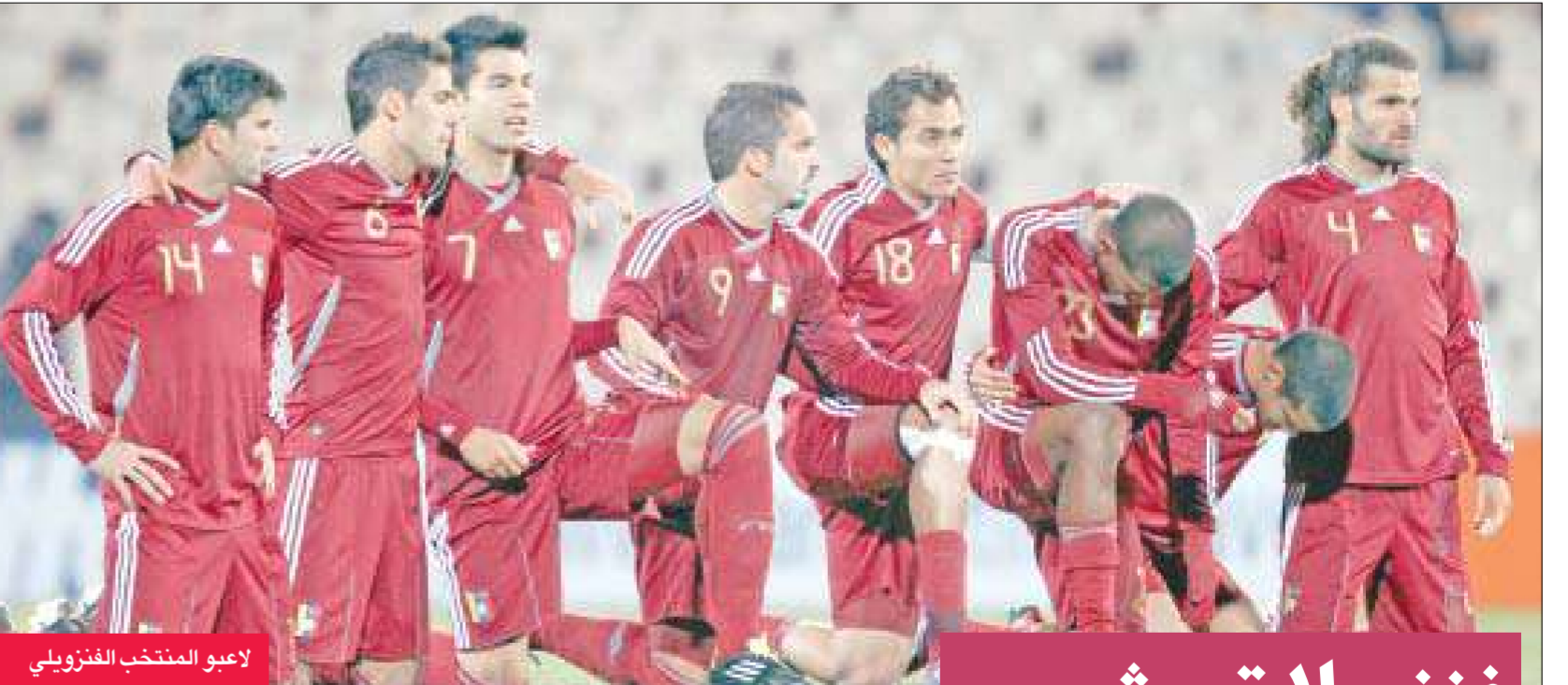
لاعبو المنتخب الفنزويلي