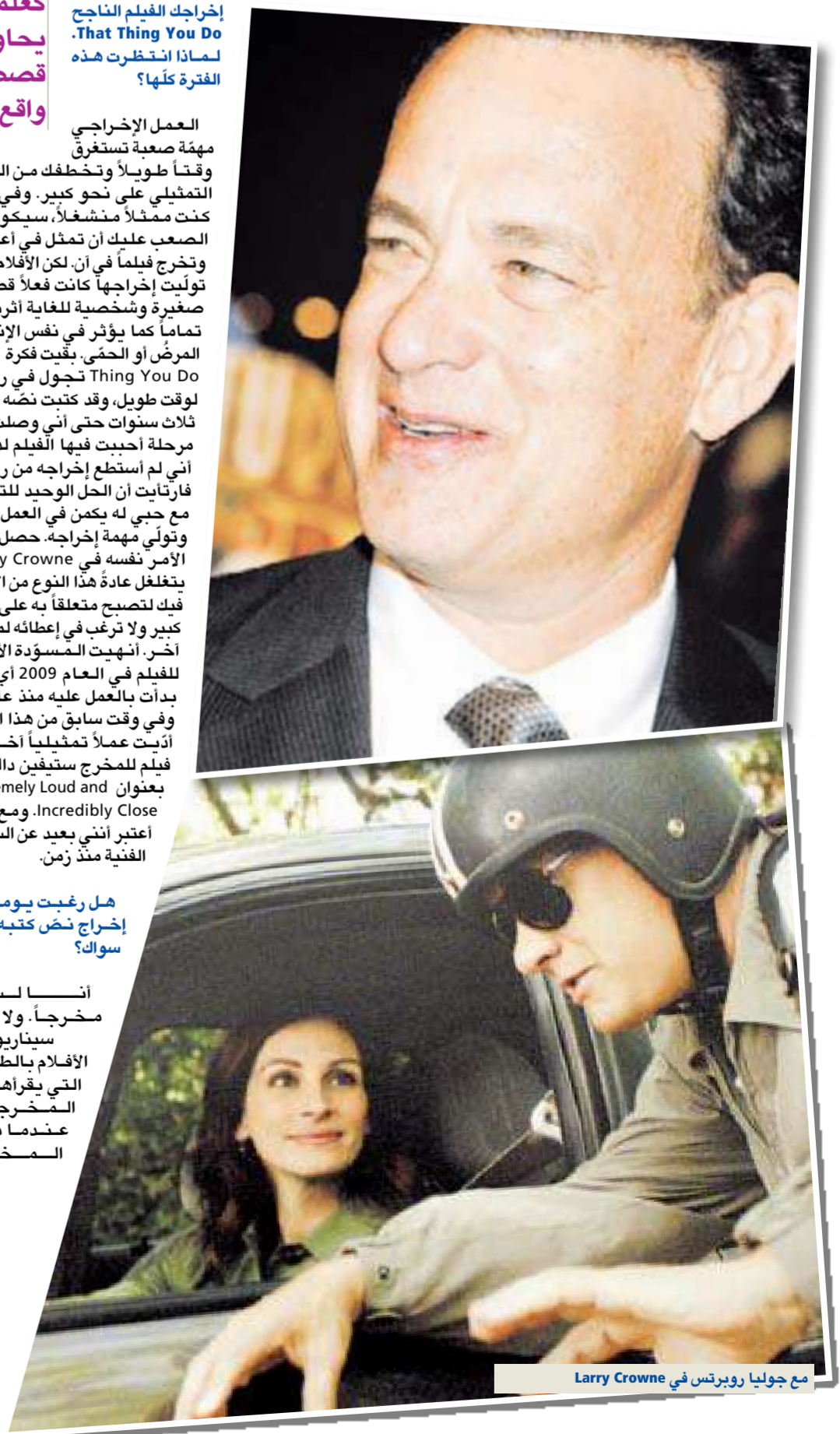
مع جوليا روبرتس في Larry Crowne

لا تنطوي عملية إجراء المقابلات على أي غموض أو قوة خارقة. اعتبر أن إجراء مقابلة صحفية أشبه بالجلوس مع أحدهم والتحدث معه عن العمل الذي أزاوله منذ تخرجي. فعندما تقوم بعمل ما، تتجلس مع الآخرين وتفويض في الحديث عنه. لا أخشى من الحديث عن أفلامي ولا سيما مع أشخاص أذكاء نسبياً. كنت أتمنى لو أننا نعيش في جو حيث تحدثت العمل عن نفسه ولا يضطر المرء إلى شرح نفسه لأي كان. لكني أجد في المقابل أن الحديث عن هذه الأمور مثير للاهتمام، فهمت قصدي؟ كذلك لا اعتبر المقابلات الصحفية مهمة شاقة كما هي بالنسبة إلى بعض الناس. فشخصيتي تختلف عن هؤلاء، ربما لأنني بطبعي أحب التحدث كثيراً.