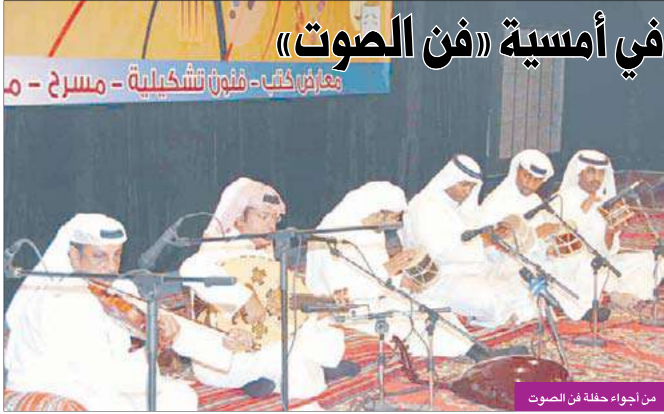
من أجواء حفلة فن الصوت