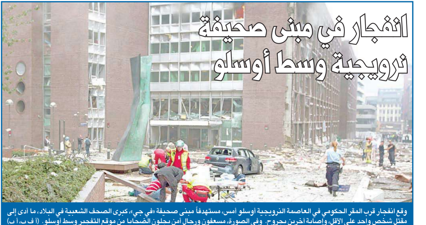
وقع انفجار قرب المقر الحكومي في العاصمة النرويجية أوسلو أمس، مستهدفاً مبنى صحيفة «في جي»، كبرى الصحف الشعبية في البلاد، ما أدى إلى مقتل شخص واحد على الأقل، وإصابة آخرين بجروح. وفي الصورة، مسعفون ورجال أمن يجلبون الضحايا من موقع التفجير وسط أوسلو.