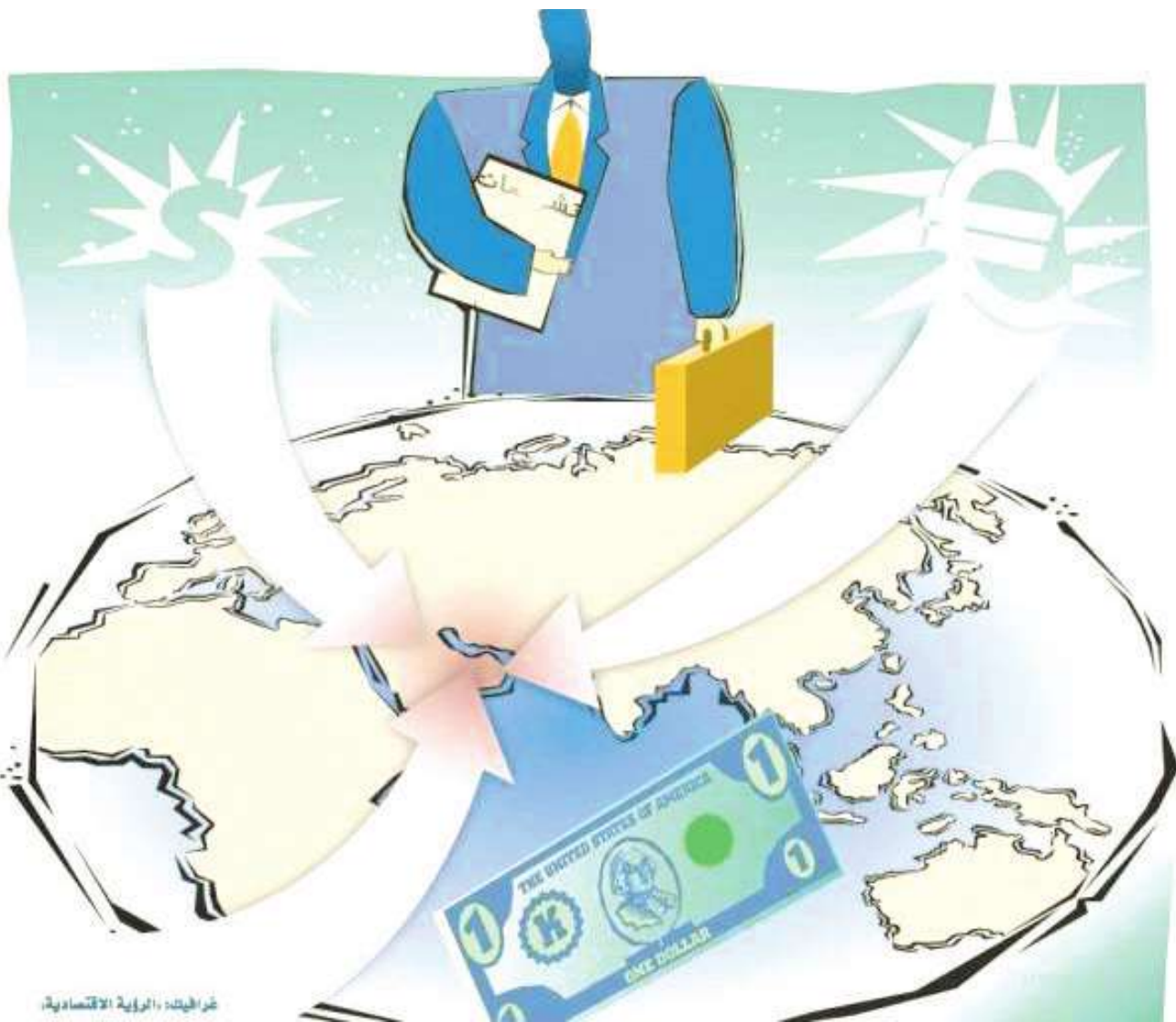
خريطة: الرؤية الاقتصادية.

العالم يعود إلى أجواء الخوف وتوقعات بالتحويل إلى «السالب» بسبب الربيع العربي