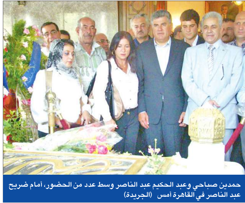
حمدين صباحي وعبد الحكيم عبد الناصر وسط عدد من الحضور، أمام ضريح عبد الناصر في القاهرة أمس (الجريدة)

رئاسة الجمهورية حمدين صباحي على الوجود والمشاركة في الاحتفال وأكد لـ«الجريدة» أنه ضد أي اعتداء على المتظاهرين سلميا، محذرا من «كارثة الانقسام بين الشعب والجيش». وذكر صباحي أنه حرص على الوجود في «ميدان التحرير» لمشاركة المعتصمين في مطالبهم التي يتفق مع بعضها ويرفض بعضها المستعمل في إقالة المجلس العسكري أو صياغة الدستور. وأعتبر عبدالحكيم عبدالناصر، نجل الزعيم الراحل أن ثورة يناير وثورة 23 يوليو قامتا لفرص إرادة الشعب المصري، مستنقدا نظام الرئيس السابق أنور السادات، وتوقيع لمعاهدة السلام مع إسرائيل، والتي جاءت ضد رغبة الشعب العربية، مستنقدا أن ما سماه بالتمذيد «النجيب» في إشارة إلى الرئيس السابق حسني مبارك «استكمل الخطوات الطبيعية مع العدو الصهيوني».