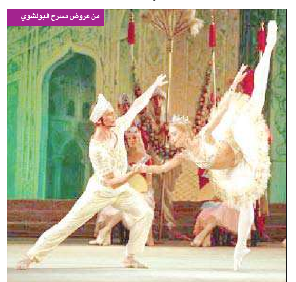
من عروض مسرح البولشوي

يعيد مسرح البولشوي الروسي الشهير الذي اضطر إلى إقامة عروضه في مكان آخر منذ 2005 بسبب أعمال ترميم ضخمة، فتح أبوابه في 28 أكتوبر على ما