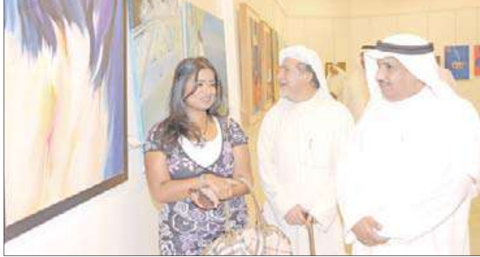
المهنا متجولاً في المعرض

يضم المعرض 120 عملاً لـ63 فناناً ينتمون إلى مختلف المدارس والأجيال في الحركة التشكيلية في الكويت.