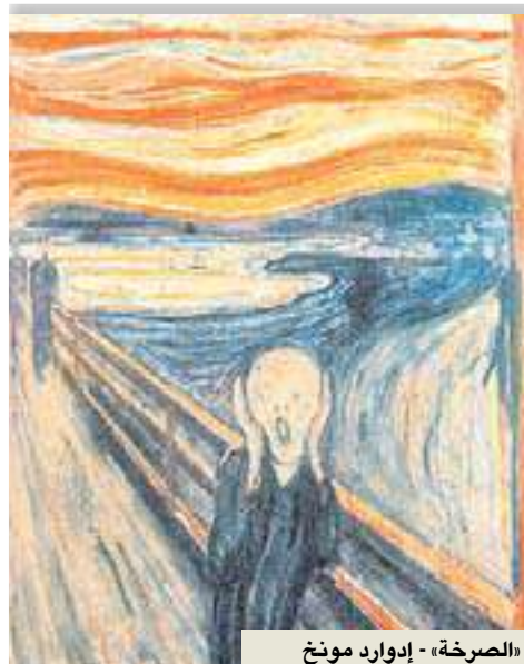
«الصرخة» - إدوارد مونخ