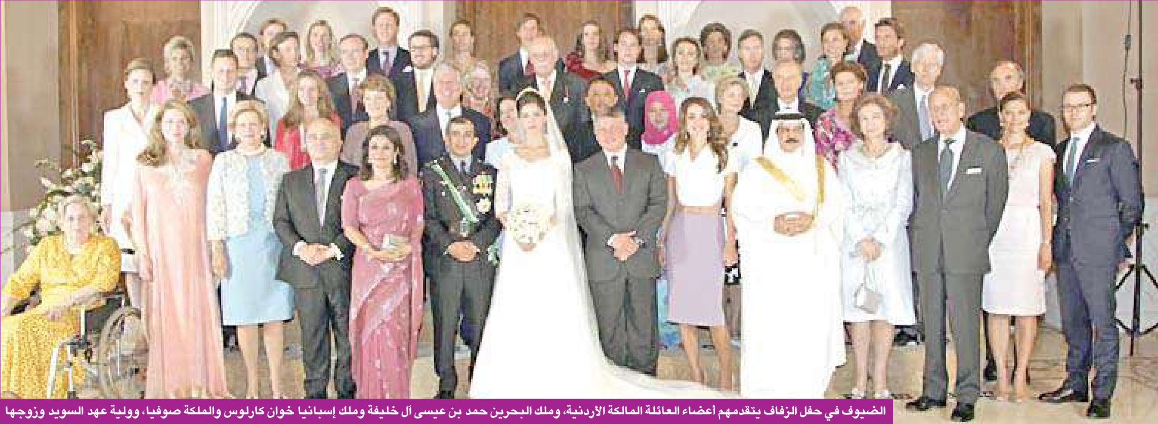
الضيوف في حفل الزفاف يتقدمهم أعضاء العائلة المالكة الأردنية، ملك البحرين حمد بن عيسى آل خليفة وملك إسبانيا خوان كارلوس والملكة صوفيا، وولية عهد السويد وزوجها

جرت في عمان أمس الأول مراسم عقد قران وحفل زفاف ابن عم ملك الأردن الأمير راشد بن الحسن على عروسه زينة شعبان ابنة أحد رجال الأعمال الأردنيين.