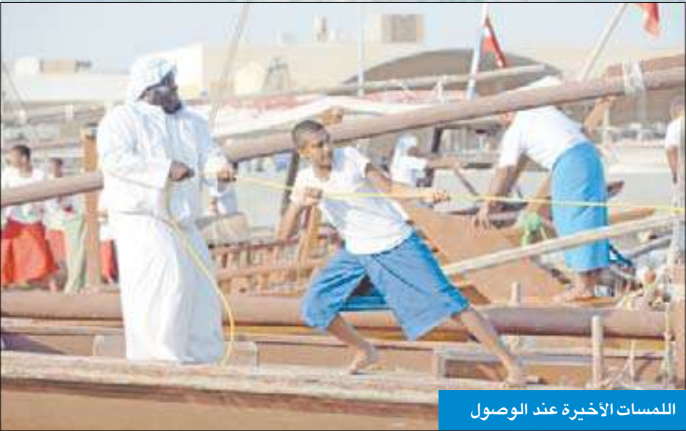
المسرات الأخيرة عند الوصول

العفاسي ناب عن سمو الأمير في «قفال» الغوص ودعا المؤسسات إلى دعم تراث الآباء والأجداد والشباب للحفاظ على الوطن