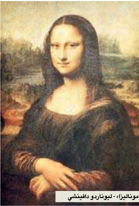
«موناليزا» - ليوناردو دافينشي

من ضمن ثورة الإنترنت صيحة جديدة للتصويت لاختيار اللوحات التشكيلية الأشهر في العالم، لعرضها بصورة نقيّة للغاية على الموقع الإلكتروني «يوتيوب».