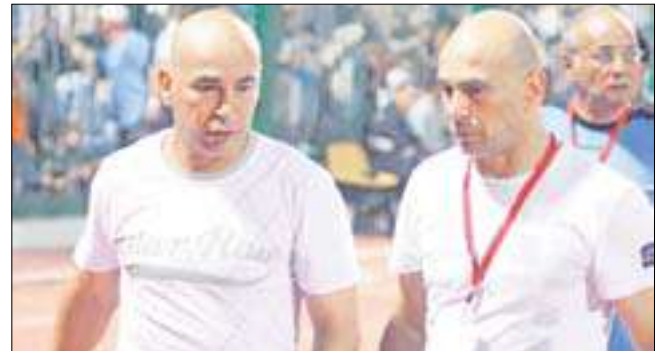
إبراهيم وحسام حسن

طالبت جماهير فريق غزل المحلة، الصاعد إلى الدوري الممتاز الموسم المقبل، إدارة ناديها بالتعاقد مع التوأم حسام وإبراهيم حسن لتولي القيادة الفنية للفريق في الموسم المقبل في الدوري الممتاز.