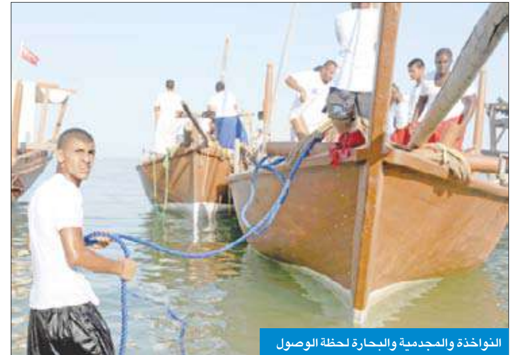
النواخذة والمجدمية والبحارة لحظة الوصول