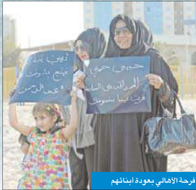
فرحة أهالي بعودة ابنائهم