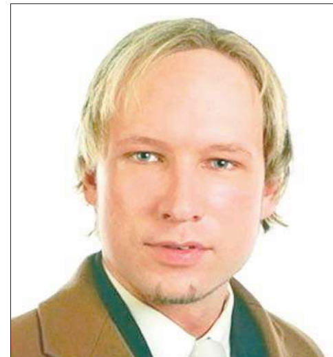
المشتبه فيه اندرس بريفيك الذي اعتقل إثر مجزرة مخيم ساينفول

توالى الإدانات من جميع دول العالم للحادثين الإرهابيين اللذين شهدتهما النرويج أمس الأول وأسفرا عن مقتل 92 شخصاً بحسب آخر حصيلة أعلنتها وكالات الأنباء العالمية، في أعنف حادث تشهده البلاد منذ الحرب العالمية الثانية. واستجوبت الشرطة النرويجية أمس اندرس بريغ بريفيك الذي يشتبه في أنه نفذ الاعتداءين، وبحسب التحقيقات الأولية، فإن المشتبه فيه نفذ الاعتداء بالقنبلة في الحي الحكومي وسط أوصلو، ثم توجه إلى جزيرة أوتاي حيث فتح النار على المشاركين في مخيم صيفي لـ «الشبيبة العمالية» التابعة للحزب الحاكم في البلاد.