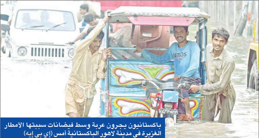
باكستانيون يجرون عربة وسط فيضانات سببتها الأمطار الغزيرة في مدينة لاهور الباكستانية أمس

وبشر بالتسامح الإسلامي بين المسلمين والهنود. (كابول - إسلام آباد - يو بي أي، أ ف ب)