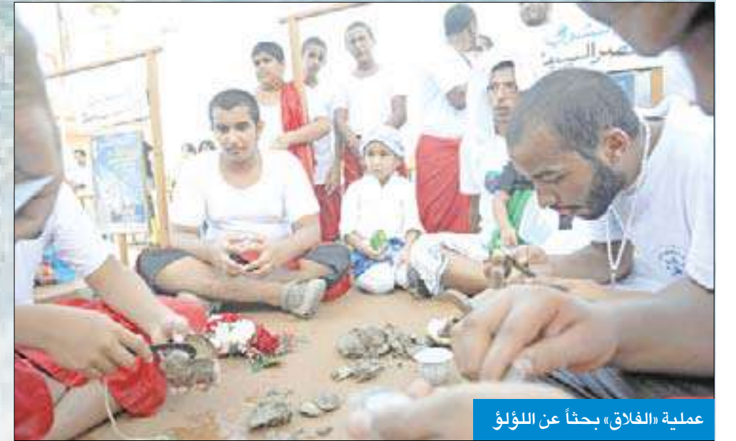
عملية «الفاق» بحثاً عن اللؤلؤ

والحد الأدنى للاجور وتحويل الإقامة دون رغبة الكفيل حققت الطموح وساهمت في رفع اسم الكويت من القائمة السوداء في منظمة العفو الدولية.