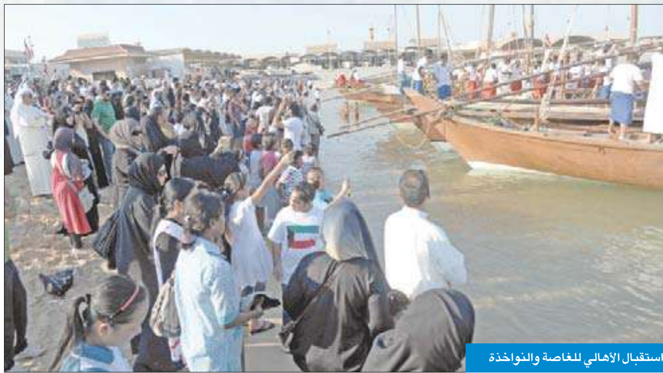
استقبال أهالي للخاصة والنواخذة

وأكد العفاسي اهتمام الكويت بملف حقوق الإنسان، مشيراً إلى أن دستور الكويت تضمن بنوداً خاصة تعنى بحقوق الإنسان وكرامته، وتحصر على عدم التمييز بين أطراف المجتمع بناءً على دين أو عرق أو أصل. لافتاً إلى أن الكويت تفخر بدستورها وقوانينها التي لا تفرق بين مواطن ومقيم. وأوضح أن القوانين التي صدرت مؤخراً مثل قانون العمل وقانون المعاقين وتحديد ساعات العمل