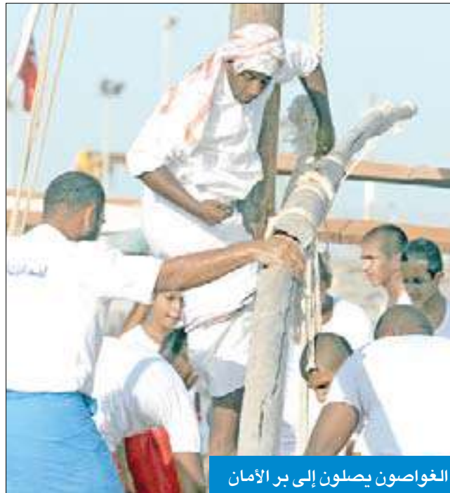
العواصون يصلون إلى بر الأمان