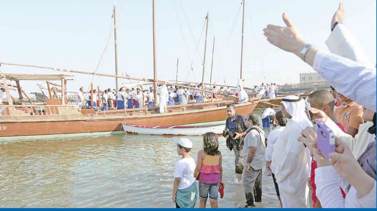
أهالي الغواصين يستقبلون أبناءهم لدى عودتهم من رحلة الغوص أمس