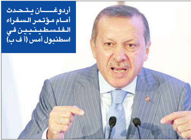
أردوغان يتحدث أمام مؤتمر السفراء الفلسطينيين في اسطنبول امس

(بغداد - د ب أ، يو بي أي) بتنسيق تام مع السلطات العراقية، وهي خاضعة للقوانين العراقية خارج السفارة الأميركية في بغداد حيث سيكون مركزها». وتنص الاتفاقية الأمنية الموقعة بين بغداد وواشنطن في نهاية نوفمبر عام 2008، على وجوب أن تنسحب جميع قوات الولايات المتحدة من الأراضي والمياه والأجواء العراقية كافة في موعد لا يتعدى 31 ديسمبر من العام الجاري. وكانت قوات الولايات المتحدة المقاتلة انسحبت بموجب الاتفاقية من المدن والقرى العراقية في 30 يونيو عام 2009.