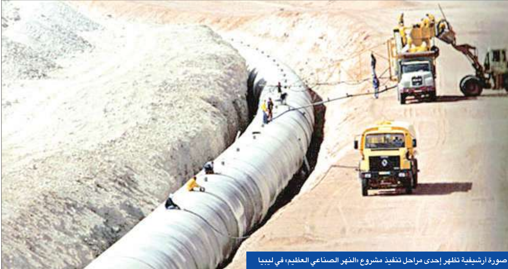
صورة أرشيفية تظهر إحدى مراحل تنفيذ مشروع «النهر الصناعي العظيم» في ليبيا

واتهمت السلطات الليبية أمس الأول «حلف الأطلسي» بقتل ستة