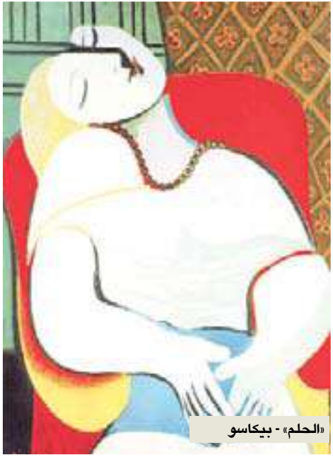
«الحلم» - بيكاسو