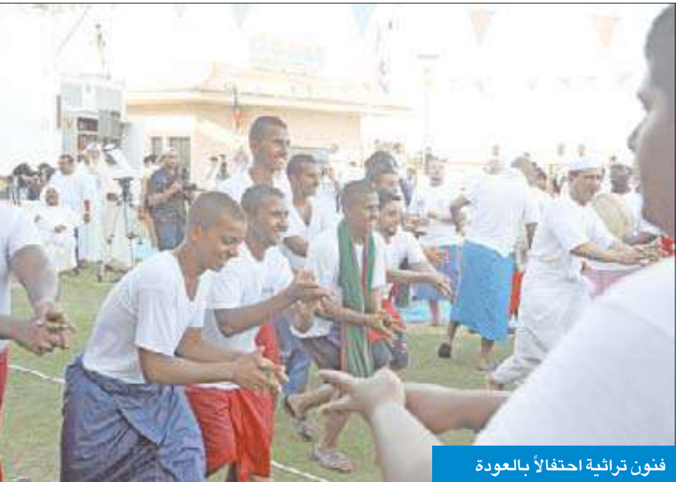
فنون تراثية احتفالاً بالعودة