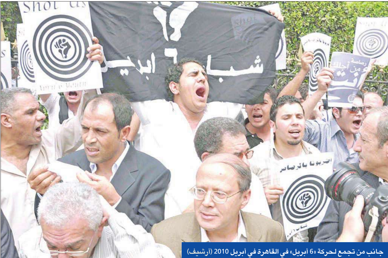
جانب من تجمع لحركة «6 أبريل» في القاهرة في إبريل 2010 (أرشيف)

مصدر عسكري يؤكد رصد مساع لإثارة الفتن... والحركة تعتبر الأمر «تصفية حسابات»