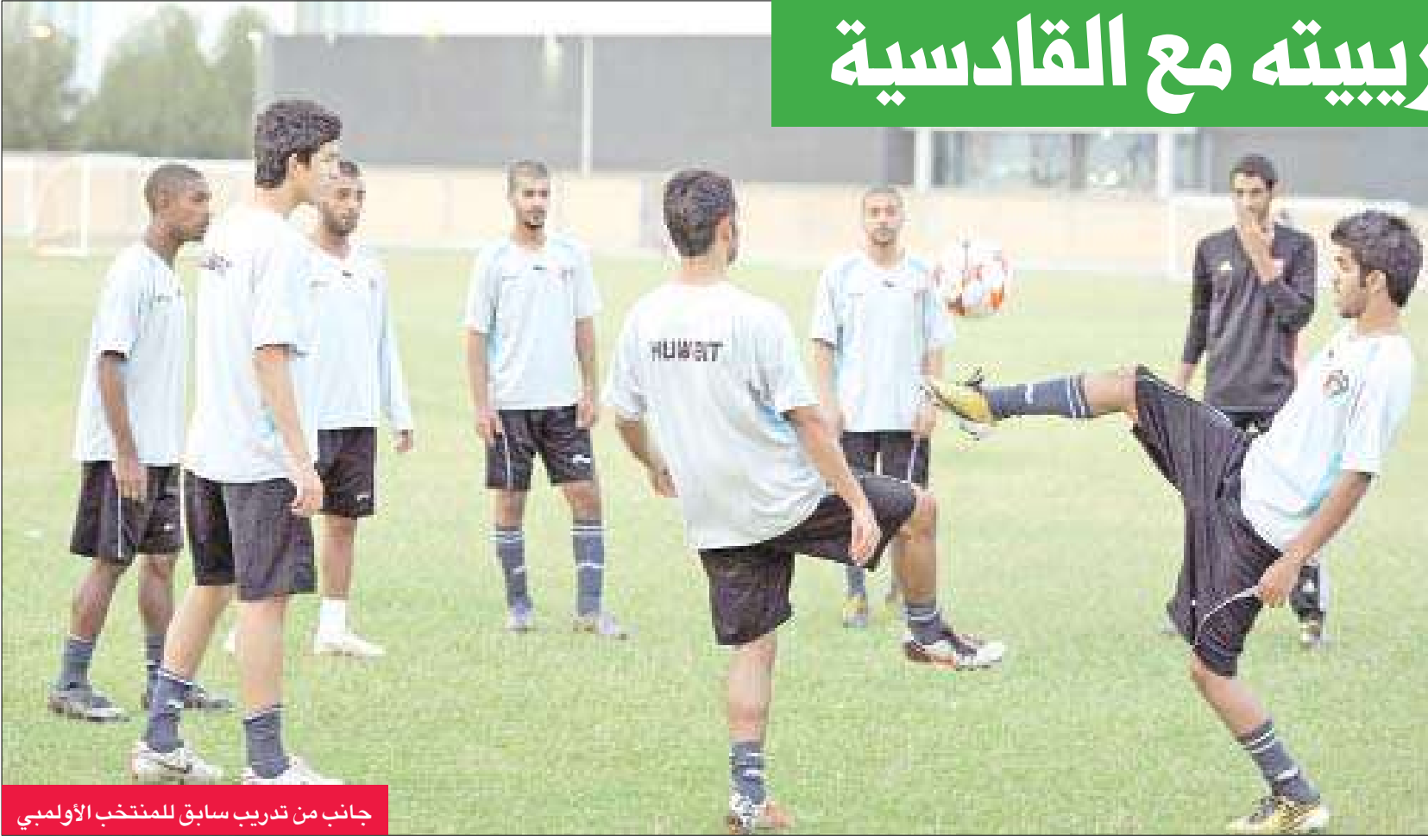
جانب من تدريب سابق للمنتخب الأولمبي