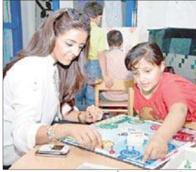
مسؤوله علاقات عامة تشارك طفلاً اللعب