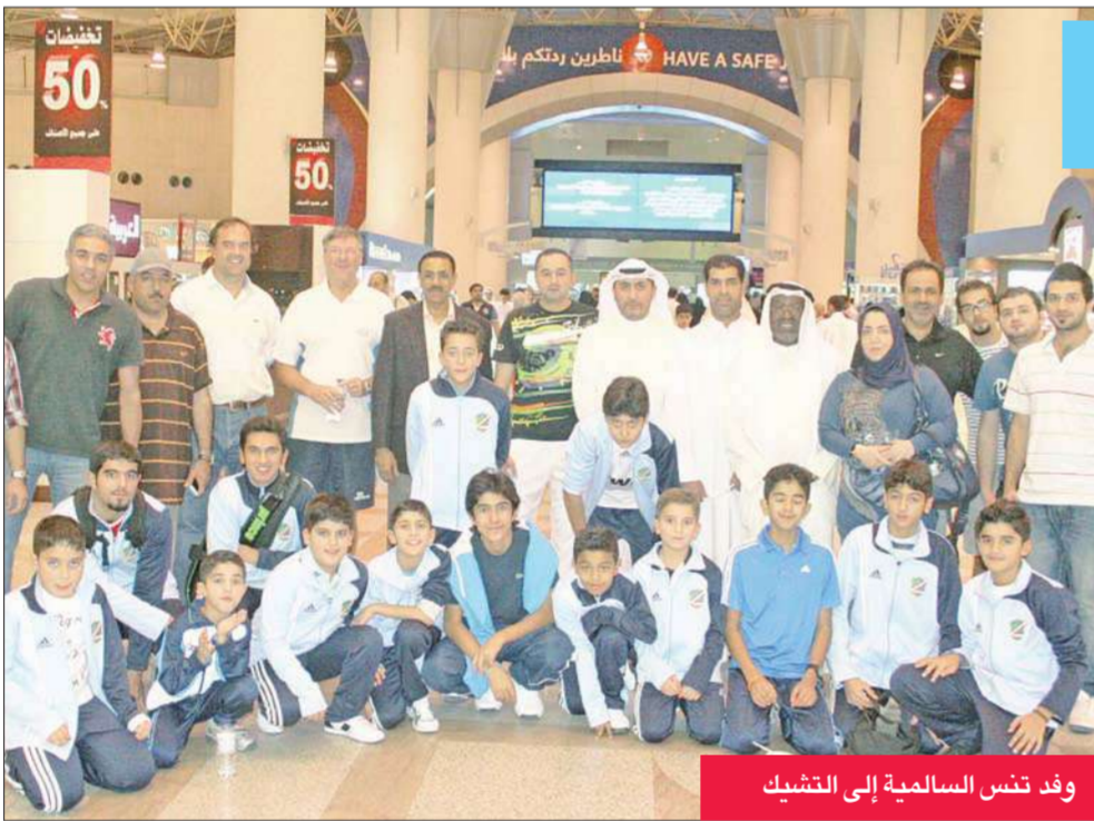
وفد تنس السالمية إلى التشيك

يبدأ اليوم فريق التنس الارضي بنادي السالمية معسكرة في التشيك بوفد يضم 18 لاعباً وذلك استعداداً للبطولات المحلية التي ينظمها الاتحاد وتنتقل يوم 20 الشهر الجاري.