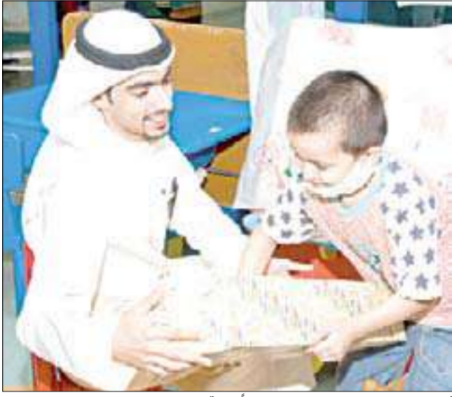
أحد موظفي البنك الوطني يعطي طفلاً هدية العيد

المكان مستشفى بنك الكويت الوطني ومستشفى ابن سينا