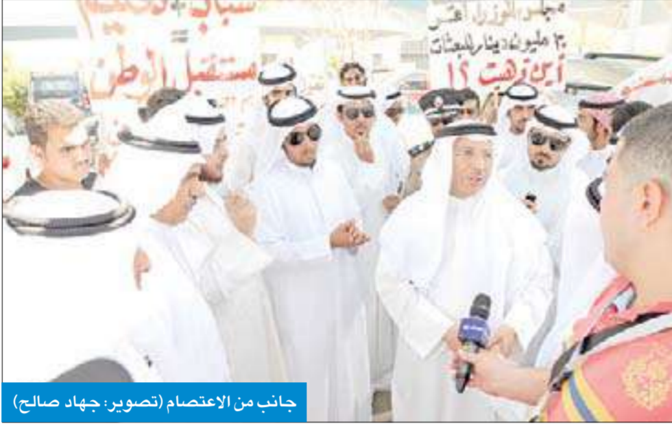
جانب من الاعتصام

اعتصم مجموعة من خريجي الثانوية غير المقبولين في خطة البعثات أمام وزارة التعليم العالي للمطالبة بسرعة حل مشكلتهم لا سيما مع تخصيص مجلس الوزراء 30 مليون دينار لزيادة المبتعثين.