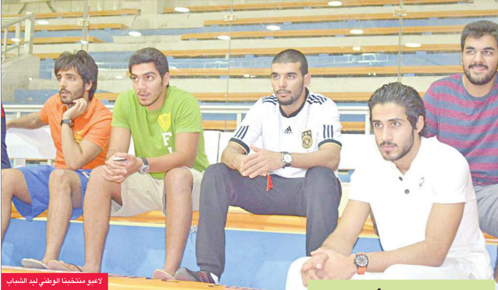
لاعبو منتخبنا الوطني ليد الشباب