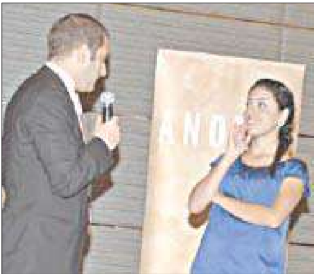
جانب من المسابقات