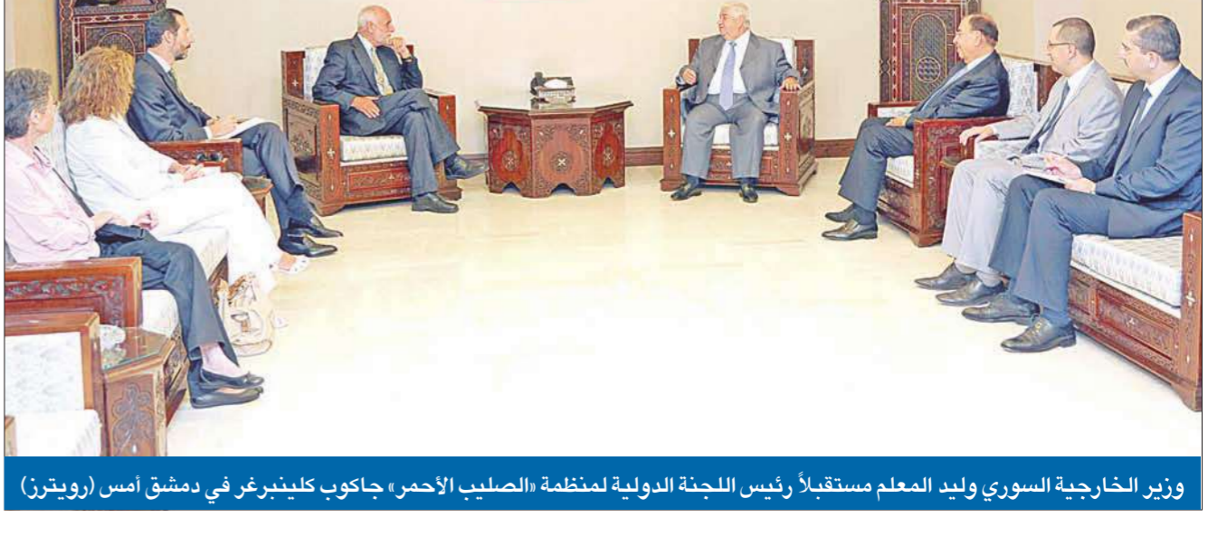
وزير الخارجية السوري وليد المعلم مستقبلاً رئيس اللجنة الدولية لمنظمة «الصليب الأحمر» جاكوب كلينبيرغر في دمشق أمس

وتقارير عن وصول النائب العام لحماية إلى تركيا في حين واصلت قوات الأمن السورية عملياتها العسكرية في عدد من المناطق السورية حاصدة 12 قتيلاً من المدنيين وعشرات المعتقلين، وعشية جلسات الحوار الوطني التي تنظمها السلطات السورية اليوم على مستوى المحافظات تمهيداً للحوار الوطني الشامل، أعلنت الجامعة العربية أن الحكومة السورية رحبت بزيارة أمين عام الجامعة نبيل العربي لدمشق في أي وقت. وقالت المتحدث باسم الجامعة