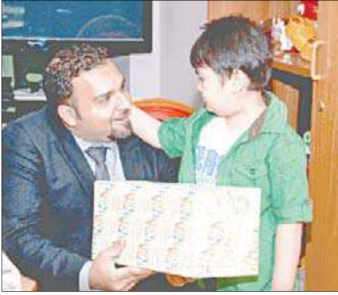
مسؤول من العلاقات العامة لدى البنك مع أحد الأطفال

شاركت أسرة العلاقات العامة في بنك الكويت الوطني مجموعة من موظفي البنك في زيارات معايدة خاصة لمستشفى بنك الكويت الوطني للأطفال ومستشفى ابن سينا في منطقة الصباح الطبية. وذلك بهدف مشاركة الأطفال المرضى فرحة العيد وتقديم الهدايا وقضاء بعض الأوقات الطيبة. وعبر الأطفال في المستشفيات عن سعادتهم البالغة بالحصول على الهدايا الجميلة.