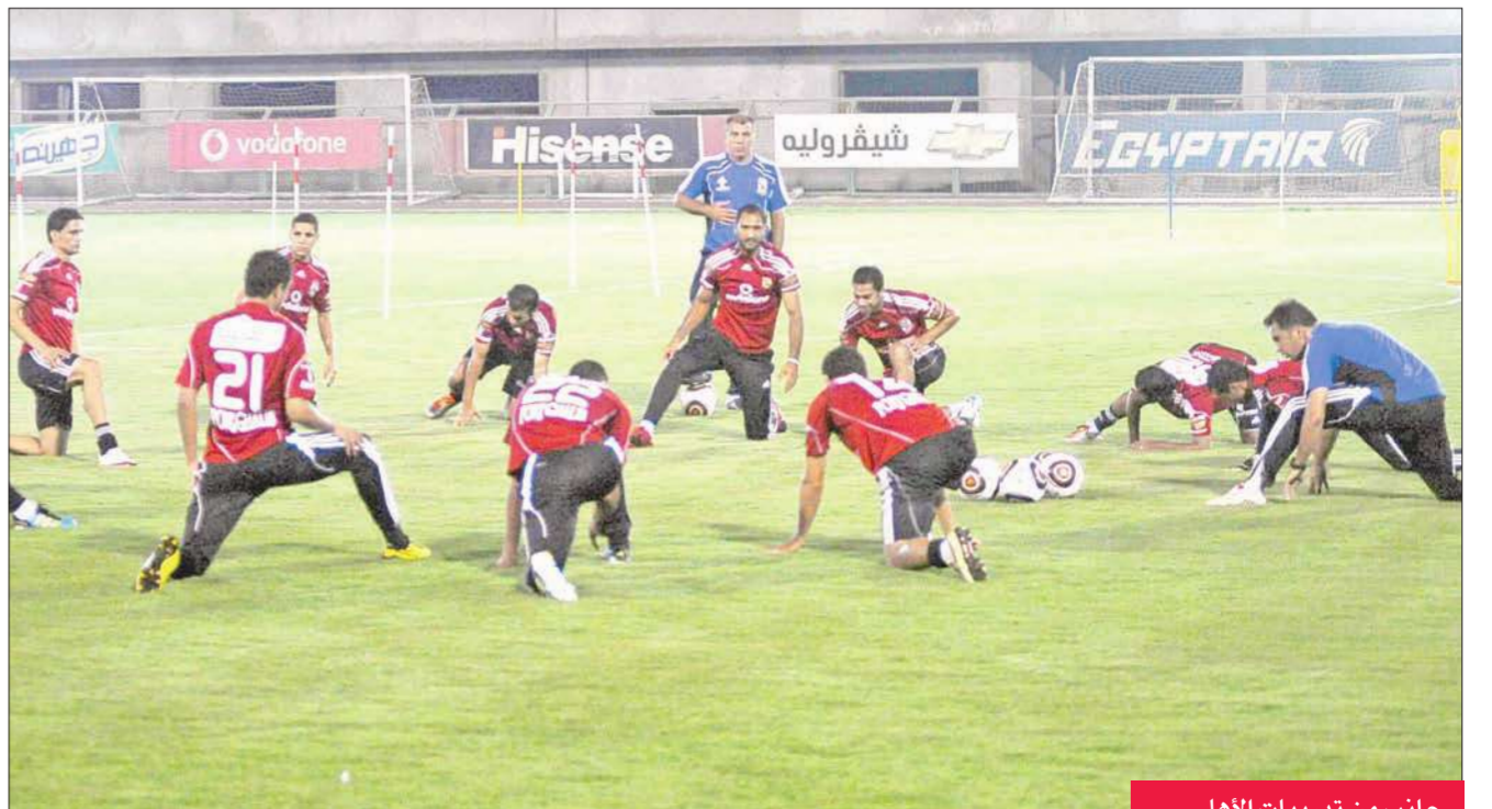
جانب من تدريبات الأهلي

ويتطلع المجلس إلى إنهاء ملف الميزانية حتى يتم إرسالها لأعضاء النادي قبل 15 يوماً من اجتماع الجمعية العمومية المقرر له 29 و30 سبتمبر الحالي. كما سيبحث المجلس أيضاً العروض التي تلقاها مؤخراً لتحويل فريق الكرة لشركة مساهمة، حيث تلقى النادي مؤخراً عروضاً من أربع شركات، وإن كان هناك شركتان فقط هما الأكثر جدية وسيتم الاستقرار على الشركة الفائزة في اجتماع اليوم، وتنتج النية للبدء فوراً في إجراءات تحويل النادي لشركة مساهمة وبناء استناد النادي بالشيخ زايد باعتبار أن هذا المشروع يمثل «الحلم العالمي» لمسؤولي القلعة الحمراء.