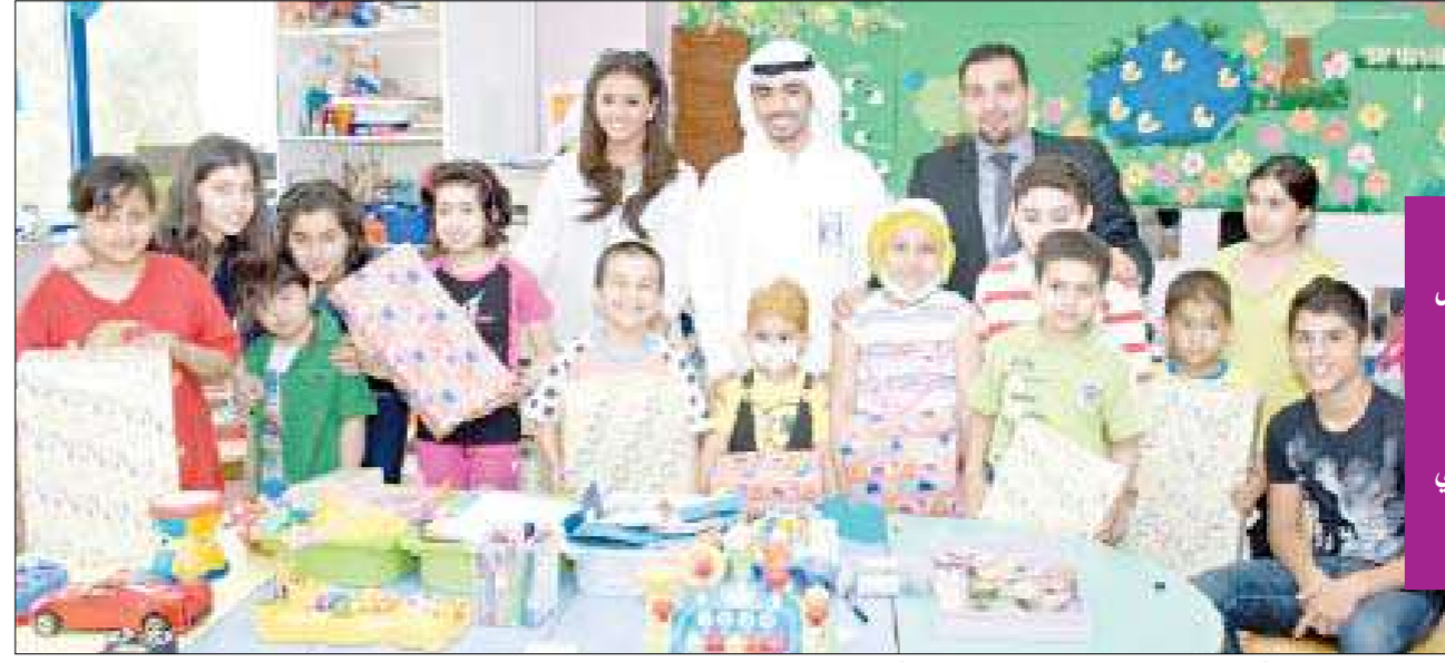
فريق العلاقات العامة ومتطوعو المستشفى في صورة جماعية مع الأطفال في مستشفى ابن سينا

شاركت أسرة العلاقات العامة في بنك الكويت الوطني مجموعة من موظفي البنك في زيارات معايدة خاصة لمستشفى بنك الكويت الوطني للأطفال ومستشفى ابن سينا في منطقة الصباح الطبية. وذلك بهدف مشاركة الأطفال المرضى فرحة العيد وتقديم الهدايا وقضاء بعض الأوقات الطيبة. وعبر الأطفال في المستشفيات عن سعادتهم البالغة بالحصول على الهدايا الجميلة.