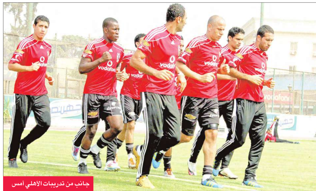
جانب من تدريبات الأهلي أمس