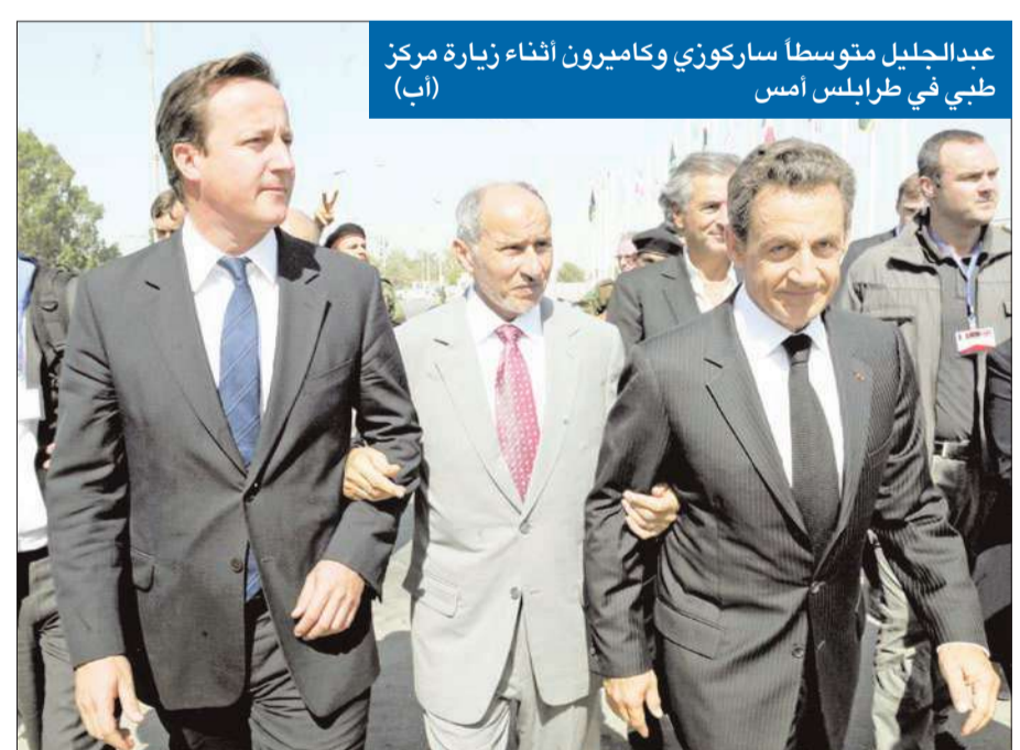
عبد الجليل متوسلاً ساركوزي وكامبيرون أثناء زيارة مركز طبي في طرابلس أمس

قوات «المجلس الوطني الانتقالي» تبدأ دخول مدينة سرت