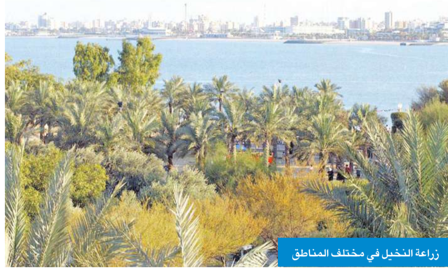
زراعة النخيل في مختلف المناطق

أكدت الهيئة العامة لشؤون الزراعة والثروة السمكية أهمية اشجار النخيل لدولة الكويت وسعيها التي تنفذ خطط واستراتيجيات تستهدف الارتقاء بزراعة تلك الأشجار والمحافظة عليها.