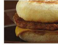
ماك ماغن صوص