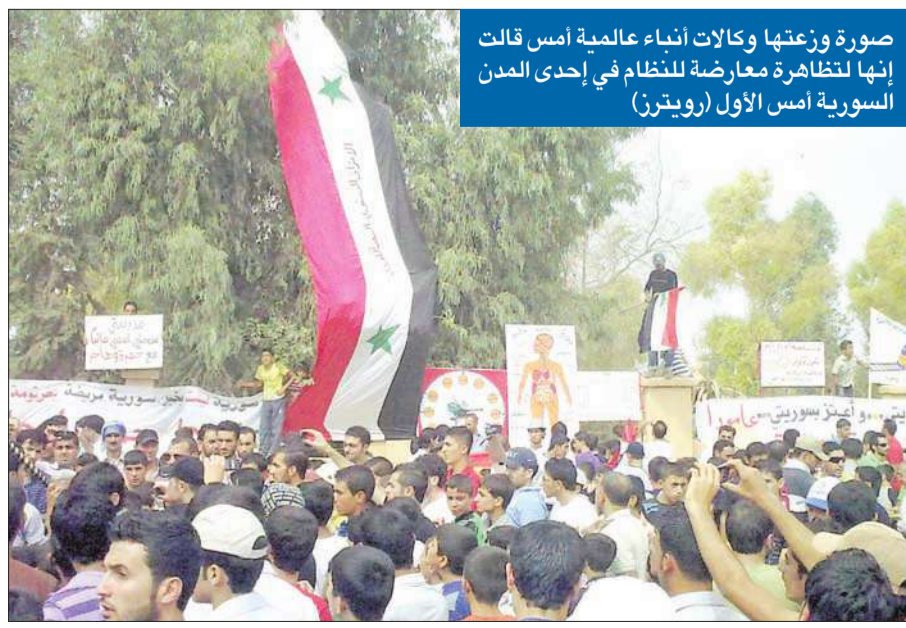
صورة وزعتها وكالات أنباء عالمية أمس قالت إنها لنظاهرة معارضة للنظام في إحدى المدن السورية أمس الأول

في وقت تواصلت العمليات الأمنية التي تشنها القوات السورية في عدة مناطق، خصوصاً في حمص حيث قتل 10 أشخاص بينهم مهندس نووي تعرض للاغتيال على يد مجهولين، اعتبر الرئيس السوري بشار الأسد أن «الحوادث الأليمة» انتهت وأن المدن التي شهدت اضطرابات تستعيد استقرارها. وبعد لقاء الأسد مع رئيس الحكومة اللبنانية الأسبق سليم الحص في دمشق أمس، أصدر الأخير بياناً أعلن فيه أنه بحث مع الرئيس السوري الأزمة التي مرت بها سورية واجتازتها بسلام. وبحسب البيان، فقد أكد الأسد أن «الحوادث الأليمة انتهت والحمد لله، والمدن السورية التي تعرضت للحوادث تستعيد استقرارها الكامل، والسلسلة في 02