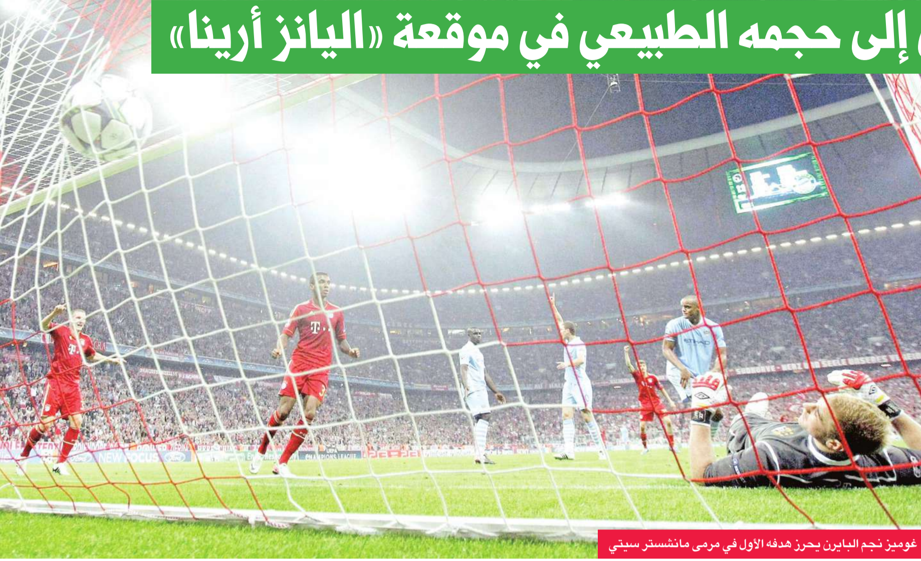
غوميز نجم البايرن يحرز هدفه الأول في مرمى مانشستر سيتي

واصل بايرن ميونيخ الألماني عروضه المميزة وتغلب على ضيفه مانشستر سيتي الإنكليزي بالفوز عليه 2-0 صفر أمس الأول في الجولة الثانية من مسابقة دوري أبطال أوروبا.