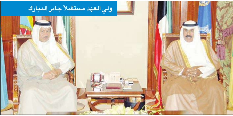
ولي العهد مستقبلاً جابر المبارك

سموه استقبل جابر المبارك والمليفي ووفداً من معهد الأبحاث