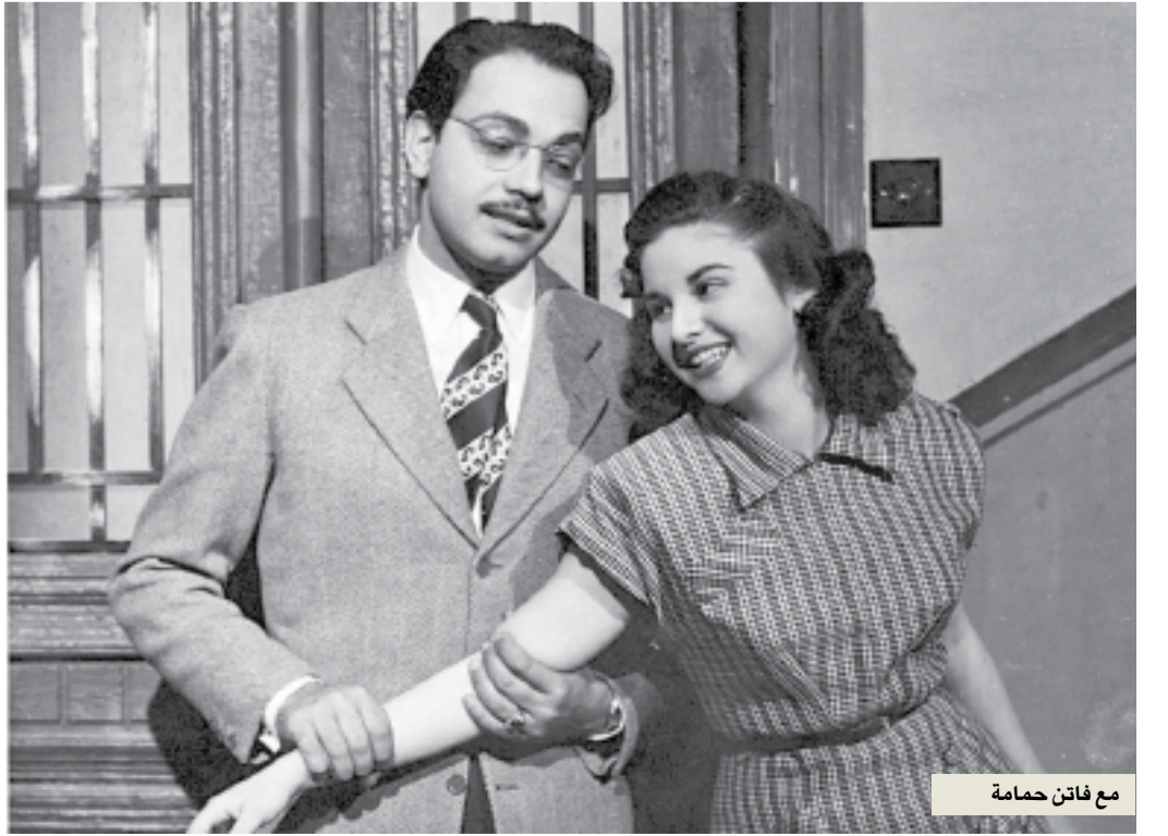
مع فائق حمامة