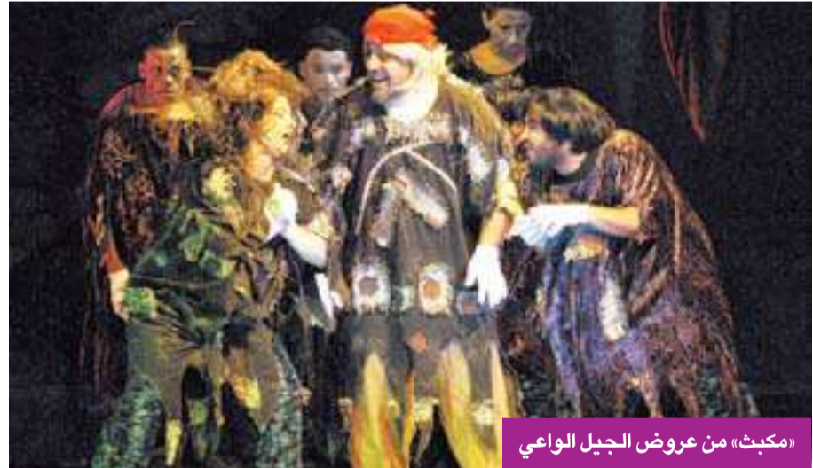
«مكبث» من عروض الجيل الواعي