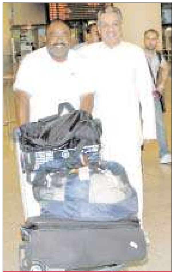
إسماعيل عبدالقدوس لدى وصوله إلى المطار أمس

تفاعلاً مع الخبر المنشور في "الجريدة" في عددها الصادر أمس بعنوان "يد الشواطئ"