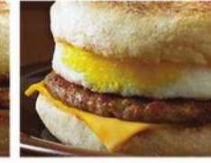
ماك ماغن صوص بالبيض