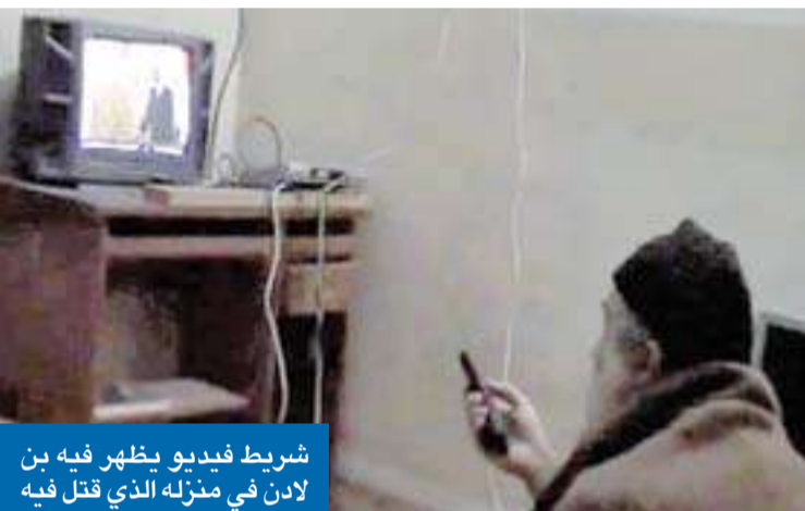
شريط فيديو يظهر فيه بن لادن في منزله الذي قتل فيه

قال مسؤول في وكالة الاستخبارات الأميركية المركزية "سي أي إيه" إن نشر صور وفيديو لزعم القاعدة اسامة بن لادن بعد مقتله في مايو الماضي، قد يعرض الأمن القومي للخطر.