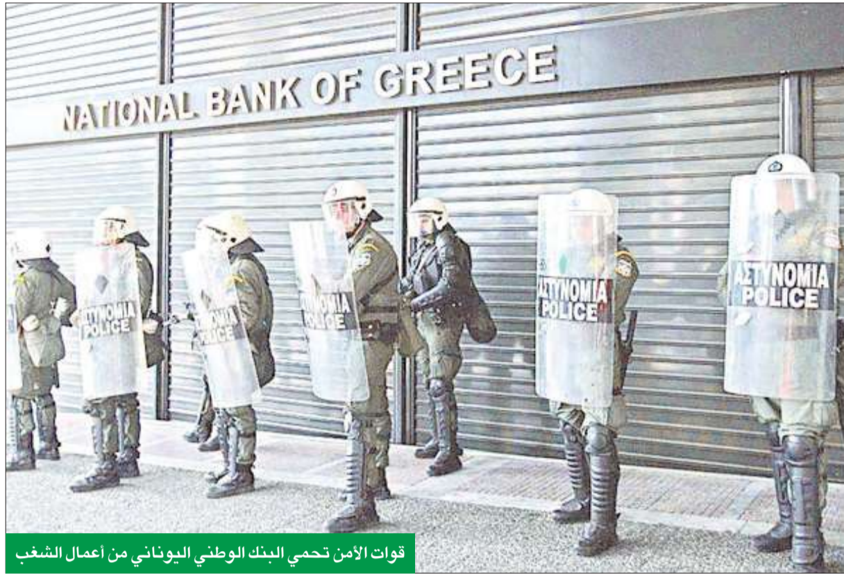
قوات الأمن تحمي البنك الوطني اليوناني من أعمال الشغب

أما استناد الاقتصاد في مدرسة "تدبير" لإدارة الأعمال بجامعة نيويورك ومؤسس ورئيس "روبيني غلوبال ايمبكونكس" نوريل روبيني فقال في مؤتمر لبلومبرغ، إن