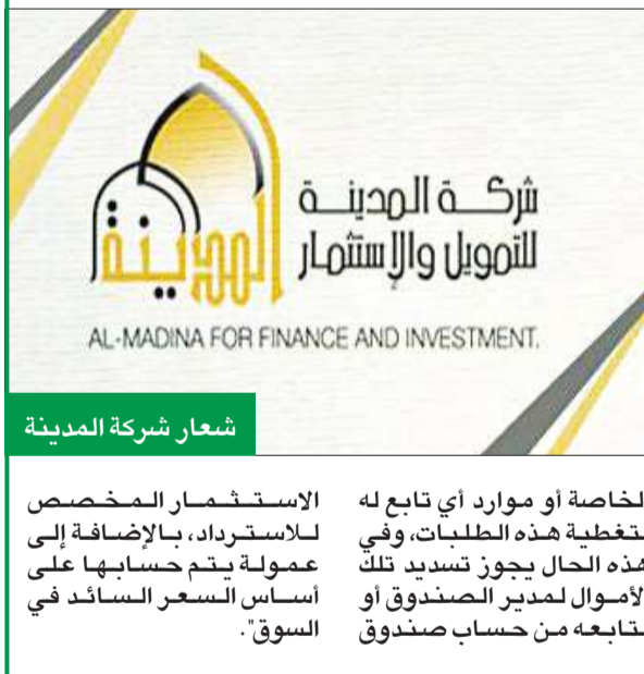
شعار شركة المدينة

الشركة أبلغتهم: لا استرداد... اذهبوا واشتكو