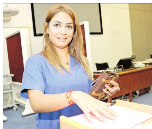
طالبة تدلي بصوتها في انتخابات جمعية العلوم الطبية

استعادت معقلها بعد مرور ثلاث سنوات عن طريق صندوق الطالبات