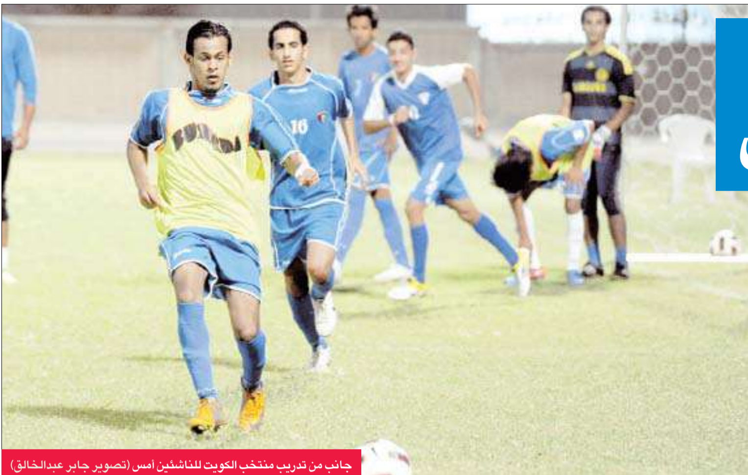
جانب من تدريب منتخب الكويت للناشئين أمس

اللاعبين مع التوجيه المستمر من قبل المدرب ومساعدة علي العدواني لتنفيذ بعض الجمل التكتيكية والتشديد على لاعبي الهجوم والوسط بالمباغثة في التسديد على المرمى، والاختراق من العمق.