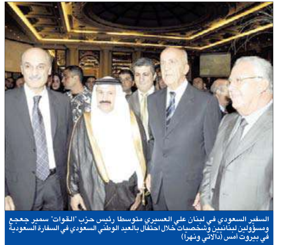
السفير السعودي في لبنان علي العسيري متوسلاً رئيس حزب «القوات» سمير جعجع ومسؤولين لبنانيين وشخصيات خلال احتفال بالعيد الوطني السعودي في السفارة السعودية في بيروت أمس

وردت أسماؤهم ونشرت صورهم في وسائل الإعلام.