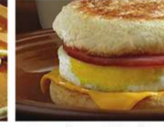
ماك ماغن صوص بالبيض

هل يمكنك مشاهدة مقاطع فيديو فلاش على موبايلك؟