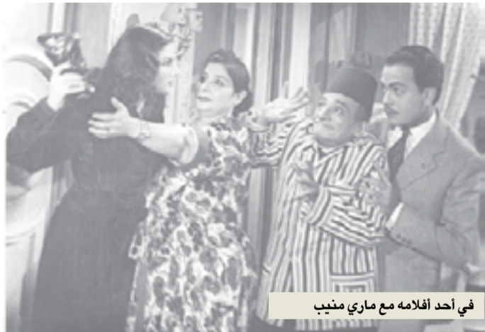
في أحد أفلامه مع ماري منيب

ثنائي ناجح أقبل الجمهور على مشاهدته، وبلغ عدد الأفلام التي قدمها كمال مع شادية 32 فيلماً، فكانت أكثر ممثلة وقفت أمامه. تحجرت أفلامهما حول قصص اجتماعية دمها خفيف، وهي عبارة عن حذوة تقليدية للحب بين ولد وبنت وما يتخللها من مشاكل، وكانا يخرجان من فيلم لبيداً فيلماً جديداً، وأحياناً كانا يمثلان أربعة