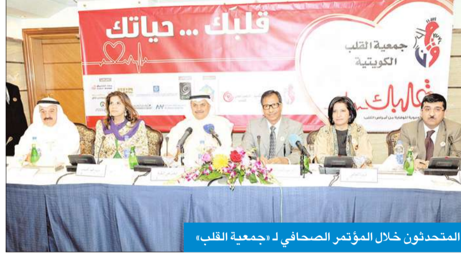
المتحدثون خلال المؤتمر الصحفي لـ «جمعية القلب»

وأضاف ان جمعية القلب تقوم بفحص طبي شامل للكشف المبكر عن الكولسترول بالدم والسكر وضغط الدم والوزن وإجراء فحص القلب، إلى جانب دورها في التوعية بخطورة أمراض القلب وأهمية الالتزام بالسلوكيات الصحية للوقاية منها وفي مقدمتها الإقلاع عن التدخين وممارسة الرياضة بانتظام والحرص على انتقاء الأغذية الصحية والابتعاد عن السلوكيات الغذائية الضارة.