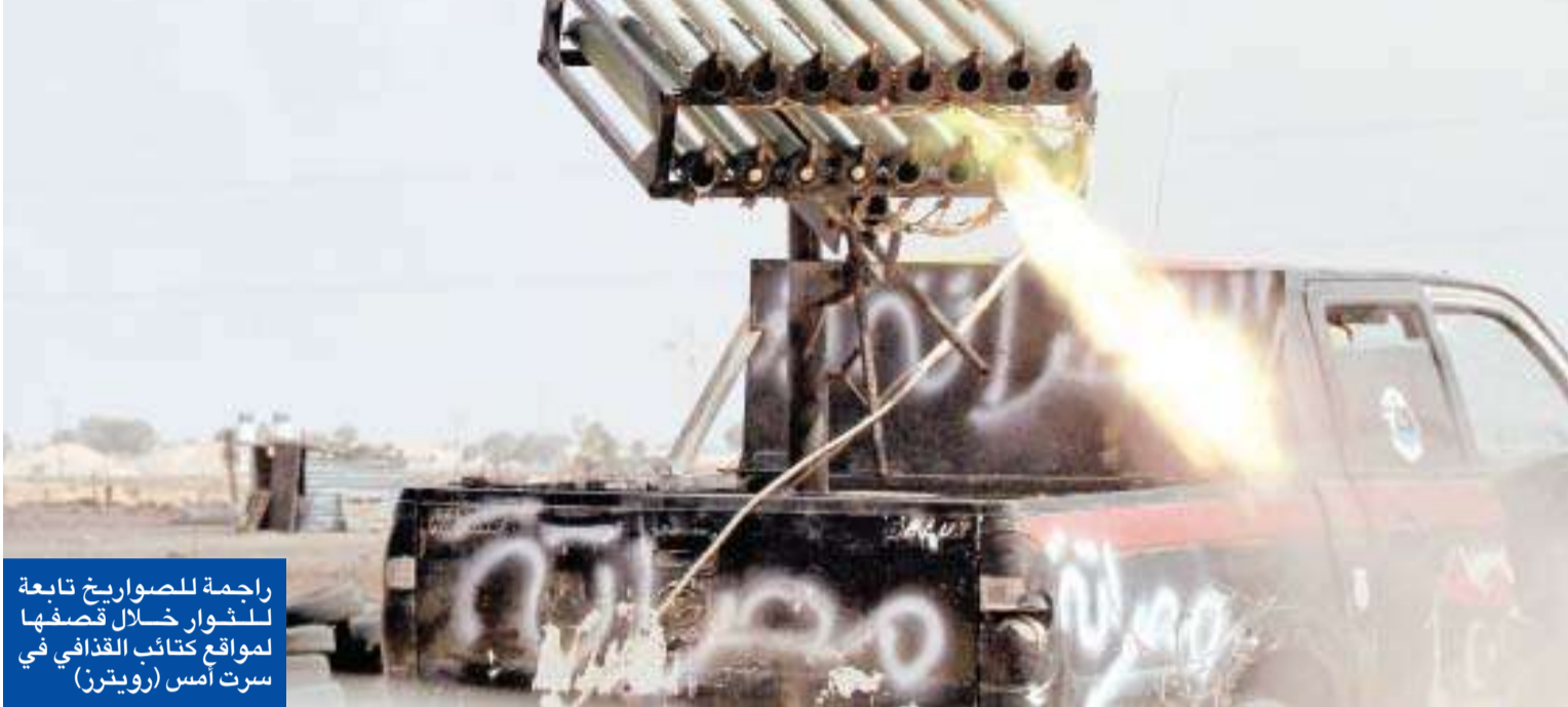
راجمة للصواريخ تابعة لثوار خلال قصفها لمواقع كتائب القذافي في سرت

الثوار يقبضون على «صحاف ليبيا»... ومقتل قائدهم في بني وليد