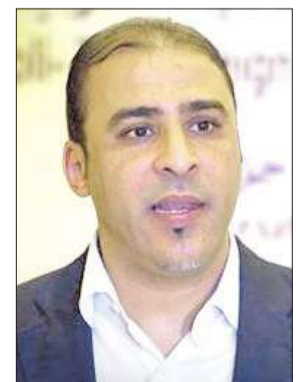
موسى إبراهيم (أرشيف)

بعد أن اشتهر بتصريحاته الشبيهة بتصريحات وزير إعلام صدام حسين، محمد سعيد الصحاف، يبدو أن المتحدث الرسمي باسم النظام الليبي السابق موسى إبراهيم أصبح في قبضة الثوار، بحسب ما أفاد أحمد الترهوني، أحد القادة الميدانيين للثوار أمس. وقال الترهوني إنه تلقى اتصالاً هاتفياً من نوار مصراتة المرابطين على تخوم مدينة سرت، أكدوا فيه أنهم القوا القبض على إبراهيم خلال محاولته الخروج من سرت متنكراً أثناء عملية إجلاء سكان المدينة لحمايتهم من العمليات العسكرية الجارية فيها. ولفت إلى أنه تم نقل إبراهيم إلى مدينة مصراتة فور القبض عليه في ساعة متأخرة من مساء أمس الأول. من جهة أخرى، عثر في طرابلس أمس، على مقبرة جماعية في الغابة الملحقة ببنفق «ريكسوس» الذي كان يقم فيه الصحافيون الأجانب قبل سقوط العاصمة في أيدي الثوار.