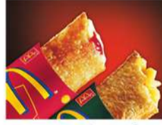
أبل باي (فطيرة تفاح) فطير الفراولة بالكاسترد