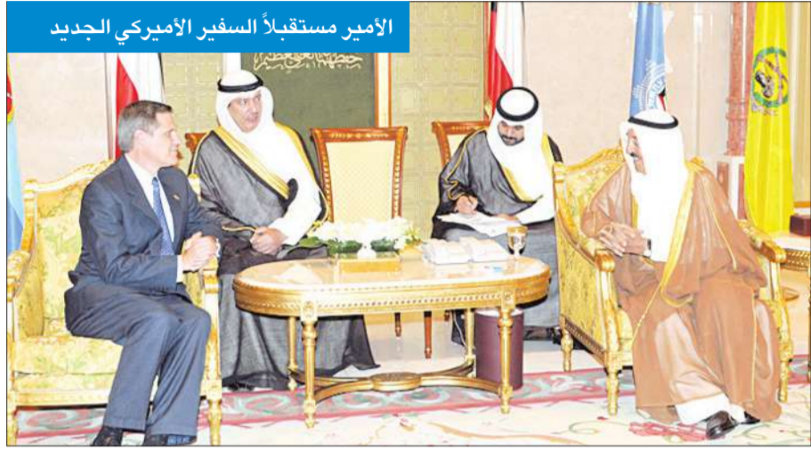
الأمير مستقبلاً السفير الأميركي الجديد

الاميرية الشيخ خالد العبدالله الصباح الناصر الصباح ومدير ادارة المراسم بوزارة الخارجية السفير ضاري الحجران ورئيس هيئة الحرس الاميري اللواء ركن طلال المسلم.