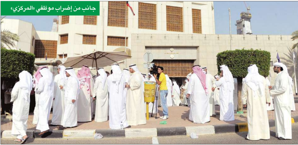
جانب من إضراب موظفي «المركزي»

بعد الزيادات التي طالت جميع قطاعات الدولة في الآونة الأخيرة، في حين أن موظفي البنك المركزي يعانون تردداً في الأوضاع بسبب الإخلاء التي تم اكتشافها عند تطبيق الكادر في 1/1/2007 وعدم اهتمام الإدارة العليا بإصلاحها، وفي ظل الارتفاع الملحوظ في أسعار السلع والخدمات خلال السنوات الأربع الأخيرة، فضلاً