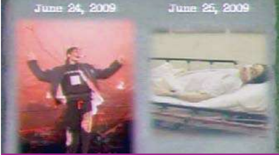
صورة عرضها الادعاء في المحكمة تظهر كيف كان مايكل جاكسون أثناء التمارين الغنائية قبل يوم واحد فقط من وفاته

الادعاء وجه إليه تهمة القتل غير العمد وارتكاب «أخطاء فادحة»