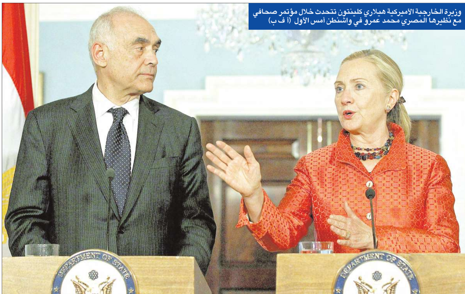
وزيرة الخارجية الأميركية هيلاري كلينتون تتحدث خلال مؤتمر صحفي مع نظيرها المصري محمد عمرو في واشنطن أمس الأول

«الجبهة السلفية» و«الائتلاف الحر» يخالفان الإسلاميين مجدداً ويشاركان في التظاهرات