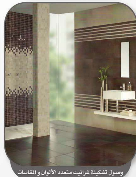
وصول تشكيلة غرايت متعددة الألوان والمقاسات