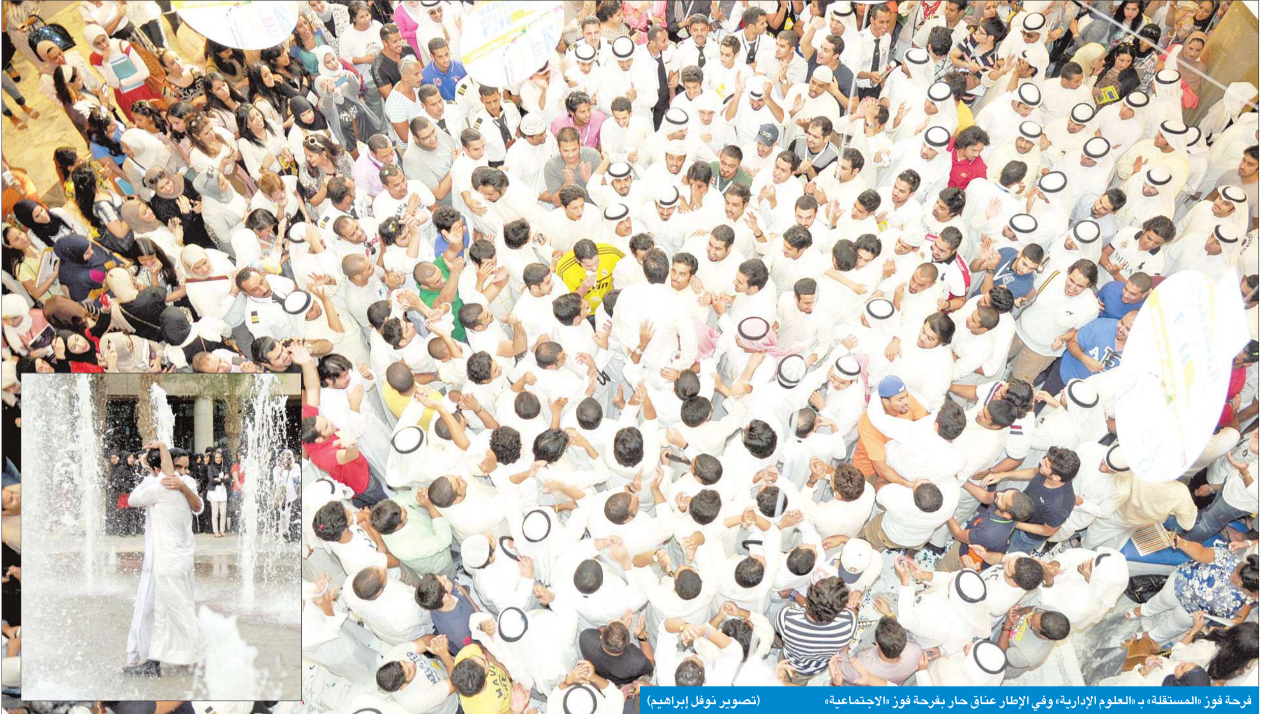
فرحة فوز «المستقلة» بـ العلوم الإدارية، وفي الإطار عناق حار بفرحة فوز «الاجتماعية»