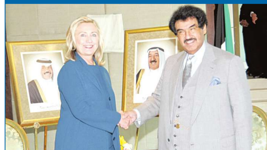
استقبل رئيس الوزراء سمو الشيخ ناصر المحمد في مقر إقامته في واشنطن أمس وزيرة الخارجية الأميركية هيلاري كلينتون. وتم خلال اللقاء بحث العلاقات الثنائية وسبل تعزيزها، إضافة إلى آخر المستجدات الإقليمية والعربية والدولية.