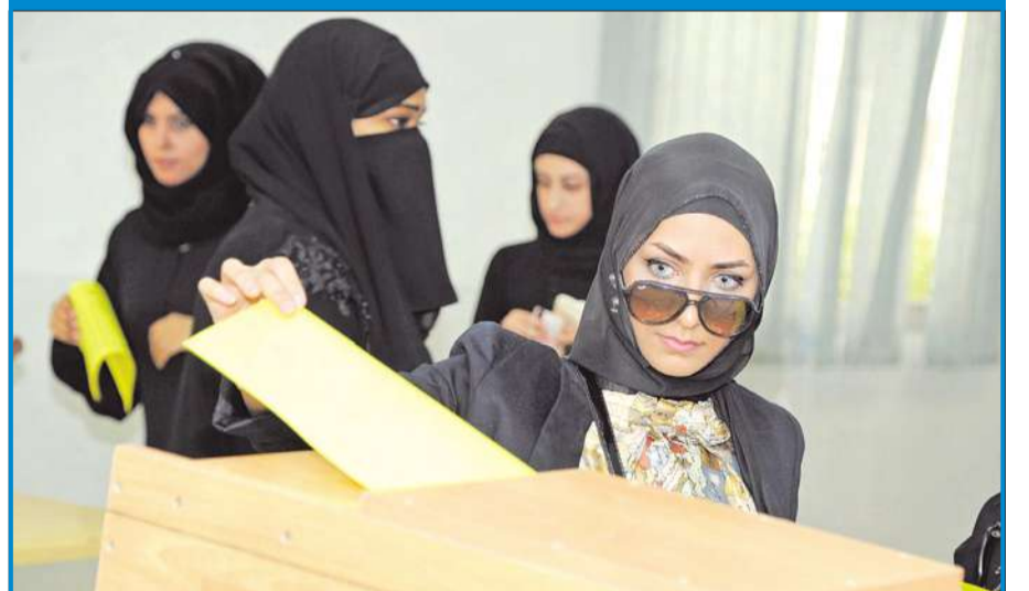
طالبة تدلي بصوتها في كلية الهندسة والبتترول