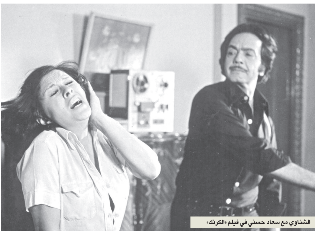
الشناوي مع سعاد حسني في فيلم «الكرنك»