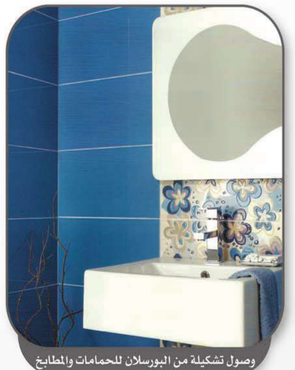
وصول تشكيلة من الجورسلان للحمامات والمطابخ