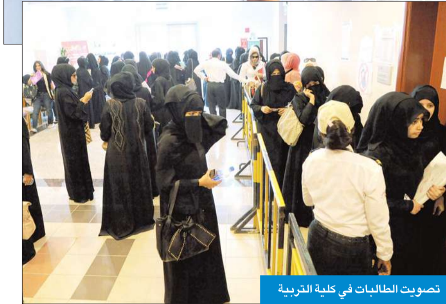
تصويت الطالبات في كلية التربية