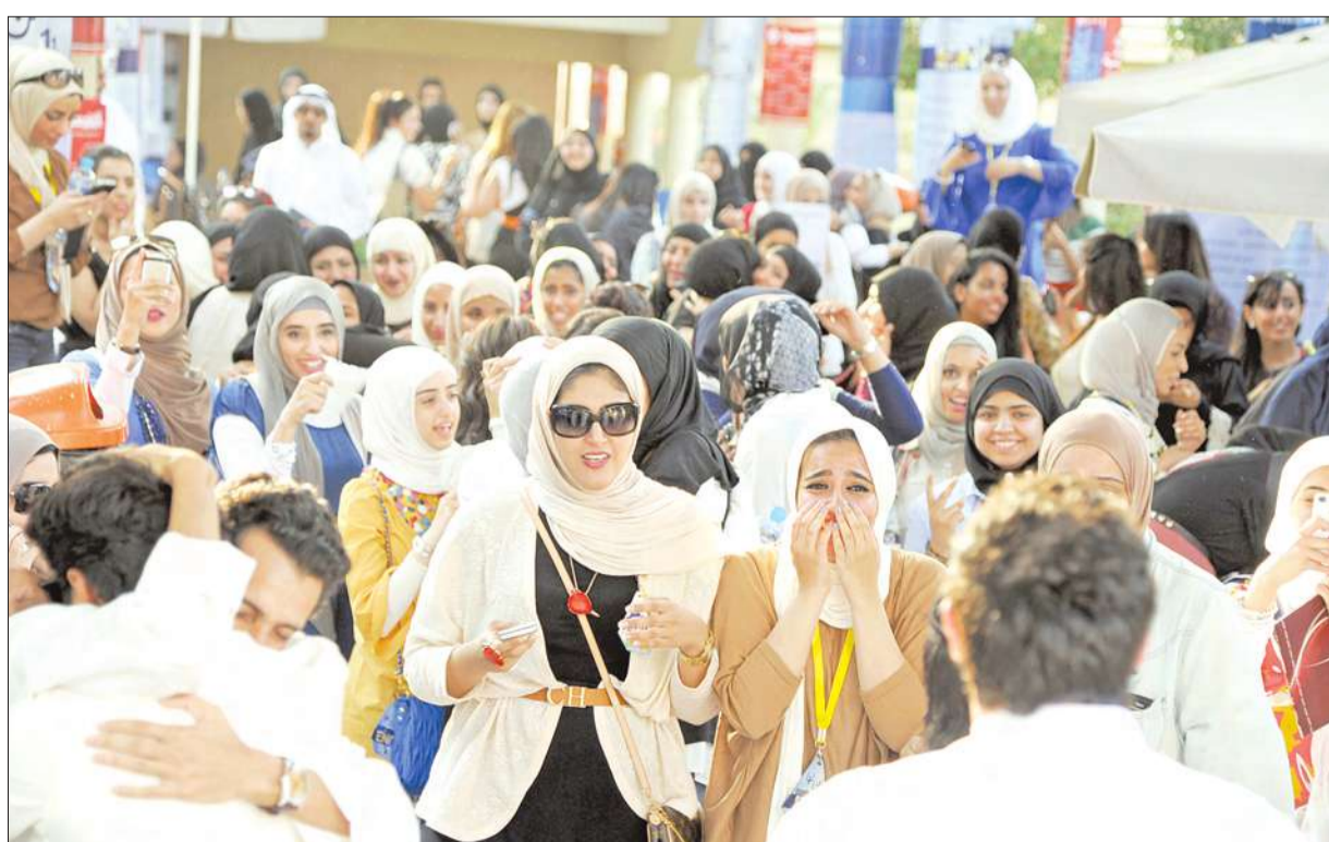
دموع الفرحة من الطالبات بفوز «المستقلة»