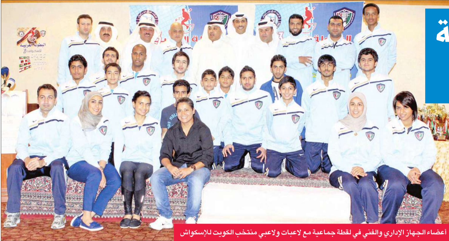
أعضاء الجهاز الإداري والفني في لقطة جماعية مع لاعبات ولعبي منتخب الكويت للإسكواش

توجت الكويت بلقب البطولة العربية الثالثة والعشرين للإسكواش بعد إحراز لقي "الفردى والفرق" في مرحلة السن العام والفردى في مرحلة الناشئين.