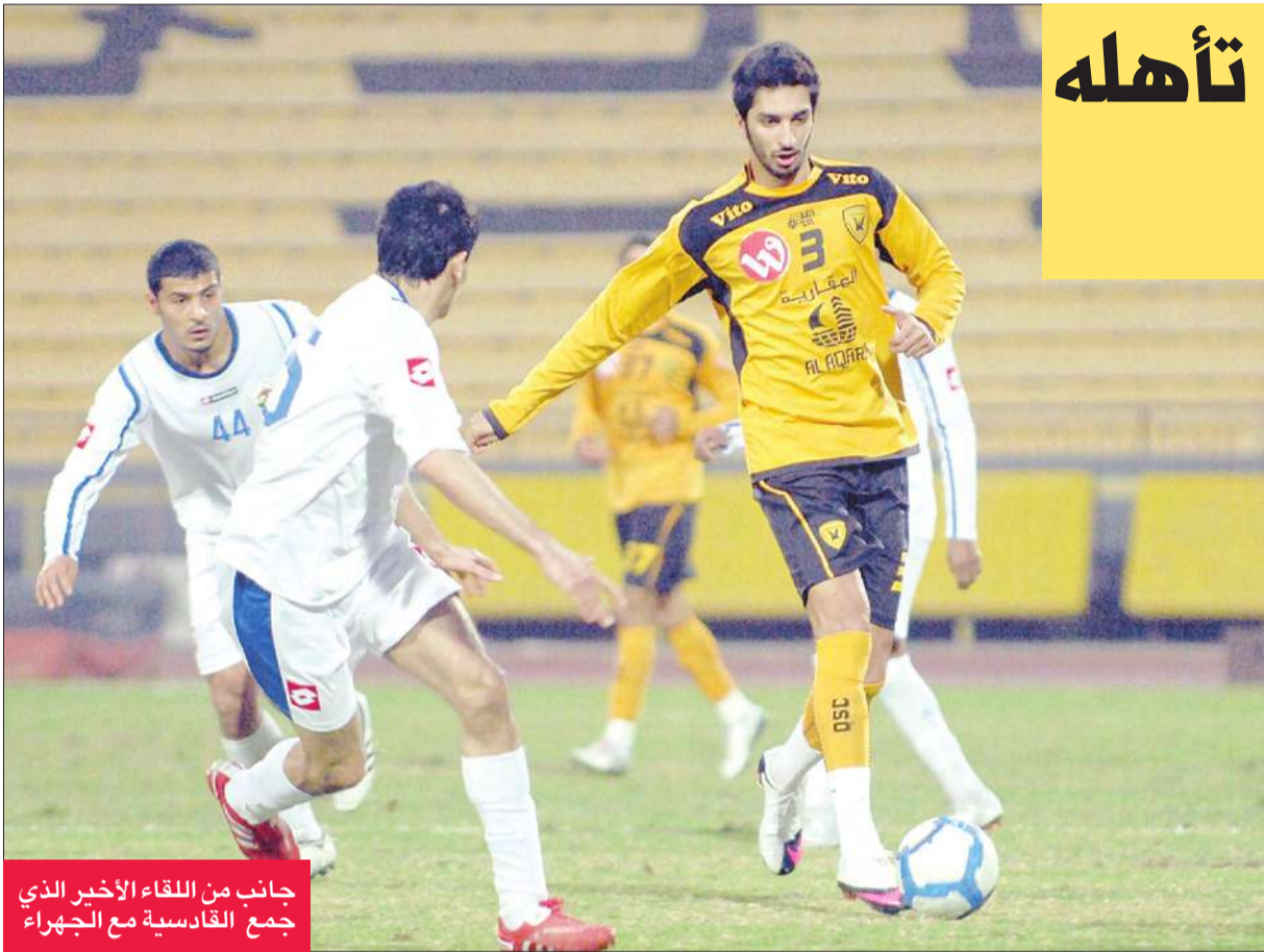
جانب من اللقاء الأخير الذي جمع القادسية مع الجهراء

تقام اليوم ثلاث مباريات في الجولة السادسة قبل الأخيرة من منافسات المجموعتين الأولى والثانية، ضمن بطولة كأس ولي العهد في كرة القدم.