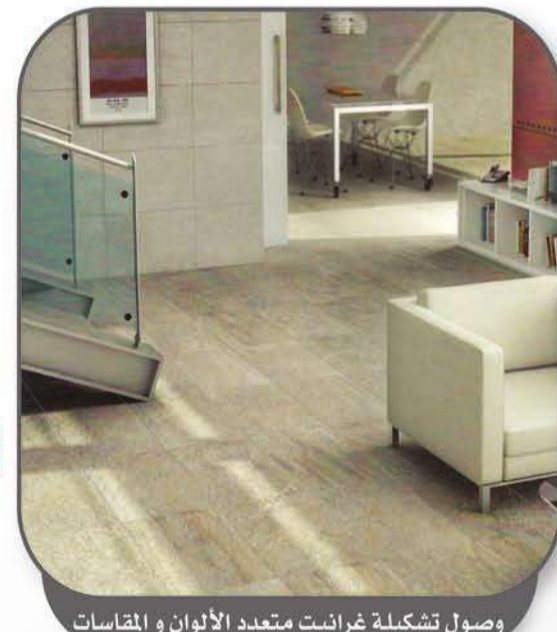
وصول تشكيلة غرايت متعددة الألوان والمقاسات