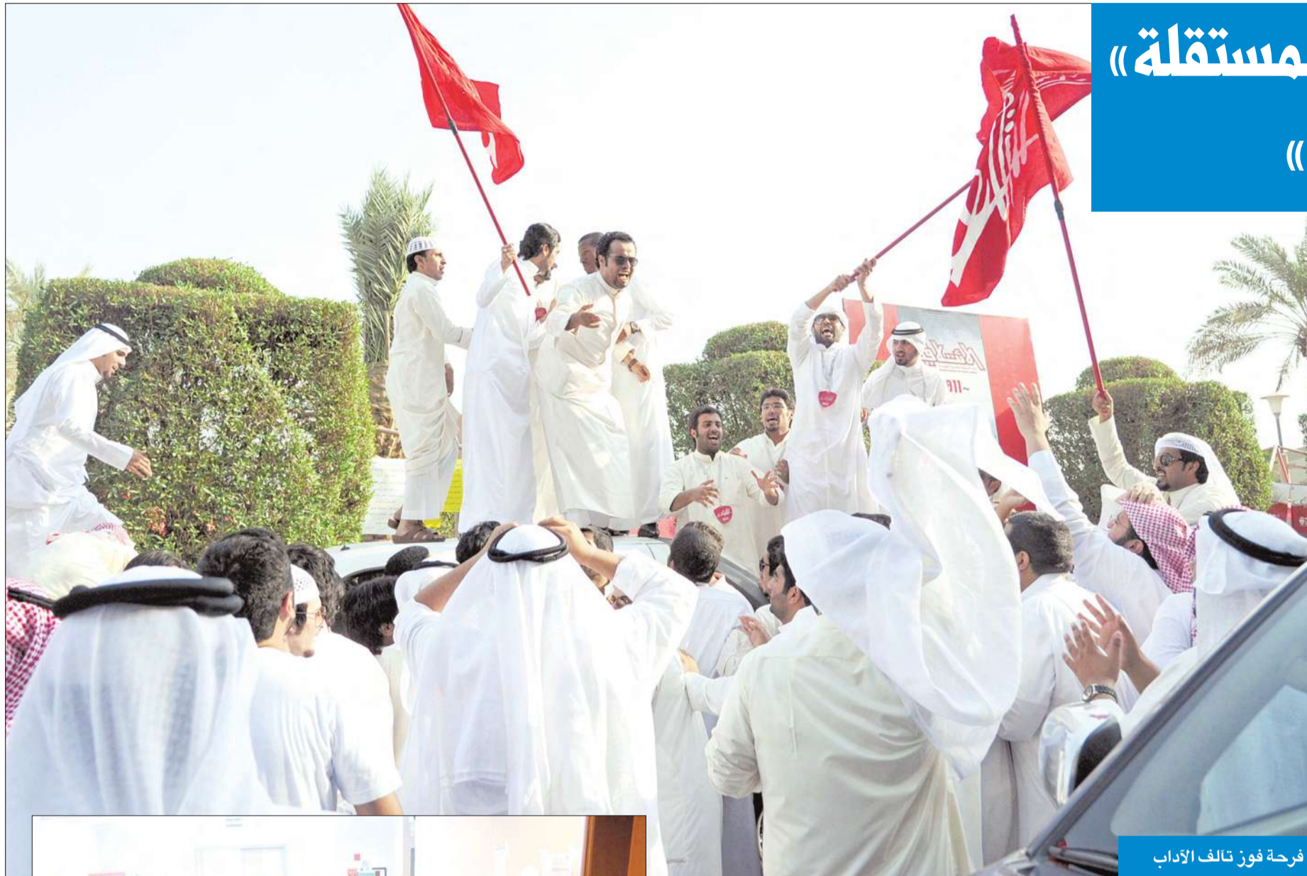
فرحة فوز تآلف الآداب

الاقتراع العام الماضي 54.5% فقد كانت نسبة الاقتراع امس بنسبة 30% فقط. جدير بالذكر ان القائمة التربوية انخفضت بشكل كبير عن العام الماضي بفارق 574 بعد ان حصلت العام الماضي على 1253 صوتا، وعلى الرغم من انخفاض مستقلة التربية عن نظيرتها التربوية الا ان الفارق كان بسيطاً جداً فقد حصلت العام الماضي على 739 اي بفارق 68.