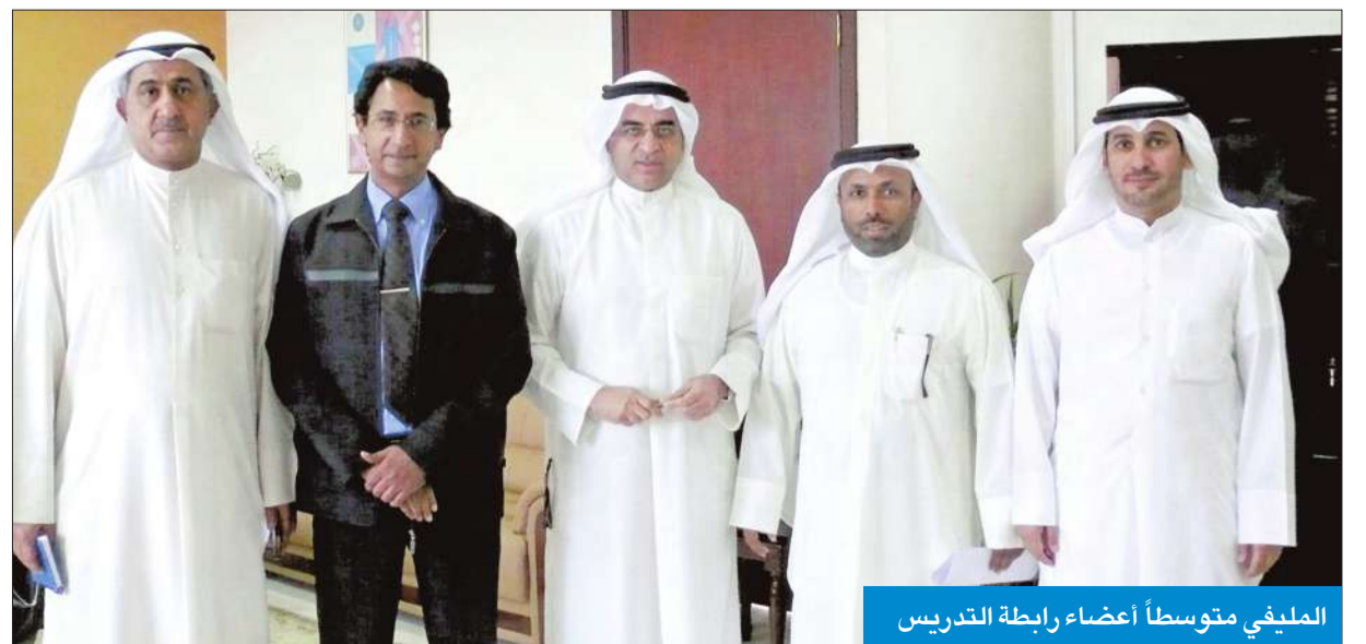
المليفي متوسلاً أعضاء رابطة التدريس

وفي ختام تصريحه أكد د.العجمي أن رفض الساعات الزائدة مستمر لحين صدور قرار حاسم ونهائي يحقق مطالب الرابطة، وذكر أن وفد الطلاب توجه بعد خروجه من مكتب وزير التربية إلى مجلس الأمة للقاء رئيس اللجنة التعليمية د.جمعان الحريش لمناقشة آخر المستجدات حول مطالب الرابطة.