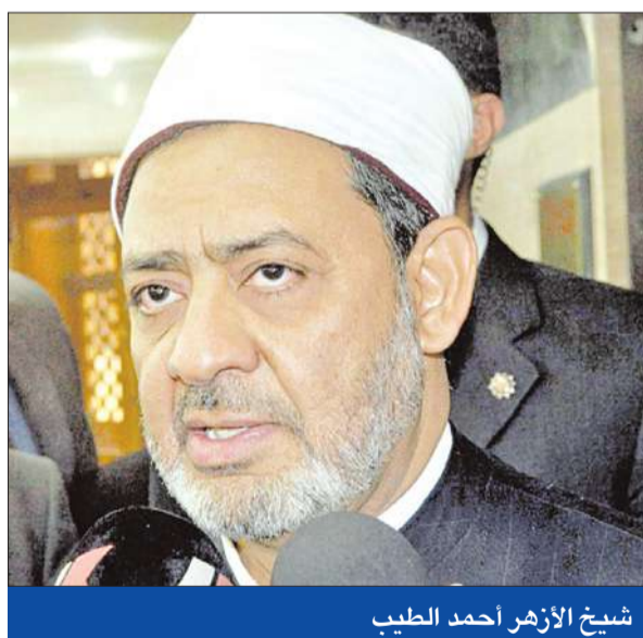
شيخ الأزهر أحمد الطيب

الطيب يحذر باستخدام «خيارات» أخرى لـ«الدفاع عن أهل السنة والجماعة»