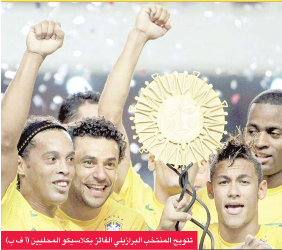
تتويج المنتخب البرازيلي الفائز بكلاسيكو المحليين (أ ب ف)

50 متراً وتسجيل هدف السبق (53)، قبل أن يضم مهاجم سانتوس نيمار النتيجة من مسافة قريبة (75). وحمل رونالدنيو لاعب فلانغوو شارة القائد مع المنتخب البرازيلي. وفضل رونالدنيو في هز الشباك مع الفريق البرازيلي بعد أربعة أعوام من الغياب، ولكنه في النهاية رفع كأس البطولة، بعد أن حقق أول لقب له منذ الفوز بلقب كأس القارات بالمانيا في 2005. (أ ب ف)