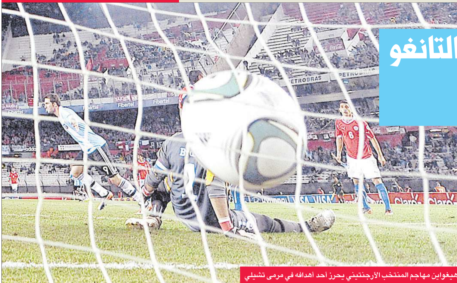
هيوغواين مهاجم المنتخب الأرجنتيني يحرز أحد أهدافه في مرمى تشيلي