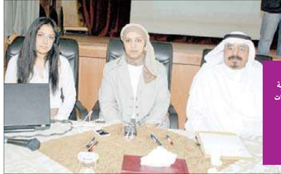
القائمون على المسابقة

تحت رعاية سمو الشيخ ناصر المحمد رئيس مجلس الوزراء، تنطلق مسابقة فادية السعد الصباح العلمية الثانية عشرة 2011-2012 لطالبات المرحلة الثانوية في التعليم العام، تحت شعار 'ابتكار'، تنفيذاً لاتفاقية التعاون العلمي قبل عامين بين وزارة التربية ومسابقة فادية السعد الصباح العلمية وذلك بمشاركة طالبات مدارس دول مجلس التعاون لدول الخليج العربية، للتنافس في مجالات العلوم، والفيزياء التطبيقية، والتكنولوجيا وعلوم الهندسة. وبهذه المناسبة نظم القائمون على المسابقة زيارات تعريفية لمدارس الثانوية في مختلف المحافظات بالكويت تضمنت شرحاً وافياً لآليات وأهداف المسابقة.