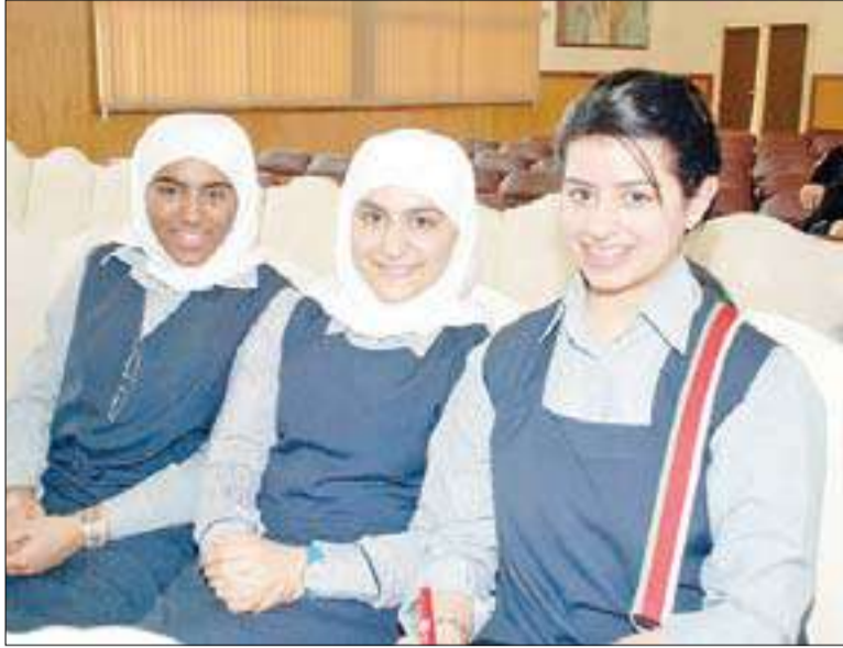
بعض الطالبات المشاركات في اللقاء

تحت رعاية سمو الشيخ ناصر المحمد رئيس مجلس الوزراء، تنطلق مسابقة فادية السعد الصباح العلمية الثانية عشرة 2011-2012 لطالبات المرحلة الثانوية في التعليم العام، تحت شعار 'ابتكار'، تنفيذاً لاتفاقية التعاون العلمي قبل عامين بين وزارة التربية ومسابقة فادية السعد الصباح العلمية وذلك بمشاركة طالبات مدارس دول مجلس التعاون لدول الخليج العربية، للتنافس في مجالات العلوم، والفيزياء التطبيقية، والتكنولوجيا وعلوم الهندسة. وبهذه المناسبة نظم القائمون على المسابقة زيارات تعريفية لمدارس الثانوية في مختلف المحافظات بالكويت تضمنت شرحاً وافياً لآليات وأهداف المسابقة.