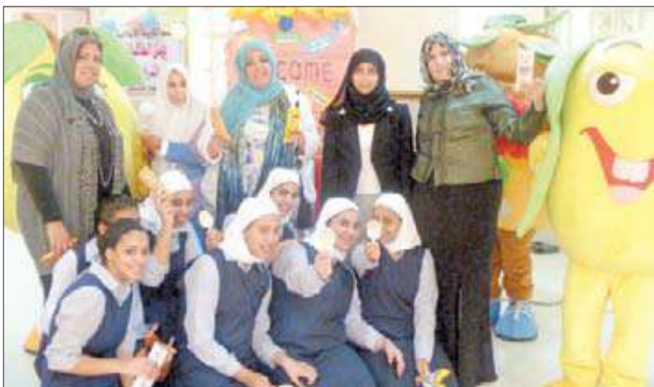
مجموعة من الطالبات مع معلمتهن