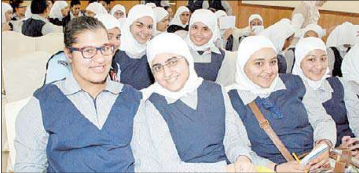
حضور كبير من الطالبات المشاركات