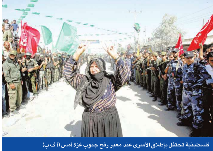
فلسطينية تحتفل بإطلاق الأسرى عند معبر رفح جنوب غزة أمس