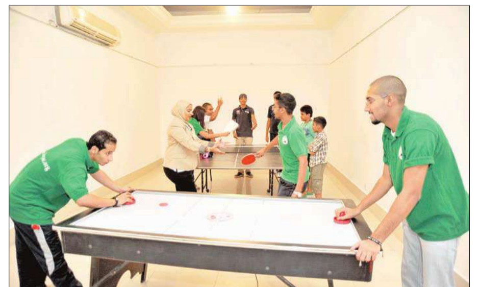
دورة تنس طاولة