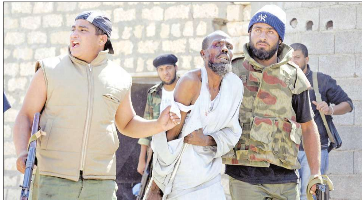
مقاتلان من المجلس الانتقالي يرافقان أحد مقاتلي القذافي وهو يعاني جروحاً خلال القتال في سرت أمس (أ ب)

في أعقاب الإعلان عن تحرير بني وليد بالكامل من قبضة المقاتلين المواليين للعقيد الليبي الهارب معمر القذافي، عادت الأضواء إلى مدينة سرت، حيث جرت معارك كثيفة بالمدفعية الثقيلة والصواريخ أمس، أحر مقل أنصار النظام السابق. وشارك مئات المقاتلين في المعارك الدائرة في حيي «الدولاب» و « الرقم 2 » اللذين يتحصن فيهما مقاتلو «الكتائب»، بهدف السيطرة عليهما، وليمكن إعلان سقوط المدينة وبالتالي التحرير الكامل لليبي.