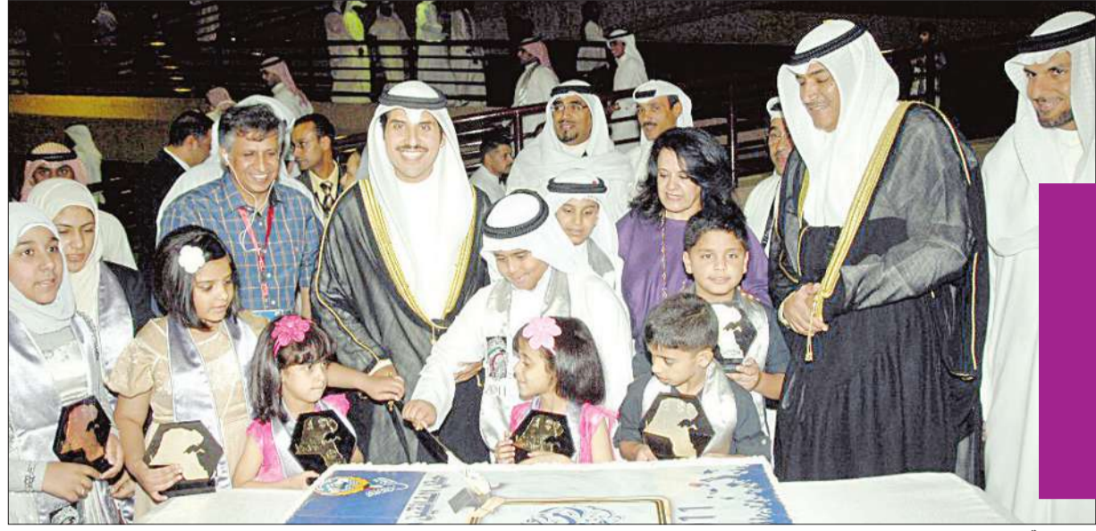
قطع كتيبة الحفل

أقام مكتب الشهيد حفل تكريم الطلبة الفائزين من أبناء الشهداء للعام الدراسي 2010-2011 برعاية وزير شؤون الديوان الأميري الشيخ ناصر الصباح، الذي أناب وكيل الديوان الأميري لشؤون الأسرة الحاكمة الشيخ صباح الناصر لحضور الحفل.