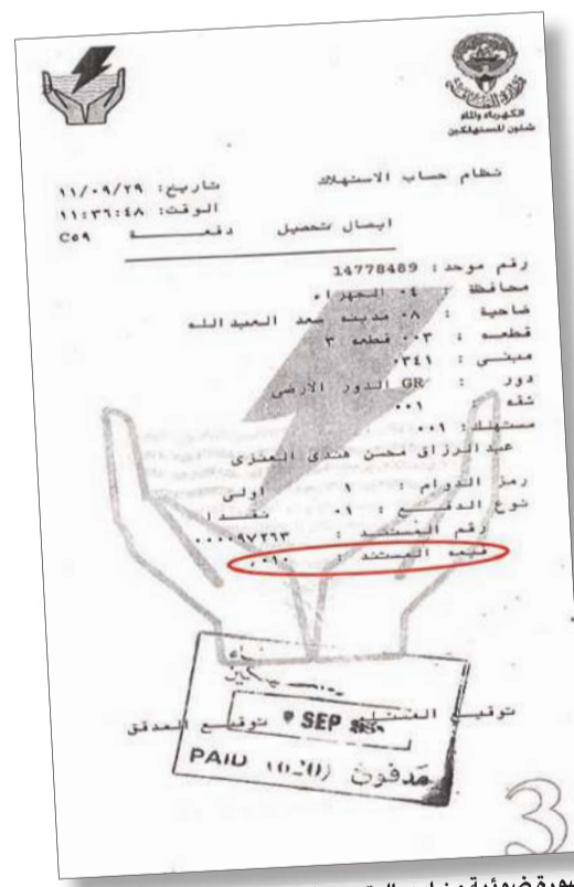
صورة ضوئية من إيصال تحصيل الفلوس العشرة