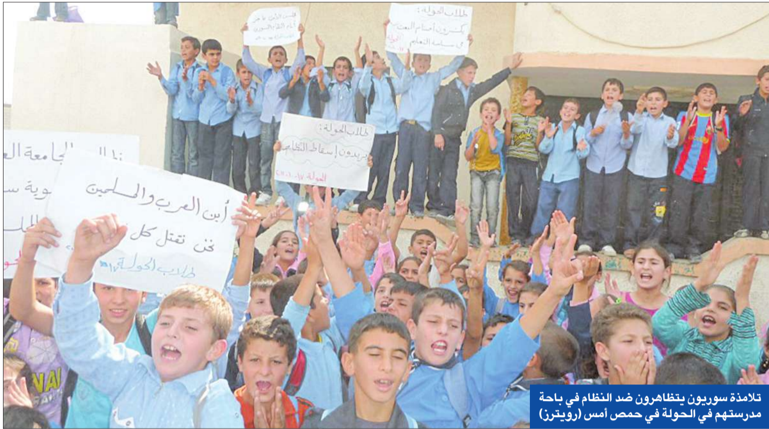
تلامذة سوريون يتظاهرون ضد النظام في باحة مدرستهم في الحولة في حمص أمس

«هيئة التنسيق» ترحب بقرارات الجامعة العربية... وأكراذ يطالبون لندن بدعم قيام «سورية فدرالية»