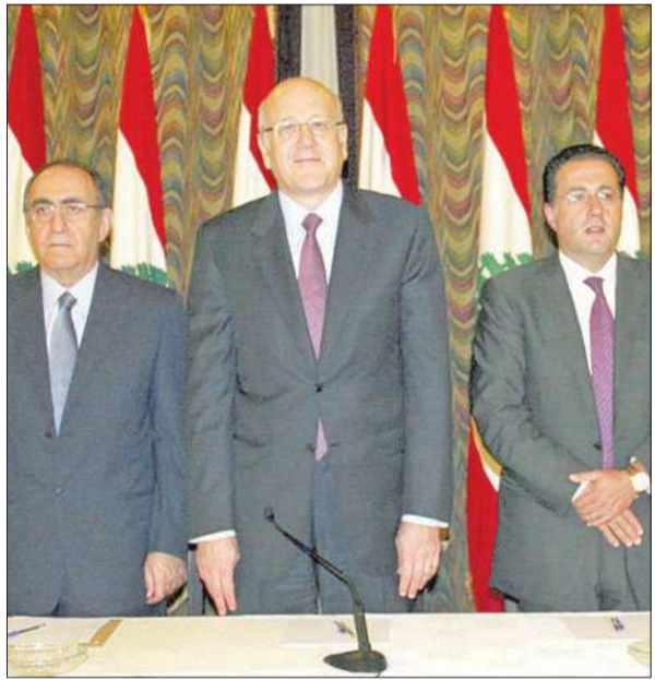
مقباتي خلال افتتاح مؤتمر اقتصادي إقليمي في بيروت أمس (اللاتي ونهرا)

انطلق أمس الأول، مع طلب قاضي الإجراءات التمهيدية دانيال فرانسيس إلى غرفة الدرجة الأولى، الفصل في جواز الشروع في إجراءات المحاكمة غيابياً في قضية الاغتصاب. في موازاة ذلك، أشاد وزير الأشغال العامة والنقل غازي العريضي أمس بإجراءات فرع المعلومات وبضحايا عناصره، مشدداً على «عدم جواز أن تضع هذه التصريحات باللحية السياسية الداخلية، أو أن يصوب على هذا الفرع من أجل مكتسبات سياسية لا توازي تضحيات هؤلاء الشبان». ونوه العريضي بعدما قدم وإجاب التعزية في بلدة الفرزل بالبقاء الأوسط باستشهاد الرقيب في فرع «المعلومات» في قوى الأمن الداخلي الياس نصرالله أمس، «بإجراءات الفرع على المستويين الداخلي والخارجي»، فلفت إلى أن «فرع المعلومات وضع يده على ملفات كانت تريد العبث بالأمن السوري الداخلي، وكشف الدور الإسرائيلي في شبكة الاتصالات، كما وضع يده على معلومات أساسية ومخبرات كانت تتجاهلها مؤسسات إعلامية وفلسطينية». مؤكداً أنه «لا يجوز إذا كان هناك أي انزعاج أن يشار إلى فرع المعلومات أو جهاز الأمن العام أو أمن الدولة، أو أن يؤدي إلى تأخير ترقيبة ضابط في هذا الفرع أو ذاك الجهاز».