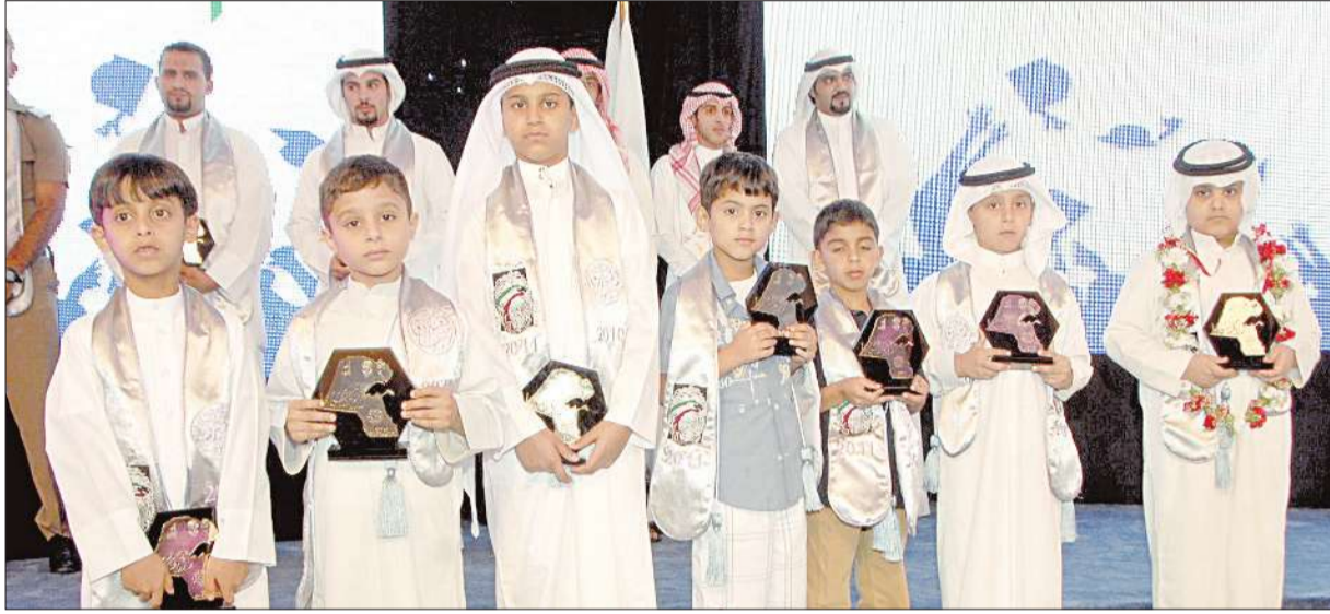
مجموعة من الطلبة الفائزين