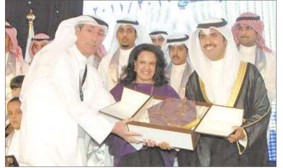
تقديم درع تذكارية