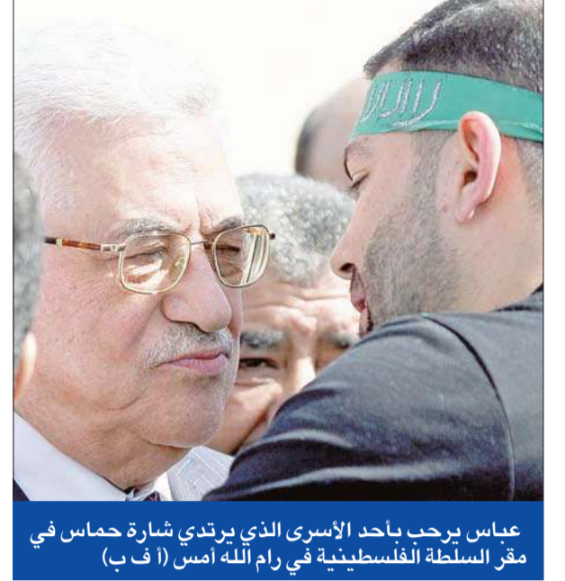
عباس يرحب بأحد الأسرى الذي يرتدي شارة حماس في مقر السلطة الفلسطينية في رام الله أمس

غزة - سمية درويش، رفح - محمود علي ومصطفى سنجر