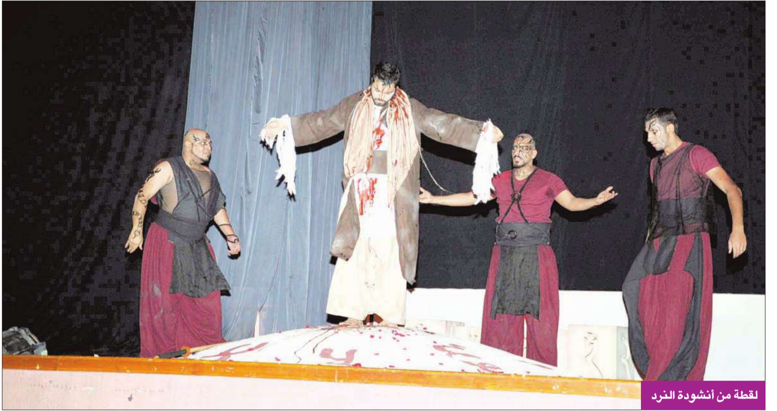
لقطة من أنشودة النرد

قدم رسالة يحذر فيها من نار الفتنة الطائفية