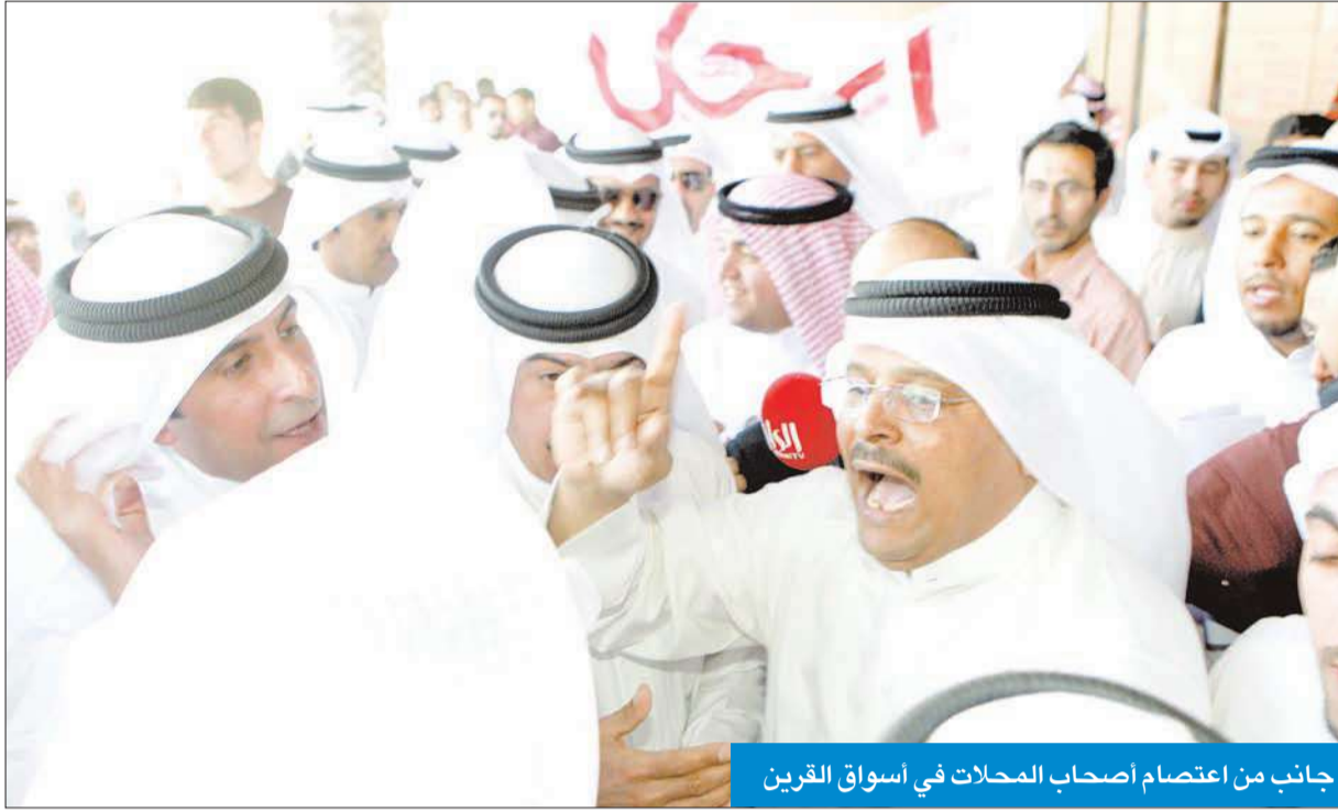
جانب من اعتصام أصحاب المحلات في أسواق القرين

مشيراً إلى تضخم حجم المصائب التي تسفر عن نهج وسياسة البلدية، قائلاً: "نحن لا نلوم وزير البلدية وإنما نلوم رئيس مجلس الوزراء على استمرارية إبقاء الوزير لما يتخذه من قرارات تضر بالمواطنين والمستثمر الأجنبي الذي جاء لرفع اقتصاد البلد، مختتماً بالقول: "يا رئيس مجلس الوزراء قم بدورك واستبعد وزير البلدية".