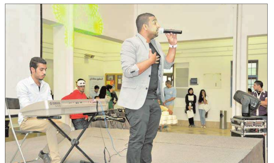
عبدالله الشامي يغني