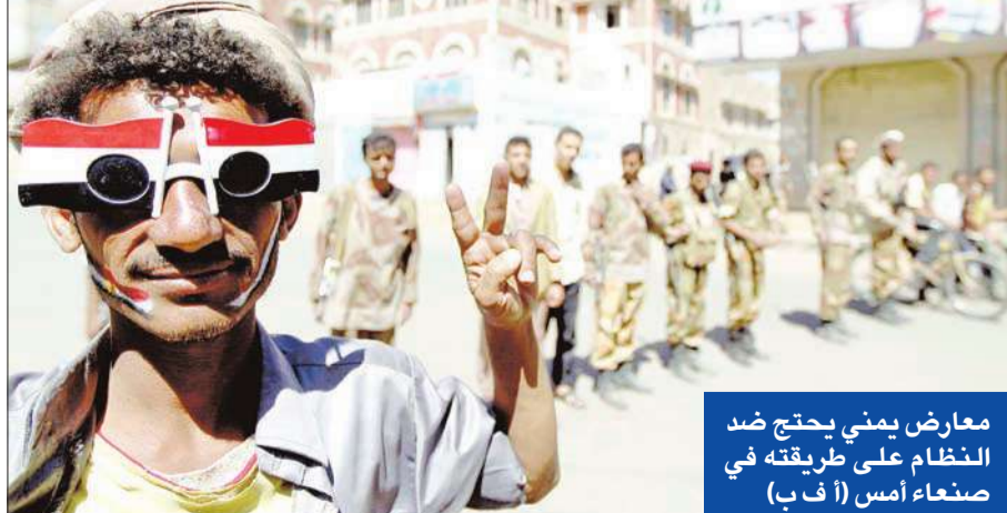
معارض يميني يحتج ضد النظام على طريقته في صنعاء أمس

الأمم المتحدة تدين المجازر ضد المتظاهرين المسالمين في اليمن