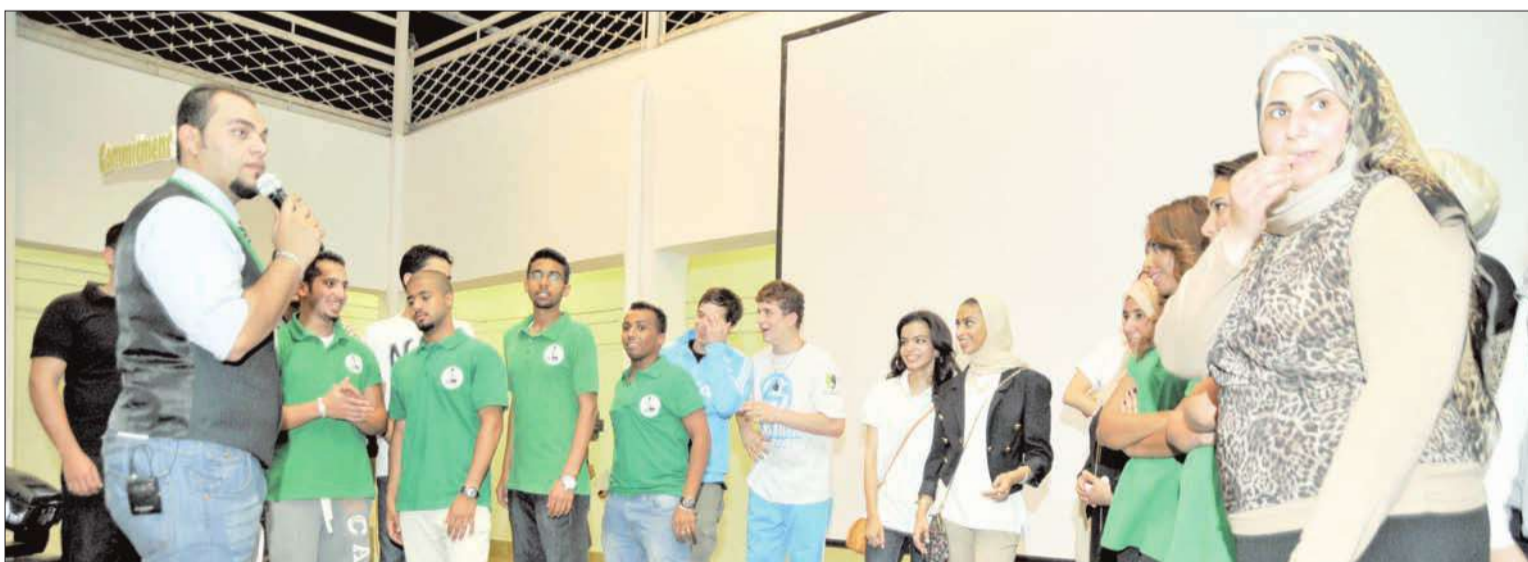
جانب من المسابقات