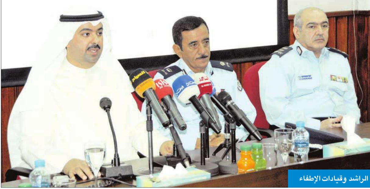
الراشد وقيادات الإطفاء

التجاوزات التي حدثت ولا نقلها، لافتاً إلى أنه جرت إحالة البعض إلى جهات الاختصاص.