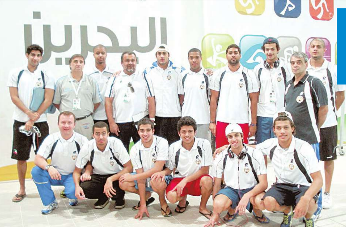
وفد منتخب السباحة

سيصبح المغرب أول دولة أفريقية وثاني دولة عربية تستضيف كأس العالم للأندية، بعد انسحاب منافسيه على شرف احتضان سنتي 2013 و2014. وكشفت الاتحاد الدولي لكرة القدم (فيفا) أن المغرب هو المرشح الوحيد الذي قدم طلبه قبل انتهاء المهلة النهائية يوم السبت الماضي، بعد أن أعلنت كل من إيران وجنوب أفريقيا والامارات نتيتها خوض السباق لاستضافة هذا الحدث الذي تنظمه اليابان في 2012. ويذكر أن نسخة 2011 ستقام بين 8 و18 ديسمبر المقبل، وقد حسمت هوية ممثلي أوروبا (برشلونة) وأميركا الجنوبية (سانتوس البرازيلي) والكونكاكاف (مونتيري المكسيكي) واقيانوسيا (ولاند سيتي النيوزيلندي) على أن تحسم هوية بطلي أفريقيا وآسيا وممثل البلد المضيف في الأسابيع المقبلة.