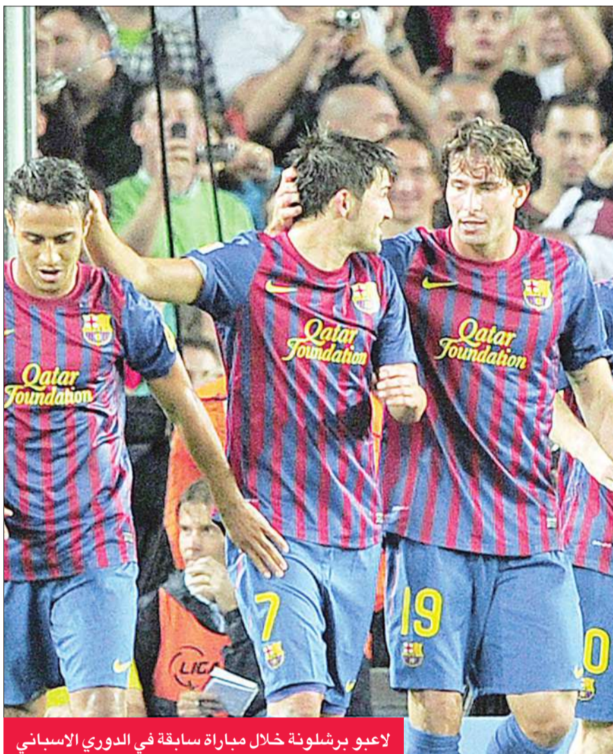
لاعبو برشلونة خلال مباراة سابقة في الدوري الإسباني

يسعى برشلونة إلى تدعيم وضعه في صدارة المجموعة الثامنة ببطولة دوري أبطال أوروبا، من خلال تحقيق الفوز على ضيفه فيكتوريا بلسن اليوم.