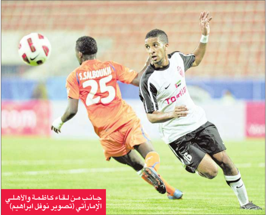
جانب من لقاء كاظمة والأهلي الإماراتي