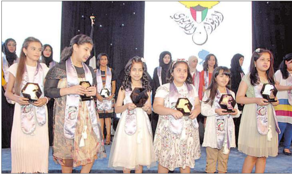
مجموعة من الطالبات الفائزات