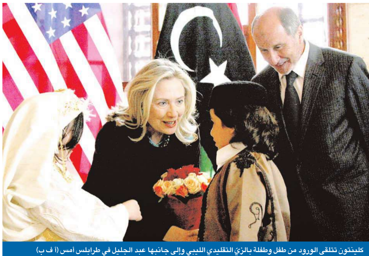
كلينتون تتلقى الورد من طفل وطفلة بالزّي التقليدي الليبي وإلى جانبها عبد الجليل في طرابلس أمس

على وقع القتال العنيف المستمر في سرت لتحريرها من قبضة كتائب العقيد الهارب معمر القذافي التي تقاثل دفاعاً عن آخر معاقلها على الأراضي الليبية، وصلت وزيرة الخارجية الأميركية هيلاري كلينتون إلى طرابلس أمس، في زيارة مفاجئة، عبرت خلالها عن أملها أن يتم قتل الزعيم المخلوع أو وقوعه في الأسر قريباً. وحيث كلينتون «انتصار ليبيا»، مشددة