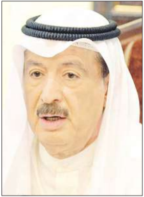
عبد الوهاب الهارون

المؤسسات الحكومية بشكل عام والأكاديمية بشكل خاص أسوة بالدول الأخرى. وفي ما يخص مقومات الاقتصاد المعرفي قال الهارون: «إنه في المقوم الأول لابد أن تكون هناك إعادة نظر في الجانب التشريعي ليعطي مجالاً أوسع للإعطاء الخاص، وهذا ما عملت عليه في الفترة الأخيرة في مجلس الوزراء بمجموعة من القوانين والقرارات لإعطاء القطاع الخاص الدور الأكبر لقيادة الاقتصاد، أما المقوم الثاني فيتطرق إلى جودة التعليم، والمقوم الثالث بأن يكون لدينا مجتمع قائم على المعرفة، لأنه الركيزة الأساسية، وهذا ما سعت إليه الدول التي اتخذت استراتيجيات بتحويل الاقتصاد القائم على المعرفة». وأوضح أن الجائزة هدفها تصليب هذا الفكر في الكويت بالتعاون مع مجلس التعاون الخليجي، مشيراً إلى أن الجائزة تعتبر ضمن إطار الخطة التنموية للكويت وهي مفتوحة لداخل الكويت وخارجها، وأشار إلى أن إطلاق هذا المشروع الواعد اقتصادياً جاء عن طريق بوابة جامعة الكويت في كلية العلوم الإدارية، لأنها المعنية لكونها متخصصة في هذا المجال، وهذه الجائزة من هذه الكلية لعلاقتها المرتبطة بقضايا التنمية في الكويت.