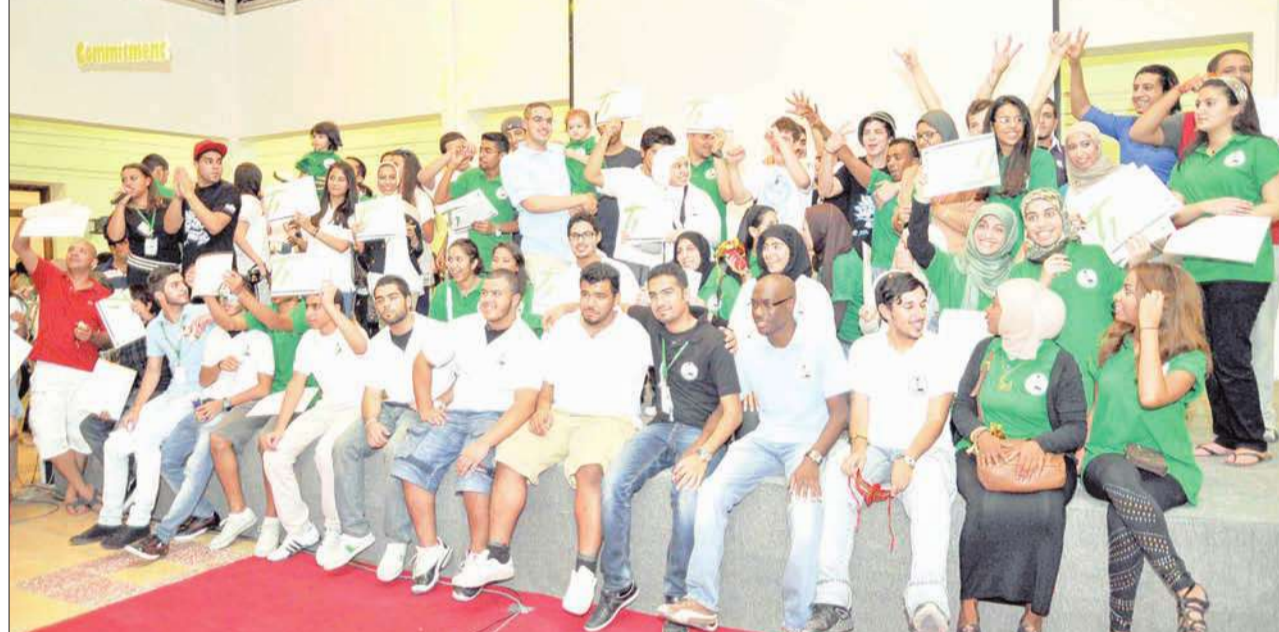
المشاركون يحملون الشهادات