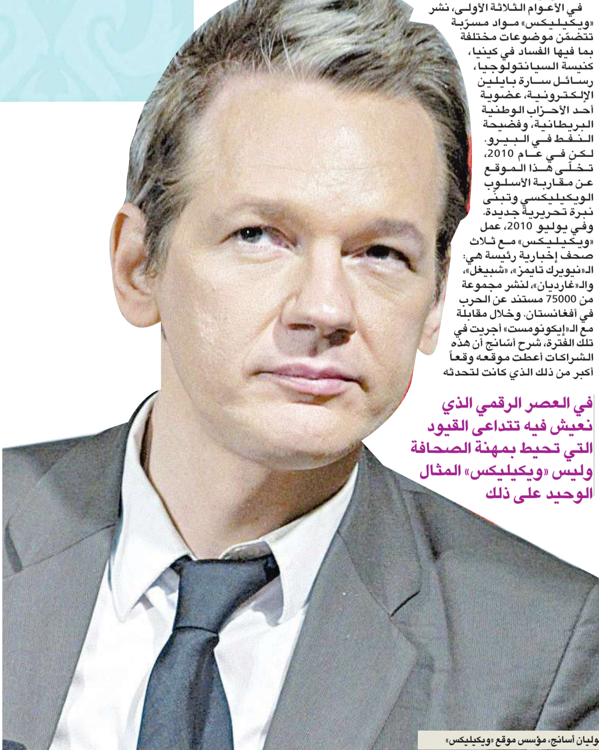
جوليان أسانج، مؤسس موقع «ويكيليكس»

في هذا الإطار، تعطي إيلين ميلير، المؤسسة المشاركة لـSunlight