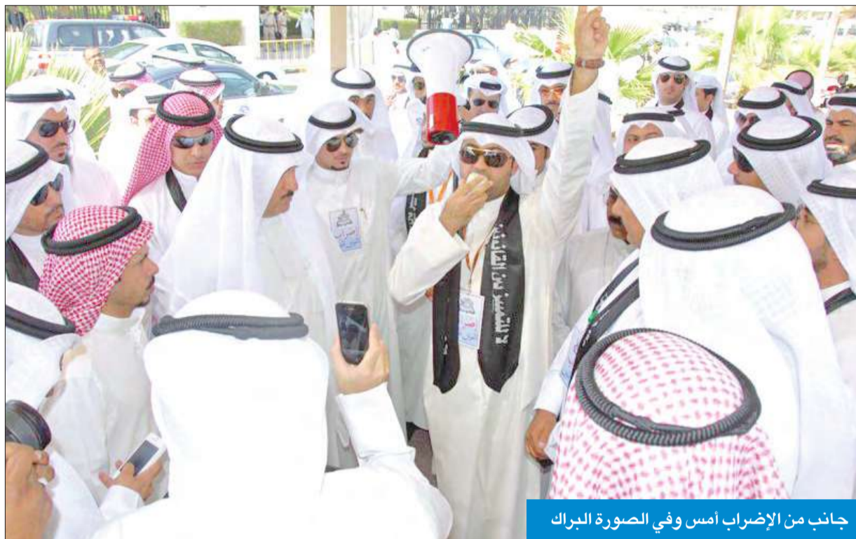
جانب من الإضراب أمس وفي الصورة البراك

الطاحوس: إن حكومتنا الرشيدة زرعت الريح، فحصدت عاصفة قوية من الإضرابات والاعتصامات، ضربت وأصرت وجعلتها ترفج كاوراق الخريف، وأظهرت تخبطها وفشلها في إدارة الأزمات، إضافة إلى أنها أضاعت ما كان متبقياً في مصداقيتها، مؤكداً أن الحكومة غير قادرة على إدارة البلد، أو قراءة مطالب الطبقة العاملة. وأشار الطاحوس إلى أن القانونيين سلكوا الطرق القانونية والمشروعة كافة لتحقيق مطالبهم، لكن مساعيهم جاءت بخيبة أصل حكومية معنادة، ثقف على بعد واحد من الكل سبنيهم موجة الإضرابات والاعتصامات، ويحقق مبادئ العدل والمساواة وتكافؤ الفرص، مؤكداً أن الشعب الكويتي يدفع اليوم ثمن التخبط الحكومي والتخرد في اتخاذ العديد من القرارات، أملاً أن تجد مطالب القانونيين الإذنان الصاغية والقرار الحاسم.