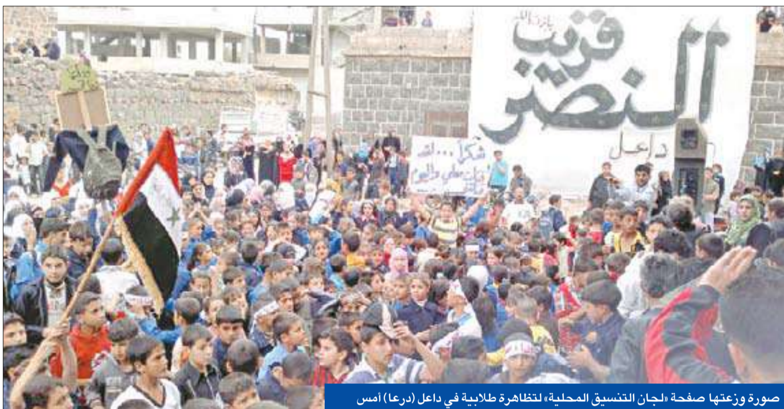
صورة وزعتها صفحة الجان التنسيق المحلية، لتظاهرة طلابية في داعل (درعا) أمس

المحتجون المعارضون يتظاهرون في «أحد تجميد العضوية» للضغط على «اجتماع الدوحة»