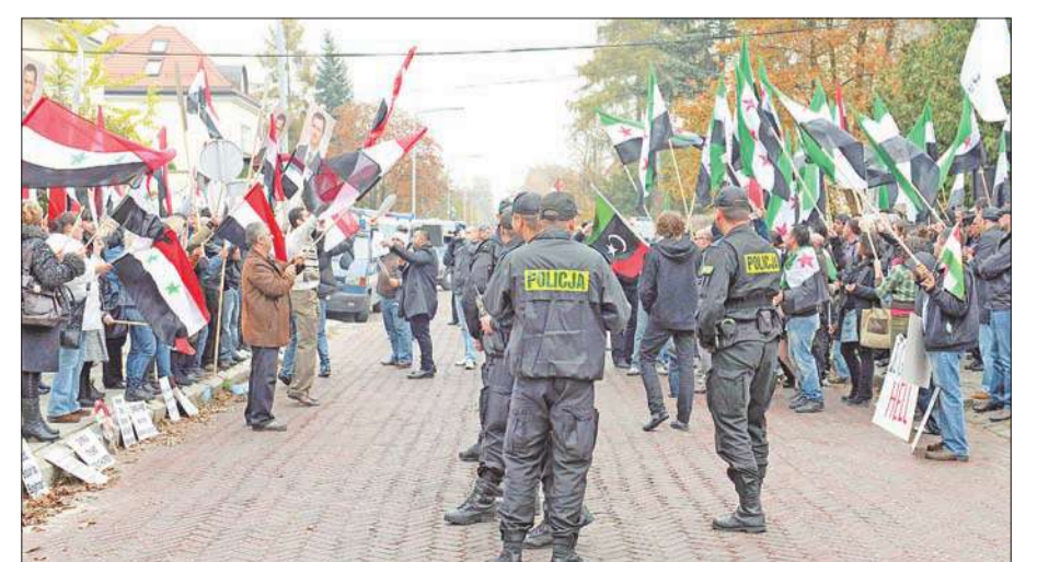
الشرطة البولندية تفصل بين سوريين معارضين للأسد وآخرين موالين له خلال تظاهرات متضادتين في وارسو أمس (إي بي إي)