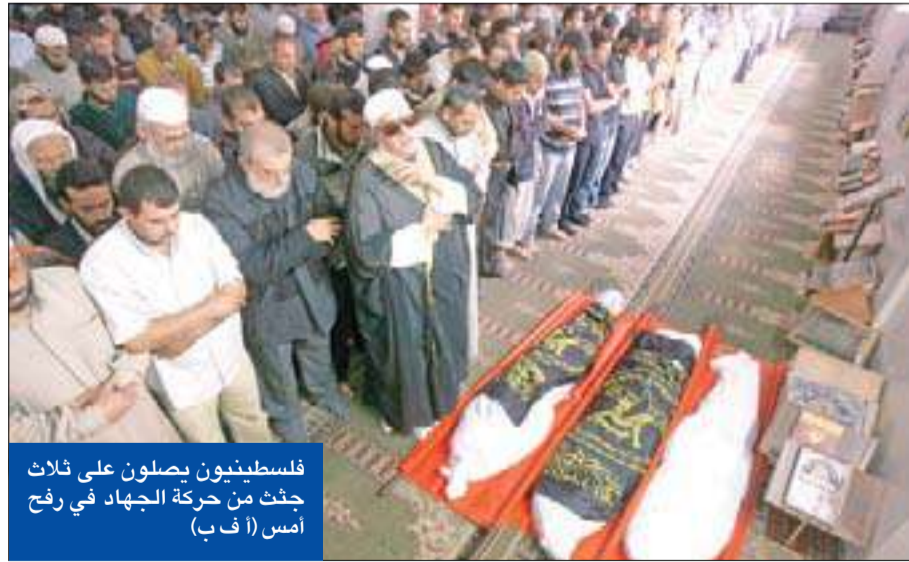
فلسطينيون يصلون على ثلاث جثث من حركة الجهاد في رفح أمس

«سرايا القدس» تقصف إسرائيل... و«القبة الفولاذية» تفشل في الاختبار الأول