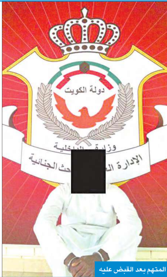
المتهم بعد القبض عليه

وأضاف المصدر أن رجال المباحث شرعوا في استدعاء اصحاب البلاغات في بادئ الأمر، واستمعوا الى اقوالهم وكونوا صورة تقريبية