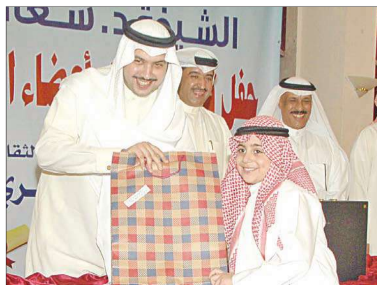
... وتكريم متفوق