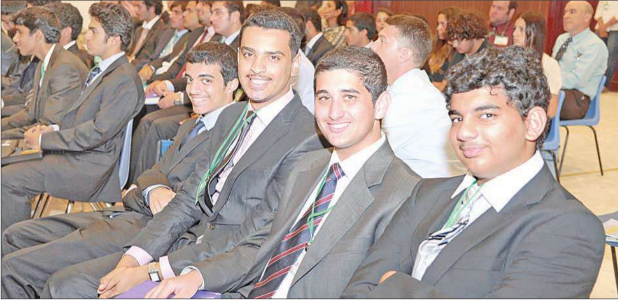
عدد من الطلاب المشاركين في المؤتمر

المناسبة المؤتمر السنوي لنموذج هيئة الأمم المتحدة المصغر المكان مدرسة البيان النموذجية