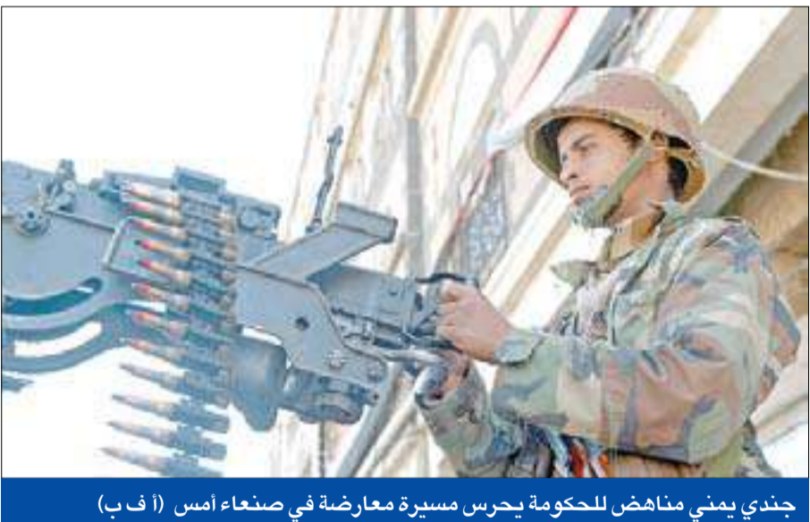
جندي يمني مناهض للحكومة يحرس مسيرة معارضة في صنعاء أمس

«قاعدة الجزيرة» ينفي مقتل مسؤوله الإعلامي