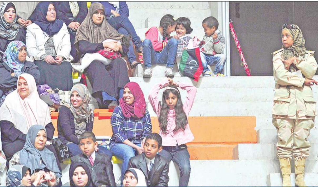
عدد من الليبيات يتابعن احتفال تكريم مقاتلي الجبهة الغربية في بنغازي أمس الأول

الناتو ترتكب اليوم جرائم ضد الشعب الليبي أكثر من الحكومة الليبية السابقة لكن لا يعلم أحد عن إجراءاتها وأعمالها.