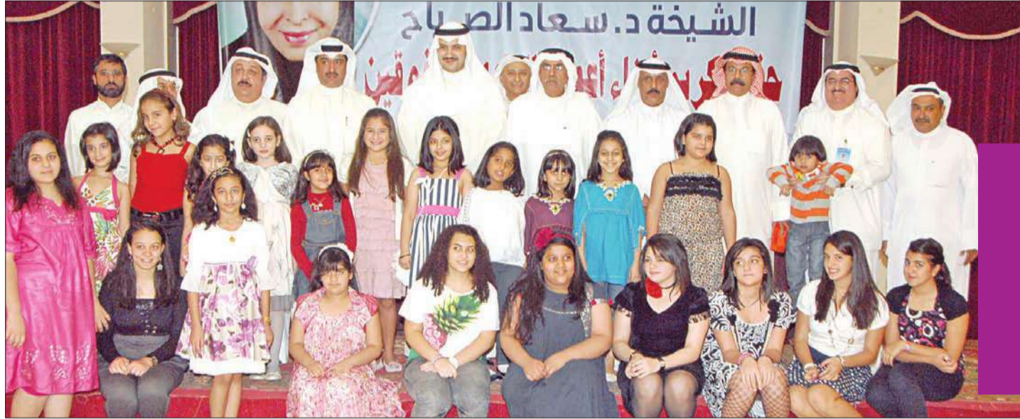
الشيخ مبارك العبدالله واللواء فهد الفهد وخالد الفودري مع المتفوقات

المناسبة تكريم أبناء أعضاء النادي البحري