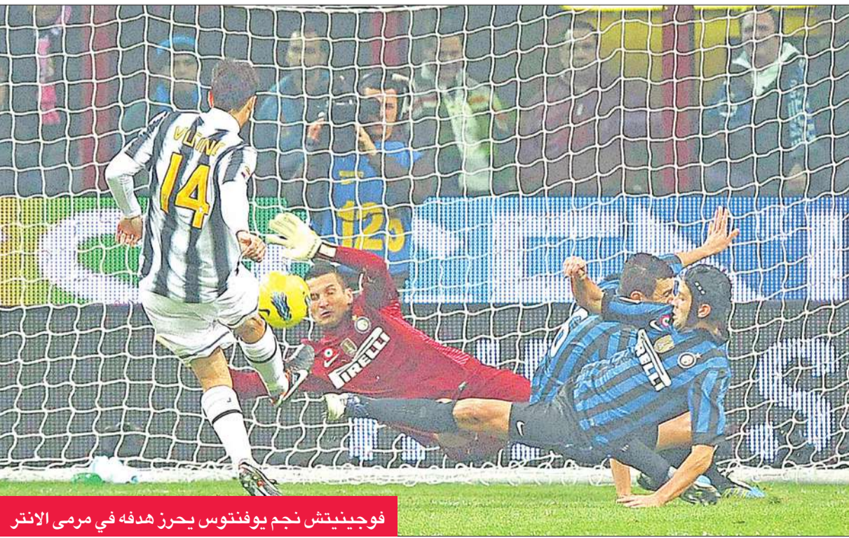
فوجينيتش نجم يوفنتوس يحرز هدفه في مرمى الإنتر