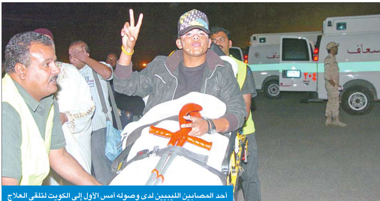
أحد المصابين الليبيين لدى وصوله أمس الأول إلى الكويت لتلقي العلاج

من جهته شدد السفير الليبي في الكويت محمد المبارك على حاجة ليبيا والشعب الليبي إلى دعم جميع الدول العربية الشقيقة في هذا الوقت العصيب