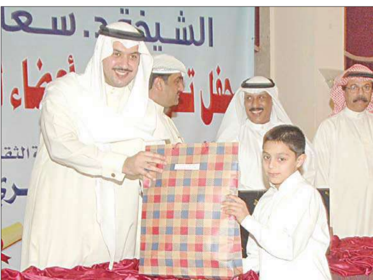
الشيخ مبارك العبدالله خلال تكريم أحد المتفوقين