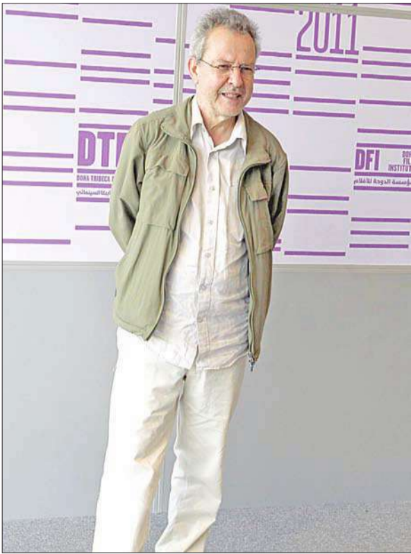
مرزاق علواش