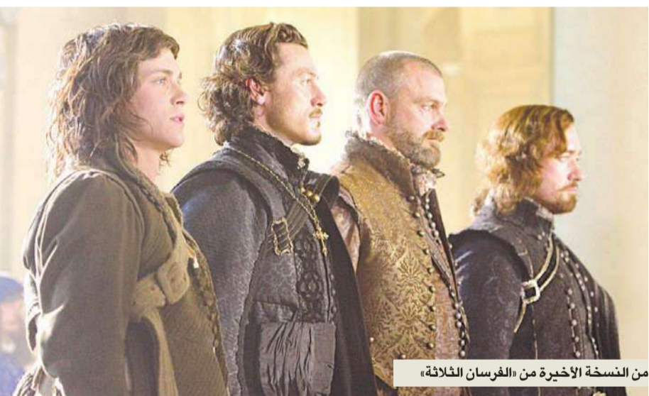
من النسخة الأخيرة من «الفرسان الثلاثة»

في هذه القصة حيث يكون الفرسان خبراء بالأسلحة، أي ما يشبه جيمس بوند أو وحدات المهمات السرية في ذلك الزمن. لهذا السبب، تمكّنوا من إضافة جميع الأدوات التي كان يمكن اختراعها في تلك الفترة الزمنية، وخضع ليرمان لأشهر من التدريب على القتال قبل بداية تصوير الفيلم. وكان قد اتخذ خطوات تمهيدية مشابهة للمشاركة في فيلم «بيرسي جاكسون»، لكن لا شيء يضاها الاستعداد لأداء دور فارس حقيقي!