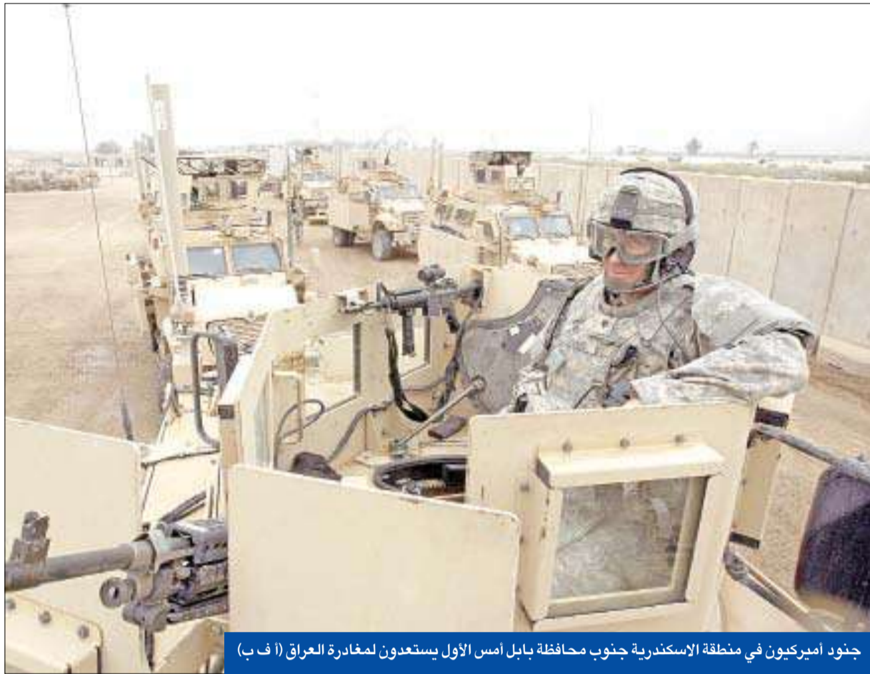
جنود امريكيون في منطقة الاسكندرية جنوب محافظة بابل أمس الأول يستعدون لمغادرة العراق

تردد في الآونة الأخيرة أن الإدارة الأميركية تخطط لتعزيز وجودها العسكري في منطقة الخليج بعد انسحاب القوات الباقية من العراق نهاية هذا العام، وقد تشمل عملية إعادة التموضع هذه قواتاً قتالية جديدة في الكويت قادرة على الرد على أي انهيار للأمن في العراق أو مواجهة عسكرية مع إيران. وقالت صحيفة «نيويورك تايمز» الأميركية أمس، إن الخطة الأميركية لتعزيز وجودها في الخليج بعد الانسحاب من العراق، خاصة للنقاش منذ أشهر واكتسبت طابعاً ملحا جديداً بعد إعلان الرئيس الأميركي باراك أوباما هذا الشهر أن الانسحاب الكامل للقوات الأميركية من العراق سينتهي نهاية العام الحالي. وذكرت الصحيفة، أن المفاوضات بشأن الحفاظ على وجود قوات أميركية قتالية في الكويت، تنظر الولايات المتحدة في إرسال مزيد من السفن الحربية الأميركية عبر المياه الدولية في المنطقة، مشيرة إلى أنه بالنظر إلى التهديد الإيراني، فإن الإدارة الأميركية تسعى أيضاً إلى توسيع العلاقات العسكرية مع الدول الست الأعضاء في مجلس التعاون الخليجي، وهي السعودية والكويت والبحرين وقطر والإمارات العربية وسلطنة عمان. وأشارت الصحيفة إلى أن حجم القوة القتالية الأميركية الجديدة التي ستتمركز في الكويت، لا يزال يخضع للمفاوضات، مع توقع الإجابة عن ذلك في الأيام القليلة المقبلة. وذُكرت أن لدى واشنطن علاقات عسكرية ثنائية وثيقة