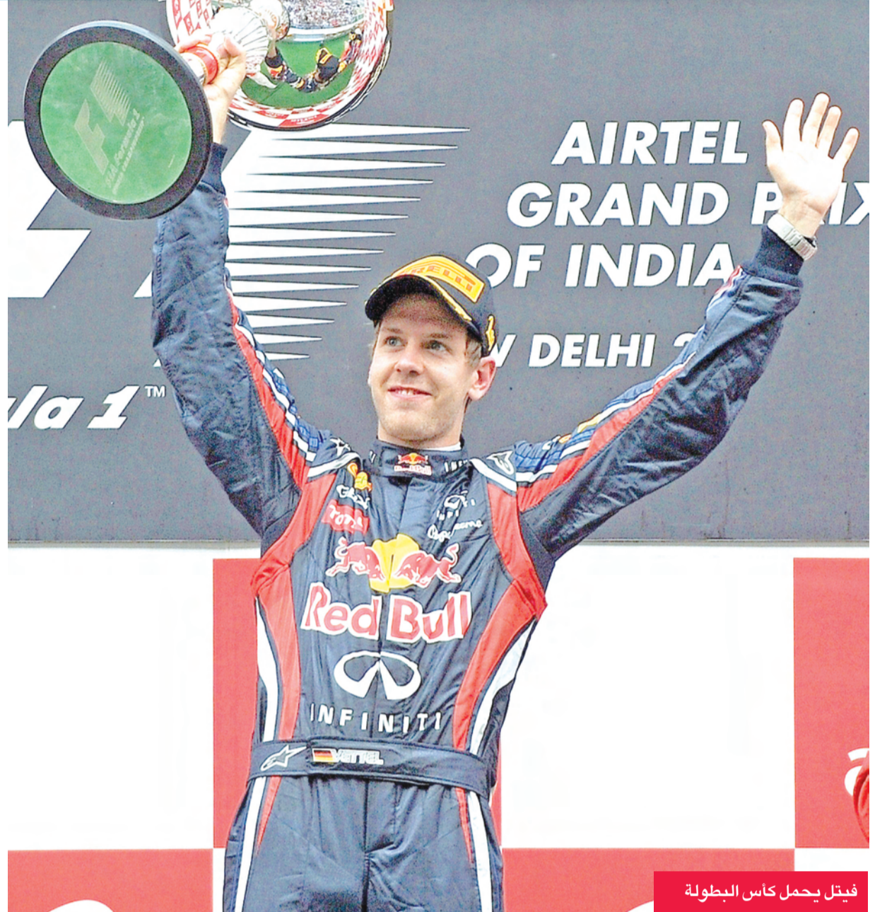
فيتل يحمل كأس البطولة

واصل السائق الألماني سيباستيان فيتل نجم فريق ريد بول انتصاراته في بطولة العالم (الجائزة الكبرى) لسباقات سيارات فورمولا-1 وفاز أمس الأحد بلقب أول سباق لفورمولا-1 يقام في الهند ضمن فعاليات البطولة. وتصدر فيتل السباق الهندي منذ بدايته وحتى نهايته ليتفوق على البريطاني جنسون باتون سائق ماكلارين والذي حل في المركز الثاني. واحتل الإسباني فيرناندو ألونسو سائق فيراري المركز الثالث في السباق متفوقا على الأسترالي مارك ويبر سائق ريد بول.