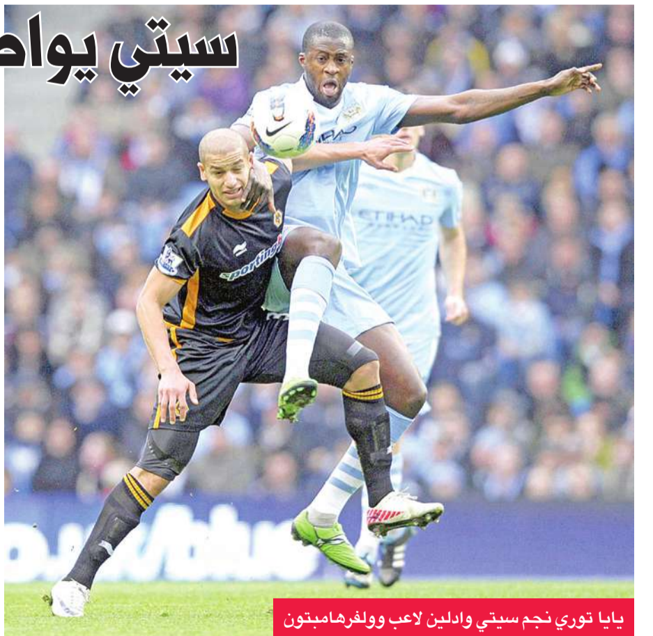
يايا توري نجم سيتي وادلين لاعب ولفرهامبتون

وفك ليفربول نحس التعادلين اللذين سقط فيهما في المرحلتين الأخيرتين وانزع فوزا ثمينًا من مضيفه وست بروميتش البيون 2 - صفر خوله الارتفاع إلى المركز الخامس برصيد 18 نقطة. وسجل تشارلي ادم (9 من ركلة جزاء) وأندي كارول (45) الهدافين.