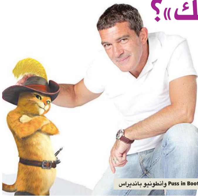
Puss in Boots وأنطونيو بانديراس

Forever After، وستصدر هوليوود هذه السنة 15 فيلماً من هذا النوع، بعد أن أنتجت 12 فيلماً عام 2010. وتكون بذلك قد اقتربت من الرقم القياسي الذي حققته في هذا المجال عام 2002، بإصدارها 17 فيلم «أنيميشن»، وفق Hollywood.com، شركة تتبع أخبار الأفلام على شبك التذاكر.