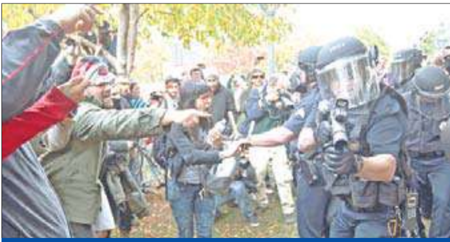
قوات مكافحة الشعب الأميركية في مواجهة متظاهرين من حركة «احتلوا دفر» في مدينة دفر أمس الأول

كما سببت الأحوال الجوية السيئة اضطراب حركة النقل بالسكة الحديد والطريق من واشنطن إلى بوسطن، بينما حذرت إدارة الأرصاد الجوية من أن «قد يكون خطيراً جداً». وفي نيو جيرسي وحدها، حرم 500 ألف شخص من التيار الكهربائي. (نيويورك. أ ف ب، أ ب، رويترز، د ب، يو بي آي)