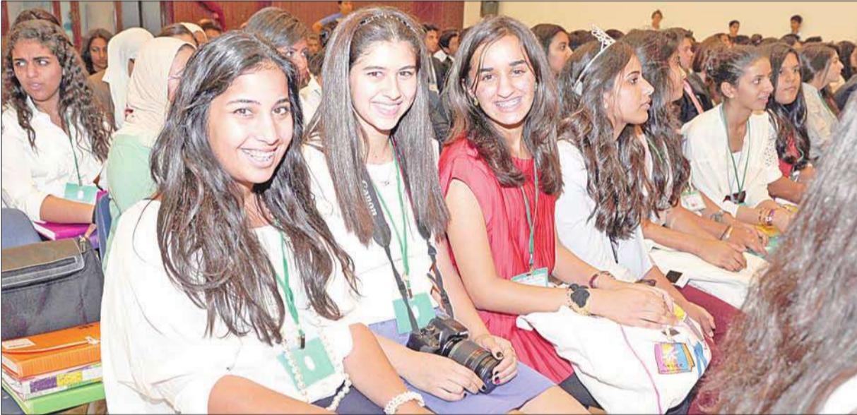
عدد من الطالبات