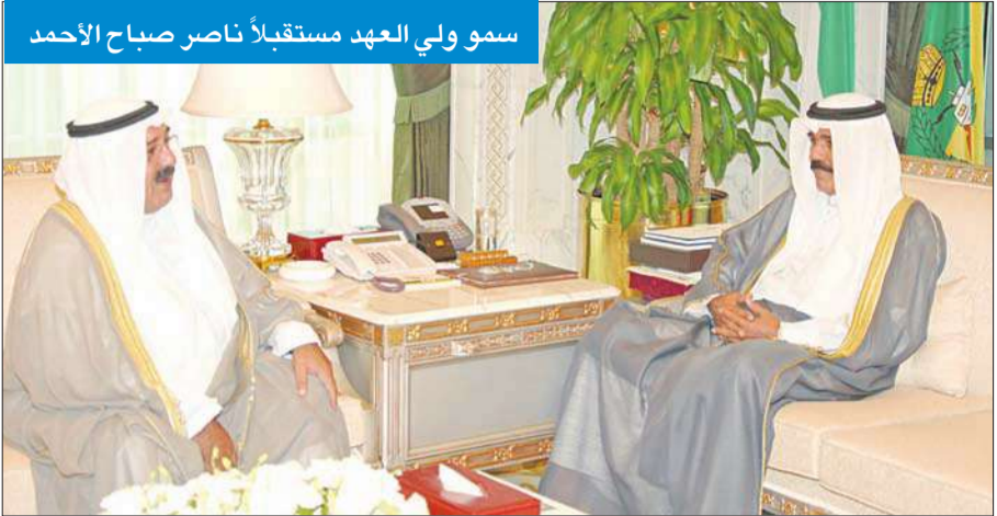
سمو ولي العهد مستقبلاً ناصر صباح الأحمد

استقبل سمو ولي العهد نواف الأحمد، في ديوانه بقرص السيف صباح أمس، رئيس مجلس الأمة جاسم الخرافي. واستقبل سموه سمو الشيخ ناصر المحمد رئيس مجلس الوزراء كما استقبل سمو ولي العهد وزير شؤون الديوان الأميري الشيخ ناصر صباح الأحمد. واستقبل سموه نائب رئيس مجلس الوزراء وزير الداخلية الشيخ