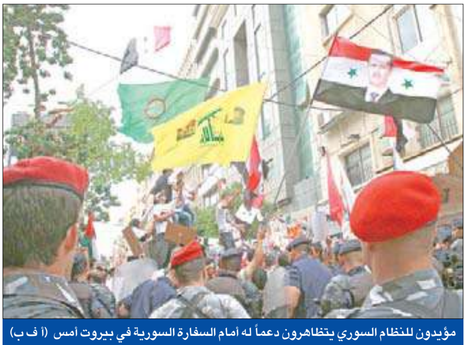
مؤيدون للنظام السوري يتظاهرون دعماً له أمام السفارة السورية في بيروت أمس

وعلى الصعيد الفلسطيني، شدد جنبلات على أهمية «دعم جهود المصالحة الداخلية»، مؤكداً أن «القرار الفلسطيني المستقل هو وحده الكفيل لتثبيت الحق»، واقترح أنه في حال فشل مشروع الدولتين (إسرائيل-فلسطين) والعودة إلى الدولة الواحدة للشعبين الفلسطيني والإسرائيلي على أن تكون القدس عاصمة للجميع، معتبراً أن «أفضل داعم للشعب الفلسطيني هي الشعوب العربية الحرة أما أنظمة الممانعة السخيفة فلم تكن إلا لتحسين شروطها الشخصية للتفاوض مع إسرائيل».