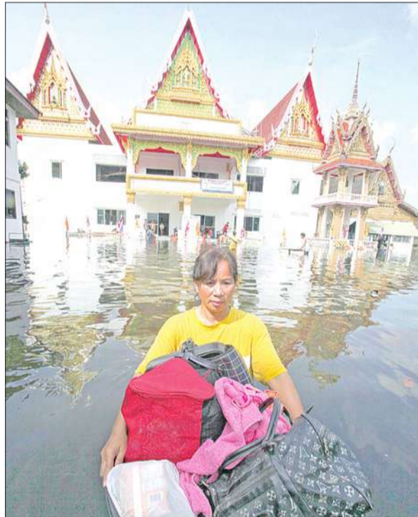
فيضانات تايلاند

ومع ذلك، فالتأثر لتايلاند قادرة على التعافي مجدداً مع انحسار الفيضانات، كما تستطيع الهند زيادة صادراتها من الأرز أيضاً. ولكن والحين قدوم أنباء أخرى عن حدوث تدمير محتمل في المحاصيل، يحمل سعر الأرز الخام المقرر تسليمه في شهر يناير، والذي يتم تداوله في بورصة شيكاغو، في طياته مخاطر الزيادة في الأسعار نتيجة لهذه الشكوك المتزايدة.