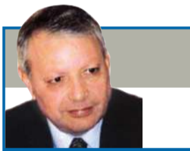
صالح القلاب كاتب وسياسي أردني

خلال هذه التصريحات التي ضمنها حديثه لصحيفة "الصناديق" لتلغراف البريطانية، أن خياره بات بعد أن وصلت الأمور إلى ما وصلت إليه هو "الفرادة" وهو تحول هذه المنطقة إلى قيسفاء طائفية وفقاً للمشروع الإسرائيلي القديم الذي كان طرحه حتى قبل قيام الدولة الإسرائيلية موشي شاريت الذي كان أول وزير خارجية لهذه الدولة.