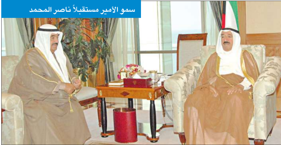
سمو الأمير مستقبلاً ناصر المحمد

استقبل سمو أمير البلاد الشيخ صباح الأحمد بقرص السيف صباح أمس، سمو ولي العهد الشيخ نواف الأحمد. كما استقبل سموه، رئيس مجلس الأمة جاسم الخرافي. واستقبل سموه، سمو الشيخ ناصر المحمد رئيس مجلس الوزراء. واستقبل سموه، وزيرة التجارة والصناعة د. أماني