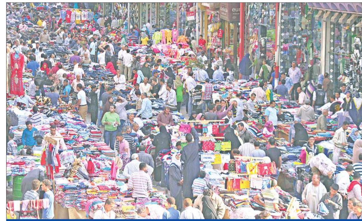
حشد من المصريين في سوق شعبي وسط القاهرة استعداداً لعيد الأضحى المبارك أمس

مسؤولياتها السياسية والإصلاحية، بدأت أمس لجان فحص الطعون الانتخابية في المحافظات، فحص الطعون التي تم تقديمها ضد المرشحين في الانتخابات البرلمانية المقبلة، تمهيداً لإعلان القوائم النهائية غداً الثلاثاء.