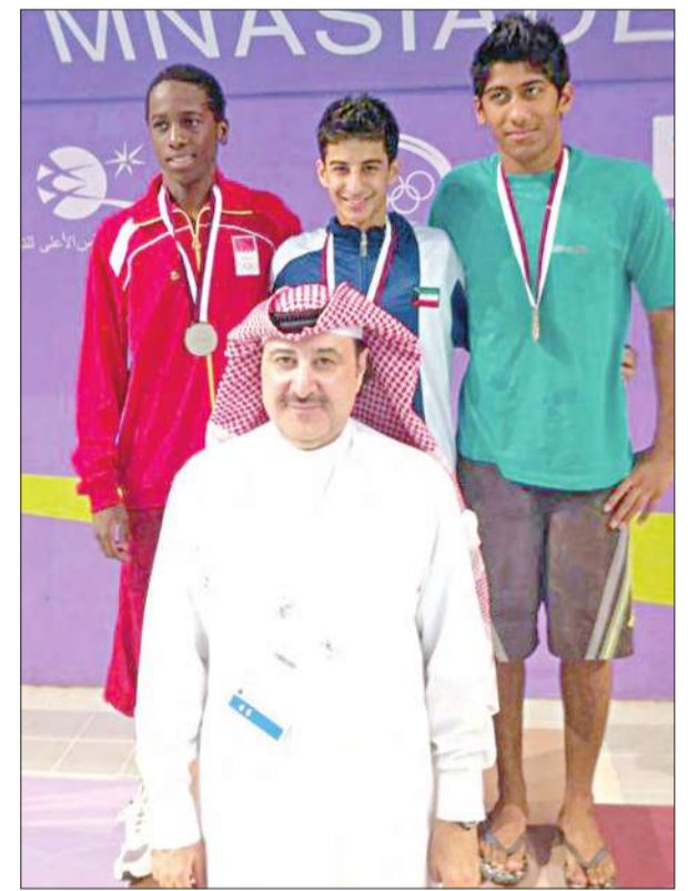
أبطال السباحة على منصة التتويج