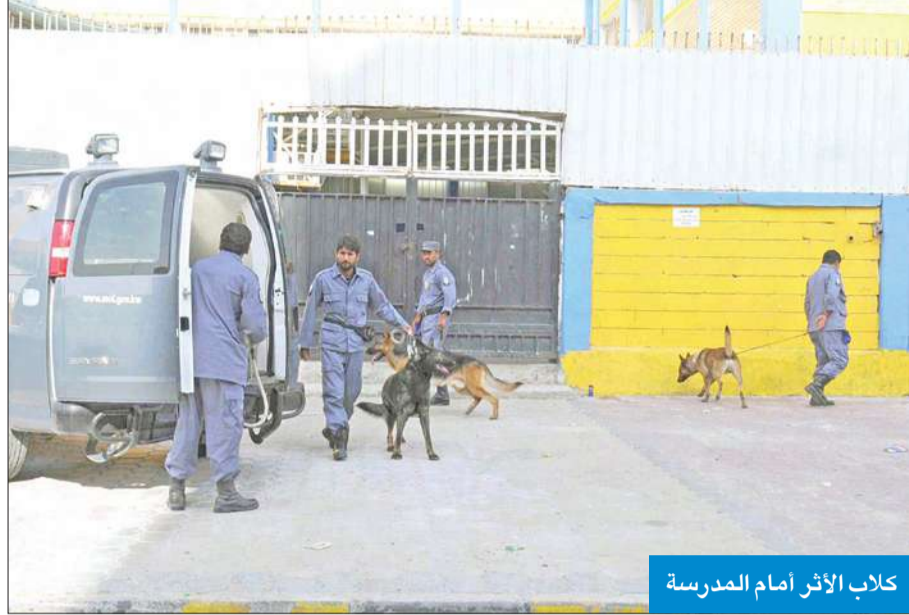
كلاب الأثر أمام المدرسة