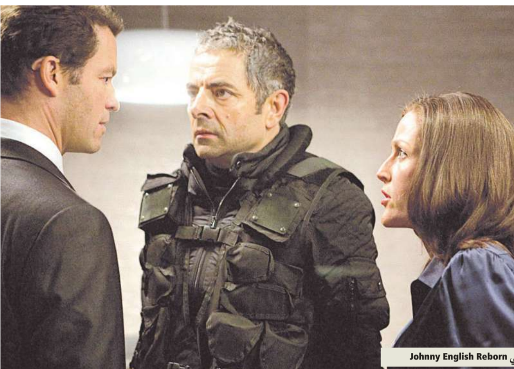
في Johnny English Reborn

إن كان الممثل الفكاهي الإنكليزي روان أتكينسون يشك في شهرته العالمية، فذلك سرعان ما سيتبدد عند سماعه آخر الأخبار من عمال الإغاثة الإنكليز العائدين من إفريقيا. يخبر أتكينسون (56 سنة): «يقصد هؤلاء القرى الإفريقية التي تضم أربعة أكواخ مبنية من النبات والقصب. فيجدونها كلها فارغة، باستثناء واحد منها. في هذا الكوخ، تتلحق القرية بأكملها حول شاشة تلفزيون صغير بالابيض والأسود يستمد طاقته من بطارية سيارة، وتحت جهاز فيديو يعرض فيلم Mr. Bean».