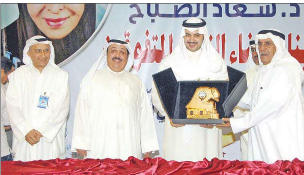
دروع تذكارية مقدمة إلى راعي الحفل