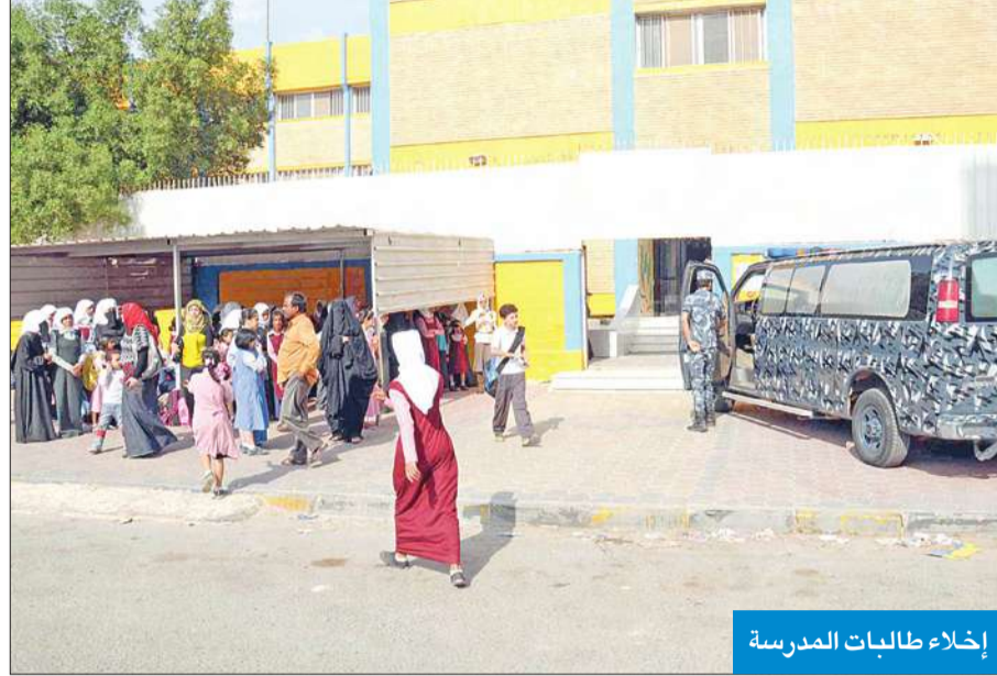
إخلاء طالبات المدرسة