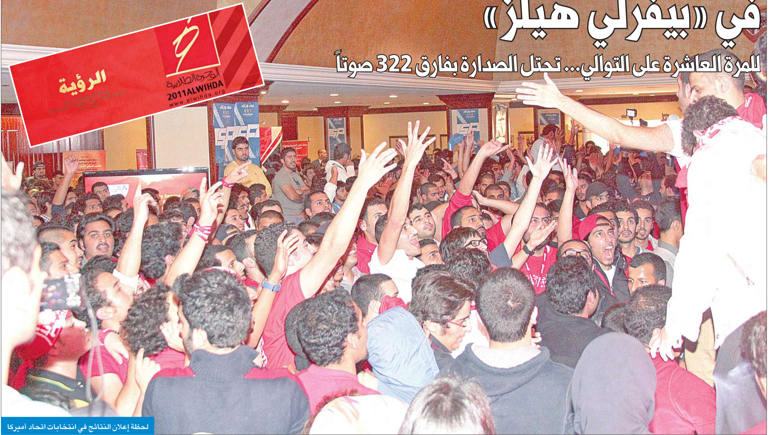
لحظة إعلان النتائج في انتخابات اتحاد أميركا

للمرة العاشرة على التوالي... تحتل الصدارة بفارق 322 صوتاً