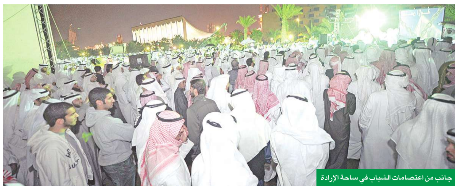
جانب من اعتصامات الشباب في ساحة الإدارة

لقد كان الاقتصاد الكويتي، الأسوأ أداءً في عام 2009، ذلك كله بسبب سوء أداء الإدارة الحكومية، التي تحاول شراء وقت بإهدار فرص الاقتصاد الكويتي، على المنافسة، الآن، أضفنا إليهما، تكلفة تحسين الإدارة، ضد المساءلة السلمية، والمحاربة العنيدة لمبدأ التغيير الصحي، وهو تطور خطير، فثمن بقائها أصبح تهديداً مخيفاً لأمن الكويت الاقتصادي والسياسي، والأمر لا يحتاج إلى أكثر من متهور، أو ربما مندس، يتسبب في إزهاق روح بريئة، لنترخم، على كل ما سبق.