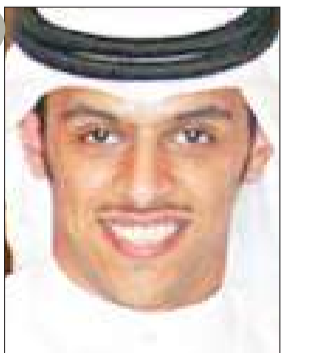
جانب من الفرحة