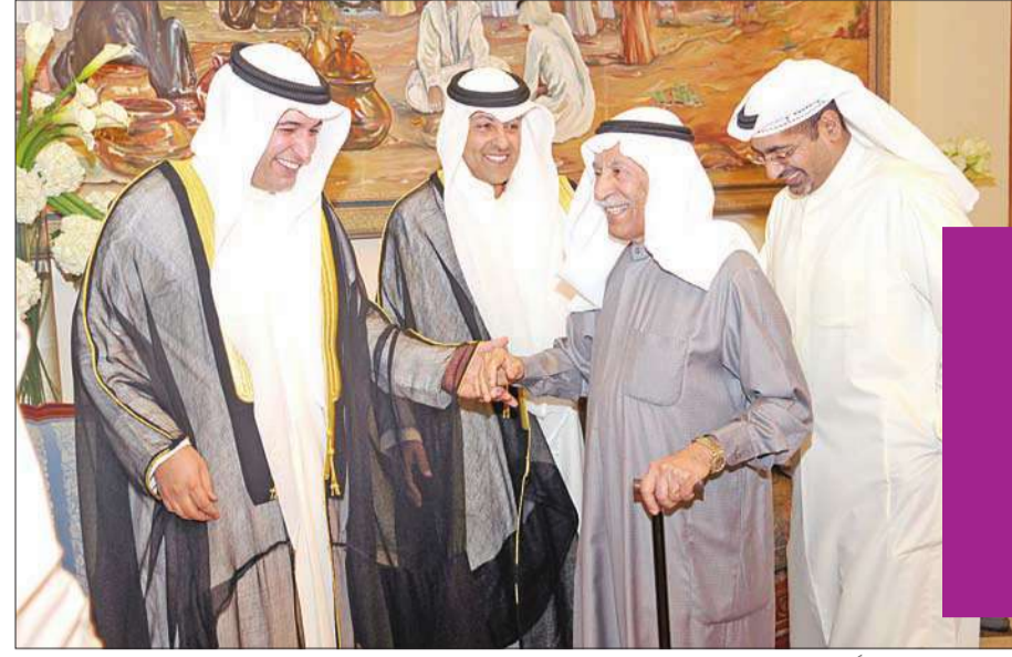
غازي الرئيس مهنتنا