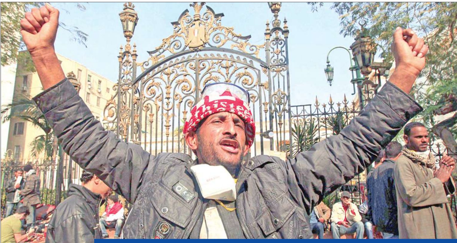
مصري يردد الهتافات ضد المجلس العسكري أمام مقر مجلس الوزراء في القاهرة أمس