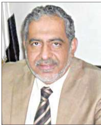
أبو العلا ماضي

● كيف ترى المخرج من هذا المازق السياسي؟ - إذا تم تنفيذ كل البنود التي اتفق عليها خلال لقاء نائب رئيس المجلس العسكري الفريق سامي عنان بالقوى السياسية مؤخرا فسجد حلاً، وأبرز نقاط الاتفاق تتمثل في تشكيل حكومة إنقاذ وطني، والاعتذار عن العنف الأمني المفرط ضد المتظاهرين، ووقف كل أشكاله ضد المعتصمين في ميدان التحرير وناميبيهم، والإفراج عن المعتقلين وعلاج المصابين في الأحدث على نفقة الدولة، وصرف تعويضات لأسر الشهداء. ● وما موقفكم من المطالبة برحيل المجلس العسكري عن الحكم الآن؟ - نحن لا نؤيد هذا الطرح، لأن المطالبة بالرحيل الفوري في الفترة الراهنة أسماها إشكالية عملية، والسؤال: من يتسلم السلطة، وبأي حق ومشروعية، رأينا أنه من الأفضل الانكفاء بتحديد جدول زمني سريع لإجراء الانتخابات البرلمانية والرئاسية، هذا هو الحل العملي للآزمة الراهنة. ● وما رؤيتكم لإدارة ما تبقى من