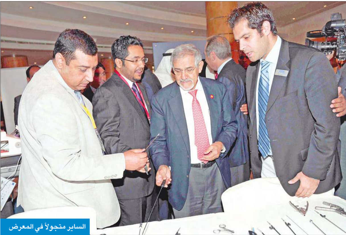
الساير متجولاً في المعرض

افتتح وزير الصحة د. هلال الساير صباح أمس المؤتمر الكويتي السنوي الأول لجراحة السمنة، مؤكداً أن مشكلة السمنة أصبحت عالمية، وليست في الكويت فقط، وأن مضاعفاتها كثيرة.