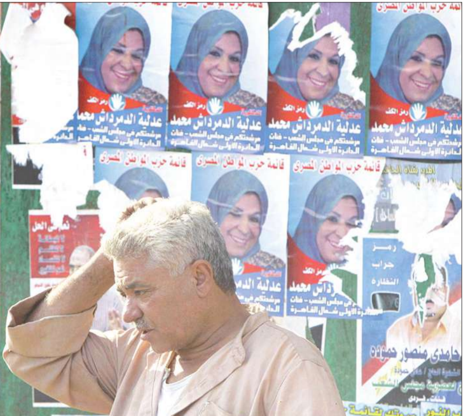
مصري يمر بجانب ملصقات تغطي جداراً لمرشحة في الانتخابات في القاهرة أمس