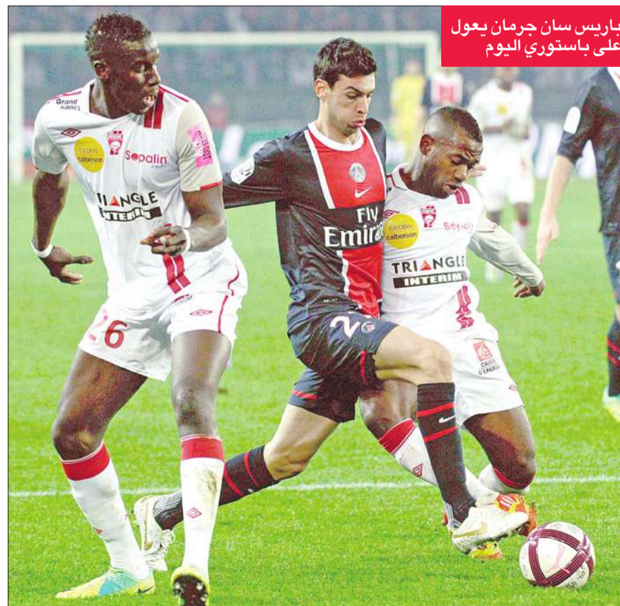
باريس سان جرمان يعول على باسستوري اليوم

يحل باريس سان جرمان ضيفاً ثقيلًا على غريمه التقليدي مارسيليا، وهو يأمل في الاحتفاظ بصدارة الدوري الفرنسي في المرحلة الخامسة عشرة من البطولة.