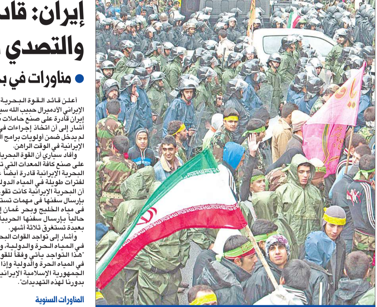
جانب من استعراض ميليشيا الباسيج الإيرانية في أسبوع الباسيج في طهران أمس الأول

وفي السياق نفسه، أعلن قائد القوة البحرية الإيرانية أن بلاده ستجري مناوراتها