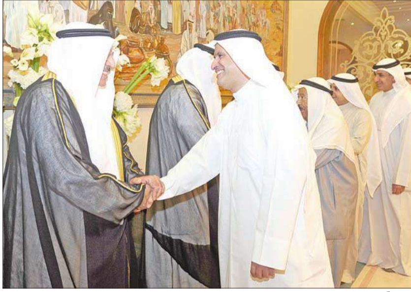
وتهنئة من غصان الصقر