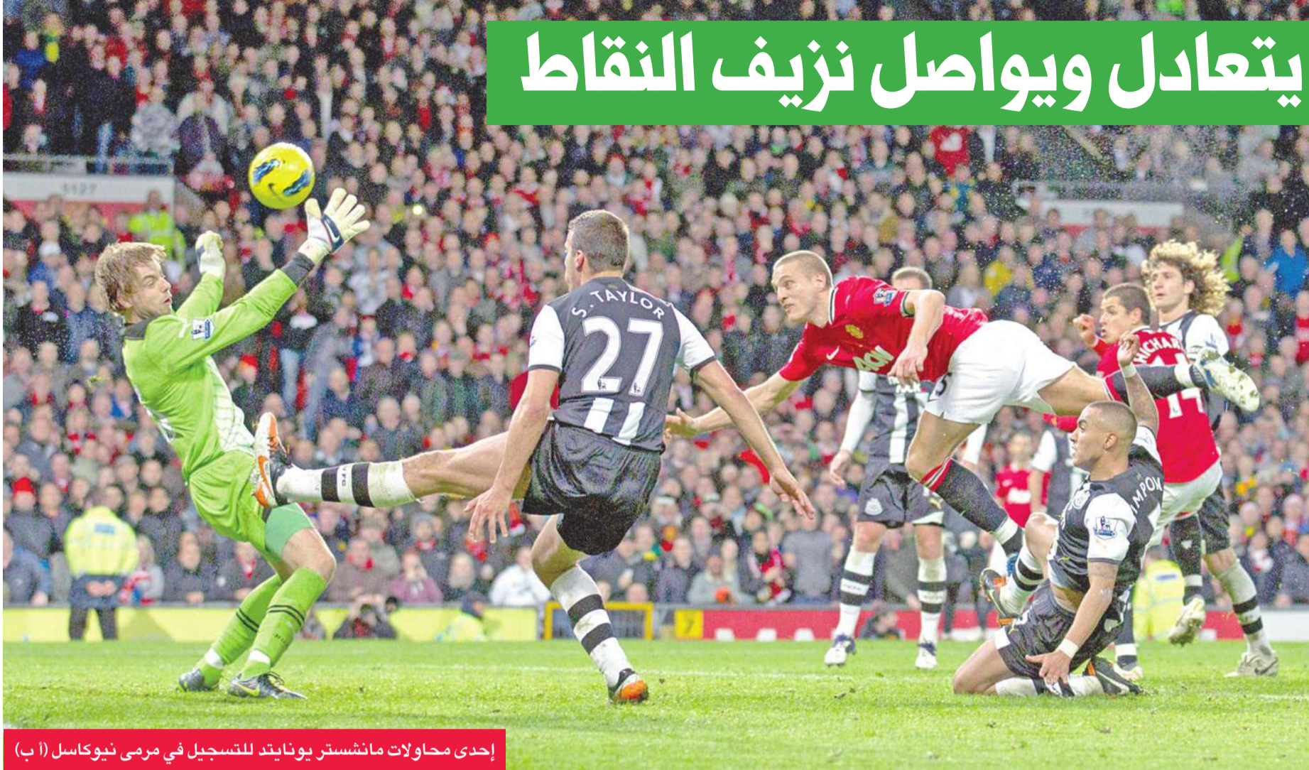
إحدى محاولات مانشستر يونايتد للتسجيل في مرمرى نيوكاسل

سقط مانشستر يونايتد في فخ التعادل أمام ضيفه نيوكاسل، بهدف لفته، ليواصل حامل اللقب نزيف النقاط في افتتاح المرحلة الثالثة عشرة من الدوري الإنجليزي لكرة القدم.