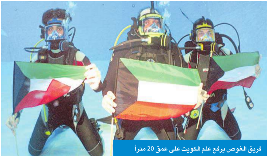
فريق الغوص يرفع علم الكويت على عمق 20 متراً

المشاركات العالمية والتعاون المشترك وتبادل الخبرات مع المنظمات والجهات المختصة في مجال البحر والبيئة حول العالم.