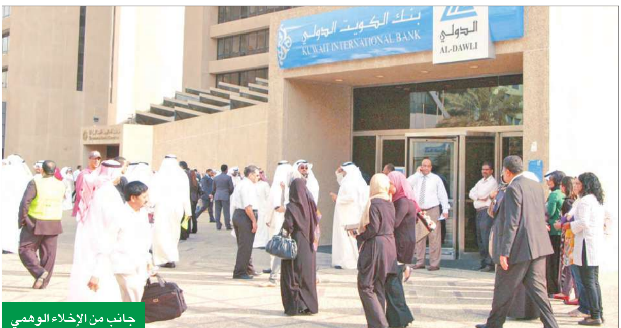
جانب من الإخلاء الوهمي