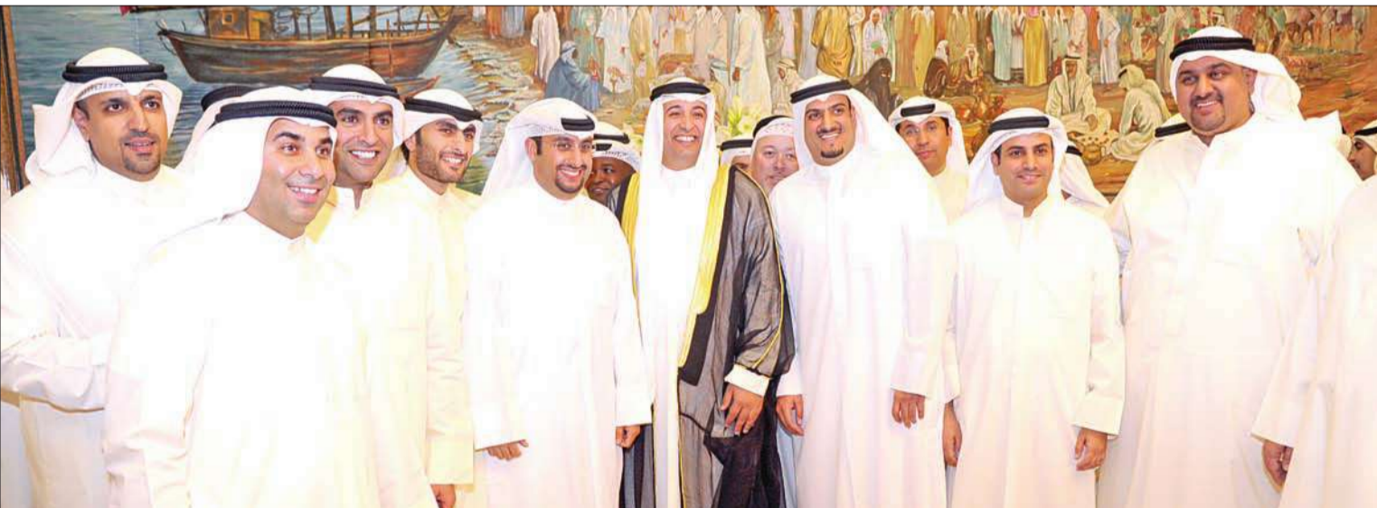
المعرس متوسطا أصدقاءه