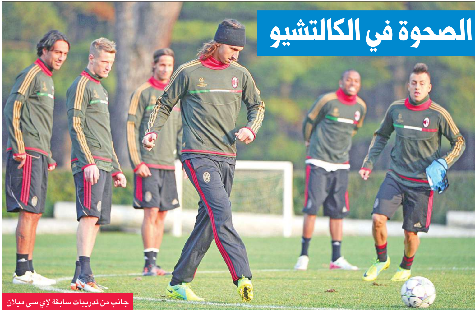
جانب من تدريبات سابقة لإي سي ميلان

مارتن ستكيلنبروغ (89). ورفع اودينيزي رصيده الى 24 نقطة، في حين وقف رصيده روما عند 17 نقطة في المركز الخامس. من جانبه، رفع دي ناتالي رصيده الشخصي الى 9 اهداف وتساوى مع الارجنتيني جرمان دينيس مهاجم اتالانتا برغامو في صدارة ترتيب الهادفين.