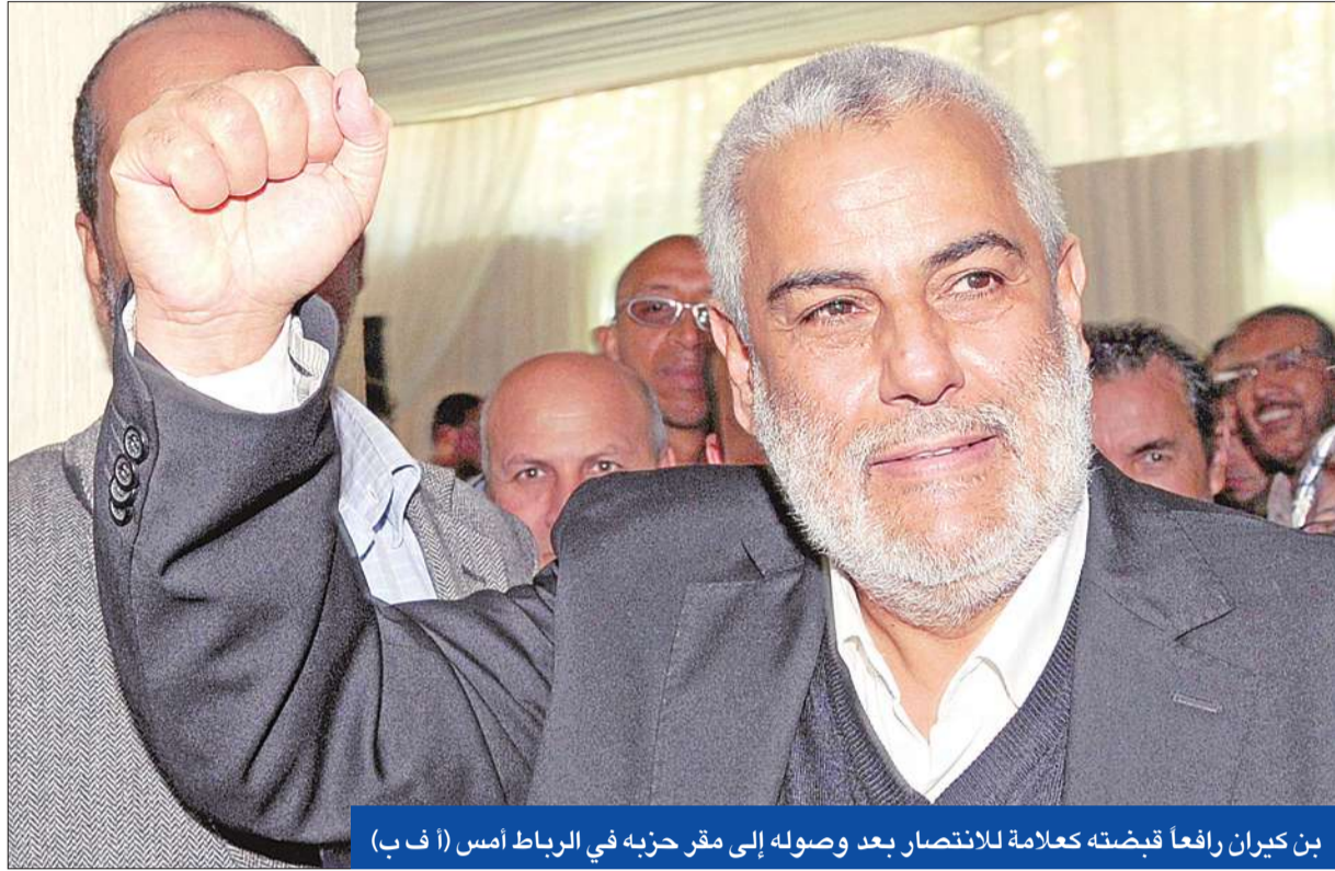
بن كيران رافعا قبضته كعلامة للانتصار بعد وصوله إلى مقر حزبه في الرباط أمس

وأوضح بن كيران في تصريحات لقناة «فرانس 24» الفضائية: «لقد سجلنا نجاحاً. أما بشأن التحالفات فنحن منفتحون على الجميع ولم نكف عن قول ذلك».