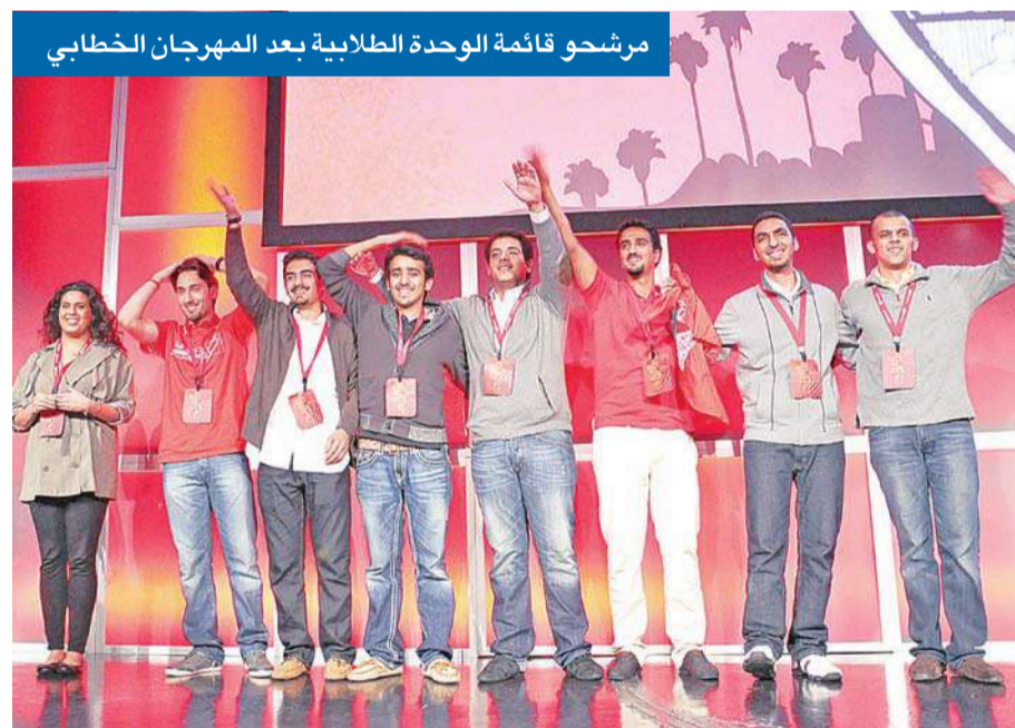
مرشحو قائمة الوحدة الطلابية بعد المهرجان الخطابي

فازت قائمة الوحدة الطلابية بـ 925 صوتاً في انتخابات الهيئة الإدارية للاتحاد الوطني لطلبة الكويت، فرع الولايات المتحدة، بينما جاءت قائمة «المستقبل الطلابي» في المركز الثاني بـ 603 أصوات، ليكون الفارق 322 صوتاً. وتخلو النتيجة قائمة الوحدة الطلابية بقيادة الاتحاد الوطني للمرة العاشرة على التوالي.