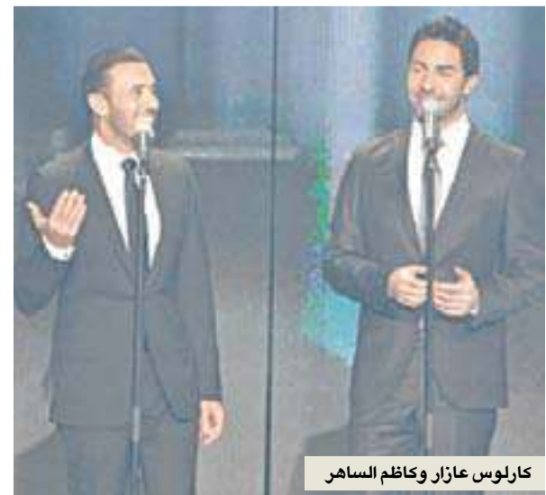
كارلوس عازار وكاظم الساهر