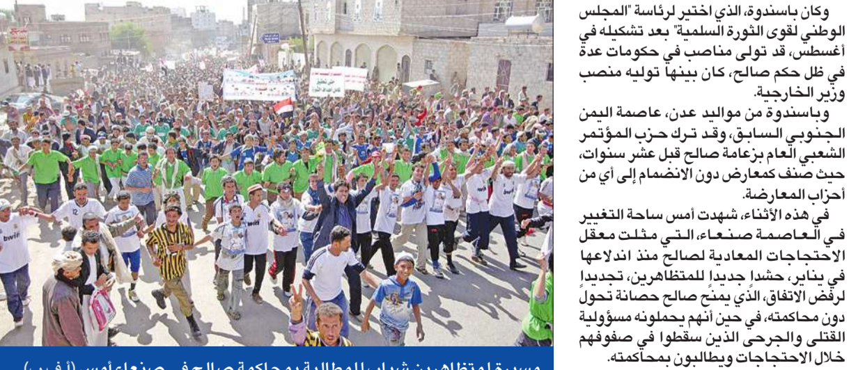
مسيرة لمتظاهرين شباب للمطالبة بمحاكمة صالح في صنعاء أمس

وأضاف في مؤتمر لحزب المؤتمر الوطني الحاكم في السودان في الخرطوم أن