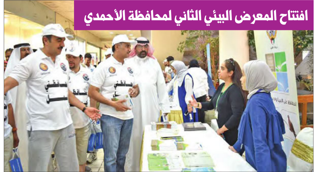
الفودري خلال جولته على أقسام المعرض البيئي