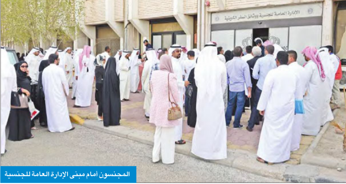
المجنسون أمام مبنى الإدارة العامة للجنسية

إجراءات الراغبين في أداء فريضة الحج هذا العام من المشمولين بالمكرمة الأميرية، وذلك من خلال صرف جوازات سفرهم الكويتية الجديدة وشهادات الجنسية خلال اليومين المقبلين لكي يتمكنوا من أداء فريضة الحج.