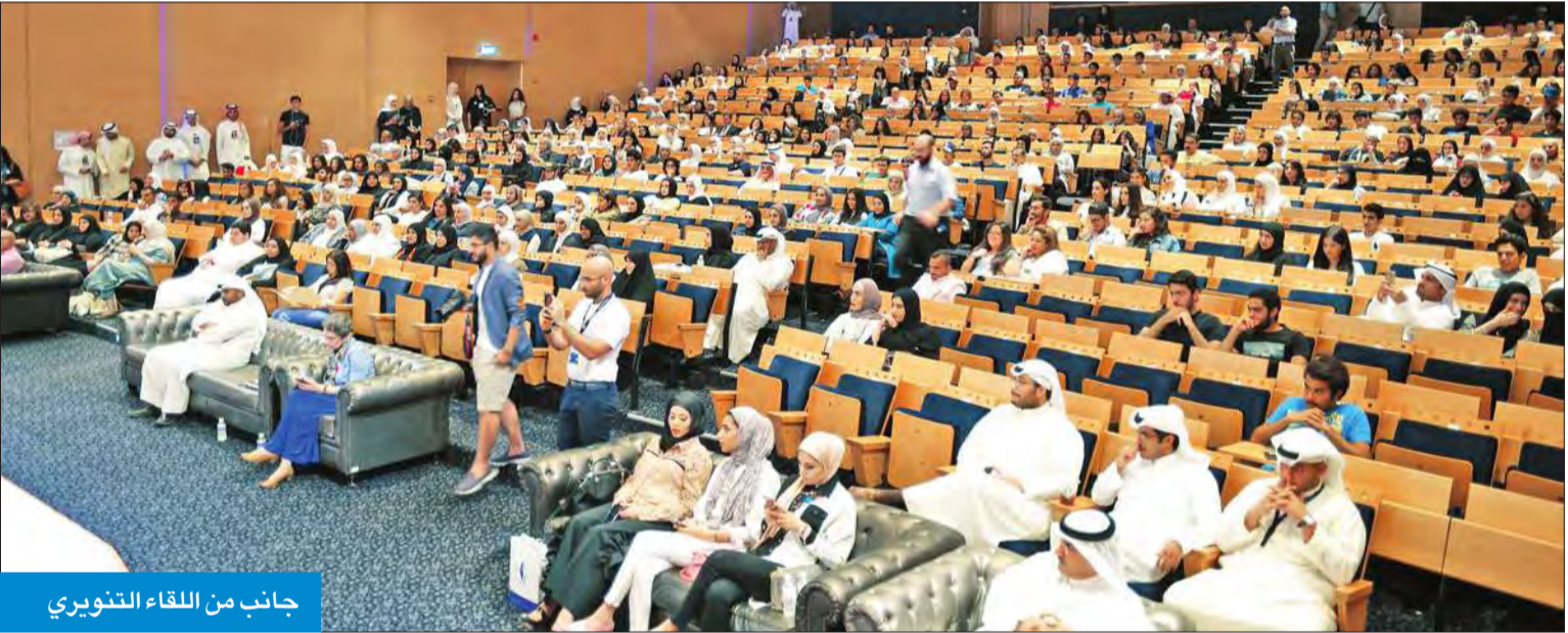
جانب من اللقاء التنويري