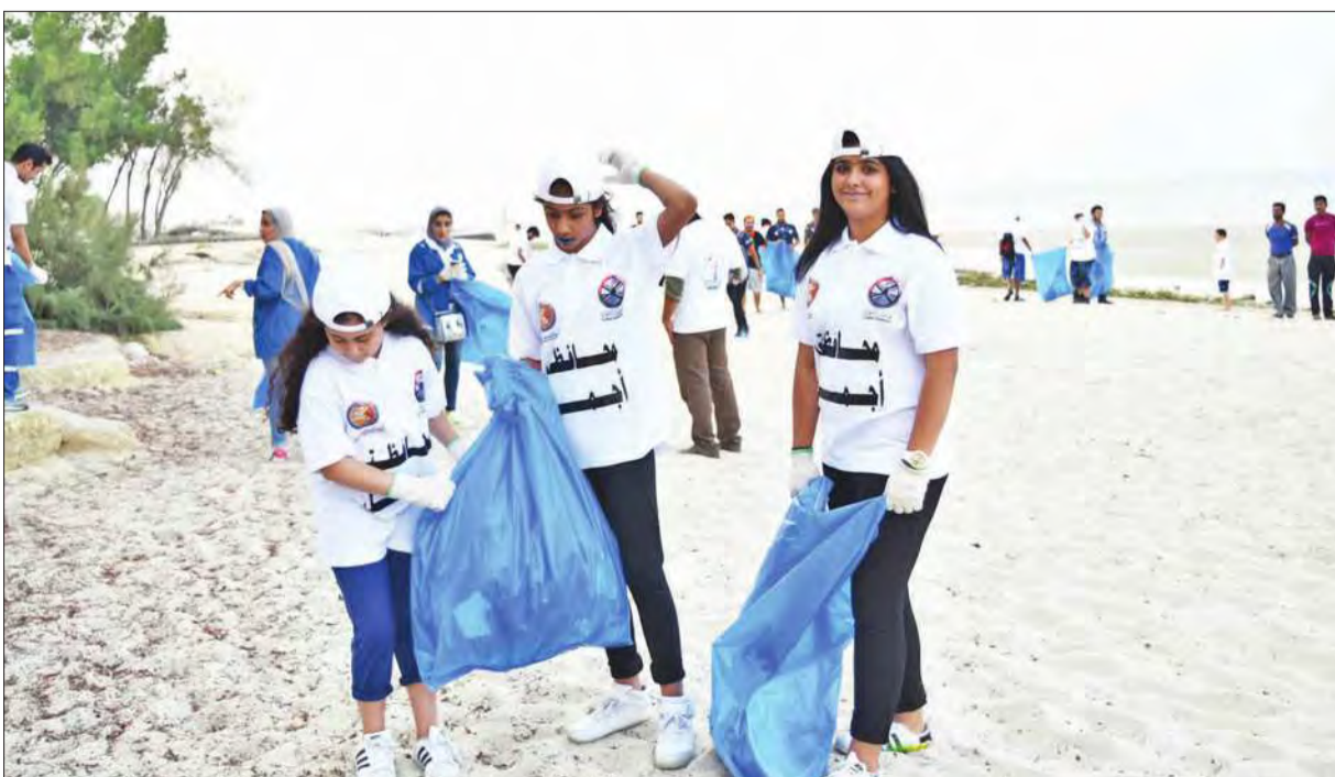
جانب من حملة التنظيف