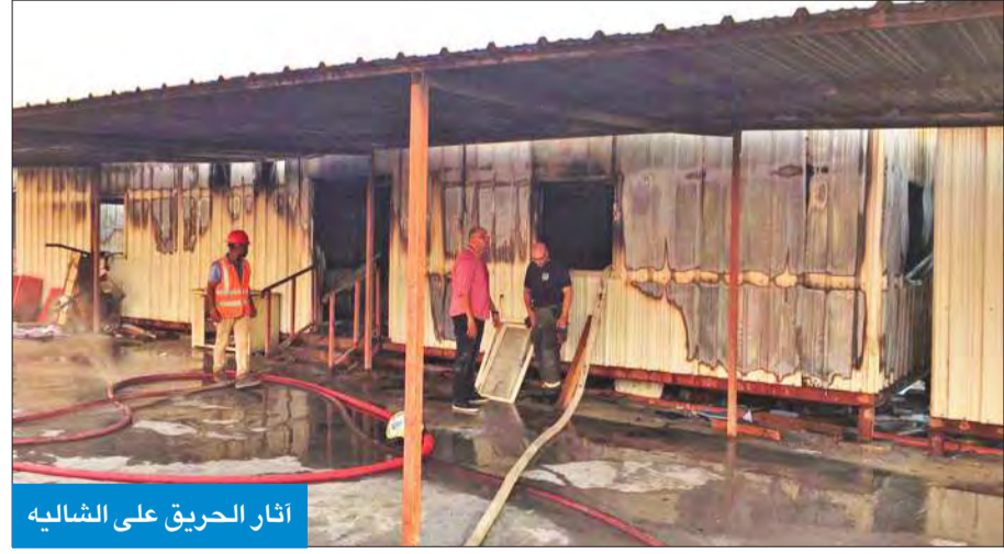
آثار الحريق على الشاليه

بأحد شاليهات مقاولي مشروع كلية الهندسة والبتترول