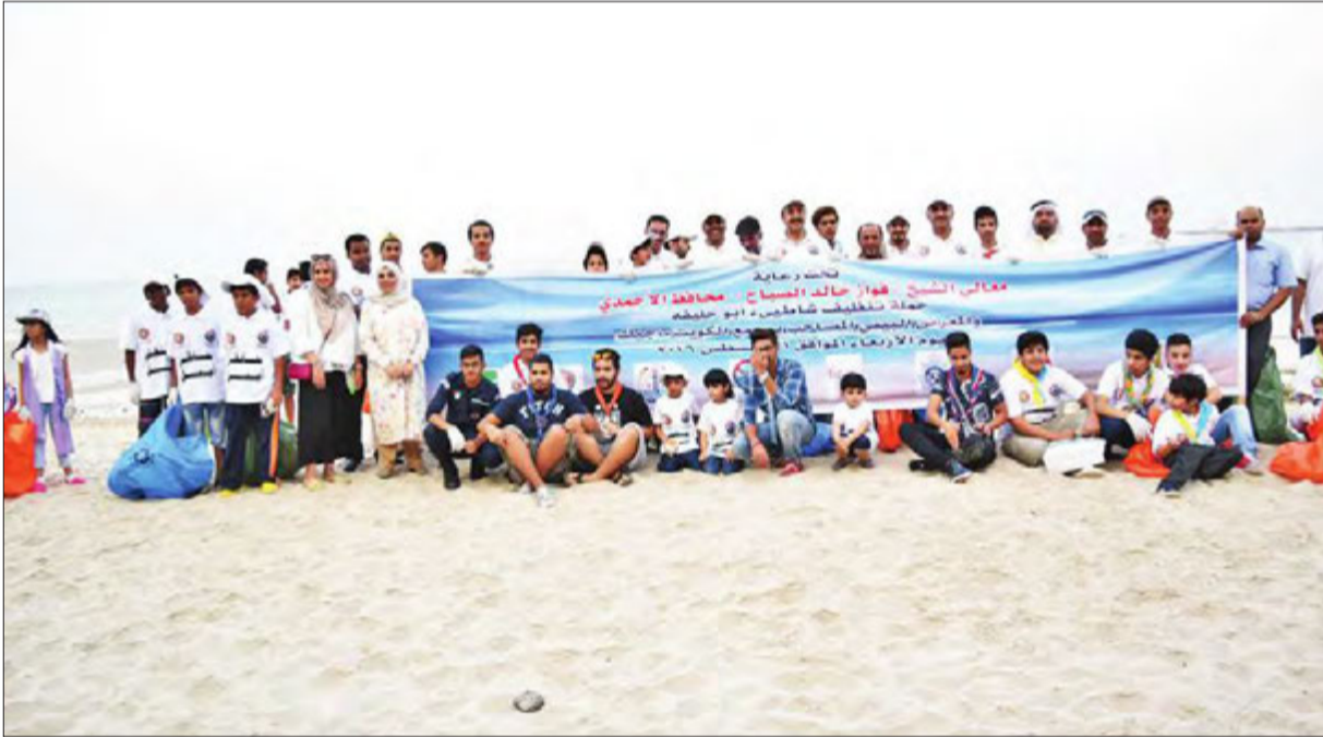
صورة جماعية للمشاركين