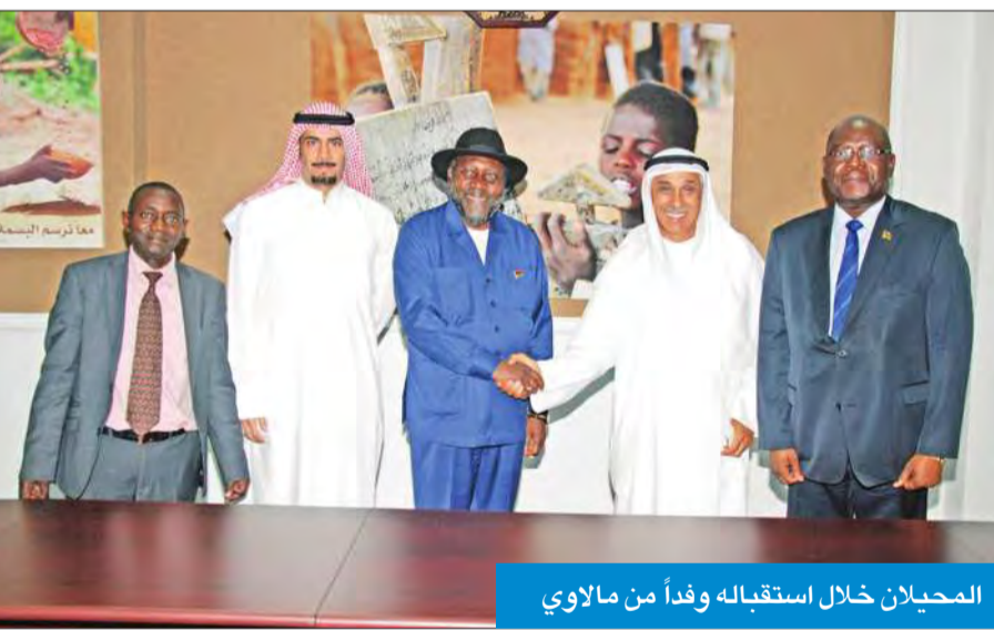
المحيلان خلال استقباله وفداً من مالاوي

وزير العمل المالوي: خطة لتوفير العمل لعاطلين في الكويت