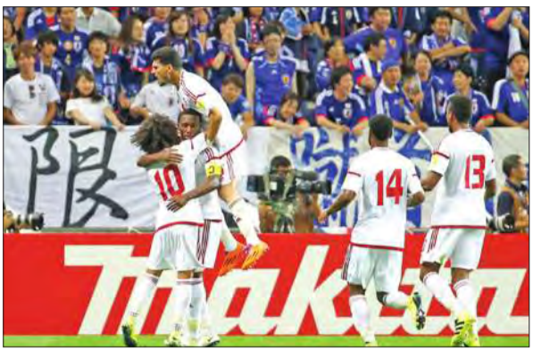
فرحة لاعبي منتخب الإمارات بعد الفوز على اليابان