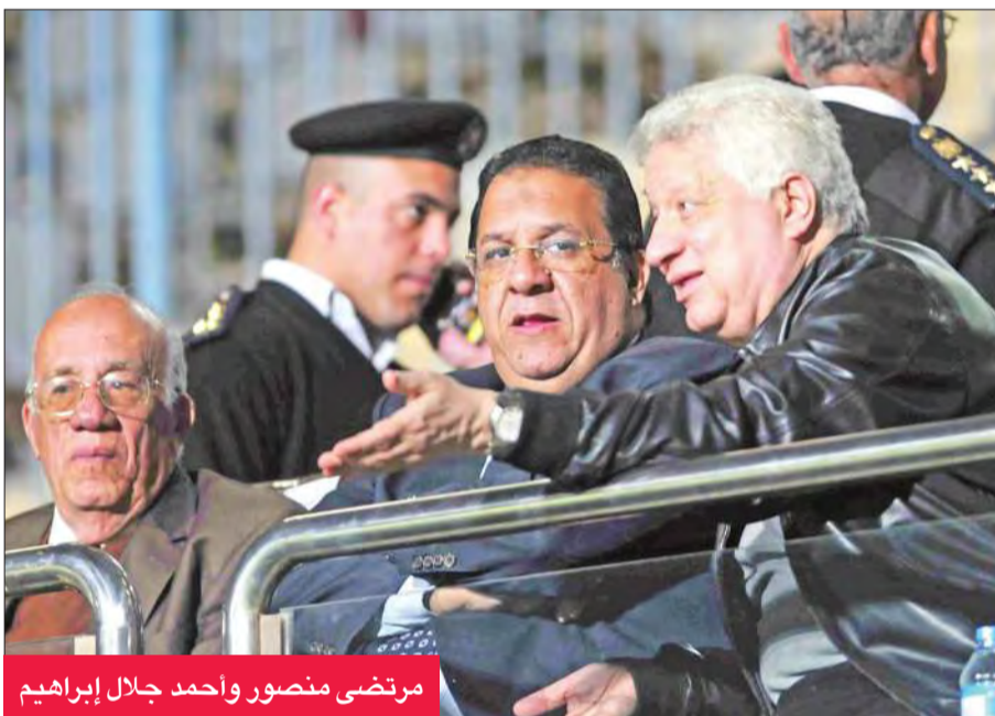
مرتضى منصور وأحمد جلال إبراهيم

يرتبط بعلاقة متوترة مع جماهير الأهلي منذ انضمامه للزمالك، خاصة بعد تسببه بشكل رئيسي في فوز الأبيض على الأحمر مرتين متتاليتين في نهائي كأس مصر عامي 2015 و2016، ليصبح بمنزلة كابوس للجماهير الأحمر. وأضاف أن اللاعب أبلغ مسؤولي ناديه رغبته في الاحتراف الخارجي خلال الفترة المقبلة بأحد الدوريات الأوروبية الكبرى، ليسير على