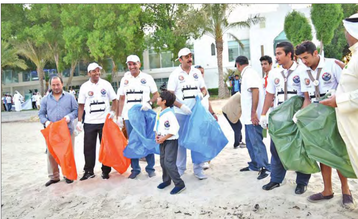
الفودري مشاركاً في الحملة

برعاية محافظ الأحمدية الشيخ فواز الخالد، افتتح المعرض البيئي الثاني وحملة تنظيف شاطئ ابوحليفة، بحضور ممثل المحافظ مدير إدارة المكتبة الفنية بالمحافظة رئيس مشروع «محافظة أجمل» إبراهيم