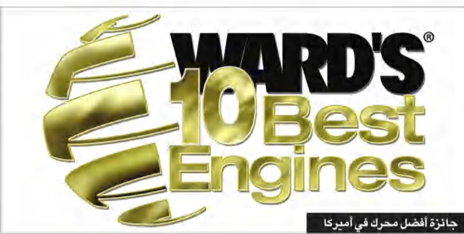
جائزة أفضل محرك في أمريكا

وتشكل القوة والكفاءة والقيمة جزءا أساسيا من كل سيارة تصنعها شركة فيات كرايسلر أوتوموبيلز (FCA)، ومن أنظمة نقل الحركة والمحركات الجديدة بنظام دفع يعمل بالبطارية والكهرباء، تولي FCA أهمية بالغة لهذه العناصر الثلاثة. ويتضح ذلك من خلال دعم FCA الكبير لتطوير أنظمة توليد قوة متقدمة، وبدا هذا الدعم بمجرد أن تأسست الشركة عام 2009، واعتبارا من طراز عام 2011 وحتى الوقت الحاضر، قدمت FCA نظام نقل حركة جديد 18 محركا جديدا ونظام دفع يعمل بالبطارية والكهرباء مجهزة به سيارة Fiat 500e الكهربائية بالكامل التي تحظى بإعجاب بالغ.