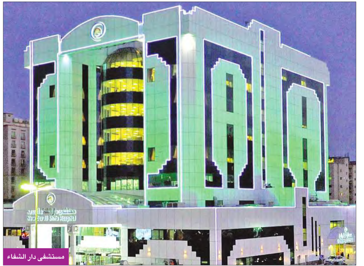
مستشفى دار الشفاء

يواصل قسم الجراحة العامة بمستشفى دار الشفاء مسيرته الناجحة، التي استمرت لما يزيد على 50 عاماً من الإصرار على تقديم كل ما هو حديث في مجال الجراحة، بجميع أنواعها، وذلك بتجهيز القسم بأحدث التكنولوجيا المتطورة، مع توافر الطاقم الطبي ذي الكفاءة العالية، من جراحين ذوي خبرة عالمية من داخل البلاد وخارجها وطاقم تمريضي عالي الكفاءة، ومدرب على أعلى المعايير،