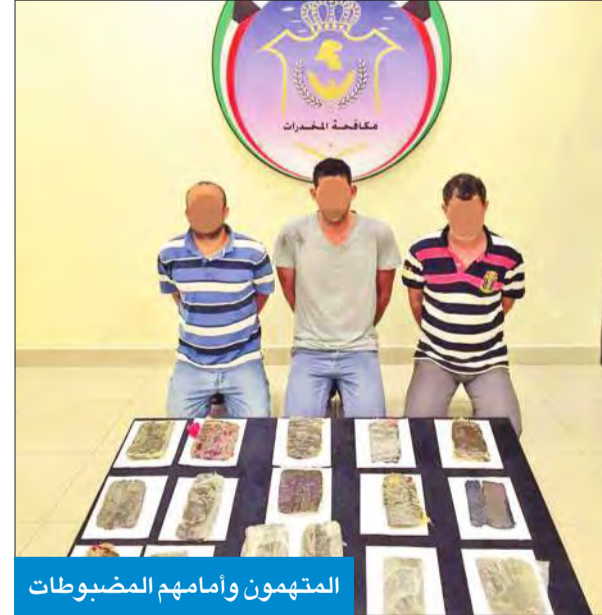
المتهمون وأمامهم المضبوطات

المتهمون اعترفوا لرجال المكافحة باتجارهم بالمخدرات