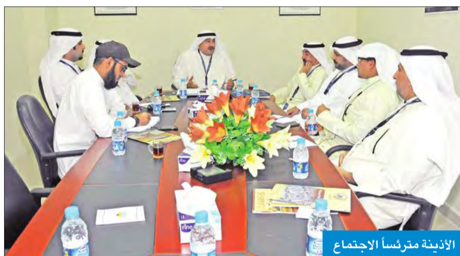
الأذينة مترئساً الاجتماع

وقال: «كل فريق يقوم بالمهام الموكلة إليه على أكمل وجه، وهذا ما لمستُه عن قرب من الجميع وأفرحنا وأثلج صدورنا، ويؤكد أننا نسير في الاتجاه الصحيح، إذ نتج عنه أننا تسلمنا جميع الأراضي الخاصة بنا في مزدلفة ومني وعرفات بوقت مبكر، نتيجة التعاون الكبير مع مؤسسة الدول العربية للطواف». وأشار إلى أن «العمل جار على قدم وساق لتجهيز مقر البعثة في تلك الأراضي»، داعياً رؤساء فرق بعثة الحج الكويتية إلى ترجمة الخطط التي رسموها آلياً