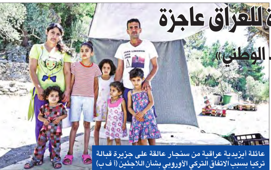
عائلة أيزيدية عراقية من سنجان عالقة على جزيرة قبالة تركيا بسبب الاتفاق التركي الأوروبي بشأن اللاجئين

ويحسب تقرير للمجلس، فإن هناك 70 ألف مقاتل إلى جانب النظام يشكلون رأس الحربة وخط الدفاع الأول عنه، وهم موزعون على الشكل التالي: 8000 إلى 10 آلاف من الحرس الثوري الإيراني، و5000 إلى 6000 من الجيش الإيراني، و20 ألفاً من الميليشيات الشيعية، و7000 إلى 10 آلاف من ميليشيات حزب الله، و15 ألفاً إلى 20 ألفاً من الميليشيات الأفغانية المسماة «لواء فاطميون».