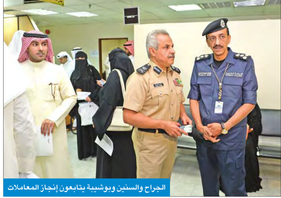
الجراح والسنيين وبوشيبه يتابعون إنجاز المعاملات

ووثائق السفر وشؤون الإقامة اللواء الشيخ مازن الجراح ومدير الجنسية محمد بو شيبه، انه بناء على تعليمات نائب رئيس مجلس الوزراء وزير الداخلية الشيخ محمد الخالد ووكيل وزارة الداخلية الفريق سليمان الفهد والوكيل المساعد لشؤون الجنسية ووثائق السفر اللواء الشيخ مازن الجراح استعدت الادارة لاستقبال الأشخاص المشمولين بالمكرمة الاميرية