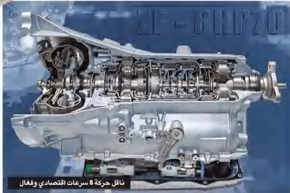
ناقل حركة 8 سرعات اقتصادي وفعال