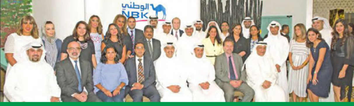
صورة جماعية لعدد من قيادات «الوطني» مع الدفعة الجديدة من متدربي البنك في الجامعة الأميركية ببيروت

الصقر: البنك يلتزم بالاستثمار في الطاقات الشبابية الواعدة وصقل مهاراتهم