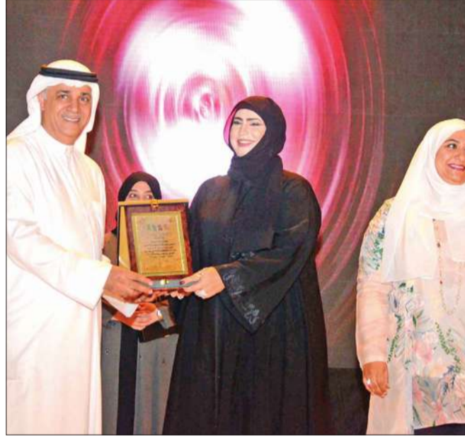
جانب من التكريم