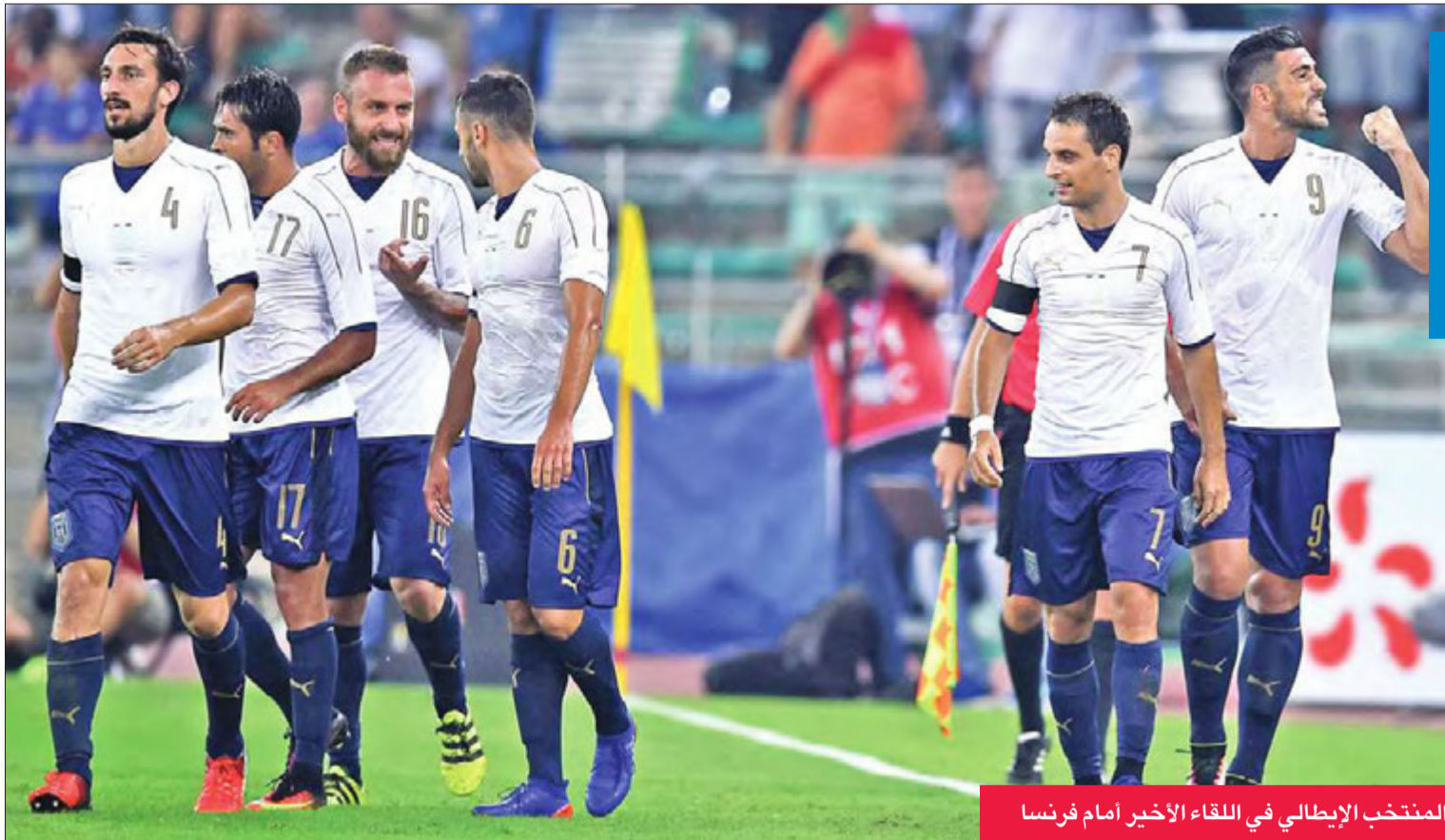
المنتخب الإيطالي في اللقاء الأخير أمام فرنسا

بات جيامبيرو فينتورا مطالباً بتصحيح الأوضاع بأسرع وقت ممكن، بعد البداية المخيبة للآمال لمشواره في منصب المدير الفني للمنتخب الإيطالي.