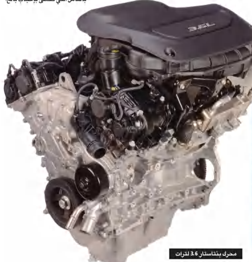
محرك بنتاستار 3.6 لترات

تصميمه، تحسينات بالاقتصاد في استهلاك الوقود بنسبة تزيد على 6 في المئة مع زيادة عزم الدوران بنسبة تزيد على 14.9 في المئة، ويحدث هذا عندما تكون سرعة المحرك أدنى من 3000 دورة في الدقيقة، حيث يكون لعزم الدوران المرتفع تأثير عميق على تجربة القيادة.