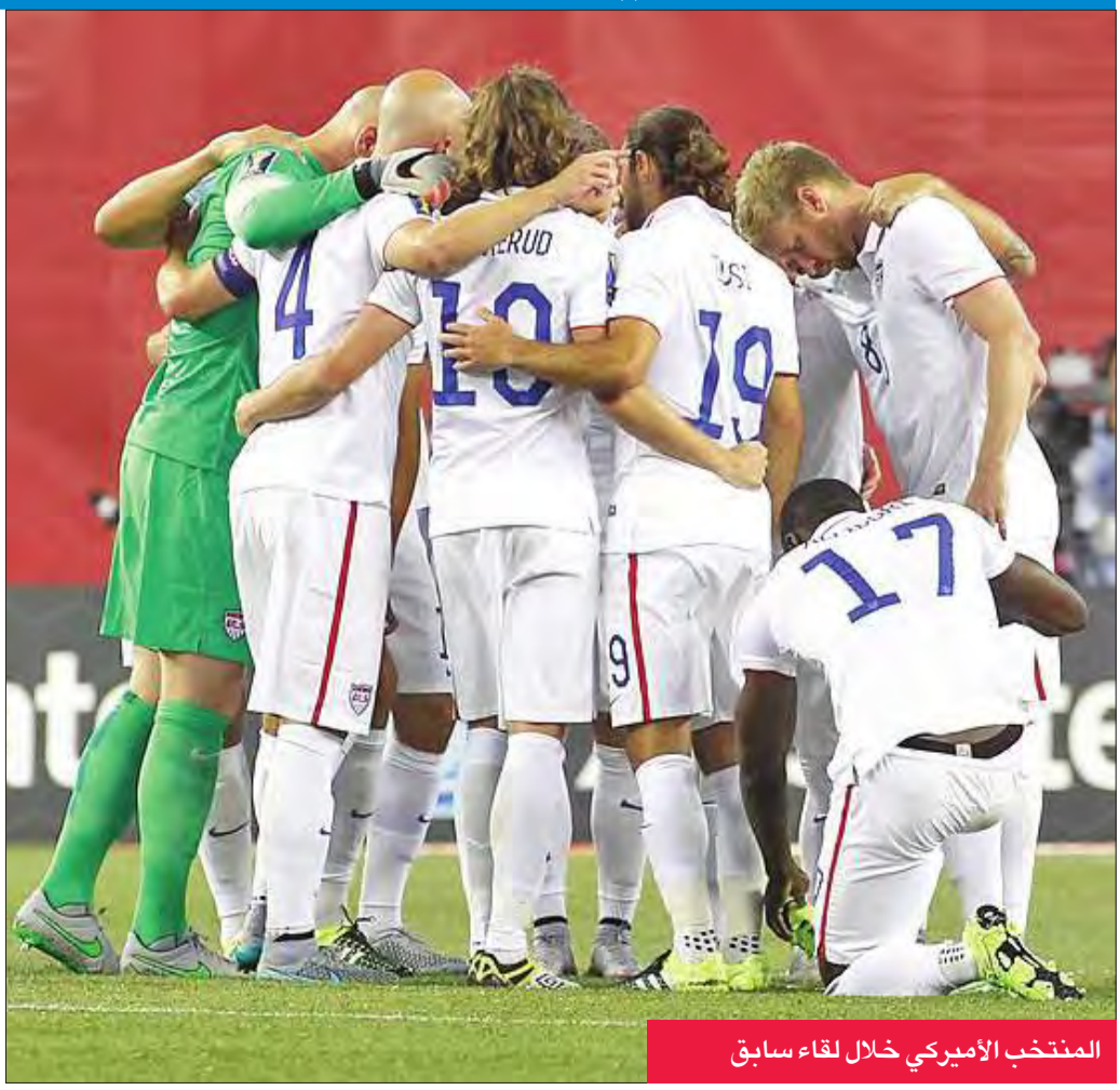
المنتخب الأميركي خلال لقاء سابق

وتتصدر ترينيداد وتوباغو المجموعة برصيد 11 نقطة، فيما تأتي غواتيمالا في المركز الثالث بسبع نقاط، لكن الولايات المتحدة تتفوق عليها بفارق 12 هدفاً.