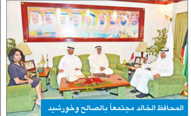
المحافظ الخالد مجتمعاً بالصالح وخورشيد

أكد محافظ الأحمدية الشيخ فواز الخالد أهمية السياحة والترويج كركيزة من ركائز الاقتصاد والتطور الاجتماعي للمجتمعات على امتداد العالم، مجدداً التأكيد على المقومات السياحية الواعدة للكويت، والتي يمكن أن تجعل السياحة رافداً اقتصادياً وقيمة مضافة إلى مصادر الدخل في البلاد.