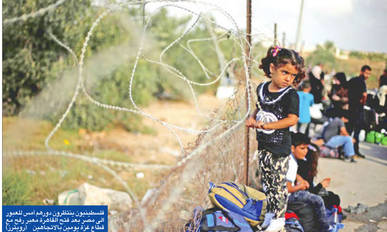
فلسطينيون ينتظرون دورهم أمس للعبور إلى مصر بعد فتح القاهرة معبر رفح مع قطاع غزة يومين بالاتجاهين

«الخارجية» تتجاهل تصريحات يلدريم الإيجابية وأنفرة طلبت اجتماعاً مع القاهرة... وموسكو على الخط