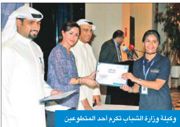
وكيلة وزارة الشباب تكرم أحد المتطوعين