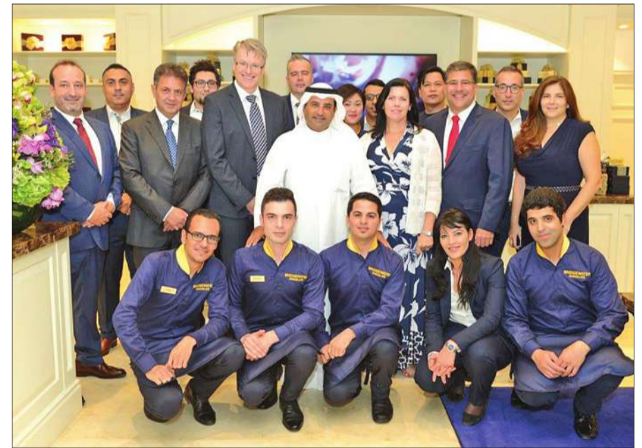
الشايح متوسطاً فريق العمل والقياديين