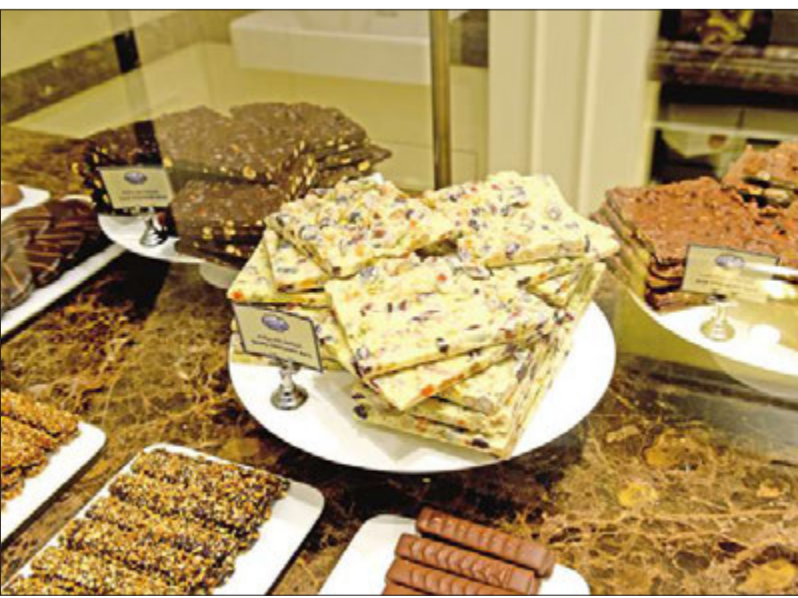
منتجات تحتوي على المكسرات والفواكه