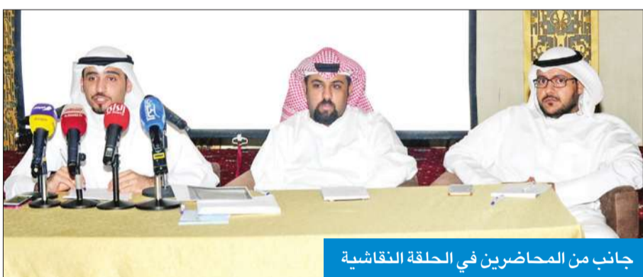
جانب من المحاضرين في الحلقة النقاشية

«هل يطبق القرار بأثر رجعي رغم حصول المستمدين على موافقات؟»