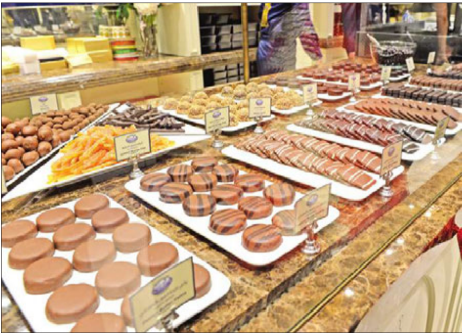
مجموعة واسعة من أصناف الشوكولا المصنوعة من الكاكاو الطبيعي