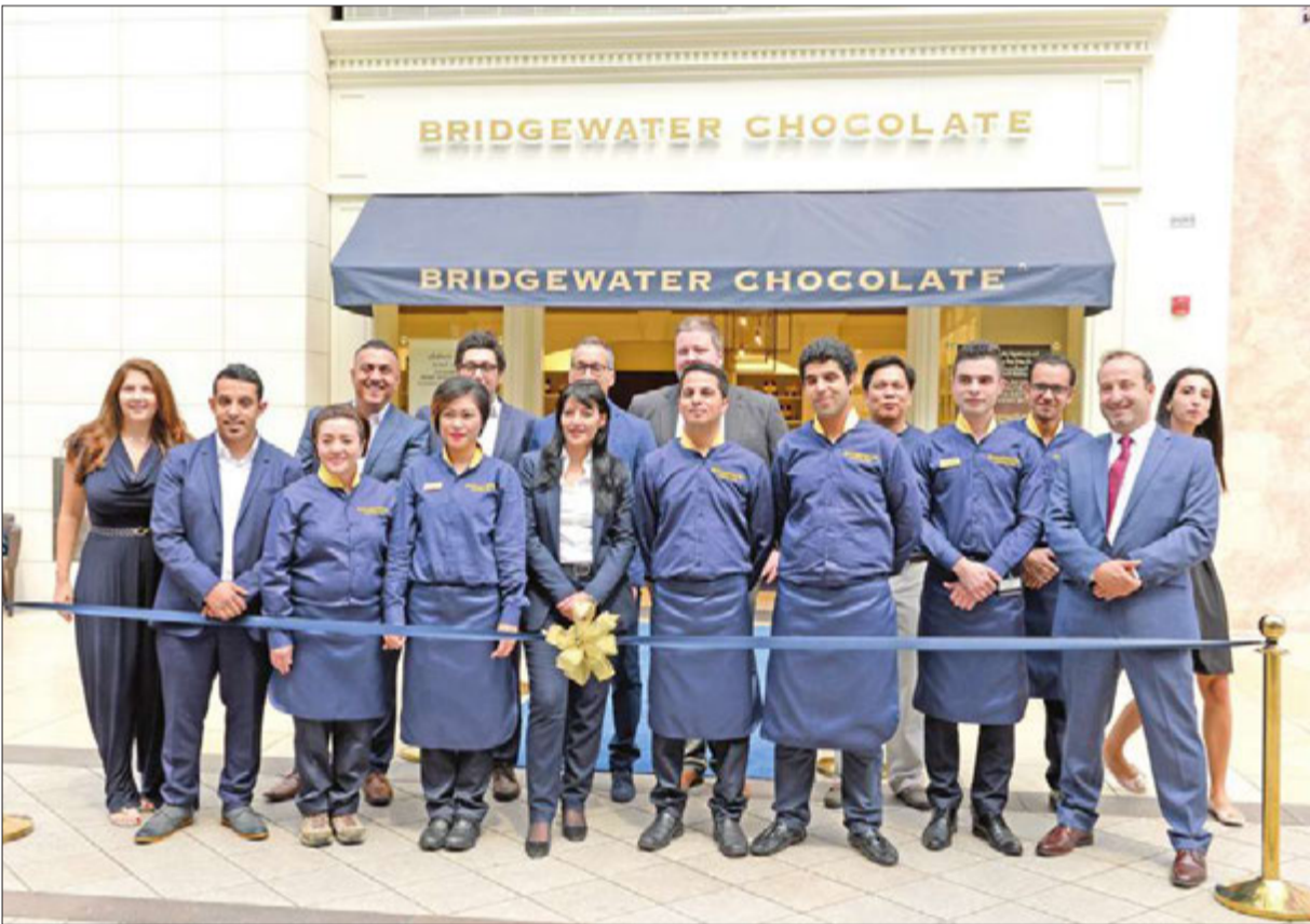
صورة جماعية لفريق العمل

من جانبه، قال لاندغرين: «مما لا شك فيه، أن الشغف بالشوكولا ذات المذاق المميز والجودة العالية هو عامل مشترك بين زبائننا في الكويت ونظرانهم في أميركا. ونحن نفتخر باننا نقدم أصنافاً متنوعة من الشوكولا التي نحضرها يدوياً، كما أننا متحمسون جداً لتقديم علامتنا التجارية ومنتجاتها المميزة في الشرق الأوسط، من خلال شراكتنا مع شركة الشايح، وكلنا ثقة بأن زبائننا في المنطقة سوف يحبون شوكولا بريدج واتر، بعد أن يجربوا مذاقها الفريد».