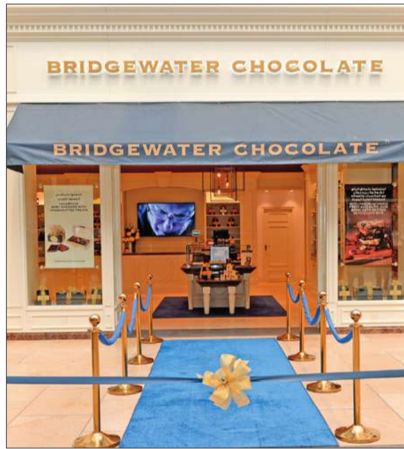
واجهة محل «شوكولا بريدج واتر»