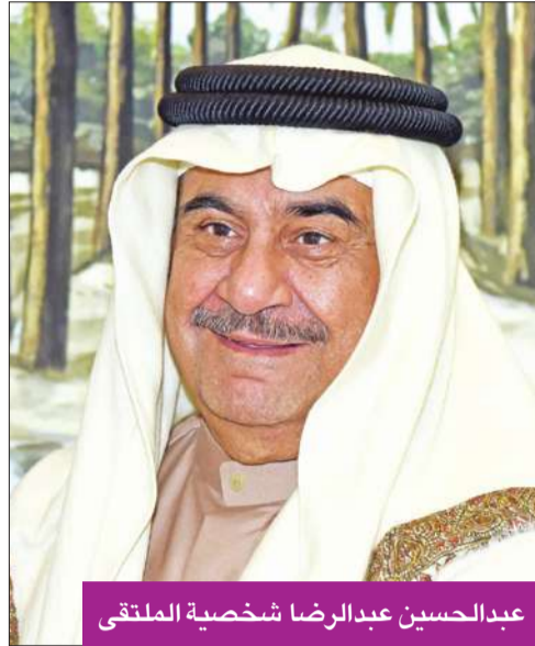
عبدالحسين عبدالرضا شخصية الملتقى