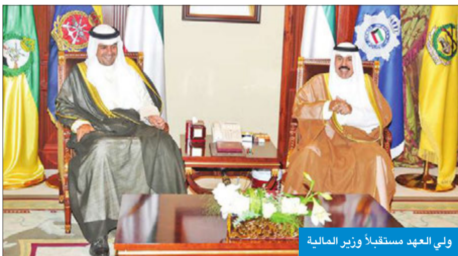
ولي العهد مستقبلاً وزير المالية

أكدت أهمية الدور الذي يقوم به سفراء الكويت في الخارج من خلال العمل على إبراز المكانة التي تحتلها الكويت، ورفع رايتهما في المحافل الدولية، وتعزيز علاقاتها الثنائية مع الدول المعتمدين فيها، مشيراً إلى فتح آفاق جديدة لمزيد من التعاون والمشاركة بما ينسجم مع رسالة الدولة السامية ومصلحتها العليا ويسهم مع رسالة الدولة السامية ومصلحتها والتعاون وتحقيق السلم العالمي.