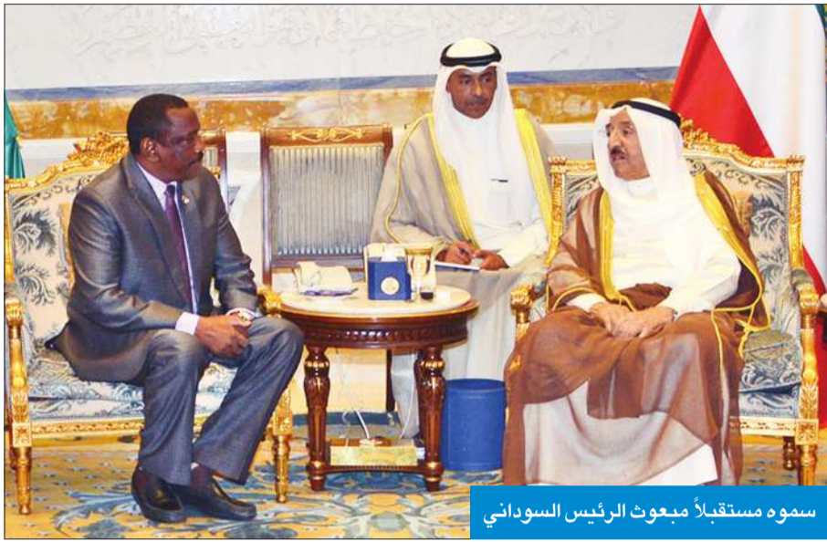
سمو مستقبلاً بمبعوث الرئيس السوداني