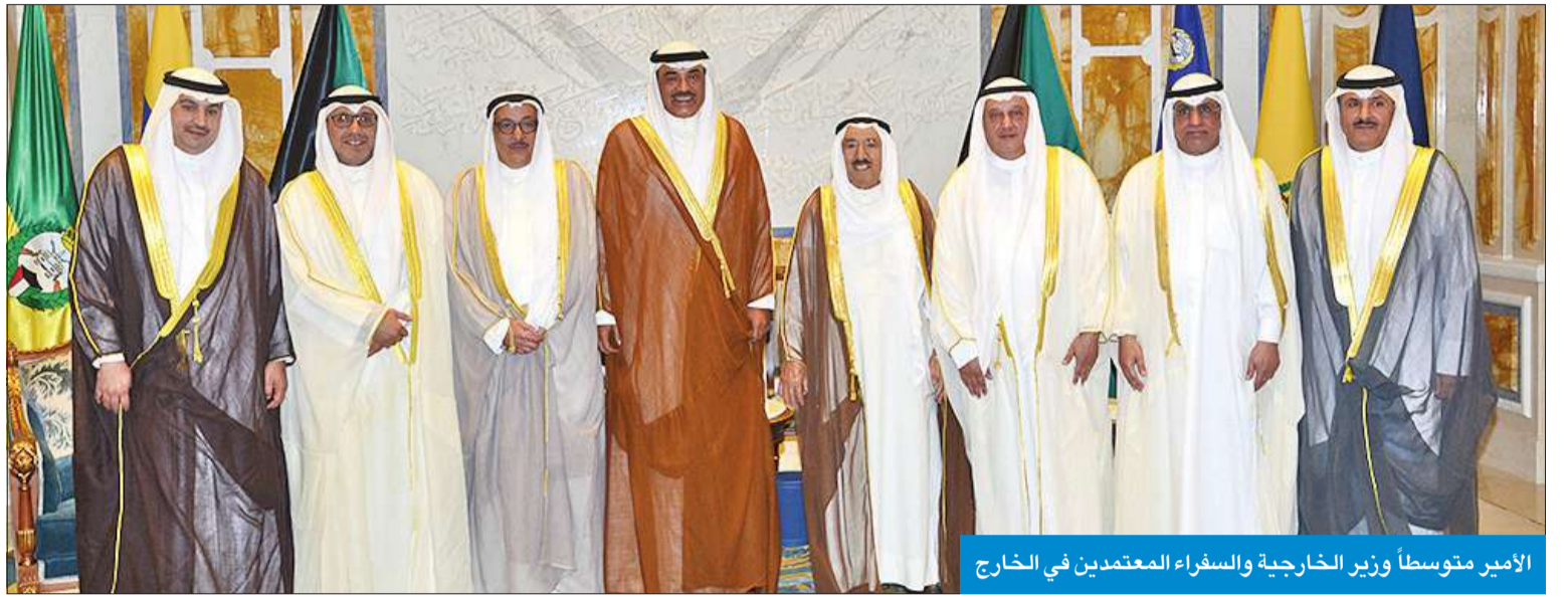
الأمير متوسماً وزير الخارجية والسفراء المعتمدين في الخارج