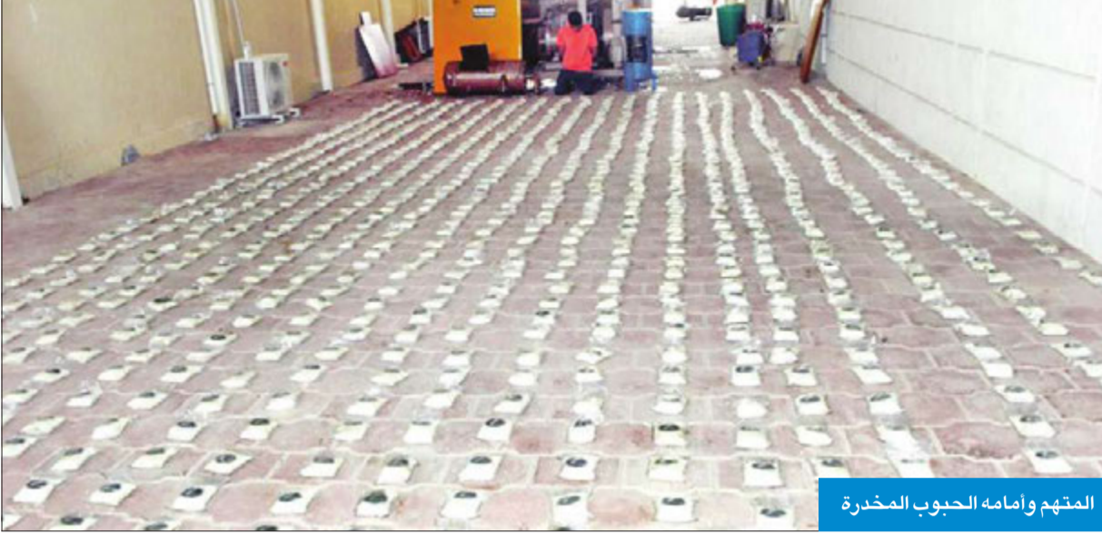
المتهم وأمامه الحبوب المخدرة