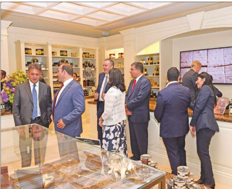
جولة في أركان محل شوكولا بريدج واتر