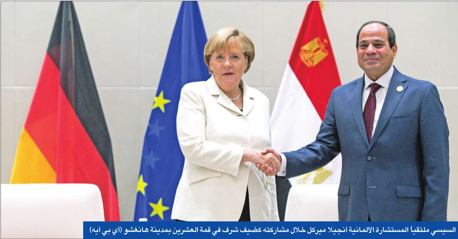
السياسي ملتقى المستشار الألمانية أنجيلا ميركل خلال مشاركته كضيف شرف في قمة العشرين بمدينة هانغشو

● تعديل «التظاهر» إلى الدور الثاني لانعقاد المجلس والقوى المدنية متشائمة ● مسلحون يقنصون جندياً في رفح