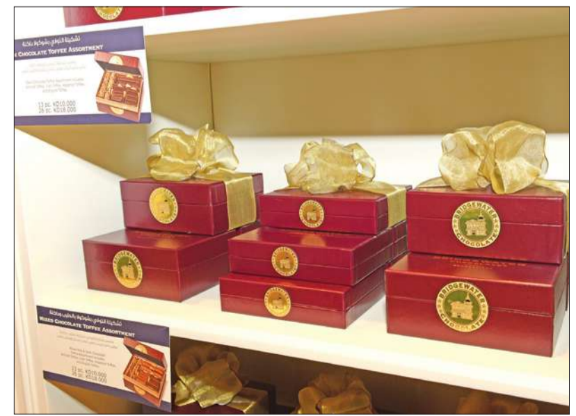
تغليف كل قطعة من الشوكولا يدوياً بحرفية وإتقان كبيرين