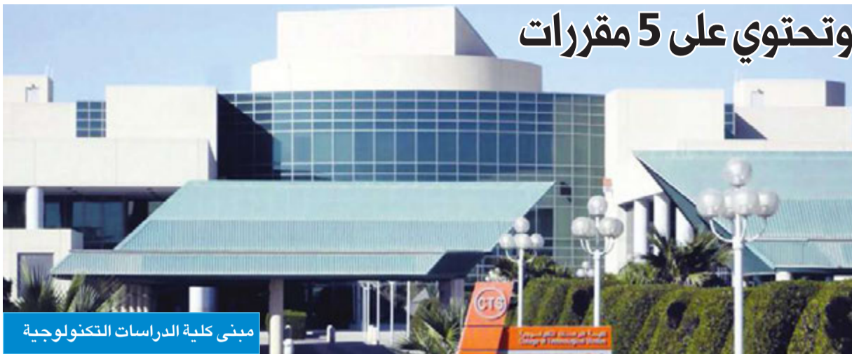
مبنى كلية الدراسات التكنولوجية

وأوضح المزروعي لـ «الجريدة» أن «الدراسات التكنولوجية» حظيت بنجاح في طرح نظام الجدول الدراسي الثابت للطلبة المستجدين، لافتاً إلى فتح شعب دراسية وتوفيرها بشكل أفضل عن السنوات الدراسية الماضية، التي