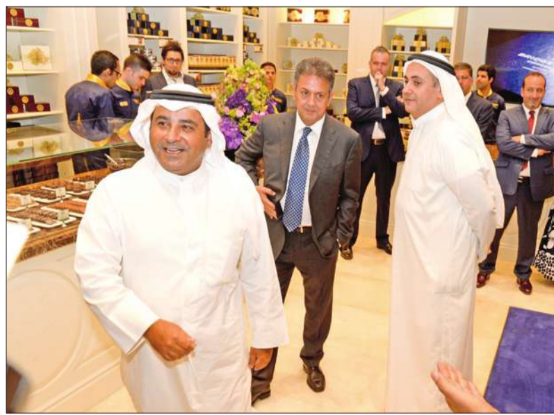
الشايح خلال اطلاعه على مجموعة متنوعة من أصناف الشوكولا