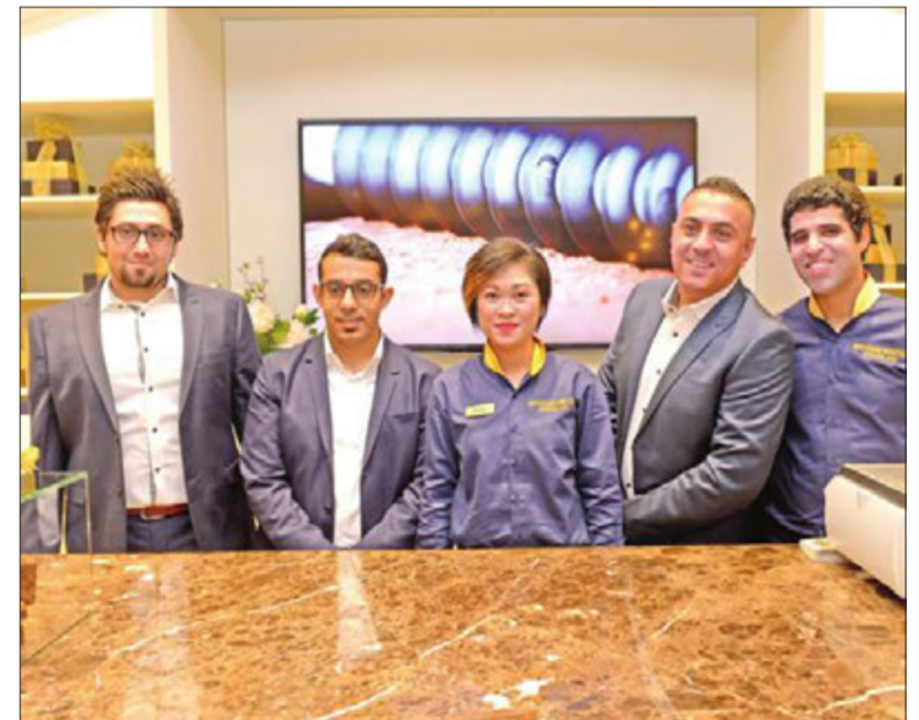
بعض موظفي محل شوكولا بريدج