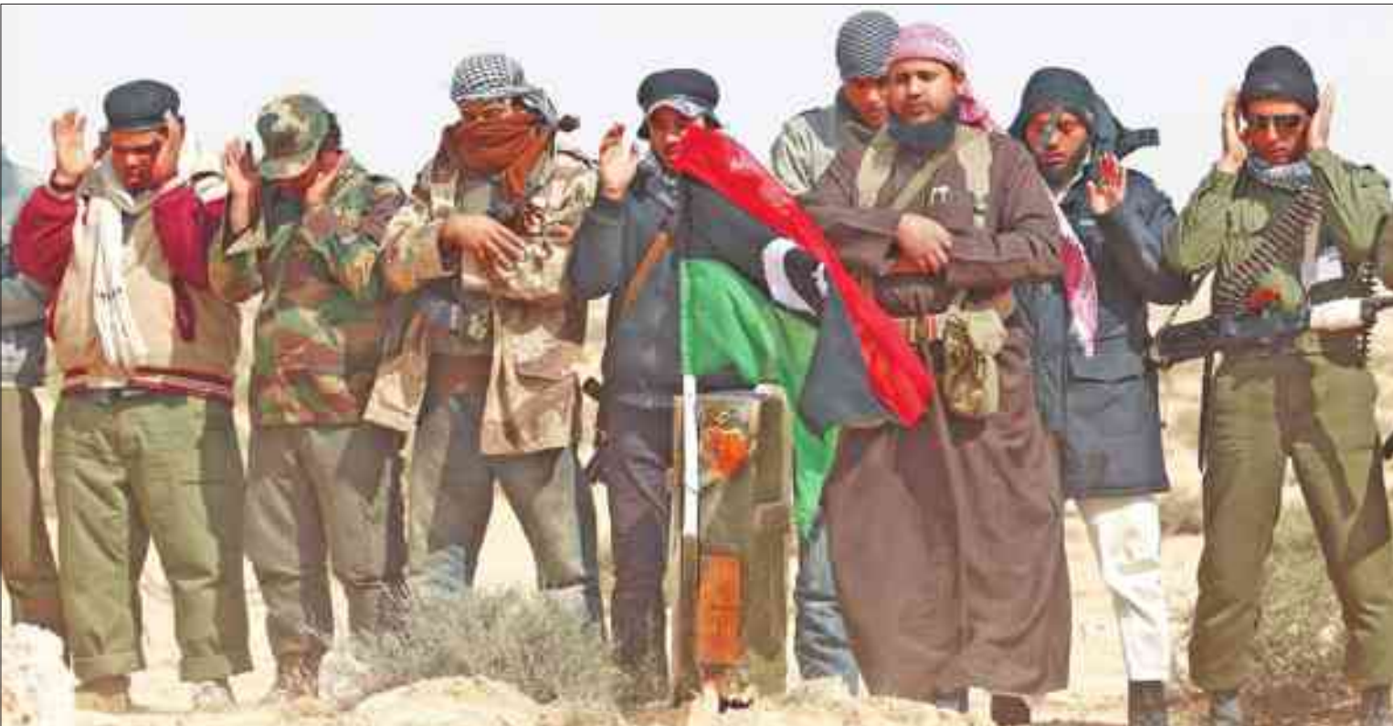
مقاتلون ليبيا يودون صلاة الجنائز على زملاء لهم قتلوا في غارة جوية لقوات التحالف التي تدخلت للإطاحة بالقدافي مطلع 2011

إيطاليا ترسل 300 جندي إلى مصراتة • باريس تحذر من تفكك ليبيا وبريطانيا تراجع الإطاحة بالقدافي