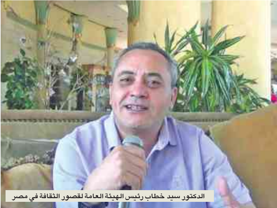
الدكتور سيد خطاب رئيس الهيئة العامة لقصور الثقافة في مصر

طبعاً، فهذا الأمر يضعف الاستقرار العام وتنفيذ الخطط المتاحة، لكن الهيئة كانت تتمتع بميزة كبيرة جداً، هي أن الرؤساء