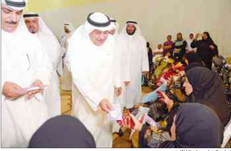
توزيع العيادي على النزلاء