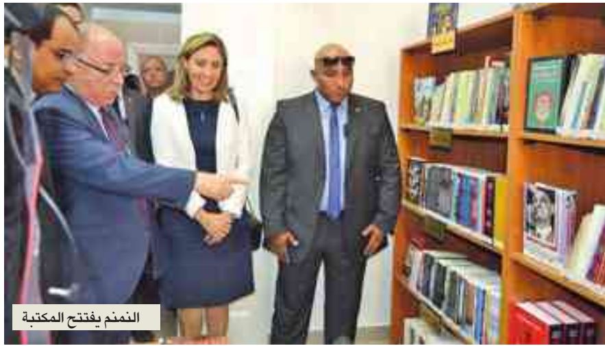
النمنم يفتتح المكتبة

يأتي افتتاح المكتبة بمثابة تكريم للزعيم الراحل، في المدينة التي شهدت ميلاده وسنوات طفولته الأولى، ذلك ضمن مخطط