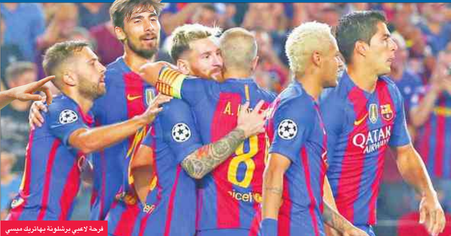
فرحة لاعبي برشلونة بهاتريك ميسي

مسعود أوزيل كرة عرضية داخل المنطقة هاما النيجيري اليكس ايوي لنفسه وسدها قوية بيمينه ارتدت من الحارس الفونس اريولا، وتهيأت أمام الدولي التشيلي اليكسيس سانشيز فسدها قوية بيمينه على يمين الحارس الباريسي (78).