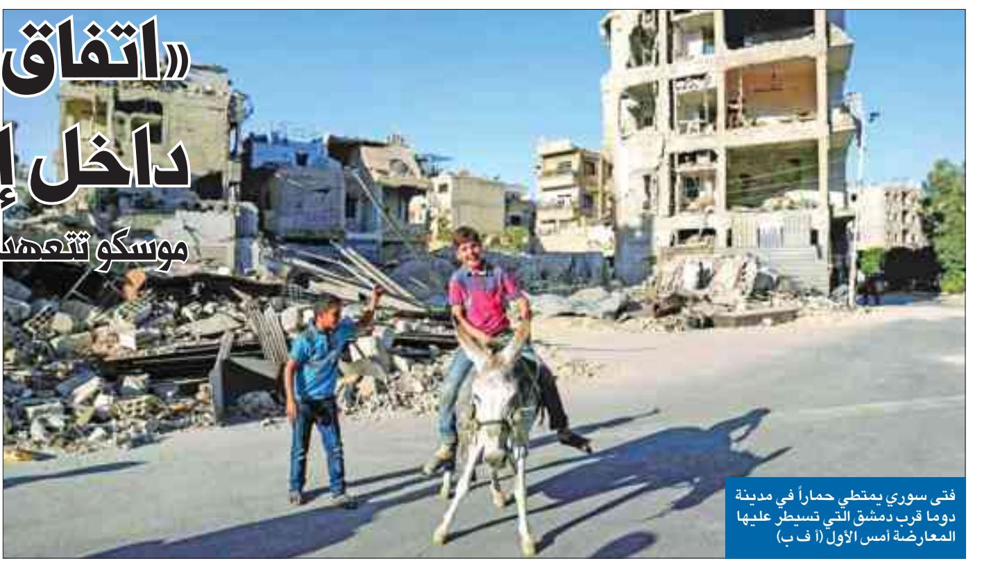
فتى سوري يمتطي حماراً في مدينة دوما قرب دمشق التي تسيطر عليها المعارضة أمس الأول

أثار الاتفاق الروسي، الأمريكي بشأن سورية خلافات داخل إدارة الرئيس الأمريكي باراك أوباما، التي تستعد للرحيل بعد أشهر. وحاول وزير الخارجية الأمريكي جون كيري، أمس، الدفاع عن الاتفاق، معتبراً إياه الفرصة الأخيرة لـ «الإبقاء على سورية موحدة». وكان مسؤولون كبار في وزارة الدفاع (البننتاغون) والجيش والمخابرات انتقدوا الاتفاق، قائلين إنه لا يمكن الوثوق بموسكو التي ستقدم لها واشنطن بمقتضى الاتفاق