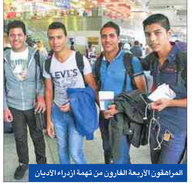
المراهقون الأربعة الفارون من تهمة ازدراء الأديان

وبينما شهد البرلمان قبل شهر، جدلاً بشأن تعديل هذه المادة التي أُرجت إلى دور الانعقاد الثاني للبرلمان المقرر انطلاقه مطلع أكتوبر المقبل، زادت المخاوف من تأثير فرار الشباب الأقباط على سمعة مصر الخارجية، حيث قالت مصادر قبيلية، إن الفارين الأربعة وهم