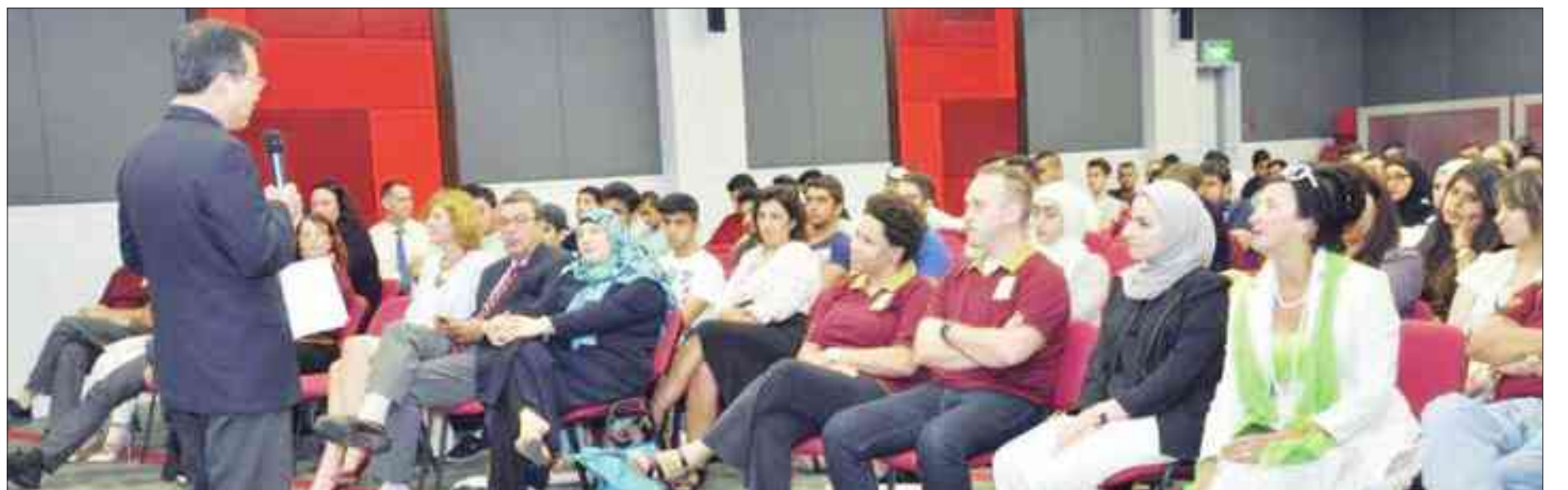
جانب من المشاركين في الجلسات الإرشادية