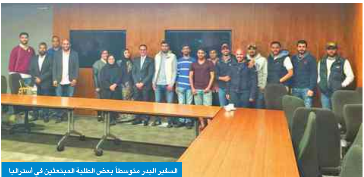
السفير البدر متوسطاً بعض الطلبة المبتعثين في أستراليا

به جامعاتها من جودة عالية في التعليم. وقال إن وزير التعليم الدولي والسياحة أعلن أن أستراليا تأتي بالمرتبة الثالثة كوجهة مفضلة للطلبة في العالم، بعد أميركا والمملكة المتحدة، وبلغت وارداتها من الخدمات التعليمية ما يقارب 20 مليار دولار أسترالي عام 2015.