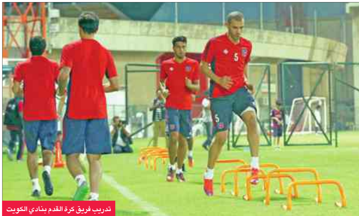
تدريب فريق كرة القدم بنادي الكويت

المقبل، بيد أن مشاركاتهم في السوبر تعود للجهز الفني، ومدى جاهزيتهم البدنية للمباراة. واتفق الكويت على أن تكون آخر مبارياته الودية استعدادا للسوبر أمام الفحيحيل الأحد المقبل، على استاد نادي الكويت، بعدها سيعتقد الأبيض على خطة مواجهة القادسية في السوبر.