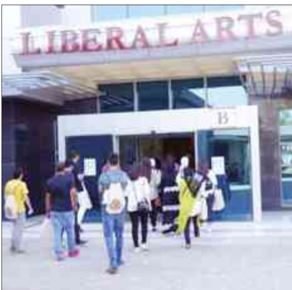
جولة للطلاب الجدد في مكتبة الجامعة