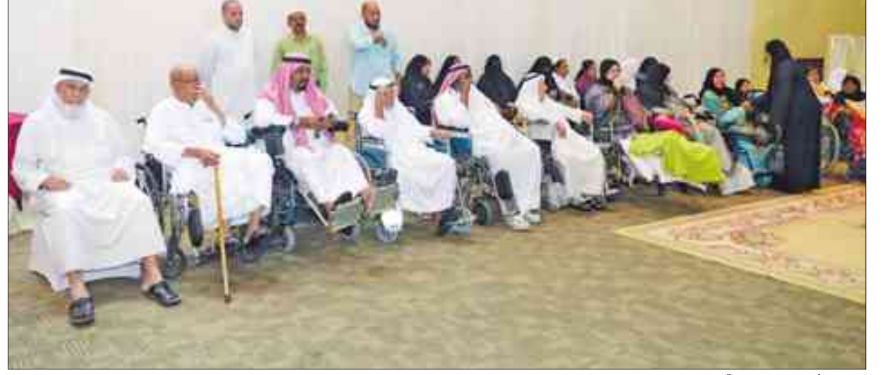
عدد من أبناء دور الرعاية