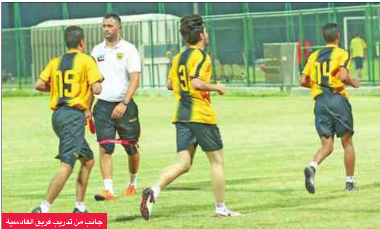
جانب من تدريب فريق القادسية

الأصفر يختم استعداداته بمواجهة السماوي... والأبيض يختار الفحيحيل