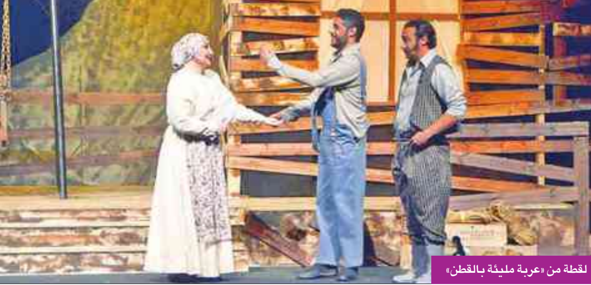
لقطة من «عربة مليئة بالقطن»

وأشار الشطبي إلى أن هذه المسرحية مأخوذة عن نص عالمي للمؤلف البلغاري ست كوستوف، وإعداد نادبة القناعي،