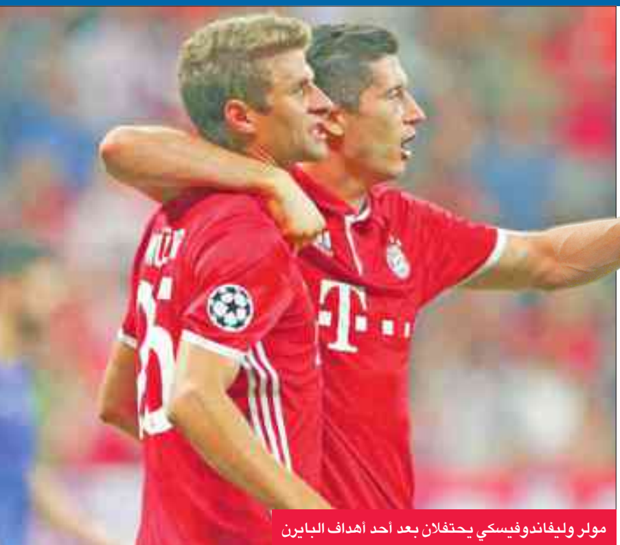
مولر وليفاندوفيسكي يحتفلان بعد أحد أهداف البايرن