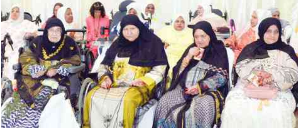
مجموعة من نزيلات دور الرعاية

احتفالاً بعيد الأضحى، قام وكيل وزارة الشؤون د. مطر المطيري، بزيارة نزلاء دور الرعاية، وقام بتهنئتهم بالعيد، وتوزيع العيادي عليهم، ومشاركتهم فرحة العيد. ويجتمع في هذا اليوم المسؤولون والعاملون، وكل من في دور الرعاية من مسنين ومعاقين وأطفال.