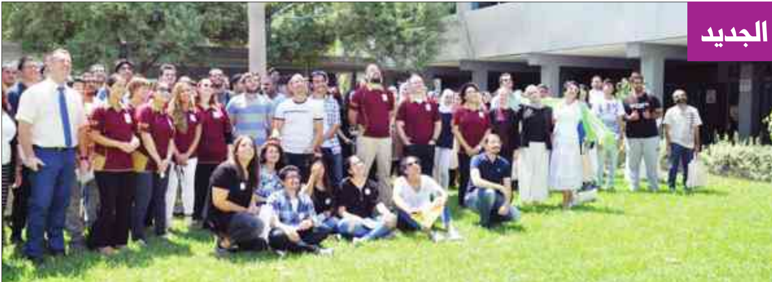
صورة جماعية للطلاب الجدد