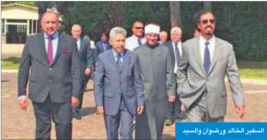
السفير الخالد ورضوان والسيد

العالمية إيماناً بقدرة الثقافة على اذابة الحواجز بين شعوب العالم. من جانبه، أشاد الأمين العام للمركز الثقافي الإسلامي في إيطاليا د. عبدالرحمن رضوان بمبادرة سفارة الكويت والسفير الخالد التي تعد الأولى من نوعها وللعام الثاني على التوالي بدعوة السفراء العرب والمسلمين والفعاليات الإسلامية الرئيسية في روما وفي المركز الإسلامي، وقال د. رضوان «كونا» إن سفارة الكويت أول سفارة لدولة عربية وإسلامية منذ العام الماضي تتولى إحياء الاحتفاء بعباد المسلمين في إيطاليا، مبرهاً عن ترحيب المركز الثقافي الإسلامي بمبادرة الكويت التي «تأتي في وقتنا هذا نظراً للمظرف الدولي الصعب على الصعيد الإسلامي والأزمات التي تعيشها عدة مناطق عربية وإسلامية».