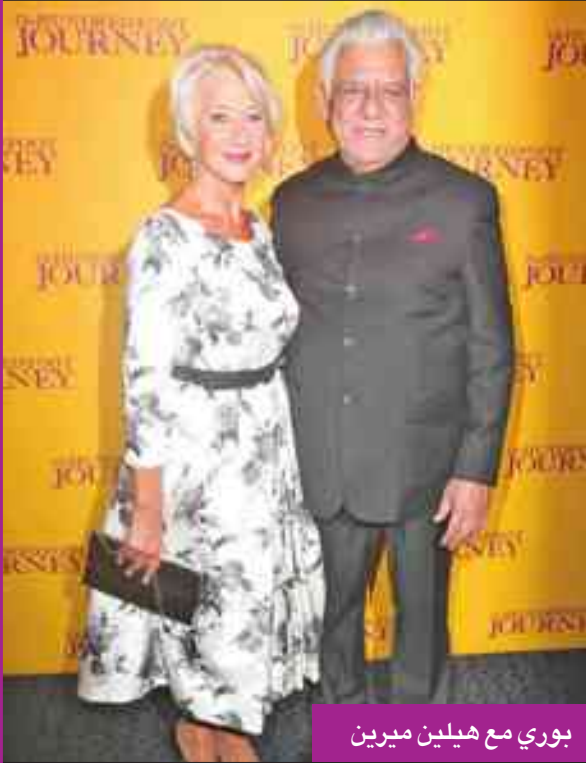
بوري مع هيلين ميرين

صانعي الأفلام من إنتاج أفلام بيميزانيات أكبر. وقال بوري، الذي مثل أيضاً في بضعة أفلام تتناول التطرف الديني مثل «الأصولي الممانع»، إنه يأمل أن يساعد تمثيل مثل هذه الأدوار في تغيير أنماط التفكير لدى الأشخاص الذين ينحرفون إلى الإرهاب، خصوصاً في عالم اليوم.