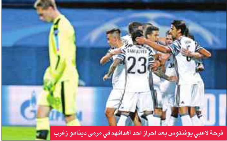
فرحة لاعبي يوفنتوس بعد إحراز احد اهدافهم في مرعى دينامو زغرب