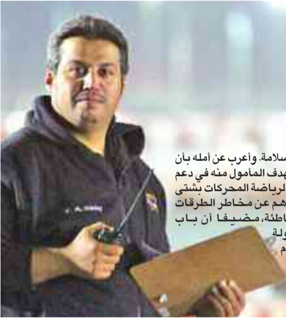
تحقيقاً للأمن والسلامة، وأرب عن أمه لأن يحقق التعاون الهدف المأمول منه في دعم الشباب الممارس لرياضة المحركات بشتى أنواعها، وإبعادهم عن مخاطر الطرقات والممارسات الخاطئة، مضيئاً أن باب التسجيل للبطولة مفتوح حتى اليوم في إدارة النادي. (كونا)

التي تعد المتفلس الأول لهم، للاستفادة من قدراتهم في أطر أمنة محاطة بتنظيم يكفل إخراجها بالصورة المنشودة.