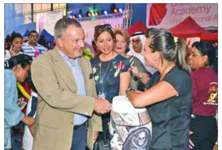
السفير لودج خلال جولته في الكرنفال