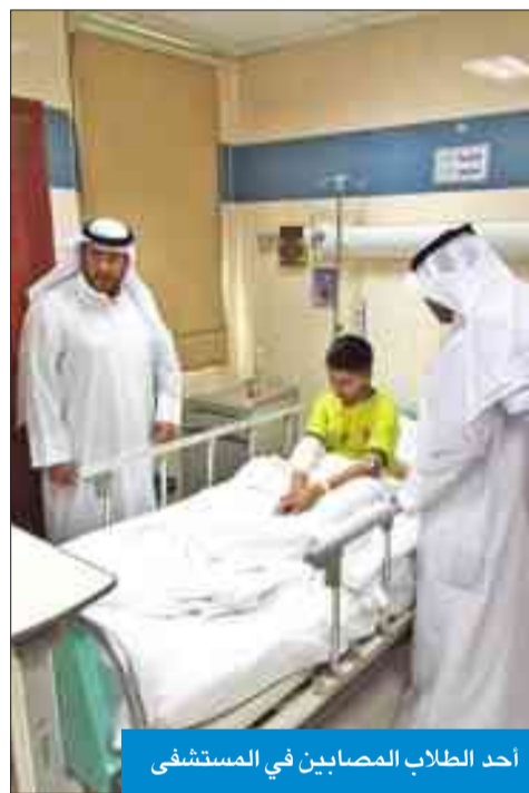
أحد الطلاب المصابين في المستشفى

مدرسة خاصة صباح أمس، أسفر عن إصابة 4 طلاب بإصابات متفرقة. وقال الحوية، في تصريح للصحافيين إنه بمجرد سماعه بخبر الحادث اتصل بمسؤولي المدرسة،