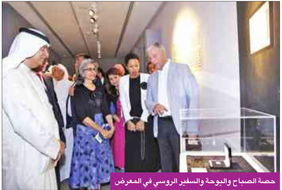
حصة الصباح واليوحة والسفير الروسي في المعرض

أقامت دار الآثار الإسلامية بالتعاون مع السفارة الروسية في الكويت معرضاً تحت عنوان «مكة بالفضة... رمزية الحج في طوايع بالمركز الأمريكي الثقافي في منطقة القبلة. يضم المعرض 40 نسخة طبق الأصل من طوايع بريدية من الفضة الخالصة بعيار 999، مهداة لمدينة مكة المكرمة تم سكها في دار المسكوكات التابعة لوزارة المالية الروسية في موسكو. واعتمدت الدار في استنساخ هذه الطوايع على نسخ أصلية منها صدرت في أزمنة مختلفة في 24 دولة مسلمة. واستغرق صنع هذه المجموعة من الطوايع ثلاثة أعوام، وشارك في إعدادها مجموعة من العلماء والخبراء والفنانين والمهندسين والمصممين والنحاتين، فضلاً عن رسامين.