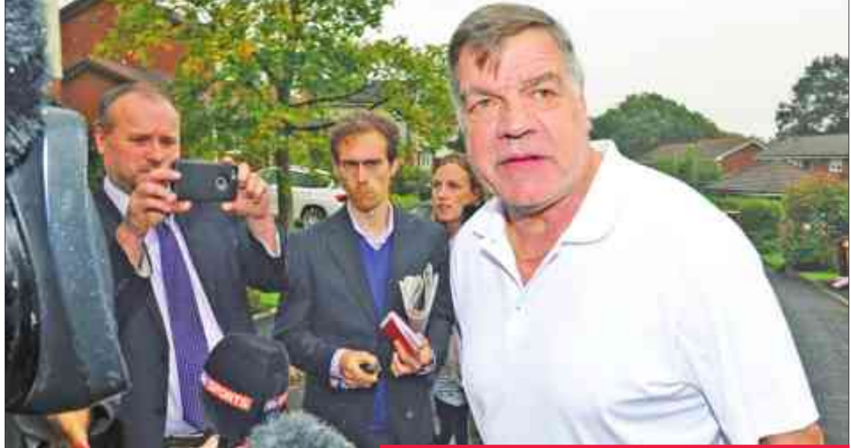
سام الأردايس محاطاً بالصحافيين لحظة مغادرته المنزل يوم أمس

الإنكليزي في المباريات الأربعة المقبلة أمام كل من مالطا وسلوفينيا واسكتلندا وإسبانيا، لحين تعيين بديل دائم للمدرب المقال الأردايس. وسيقود ساونجيت، المدرب الحالي لمنخب إنكلترا تحت 21 عاماً. وقال الاتحاد الإنكليزي في بيان «سيقود ساونجيت المنتخب الوطني الأول في الاستحقاقات الأربعة المقبلة أمام مالطا وسلوفينيا واسكتلندا وإسبانيا، إلى حين تعيين مدرب جديد».