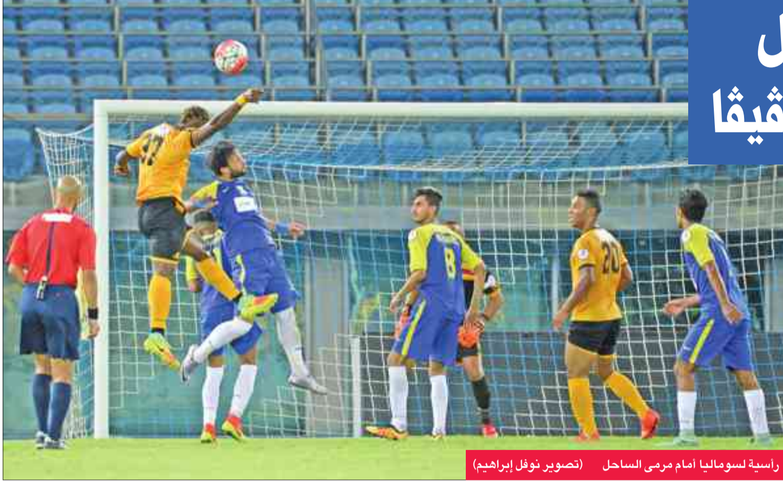
راسية لسوماليا أمام مرمى الساحل