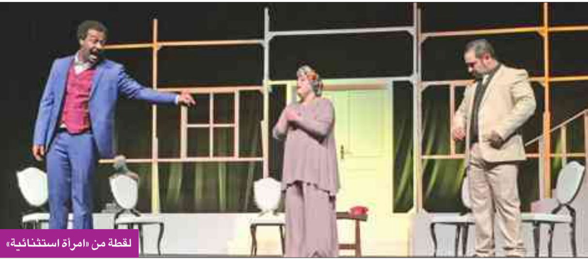
لقطة من «امرأة استثنائية»

حقق عرض «امرأة استثنائية» لفرقة المسرح العربي أهداف مهرجان «ليالي مسرحية كوميدية» في دورته الأولى.