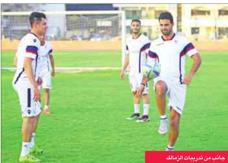
جانب من تدريبات الزمالك

تأجيل مباراته مع الزمالك وفوزه في الجولة الأولى على المصري البورسعيدي، لتحقيق نتيجة إيجابية أمام الدراويش، الذي حقق فوزاً على الإنتاج الحربي في الجولة الماضية بهدف دون رد. في المقابل استقر عماد