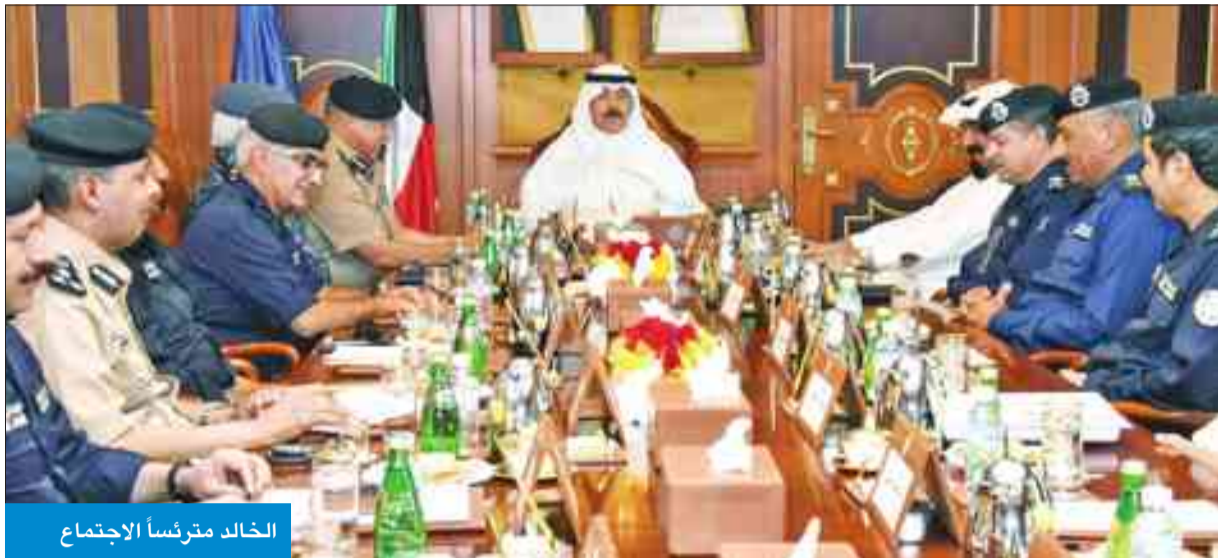
الخالد مترأساً الاجتماع

ترأس اجتماعاً بحضور الفهد وفريق العمليات الأمنية الميدانية الخاصة بشهر المحرم