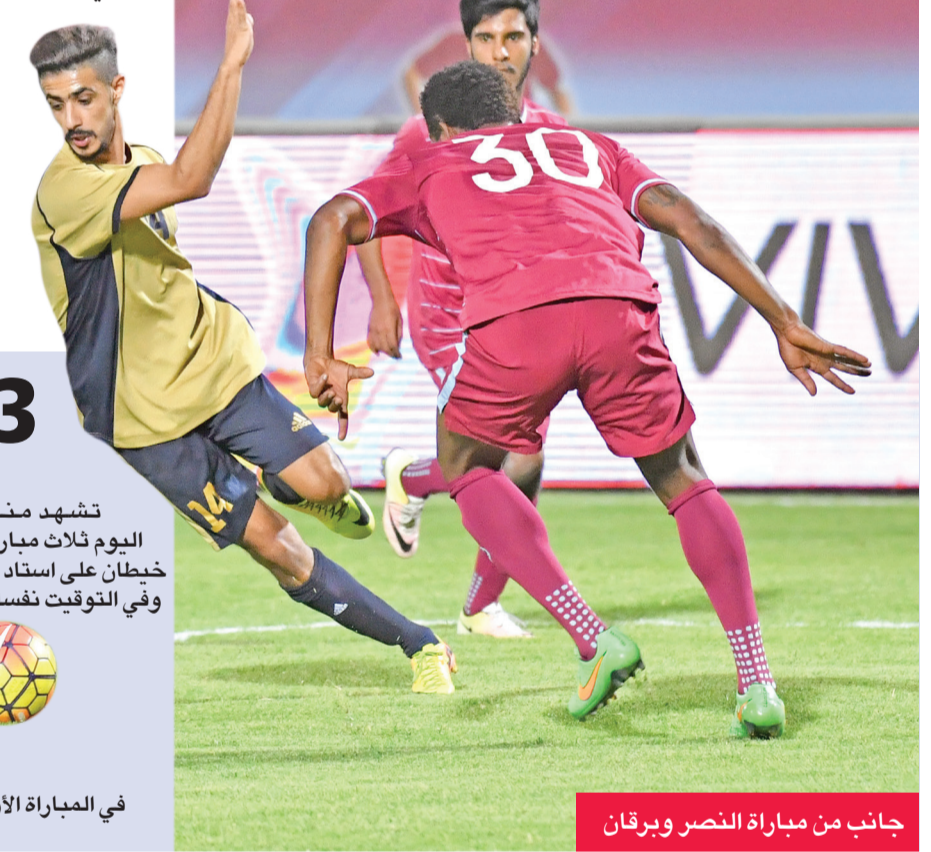
جانب من مباراة النصر وبرقان