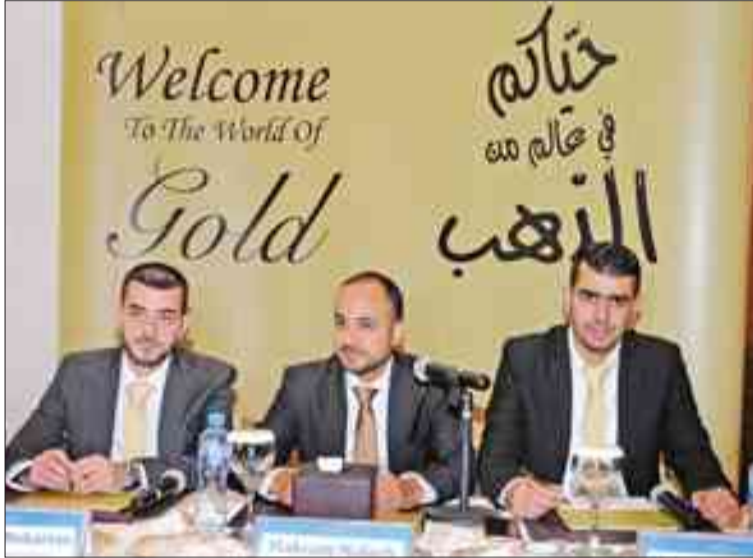
مسؤولو إدارة مركز سلطان أثناء المؤتمر الصحفي

أعلن مركز سلطان إطلاق برنامج بطاقات مركز سلطان الذهبية في مؤتمر صحفي عقد في فندق المليونيوم، وهي إضافة إلى برنامج الحالي للمكافآت، وتم تصميمه لمكافأة عملاء المركز الأوفياء، ليحفظوا بفرصة حصرية للتسوق. وتسمح بطاقة «سلطان» الذهبية لأعضاء البرنامج بالحصول على مميزات إضافية تناسب أسلوب حياتهم، فضلاً عن جوائز مختارة تتوافق مع انتسابهم إلى العضوية الذهبية.