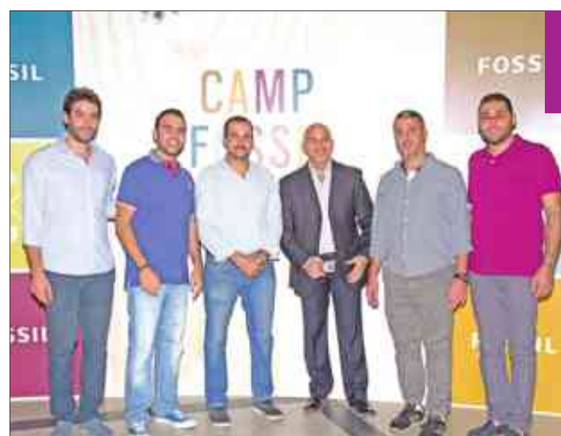
عدد من الحضور