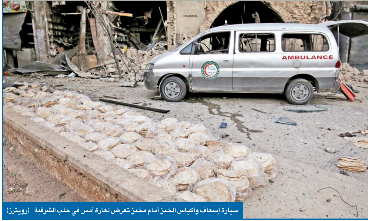
سيارة إسعاف ووكياس الخبز أمام مخبز تعرض لغارة أسس في حلب الشرقية