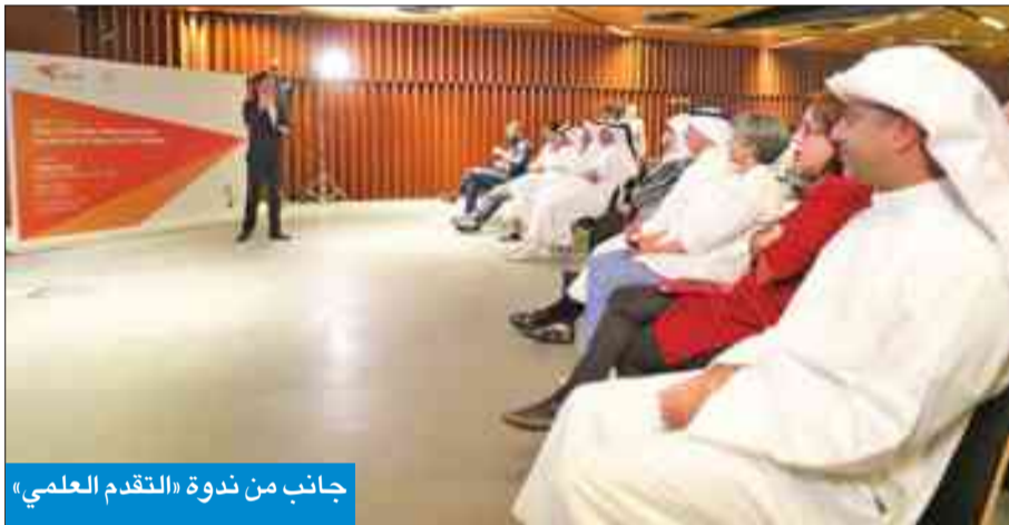
جانب من ندوة «التقدم العلمي»

«التقدم العلمي» تنظم محاضرة عن النهج الحضري في المدن