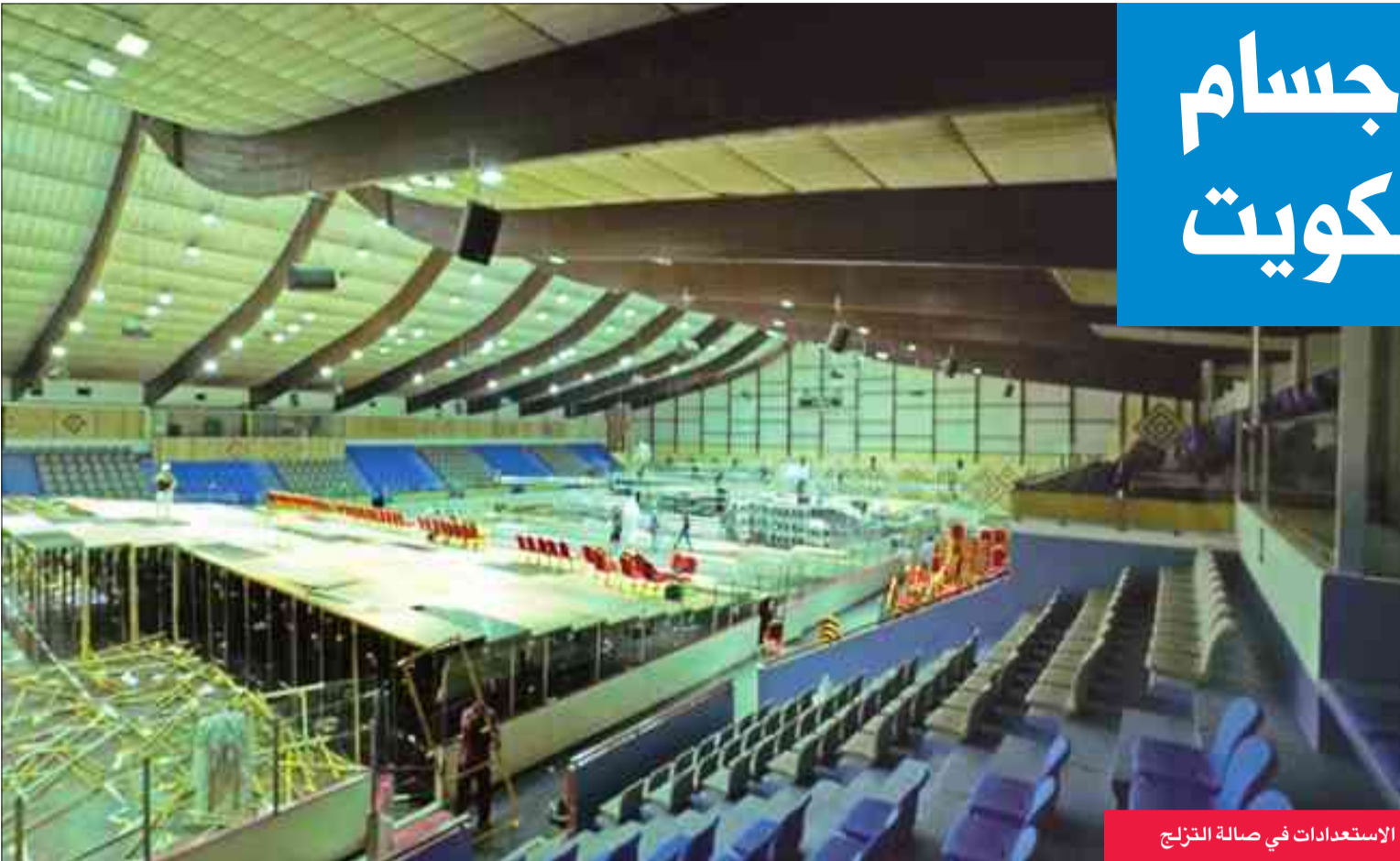
الإستعدادات في صالة التزلج

وستنطلق منافسات البطولة بالدور التمهيدي الساعة السادسة مساءً، على أن تكون النهائيات في الساعة الثامنة، حيث قامت اللجنة المنظمة بتجهيز صالة التزلج، باروع ما يكون، لاستقبال عمالقة العالم، الذين اتوا استعداداتهم لإبهار الحضور.