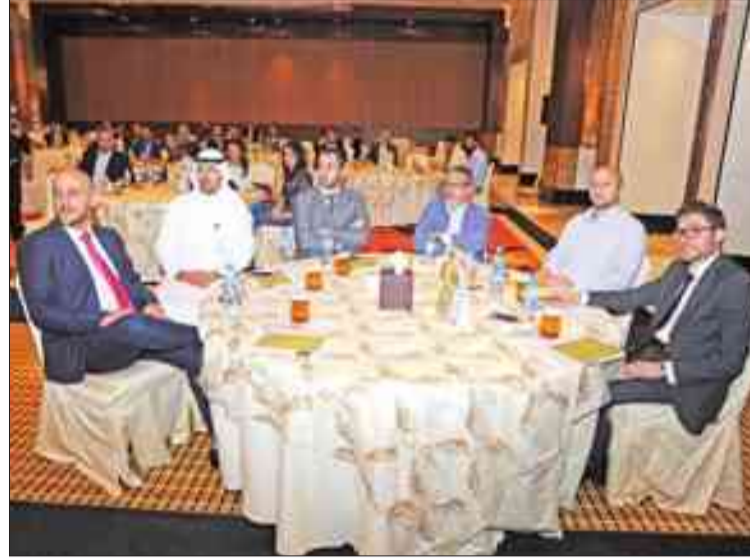
عدد من الحضور