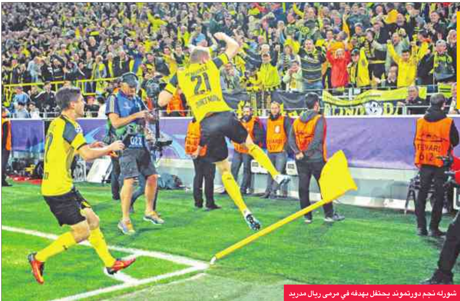
شورله نجم دورتموند يحتفل بهدفه في مرعى ريال مدريد

وفي المجموعة السابعة، احتفل ليستر سيتي بظلم انكلترا