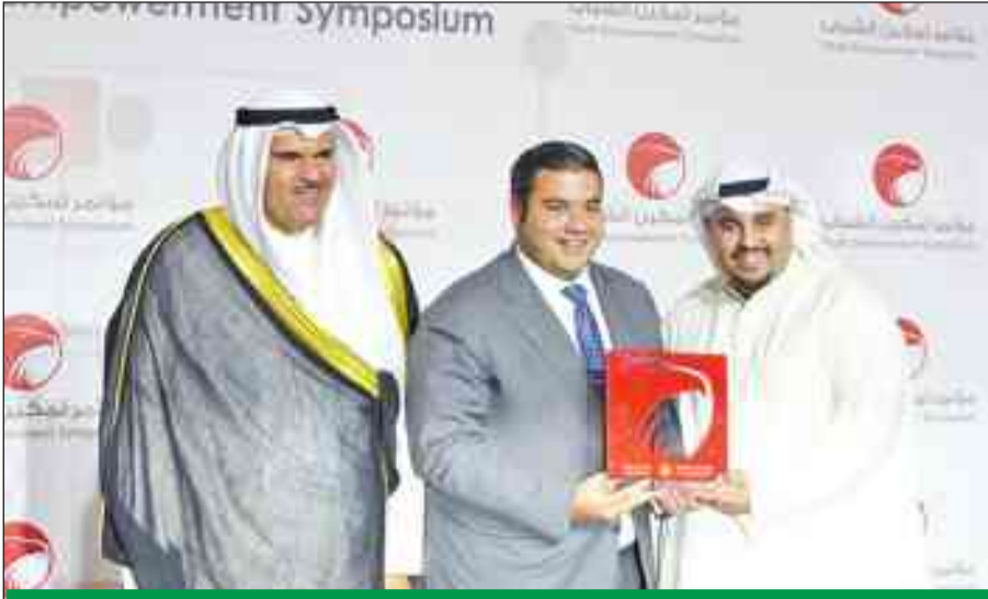
ممثل سمو الأمير الوزير الحمود ورئيس المؤتمر علي الإبراهيم بكرمان ممثل «الدولي» نواف ناجيا

أعلن بنك الكويت الدولي رعايته الذهبية لمؤتمر تمكين الشباب الخامس، الذي تستمر فعالياته يومي 25 و26 أكتوبر المقبل، برعاية سامية من سمو أمير البلاد الشيخ صباح الأحمد، وبمشاركة محلية وعالمية متميزة تتناسب مع الاهتمام الذي باتت توليه الحكومات لطاقتها الشبابية محلياً وإقليمياً وعالمياً. وكرم ممثل سمو أمير البلاد الشيخ صباح الأحمد وزير الإعلام