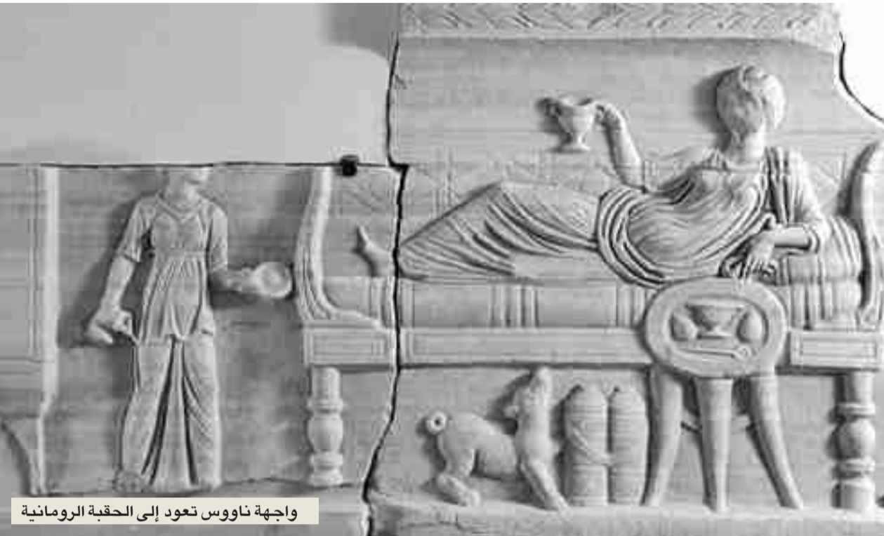
واجهة ناووس تعود إلى الحقبة الرومانية

إن لم نستطع، فلنعبر عن شربنا من باب "شراً لا بد منه"، لحماية إنسانيتنا التي تتفق وجمال الحياة من أن تهان أو تنتهك، و"باب الشر الذي لا بد منه"، هذا عبه أنه يضيق ويتسع بقدر ما تحمل ظهور رغباتنا الإنسانية وغير الإنسانية، إلا أن جميع العقوبات والجزاءات السماوية والدنيوية ما هي إلا ممرات أمانة لعبور الشر الذي وُجدنا به، حتى لا يفرض أو يفجر. وهذه الممرات جاءت لتصبح "جداًئل" تجمل الحياة، و"لتشربنا" الشر فيما وتوظفه إيجابياً، والتربية الحسنة لشربنا تكمن في التمرين الدائم لشربنا على الخشية من أن نصبح وحلاً!