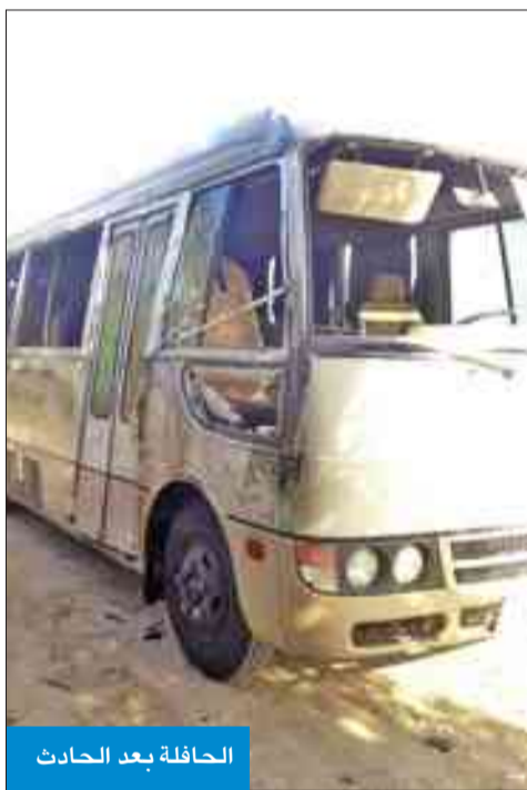
الحافلة بعد الحادث

وأشار إلى أنه سيتم التأكد من اتباع المدرسة لكل الإجراءات القانونية التي تضمن سلامة الطلبة أثناء استخدام الحافلات المدرسية، مشدداً على أن قطاع التعليم الخاص يعتبر جزءاً لا يتجزأ من المنظومة التعليمية، والتربية، لن تتهاون في سلامة وصحة الطلبة الدارسين في مختلف المدارس الخاصة. بدوره، دعت الإدارة العامة للعلاقات والإعلام الأمني قاندي المركبات إلى توخي الانتباه والتركيز أثناء القيادة، وعدم الانشغال بغير الطريق، مع الالتزام بالوقائع والنظم المرورية، لأنها صمام الأمان لقيادة آمنة، والعمل على الحيلولة دون وقوع أي حوادث بالطريق، مؤكداً أن أمن وسلامة الأبناء يقعان على عاتق الآباء والأمهات والسائقين، وحثهم على الالتزام بكل جوانب الأمن والسلامة والوقاية على الطريق.