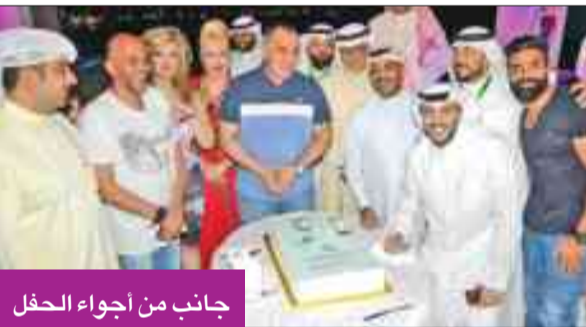
جانب من أجواء الحفل

جهداً من أجل تقديم الأعمال الدرامية الهادفة التي تعمل على إثراء الإعلام الشيخ سلمان الحمود، على دعمه للنقابة، حيث أتاح أمامها باب المشاركة في عضوية لجنة المنتج المنفذ، مؤكداً أنّ النقابة ستبذل كل