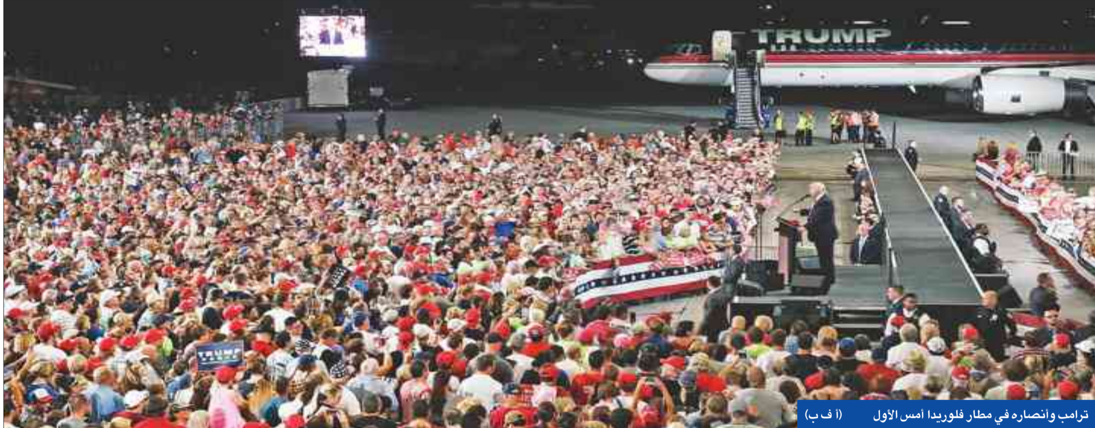
ترامب وانتصاره في مطار فلوريدا أمس الأول

المرشح الجمهوري يدافع عن أدائه في المناظرة ويتهم الإعلام بالانحياز ويحاول استمالة «اللاتينيين»