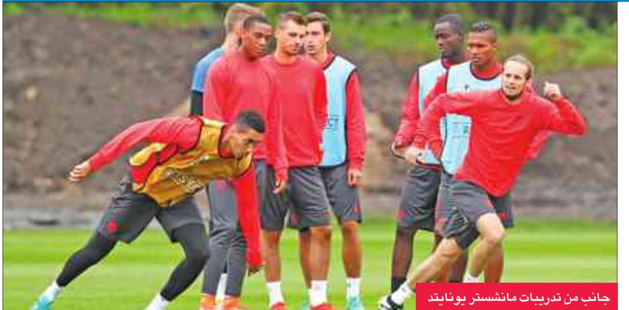
جانب من تدريبات مانشستر يونايتد

فيكتوريا بلزن التشيكي 1-1 في المباراة السابقة. ويلتقي اثليتك بلباو الإسباني مع ضيفة رايد فيينا النمساوي باحثاً عن التعويض بعد خسارته في المرحلة الأولى أمام ساسوللو الإيطالي بثلاثية، والذي يحل ضيفا بدوره على غتك البلجيكي. ويلعب سلتا فيغو الإسباني مع باناثينايكوس اليوناني، وشالكة الألماني مع ريد بول سالزبورغ النمساوي، وفيورنتينا الإيطالية مع قره باغ الأذري، وفياريال الإسباني مع ستيووا بوخارست الروماني.