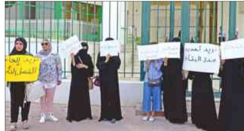
جانب من اعتصام الطالبات المفصولات