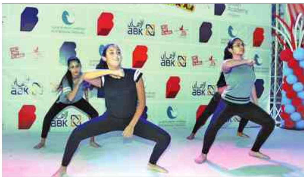
فكرة رياضية لطالبات «البريطانية»