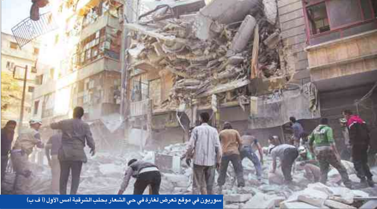
سوريون في موقع تعرض لغارة في حي الشعرا بحلب الشرقية أمس الأول

● بان كي مون: ما يجري «أسوأ من مسلخ» ● المعارضة تحصل على صواريخ «غراد» يصل مداها إلى 40 كلم