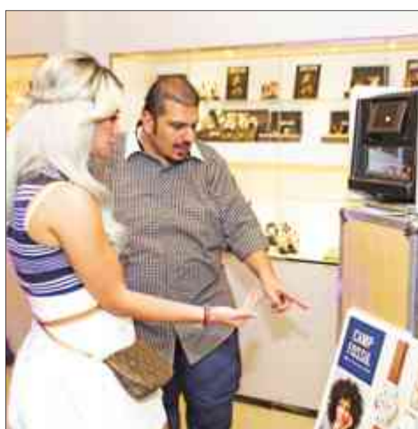
الاطلاع على التشكيلة الجديدة