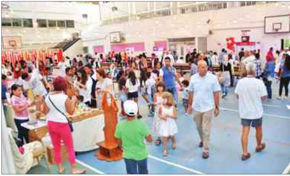
جانب من الكرنفال