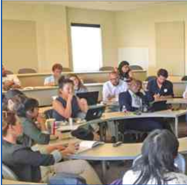
هونت خلال حديثه في الجامعة المسيحية في كولورادو أمس

الأغلبية تدعم كلينتون خوفاً من ترامب... وجزء كبير يطالب بـ «القوة الثالثة»