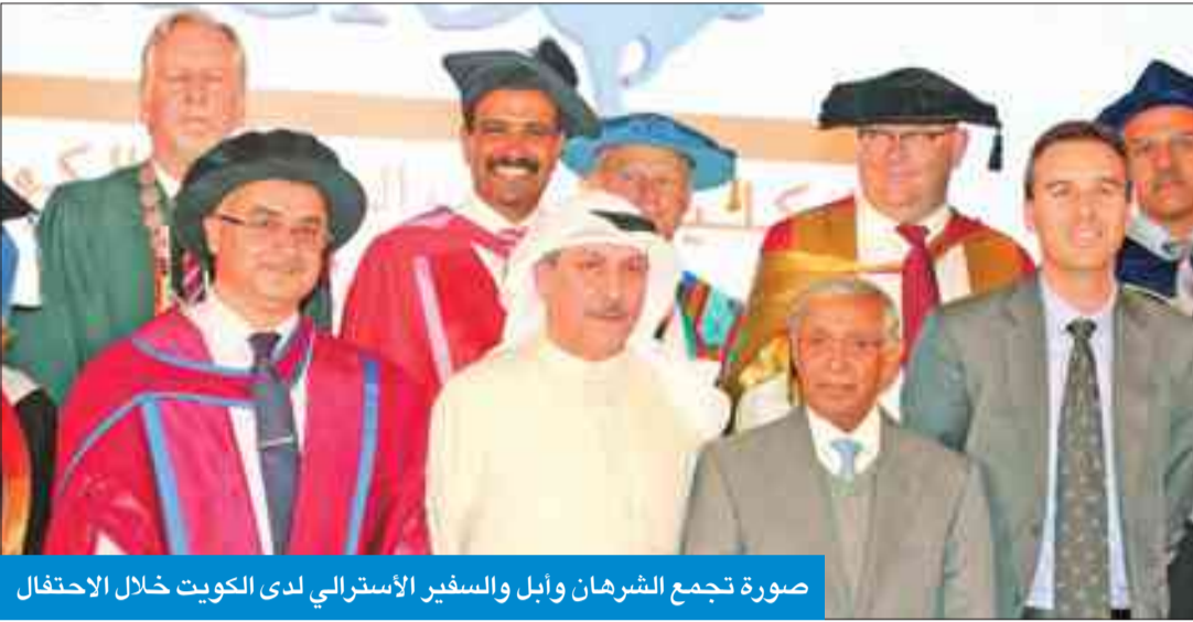
صورة تجمع الشهران وأبل والسفير الأسترالي لدى الكويت خلال الاحتفال

وأشار أبل إلى أن الكلية الأسترالية حرصت على سلوك الطريق التعليمي