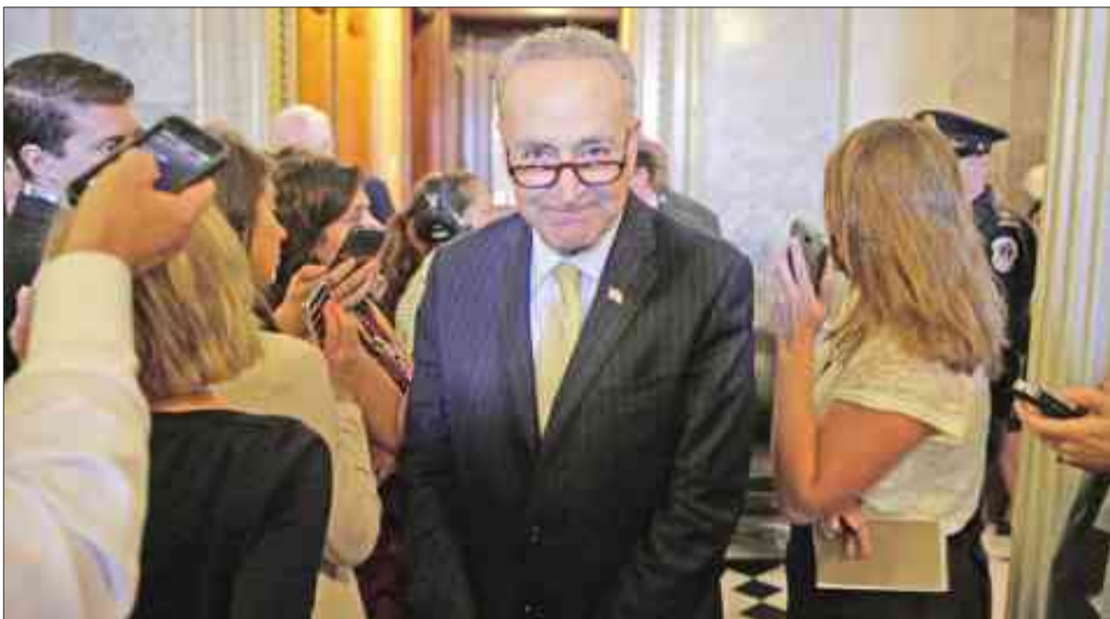
السيناتور شك سومر، الذي وضع قانون «جاستا» يعد التصويت عليه في مجلس الشيوخ بواشنطن أمس الأول

● خيارات عدة للمملكة بينها تجميد التعاون الأمني والسياسي والاقتصادي مع واشنطن ● مراقبون يرجحون أن تتجاهل الرياض القانون ● اللوبي السعودي: لا للتهويل وإيران الأكثر تضرراً