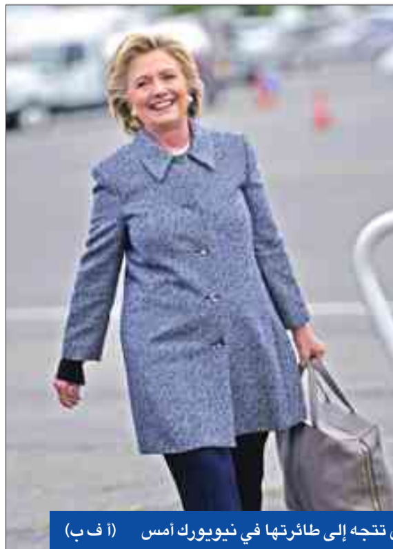
كلينتون تتجه إلى طائرتها في نيويورك أمس

أوباما: الامتناع عن التصويت يصب في مصلحة ترامب