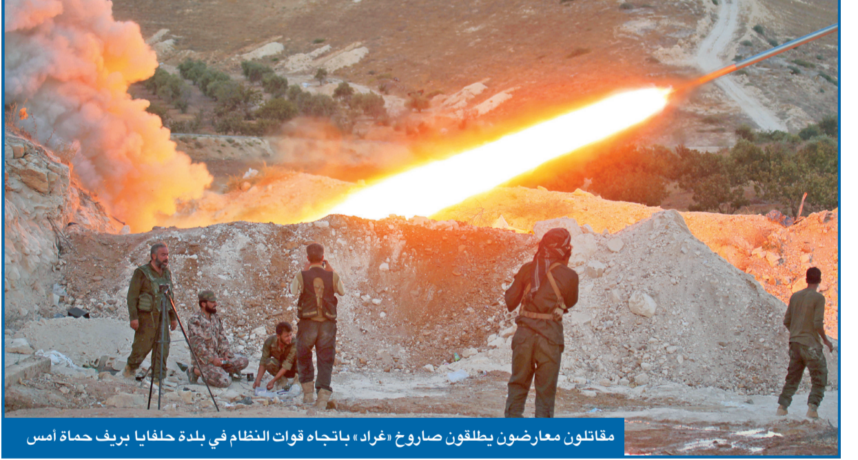
مقاتلون معارضون يطلقون صاروخ «غراد»، باتجاه قوات النظام في بلدة حلفايا بريف حماة أمس