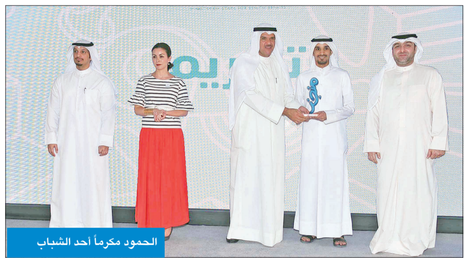
الحمود مكرماً أحد الشباب

مؤسوسها بتوظيف زملائهم من الشباب الكويتيين. وذكرت ان الوزارة اطلاقاً من ادراكها لاهمية تشجيع التميز والابداع والابتكار في رسم صورة المستقبل قامت باطلاق (جائزة الكويت للتميز والابداع) في 10 مجالات عمل وطنية لتصبح بذلك الجائزة الاولى خليجياً وعربياً المخصصة للشباب. وبينت السيدة الزين ان الوزارة استت قنوات تواصل مع الشباب واستحدثت مركز اتصال معهم ليكون مصدراً للتبادل الحي والموتق بين الشباب والجهات المعنية بتنميتهم وتمكينهم بالإضافة الى عمل اول مسح وطني بتاريخ الكويت يستطلع آراء الشباب في عدد من القضايا التي تهتم كالاسكان والعمل والتعليم والمواطنة وغيرها من القضايا ل بناء اسس صحيحة في استراتيجيات ومبادرات الوزارة.