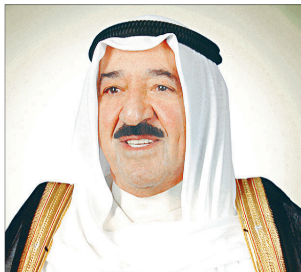
العهد الشيخ نواف الاحمد، وسمو رئيس مجلس الوزراء الشيخ جابر المبارك ببرقيات تهنئة مماثلة.

دعا الحمود إلى تدليل ما يعترض مشاريع الشباب من عقبات واستثمار طاقاتهم، كما دعا إلى تكوين قاعدة شبابية وطنية فاعلة ومبادرة نواتها الشباب المنجزون لتمكينهم من تحقيق طموحاتهم.