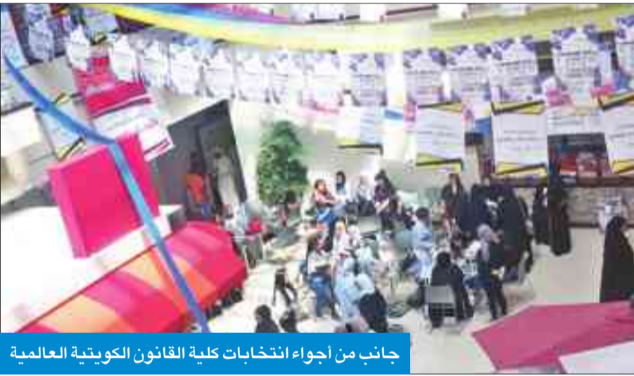
جانب من أجواء انتخابات كلية القانون الكويتية العالمية

المطيري إلى أن رابطة الكلية لم تسمح للطلبة، خلال الجمعية العمومية، من الإلء بانتقاداتهم التي يحق لهم أن يقدموها في الجمعية، مبيناً أن القائمين على "العمومية" أغلقوا باب المناقشة، من خلال التزوير في عملية التصويت، ما أدى إلى خروج العديد من الطلبة من القاعة، لافتاً إلى أن الرابطة أمنت من خلال تصرفها أنها لا تستطيع تقبل الانتقادات ومواجهتها.