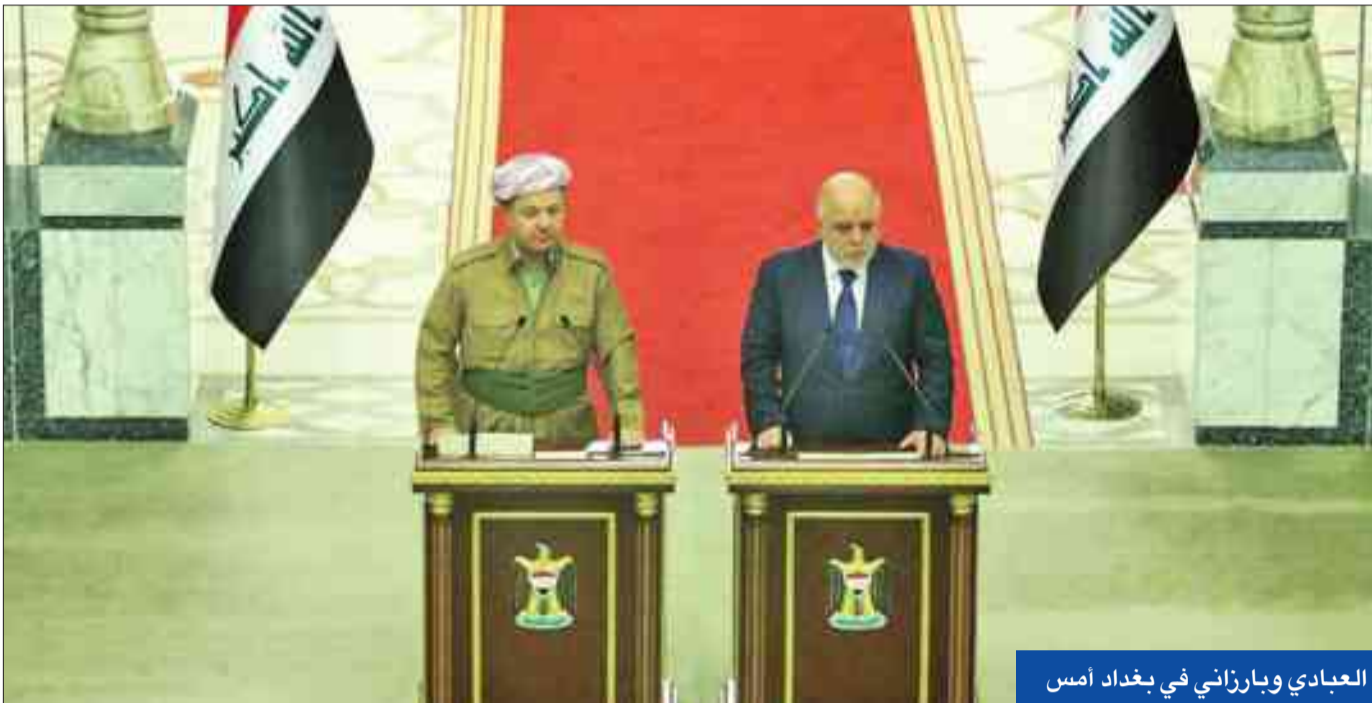
العبادي وبارزاني في بغداد أمس

ذكرت وزارة الدفاع الصينية أمس أن الصين تعني ما تقوله عندما تصرح بأنها ستدرس اتخاذ إجراءات مضادة في مواجهة خطة لنشر نظام أميركي متطور للدفاع الصاروخي في كوريا الجنوبية. وأبدت الصين جارة كوريا الشمالية وحليفها غضها مراراً من الولايات المتحدة وكوريا الجنوبية لقرارهما نشر نظام ثاد الدفاعي الأميركي، للتصدي للتهديدات الصاروخية والنووية من كوريا الشمالية. وقالت وزارة الدفاع الكورية الجنوبية إنها ستعلن موقفاً جدياً لنشر النظام اليوم بعد معارضة السكان لمكان وقع عليه الاختيار في بادئ الأمر.