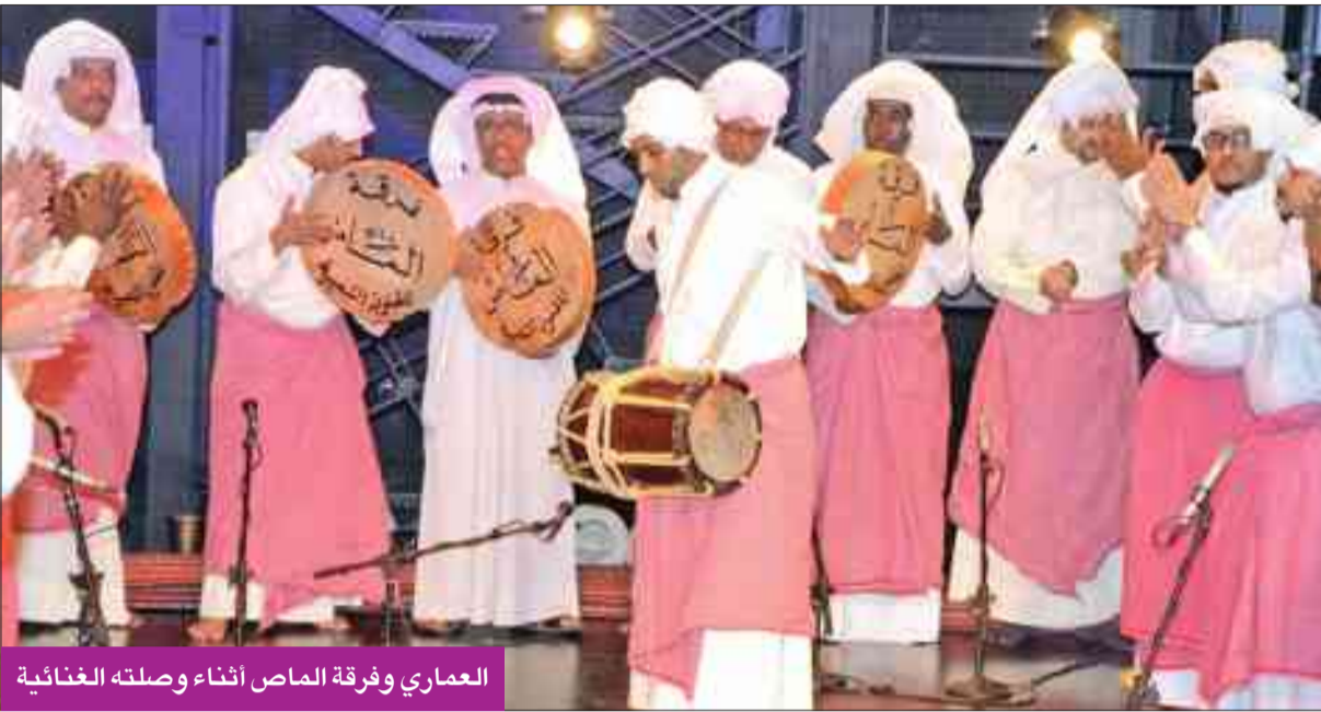
العماري وفرقة الماص أثناء وصلته الغنائية

افتتح الفنان سلمان العماري أمسيات دار الآثار الإسلامية الغنائية بليلة عبقة بفنون التراث الكويتي الجميل.