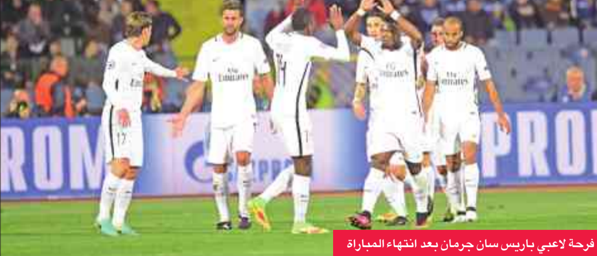
فرحة لاعبي باريس سان جرمان بعد انتهاء المباراة

تلقية كرة من البرازيلي لوكاس مورا (60)، وعاد الفريق الباريسي الساعي إلى إحراز لقب الدوري المحلي يوم الجمعة الماضي. وفي الثانية على ملعب «الإمارات» في لندن، حسم أرسنال نتيجة المباراة في شوطها الأول بهدفين لجناحه الدولي ثيو وكوت من صناعة الدولي التشيلي المكسيك سانتشير.