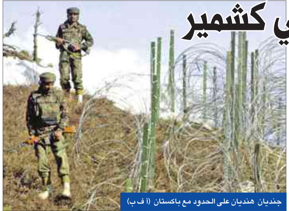
جنديان هنديان على الحدود مع باكستان (أ ف ب)

في وقت تشهد الساحة الإيرانية صراعاً بين أنصار التيار المتشدد والإصلاحيين، استعداداً للانتخابات الرئاسية، دعا الرئيس حسن روحاني الإيرانيين بجميع طبقاتهم إلى الاعتدال والوسطية في الفكر والعقيدة والرؤية الداخلية والخارجية، مستعيداً الشعارات التي فاز بها في الانتخابات الرئاسية الماضية. وقال روحاني، في اجتماع عقده أمس بالمجلس الإداري لمحافظة قزوین، إن "الإفراط والتفریط، يدمران دنيانا وأخروتنا، وليس هناك من خيار أصامنا سوى الاعتدال لتحقيق التطور في البلاد وتقديم الثورة". ولفت إلى أهمية اعتماد نهج الاعتدال في السياسة الداخلية والخارجية للبلاد، معتبراً أن "إمكانية التطور والتقدم لا يمكن أن تتحقق في ظل غياب التواصل