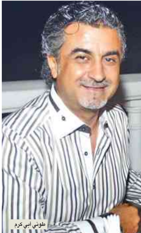
طوني أبي كرم

أطلق الشاعر اللبناني طوني أبي كرم ضمن برنامج «بصراحة» مع باتريسيا هاشم عبر أنثر إذاعة «فايم أم.آم.» وأكد في بداية اللقاء أن أغنية «بلا حب بلا بطيخ» التي قدمها للنجم فارس كرم تفوّقت على الأغاني كافة التي صدرت خلال الصيف، وتساءل: «أين الكلام الهابط فيها؟».