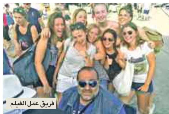
فريق عمل الفيلم

كان الفيلم كله صعباً، لكن البداية كانت الأصعب حيث نوضح تعرض مصر لموجة من الجليد وتجمد كل شيء، لذا كان لا بد من أن تكون جيدة ومقنعة للجمهور، فعملينا بنينا الأحداث اللاحقة. كذلك كان المشهد الأخير مهماً جداً حيث ظهور الإعصار ومطارده الإبطال وانقسام «الكوبري». فذقتنا هذه المشاهد والغرافيك داخل مصر مع شباب مصريين