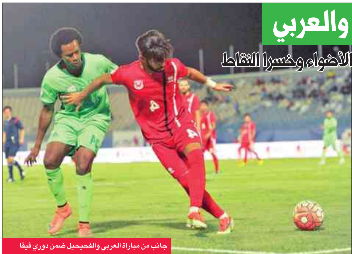
جانب من مباراة العربي والفحيحيل ضمن دوري فيفا

وأضاف: "من وجهة نظره كإداري، فإن تديلات الفرنسي بانيد لم تكن في وقتها المناسب، ولاسيما فيما يخص تديلات لاعبي الوسط".