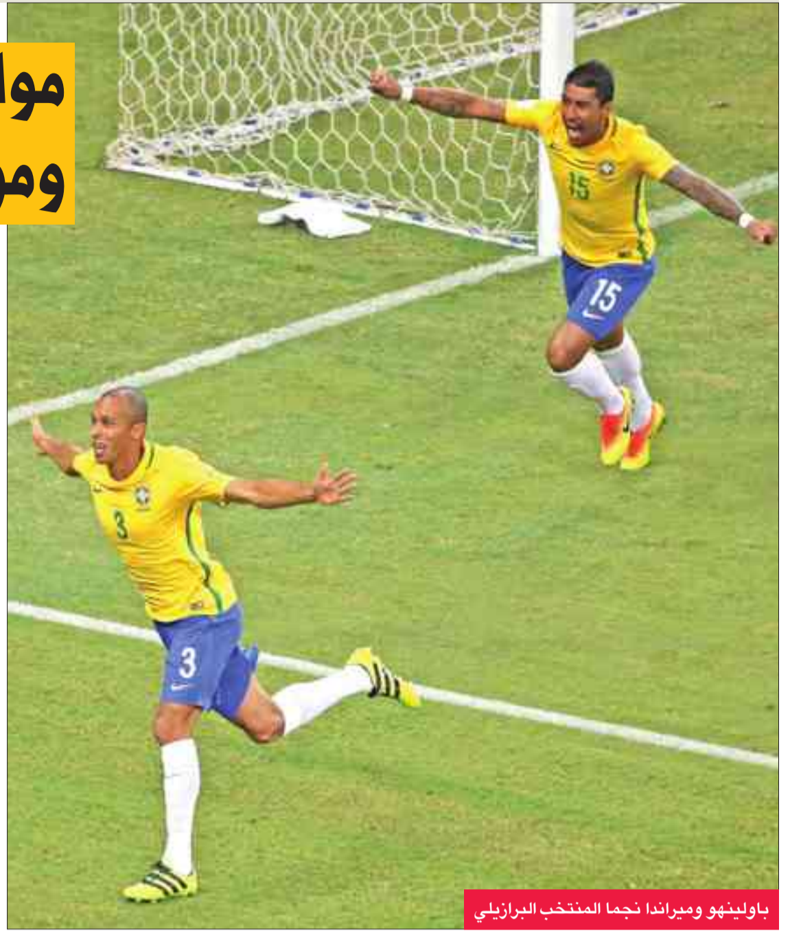
باولينهو وميراندا نجما المنتخب البرازيلي

ورفض كوريا المقارنة بينه وبين قائد المنتخب الأرجنتيني، حيث قال: «كلنا نعرف ميسي واحدا فقط، أنا سعيد بوجودي هنا، وإذا كان علي أن أكون مكانه، فسأسعى لأقدم أفضل ما لدي لمساعدة الفريق».