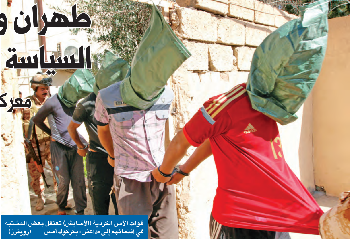
قوات الأمن الكردية (الأسايش) تعتقل بعض المشتبه في انتمائهم إلى «داعش» بكروك أمس

في ظل التصعيد غير المسبوق بين بغداد وأنقرة، وتبادلها استدعاء السفراء، وتمسك تركيا بحقها في التدخل عسكرياً في العراق المسمم، وتلويح بغداد بمواجهة إقليمية إذا لم تتراجع حكومة الرئيس رجب طيب أردوغان عن استفزازاتها، تعترف الأوساط السياسية في بغداد بأن الشكوك الشديدة، التي تحوم حول القوة العسكرية التركية الموجودة على تخوم نينوى شمال العراق، ليست مجرد ريبة تتعلق بنوايا خرق سيادة، بل تتصل بمستقبل الإدارة السياسية في الموصل، ومن سيقوم بالتأثير على شكل الحكم هناك بعد طرد «داعش». وبات يديه لدى الموصلين أنهم سيتخلصون من «داعش»، لكن لا أحد منهم يمتلك إجابة عن سيجمك مدينتهم، وكيف يضمنون ما يخفف الاحتقان الطائفي ويحفظ مصادر التطرف التي قد تخلق ظواهر أخطر من «داعش». 02