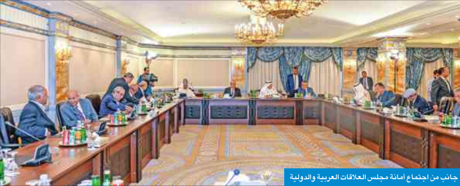
جانب من اجتماع أمانة مجلس العلاقات العربية والدولية

اختتم مجلس العلاقات العربية والدولية فعاليات دورته السادسة التي استضافتها الكويت يومي 4 و5 أكتوبر الجاري، برئاسة رئيس المجلس محمد الصقر، وبمشاركة أعضاء أمانته العامة. واستنكر المجلس، في بيانه الختامي أمس، إقرار قانون العدالة ضد رعاة الإرهاب (جاستا)، محذراً من أنه يقوض مبدأ الحصانة