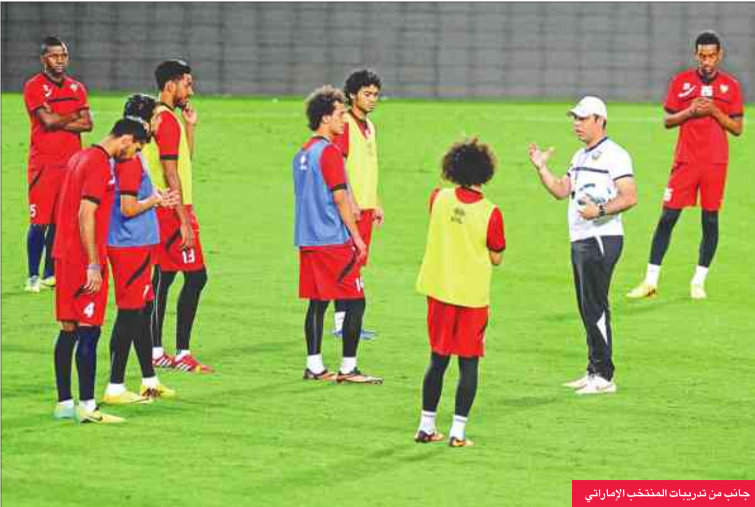
جانب من تدريبات المنتخب الإماراتي