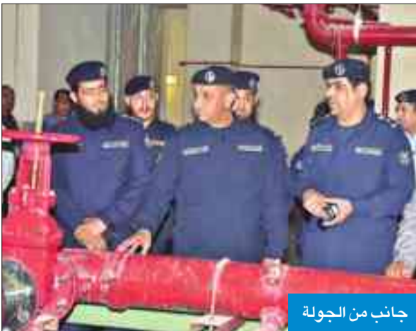
جانب من الجولة

يضم 3 سراديب و15 دوراً متكرراً بمساحة 5000 متر مربع