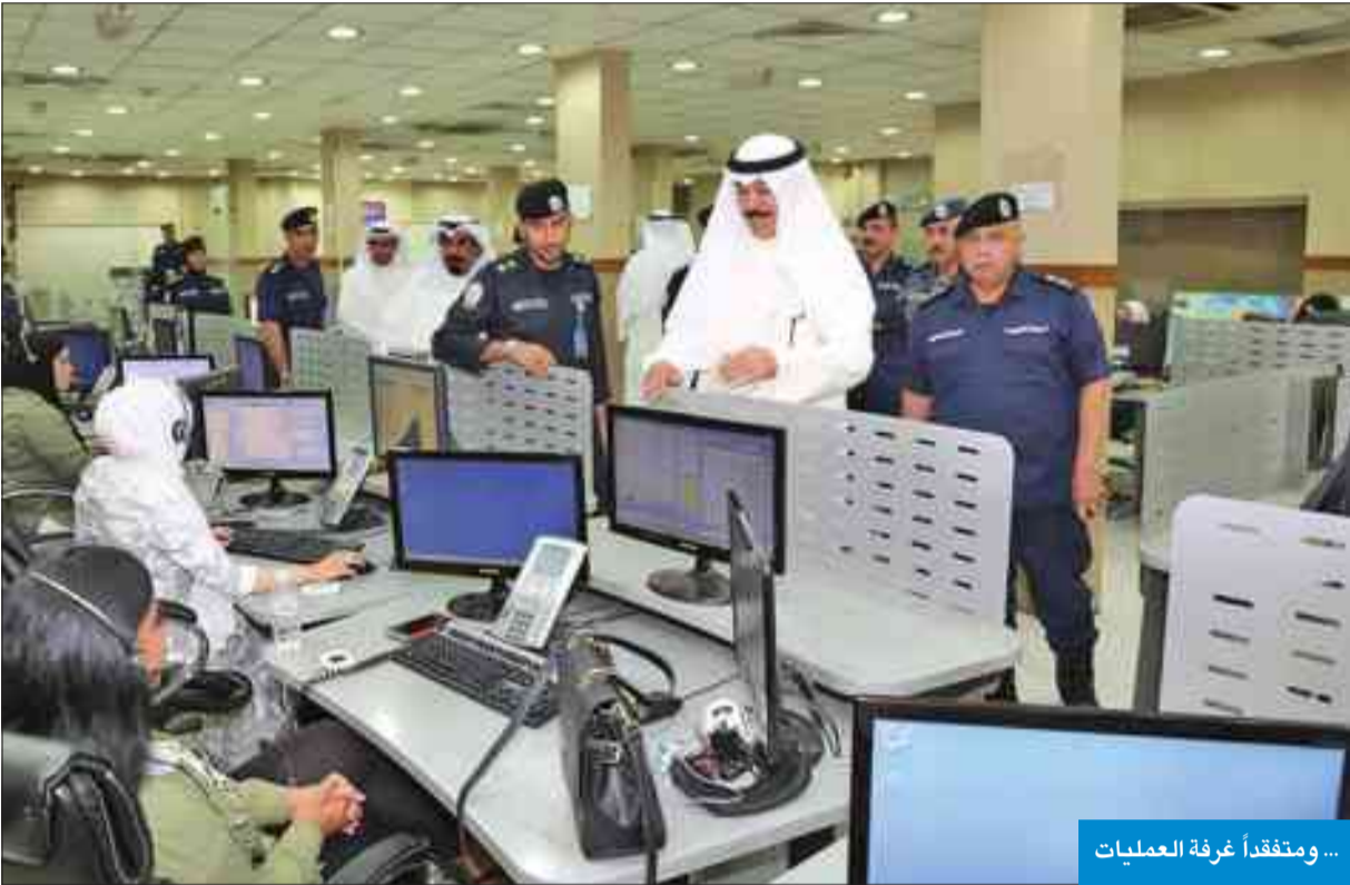
... ومتفقداً غرفة العمليات