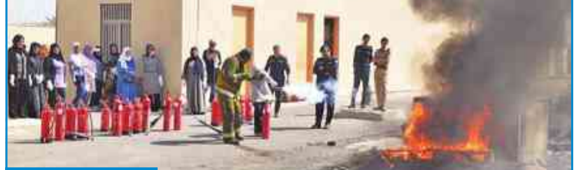
تدريب الموظفين خلال الدورة