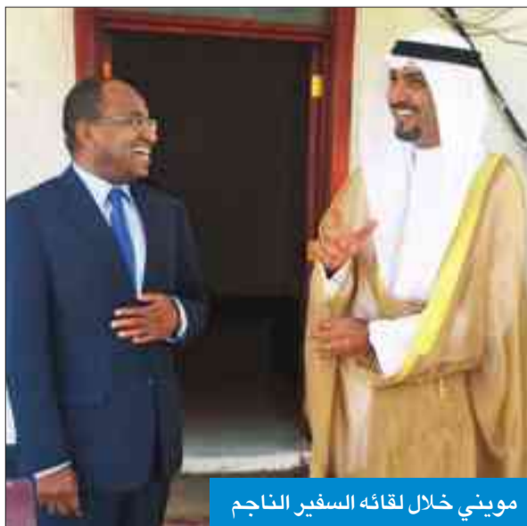
مويني خلال لقائه السفير الناجم

وأضاف أن الشراكة بين وزارتي الدفاع في البلدين يمكن أن تحقق نتائج ممتازة، لافتاً لتبادل الزيارات بين المسؤولين في كلا البلدين، والتي يمكن تطويرها لاحقاً لزيارة له للكويت، لبحث كل أوجه التعاون وزيارة الوزير الجراح لتنزانيا.