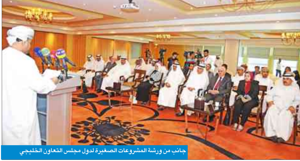
جانب من ورشة المشروعات الصغيرة لدول مجلس التعاون الخليجي

«تكليف شركة خاصة لدراسة البعدين الاقتصادي والاجتماعي لهذه القرارات»