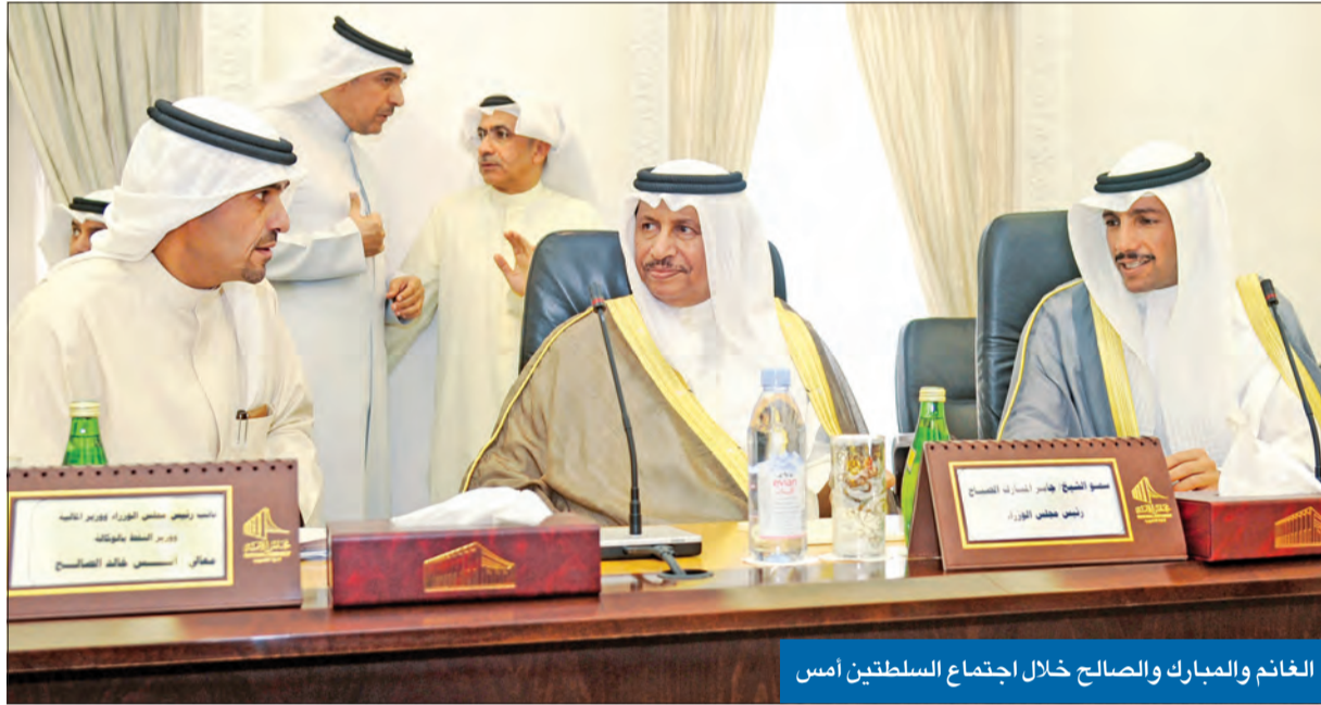
الغانم والمبارك والصالح خلال اجتماع السلطتين أمس

انتهى اجتماع السلطتين التشريعية والتنفيذية بتراجع الحكومة عن رأيها الفني في وثيقة الإصلاح الاقتصادي والمالي، لتقدم موافقة سياسية على منح كل مواطن يحمل رخصة قيادة صالحة 75 لتراً شهرياً من البنزين الممتاز مجاناً، بما يعادل نحو 7 دنانير. ويأتي قرار الحكومة، دون عرضه على المجلس الأعلى للتخطيط ومتجاهلاً رأي لجنة الدعم، ليخلق أول سابقة في تقديم «كوبونات حكومية» للمواطنين، ما قد يفتح باب الكوبونات للخدمات وبيع أخرى ينتظر أن يرفع الدعم عنها، كما أن موقفها «المتجدد» بتقديم التخازلات، بعد قرار «دعم الديزل» لبعض الجهات، واستثناء المواطنين من زيادة الكهرباء والماء، من شأنه أن يفرغ «وثيقة الإصلاح» من أهداف الترشيد الواردة بها. يذكر أن وزارة المالية حذرت، في بيان، من خلق نظام مزدوج لأسعار البنزين، مشيرة إلى أن ذلك من شأنه خلق سوق سوداء للوقود. وعودة إلى الاجتماع، أكد رئيس مجلس الأمة مرزوق الغانم أن السلطتين لن تحيدا عن التوجيهات السامية لسمو أمير البلاد، التي تشدد على عدم المساس بالمواطن في أي قرارات تهدف إلى الإصلاح، وتحقيق وفر في الميزانية، مبيناً أن تحرير سعر البنزين جزئي ومرتبط بدعم المواطن الرشيد، ولا يزيد الكلفة عليه عما هي الآن. 02