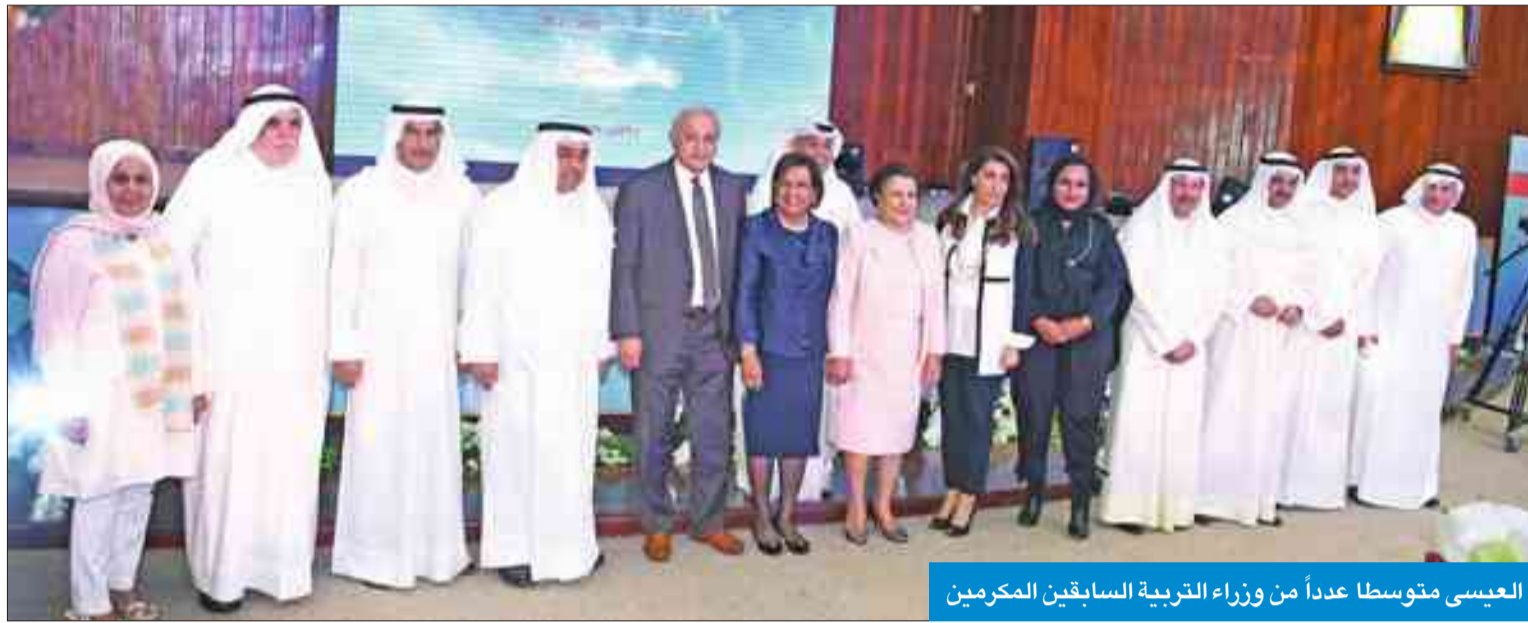
العيسى متوسطاً عدداً من وزراء التربية السابقين المكرمين

وأضافت: نظام المعدل التراكمي يساعد الطالب على توفير الدرجات، ولاسيما في حال حصول ظروف طارئة لأي طالب تؤثر على درجته يمكنه تعويض هذه الدرجات في العام الذي يليه. وبيّنت أن إعادة النظر في هذا النظام أمر طبيعي، لكون النظريات التربوية متغيرة، مضيفة: القرارات ليست مرتبطة بوزراء أو أشخاص، لكن مصلحة الطالب هي الأهم.