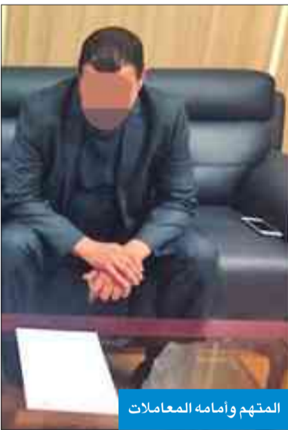
المتهم وأمامه المعاملات

يستخرج تصريحات عمل على صحيفة أسبوعية ألفتها «الإعلام»