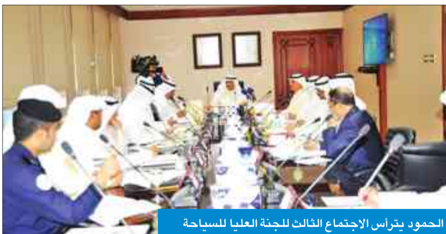
الحمود يترأس الاجتماع الثالث للجنة العليا للسياحة

يسهل التوسع في صناعة السياحة المحلية. بدوره، قال ممثل وزارة الداخلية في اللجنة التوجيهية للمساعد لشؤون الأمن العام اللواء إبراهيم الطراح، خلال الاجتماع، إن لدى الوزارة تصورا كاملاً لإنشاء الشرطة السياحية من أجل دعم الجهود التطويرية لقطاع السياحة في الكويت.