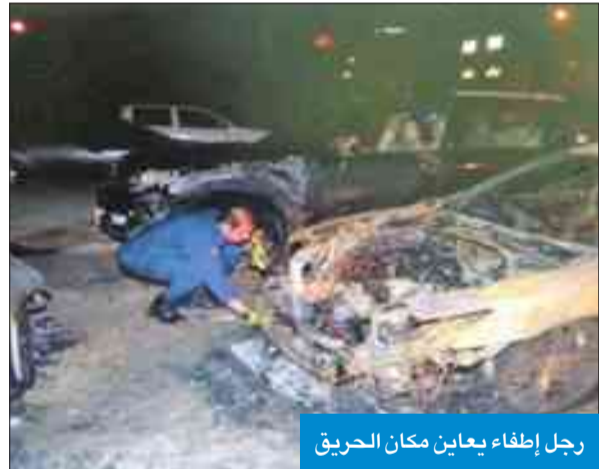
رجل إطفاء يعاين مكان الحريق

من الخسائر في الممتلكات. وقد تعرض رجل إطفاء إلى إصابة باليد، وطلب على الفور التدخل السريع من فني الطوارئ الطبية الموجودين في