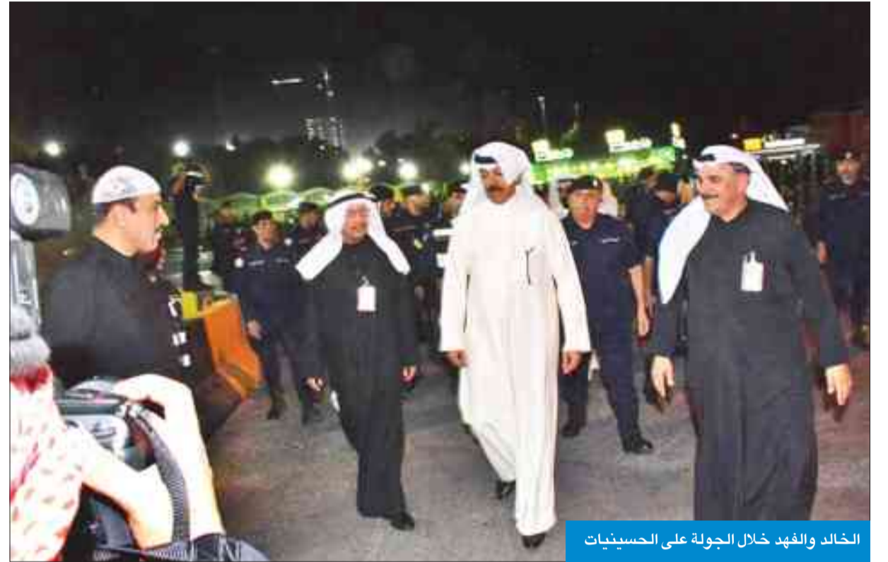
الخالد والفهد خلال الجولة على الحسينيات

من الأجهزة الأمنية المختصة وبما يحقق الأمن الشامل للحسينيات ومرتابها.