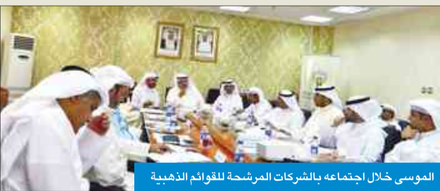
الموسى خلال اجتماعه بالشركات المرشحة للقوائم الذهبية

الموسى: فتح «البوابة» أمام الشركات لإنجاز العديد من المعاملات