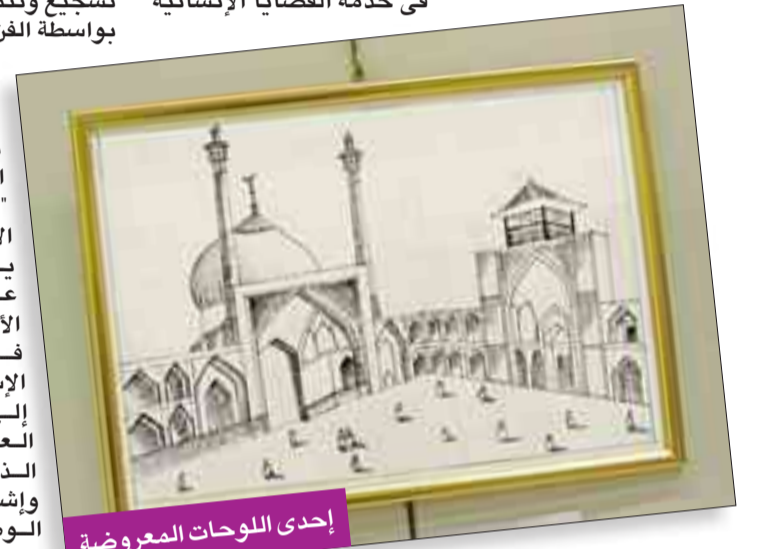
إحدى اللوحات المعروضة

وأشارت القطان إلى أن إقامة المعرض اختيار الكويت «عاصمة الثقافة الإسلامية»، لذا يحمل المعرض عنوان «إبداعات الأنامل الصغيرة في الفنون الإسلامية»، إضافة إلى أن هذا العام العاشر للمعرض الذي يقام برعاية وإشراف المجلس الوطني للثقافة والفنون والآداب.