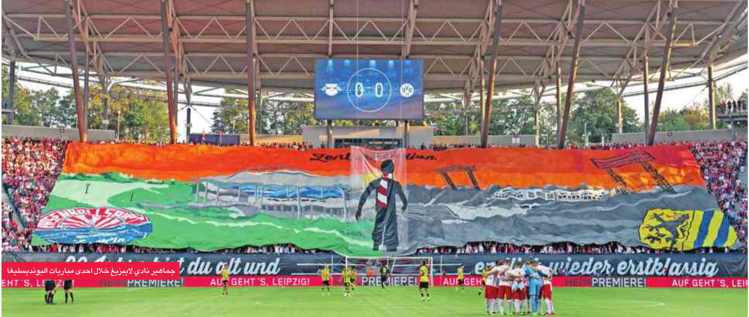
جماهير نادي لايبزيغ خلال إحدى مباريات البوندسليغا

القديم. إلا المشجعون لديهم انطباع بأن هذا التقليد أصبح متحرفاً من قبل الأندية التي تؤسسها الشركات.