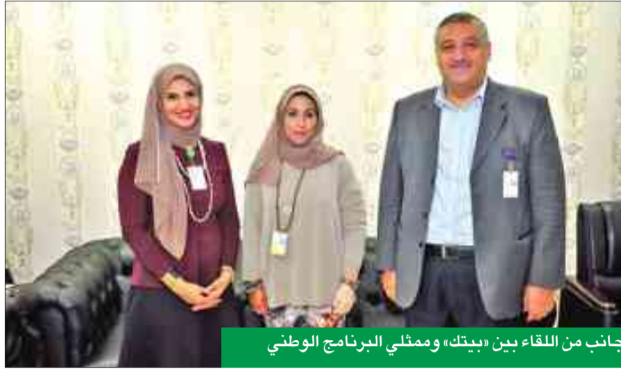
جانب من اللقاء بين «بيتك» وممثلي البرنامج الوطني

والترجع بالدم ورعاية العديد من الندوات وحملات التوعية للوقاية من امراض متعددة.