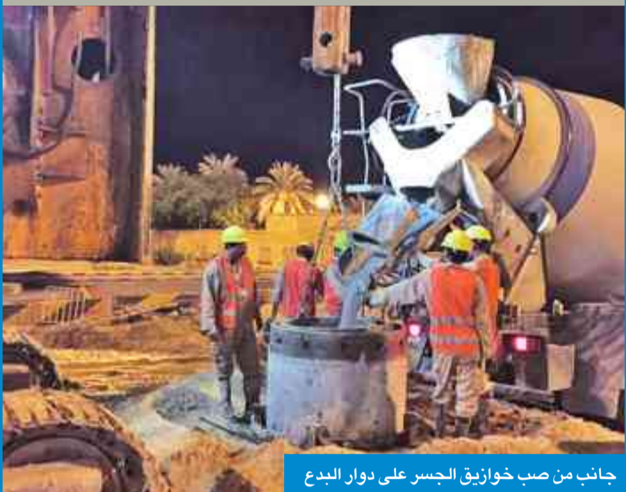
جانب من صب خوازيق الجسر على دوار البدع

قاعدة من قواعد الجسر في الدوار والتجهيز لصب القواعد الثانية، لافتاً إلى أن المقاول يجهز حالياً لصب أول عمود في الدوار. وأوضح أنه بالتنسيق مع الإدارة العامة للمرور تم تجهيز التحويلة رقم 3 على طريق الملاجج بجانب النادي الدبلوماسي، مشيراً إلى أن «الأشغال» تقوم حالياً بالعديد من القاءات مع الوزارات الخدمائية المختلفة، وتجهيز المخططات الخاصة بأعمال مجرور الخدمات وخط المياه.