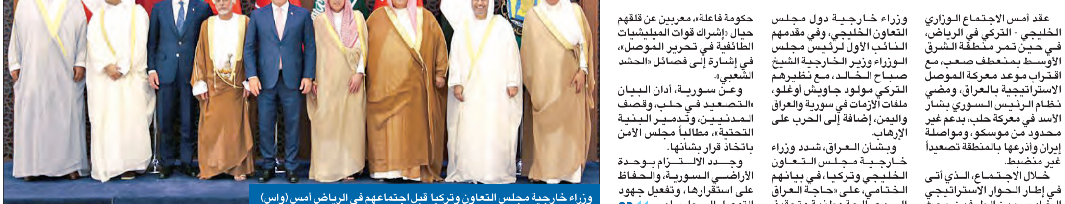
وزراء خارجية مجلس التعاون وتركيا قبل اجتماعهم في الرياض أمس

تحذير من خطورة الموصل... وإدانة لـ «جاستا»