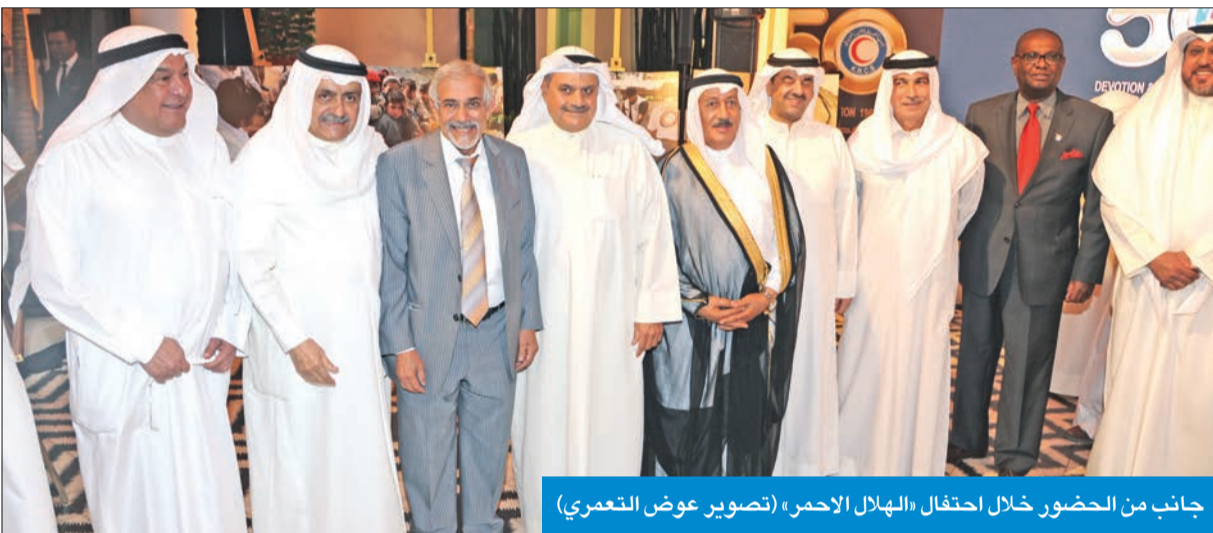
جانب من الحضور خلال احتفال «الهلل الأحمر»

أكد رئيس مجلس إدارة جمعية الهلال الأحمر الكويتي د. هلل الساير، أن المساعدات التي قدمتها الجمعية للاجئين السوريين في دول الجوار السوري بلغت 30 مليون دولار، لافتاً إلى أنه «تم دعم مستشفى الهلال الأحمر الأردني بـ500 ألف دولار لعلاج السوريين دون مقابل، إضافة إلى مشاريع المختبرات الطبية في لبنان والأردن، والتي يستفيد منها نحو 120 ألف أسرة، بالإضافة إلى مشاريع غسل الكلى، وعبادات الأسنان، التي استفاد منها أكثر من ألفي شخص.