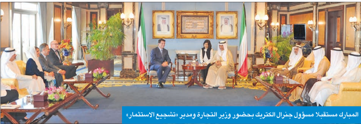
المبارك مستقبلاً مسؤول جنرال إلكتريك بحضور وزير التجارة ومدير «تشجيع الاستثمار»

وحضر المقابلة وزير التجارة والصناعة الدكتور يوسف العلي والعميد العام لهيئة تشجيع الاستثمار المباشر الشيخ الدكتور مشعل الجابر.