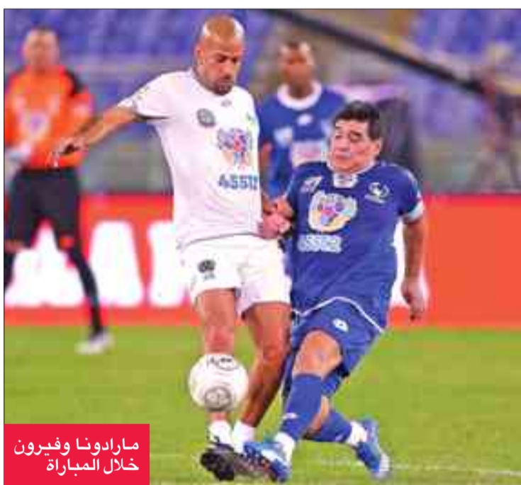
مارادونا وفيرون خلال المباراة

واتهم مارادونا في يوليو الماضي فيرون بالخيانة، ليرد الأخير، الذي يشغل منصب الرئيس الحالي لنادي استوديانتيس، بأن ما قاله زميله القديم لا أهمية له. وسبق المباراة لقاء بين اللاعبين المشاركين في الحدث كبرى أو أفراد أثرياء، ولا تعتبر أندية شعبية ويطلق عليها اسم الأندية البلاستيكية.