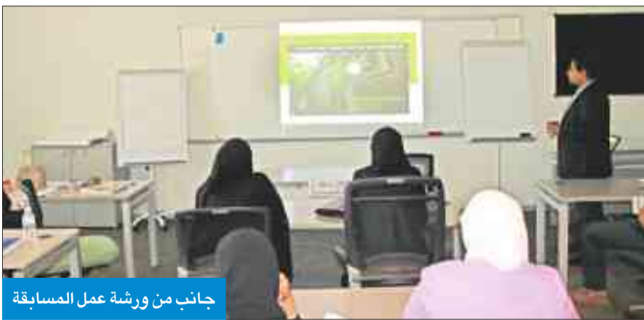
جانب من ورشة عمل المسابقة

في دعم الطالبات في جميع المجالات، ليكن دائماً نواة كل تنمية وبناء لدولة الكويت، لافتة إلى أن «طالبات الكلية أختفن في مختلف المسابقات، التي شاركن فيها، علو طموجهن وريادتهن، بما تمنعه لهن الكلية من تدريب وخبرات تؤهلهن ليكن دائماً في طليعة أقرانهن الطالبات في مختلف المؤسسات الأكاديمية في دولة الكويت». يذكر أن كلية بوكسهل تسعى دائماً للمشاركة في مثل هذه المسابقات، بهدف إثراء الجانب العملي لدى الطالبات من خلال الاحتكاك والتفاعل مع خبرات لها تجارب عملية ثرية.