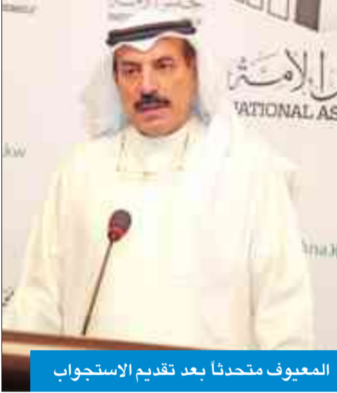
المعيوف متحدثاً بعد تقديم الاستجواب

وإن تعجب فعبج قولهم نحن نعمل في ضوء الصالح العام الطامة الكبرى إن هؤلاء السبعة يعملون، تم حجب الأسماء لحق الخصوصية، (أعمال سكرتارية)، ومنفذ عمليات (فراش)، وسائق، واختصاصي