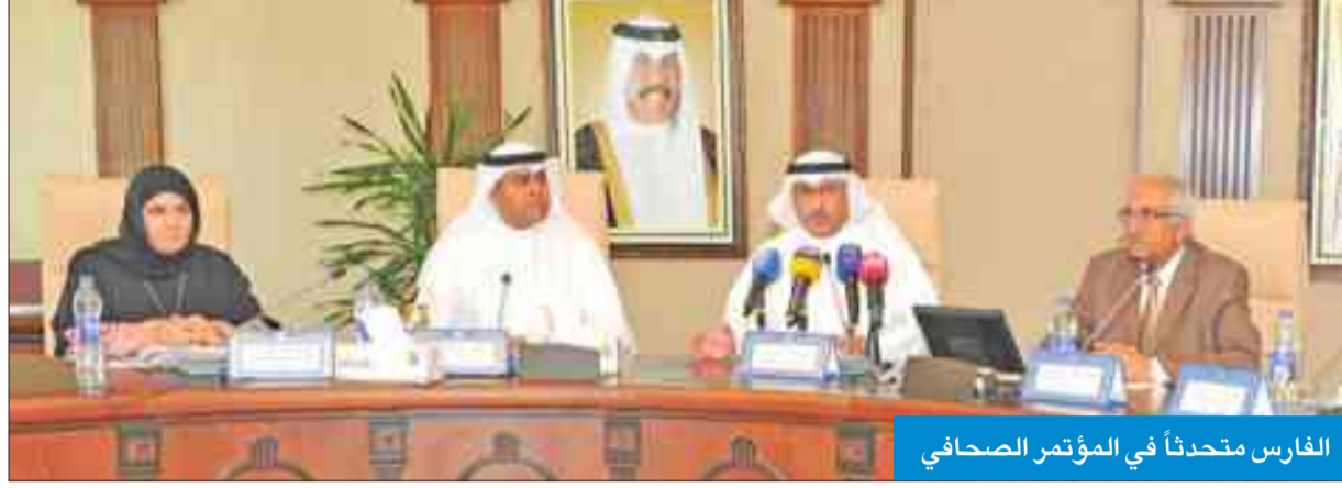
الفارس متحدناً في المؤتمر الصحافي

أعلن الأمين العام لجامعة الكويت د. محمد الفارس احتفال الجامعة بمرور 50 عاماً على تأسيسها يوم الأربعاء 30 نوفمبر المقبل، مشيراً إلى أن جميع الكليات ستشارك في فعاليات اليوبيل الذهبي للجامعة.