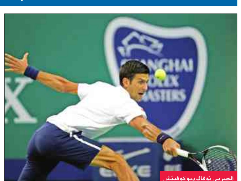
الصربي نوفاك ديوكوفيتش

وامتلك راوونيتش فرصتين في الثالثة الحاسمة لإنهاء اللقاء في صالحه قبل أن يخسرها بنشوط فاصل 7-6 (10-8).