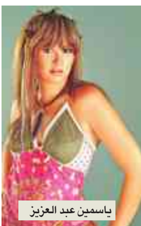
ياسمين عبد العزيز

قررت ياسمين عبد العزيز تاجيل أية أحاديث عن مشروعيها السينمائي المقبل إلى حين الانتهاء من تصوير بطوليتها الدرامية الأولى، علماً بأنها تلقت أكثر من فكرة، ولكنها طلبت تأجيل المشروع.