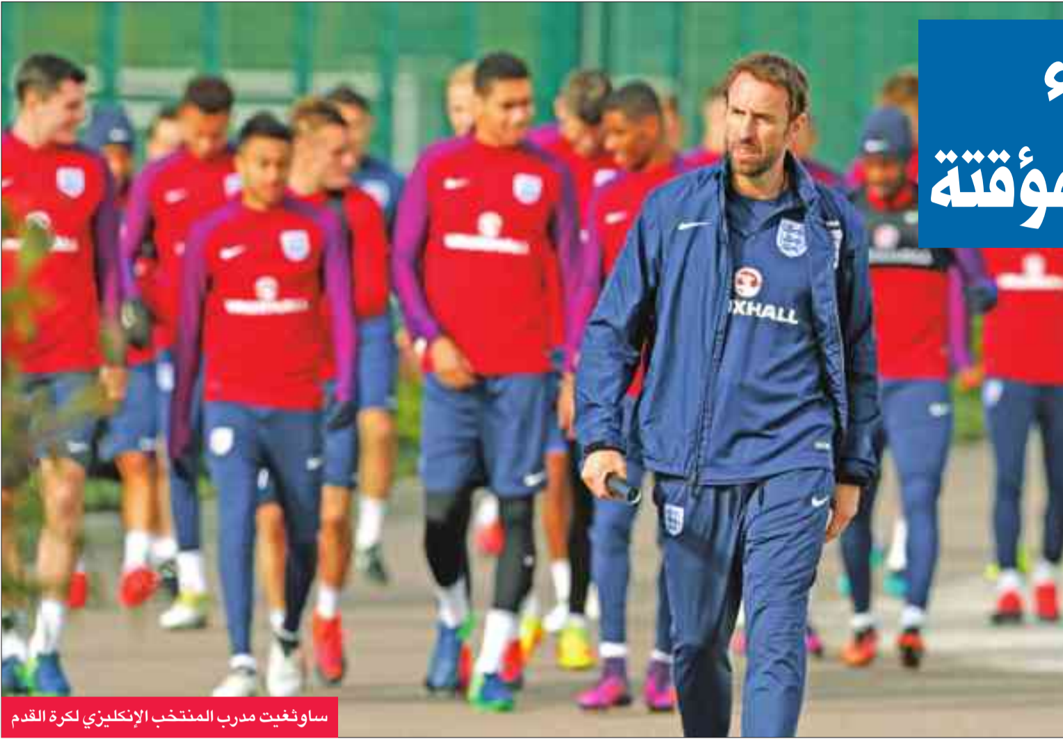
ساوثغيت مدرب المنتخب الإنجليزي لكرة القدم