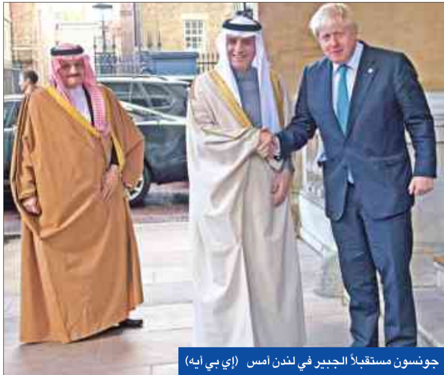
جونسون مستقبلاً الجبير في لندن أمس

تعرضت سفينة أميركية لهجوم صاروخي فاشل، هو الثالث خلال أقل من أسبوع، مصدره الأراضي اليمنية الواقعة تحت سيطرة الميليشيات الحوثية وسط تزايد المخاوف بشأن حرية الملاحة بمضيق باب المندب الاستراتيجي، في حين لم يفتح قيادة أركان الجيش اليمني تحقيقاً داخلياً بعد يوم من إلقاء اللجنة المشتركة للتحقيق في حادث كصف «قاعة صنعاء» اللوم على طرف بالجيش.