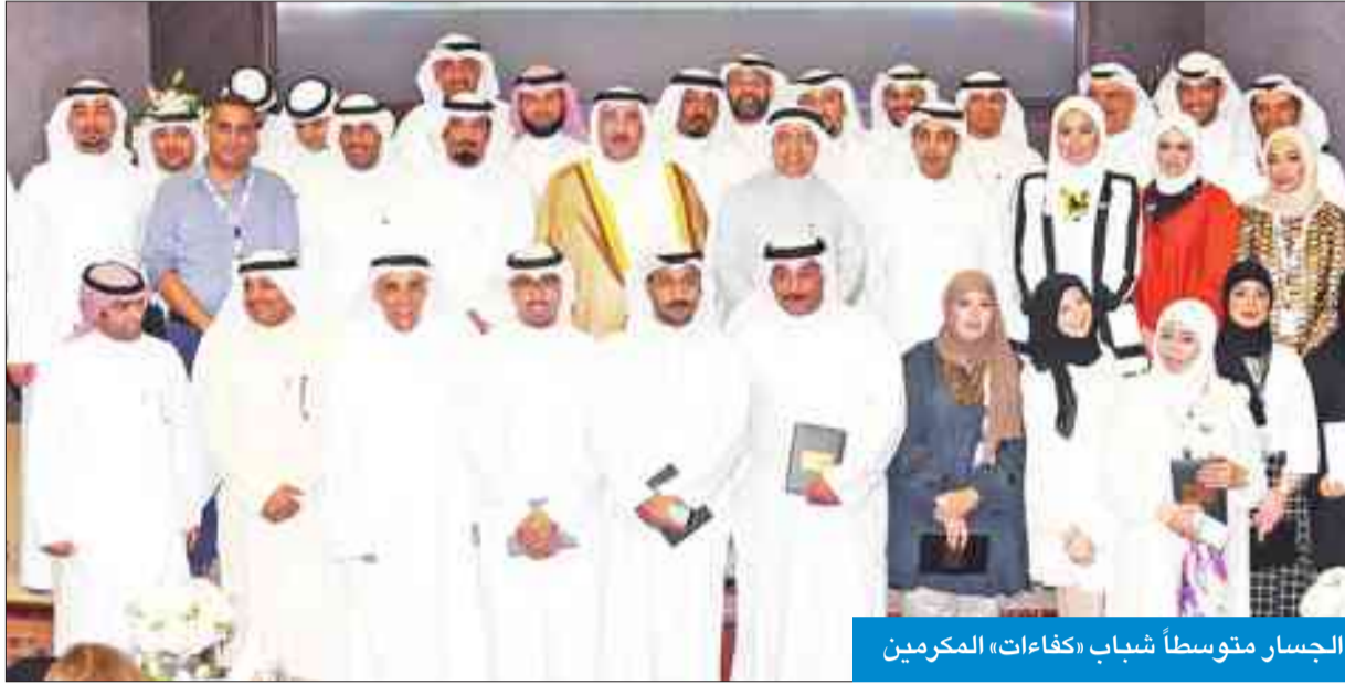
الجسار متوسطاً شباب «كفاءات» المكرمين

بوشهري: نسعى إلى تحويل الأفكار المبتكرة إلى واقع حقيقي في جميع المجالات