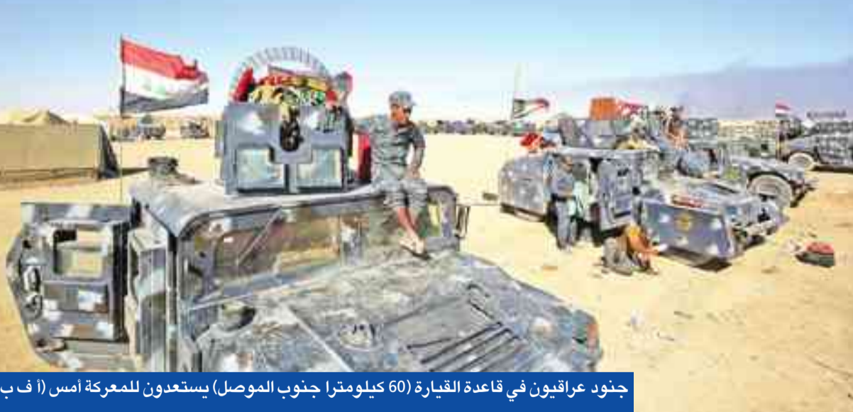
جنود عراقيون في قاعدة القيارة (60 كيلومترا جنوب الموصل) يستعدون للمعركة أمس

«الصدريون» يتظاهرون غداً رفضاً لعودة المالكي