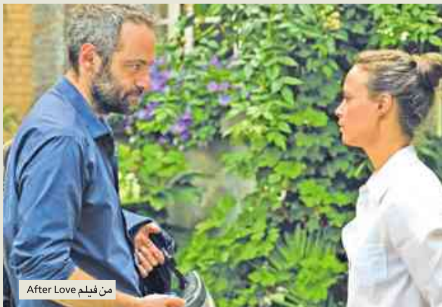
من فيلم After Love

والإيطالي Fire At Sea الحائز جائزة الدب الذهبي في مهرجان برلين 2016، ورشحته إيطاليا لتمثيلها في مسابقة أفضل فيلم أجنبي في جوائز الأوسكار للعام