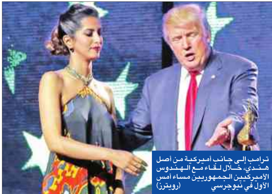
ترامب إلى جانب أميركية من أصل هندي، خلال لقاء مع الهندوس الأميركيين الجمهوريين مساء أمس الأول في نيوجرسي

أصوات المجمع الانتخابي المطلوبة للفوز بالرئاسة تتجاوز 95 في المئة بفارق 118 صوتاً في المجمع الانتخابي. وبالنسبة لحملة ترامب توجد مجموعة ولايات ينبغي على المرشح الجمهوري الفوز بها، لضمان تأييد كاف من الولايات للوصول إلى البيت الأبيض. ومن بين هذه الولايات فلوريدا، لكن الزيارات العديدة التي قام بها ترامب والمرشح الجمهوري لمنصب نائب الرئيس مايك بنس لم يكن لها سوى تأثير بسيط على تقدم كليتون في سياق الفوز بأصوات المجمع الانتخابي للولاية وعددها 29 صوتاً. وتتقدم كليتون في هذه الولاية بست نقاط مئوية، وهي نفس نسبة تقدمها في الأسبوع الماضي. لكن السباق أصبح متقارب النسب في أوهايو، وهي ولاية أخرى مهمة لترامب. وكانت أوهايو ونيغادا تميّلان نحو كليتون في الأسبوع الماضي، لكنهما الآن تتأرجحان بين المرشحين. (نيويورك، بورتموث، أ ف ب - رويترز)