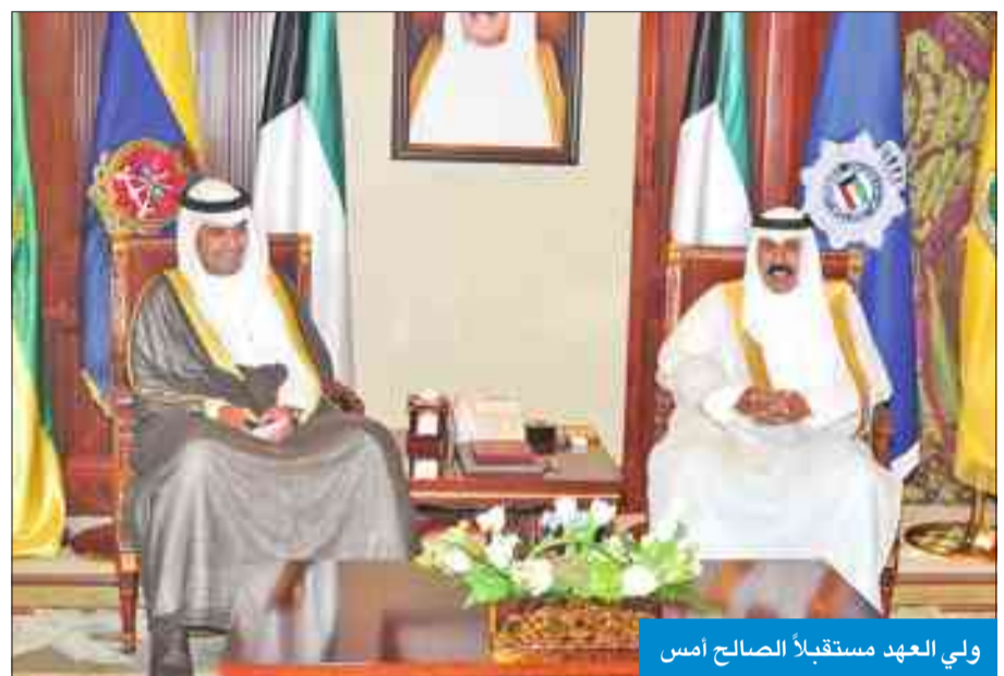
ولي العهد مستقبلاً الصالح أمس

استقبل سمو ولي العهد الشيخ نواف الأحمد، بقصر بيان، صباح أمس، رئيس مجلس الوزراء سمو الشيخ جابر المبارك، والنائب الأول لرئيس مجلس الوزراء وزير الخارجية الشيخ صباح الخالد، ونائب رئيس مجلس الوزراء وزير الداخلية الشيخ محمد الخالد، ونائب رئيس مجلس الوزراء وزير الدفاع الشيخ خالد الجراح، واستقبل سموه، نائب رئيس مجلس الوزراء وزير المالية وزير النفط بالوكالة أنس الصالح، ووزير الإعلام وزير الدولة لشؤون الشباب الشيخ سلمان الحمود، ووزير الدولة لشؤون مجلس الوزراء الشيخ محمد العبدالله.