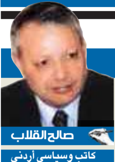
صالح القلب كاتب وسياسي أردني