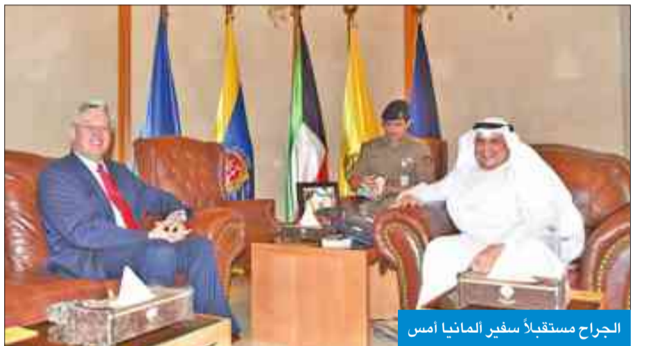
الجراح مستقبلاً سفير ألمانيا أمس