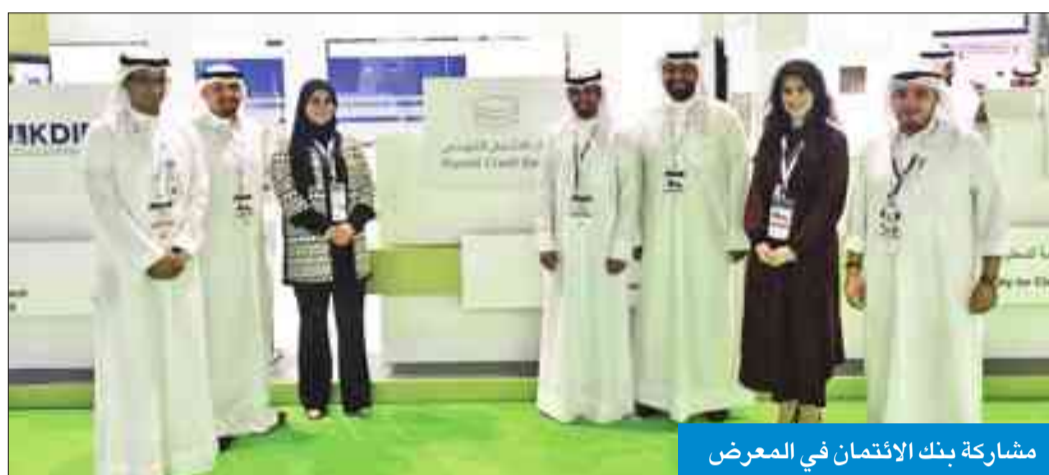
مشاركة بنك الائتمان في المعرض

المضف: أبرز إنجازاتنا إطلاق القرصين الاجتماعي والعقاري إلكترونياً