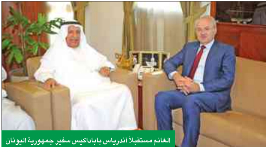
الغانم مستقبلاً أندرياس باباداكيس سفير جمهورية اليونان

وسيكون من دواعي سرور الغرفة التعاون مع الجهات اليونانية لإيجاد هذه الزيارة. في نهاية اللقاء، أعرب السفير اليوناني عن خالص امتنانه وتقديره لغرفة تجارة وصناعة الكويت على تعاونها الدائم، وما تقدمه من خدمات لتعزيز التعاون الثنائي بين البلدين، وتم تزويده بالدليل التجاري لأعضاء الغرفة، وإهم القوانين التجارية والاستثمارية في الكويت.