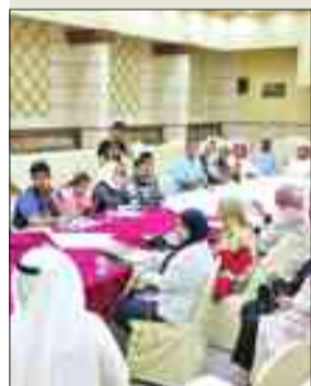
جانب من تحضيرات ملتقى التطوع

تقيم مجموعة «الكويت بقلوبنا» التطوعية، بالتعاون مع مدرسة الكويت الإنكليزية اليوم، ملتقى الفرق التطوعية الأول، بحضور الشايح أنيسة سالم الحمود، في السادسة مساءً بمركز تنمية المجتمع في منطقة صباح السالم.