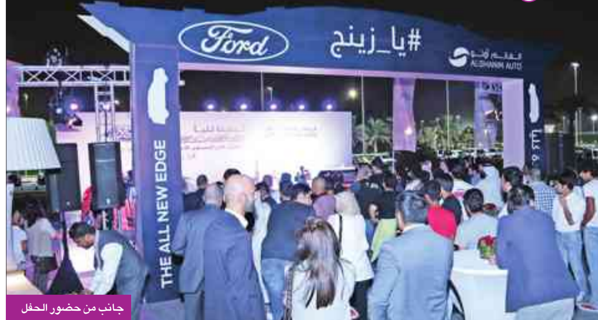
جانب من حضور الحفل