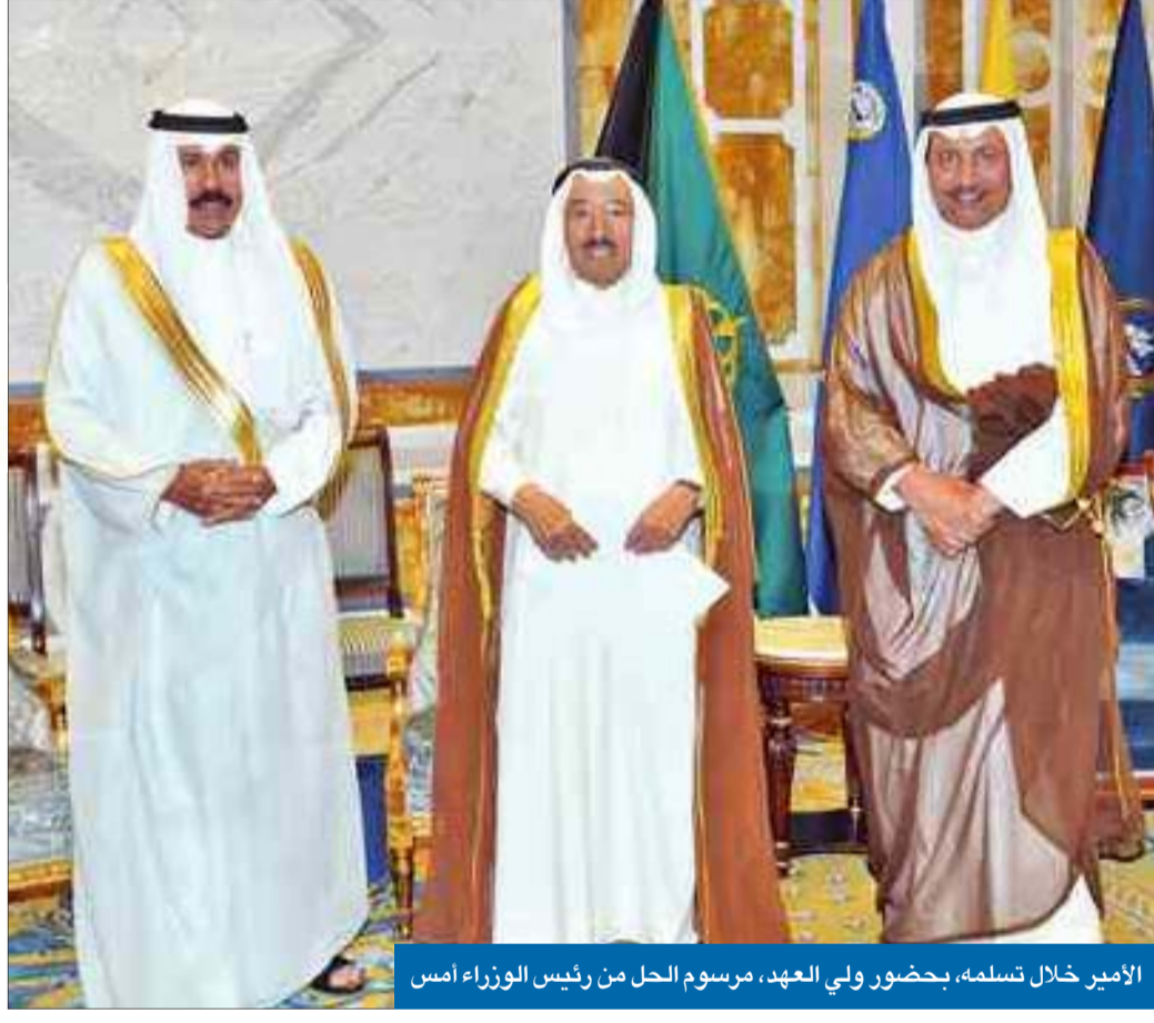
الأمير خلال تسلمه، بحضور ولي العهد، مرسوم الحل من رئيس الوزراء أمس

● الخالد يحدد موعد فتح باب الترشح... وترجيح بدء تسجيل المرشحين الأحد