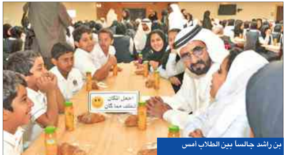
بن راشد جالساً بين الطلاب أمس

وأكد حاكم دبي للطلاب أن عمل الدولة من أجلهم ومن أجل جميع أبناء وبنات الإمارات، أملاً تفوقهم العلمي من أجل مستقبل بلدهم.