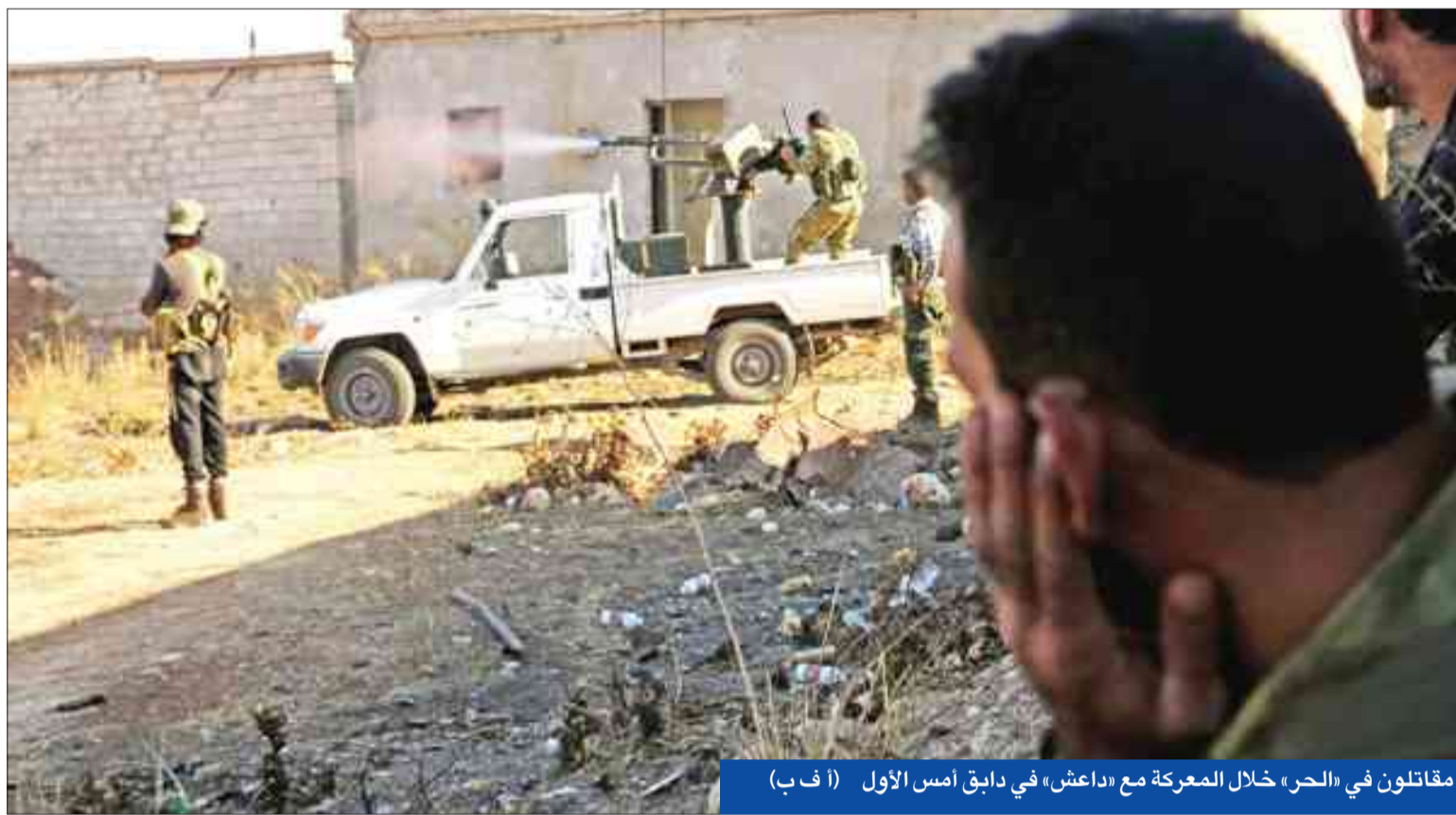
مقاتلون في «الحر» خلال المعركة مع «داعش» في دابق أمس الأول