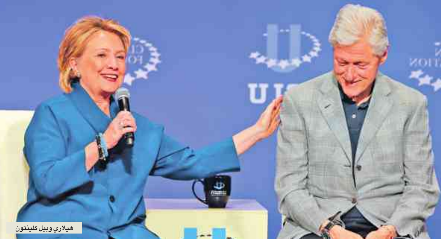
هيلاري وبيل كلينتون

لا يتفارق الثنائي هيلاري وبيل كلينتون. تبدو سر هذه الكيمياء الواضحة خلف الكواليس؟ هيلاري مَترنة ومتحفظة بقدر ما يبدو بيل مسترخياً ومنفتحاً. يجمعهما حب التفوق منذ 30 سنة وبشكلان معاً فريقاً متكاملًا. لكن ما من علاقتهما بعدما تعرّف إليهما عن قرب.