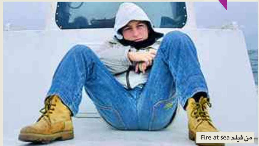
من فيلم Fire at sea

واستحدثت البانوراما هذا العام قسمين جديدين أضافتهما إلى أقسام الدورات الماضية، وهما «عدسة المدينة» ويركز على أفلام خاصة بإحدى المدن (برلين لهذه الدورة)، وقسم «بانوراميشين» الخاص بأفلام التحريك الأوروبية، بالإضافة إلى الأقسام القديمة، وهي: الأفلام أوروبية، وأفلام العمل الأول، والفيلم الوثائقي، وأفلام ملثقي الطرق والعلامات السينمائية وكلاسيكات البانوراما.