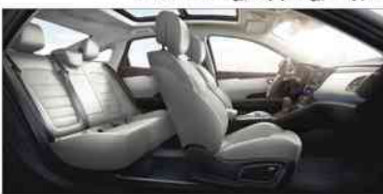
مظهر خارجي فخيم

الداخلية، ويتم تحديد سرعات الأبواب من وضع الصف وتفعيل الإضاءة فسلفية لتضفي «المنطقة المحيطة بالمباب وتلويح مؤشرات الاتجاه وتلميح رينو تاليسمان» بأفضل مستوى من حيث الكابينة ومساحة التخزين. ويمكن تمييزها بسهولة، بسبب ثلاثة جوانب رئيسية، هي: مساحة كبيرة في الأمام والخلف مخصصة للتراس، بغسل ارتفاعها البالغ 902 مم، ومسافة 854 مم بين وسادة المقعد والسقف في الأمام والخلف.