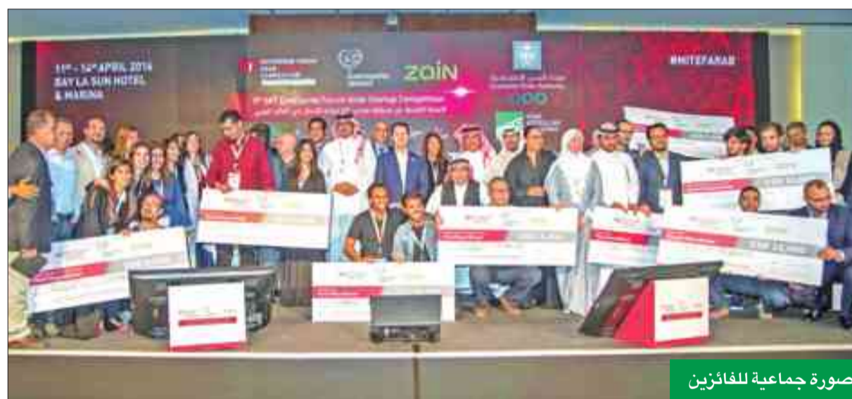
صورة جماعية للفائزين

وهذا الهدف بكل تأكيد يتوافق مع مبادرتنا في مجموعة زين في مجالات الاستدامة، حيث نتطلع إلى رؤية أفكار ابتكارية جديدة في هذه النسخة.