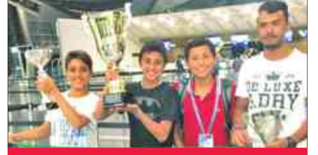
منتخب الكويت للشراع في ختام المنافسات

حصد منتخب الكويت للشراع المراكز الأولى في ختام منافسات بطولة قطر الدولية المفتوحة للشراع، التي انطلقت الثلاثاء الماضي، واستمرت خمسة أيام، بتنظيم الاتحاد القطري للشراع والرياضات البحرية، وشاركت فيها: الكويت وتونس والسودان والهند وبريطانيا وأستراليا وإيطاليا وكازاخستان وفرنسا، إضافة إلى قطر، البلد المظف.