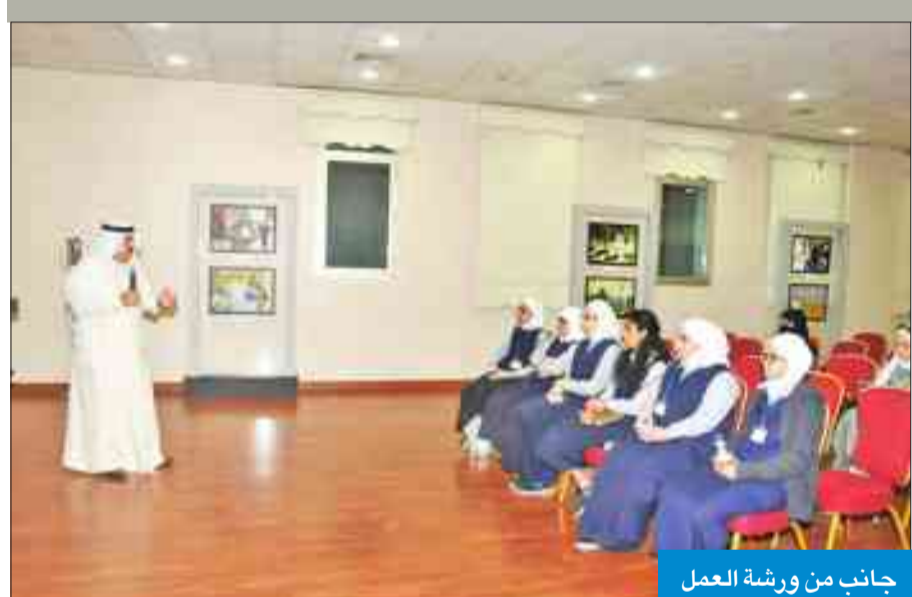
جانب من ورشة العمل

ثقافة الحد من الكوارث عالميا والوقاية منها والاستعداد لها. وأضاف أن الأمم المتحدة حددت عام 2016 للتعريف بحملة «سنداي سبعة» التي تتضمن سبع غايات لتحقيقها خلال سبع سنوات وتتلخص بإطار سنداي للحد من مخاطر الكوارث الطبيعية الذي تم إقراره في سنداي باليابان عام 2015. وأشار بما تقوم به الكويت من أعمال إنسانية لخدمة البشرية ودعم الدول التي تتعرض للكوارث الطبيعية من خلال تقديم المساعدات الإغاثية والطبية العاجلة وعمل المشاريع التنموية. وأكد أهمية بناء قدرات الجمعيات الوطنية في تنفيذ برامج بشأن الكوارث وإدارة الأزمات والنهوض بتلك البرامج وتعزيز التقيد بالمبادئ الإنسانية باعتبارها أرضية مشتركة لتحسين التنسيق بين الشركاء.