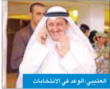
العتيبي: الوعد في الانتخابات