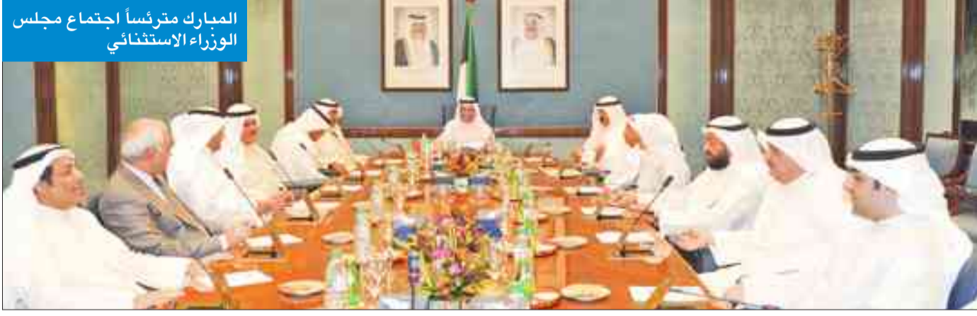
المبارك مترئساً اجتماع مجلس الوزراء الاستثنائي