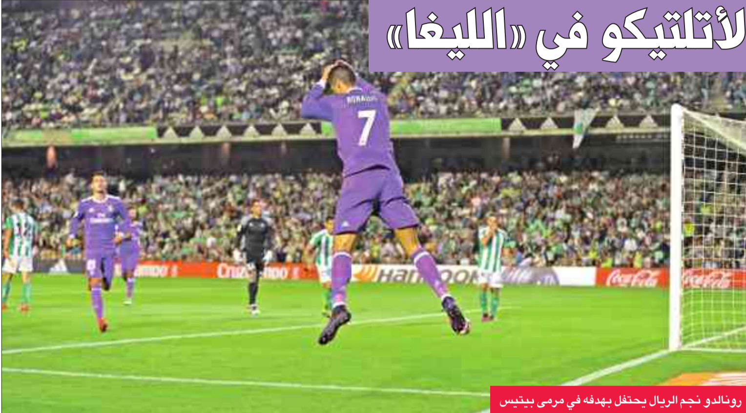
رونالدو نجم الريال يحتفل بهدفه في مرمرى بيتيس

بداية رائعة، فاز خلالها في 4 مباريات على التوالي، بيد أن رجال المدرب الفرنسي زين الدين زيدان تعادوا 3 مرات أمام فياريال (1-1) ولاس بالماس (2-2) وإيبار (1-1)، مما رفع مستوى الانتقاد ضد النجم السابق