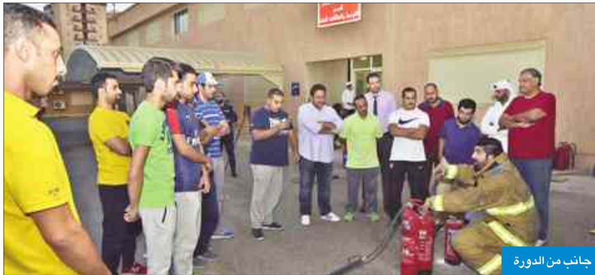
جانب من الدورة

اعتبر العقيد الأمير أن الإقبال الشديد من المواطنين والمقيمين على دورة «إطفائي في كل بيت» يعطي مؤشراً جيداً على وعي المجتمع واهتمامه لمعرفة السلامة من الحريق وطرق المكافحة والأمن في المنزل.