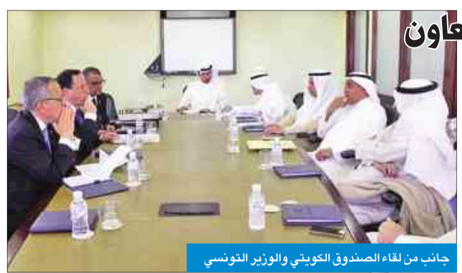
جانب من لقاء الصندوق الكويتي والوزير التونسي

كشف الخالد أن ميزانية العام الحالي 2016/2017 بلغت 15 مليون دينار للبعثات الدراسات العليا، مشيراً إلى تخصيص 7.5 ملايين لخطة التدريب الخارجية والبرامج التعاقدية.