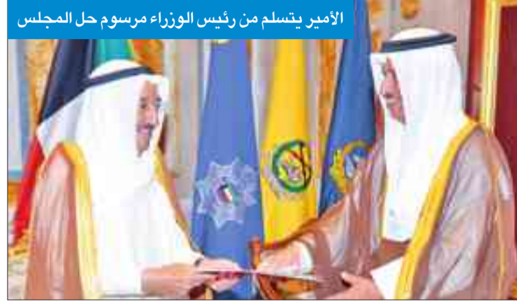
الأمير يتسلم من رئيس الوزراء مرسوم حل المجلس

وقد اعتمد مجلس الوزراء مشروع مرسوم بحل مجلس الأمة وفقاً للمادة 107 من الدستور، ورفع لصاحب السمو الأمير لاتخاذ ما يراه محققاً للمصلحة العامة بحكمته المعهودة.