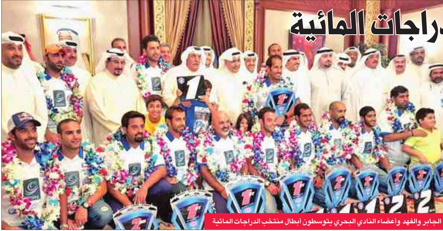
الجابر والفهد وأعضاء النادي البحري يتوسطون أبطال منتخب الدراجات المائية

عاد الى البلاد منتخبنا الوطني للدراجات المائية، قادما من الولايات المتحدة، عقب تحقيقه المركز الأول وحصوله على 10 ميداليات في بطولة العالم 2016