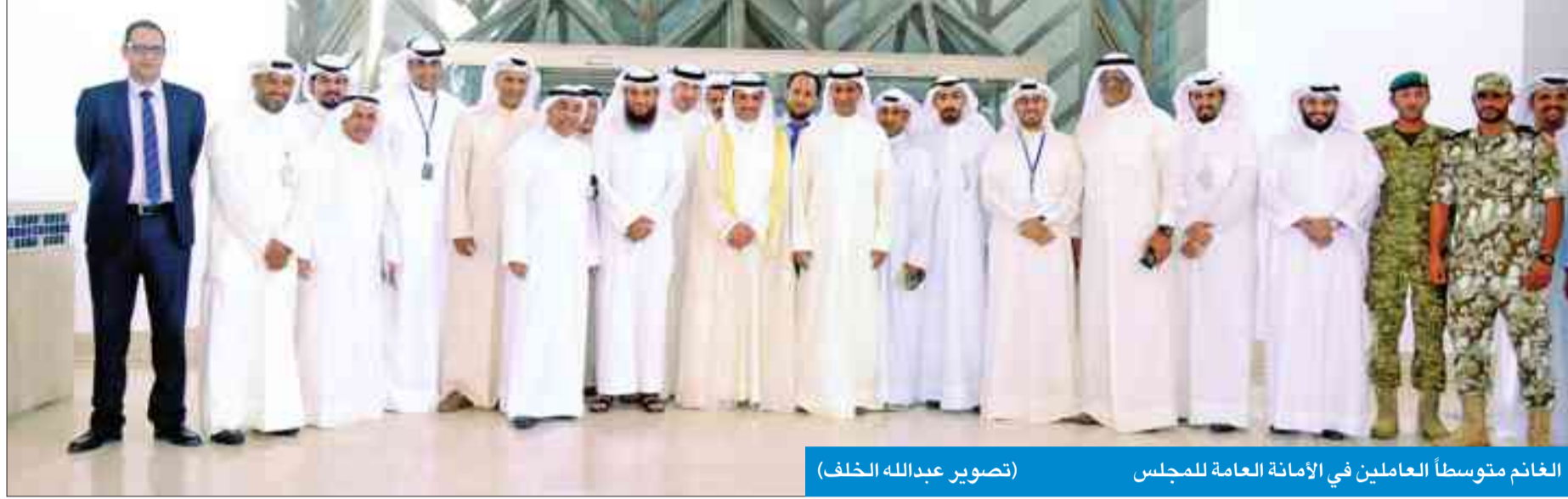
الغانم متوسطاً العاملين في الأمانة العامة للمجلس

الغانم عقب الحل: كل عام وأنت بخير... سامحوني إذا أخطأت