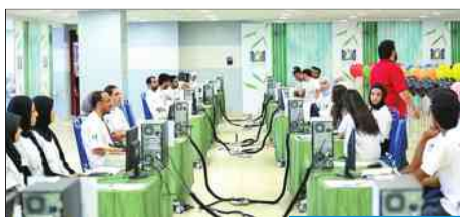
جانب من المشاركة في المسابقة

تشارك في المسابقة جامعة الكويت والجامعة الأميركية بالكويت وجامعة الخليج للعلوم والتكنولوجيا والجامعة الاسترالية وكلية الكويت للتقنية والجامعة العربية المفتوحة وأعضاء هيئة التدريس والطلبة من مختلف الجامعات.