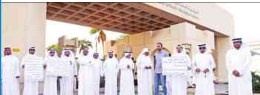
جانب من اعتصام أهالي مدينة جنوب عبدالله المبارك أمام السكنية

على المشروع في يناير المقبل وعدم التحجج بالمعوقات، مبيّناً أن عالم الهندسة لا يوجد شيء يعطله. وقال المتحدث باسم المصممين راشد رجا إن «المطالب شرعية ويجب النظر إليها لتحقيقها، لا سيما أن هناك الكثيرين من مدعي الإعاقة حصلوا على حق أصحاب الطلبات الإسكانية القديمة في غرب عبدالله المبارك بحدود 1440 شخصاً، بعضهم مدعو إعاقة وبعضهم معاقون».