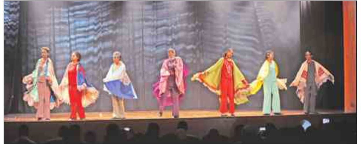
مقامات موسيقية تعبيرية