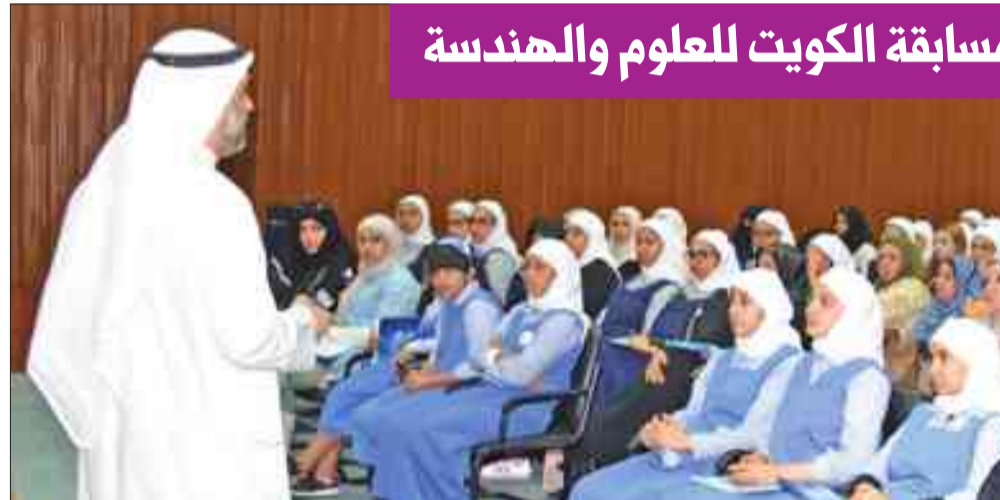
صورة جانبية خلال اللقاء التثويري