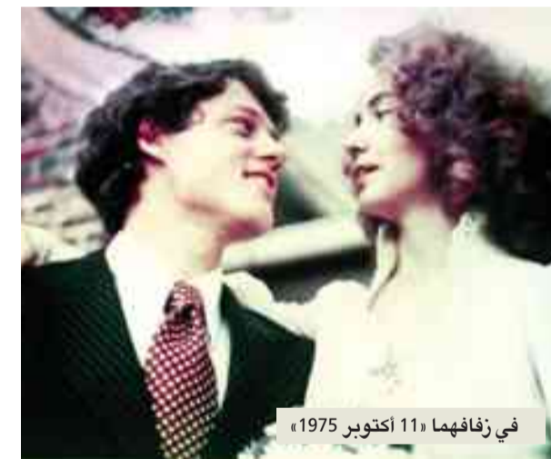
في زفافهما (11 أكتوبر 1975)

سواء كنا نؤيد ترامب أو نعارضه، يشارك هذا الرجل في أكثر اللقاءات المضحكة خلال هذه الحملة. يقدّم استعراضاً بمعنى الكلمة ولا يمكن أن يتجاهله أحد. يكفي أن نشاهد برنامج تلفزيون الواقع The Apprentice (المبتدئ) الذي حقق نجاحاً باهراً وتجاهله صفحات نيويورك تايمز: «كانت حركاته وعباراته القصيرة والحاسمة