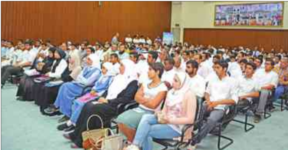
.. والمعلمون والطلاب