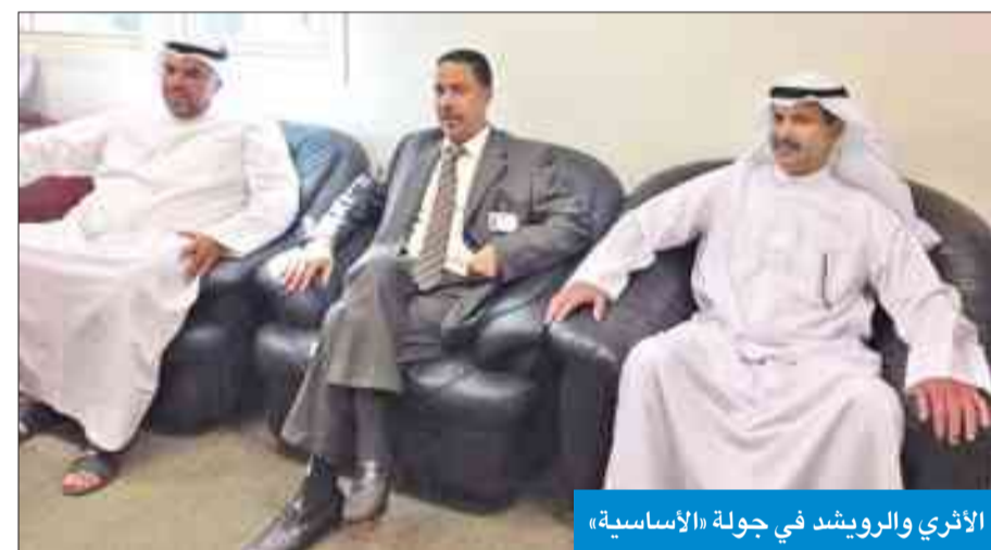
الأثري والرويشد في جولة «الأساسية»

«نسعى لتوفير كل السبل لتيسير العملية التعليمية»