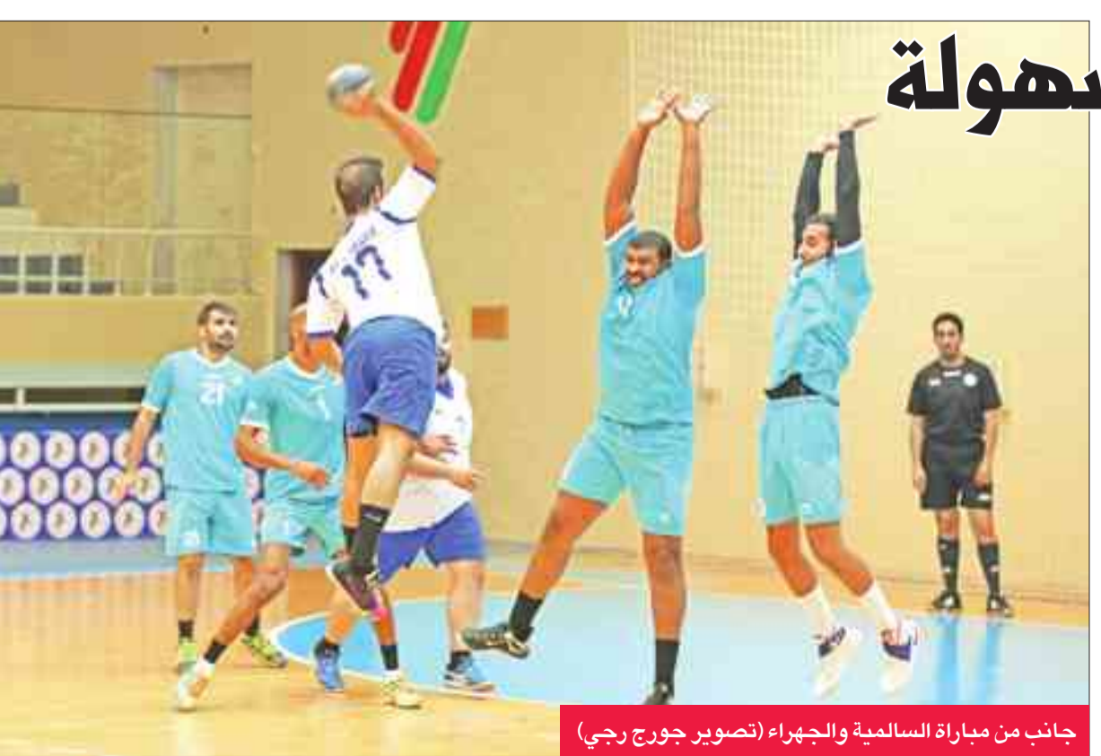
جانب من مباراة السالمية والجهراء