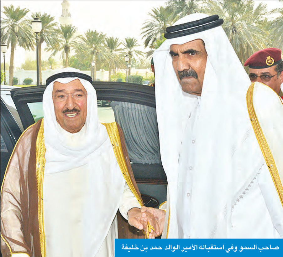
صاحب السمو وفي استقباله الأمير الوالد حمد بن خليفة