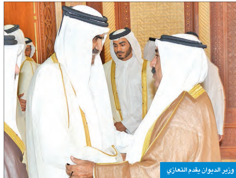
وزير الديوان يقدم التعازي

وقد رافق سموه، وقد رسمي ضم كلا من الشيخ جابر العبدالله، والشيخ فيصل السعود، ونائب رئيس الحرس الوطني الشيخ مشعل الأحمد، وسمو الشيخ ناصر المحمد،