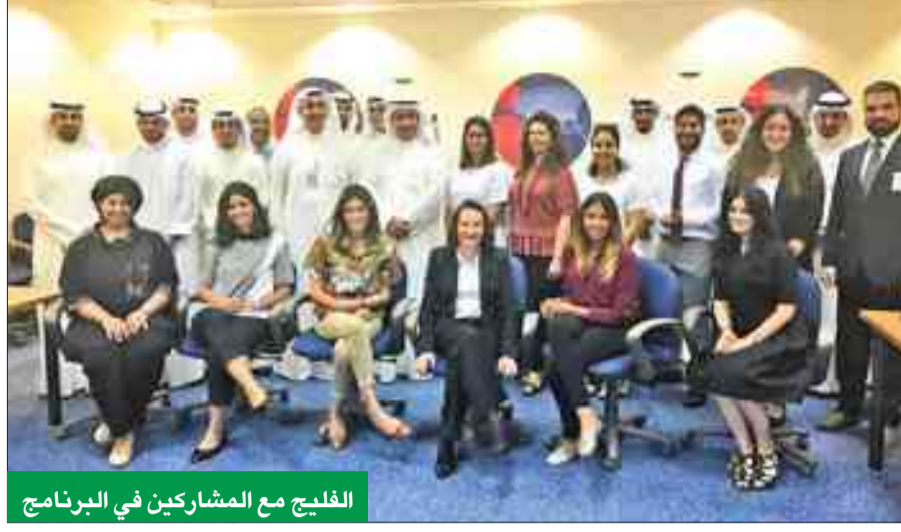
الفليج مع المشاركين في البرنامج

يحتضن بنك الكويت الوطني على التعاون المستمر مع المؤسسات المتخصصة بالدراسات المصرفية، لمواكبة كل جديد في سوق العمل المصرفي، انسجاماً مع جهوده المتواصلة في دعم وتنمية الموارد البشرية وتعزيز الخبرات المتراكمة لدى كوادره بأساليب القيادة الحديثة.