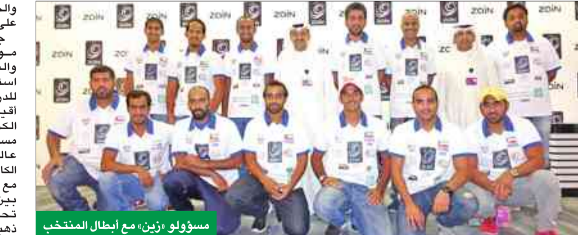
مسؤولو «زين» مع أبطال المنتخب

التوالي جاءت في إطار ثقته الكبيرة بكفاءات الشباب الكويتي القادر على تحقيق التميز والتفوق في جميع الكويز مستويات عالية من المهارة