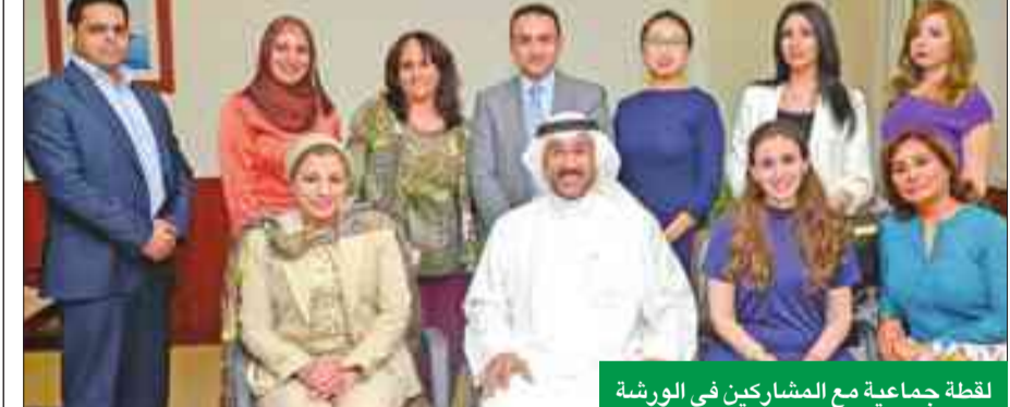
لقطة جماعية مع المشاركين في الورشة

استهدف برنامج الورشة تطوير أداء العاملين من مؤسسات القطاعين الحكومي والخاص، من خلال الطرق لنهج التفاوض وفنه، والأساليب الحديثة في تطبيقات مهارات التفاوض.