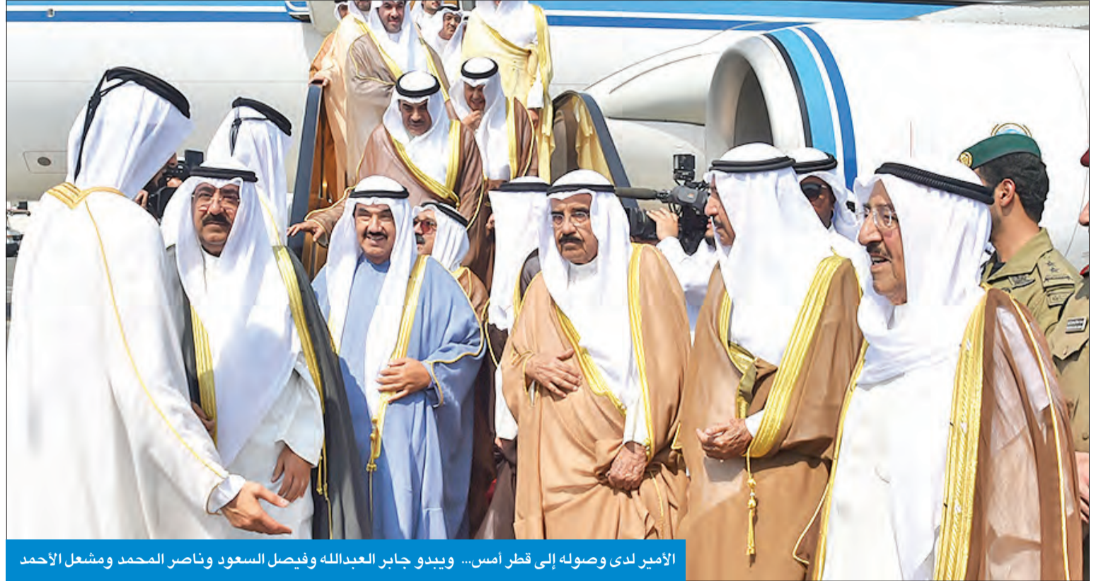
الأمير لدى وصوله إلى قطر أمس... ويبدو جابر العبدالله وفیصل السعود وناصر المحمد ومشعل الأحمد