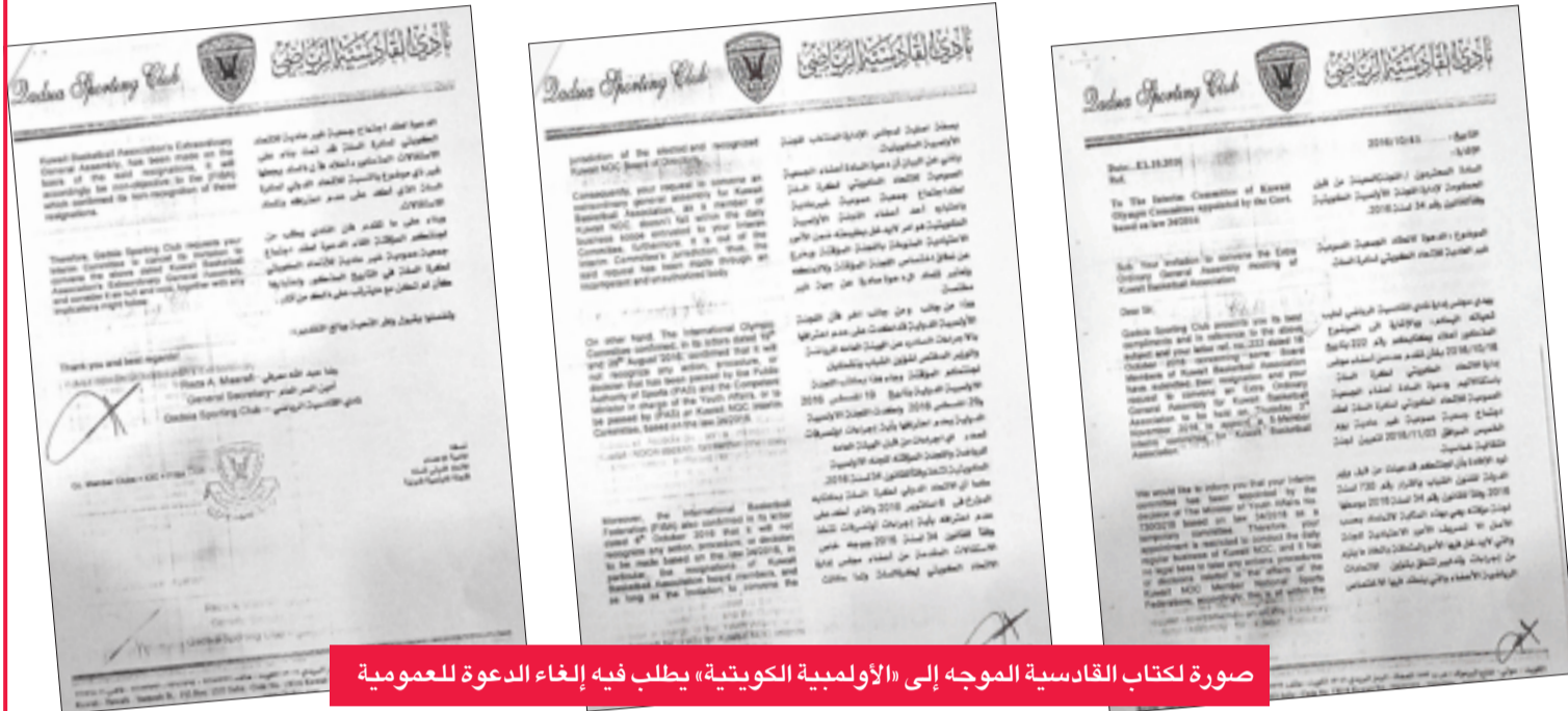
صورة لكتاب القادسية الموجه إلى «الأولمبية الكويتية» يطلب فيه إلغاء الدعوة للعمومية

طالب بإلغاء الدعوة إلى «عمومية السلة» وادعى عدم أحقية «الأولمبية» بتوجيهها