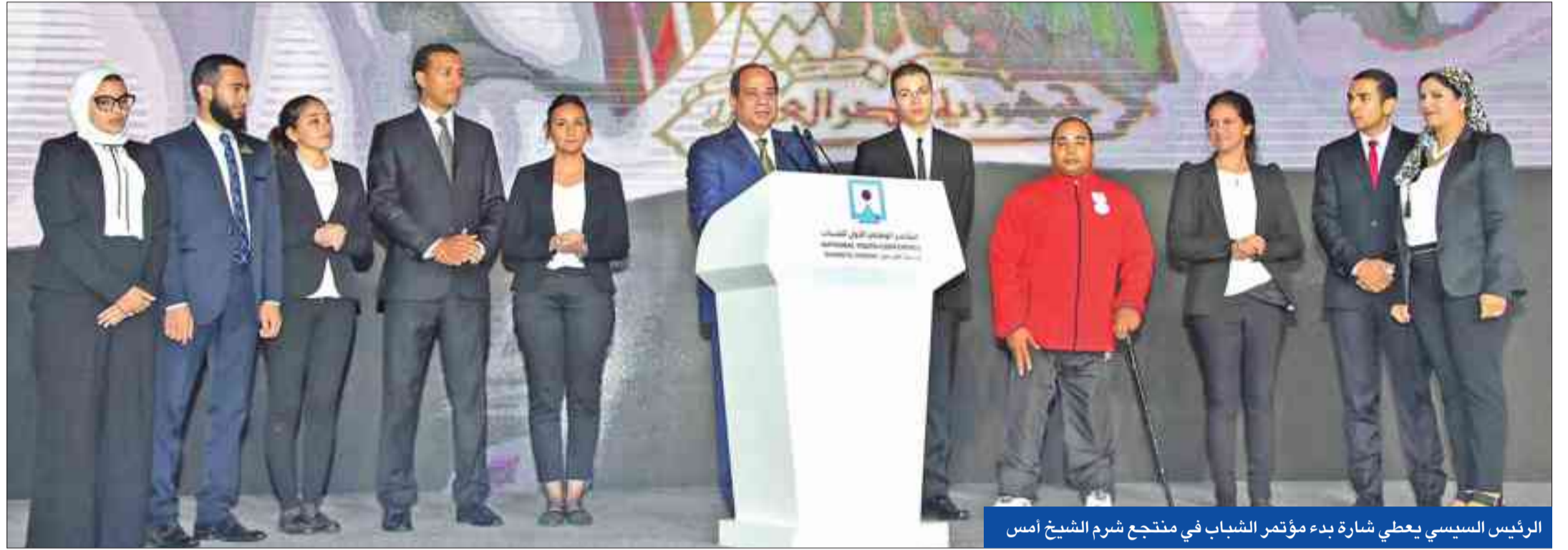
الرئيس السيسي يعطي إشارة بدء مؤتمر الشباب في منتجع شرم الشيخ أمس

الثانية أعوام، مبررا وجود عدد كبير من العسكريين في حكومته نتيجة اعتذار نحو 90 في المئة من المدنيين الذين يتم ترشيحهم لتولي حقائق وزارية، مبررا عن أمنيتها أن يكون لحكومته حزب سياسي، يساندها ويدعمها في الشارع.