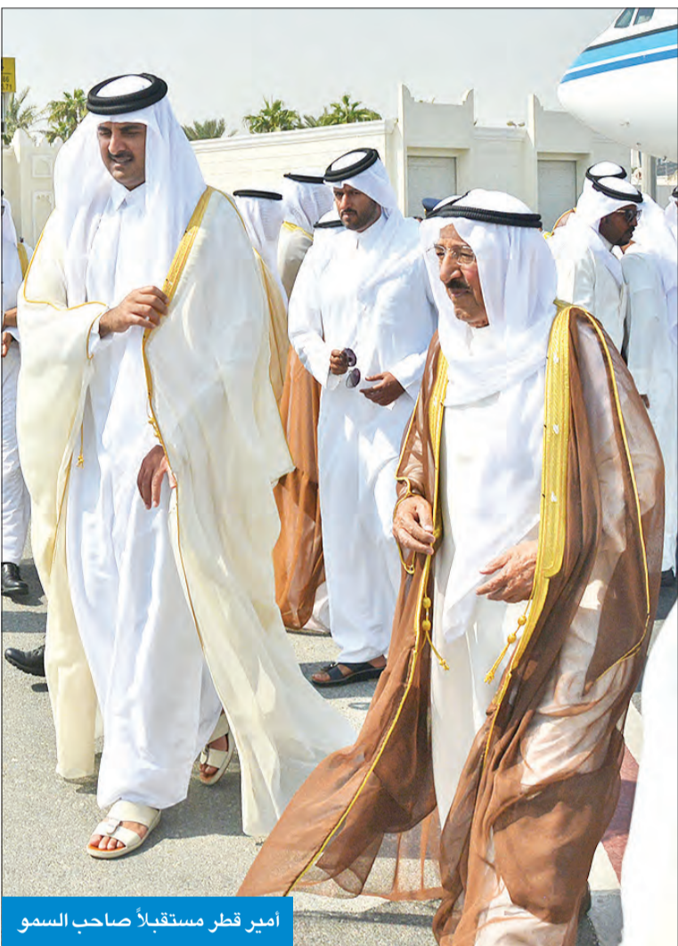
أمير قطر مستقبلاً صاحب السمو

المالية وزير النفط بالوكالة انس الصالح، إلى ذلك، قام نائب وزير شؤون الديوان الأميري الشيخ علي الجراح، صباح أمس، بزيارة لسفارة دولة قطر الشقيقة لدى الكويت، حيث نقل تعازي سمو أمير البلاد الشيخ صباح الأحمد وسمو ولي العهد الشيخ نواف الأحمد وسمو رئيس مجلس الوزراء الشيخ جابر المبارك، ونائب رئيس مجلس الوزراء وزير الداخلية الشيخ محمد الخالد، ونائب وزير شؤون الديوان الأميري الشيخ علي الجراح، ونائب رئيس مجلس الوزراء وزير الدفاع الشيخ خالد الجراح، ونائب رئيس مجلس الوزراء وزير