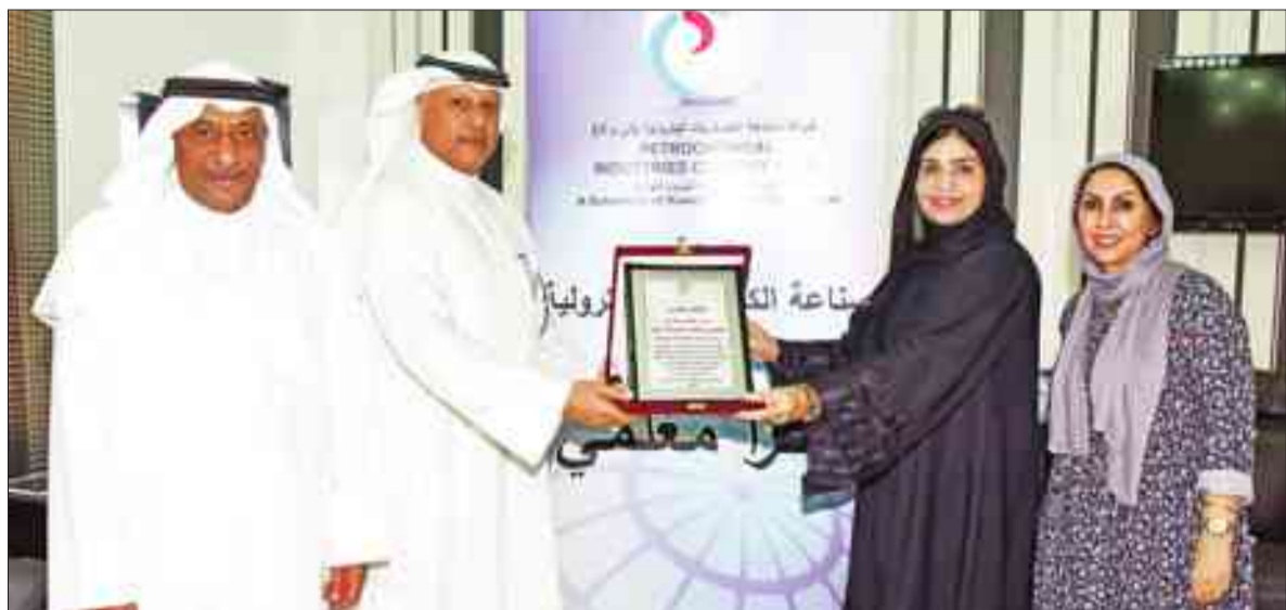
تكريم مديرة مدرسة عمرو بن العاص الابتدائية- بنين