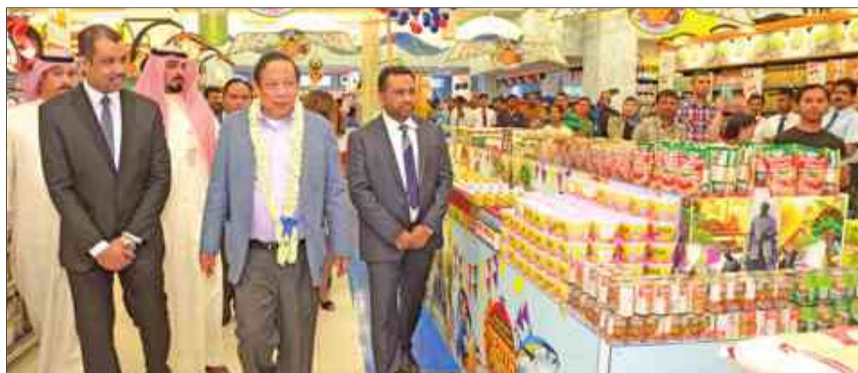
جولة للاطلاع على المنتجات المعروضة