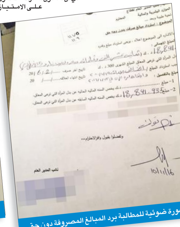
صورة ضوئية للمطالبة برد المبالغ المصروفة دون حق