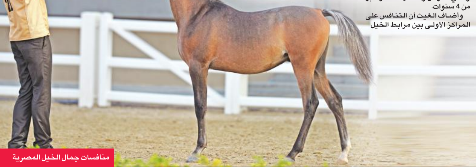
منافسات جمال الخيل المصرية

واضاف الغيث أن التنافس على المراكز الأولى بين مرابط الخيل انطلقت منافسات بطولة جمال الخيل المصرية، أمس الأول، والمدرجة ضمن فعاليات نسخة الخامسة لمهرجان الكويت الوطني للجواد العربي، الذي يقام برعاية سمو ولي العهد الشيخ نواف الأحمد، وسط مشاركة واسعة تضم 159 جواداً عربياً أصيلاً.