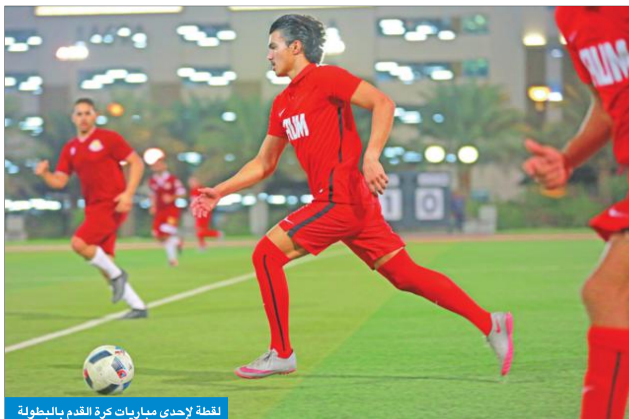
لقطة لإحدى مباريات كرة القدم بالبطولة

بالأنشطة الرياضية، المتجسد برعايتها للعديد من الفعاليات الرياضية، يأتي انطلاقاً من فلسفتها التعليمية، التي تعنى بعملية بناء شخصية الطالب وتطوير مهارات القيادة والتفكير الإبداعي النقدي المستقل لديه.