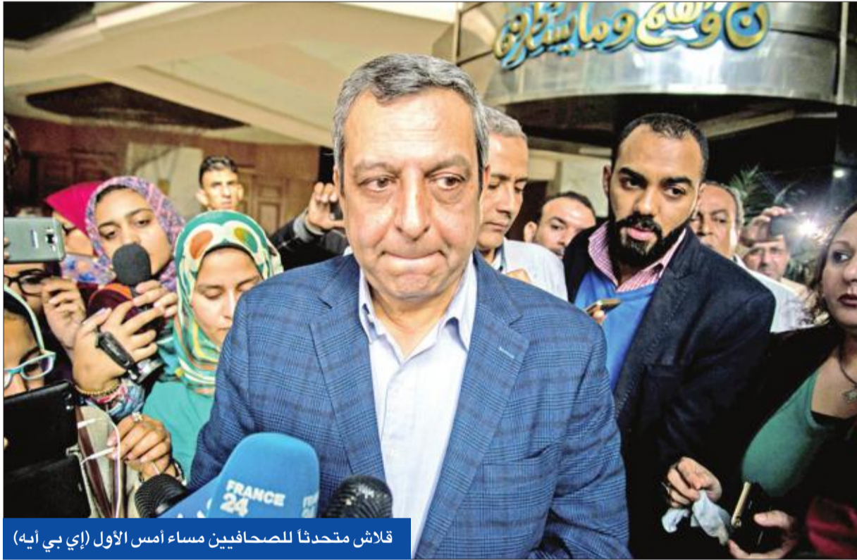
قلاش متحدثاً للصحافيين مساء أمس الأول

القاهرة - محمد يحيى وناسي عطية وإسراء عدلي