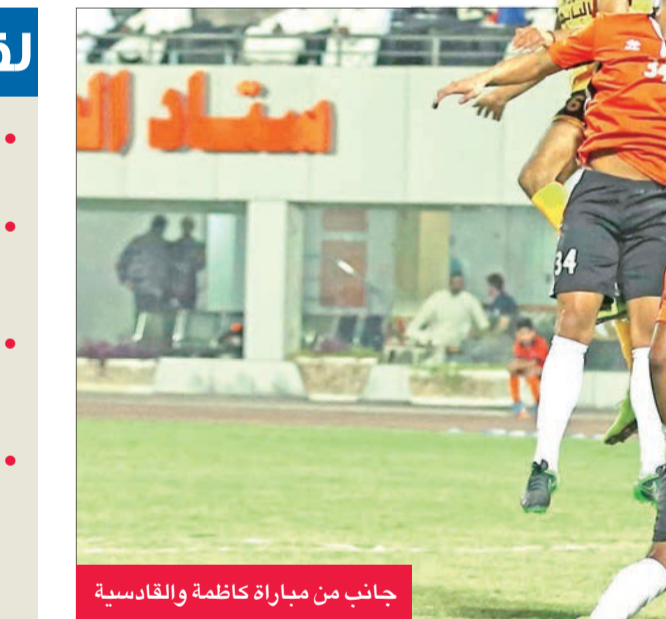
جانب من مباراة كاظمة والقادسية