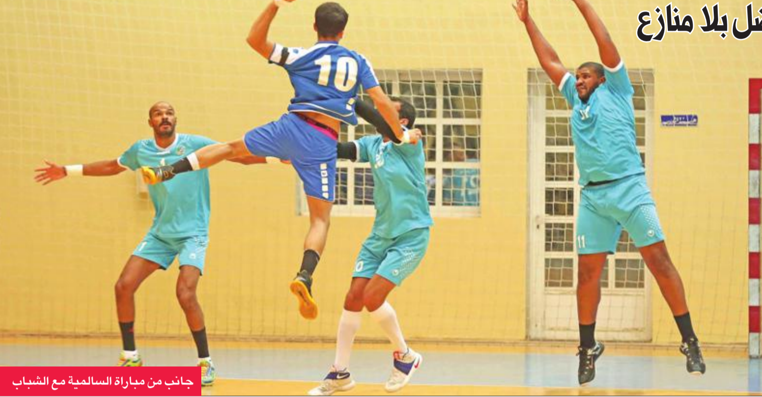
جانب من مباراة السالمية مع الشباب

شهدت الجولة السادسة من الدوري العام لكرة اليد العديد من الأحداث المؤثرة والمفاجآت، أثرت بوضوح على ترتيب فرق المقدمة وصراع الحصول على بطاقات التأهل للدوري الممتاز، كذلك على ترتيب فرق المنتصف والمؤخرة، أبرزها انفراد السالمية والقرين بالقمة، ومواصلة الكويت انتصاراته المتتالية، وتراجع كاظمة بعد سقوطه الأول، والفوز المفاجئ للنصر على العربي، ودخول برقان منطقة الأمان، وهروب الجهراء من المؤخرة تاركاً التضامن يبحث عن سبل الخروج منها، وفي هذا التحليل نسلط الضوء ببعض التفصيل على أهم ما جاء في هذه الجولة.