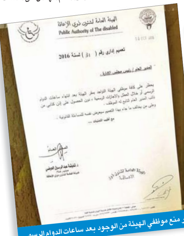
قرار منع موظفي الهيئة من الوجود بعد ساعات الدوام الرسمي

تثبيت كاميرات مراقبة وتركيبة أقفال إلكترونية لمنع التسلسل إلى الغرف