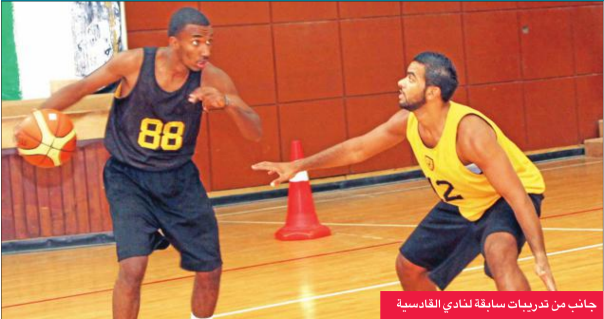
جانب من تدريبات سابقة لنادي القادسية