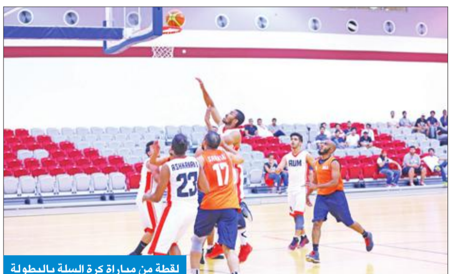
لقطة من مباراة كرة السلة بالبطولة