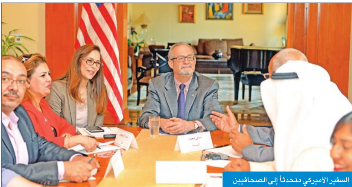
السفير الأميركي متحدثاً إلى الصحفيين

«على حلفاء واشنطن بالخليج الانتظار حتى تتضح معالم سياسة الولايات المتحدة الجديدة»