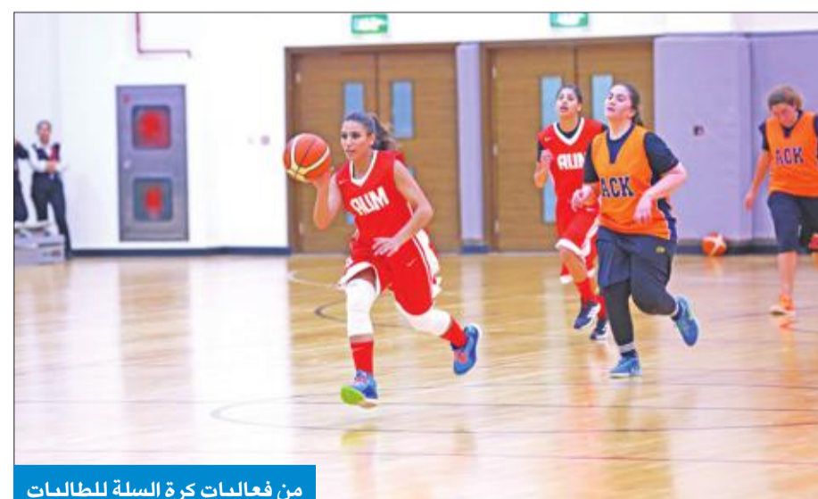
من فعاليات كرة السلة للطلبات