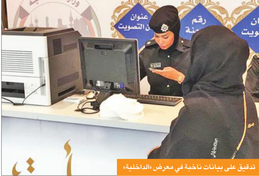
تدقيق على بيانات ناخبة في معرض «الداخلية»

العاشرة صباحاً وحتى الساعة العاشرة مساءً، حيث قامت بتزويد المراجعين من الناخبين بكل المعلومات الخاصة بهم على بطاقات مطبوعة من أرقام قديمهم ومواقع اللجان التي سيدلون فيها بأصواتهم استعداداً للانتخابات البرلمانية التي ستقام في 26 الجاري والتي تساعدهم على الإدلاء بأصواتهم في سهولة ويسر. وأوضحت أنه حضر في هذين المعرضين ضباط وأفراد من الإدارة العامة للعلاقات والإعلام الأمني، إضافة إلى ضباط مختصين من الإدارة العامة لنظم المعلومات يقومون بتزويد من يرغب من المواطنين بإرقام قيودهم في اللجان. ومن جانبهم، أشاد المواطنون الذين استعلموا عن بياناتهم الانتخابية بالدور الإعلامي والتوعوي للإدارة العامة للعلاقات والإعلام الأمني لمواكبتها كل الفعاليات التي تنهدها البلاد.