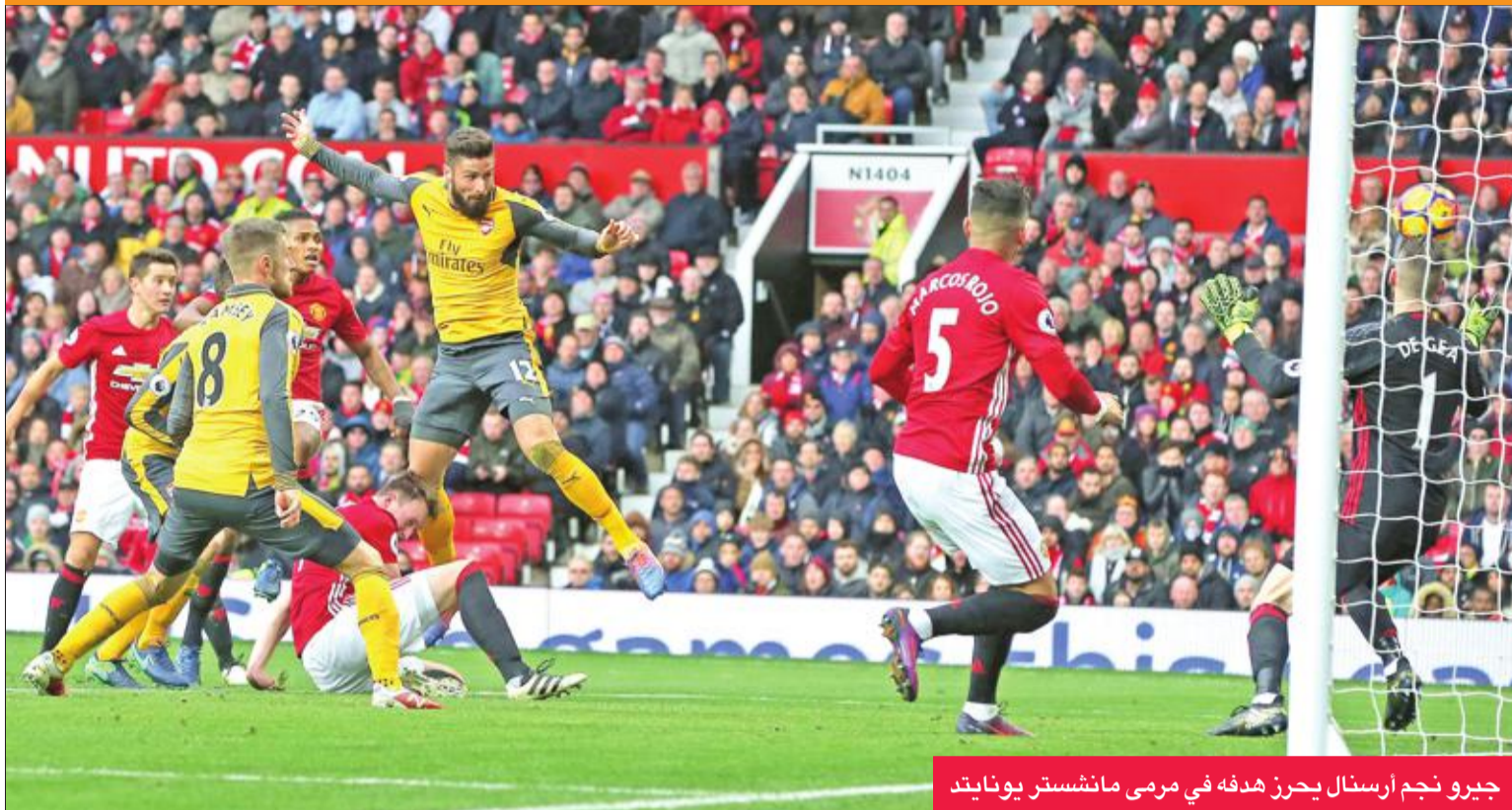
جيرو نجم أرسنال يحرز هدفه في مرمرى مانشستر يونايتد

أهدر ليفربول فرصة جديدة لتعزيز موقفه في صراع الصدارة بالدوري الإنكليزي لكرة القدم، وسقط في فخ التعادل مع مضيفه ساوثامبتون أمس بالمرحلة الثانية عشرة من المسابقة، التي شهدت فوزاً ثميناً 2-1 لمانشستر سيتي على مضيفه كريستال بالاس، ليترجم ما نشستر سيتي ليفربول في الصدارة مؤقتاً. وصوب تعادل ليفربول في مصلحة تشلسي الذي استطاع انتزاع الصدارة في حال الفوز على مضيفه ميدلسبروه اليوم في مباراة أخرى بالمرحلة نفسها.