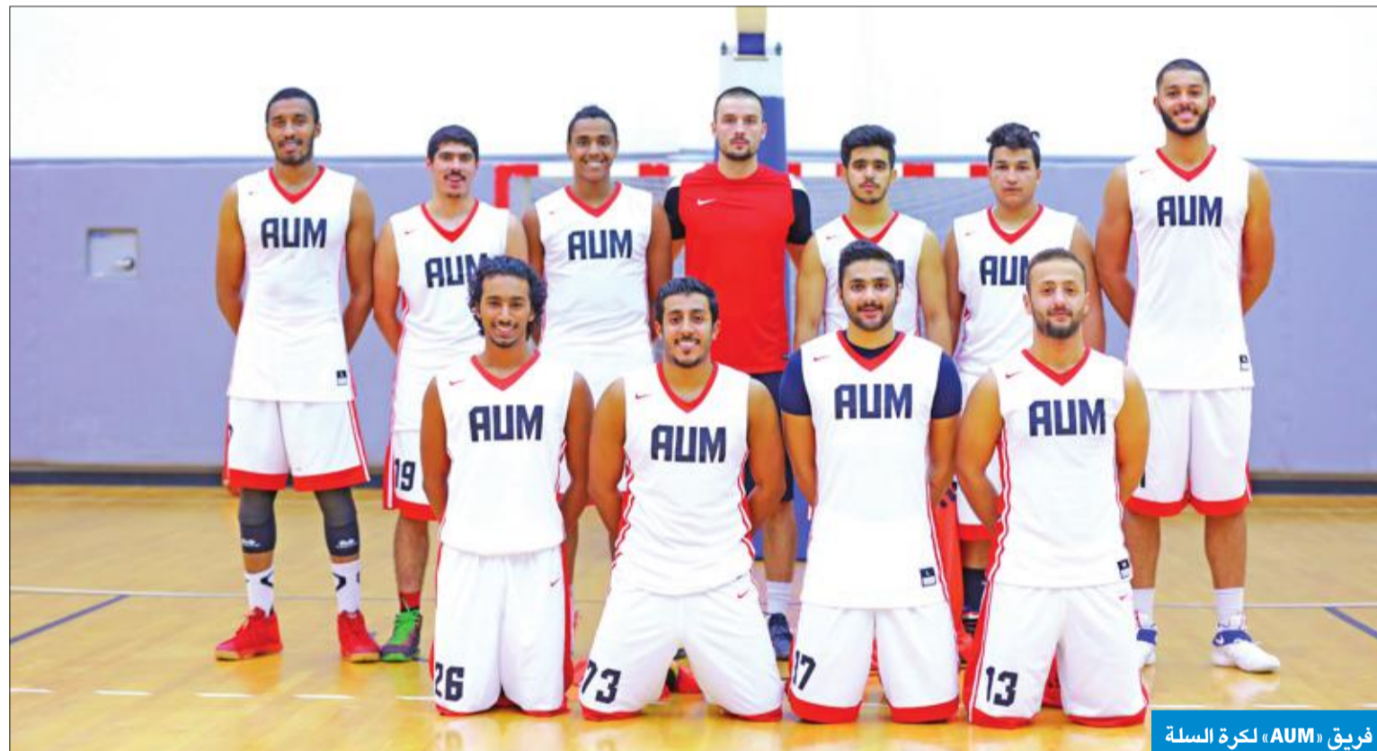
فريق «AUM»، لكرة السلة

وأضاف البيان أن الجامعة تحرص على إيجاد طلبة مجتهدين يفكرهم وعقولهم، ويمتدعين بصحة أبدانهم، ويأتي ذلك من خلال الرياضة، حيث إنها تنمي مهارات العمل كعضو في فريق، والتفكير على نطاق أوسع من تحقيق الأهداف الشخصية، بالتركيز على أهداف الفريق، وهذا يخلق روحاً إيجابية، ويساعد على تمضية أوقات ممتعة وصحية، خلال أعوام الدراسة الجامعية، بما يعود بالنفع على الطلبة، وعلى المجتمع كله.