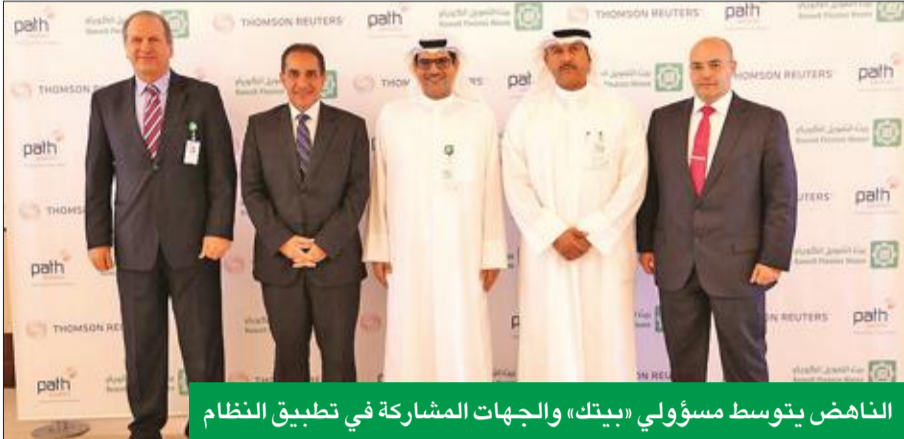
الناهض يتوسط مسؤولي «بيتك» والجهات المشاركة في تطبيق النظام

الناهض: تطور تقني مهم على صعيد البنوك الإسلامية يؤكد ريادة «بيتك»