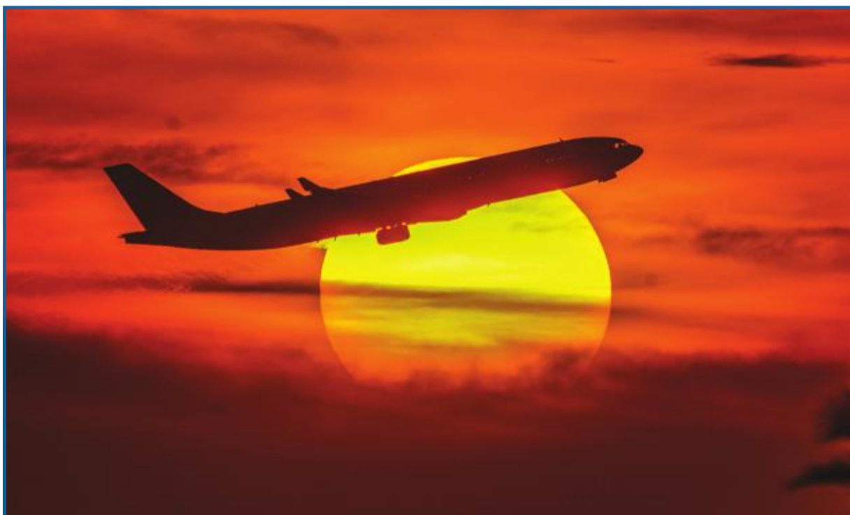
طائرة تجارية تغلق من مطار الكويت الدولي أثناء غروب شمس 19 نوفمبر 2016

الواقع يقول لا تحملوا كثيراً، واسعوا إلى تخفيف الأضرار بقدر الإمكان، فلن تسمح لكم السلطات بالبناء والتطور والزهوض، وستحاربكم في مواطنكم وأرزاقكم، وتقمع آراءكم، وتحيلكم إلى المحاكم، لتمشوا بين أروقتها حتى تحفى أقدامكم، وتضيق عليكم كل خناق حتى تتقافز عيونكم من محاربتها. فاهبطوا من مريحكم لعلكم تُرحمون.