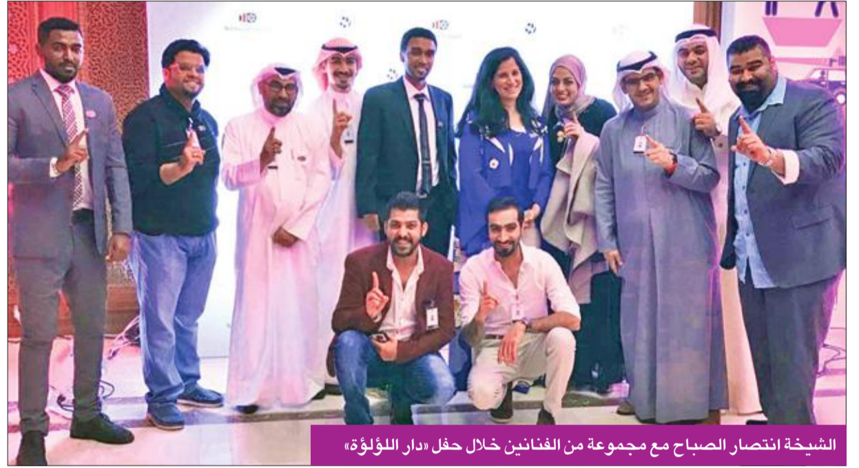
الشيخة انتصار الصباح مع مجموعة من الفنانين خلال حفل «دار اللؤلؤة»

«دار اللؤلؤة» ستكون ملقياً ومنصة لصانعي الأفلام السينمائية