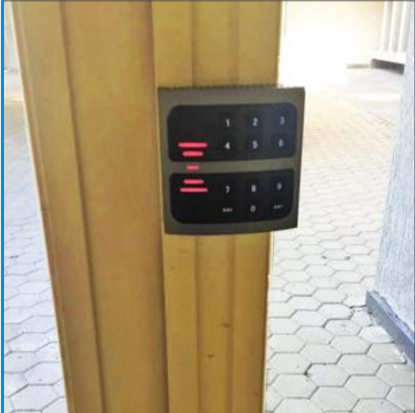
الأقفال الإلكترونية لمنع تسلسل أي شخص غير مسؤول