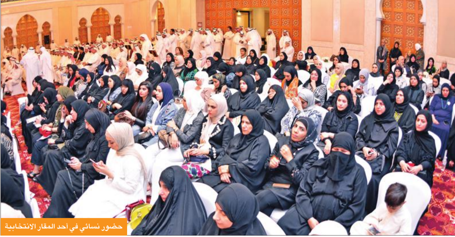
حضور سائي في أحد المقار الانتخابية

تشتمل قضايا اقتصادية وتجارية. وقالت ان "الناخبات يظنن الى ما هو ابعد من الحقوق الاجتماعية ان طالب بعضهن بتعديل قوانين خاصة بالأعمال الحرة وريادة الاعمال لتشجيع المرأة الكويتية المعروفة بتميزها على تخمية دورها وصقل موهبتها في هذا الجانب".