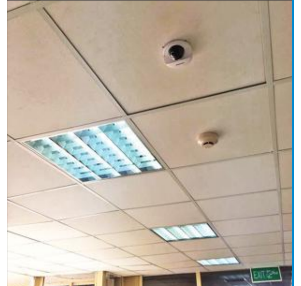
الكاميرات التي تم تثبيتها داخل أروقة الهيئة

والتلاعبات، بل اتخذت إجراءات جديدة، من شأنها إصلاح هذا الوضع المتدهور، فقد تم حصر جميع الأسماء (سواء من المعاقين أو ذويهم)، الذين تقاضوا مبالغ مالية دون حق، بلغت ملايين الدنانير، والبدء في عملية مطالبتهم برد هذه المبالغ على وجه السرعة، لكون هذه الأموال من المال العام ولها حرمتها، إضافة إلى وجود من ساهم أو سهّل أو تورط في التحايل أو التلاعب على القانون.