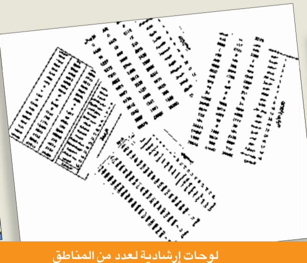
لوحات إرشادية لعدد من المناطق

جدول الانتخاب وجود قيد بـ 34 ناخبا في القبلة، وعدم وجود أي قيد في المرقاب، كما لم يسجل في الدائرة الرابعة التي تضم 18 منطقة أي قيد في الشدادية وصيهد العوازم ما عدا العضيلية (20 ناخبا)، في حين تظهر جداول الخامسة، التي تضم 20 منطقة، وجود قيد بـ 23 ناخبا في الوفرة، و 3 ناخبين في الزور.