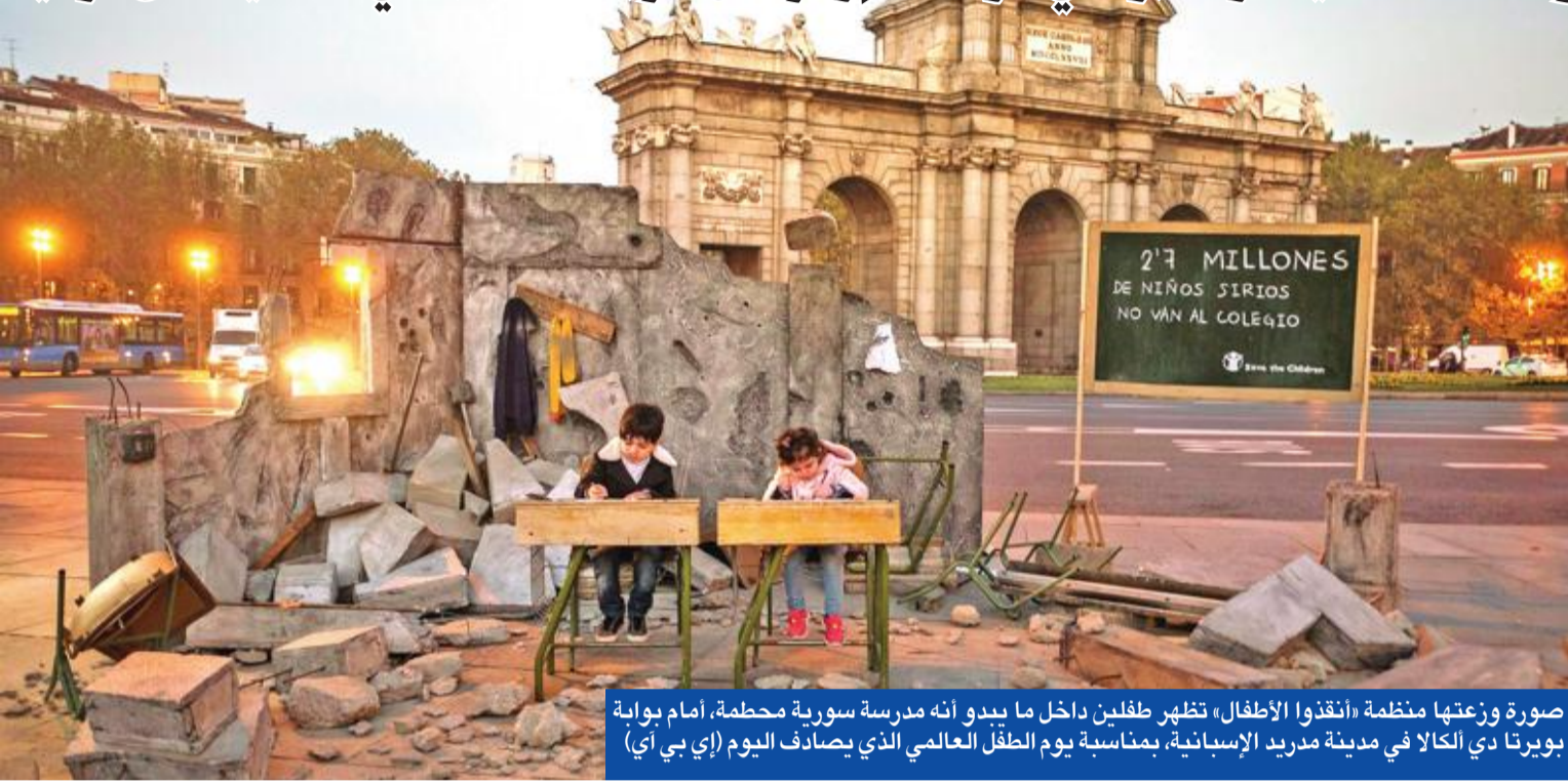
صورة وزعتها منظمة «انقذوا الأطفال» تظهر طفلين داخل ما يبدو أنه مدرسة سورية محطمة، أمام بوابة بورتا دي الكالا في مدينة مدريد الإسبانية، بمناسبة يوم الطفل العالمي الذي يصادف اليوم (أي بي إي)

«قسد» تتلقى أسلحة أميركية و«التحالف» يشارك برأ في الرقة • إردوغان: أوباما تسبب في تهديد أمن تركيا