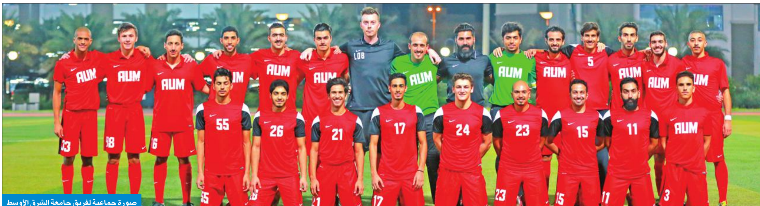
صورة جماعية لفريق جامعة الشرق الأوسط