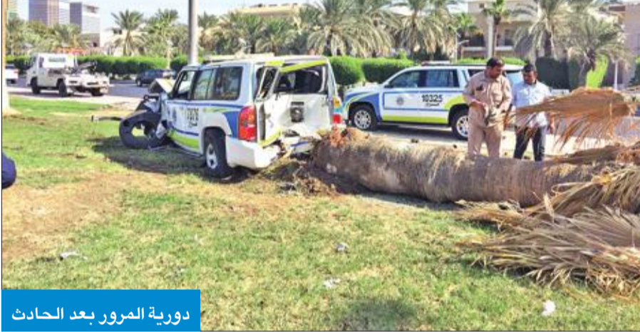
دورية المرور بعد الحادث

دورية مرور على طريق الرياض السريع. وفي تفاصيل الحادث الأول، التي رواها لـ«الجريدة» مصدر أممي مطلع، أن غرفة عمليات وزارة الداخلية تلقت بلاغاً صباح أمس الأول بوجود حادث انقلاب دورية مرور على طريق الرياض السريع. وقال المصدر إن الحادث أسفر عن إصابة قائد الدورية، وهو برتبة رقيب أول، بإصابات متفرقة نقل على إثرها إلى مستشفى الأميري لتلقي العلاج، وكانت إصابته طفيفة، وتم فتح تحقيق في الحادث لمعرفة أسبابه.