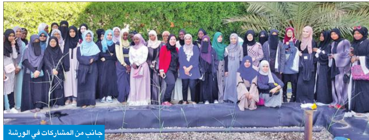
جانب من المشاركات في الورشة

ونظمت الجمعية الكويتية لحماية البيئة ورشة عمل عن مشروع «تنقية مياه الصرف الصحي بالنظم الطبيعية»، المشمول في المرحلة الثانية من مشروع ترشيد استهلاك المياه عربي الذي تنشره عليه في سبع دول عربية.