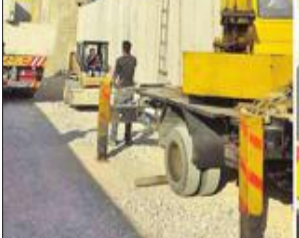
صورتان تظهران أعمال البناء لإقامة جدار أسمنتي عازل حول مخيم عين الحلوة للاجئين الفلسطينيين جنوب لبنان