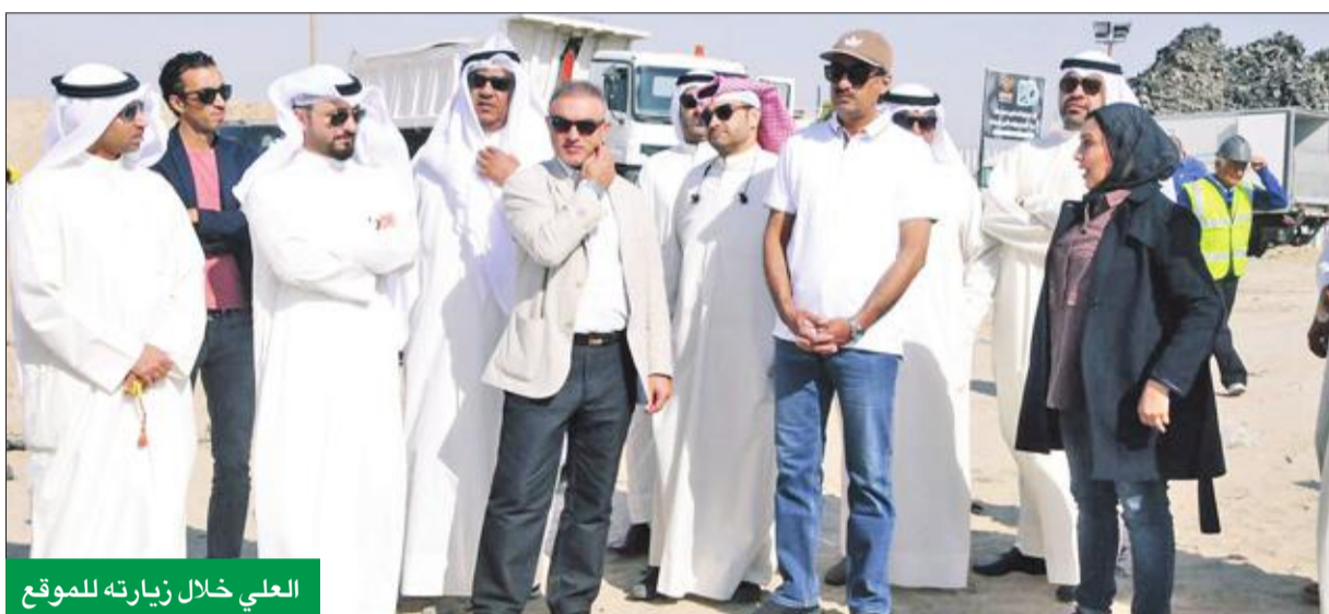
العلي خلال زيارته للموقع

التخلص من كمية الإطارات المجمعة في الموقع الحالي وتقطيعها وتحويلها إلى مواد أولية