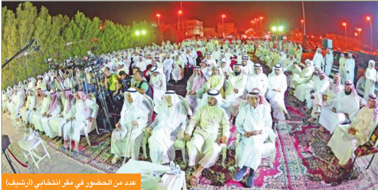
عدد من الحضور في مقر انتخابي (أرشيف)

الشريعة والدراسات الإسلامية في جامعة الكويت الدكتور عبدالرزاق الشايحي في تصريح مماثل أن ظاهرة تغيير المرشحين لدوائرهم بدأت خلال فترة الثمانينيات وتحديداً بدوائر المناطق الداخلية وذلك لوجود خطاب مشترك لقواعدهم الانتخابية. وأوضح الشايحي وهو رئيس مركز «قياس» لاستطلاعات الرأي والتحليل في شؤون الانتخابات أن انتقال المرشحين لدوائر مختلفة يكون بين دوائر غير مغلقة ولا تنحصر في فئات فكرية وقبلية وعائلية واقتصادية معينة لأنها الأسهل في مخاطبة الناخبين وكسبهم مثل الدوائر التي تعتمد على الفكر أو ما تسمى بالدوائر المثقفة. وأضاف أن تغيير بعض المرشحين لدوائرهم يكون بسبب تضالٍ فرص نجاحهم تكون ضمن نطاق الدوائر القبلية أو الفكرية أو الطائفية لتعزيز فرص نجاحهم. وقال أنها ظاهرة تستوجب تغيير المرشح مضمون برنامجه الانتخابي للحصول على أكبر عدد ممكن من أصوات الناخبين والتأثير عليهم في ضوء التغيرات السياسية. وأكد أن عملية انتقال المرشحين لدوائر أخرى بحثاً عن النجاح أصبحت اليوم أكثر صعوبة لأنها ترتبط ارتباطاً وثيقاً بمدى قوة علاقاتهم الاجتماعية وفكرهم السياسي. وبين الشايحي أن هناك مرشحين يعملون على تغيير دوائرهم ليس من أجل الفوز بل للتأثير على مرشحين آخرين ومنع وصولهم للبرلمان. وأكد أن فرص النجاح بالانتخابات تبقى للمرشح الأكثر تأثيراً على الناخبين من حيث الخدمات فيما تتضاءل مقابل ذلك فرص المرشحين الذين يعتمدون على الأطروحات والبرامج الانتخابية.