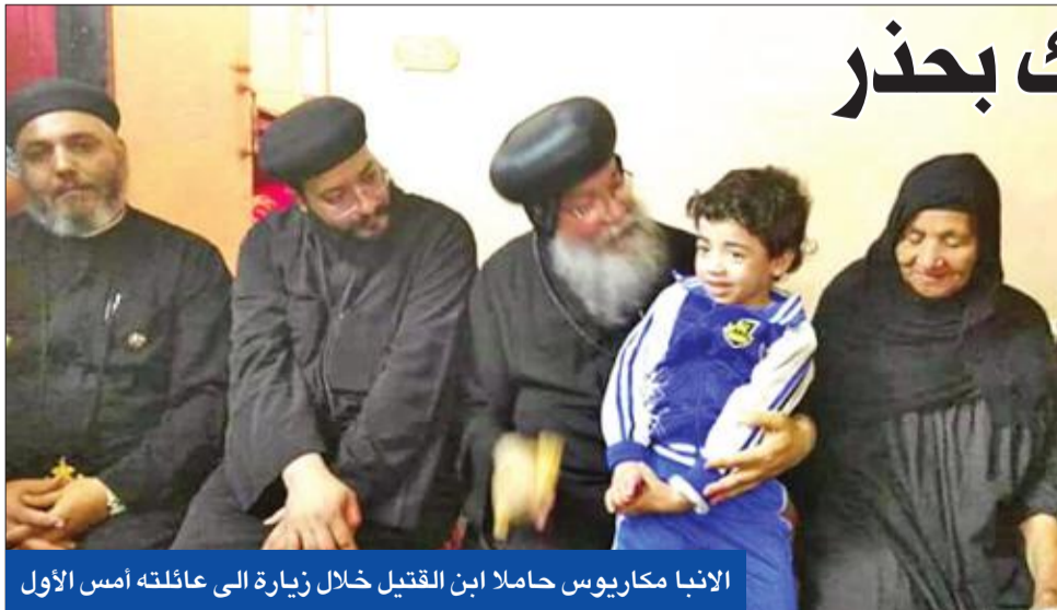
الأنبا مكاريوس حاملاً ابن القاتل خلال زيارة إلى عائلته أمس الأول

الصفحة التشريحية الخاص بالمجنى عليه، خلال 15 يوماً، مشيراً إلى أنه إذا أثبت التقرير تعرض المجنى عليه للتعذيب، فإن هيئة الدفاع ستقدم بلاغاً ضد الضابط. يشير إلى أن الأجهزة الأمنية في محافظة المنيا، «شمال الصعيد»، سيطرت على بوادر فتنة طائفية، في قرية دلجا التابعة لمركز ديرمवास، حيث أقت أسس الأول القبض على 3 أشخاص بتهمة الإعتداء على مزارع قبضي، بزعم إقامته علاقة مع امرأة مسلمة.