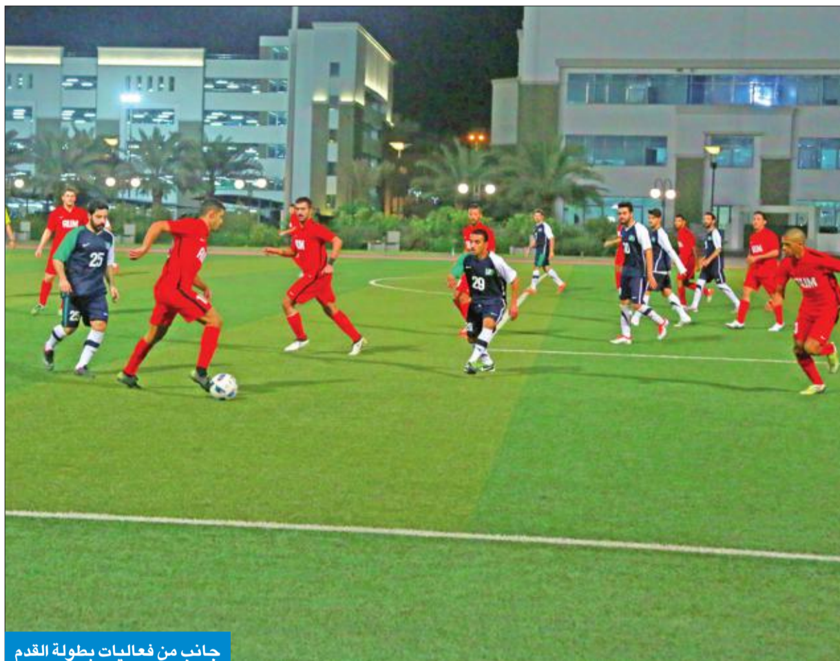
جانب من فعاليات بطولة القدم

فريق جامعة «الشرق الأوسط» يتصدر المراكز الأولى