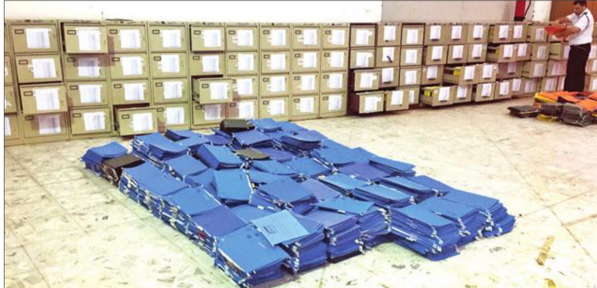
جانب من عملية مراجعة ملفات ذوي الإعاقة