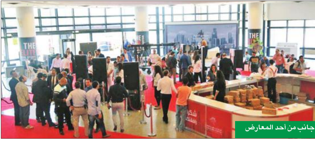
جانب من أحد المعارض