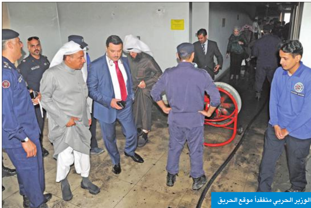
الوزير الحربي متفقداً موقع الحريق

من جانبها قالت وزارة الصحة، في بيان صحافي، إن الحريق اندلع نتيجة