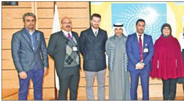
لقطة جماعية لفريق عمل سدرة ووزارة النفط

مدار 5 سنوات، مؤكدة أن "نפט الكويت" ستكون مسؤولة بعد ذلك عن الإدارة الكاملة للمشروع. وأضافت الركيان أن الشركة المنفذة تعمل على نقل خبراتها لفريق العمل الكويتي بالمشروع حتى يكون قادراً على إدارة المشروع عقب انتهاء فترة إشراف الشركة الأجنبية، مؤكدة أن عقد الشركة الإسبانية لا يقتصر على إنتاج الطاقة، بل يشمل تدريب الطاقم البشري القائم على المشروع. وأشارت إلى أن أهمية المشروع تكمن في أنه سيمكن الشركة من إنتاج طاقة بديلة تستخدمها عوضاً عن الطاقة التي تحصل عليها من وزارة الكهرباء والماء". وأضافت: "نطمح إلى أن نصل إلى عام 2020، ويكون بإمكاننا توفير 20 في المئة من الطاقة المستهلكة في شركة نفط الكويت من الطاقات البديلة، تطبيقاً للرؤية السامية لسمو أمير البلاد".