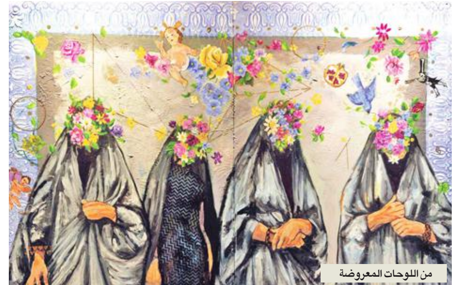
من اللوحات المعروضة