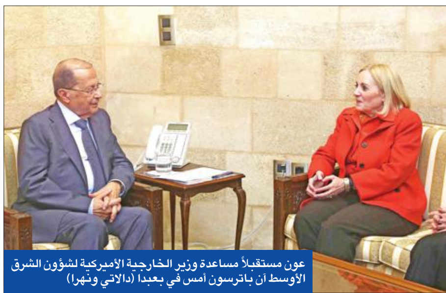
عون مستقبلاً مساعدة وزير الخارجية الأميركية لشؤون الشرق الأوسط أن باترسون أمس في بعيداً (الاداتي ونهرا)

ستصبح وزارات المالية والزراعة والاقتصاد من حصة حركة أمل، والشباب والرياضة من حصة حزب الله، بالإضافة الى وزارة دولة». في سياق منفصل، حملت مساعدة وزير الخارجية الأميركية لشؤون الشرق الأدنى، آن باترسون، رسالة من وزير الخارجية جون كيري إلى رئيس الجمهورية العماد ميشال عون، أكد فيها «استمرار الولايات المتحدة الأميركية في دعم لبنان بمختلف المجالات، ولاسيما المساعدات العسكرية». وعبرت عن ارتياح بلادها إلى «العمليات الأمنية الاسباقية التي يقوم بها الجيش اللبناني في ما يتعلق الإرهاب»، منوهة باهتمام لبنان بالنزحين السوريين. واعتبرت أن «المرحلة المقبلة تتطلب المزيد من التعاون والتنسيق بين لبنان وأميركا».