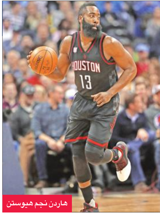
هاردن نجم هيوستن

يخوض تشلسي (المتصدر) اليوم مواجهة سهلة نسبياً أمام سندرلاند متذيل الترتيب، في المرحلة السادسة عشرة من الدوري الإنجليزي الممتاز لكرة القدم.