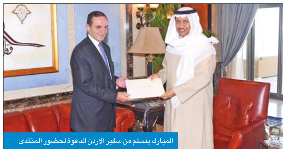
البارك يتسلم دعوة لحضور المنتدى الاقتصادي

استقبل رئيس مجلس الوزراء سمو الشيخ جابر المبارك، في قصر السيف، أمس، سفير المملكة الأردنية الهاشمية لدى الكويت محمد الكايد، حيث سلم سموه دعوة من ملك المملكة الأردنية الهاشمية الشقيقة الملك عبدالله الثاني ابن الحسين، للمشاركة في أعمال المنتدى الاقتصادي العالمي حول الشرق الأوسط وشمال أفريقيا، الذي سيعقد في منطقة البحر الميت بالمملكة الأردنية الهاشمية خلال الفترة من 19- 21 مايو 2017، تحت شعار «تمكين الأجيال نحو المستقبل».