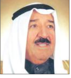
الأمير يشكر كل من اطمان على صحته