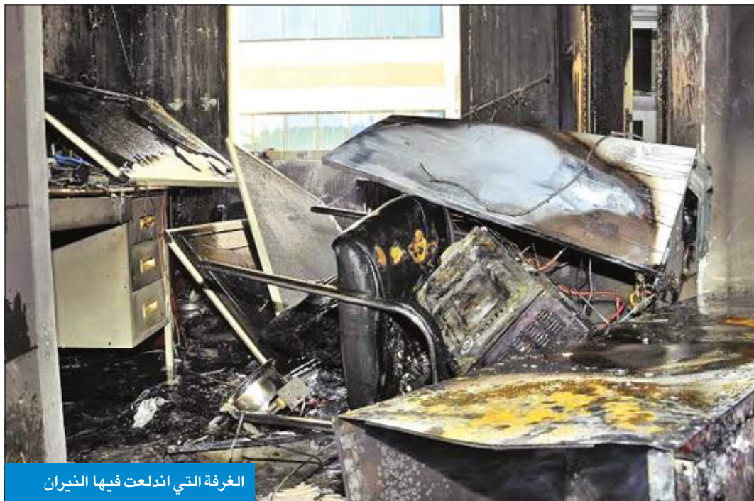
الغرفة التي اندلعت فيها النيران