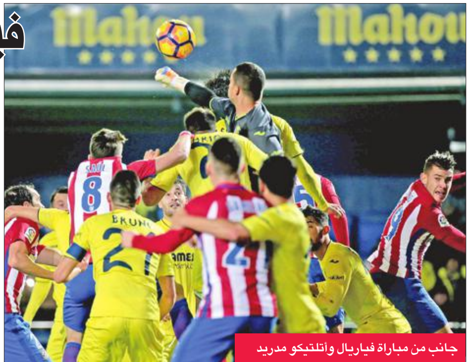
جانب من مباراة فياريال وأتلتيكو مدريد

وأضاف الإيطالي، روبرتو سوريانو، الهدف الثالث في الدقيقة الثالثة من الوقت بدل الضائع. وهو الفوز السابع لفياريال هذا الموسم، والأول بعد هزيمتين متتاليتين وتعادل، ورفع رصيده إلى 26 نقطة، وانتزع المركز الرابع من أتلتيكو مدريد الذي مني بخسارته الرابعة هذا الموسم، فتجمد رصيده عند 25 نقطة، وتراجع إلى المركز السادس.