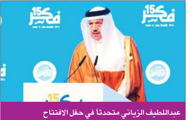
عبد اللطيف الزياني متحدثاً في حفل الافتتاح

أشاد الأمين العام لمجلس التعاون لدول الخليج العربية د. عبد اللطيف الزياني بتنظيم المؤتمر السنوي «فكر 15» والذي تنظمه مؤسسة الفكر العربي بالشراكة مع الإمامة العامة لجامعة الدول العربية. جاء ذلك في افتتاح المؤسسة، بالشراكة مع الإمامة العامة، فعاليات المؤتمر بمناسبة الذكرى الـ 35 لإنشاء مجلس التعاون الخليجي، والـ 45 لتأسيس دولة الإمارات، بحضور كبار الشخصيات في الجامعة ومجلس التعاون الخليجي.