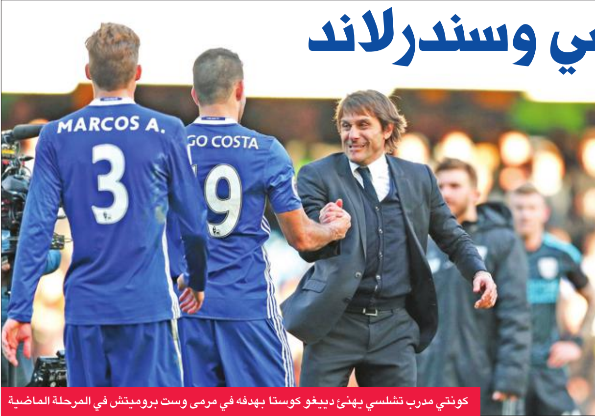
كونتي مدرب تشلسي يهنئ دييغو كوستا بهدفه في مرعى وست بروميتش في المرحلة الماضية

شدد به الضغط على توتنهام، وهو فوزه الثاني فقط في المراحل الثماني الأخيرة والثالث في آخر مرحلة.