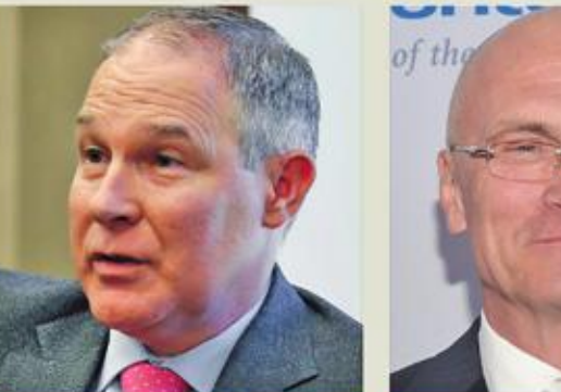
وكالة حماية البيئة

ريكس تيلرسون، 64 عاماً: رئيس مجلس إدارة إكسون موبيل ورئيسها التنفيذي يتمتع بعلاقة مع روسيا. اجتمع لأول مرة مع الرئيس الروسي فلاديمير بوتين في العام 1999، ومنح وسام الصداقة من الكرملين في العام 2013. في عهد تيلرسون، شركة إكسون حصلت على حقوق حفر في روسيا أكثر مما حصلت عليه في الولايات المتحدة*