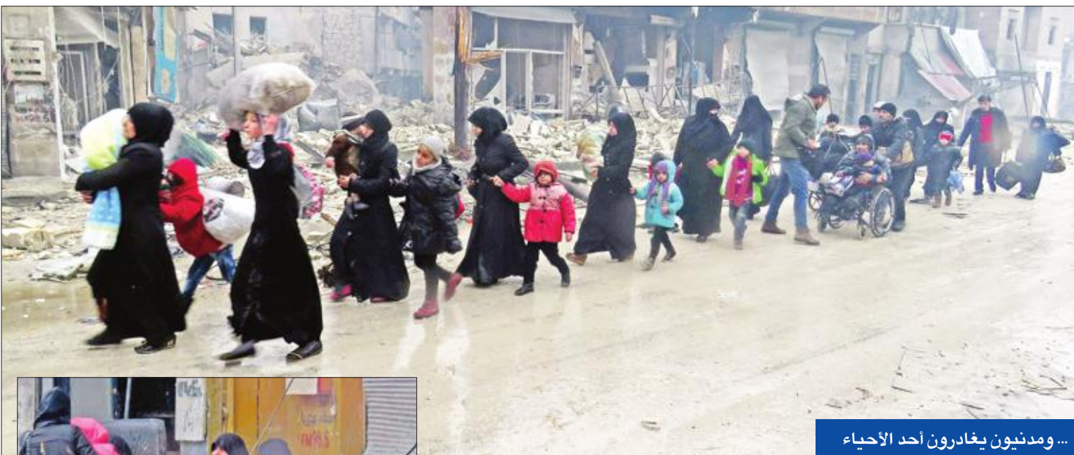
... ومدنيون يغادرون أحد الأحياء

● إعدام 82 مدنياً بينهم أطفال ونساء ● أطفال افترقوا عن عائلاتهم محاصرون تحت القصف ● الآلاف يتكدسون في كيلومترات قليلة ● موسكو ترفض وقف إطلاق النار ● إدانات دولية