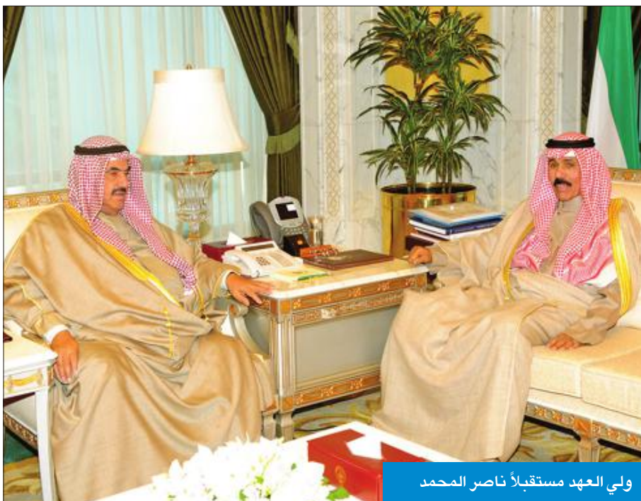
ولي العهد مستقبلاً ناصر المحمد

استقبل سمو ولي العهد الشيخ نواف الأحمد، بقصر السيف، صباح أمس، سمو الشيخ ناصر المحمد. كما استقبل سموه، سفير جمهورية البيرو لدى الكويت هيلي بيلايڤ كاسترو، وذلك بمناسبة انتهاء مهام عمله سفيراً لبلاد. حضر المقابلة رئيس المراسم والتشريفات بديوان سمو ولي العهد الشيخ مبارك الصباح.