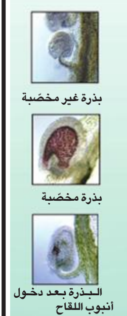
بذرة غير مخصبة

4 يندمج الحمض النووي الخاص باللقاح مع الحمض النووي الموجود في البويضة وتنمو البذرة المخصبة. إنشأ مُحرّن (مصدر غذائي بشري) جنين (يتحوّل إلى نبتة جديدة).