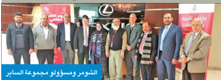
الشومر ومسؤولو مجموعة الساير

دهند الشومر إن عدد المفحوصين بلغ 140 شخصاً، حيث تم إعطاء المشورة وتحويل بعض الحالات للمراكز الصحية لاكتشاف بعض عوامل الخطورة، وأوضحت أن الجمعية تواصل مبادراتها المجتمعية للتوعية بإقامة يوم مفتوح بالمدرسة الهندية بالتعاون مع جمعية الأطباء الهنود وذلك يوم الجمعة المقبل في مقر المدرسة الهندية بجلبيل الشيوخ.