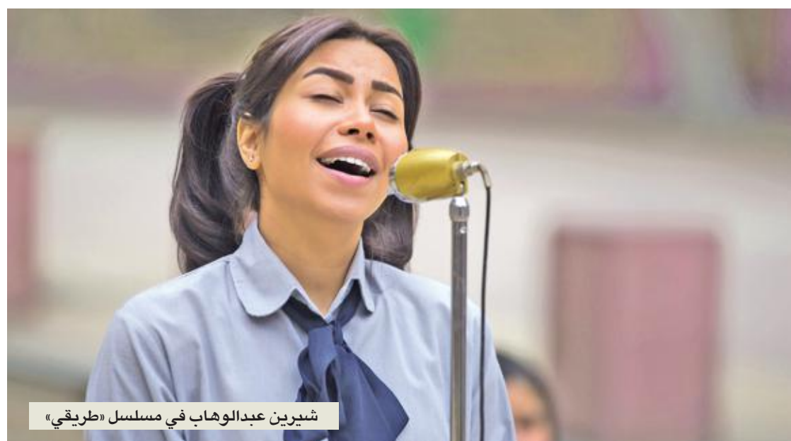
شيرين عبد الوهاب في مسلسل «طريقي»