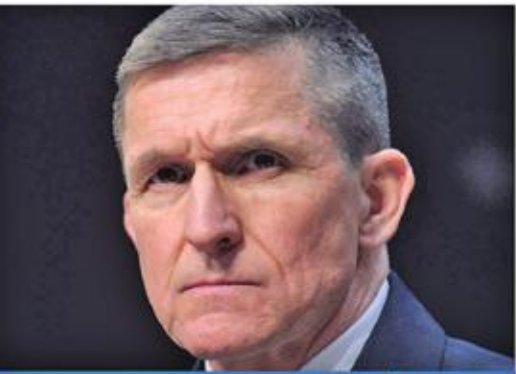
مستشار الأمن القومي

اختيار دونالد ترامب المقلق لأعضاء مجلس الوزراء