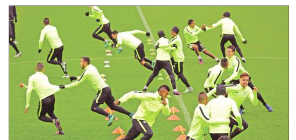
جانب من تدريبات اتلتيكو ناسيونال

يسعى اتلتيكو ناسيونال الكولومبي بطل أمريكا الجنوبية لوقف مغامرة كاشيما انتلرن بطل اليابان، وبلوغ المباراة النهائية لبطولة العالم للأندية عندما يلتقيان في نصف النهائي اليوم. ويأمل اتلتيكو ناسيونال خلال المباراة التي تقام بأوساكا، استعادة امجاده وتحديدا عندما بات أول فريق كولومبي يخوض المباراة النهائية لبطولة بنظماها وتسميتها القديمة "انتركونتينتال" عام 1989 (كانت تجمع بين بطلي أمريكا الجنوبية وأوروبا فقط، وخسارته بصعوبة أمام ميلان