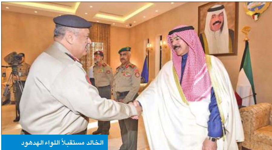
الخالد مستقبلاً اللواء الهدودي

أكد الخالد ضرورة الارتقاء بالمؤسسة العسكرية لأعلى المستويات، مشدداً على أن يكون الجيش دائماً على أتم الاستعداد ليصون أمن البلاد واستقرارها، وضرورة عمل الجميع لما فيه مصلحة الكويت والمحافظة على وحدتنا الوطنية.