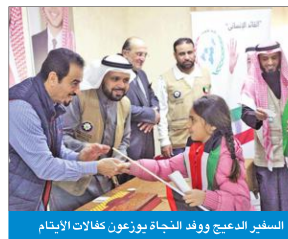
السكرتير العام ووفد النجاة يوزعون كفالات الأيتام

وأشار إلى وجود وفد الجمعية بالأردن حالياً، وذلك لتوزيع المساعدات وكفالات الأيتام والمواد الغذائية على اللاجئين السوريين، معلناً