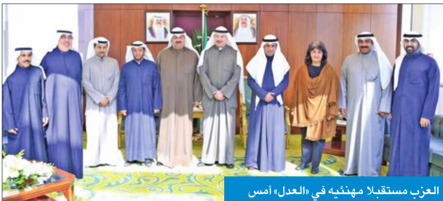
العزب مستقبلاً مهنتيه في "العدل" أمس

أكد وزير العدل وزير شؤون مجلس الأمة، د. فالح العزب، أن قانون استقلال القضاء في مقدمة الأولويات، مشدداً على أنه لا يمكن السياسية، ولا يمكن أن تسمح لأي كائن من كان بأن يتداول عليها. وأضاف العزب، خلال استقباله للمهنيين بمكتبه بمعهد الكويت للدراسات القضائية والقانونية، بحضور رئيس المجلس الأعلى للقضاء السابق، المستشار فيصل المرشد، ووكيل الوزارة عبد اللطيف السريع وعدد من قياديي الوزارة والموظفين، أن "شيوخ القضاء نجلهم ونحترمهم، سواء في المحكمة الدستورية أو في المجلس الأعلى للقضاء أو في المحاكم، موضحاً أنه سيذهب إلى ما أراه المشروع التأسيسي، وما طالب به الآباء المؤسسون باستقلال السلطة القضائية استقلالاً تاماً، وسنمكثهم من ذلك، رغم أنه طال الزمن حتى وصلنا إلى اليوم.