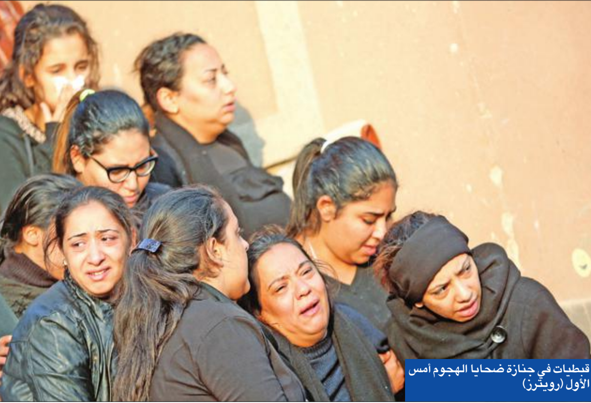
قبطيات في جنازة ضحايا الهجوم أمس الأول

على صعيد آخر، وفي استجابة سريعة لطلب السيسي، تعديل قانون الإجراءات الجنائية، لسرعة القصاص من المتورطين في عمليات إرهابية، قال رئيس لجنة الشؤون الدستورية والتشريعية بمجلس النواب، المستشار بهاء الدين أبو شقة، إن «البرلمان أمهل الحكومة 30 يوماً لالتهاء من إعداد مشروع قانون جديد للإجراءات الجنائية»، وأضاف لـ «الجريدة» أن «اللجنة بدأت في تشكيل لجنة منوط بها تعديل قانون الإجراءات الجنائية»، مشيراً إلى أن اللجنة تضم عدداً من شيوخ القضاء وخبراء القانون