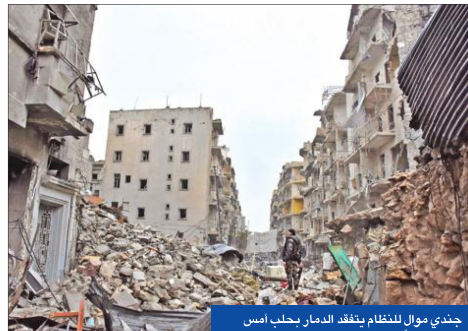
جندي موالٍ للنظام يتفقد الدمار بحلب أمس