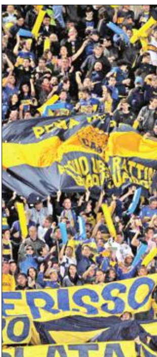
جماهير بوكا جونيورز

احتفل 20 ألف مشجع من أنصار نادي بوكا جونيورز الأرجنتيني أمس الأول بـ "يوم الجماهير"، بعد 24 ساعة فقط من فوز الفريق 2-4 على غريمه التاريخي ريفر بليت في الدوري الأرجنتيني لكرة القدم. وشارك في الاحتفال لاعبون قدامى من أيقونات بوكا جونيورز، إضافة إلى لاعبين من قطاع الناشئين داخل ملعب "بومبونيرا"، معقل الفريق، الذي فتح أبوابه للمشاركة في هذا الحدث.