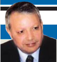
صالح القلب كاتب وسياسي أردني