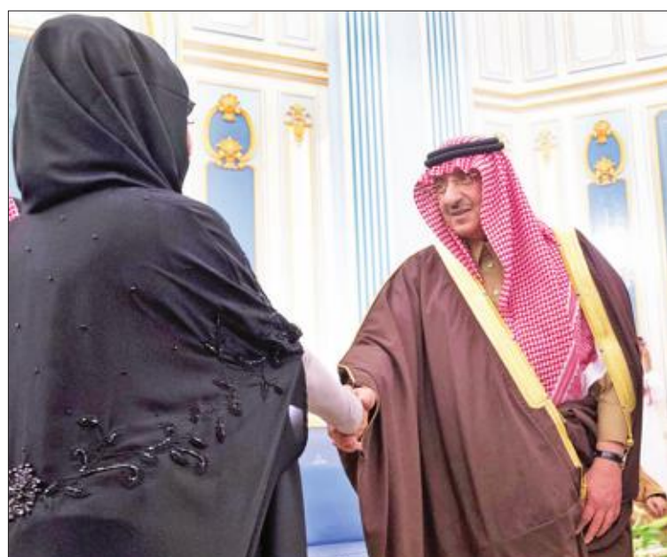
ولي العهد الأمير محمد بن نايف مهيناً عضوة في مجلس الشورى على هامس أداء أعضاء المجلس اليمين أمام الملك سلمان أمس (واس)

الملك السعودي، الملك سلمان بن عبدالعزيز، اليوم، أعمال السنة الأولى من الدورة السابعة لمجلس الشورى، حيث يلقي خطاباً يستعرض فيه سياسة المملكة الداخلية والخارجية.