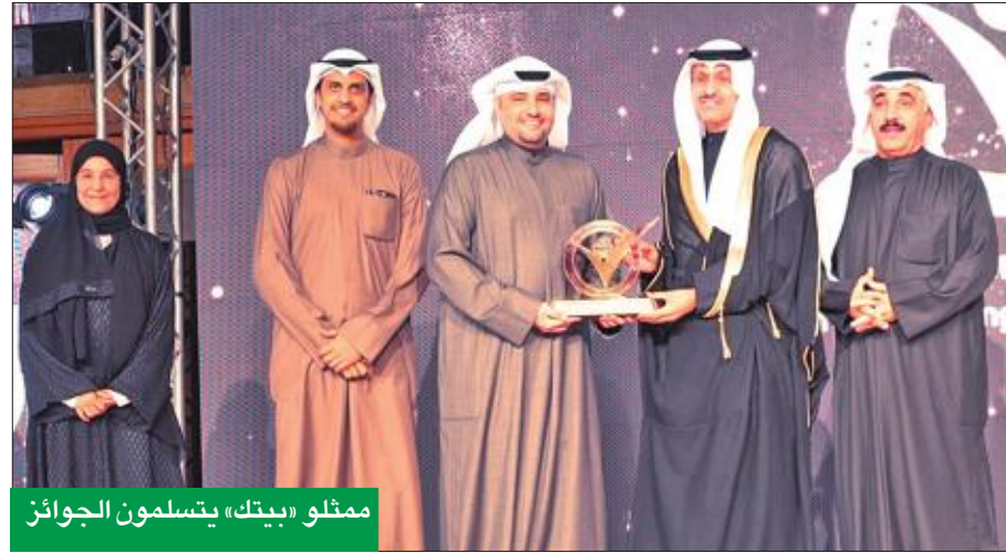
ممثلو «بيتك» يتسلمون الجوائز

فاز بيت التمويل الكويتي (بيتك) بثلاث جوائز مرموقة من بين أربع وأهم الجوائز التي قدمها الملتقى الإعلامي العربي في دورته الرابعة، وهي جائزة الإبداع في المسؤولية الاجتماعية التي تقدم لأول مرة هذا العام، وجائزة أفضل رسالة إعلامية عن إعلان «بيتك» الرضائي بعنوان «أنا بيتك»، وجائزة الإعلان الأكثر تأثيراً عن الإعلان المؤسسي «بيتك دائماً معك».