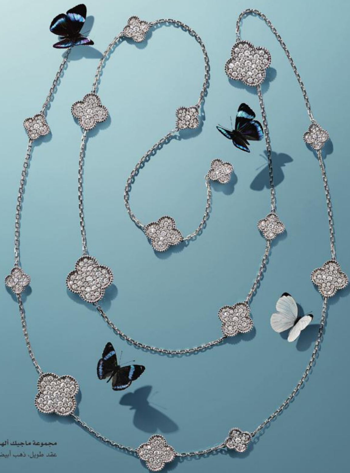
مجموعة ماجيك ألباميرا عقد طويل، ذهب أبيض و ألماس