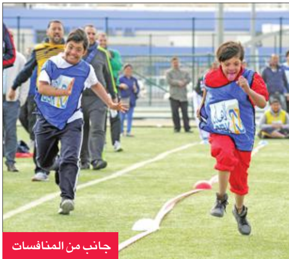
جانب من المنافسات

وافرزت البطولة العديد من المهارات والخبرات والسلوك الرياضي للطلاب، وهو ما يوضح مدى اهتمام الدولة بهذه الشريحة الهامة من أبناء الكويت.