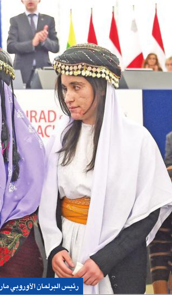
رئيس البرلمان الأوروبي مارتن شولتز يمنح عراقيات ايزيديات جائزة «ساخاروف» لحقوق الإنسان في فرنسا أمس

وكان المستشار الاعلامي لنائب رئيس الجمهورية عباس الموسوي، أكد الأحد الماضي، أن ما حدث في محافظة البصرة هو محاولة من اطراف، لم يسمها، لـ «قتل» المالكي سياسياً