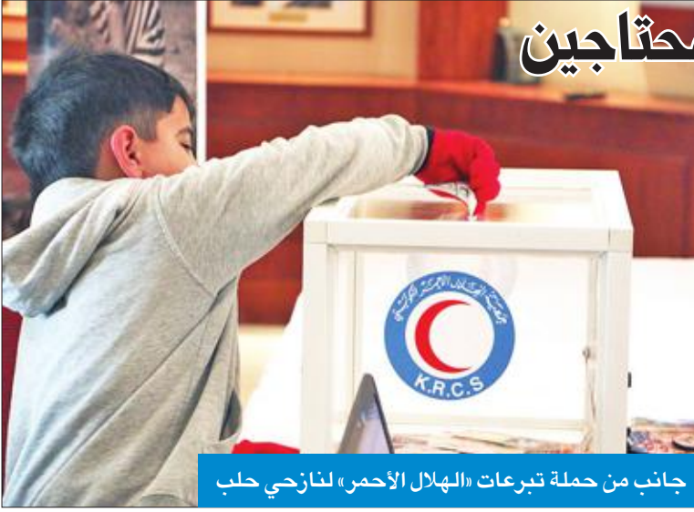
جانب من حملة تبرعات «الهلل الأحمر» للنازحين حلب

في حلب منذ أغسطس الماضي، وفر نحو عشرين ألفاً على مدار الـ 72 ساعة الماضية فقط. وذكرت أن بعض الناس يعيشون في أماكن إيواء والبعض اتخذ من المساجد أو المدارس أو الخيام ماوى لهم حين وجد البعض الآخر ملاذاً داخل بنايات غير مكتملة البناء أو متضررة. وقالت إن الحملة تعبر عن شعور جميع المواطنين والمقيمين على أرض الكويت بالمسؤولية الإنسانية والأخلاقية تجاه اخوانهم السوريين في ظل الظروف المأساوية التي يعيشونها.