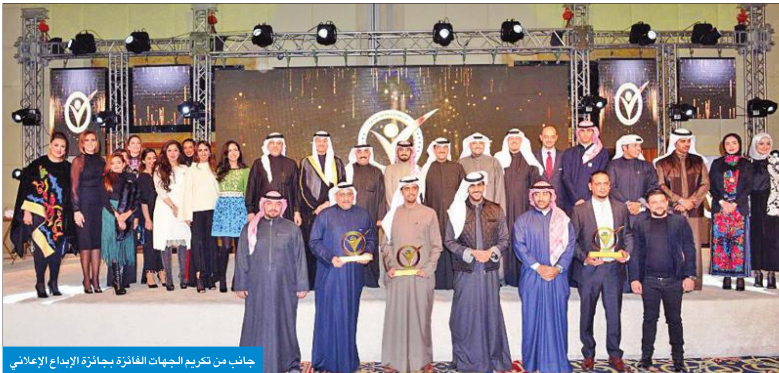
جانب من تكريم الجهات الفائزة بجائزة الإبداع الإعلاني

إعلان «الجريدة» الأول في تقديمها المستمر « يفوز بجائزة أفضل إخراج