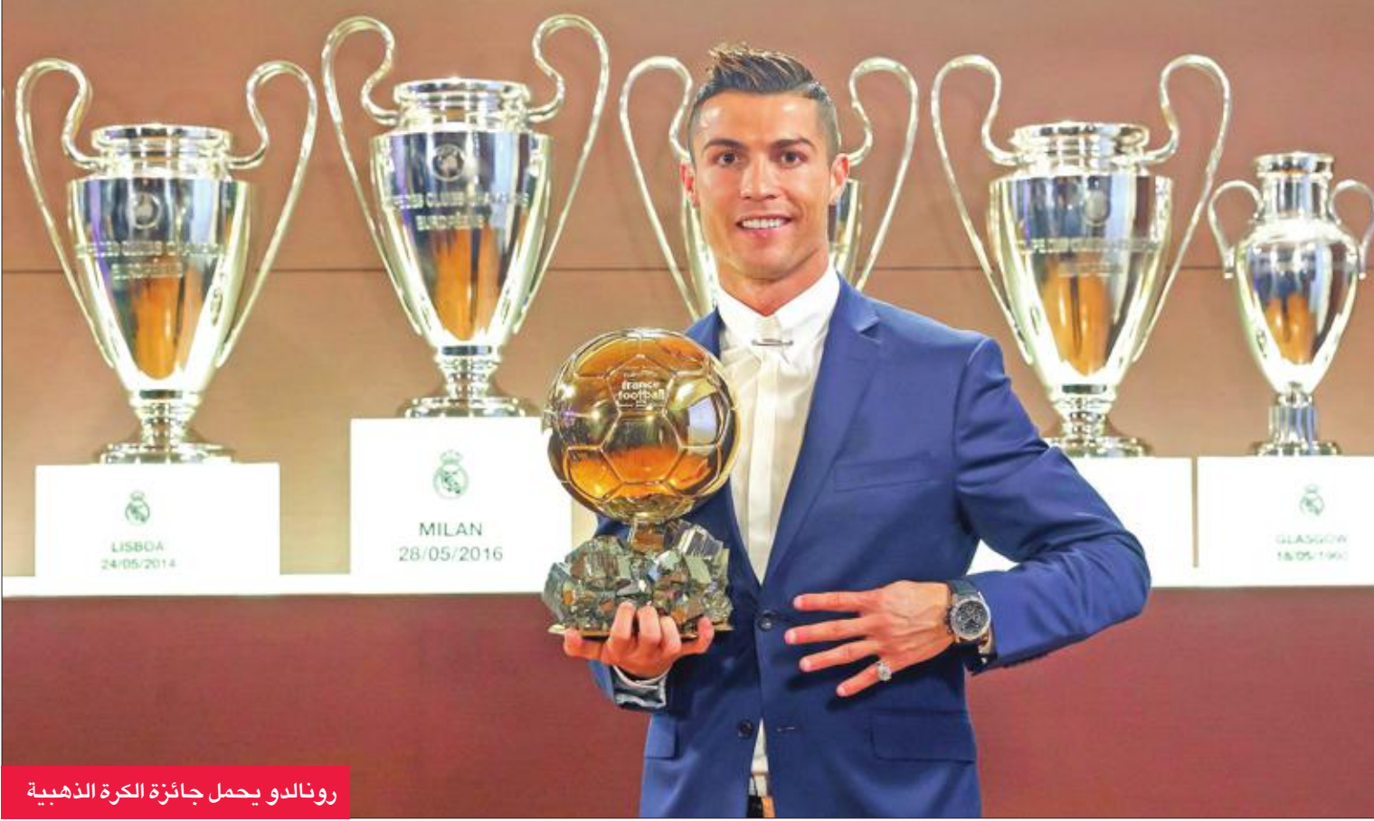
رونالدو يحمل جائزة الكرة الذهبية

ويبدو رونالدو أيضا مرشحاً فوق العادة للظفر بالجائزة التي سيمنحها الاتحاد الدولي مطلع العام المقبل.