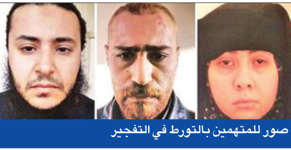
صور للمتهمين بالتورط في التفجير

أي عُشر عدد أعضاء المجلس». وأكد أن «اللجنة ستعمل في المرحلة المقبلة على إجراء ما وصفه بدوره تشريعية في قانون الإجراءات الجنائية، يعقّبها تحقيق كل النصوص الواردة في قانون العقوبات، خاصة أن هذه القوانين من عليها أكثر من 50 عاماً، و«العقوبات يجب أن تتناسب مع الجرم»، من جانبه، قال وزير العدل المستشار حسام الدين عبدالرحيم لـ «الجريدة»: «الوزارة بدأت في تشكيل لجنة منوط بها تعديل قانون الإجراءات الجنائية»، مشيراً إلى أن اللجنة تضم عدداً من شيوخ القضاء وخبراء القانون