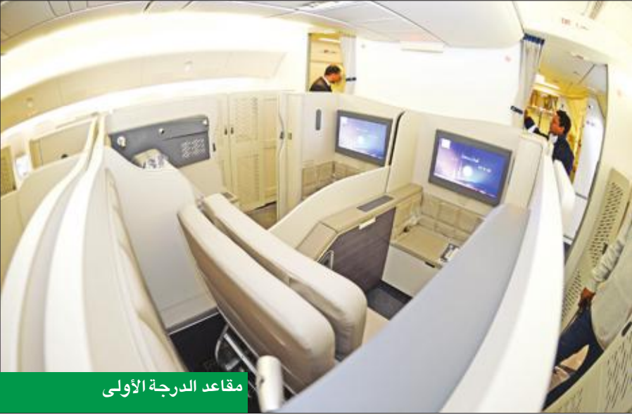
مقاعد الدرجة الأولى

أرحب مقصورة سياحية للرحلات طويلة المدى ضمن ناقلات المنطقة بواقع 3 مقاعد للصف