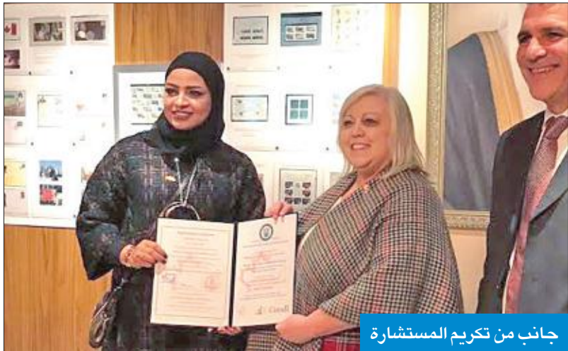
جانب من تكريم المستشارة

القديمة، وأولها يعود إلى سنة 1852م، ومجموعة أخرى من الطوابع، التي مزجت بين الأصالة والتاريخ العريق وامتداد التاريخ الكندي.