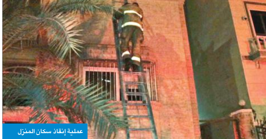
عملية إنقاذ سكان المنزل

أصيب مواطن وزوجته بحالة اختناق وحروق من الدرجة الثانية جراء حريق منزل في منطقة السلام فجر أمس، بينما نجح رجال الإطفاء في إنقاذ 17 شخصاً من سكان المنزل، بينهم نساء ورضع، فضلاً عن خسائر مادية كبيرة لحقت بالمنزل جراء الحادث.