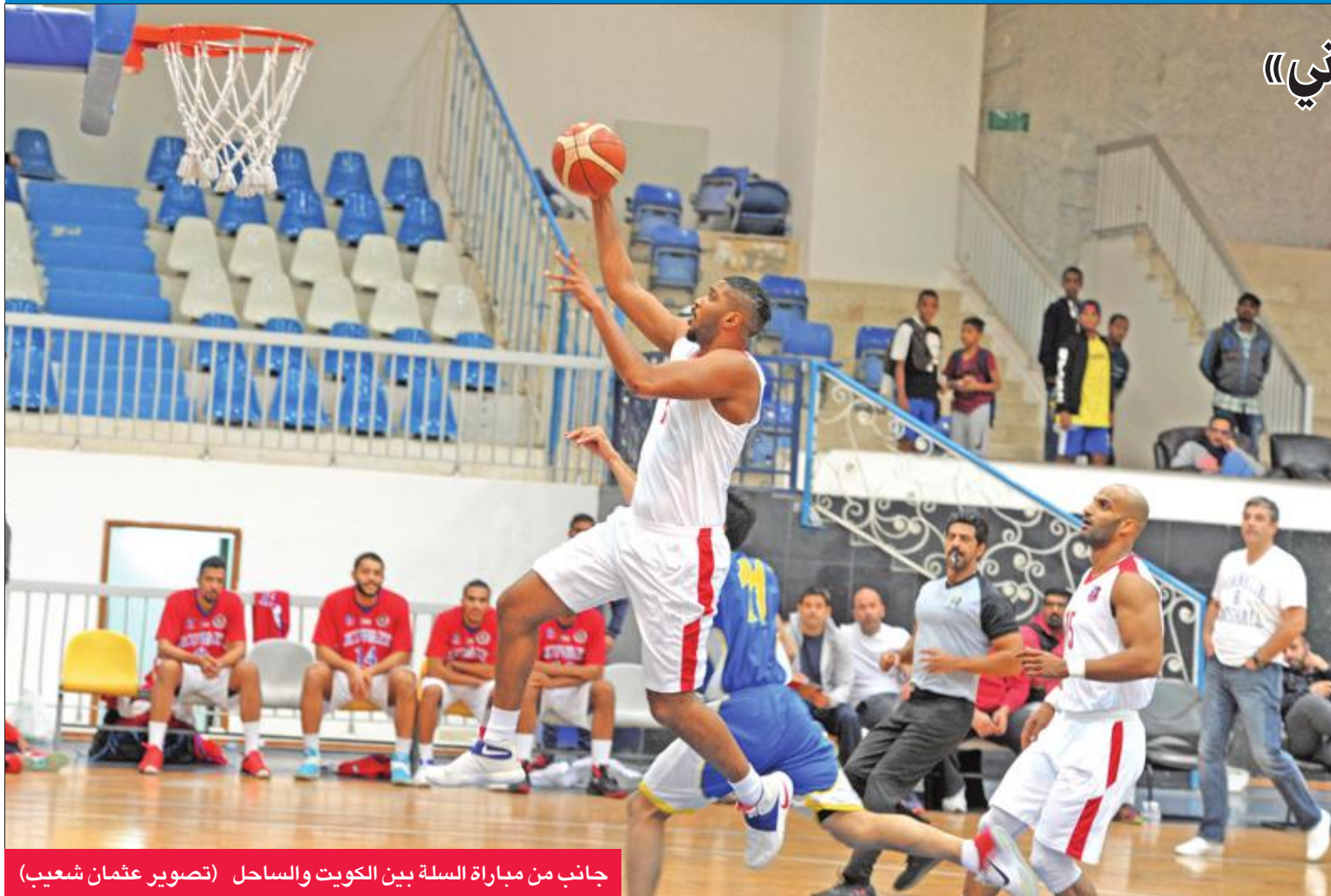
جانب من مباراة السلة بين الكويت والساحل