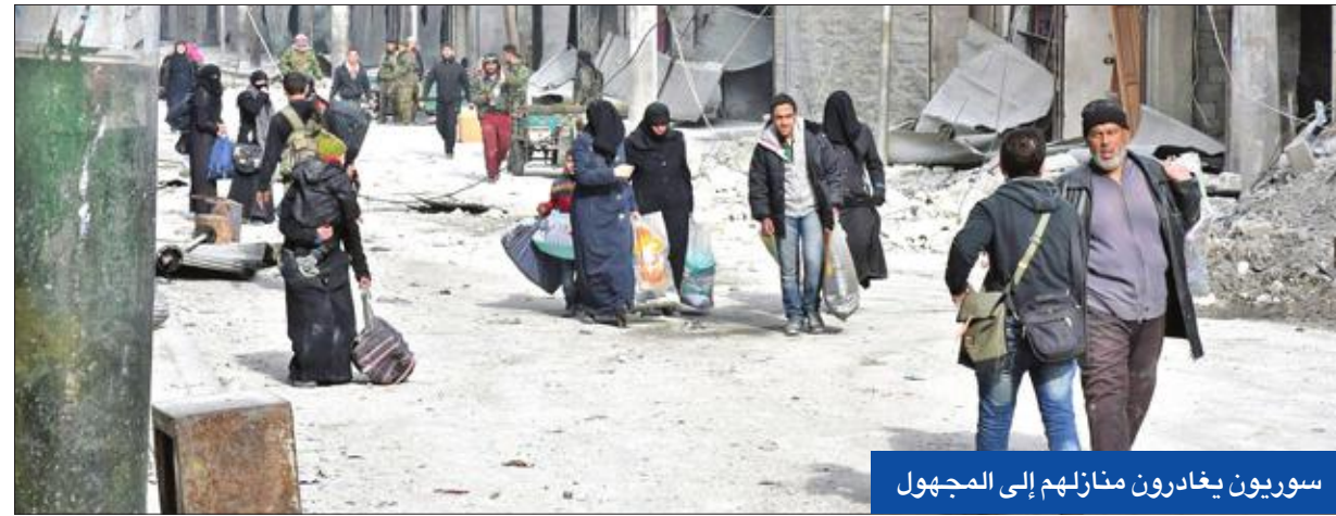
سوريون يغادرون منازلهم إلى المجهول