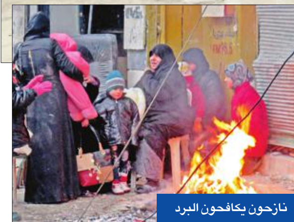
نازحون يكافحون البرد

إلى قوات المعارضة سيمثل ذلك النظام في غرب حلب أو تلك التي استعادها في شرق المدينة.