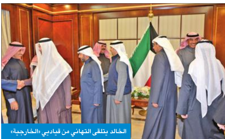
البارك يتسلم دعوة لحضور المنتدى الاقتصادي

تلقى النائب الأول لرئيس مجلس الوزراء وزير الخارجية الشيخ صباح الخالد، بحضور نائب وزير الخارجية السفير خالد الجارالله، صباح أمس، في ديوان عام وزارة الخارجية، تهاني وتبريكات مساعدي وزير الخارجية ومنسوبي الوزارة، احتفاءً بصدور المرسوم الأميري بإعادة توليه حقيبة الوزارة وتنصيبه نائباً أول لرئيس مجلس الوزراء ووزيراً للخارجية. وعبر الخالد خلال حفل الاستقبال عن شكره وتقديره لإخوانه وأبنائه من المهنيين والمهنيات، متمنياً للجميع التوفيق والسداد في خدمة الكويت ورعاية مصالحها، وأن يديم عليها نعمة الأمن والاستقرار والتقدم الإزدهار في ظل القيادة الحكيمة لصاحب السمو أمير البلاد الشيخ صباح الأحمد، وسمو ولي عهده الأمين الشيخ نواف الأحمد.