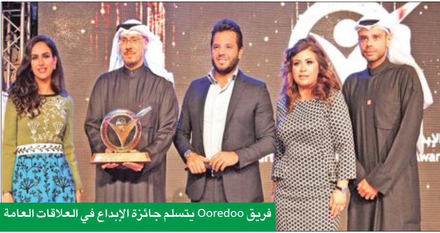
فريق Ooredoo يتسلم جائزة الإبداع في العلاقات العامة

ويظهر في الإعلان نخبة من الشخصيات المحبوبة لدى الجماهير من بينهم الفنانة الكويتية القديرة رجاء محمد، والفنانين الشباب فؤاد علي وها عبد السلام والفنان التركي بوراك أوزجيفيت بالإضافة إلى عدد من الشخصيات الشهيرة مثل الشابة الكويتية صفاء الفيلكاوي التي أطلقت حملتها على شبكات التواصل منذ سنوات لاحتضان الأيتام، بالإضافة إلى شباب مجموعة 228 وهم طلبة كويتيون منجذبون إلى الولايات المتحدة عرفوا بطرحهم الكوميدي لمواضيع اجتماعية على شبكات التواصل الاجتماعي، بالإضافة إلى الدكتورة ماجدة البناسي وكابتن منتخب عمان لكرة القدم ولاعب فريق رينغ الإنكليزي علي الحبسي، وهو من إخراج الإيطالي ماركو بيلوني. جدير بالذكر أن هذا هو الإعلان الأول المشترك بين مجموعة Ooredoo وشركات Ooredoo الكويت وعمان وقطر.