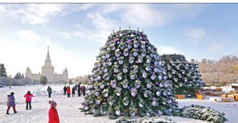
شجرة ميلاد أمام جامعة موسكو في درجة حرارة بلغت 13 تحت الصفر أمس

غورباتشوف: يمكن إنشاء اتحاد جديد في حدود الاتحاد السوفياتي