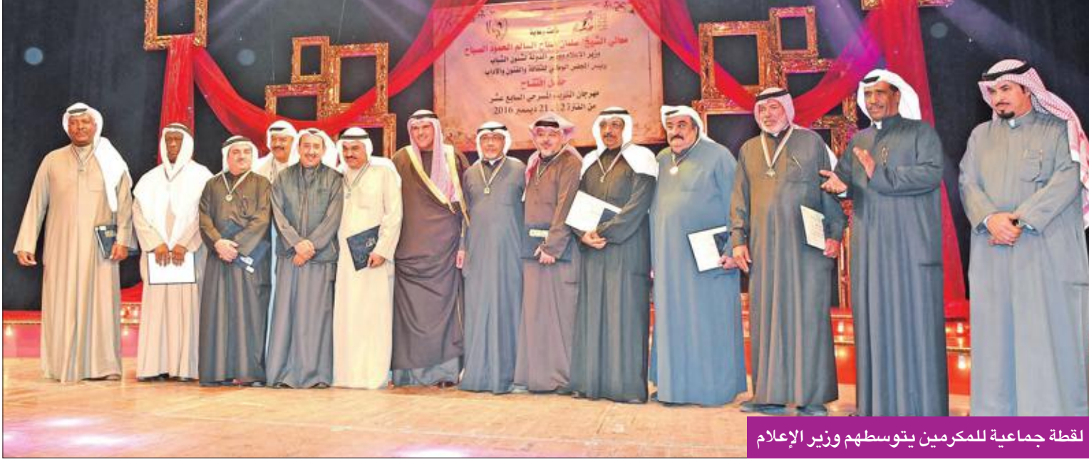
لقطة جماعية للمكرمين يتوسطهم وزير الإعلام

ويتنافس على الجوائز في المهرجان سبعة عروض مسرحية، هي: «كمبوشة» لفرقة المسرح الشعبي، «من قال ماذا؟» لفرقة المسرح الكويتي، «العائلة الحزينة» لفرقة مسرح الخليج العربي، «زنايل تل الطين» لشركة المهندر للإنتاج الفني، «تحلم»